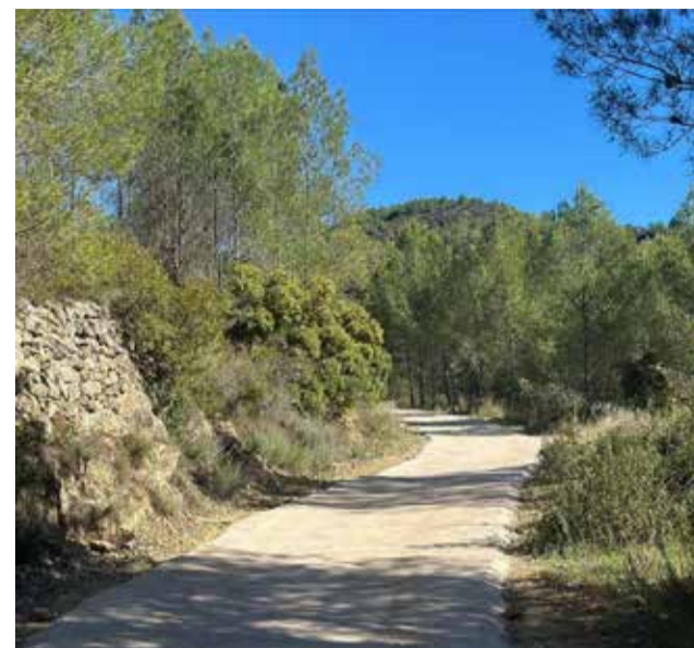
Camino Alcora de Fanzara.

Desde el consistorio han destacado la importancia de este tipo de actuaciones, que contribuyen a mantener en buen estado las infraestructuras rurales y a apoyar a los vecinos y vecinas que hacen uso diario