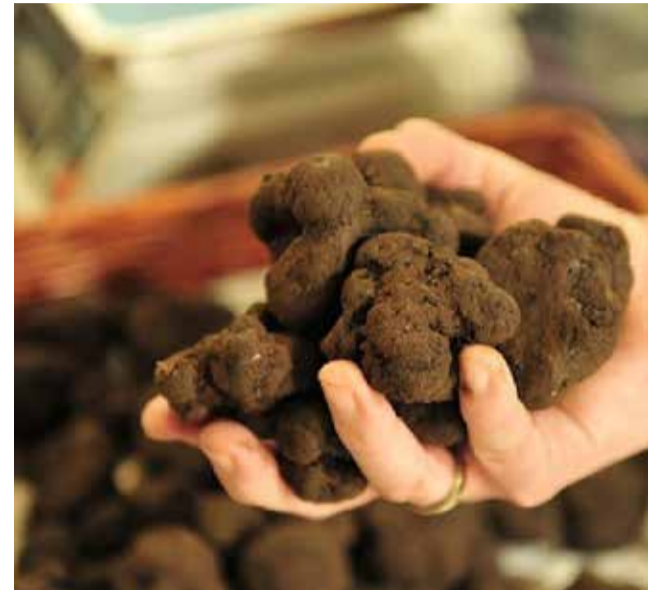
Una mano sujetando multitud de trufas.

A las 12:30 horas, el protagonismo pasará a la cocina con un show cooking a cargo del chef Kike Peris, del restaurante Randurias, conocido por su creatividad y