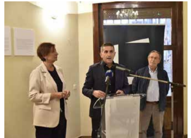
Presidente de la Fundación Bancaja.