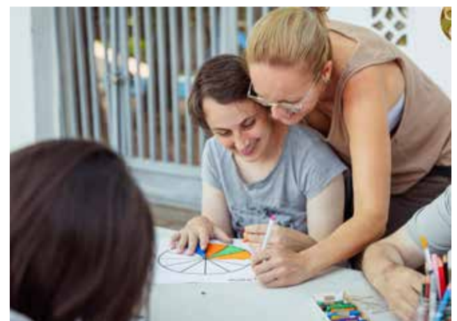
Escuela para personas con diversidad funcional. / EPDA

Si quieres transformar tu entorno, empieza por aquí. Todas las aportaciones son importantes. (info@cdrpalanciamijares.es / (+34) 644 277 665)