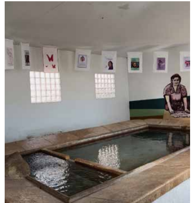
Campaña de Villanueva de Viver por el 25N ./ EPDA

No se trata de aguantar, se trata de vivir. Vivir libres, visibles y con orgullo de ser mujeres rurales que siembran igualdad en cada paso y con la mirada puesta en un futuro mejor.