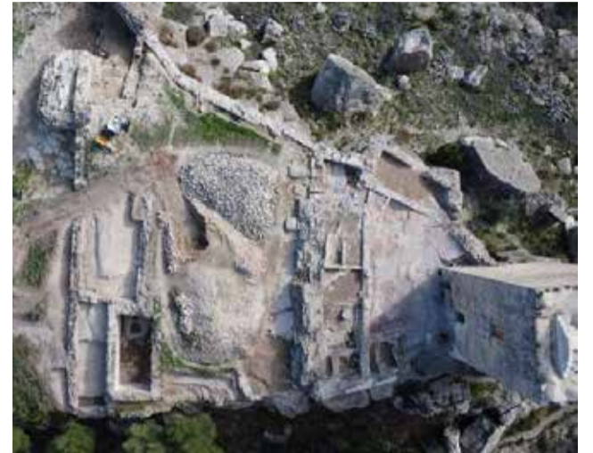
Imagen aérea de las obras del castillo de Jérica.

Desde el consistorio se ha recordado que, por motivos de seguridad, el acceso al castillo continúa prohibido mientras duren las actuaciones. Las obras incluyen labores de consolidación estructural, mejora de los accesos y restauración de elementos patrimoniales que