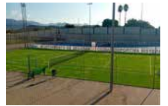
Pista renovada.