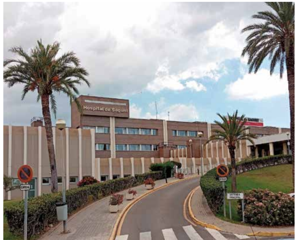
Hospital de Sagunt.

nució del seu salari per raons d'embaràs o lactància però, una cirurgiana, que estava exempta de guàrdies per lac-