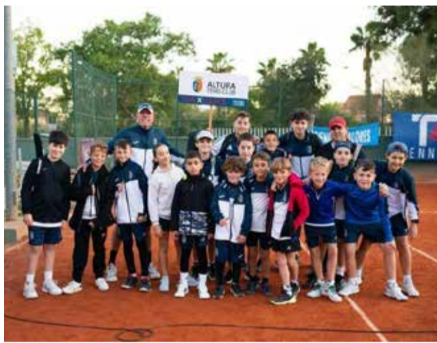
El equipo de Altura clasificado para Madrid.

La competición, que reunió a clubes y escuelas de tenis de toda la Comunitat Valenciana, fue escenario de una jornada llena de emoción, esfuerzo y deportividad, en la que los representantes de Altura brillaron por su nivel de juego y su actitud dentro y fuera de la pista. Con este nuevo triunfo, el