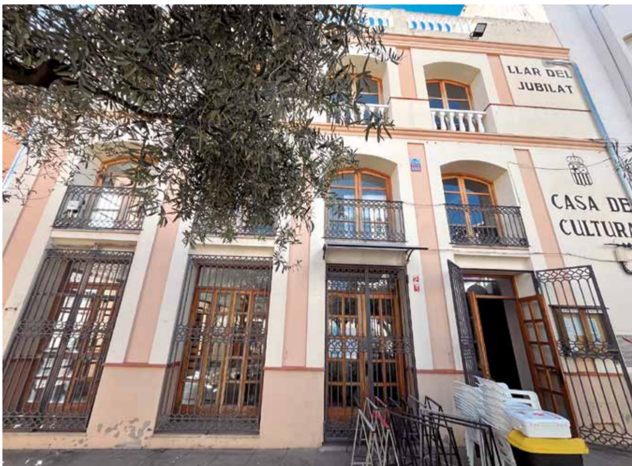
L'exterior de la Casa de la Cultura i la Llar del Jubilat de Quartell.