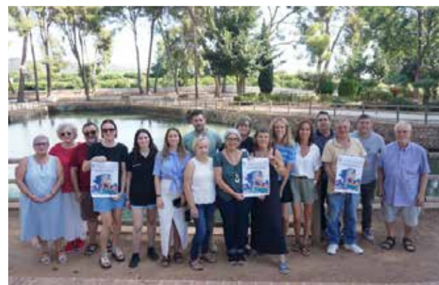
Activitat d'homenatge a Quart.