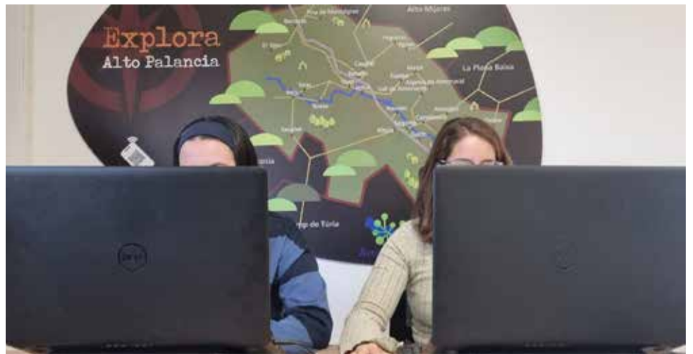
Dos nuevas empleadas públicas de la Mancomunidad para reforzar el servicio.

La creación de redes comunitarias, el impulso del asociacionismo y la promoción de la colaboración intermunicipal son tres de las apuestas de este innovador proyecto.