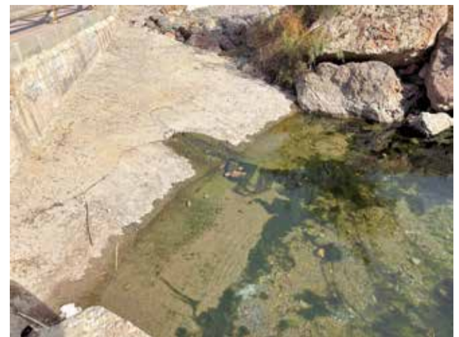
Canal Ciutat Mar en una imatge d'IP.