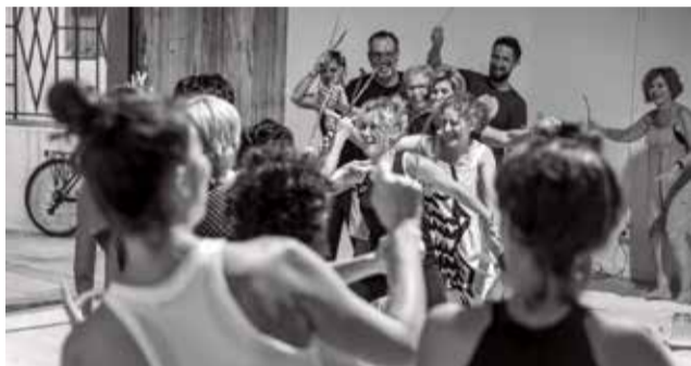
Els impulsors d'Hort Art i una iniciativa.

internacionals que aporten la seua experiència artística amb l'objectiu de generar vivència i no només espectacle.