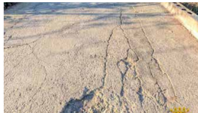
Camino del cementerio antes de las obras.