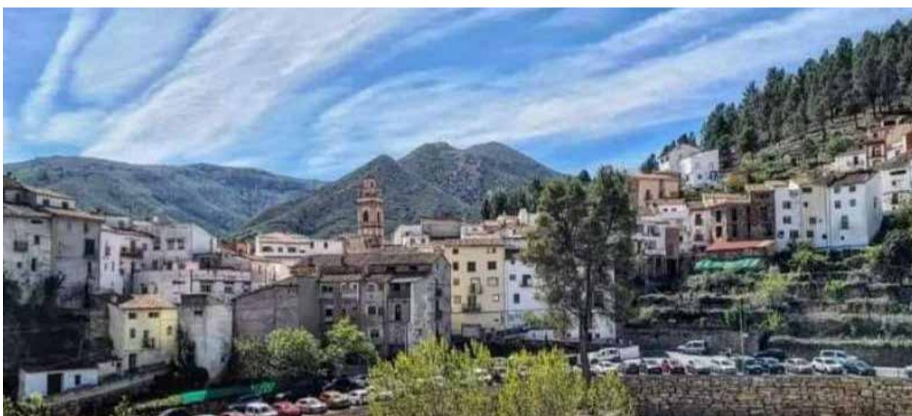
Panorámica del Barranco La Solanica de Montán.

El proyecto, que ha obtenido la máxima puntuación entre las propuestas presentadas, se enmarca dentro de la línea de trabajo que el Ayuntamiento lleva impulsando en los últimos años: fomentar un