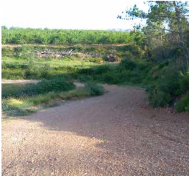
Uno de los caminos mejorados tras el incendio.

También se han ejecutado un muro de mampostería de 60 m 2 , la recuperación de 759 metros de