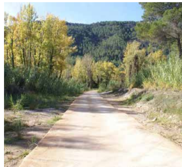
Uno de los caminos a la huerta reparado.

Con la reconstrucción de los caminos muy avanzada y el proyecto de senderos en marcha, Cirat avanza con paso firme hacia la recuperación total de su entorno. El esfuerzo conjunto de administraciones, colectivos y vecinos está permitiendo transformar la adversidad en una oportunidad para reforzar la seguridad, mejorar la accesibilidad y poner en valor un patrimonio natural único.