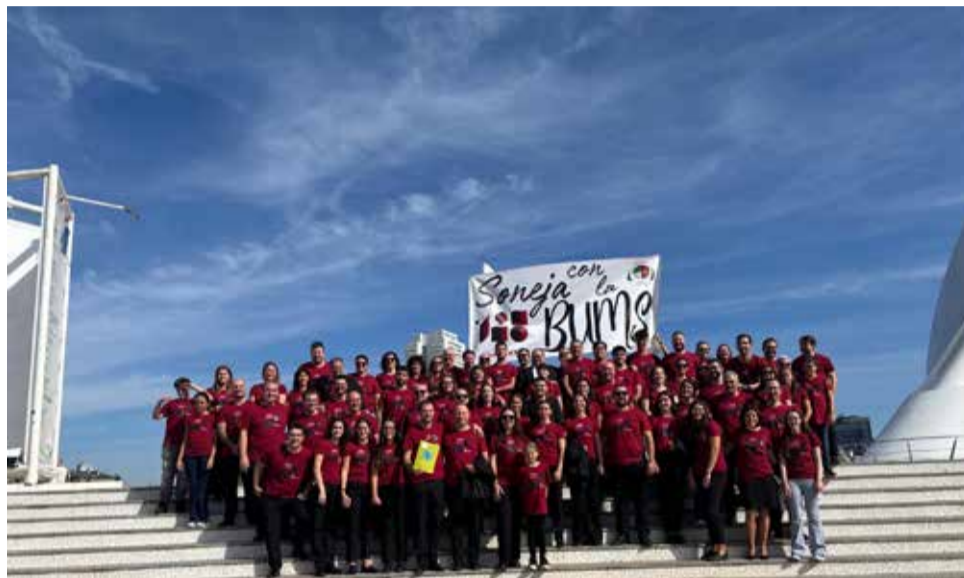
La Banda Unión Musical de Soneja posa tras el triunfo en el certamen.