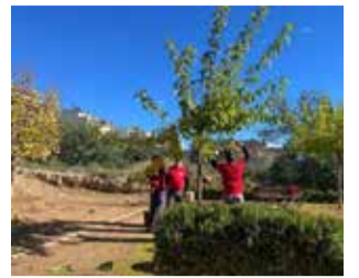
Nuevos trabajadores.