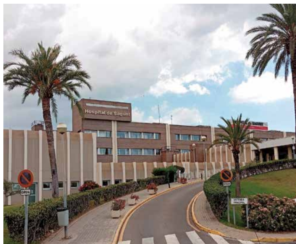
Hospital de Sagunt.

nució del seu salari per raons d'embaràs o lactància però, una cirurgiana, que estava exempta de guàrdies per lac-