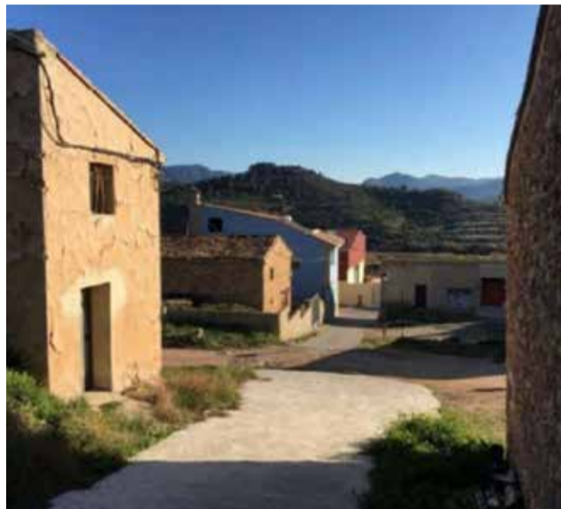
Barrio de las Eras de Geldo.

El Ayuntamiento ha puesto en marcha la estrategia participativa para la transformación de las Eras, un proceso de implicación ciudadana que acompañará el proyecto de remodelación de este histórico barrio residencial. El objetivo es convertir las 1,5 hectáreas en un espacio liga-