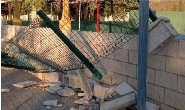
Desperfectos en el muro del polideportivo.