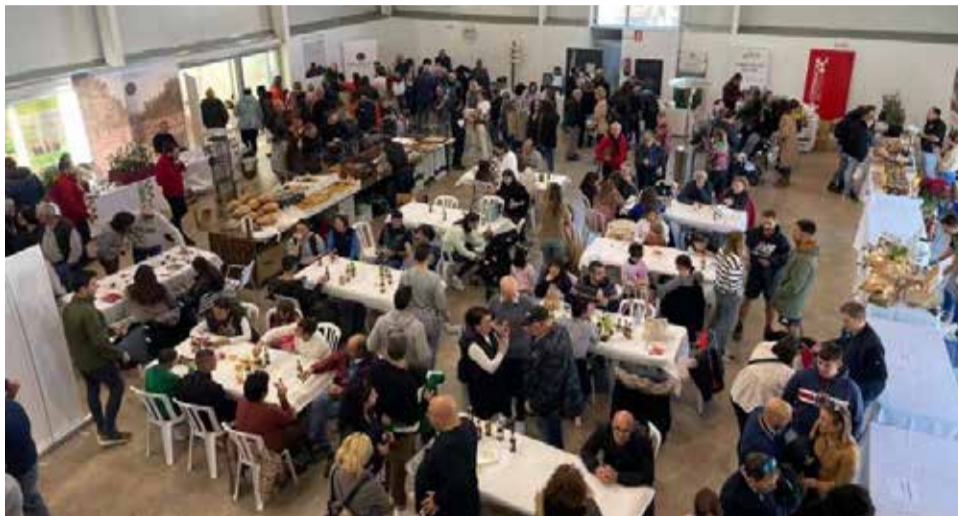
Imagen de la Feria de la Trufa Negra de El Toro en 2024.

Será del 27 al 30 de noviembre. Cuatro jornadas dedicadas a narrar las bondades de un hongo “que es oro y crece en una tierra fértil y dura. Unas características únicas que imprimen