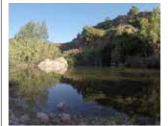
Río Mijares. / EPDA