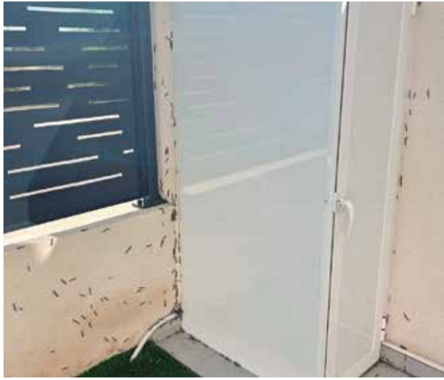
Centenars de cucs en una vivenda de Sagunt.