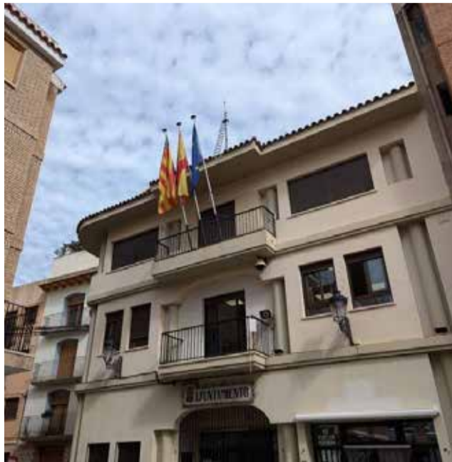
Ayuntamiento de Montanejos.

Para el Ayuntamiento de Montanejos, teniendo en