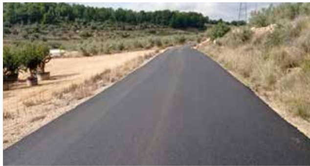
Mejoras en el camino de la Cancha de Tiro.

Cabe destacar que, estas obras dependientes de la Conselleria de Agricultura, Agua, Ganadería y Pesca, en manos de Miguel Barrachina, suponen una inversión de 30 millones de euros para reparar caminos rurales en las provin-