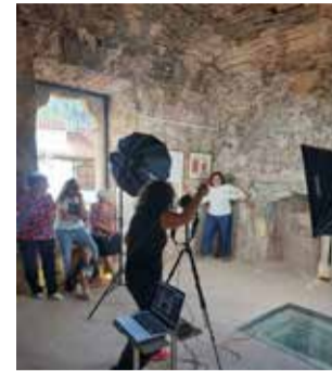
Sesión de fotografías.

El fin de esta magnífica idea es crear puentes entre el arte y la vida de campo,