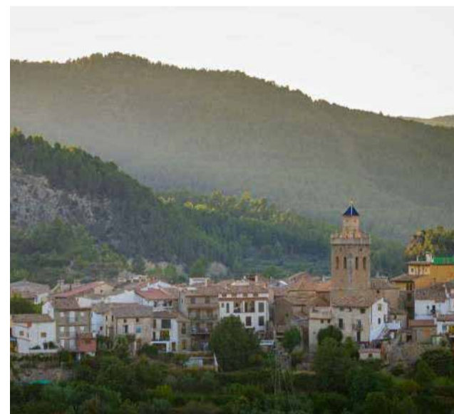
Panorámica de Puebla de Arenoso.

“Estas cuadrillas, junto a la brigada forestal municipal, realizan un trabajo fundamental de desbroce, limpieza y prevención en las zonas más vulnerables, especialmente en las áreas de interfaz urbano-forestal”, ha señalado Salvador. “Gracias a su labor, conseguimos que Puebla de Arenoso siga siendo un auténtico pulmón verde, un lugar privilegiado por su riqueza natural y su compromiso con el medio ambiente”, ha concluido el alcalde de la localidad del Alto Mijares.