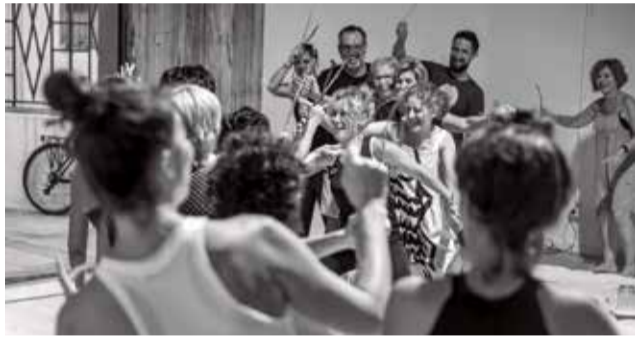
Els impulsors d'Hort Art i una iniciativa.

internacionals que aporten la seua experiència artística amb l'objectiu de generar vivència i no només espectacle.