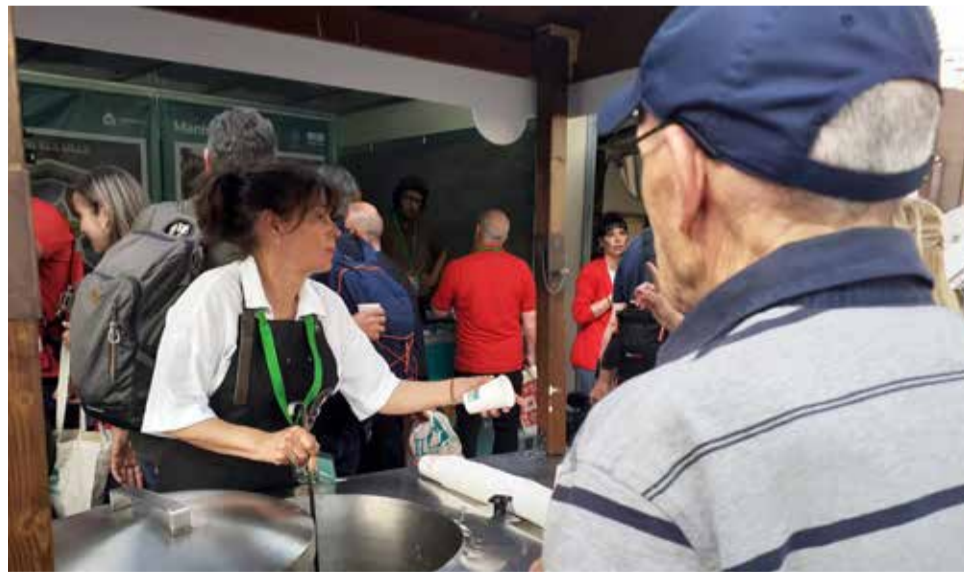
Un instant de la fira en el 2023.

La Fira dels Comarques de la Diputació, que per primera vegada se celebrarà als Jardins de Vivers de València, potència la promoció i venda directa de productes i experiències turístiques de la província entre els assistents, així com la projecció de les diverses destinacions turístiques del territori (municipis i mancomunitats). També permet conèixer el seu folklore, artesanía i les seues tradicions, a més de la gastro-