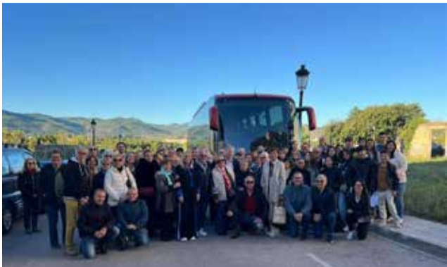
Fotografía a la llegada del autobús.