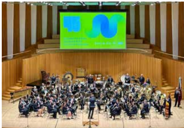
Momento de la actuación de la banda.

Soneja se llevó el certamen en su categoría representando a la provincia de Castellón con 369,75 puntos imponiéndose por más de 20 puntos a las bandas oponentes