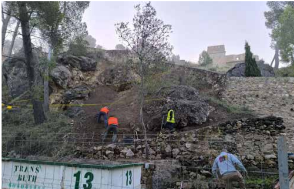
Comienzo de las obras de rehabilitación.

Todo ello tendrá en cuenta las directrices marcadas por la Ley de Patrimonio Cultural Valenciano, buscando los principios de autenticidad, rigurosidad histórica, mini-