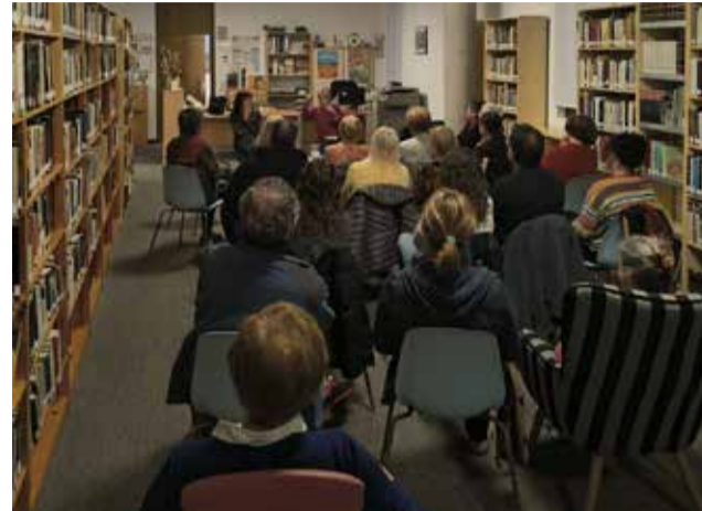
Imagen del coloquio en la biblioteca de Viver.

La doctora, conocida por sus investigaciones y sus agudas y lúcidas reflexiones que plasma en publicaciones y comparte en sus tertulias y entrevistas sobre la mujer, especialmente sobre la mujer mayor. Trata temas como la menopausia, el envejecimiento, la sexualidad, el erotismo conforme se va llegando a la vejez desde una mirada feminista, vitalista, poniendo en valor el llegar a vieja bien y el "ser vieja". Normaliza la menopausia como un periodo natural de la vida de la