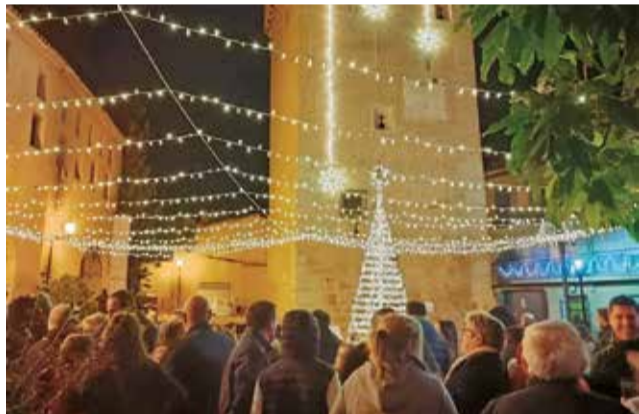
L'encesa de llums de l'any passat a Benavites.