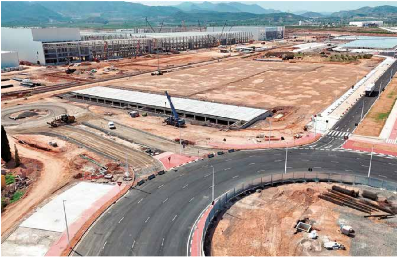
Vista aèria dels terrenys al parc empresarial.