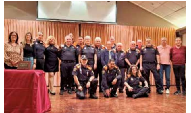
El cos de Protecció Civil d'Estivella.