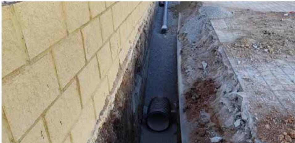
Cambios en la canalización del polígono industrial de la localidad.

La primera gran intervención que se ha puesto en marcha este mes de noviembre son las obras de renovación integral de la red de agua potable, con un presupuesto de más de 395.000 euros. La actuación, que pondrá fin a un problema histórico en la localidad, incluye la instalación de nuevas tuberías, la sustitución de acometidas y la mejora del mallado de la red mediante válvulas que optimizan la distribución del caudal.