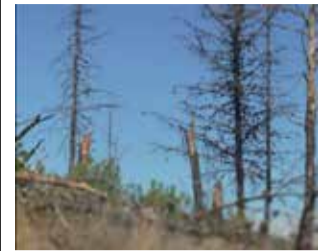
Fragmento del vídeo/ A.V