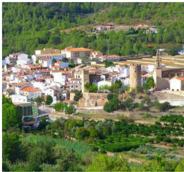
Panorámica de Argelita.

El nuevo espacio estará diseñado bajo criterios de eficiencia energética y sostenibilidad, incorporando materiales respetuosos con el medio ambiente y sistemas que minimicen el impacto ecológico. Además, el área de estacionamiento permitirá ofrecer un servicio moderno y adaptado a las necesidades de los viajeros que eligen el turismo itinerante, una modalidad cada vez más popular en las zonas rurales.