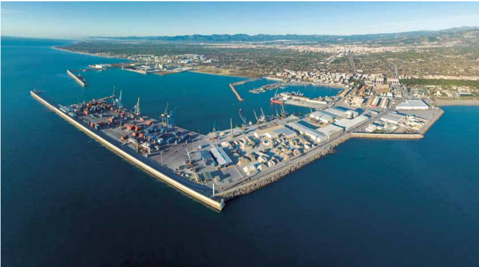
Vista aérea de las instalaciones del puerto de Castellón.

EL PUERTO CIERRA EL AÑO CON MÁS DE 6.000 PERSONAS ENTRE PASAJEROS Y TRIPULANTES Y NUEVAS ESCALAS PARA EL 2026