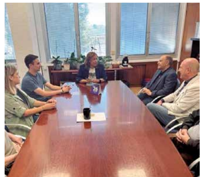
Reunión del Ayuntamiento de Benicàssim