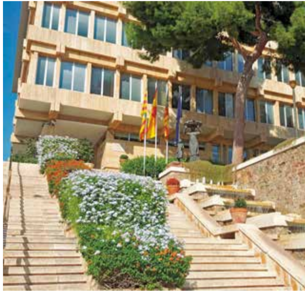
Ayuntamiento de Benicàssim.

El equipo que lidera Marqués también pone el foco en dos proyectos clave. Por un lado, continuar con el Plan de Inversiones Estratégicas para adecuar y mejorar espacios públicos y construir nuevas infraestructuras que impulsen el desarrollo del muni-