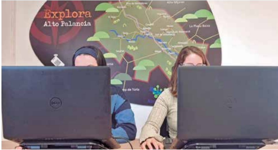
Dos nuevas empleadas públicas de la Mancomunidad.