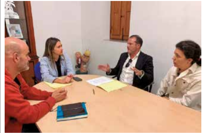
Conveni de col·laboració amb el IGME. / EPDA