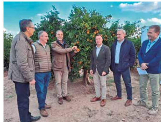
Campanya cítrica de Nules.