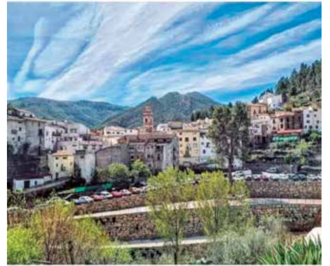
Vista del Barranco La Solanica de Montán.

El proyecto, que ha obtenido la máxima puntuación entre las propuestas presentadas, se enmarca dentro de la línea de trabajo que el Ayuntamiento lleva impul-