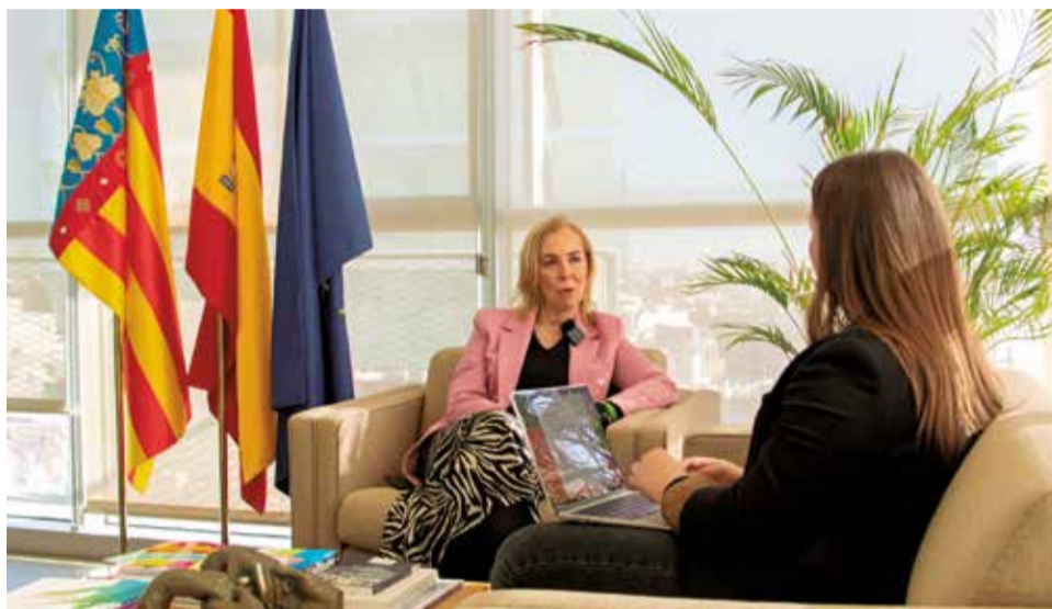
Varios instantes durante la entrevista.

► Para nosotros, erradicar la violencia es muy importante, y por eso este gobierno creó este comisionado específico. En el gobierno del Botànic, estas funciones se englobaban dentro de la Dirección General de Igualdad, donde se trataba todo tipo de desigualdades. Queríamos darle un tratamiento específico. Por eso, no solo se creó este comisionado, sino que además se le dotó de recursos, se le duplicó el presupuesto. Tanto es así que nos ha permitido en estos dos años de legislatura incrementar seis nuevos centros para atender la violencia contra la mujer: desde un nuevo centro demandado durante muchísimos años y nunca había llegado a ser una realidad, hasta