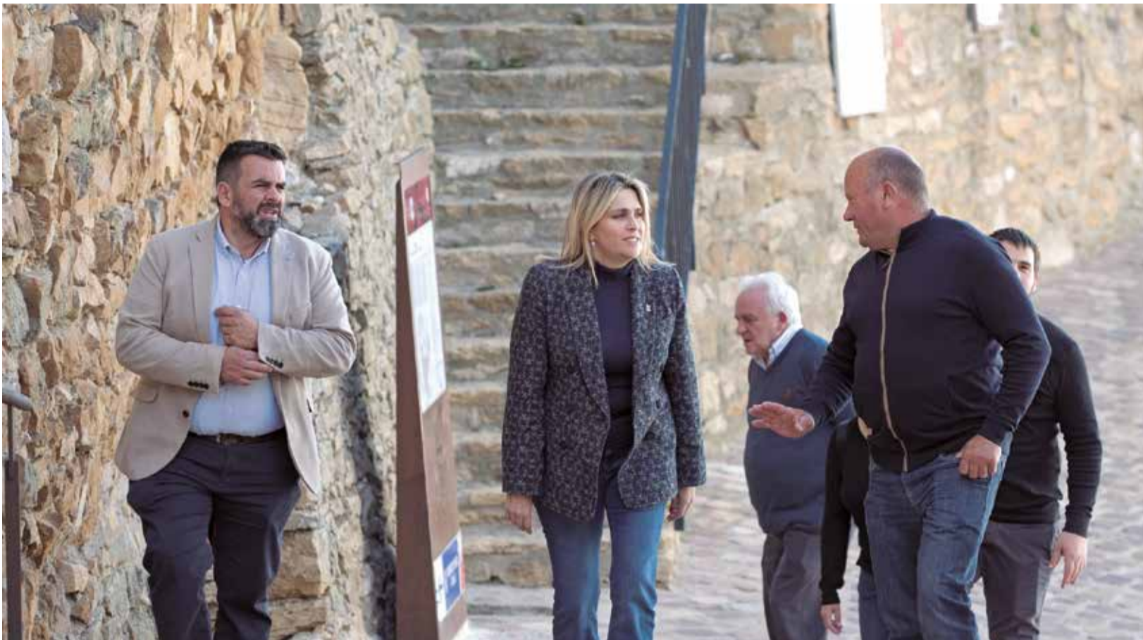
La presidenta de la Diputació de Castelló, Marta Barrachina, en la seua visita al municipi de Culla.

EL PROJECTE GARANTIX L'ENVELLIMENT ACTIU DELS MAJORS I CONTRIBUÏX A FRENAR LA DESPOBLACIÓ DEL MUNICIPI