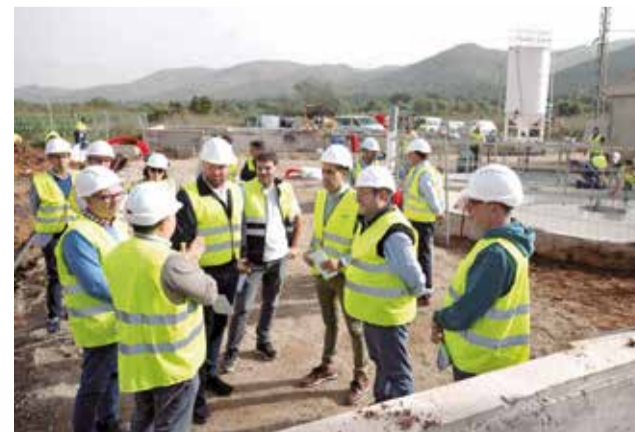
Treballs de millora de la depuració d'aigües.

El vicepresident provincial ha expressat que "garantir una bona depuració d'aigües comporta la generació de noves oportunitats per a fixar la població en el nostre territori.