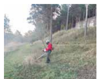
Brigada EMERGE. / EPDA