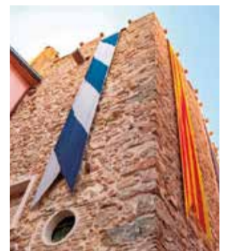
Torre del Repés.

Cal recordar que, recentment, es va dur a terme