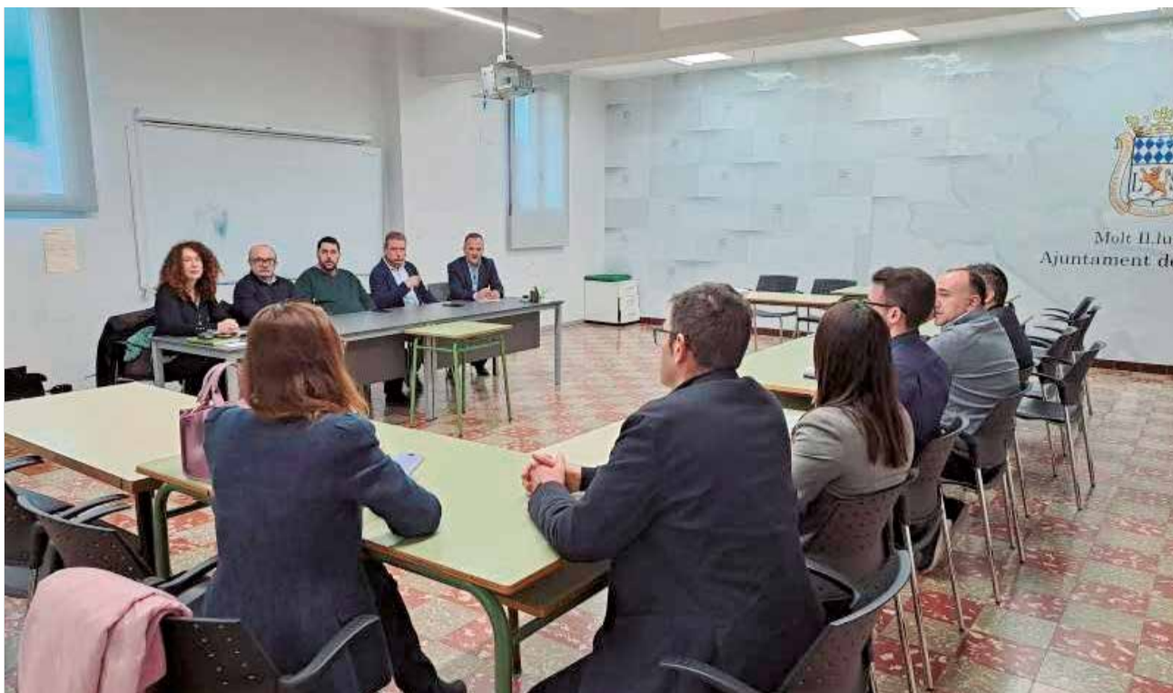
Imatge de l'assemblea de ratificació per a la gestió de la mina de Nules.