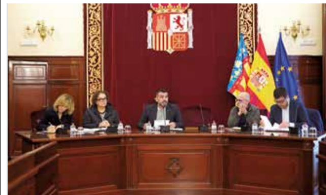
Assemblea Consorci Provincial Bombers.