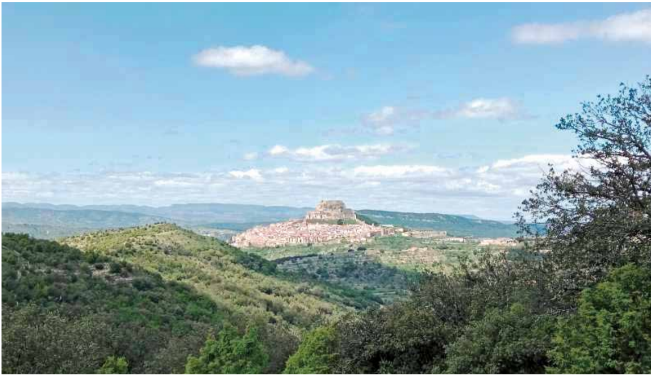
Sendera GR7 al seu pas pel municipi de Morella.