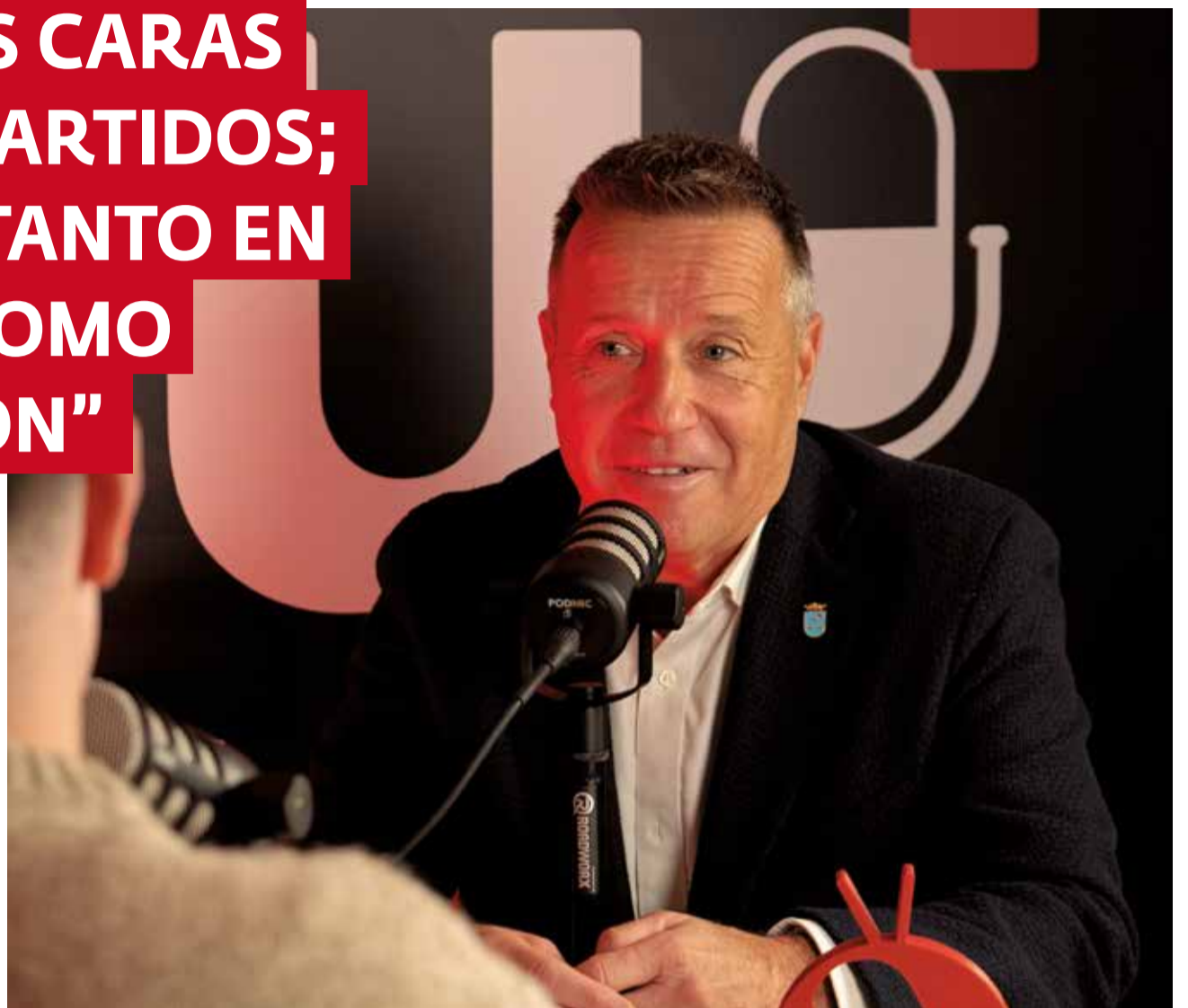
El alcalde de Burriana participa en Aquí Podcast.

► Nosotros en general, hemos tenido votos a favor de todos los partidos y hemos tenido votos en contra de todos los partidos, incluidos nuestros socios de gobierno con anterioridad. En cuanto a si va a ser más dura la oposición, por parte de Vox sí que han hecho algunas declaraciones que ahora íbamos a conocer la verdadera cara de ellos, bueno, pues