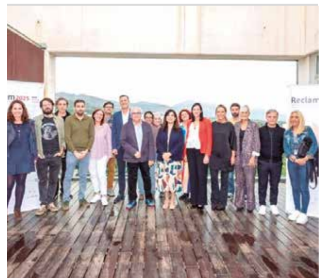
Presentació de la Mostra d'Arts Escèniques.

Amb esta programació, Vilafranca ha tornat a posar de manifest el seu compromís amb la cultura i les arts escèniques, oferint propostes per a tots els públics i situant el municipi com un punt de trobada cultural imprescindible a l'interior de Castelló.