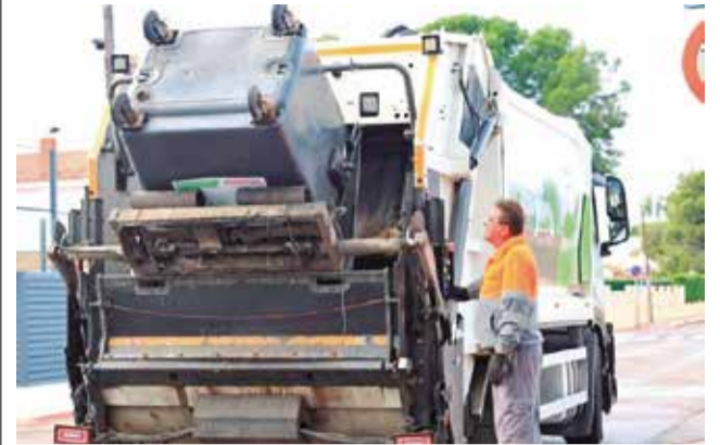
Un efectivo de limpieza durante sus labores.