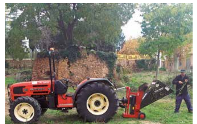
Nou tractor per a les labors forestals.

Amb esta inversió, l'Ajuntament de Benassal reforça el seu compromís amb la protecció del medi ambient, la prevenció d'incendis i la millora de la gestió dels residus vegetals del municipi.