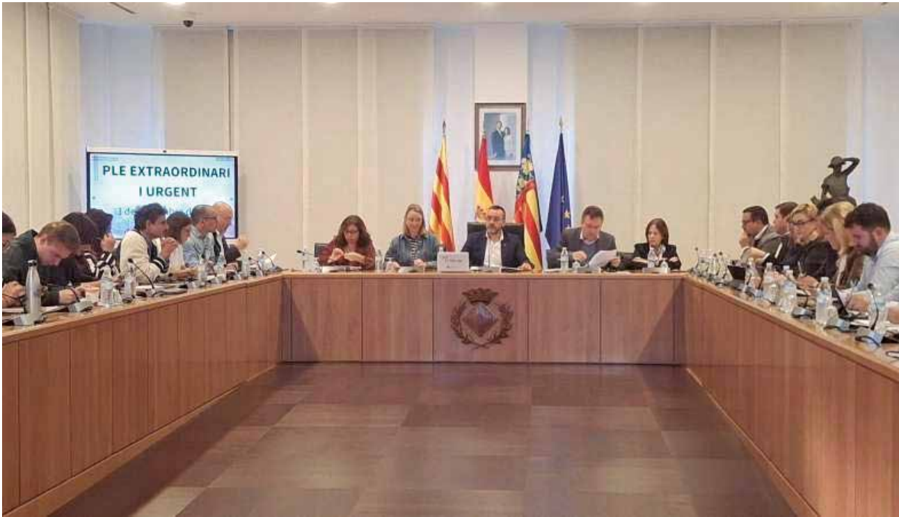
Ple extraordinari i urgent del Ajuntament de Vila-real.