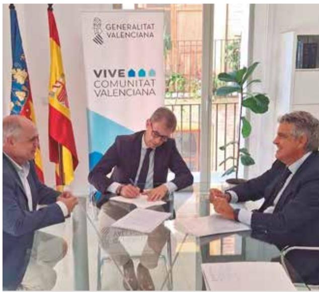
Reunió per a la cessió de les parcel·les acordades.