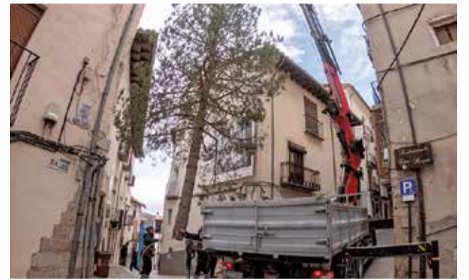
Morella planta l'arbre de Nadal en Cinc Cantons.