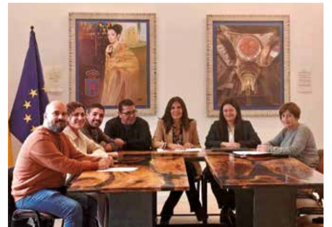
Ple de l'Ajuntament de Canet lo Roig.

es destinen a diversos programes i accions que redunten en el benestar de la població 'canetana'. No falta el suport al teixit associatiu de la localitat com la Associació de Jubilats (1.500 euros), Banda de Música (14.500 euros), Va unir de Joves (3.500 euros), Penya Taurina (14.000 euros), Escola de Futbol Baix Maestrat (1.000 euros), Ateneu Dany Cerebral Adquirít (600 euros), AMPA (1.000 euros), Subvenció BTT (1.000 euros), altres associacions i institucions sense ànim de lucre (500 euros).