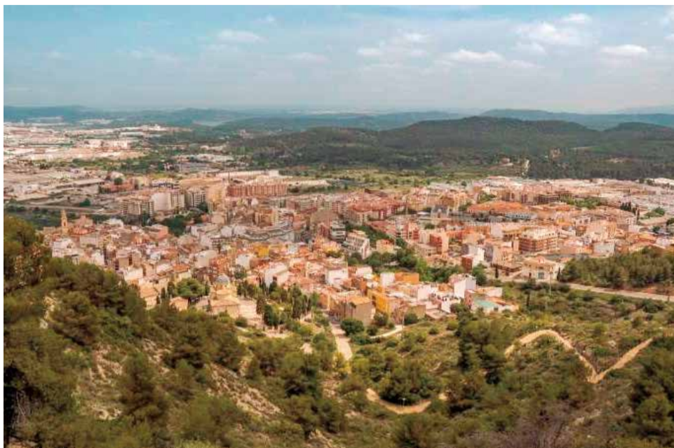
Imatge aèria del municipi de L'Alcora.

El pressupost es guia per tres metes: mantindre un període mitjà de pagament òptim, garantir una gestió eficient de la despesa i assegurar que les inversions responguen a les prioritats reals de la població. El capítol d'inversions aconseguix els 6,8 milions d'euros, dels quals un 63% procedeix de finançament extern obtingut davant