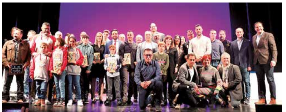
Els premiats en una altra edició.

portista Femenina, Millor Esportista Masculí, Millor Entitat Esportiva Local, Guardó al Foment Esportiu, Guardó a l'Afany de Superació, Guardó DORSAL 261 al reconeixement de la visibilitat de l'esport femení, Guardó a l'Esportista Novell, Guardó al Mèrit Esportiu més destacat de la comarca, Guardó al reconeixement a la Trajectòria Esportiva i Guardó Valors Humans.