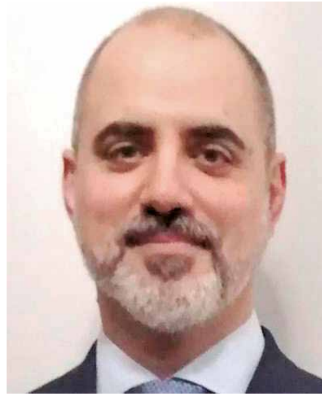
El subdelegado del Gobierno.

Sobre estos hechos se imputan en la denuncia tres tipos de delitos: desobediencia (art. 410 CP) por la negativa abierta y reiterada a cumplir la resolución y recomendaciones de la Agencia Valenciana Antifraude; prevaricación administrativa (art. 404 CP) por dictar y mantener resoluciones presuntamente ar-