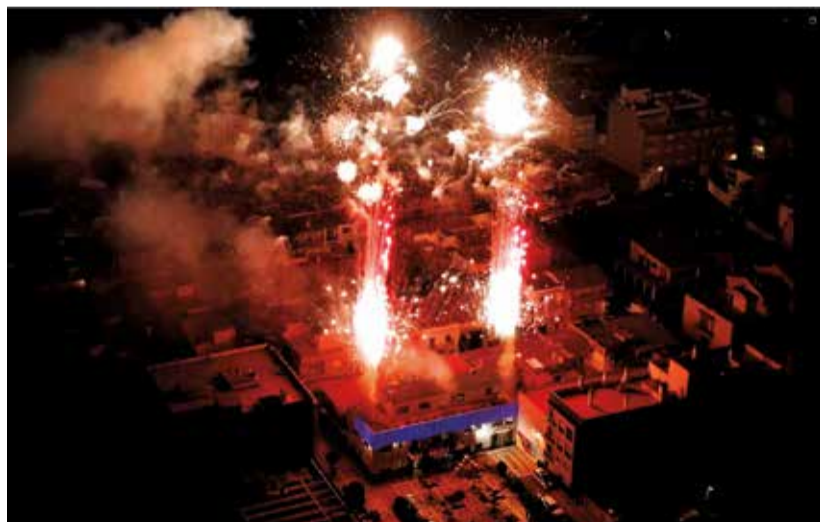
AMENENT DE FAURA

da amb música i ball. Una actuació que prolongarà la celebració fins ben entrada la nit, sota la batuta dels Festers i festeres.