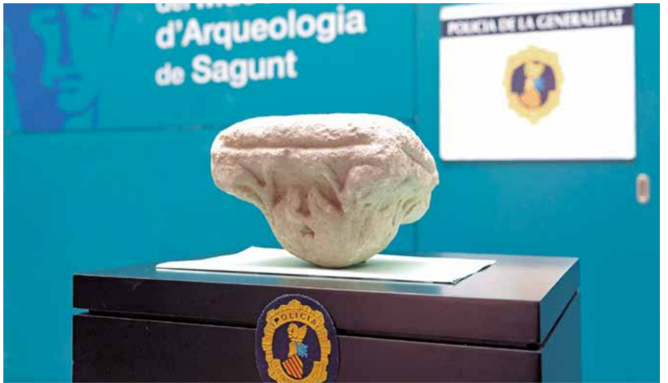
El capitel recuperat per la Policia de la Generalitat ja es troba en el Museu d'Arqueologia de Sagunt

La peça va eixir a la llum per casualitat, quan un obrer estava obrint un vano en un mur durant unes obres de re-