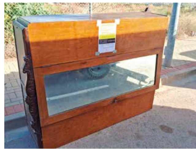
Un moble dipositat en ple carrer a Canet.

La campanya consistix a identificar objectes dipositats incorrectament amb un adhesiu groc indicant "Aviso de incidència. Residus dipositats in-