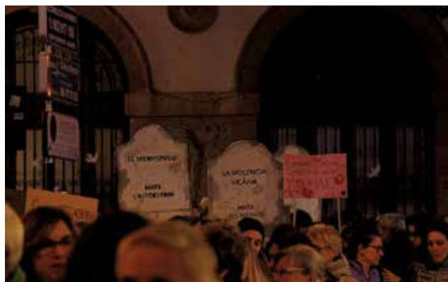
Un instant de la manifestació.

Allí, es va llegir un manifest en què es varen recordar totes les dones assassinades i s'ha reivindicat el compromís