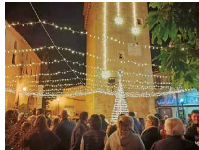
Encesa de llums l'any passat a Benavites.

La rifa se celebrarà durant la vesprada de l'encesa de llums i es convertirà en un dels moments més esperats de la jornada, que pretén unir festa, emoció i solidaritat en un mateix espai.