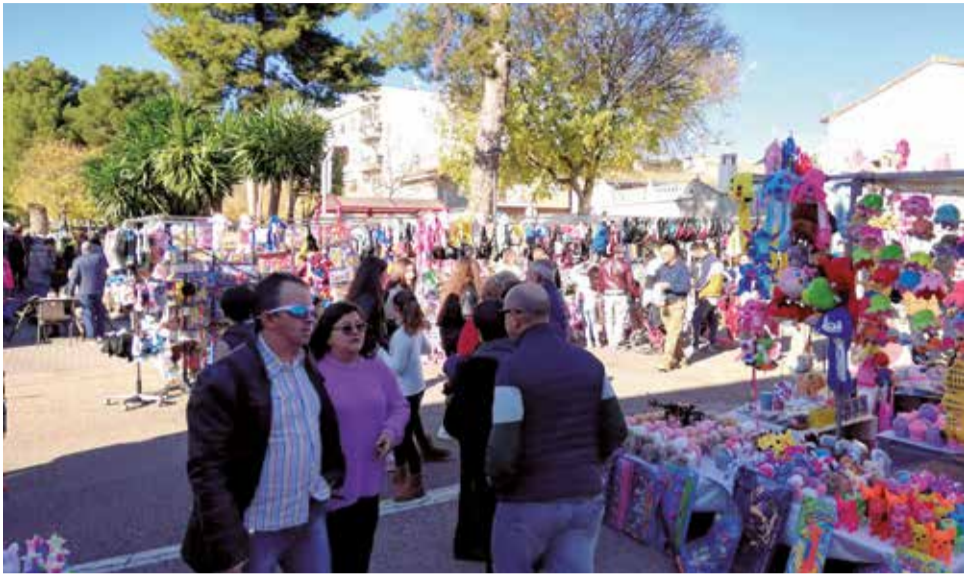
La Fira de Santa Llúcia d'Algímia d'Alfara en una imatge d'arxiu.