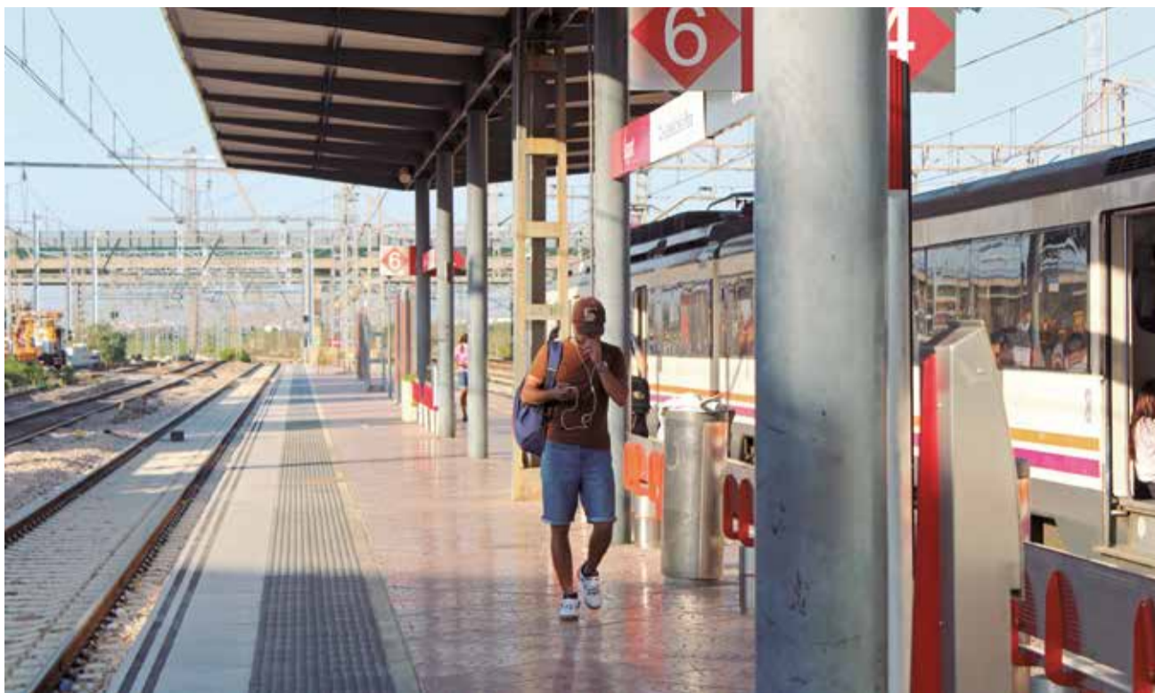
L'estació de tren de Sagunt.