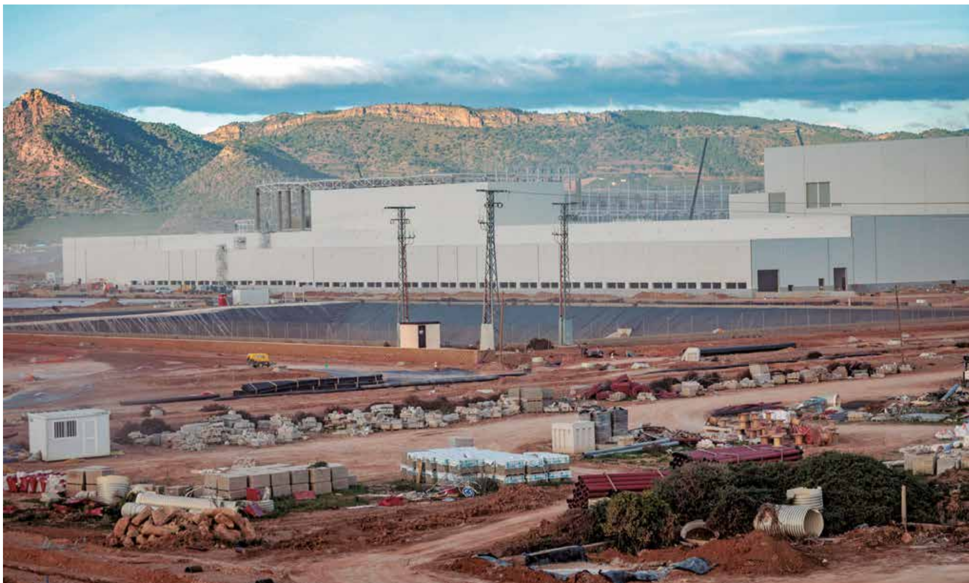
Vista general de las obras de la gigafactoría de baterías de PowerCo, del grupo Volkswagen, que se está construyendo en Sagunt.

LA GIGAFACITORÍA DE POWERCO ACABA LA OBRA CIVIL DEL PRIMER BLOQUE Y EMPEZARÁ A PRODUCIR CELDAS EN SEPTIEMBRE DEL AÑO QUE VIENE