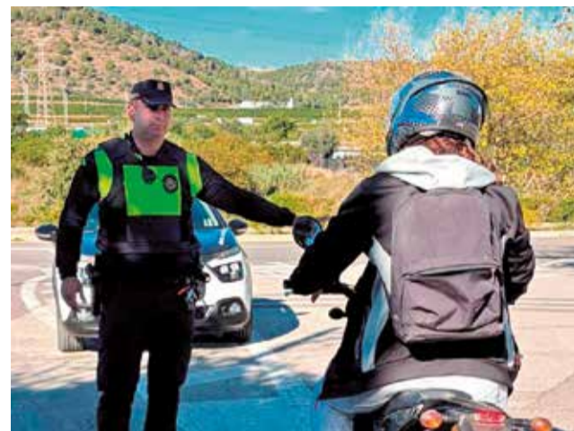
Campanya de vigilància a Sagunt.