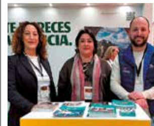
Delegació en la fira.