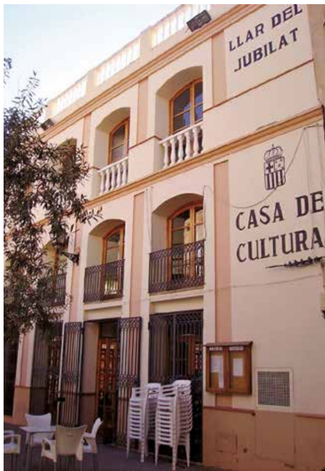
El bar de la Casa de la Cultura de Quartell.

Vilar ha denunciat que l'equip de govern ha optat per una "tramitació d'urgència inexistente, posant en perill" la subvenció i provocant "un retard injustificable" en les obres, que ha afectat tant a l'activitat social i econòmica com a la se-