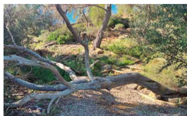
Un dels diversos arbres sobre el sender.

Segons Ximo Catalán, portaveu del PP en el municipi, esta situació impedeix que esportistes, veïns i visitants puguen transitar amb seguretat per la senda, limitant fins i tot l'accés a l'Ermita de Sant Cristòfol. "Moltes persones es veuen obligades a descendir per zones mun-