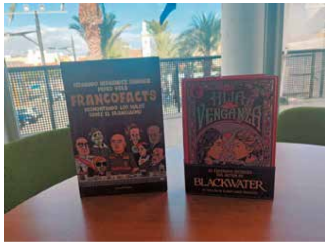
Llibres a Canet d'en Berenguer.