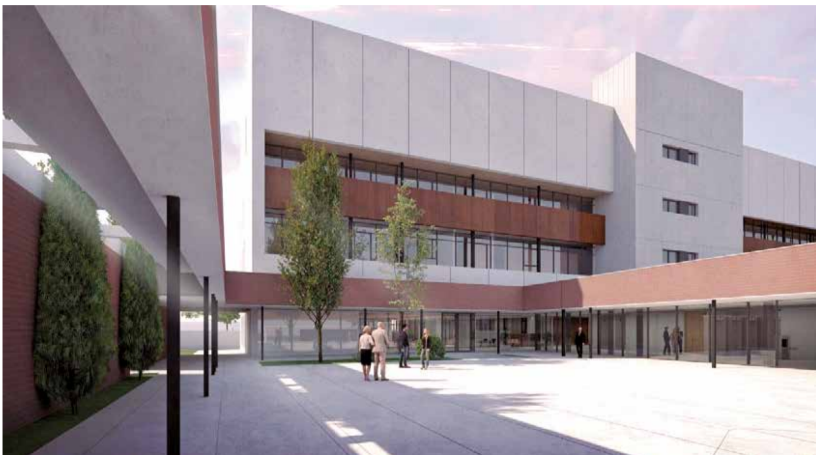
Recreació del nou Palau de la Justícia de Sagunt, que estarà ubicat junt al Centre Comercial de Lepicentre.

■ L'OBRA UNIFICARÀ I AMPLIARÀ ELS SERVEIS, A MÉS D'ADAPTAR LES INSTAL·LACIONS A L'INCREMENT POBLACIONAL