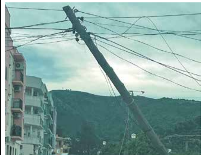
Un dels pals caiguts a Benifairó.

Després de diversos avisos, els operaris de l'empresa ja han executat les reparacions.