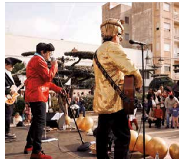
Les 'paraetes' de la Fira de Faura omplien este municipi de la Vall de Segó en unes imatges de l'edició de l'any passat.

civilitzacions com Babilònia o Egipte conviuen amb joguets tradicionals de les nostres terres, en un recorregut que parla de memòria compartida, creativitat i evolució social. Una mostra pensada tant per a la nostàlgia dels adults com per a la curiositat dels xiquets.