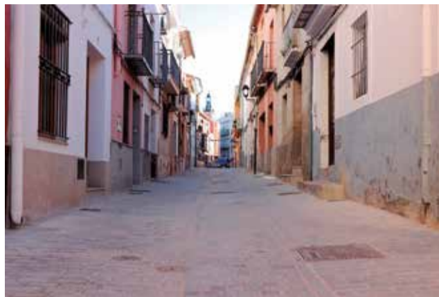
Carrers on s'ha actuat després de les obres.

En primer lloc, s'ha efectuat la renovació de les infraestructures hidràuliques, una actuació escomesa per Aigües de Sagunt, amb una inversió superior als 1,6 milions d'euros. En concret, s'ha millorat la xarxa de sanejament, amb l'objectiu d'augmentar la seua capacitat, millorar la captació de l'aigua de la pluja i el seu drenatge, per a evitar inundacions i problemes de salubritat. També s'ha actuat sobre la xarxa d'aigua potable, per exemple, substituint materials obsolets, com el fibrociment, i