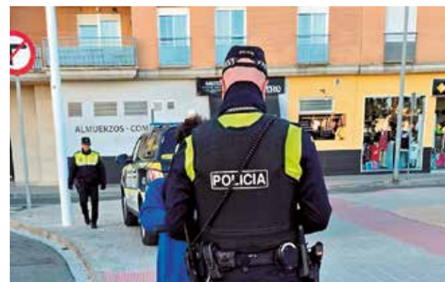
Un agent interposa una sanció.

tacat "la valoració molt positiva de la campanya", que ha permés reforçar la seguretat dels vianants i garantir la circulació en condicions adequades. Carrera recorda que la regulació continuarà avançant: a partir de 2026 serà obligatori que els VMP compten amb assegurança de responsabilitat civil i estiguen homologats i registrats.