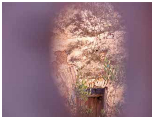
Estat actual del Palau Condés de Orbe i Pinies, ubicat en el centre urbà de Quartell.