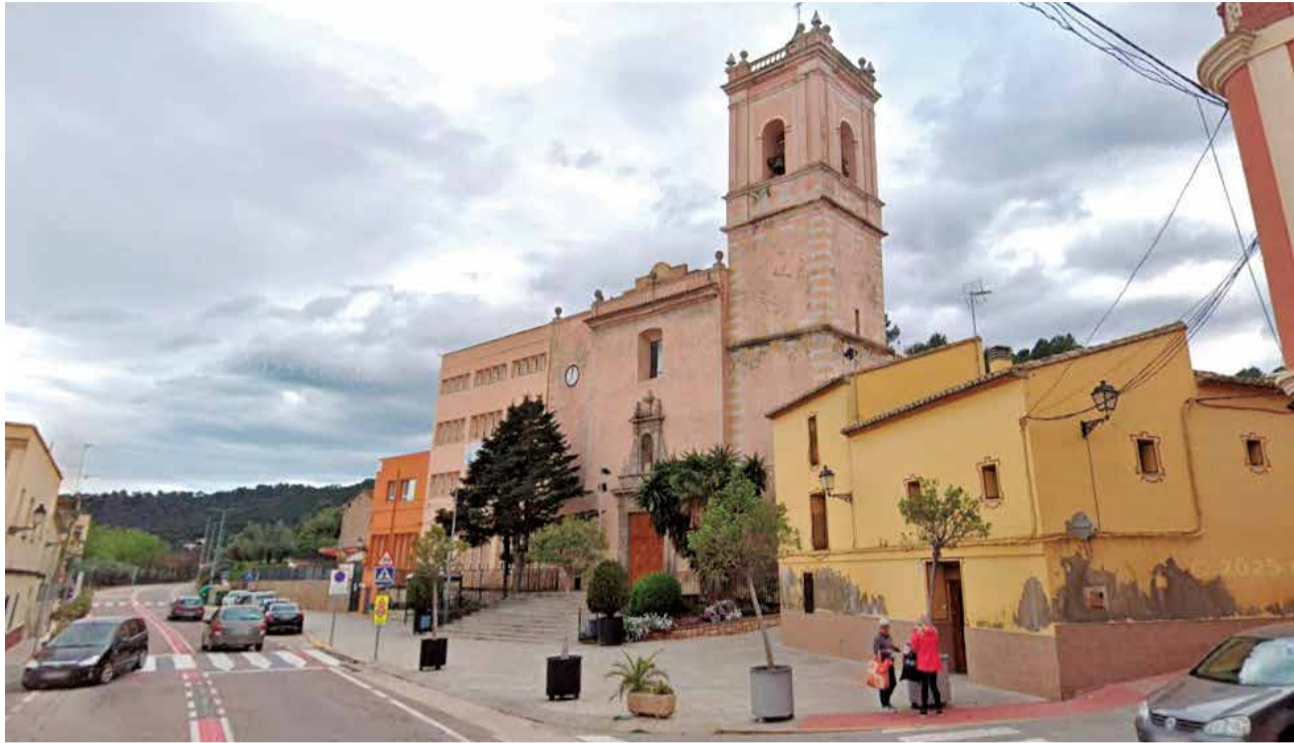
Vista de Gilet. / EPDA