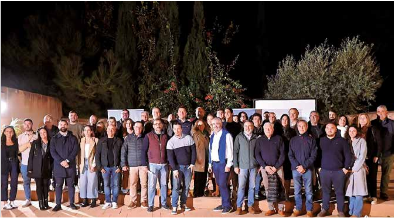
El PP del Camp de Morvedre.