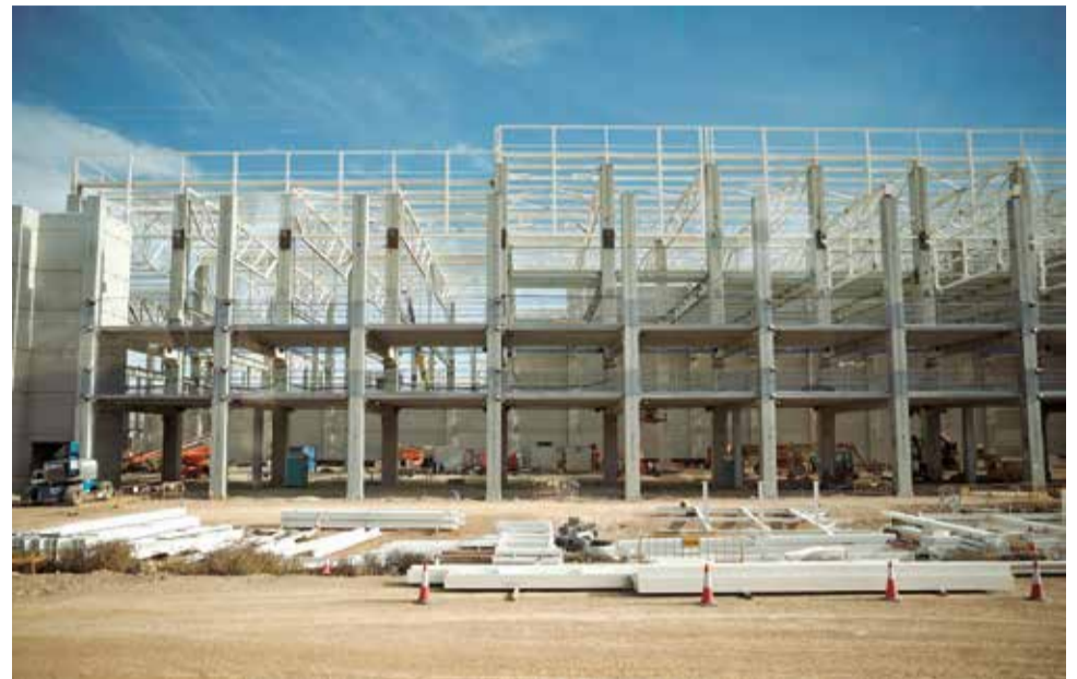
La planta de PowerCo en la visita de hace unos días tras finalizar la construcción del primer bloque productivo.

ejecutará el proveedor surcoreano K-Ensol- dentro de los propios edificios, con las que se crea un entorno seguro y exento de contaminación externa, ya sea polvo, partículas o polen que pueden afectar a su calidad o rendimiento.