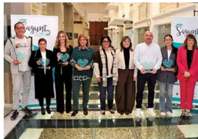
Els guardonats.

tants de la Regidoria de Turisme, Turisme Comunitat Valenciana, l'Asociación de Comerciantes y Profesionales Puerto Sagunto (ACPS), l'Asociación de Comerciantes, Empresarios e Industriales de Sagunto y Comarca (ACEISYC), l'Asociación de Comerciantes Ciudad de Sagunto (ACCS), l'Asociación de Empresarios del Camp de Morvedre (ASECAM), l'Asociación para el Desarrollo Turístico de Sagunto (ADETURSA), l'Asociación de Comerciantes 9 d'Octubre i la Cambra de Comerç de València.