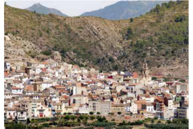
Vista del municipio de Tuéjar.

Los actos comenzarán a las 23:00 horas en la Plaza Mayor, punto de encuentro desde el que partirá el desfile de Carnaval, que estará amenizado por charangas y recorrerá las calles del municipio creando un ambiente festivo y desenfadado. El desfile se convierte cada año en uno de los momentos más destacados de la noche, con disfraces originales y una gran implicación tanto de vecinos como de visitantes.