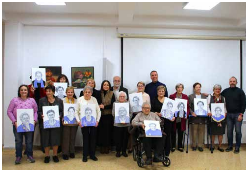
Acto de presentación en Benagéber.

rolló en un ambiente entrañable y profundamente emotivo. La publicación recoge los relatos de vida de 14 mujeres de los distintos municipios del Alto Turia. Son historias de mujeres que trabajaron en el campo y en otros oficios, emigraron, cuidaron familias, impulsaron la educación y el asociacionismo y sostuvieron la vida comunitaria, dejando un lega-