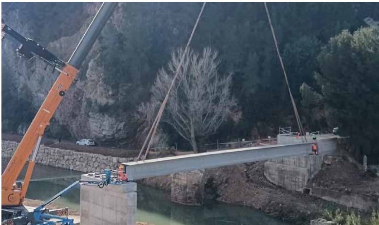
Operarios trabajan en la obra del puente de la Andenia en Bugarra.

En los últimos días, el traslado hasta el municipio de estas vigas de grandes dimensiones ha requerido una logística especial y el uso de maquinaria pesada, dada la envergadura de las piezas y la complejidad técnica de su colocación. Los trabajos se centran ahora en el ajuste y posicionamiento preciso de estos elementos estructurales, una tarea que exige una coor-