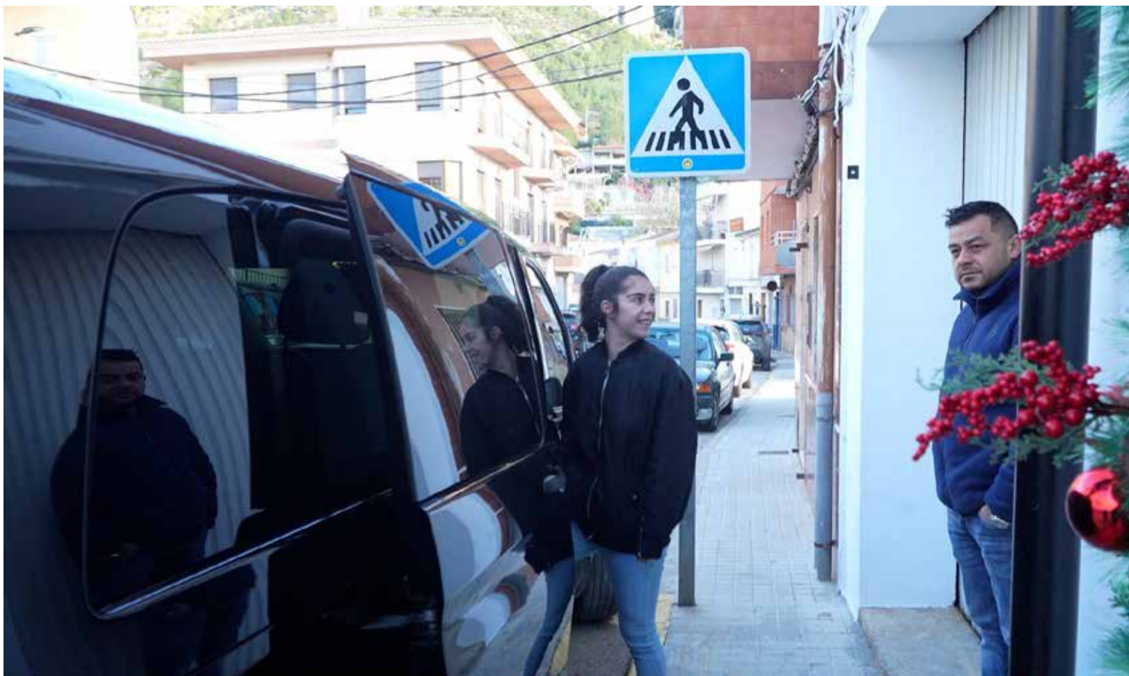
Una usuaria accede al Taxi Rural de Dos Aguas