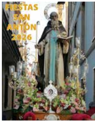
Cartel de San Antón.

El programa festivo se prolongará el siguiente fin de semana con los actos taurinos, que se celebrarán los días 23, 24 y 25 de enero, con entradas y suel-