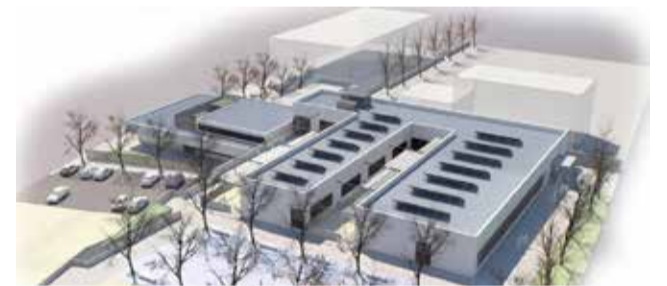
Proyecto del colegio de Villar.

La moción reclama a la Generalitat Valenciana que mantenga su compromiso con la