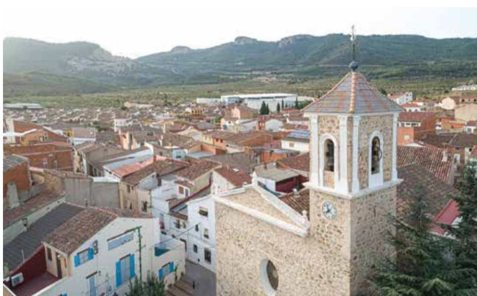
Vista del municipio de Higueruelas.

El alcalde de Higueruelas, Melanio Esteban, ha señalado: "Celebro esta cola-