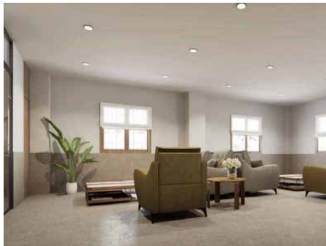
Proyecto del centro de día.

El edificio, distribuido en dos plantas, albergará unas