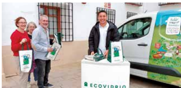
'Reto Mapamundi' en Utiel.

Los ganadores serán aquellos que mayor puntuación obtengan atendiendo a varios criterios como son el in-