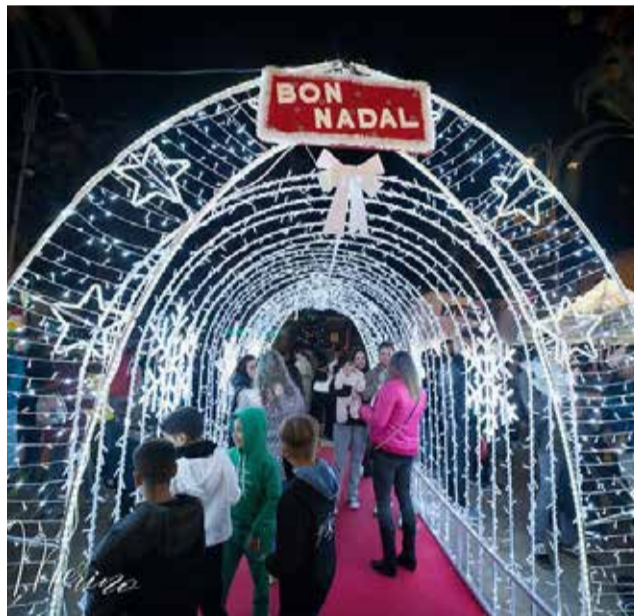
La magia de la Navidad en La Pobla de Farnals.