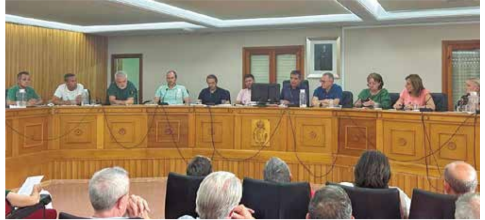
Un momento durante uno de los plenos del Ayuntamiento de Chiva.

► El problema es que en Chiva no podemos ensanchar, no podemos hacer ningún plan sur porque estamos encajados entre montañas y es un problema. La confederación está haciendo cálculos y bastantes proyectos, se han hecho muros de contención, muros de escollera con unos pilotes de 8 a 10 metros bajo tierra, con unas zapatas de hormigón importantes. También se ha quitado la "montaña" que había en la calle San Isidro, se ha quitado la roca y se ha dejado el recto, se están haciendo balsas de laminación, lagunas de contención. Hay más cuestiones, pero estamos delimitados por las calles y viviendas. Muchos cálculos por hacer, pero sí que es verdad que ahora hay unos muros que antes no había y con ellos se puede contener bastante la fuerza del agua.