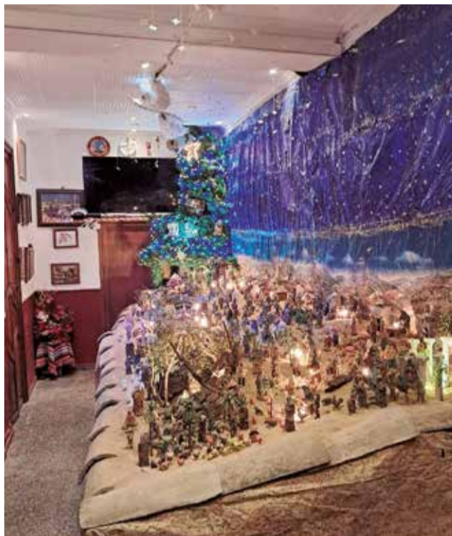
Instantáneas de archivo de la Navidad de 2024 en Godelleta.

El lunes 15 de diciembre se realizará un recorrido por el