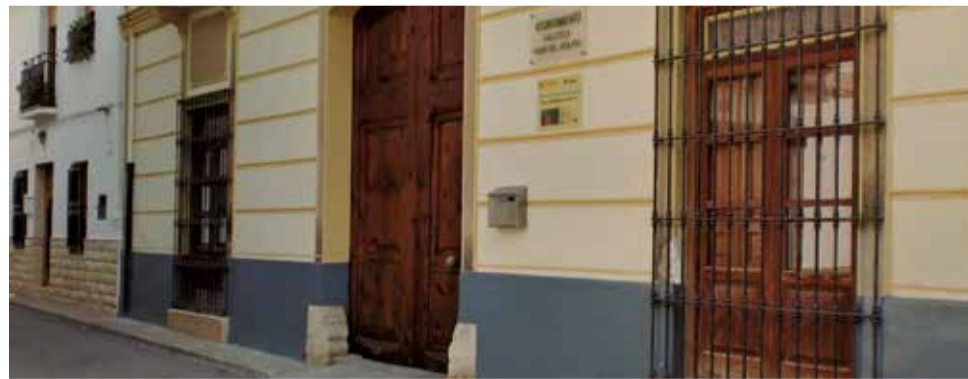
Fachada del Ayuntamiento de Macastre.

Gracias a este respaldo, el consistorio podrá avanzar en la elaboración de una propuesta europea orientada a poner en valor el papel de las mujeres en la cultura rural, impulsar la igualdad y abrir nue-