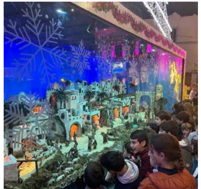
Visitas al belén en Riba-roja del Túria.