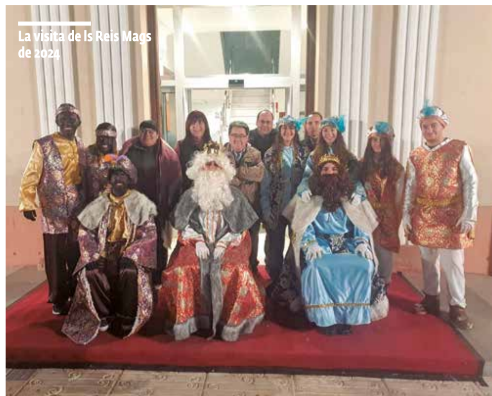
La visita de ls Reis Mags de 2024