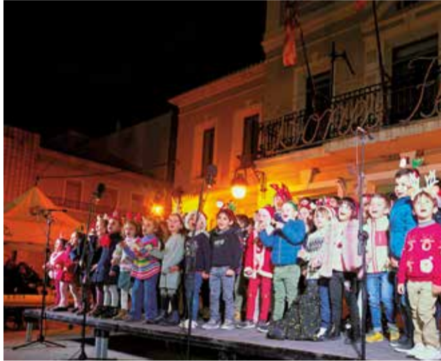
La inauguració del programa festiu.

El dilluns 22 de desembre tindrà lloc una vesprada natalenca, de 18.00 a 20.00 hores, amb disfresses i premis, mentre que el dimarts 23 es realitzarà una jornada de convivència amb jòvens del Espai Jove de Museros. El dia 26 se celebrarà el 'Survival. Jocs de supervivència', una