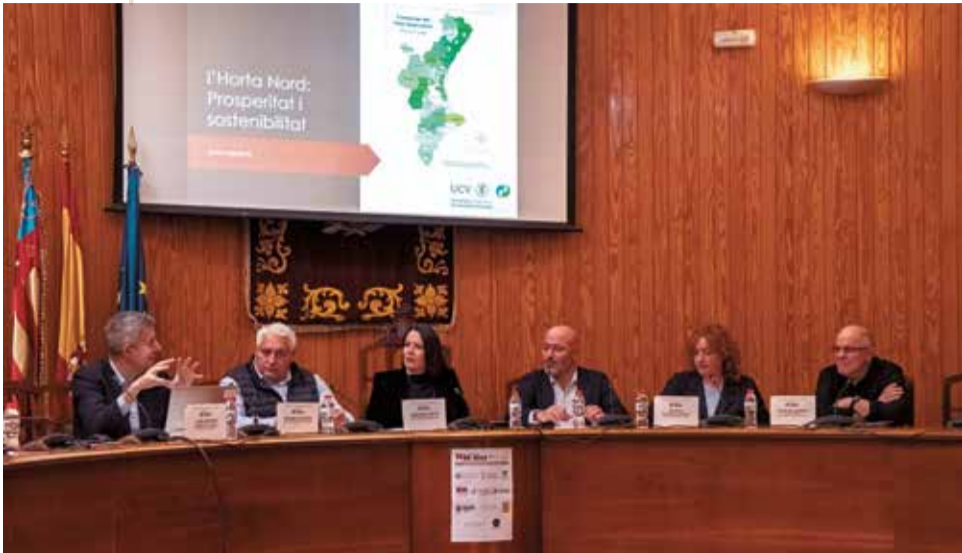
Los ponentes en un momento de la jornada.