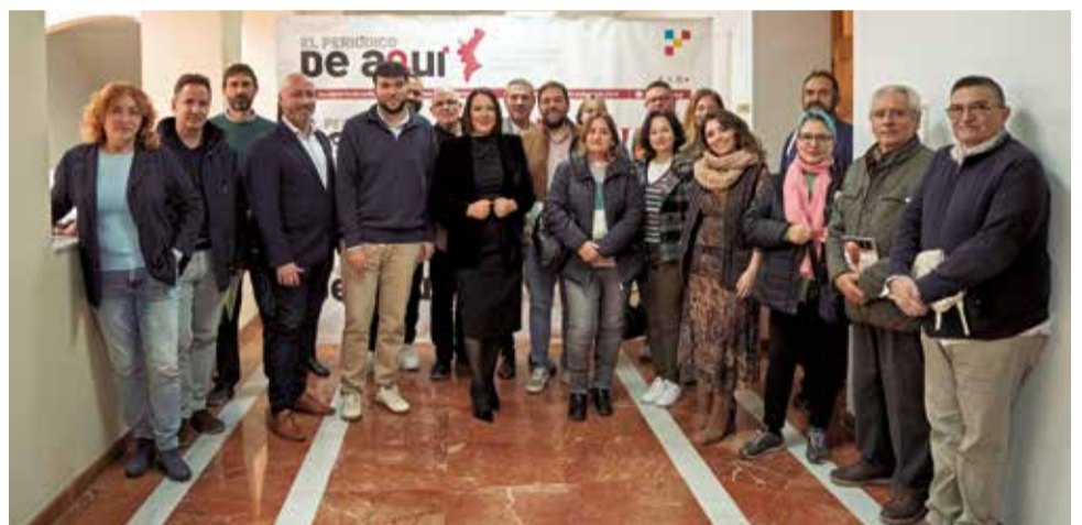
Asistentes y ponentes a las jornadas.

SI UNA LLUM ROJA T'INDICA QUE HAS DE PARAR,