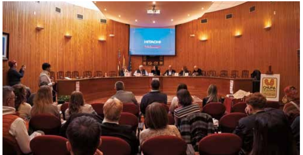
El público asistente en el salón de plenos de Moncada .

Por la Mancomunitat de l'Horta Nord, fue su presidente y alcalde de Rafelbun-