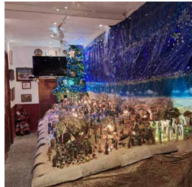
Godolleta exposa el seu betlem municipal.