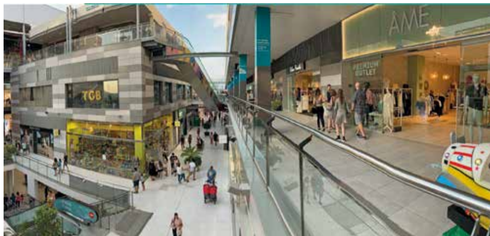
Instalaciones del Centro Comercial Lepicentre.

Para facilitar las compras navideñas, Lepicentre abrirá de manera especial los domingos 14 y 21 de diciembre. Además, los más pequeños podrán disfrutar de la esperada visita de Papá Noel, en los siguientes horarios: 13 y 14 de diciembre: 17:00 a 20:00; 19 al 23 de di-