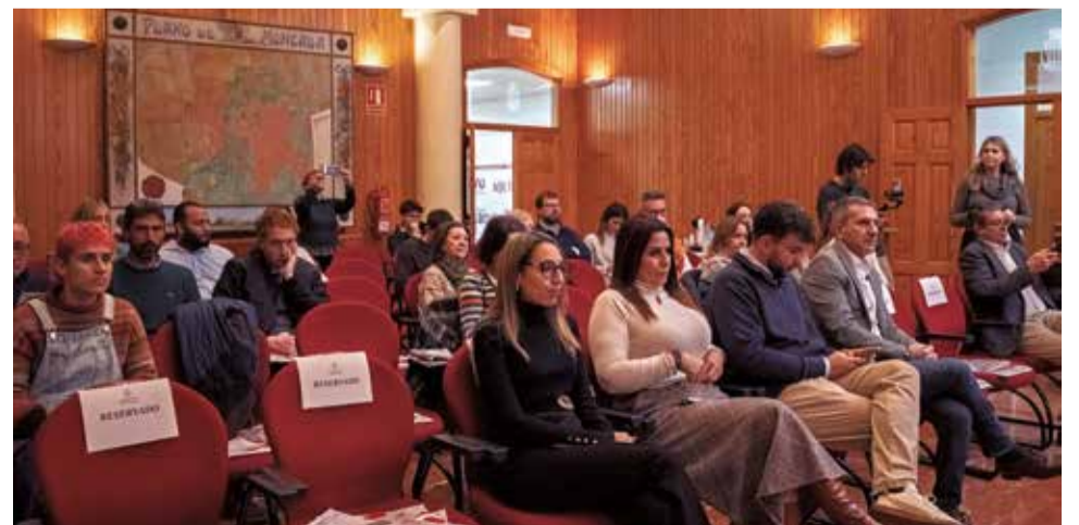
Los asistentes a las jornadas. / JAIME SORIANO