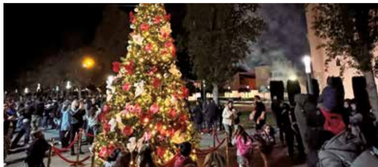
L'arbre de Nadal de l'any passat.

El 19 de desembre de 2025, el protagonisme serà per als més menuts amb l'arribada de la Casa de Papá Noel, amb inflables i tren nadalenc, al Parc del Mestre Serrano. L'activitat, organitzada per la Regidoria de Festes, es desenvoluparà de 17.30 a 20.00 hores, i els xiquets i xiquetes podran portar la seua carta per a entregar-la personalment a Pare Noel.