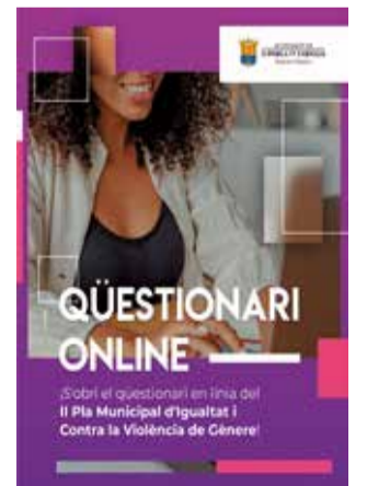
La portada.

La Pobla de Farnals avança cap a la construcció d'un municipi més igualitari, un procés en el qual la participació ciutadana resulta fonamental. Amb este objectiu, l'Ajuntament ha posat en marxa un qüestionari en línia perquè la ciutadania pugui expressar com percep la igualtat al municipi, quines millores considera necessàries i quines propostes voldria incorporar al nou pla municipal. Cada aportació contribueix a construir una Pobla