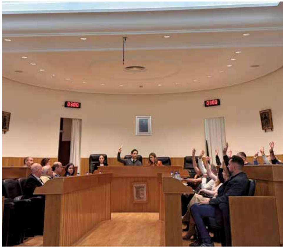
El pleno aprueba el presupuesto para 2026.

A lo largo de la exposición de los presupuestos, también ha destacado que Paterna mantiene por tercer ejerci-