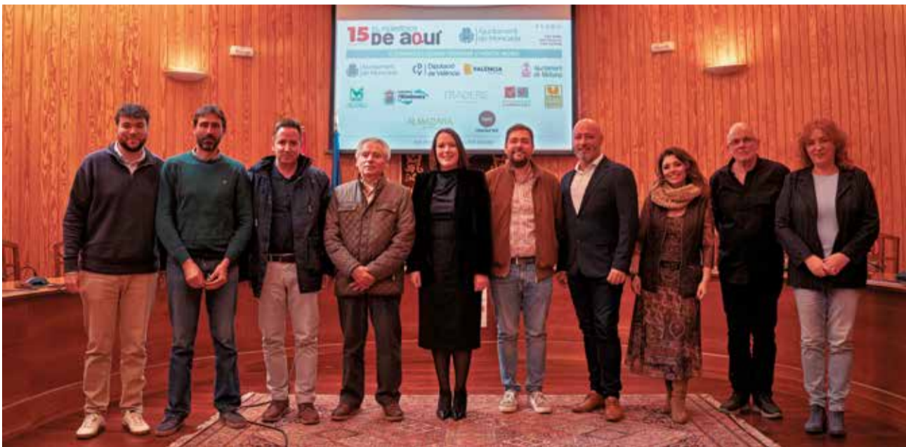
Los encargados de las ponencias, con la alcaldesa, el concejal de Turismo y la delegada de l'Horta Nord.

Lejos del turismo de sol y playa, la comarca ofrece experiencias centradas en el paisaje natural del que hace gala y del patrimonio arquitectónico y cultural, aunque quizás, lo más importante para que la estrategia funcione es crear nuevas sinergias entre los municipios que la conforman, con una mirada comarcal para atraer a los visitantes más cercanos que desconocen muchos de los atractivos que tienen cerca de su propia casa.