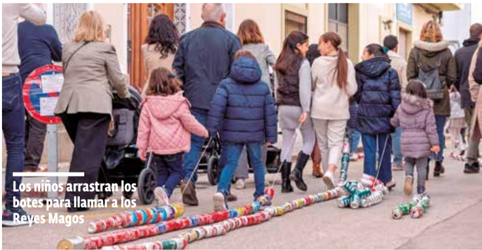
Los niños arrastran los botes para llamar a los Reyes Magos