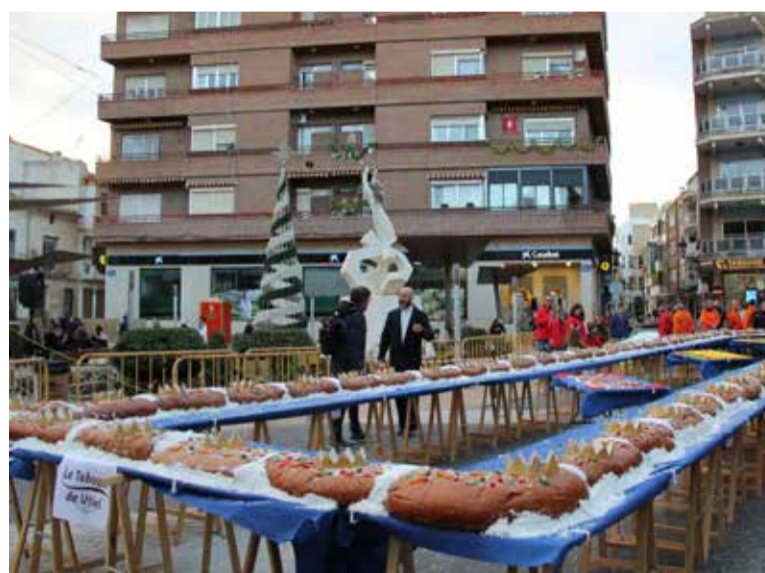
El 'Rosco' de Reis gegant d'Utiel.

nament nadalenc. Sobre l'escenari es reuniran una cantant convidada, Paula Villarroya i els tres cors infantils de la Unió Musical de Torrent, Cercle Catòlic i l'Escola Coral, formats per al voltant de 100 xiquets, que protagonitzaran una emotiva arrancada musical propi d'estes dates. Este acte s'acompanya d'una àmplia programació nadalena per a les pròximes setmanes.