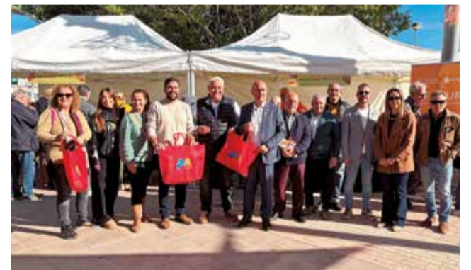
Las autoridades inauguran la feria.

pio ha aportado su identidad y el resultado ha sido una jornada abierta, atractiva y muy participativa. La respuesta del público confirma que la comarca tiene mucho a ofrecer, y continuaremos impulsando iniciativas que refuerzan este sentimiento de pertenencia y orgullo comarcal”.