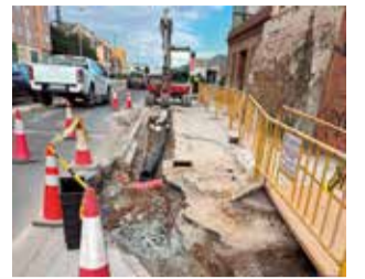
La actuación.