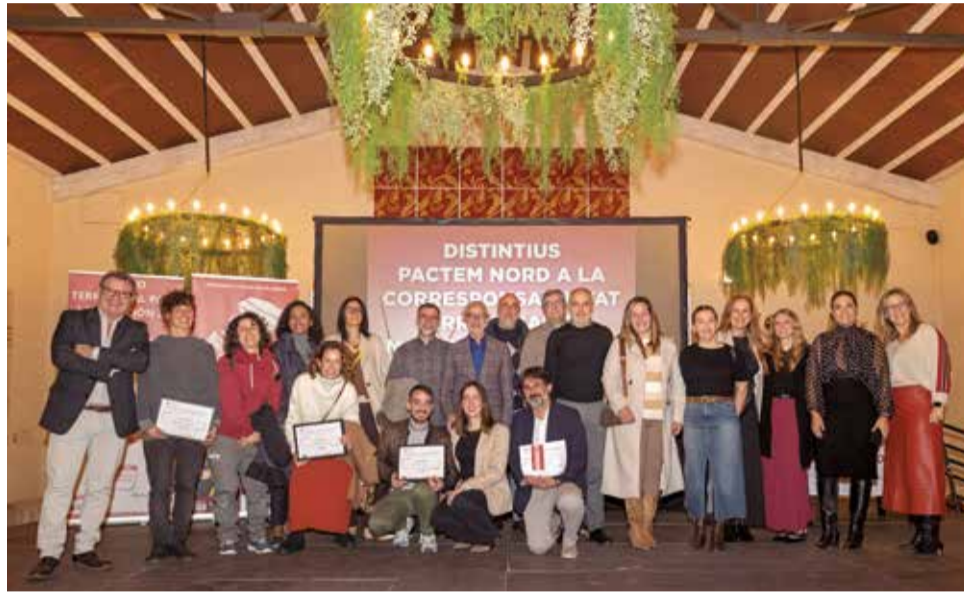
Los premiados durante la gala de Pactem Nord.

Esta VII edición bienal cuenta con la colaboración de Labora Santa Maria y el Programa Incorpora de Fundación la Caixa, así como de Facenord, Federación de asociaciones de comercio y de empresa de l'Horta Nord, y la Federació de Dones i Col·lectius per la Igualtat de l'Horta Nord, dos de las principales entidades colaboradoras en las iniciativas que se realizan desde el Pacto Territorial por el Empleo de esta comarca. Pactem Nord es una entidad que forma parte de la Red Re-