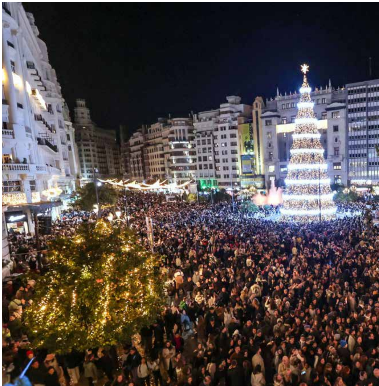
Milers de persones donen la benvinguda a Nadal en el Plaça de l'Ajuntament de València, amb l'encesa de les llums.

Nadal arribarà oficialment a Torrent, a l'Horta Sud, el divendres 28 de novembre amb la tradicional inauguració de l'encesa de la il·luminació de Nadal en la Plaça Bisbe Benlloch, al costat de l'emblemàtic ficus que presidix este enclavament històric. L'Ajuntament ha preparat un esdeveniment molt especial, dissenyat perquè xiquets, famílies i veïns gaudisquen de l'arrancada d'estes festes amb música, llum i un ambient ple-