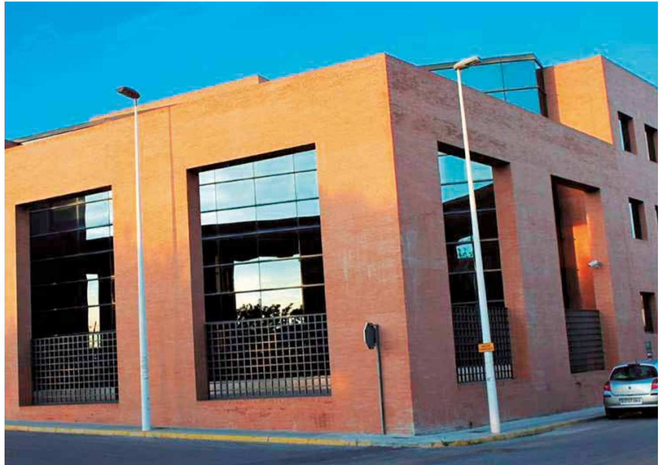
Fachada del juzgado de Moncada.

El juzgado aprecia indicios de un delito de estafa agravada, tipificado en los artículos 249 y 250 del Código Penal. En mayo de 2024, el juez acordó la emisión de una orden europea de detención y entrega con efectos internacionales contra el investigado