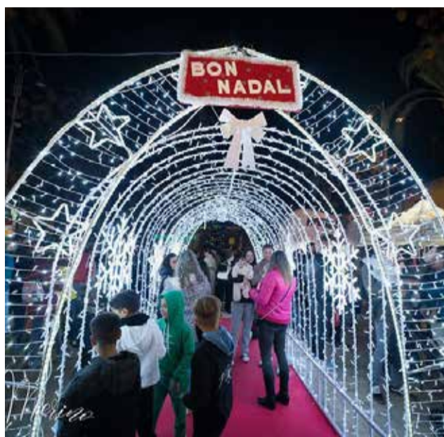
La màgia de Nadal a La Pobla de Farnals.