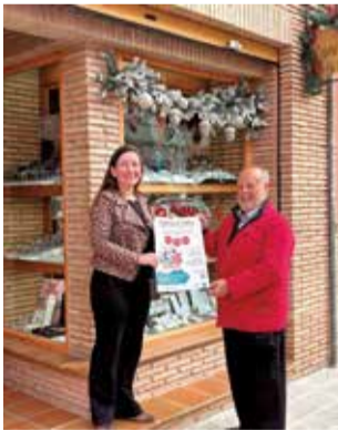
El regidor en un comerç. / EPDA

En total, 60 establiments del nucli urbà i de la platja