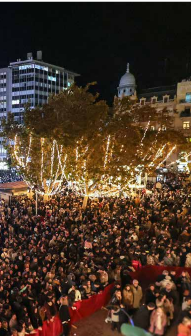
Il·lums / EPDA