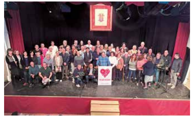
Les persones homenatjades.