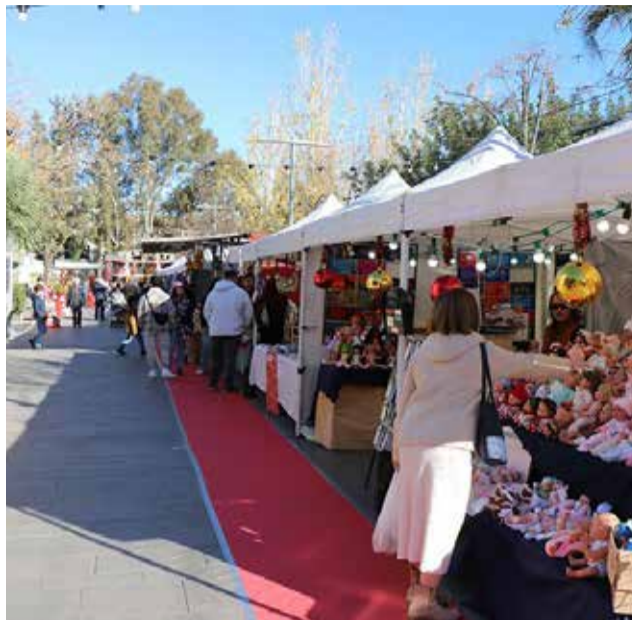
El mercat nadalenc de Sagunt.