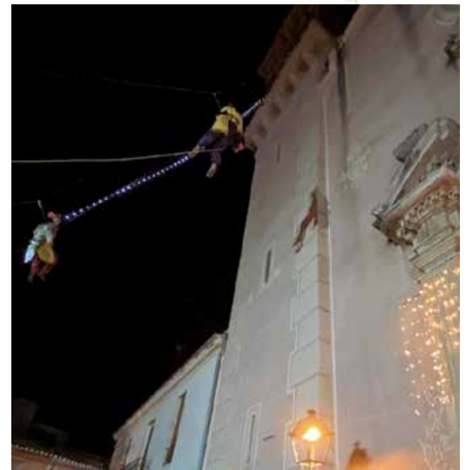
Els reis mags visiten Vinalesa.