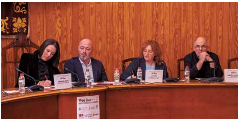
Las jornadas en la sala de pleno del ayuntamiento.