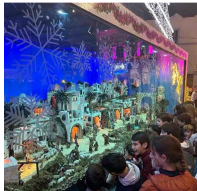
Vísitas al belén en Riba-roja del Túria.