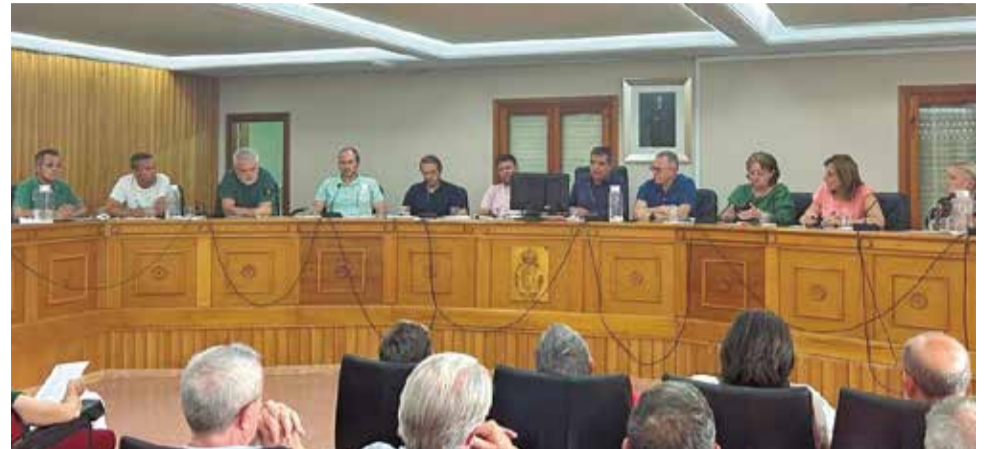
Un momento durante uno de los plenos del Ayuntamiento de Chiva.

► El problema es que en Chiva no podemos ensanchar, no podemos hacer ningún plan sur porque estamos encajados entre montañas y es un problema. La confederación está haciendo cálculos y bastantes proyectos, se han hecho muros de contención, muros de escollera con unos pilotes de 8 a 10 metros bajo tierra, con unas zapatas de hormigón importantes. También se ha quitado la "montaña" que había en la calle San Isidro, se ha quitado la roca y se ha dejado el recto, se están haciendo balsas de laminación, lagunas de contención. Hay más cuestiones, pero estamos delimitados por las calles y viviendas. Muchos cálculos por hacer, pero sí que es verdad que ahora hay unos muros que antes no había y con ellos se puede contener bastante la fuerza del agua.