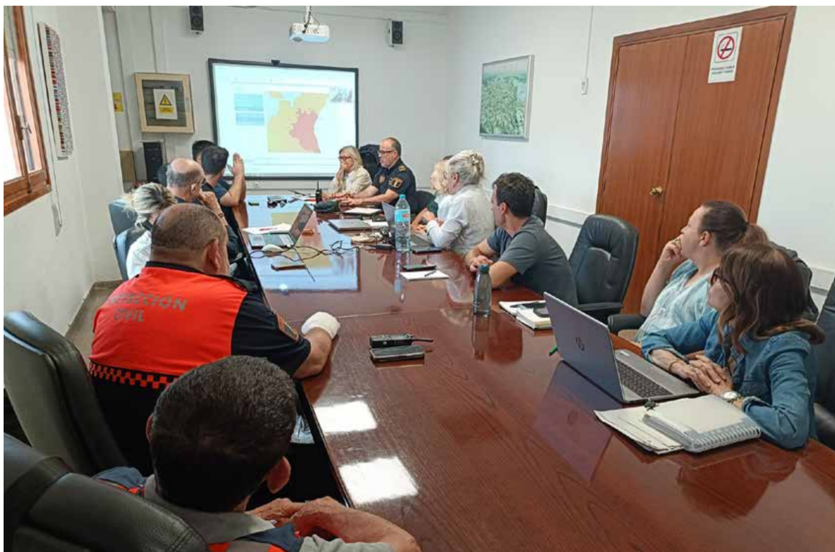
Centre de Coordinació Operativa Municipal (CECOPAL) a l'Ajuntament de Bétera.