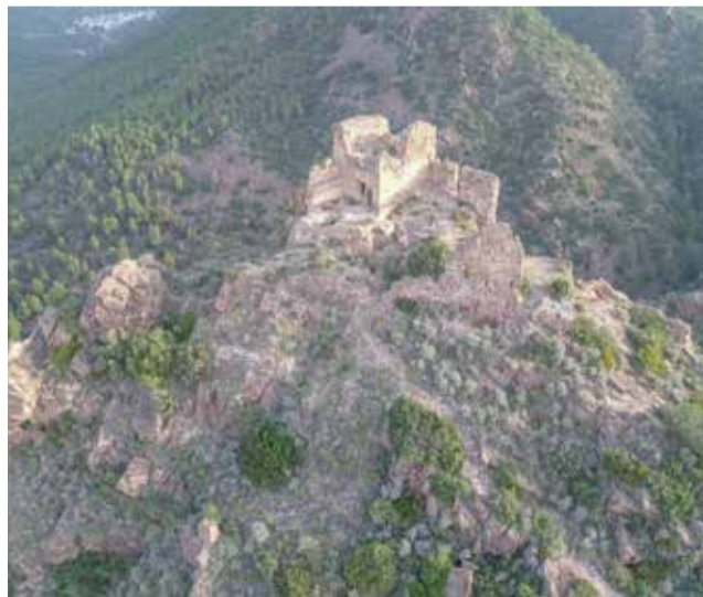
Castillo del Real de Marines.

Esta intervención se enmarca en la estrategia municipal de protección, conservación y puesta en valor del patrimonio histórico, y