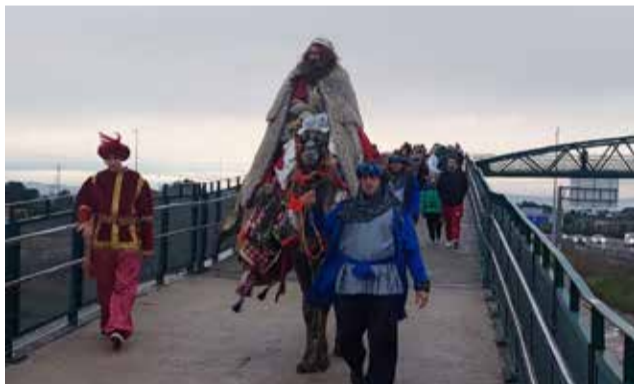
Diferentes instantes de la cabalgata de los Reyes Magos en San Antonio de Benagéber.

La Gran Cabalgata de Reyes Magos se celebró el pasado 5 de enero en San Antonio de Benagéber con un desfile como nunca antes, convirtiéndose en una de las noches más especiales y emotivas del año para el municipio. Espectáculo, sorpresas, animación y tradición se unieron en una cabalgata que hizo vibrar a personas de todas las edades a lo largo del recorrido.