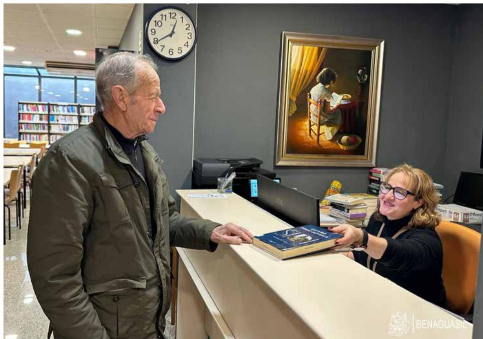
Servicio de préstamo de libros de la biblioteca de Benaguasil.

Durante 2025, el fondo bibliográfico se amplió con la incorporación de 274 nuevos títulos, reforzando así la oferta cultural de la Biblioteca. En la actualidad, el número de socios