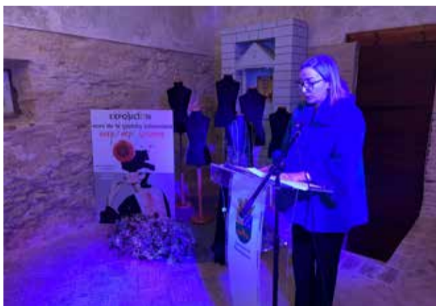
Inauguració de l'exposició al Castell de Benissanó

combina tècnica, detall i expressió artística, convidant el visitant a contemplar la moda com una disciplina que dialoga amb altres formes de patrimoni cultural.