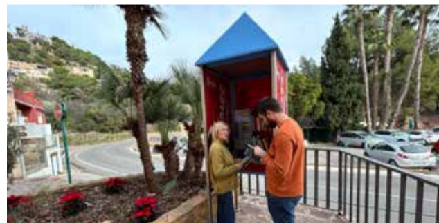
L'alcaldeessa i el regidor de Cultura en la cabina.