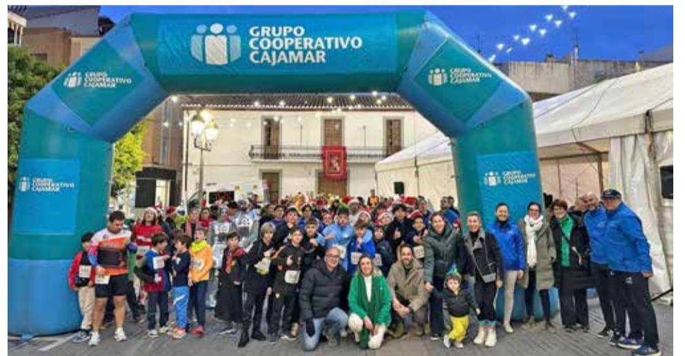
Carrera San Silvestre en Benaguasil.