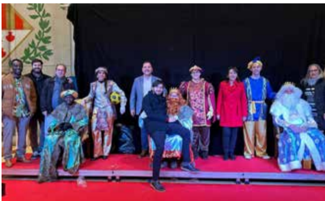
El equipo de gobierno junto a los Reyes Magos.