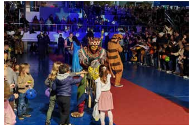
Pavelló de Vilamarxant la vesprada de Reis.

Tot va començar a les 17.30 hores, amb la trobada entre els Reis Mags i la infància amb necessitats especials del municipi, que van il·luminar la seua mirada amb l'estima dels tres màxims representants de la màgia d'Orient. Una iniciativa inclusiva que