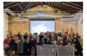
Videofòrum. / EPDA