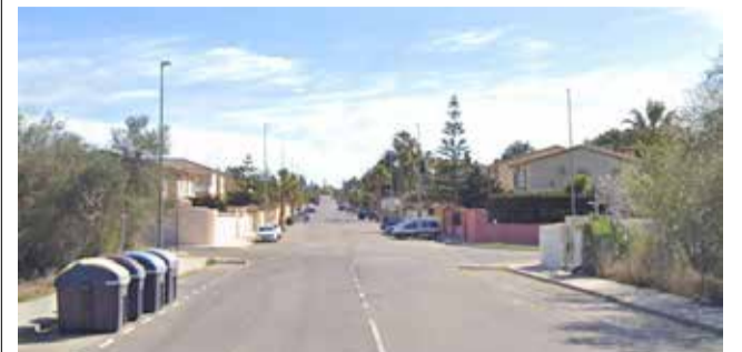
Calle Estornell en la urbanización Colinas.