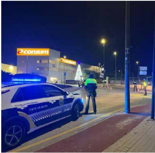
Control policial en San Antonio de Benagéber.

En el marco de esta campaña, y gracias al aviso de varios vecinos, los agentes lograron evitar un robo en la zona de Cumbres de San Antonio. La rápida intervención permitió acudir de inmediato al lugar y proceder a la detención de uno de los presuntos autores, que fue puesto a disposición judicial.