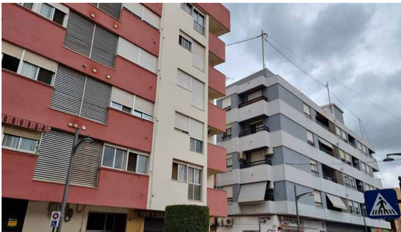
Blocs de vivendes a Riba-roja de Túria.