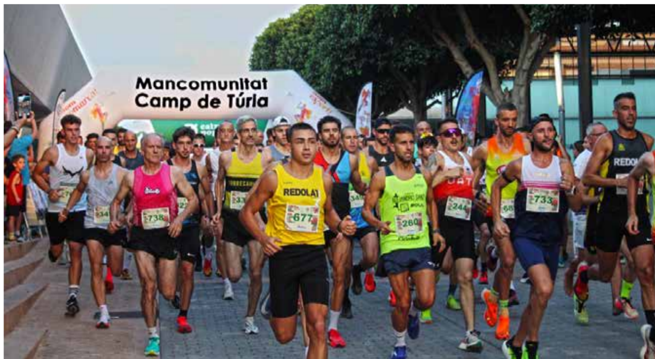
Una carrera del Circuit Camp de Túria-Caixa Popular.

Les xifres "confirmen any rere any que el circuit de carreres populars que organitza la Mancomuni-