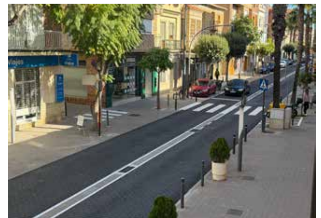
Calle Poeta Llorente de la Pobla de Vallbona.