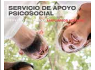
Cartel informativo. / EPDA