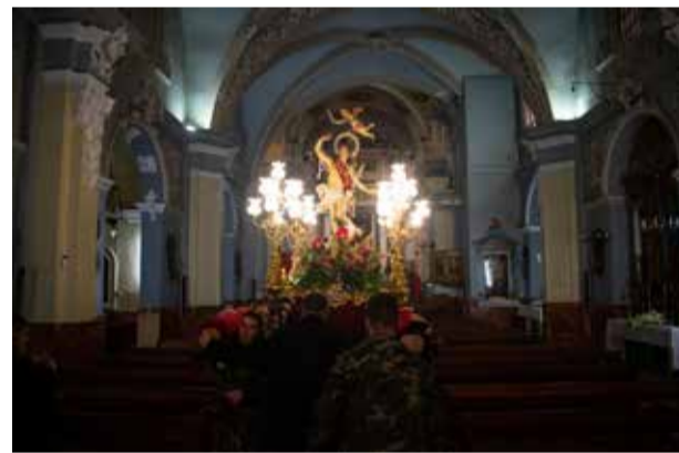
Actos de las fiestas de Sant Sebastià de la Pobla de Vallbona en una edición anterior.

se ha instalado en el Parque Municipal Benjamín March Civera. El sábado 17 tendrá lugar la actuación de la Orquesta FLAMA, mientras que el domingo 18 estará dedicada al público infantil con juegos y actividades para disfrutar de una mañana llena de diversión. Durante la mañana