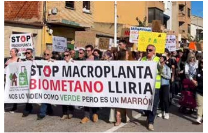
Manifestación del pasado 9 de noviembre.

El Ayuntamiento ha presentado un recurso de revisión a la Conselleria de Medioam-