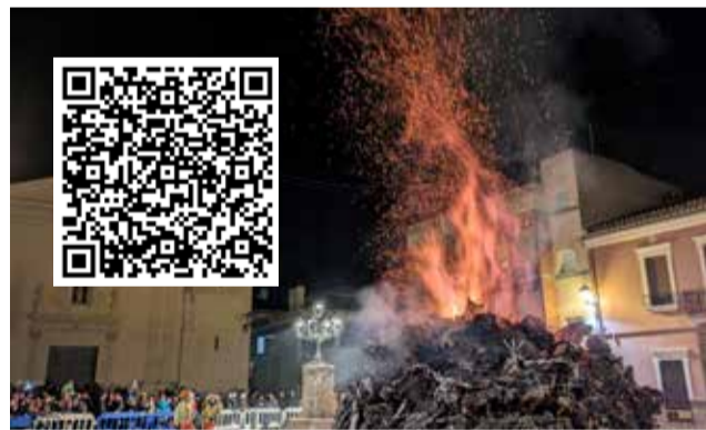
Foguera de Sant Antoni a Olocau.

A la vesprada tindran lloc l'encesa de la Foguera Infan-