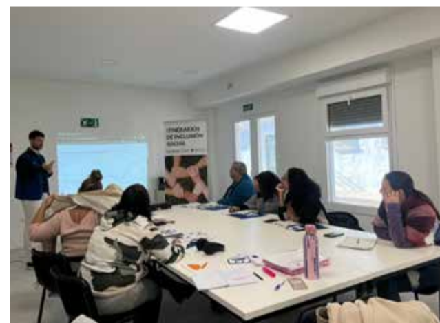
Taller del Programa Itineraris d'Inclusió Social.