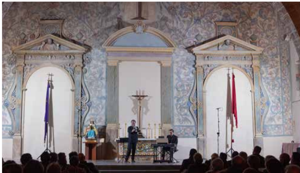
Festival eMe que combina música y patrimonio.

Además, en esta edición, la plaza central del stand de la Comunitat Valenciana, acoge-