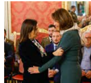
Cervera junto a la ministra.

Este distintivo es el reconocimiento por el trabajo realizado en aquellos días en los que la situación fue máxima complejidad y emergencia: horas de incertidumbre, comunicaciones difíciles, necesidades urgentes y una coordinación contrarreloj para poner en marcha los puestos de mando, canalizar recursos, organizar la logisti-