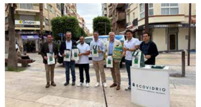
Campaña del 'Reto Mapamundi' en Lliria.

Para el desarrollo del concurso se establecieron tres categorías en función del número de habitantes de cada municipio, con tres ganadores en cada una: para más de 10.000, entre 1.000 y 10.000, y menos de 1.000.