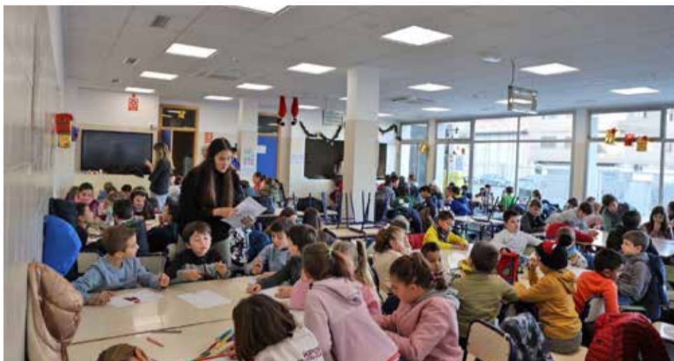
Campus de Navidad de Benaguasil en el CEIP Luis Vives.