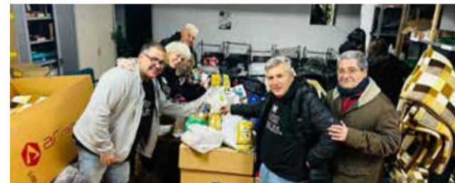
Recogida solidaria de alimentos.