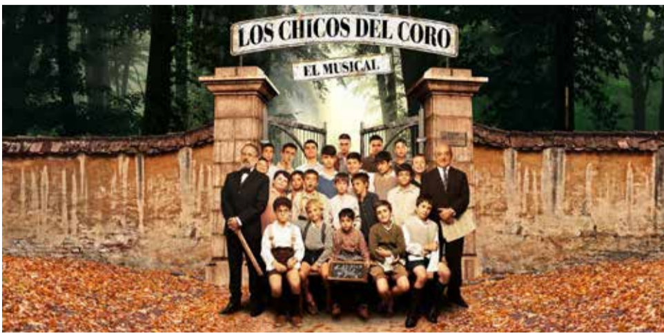
Cartell del musical de 'Los Chicos del Coro'.