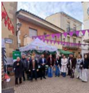
Mercado navideño.

La programación se completó con concursos tradicionales como el de belenes y el