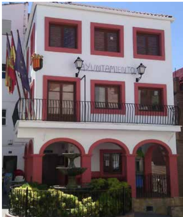
Ayuntamiento de Gátova. / EPDA

"En 2025 partimos de poco más de medio millón de euros