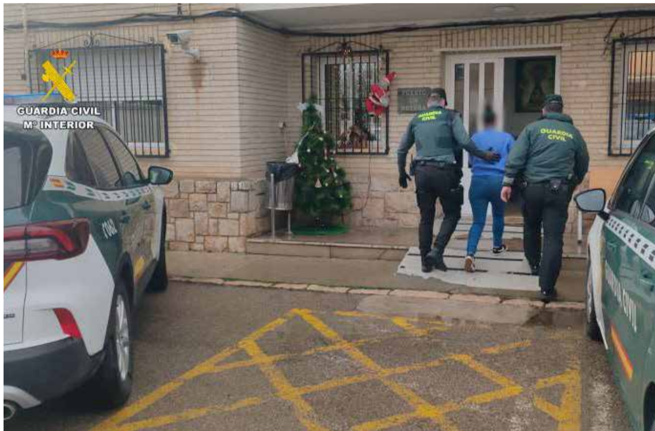
Imatge de la detenció facilitada per la Guàrdia Civil. / GUÀRDIA CIVIL

En un altre dels robatoris comesos en un habitatge d'un complex de Nàquera, l'autor va sotraure un tallagespa sense el cable d'alimentació de càrrega, ja que este es trobava ancorat al sòl. En dates posteriors, els agents van descobrir un