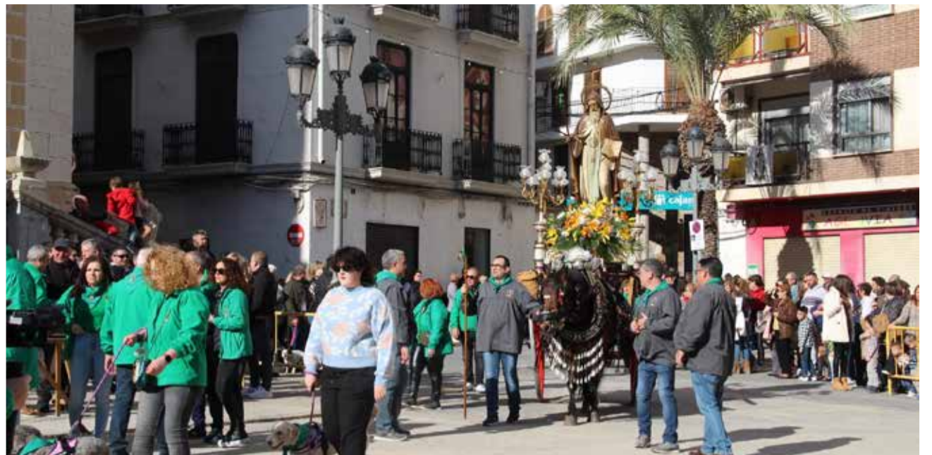
Fiestas de San Antonio Abad en Benaguasil en una edición anterior.

El jueves tuvo lugar el traslado de la imagen del santo hasta la casa del primer clavario, en un recorrido acompañado por el sonido del tabal y la dulzaina, así como por el disparo de cohetes. La programación continuará el viernes 16 de enero con la celebración de la misa en honor a San Antonio Abad