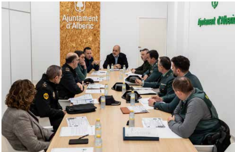
Junta Local de Seguretat d'Alberic.

Tot i la invitació a Iberdrola per a estar present en la Junta, Carratalá lamentava "la no assistència de cap representant