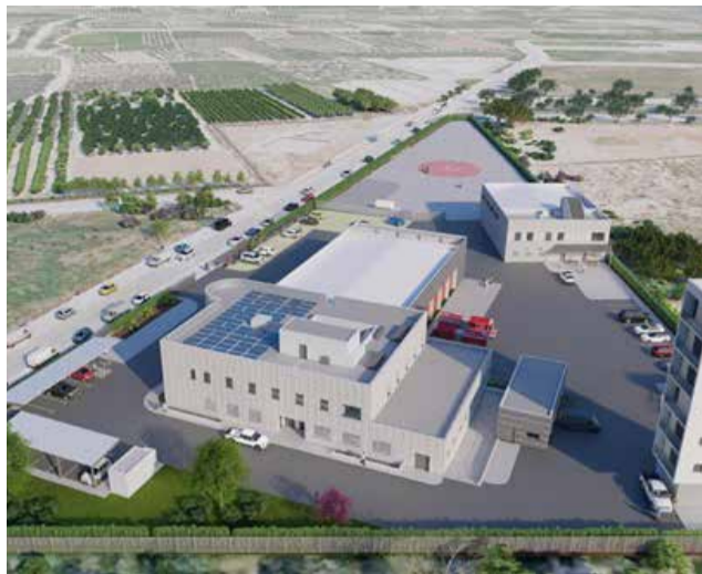
Imatge virtual de les noves instal·lacions a Alzira i un moment durant la reunió.

Amb la cessió dels terrenys per part de l'ajuntament d'Alzira, el nou parc se situarà en el Polígon Industrial El Pla de la capital de la Ribera Alta i tindrà una superfície de quasi 15.000 m 2 ; amb un pressupost de lici-