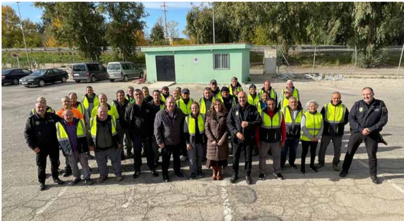
Quasi 100 persones dignifiquen el treball agrícola de la ciutat.

sibles. El treball manual ha sigut fonamental: desbrossament, retirada de residus, recuperació de marges, re-