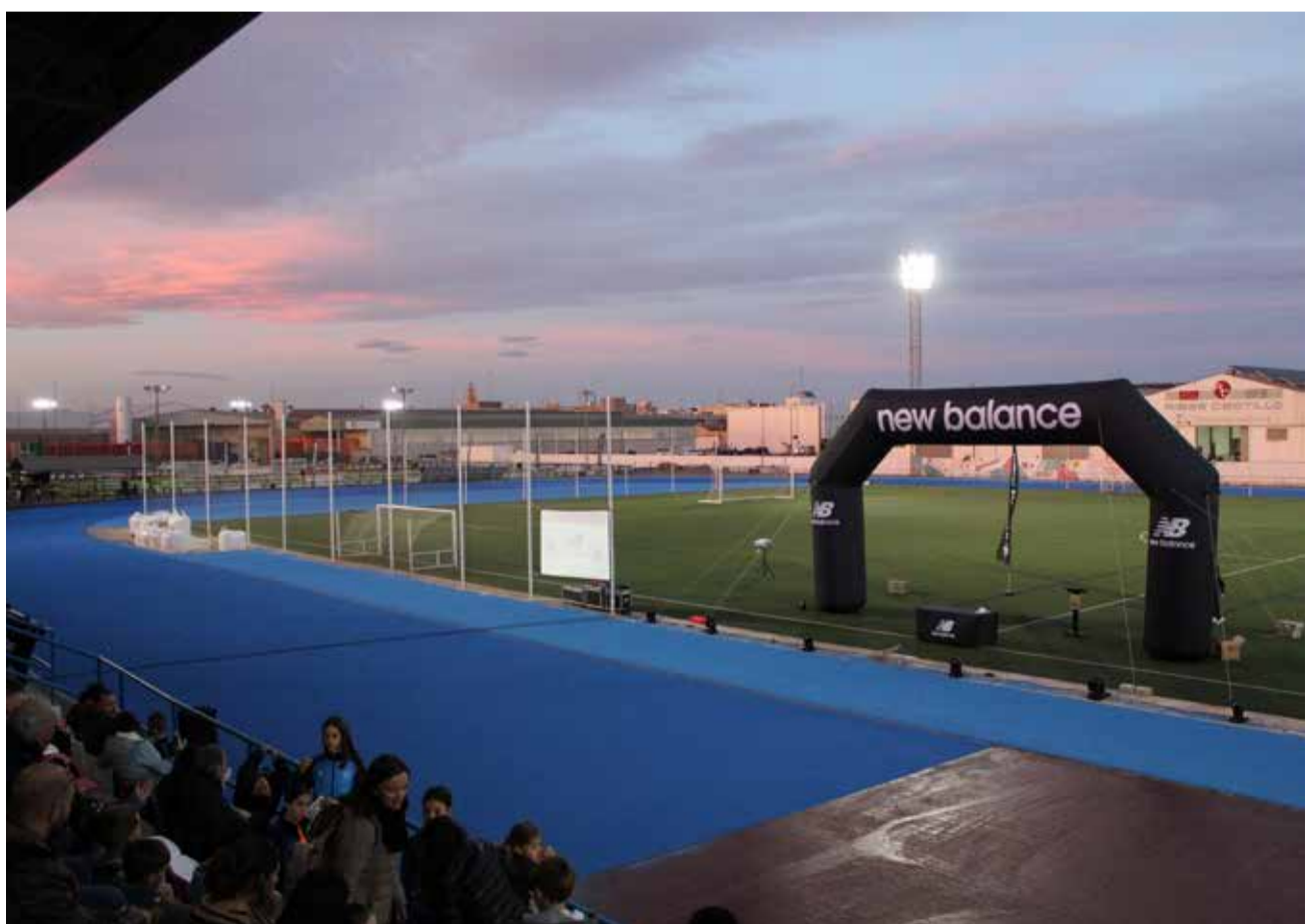
Diferents moments durant la inauguració de la pista d'atletisme de Guadassuar.