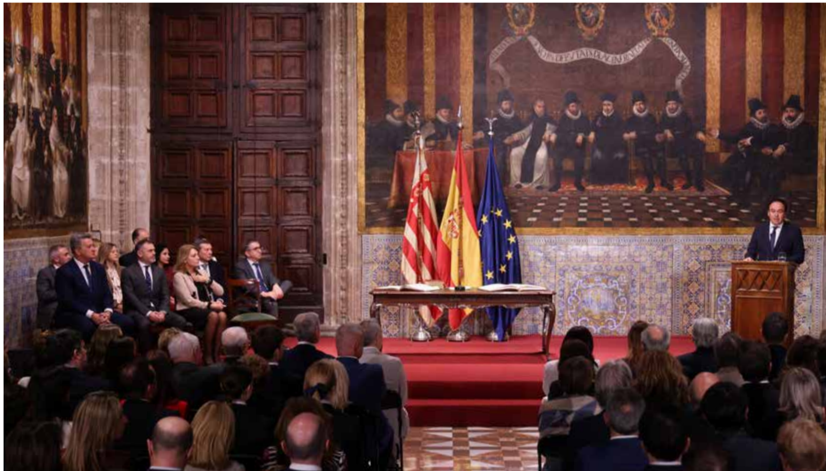
La toma de posesión del nuevo presidente de la Generalitat.