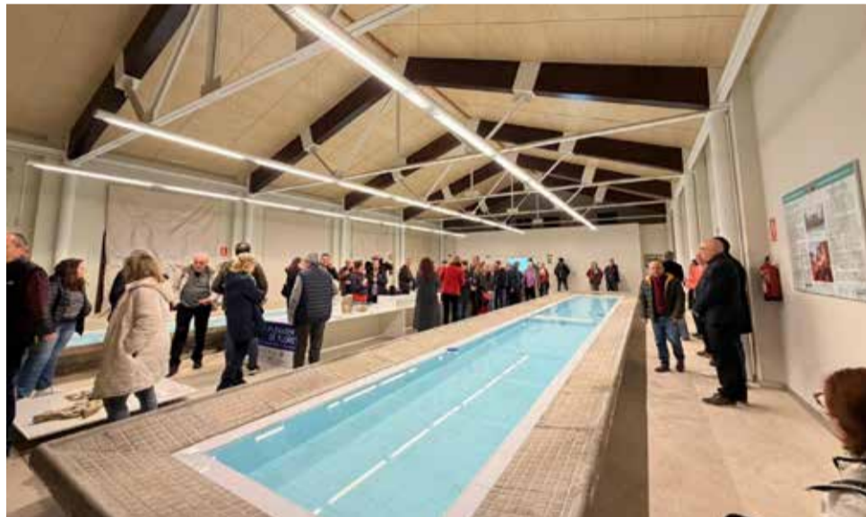
Pie de foto. / EPDA

«El feixisme la plenarà de terror, de sang i de mort, i nosaltres la plenarem de flors.» Amb este potent testimoni, el projecte va presentar una investigació sobre la col·locació de flors a les fosses comunes, tot marcant el record i visibilitzant els llocs afectats per la repressió feixista. Durant la inauguració, es va presentar també el llibre del projecte i una web que va començar a funcionar com a repositori amb documentació, materials audiovisuals i recursos que amplien la investigació.