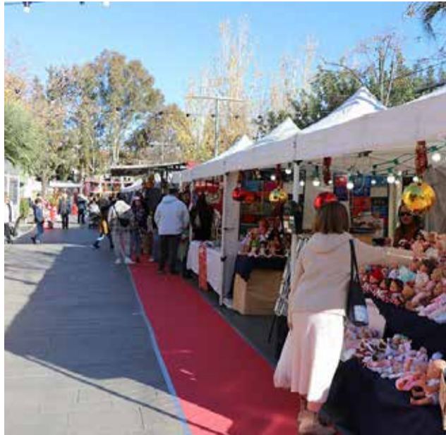
El mercado navideño de Sagunt.