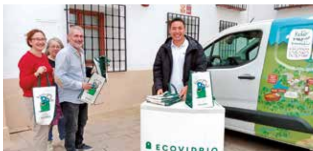
'Reto Mapamundi' en Utiel.

Los ganadores serán aquellos que mayor puntuación obtengan atendiendo a varios criterios como son el in-