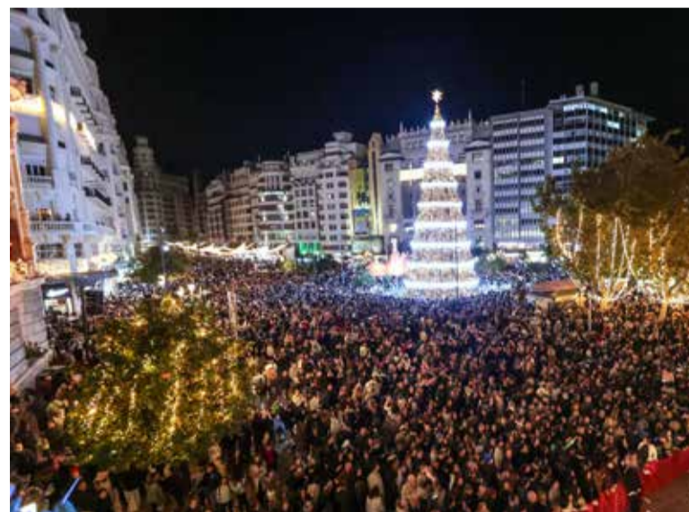
Encendido de luces en la Plaza del Ayuntamiento.