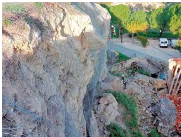
Derrumbe en el talud del Cerro.

La intervención, impulsada desde el área de Medio Ambiente de la institución provincial, responde a la solicitud remitida por el Ayuntamiento, cuyos servicios técnicos alertaron de la existencia de bloques inestables y de un riesgo real para el vecindario. Ante esta situación, la Diputación activó los trabajos para garantizar la estabilidad del