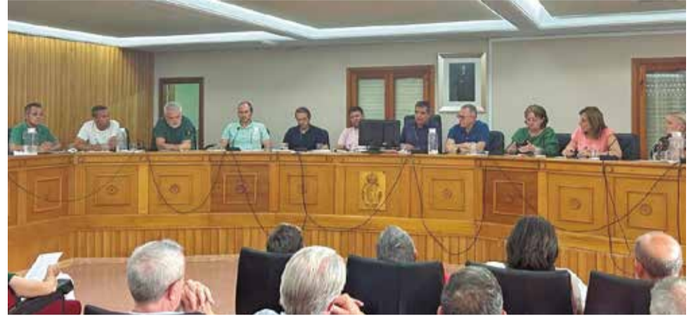
Un momento durante uno de los plenos del Ayuntamiento de Chiva.

► El problema es que en Chiva no podemos ensanchar, no podemos hacer ningún plan sur porque estamos encajados entre montañas y es un problema. La confederación está haciendo cálculos y bastantes proyectos, se han hecho muros de contención, muros de escollera con unos pilotes de 8 a 10 metros bajo tierra, con unas zapatas de hormigón importantes. También se ha quitado la "montaña" que había en la calle San Isidro, se ha quitado la roca y se ha dejado el recto, se están haciendo balsas de laminación, lagunas de contención. Hay más cuestiones, pero estamos delimitados por las calles y viviendas. Muchos cálculos por hacer, pero sí que es verdad que ahora hay unos muros que antes no había y con ellos se puede contener bastante la fuerza del agua.