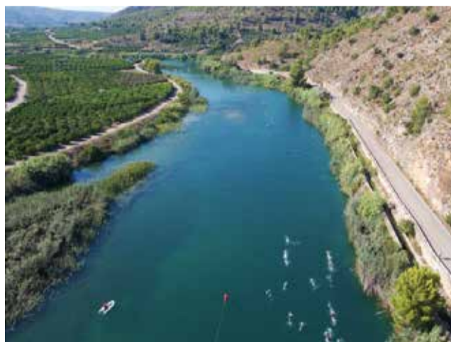
Camí que connecta Antella amb Sumacàrcer.