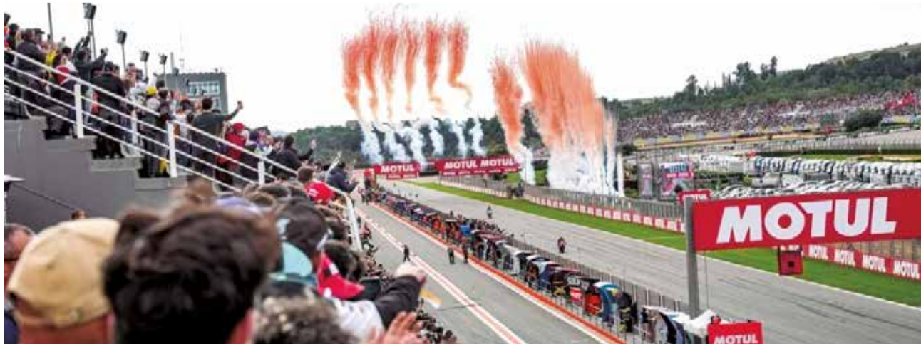
Diferentes momentos durante el Gran Premio y durante la gala de premios.