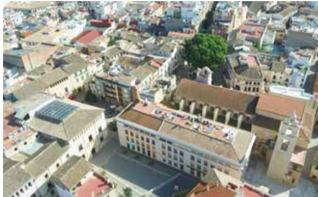
Vista d'Alzira.

el moment de la concessió de la llicència. No obstant això, una modificació aprovada en 2019 va elevar l'altura mínima entre forjats a 3 metres, fet que deixava estes estructures en una situació que impedia continuar les obres per no complir esta condició. La nova disposició transitòria aprovada pel ple permetrà acabar-ne la construcció, sempre que es complisca el Codi Tècnic de l'Edificació i es mantinga la validesa de