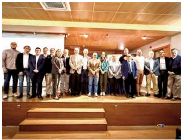
Diferentes momentos durante la jornada organizada por la JCUMARU.

Representantes del Ministerio para la Transición Ecológica y Reto Demográfico; la Conselleria de Agricultura, Agua, Ganadería y Pesca; la Confederación Hidrográfica del Júcar; el Ayuntamiento de Utiel y diversas juntas centrales de usuarios y comunidades de regantes debatieron el pasado 17 de noviembre en Utiel sobre los retos de la gestión del agua, en la jornada celebrada en el salón de actos de la Casa de la