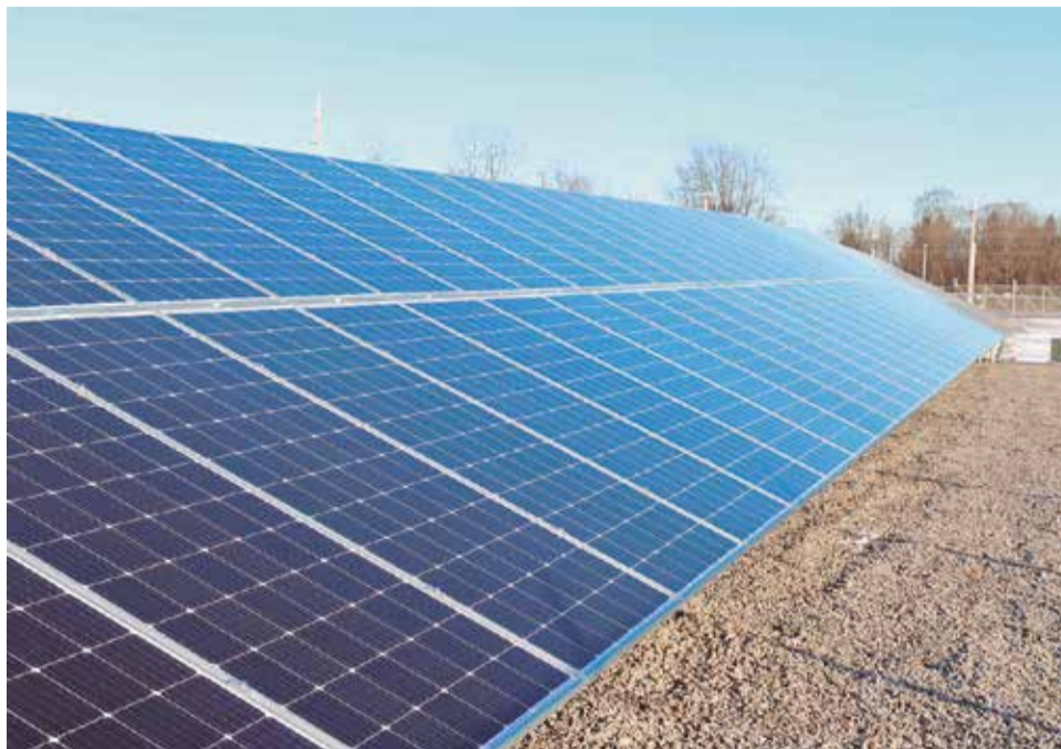
Foto archivo de una planta fotovoltaica.

Naturalista de Ayora y la Valle (ANAV) contra el Plan Especial de Ordenación de Instalaciones Fotovoltaicas de estos municipios –situados en la comarca del Valle de Ayora– y contra la Declaración Ambiental y Territorial Estratégica que lo acompaña. El procedimiento se inició en 2021 y es el instrumento urbanístico que permite ordenar de forma conjunta