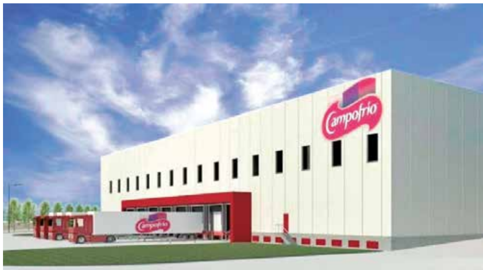
Prototipo de la fábrica de Campofrío de Utiel.

Estas ayudas se conceden de forma directa atendiendo al carácter excepcional que