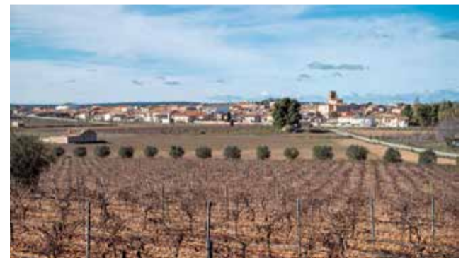
Vista panorámica de Camporrobles.

Esta actuación es posible gracias a la subvención de 4.000 euros concedida por el Área de Turismo de la Diputación de Valencia, una ayuda que impulsa la diversificación de recursos en municipios que, como Camporrobles, trabajan por mostrar al visitante el valor de un territorio que ha sabido conservar su esencia. Gracias a