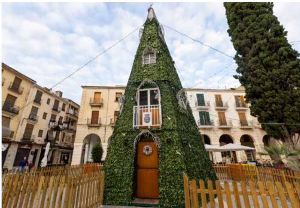
Decoració de Nadal en Gandia.

L'encesa oficial de llums tindrà lloc el dimecres 3 de desembre a les 18:30 hores,