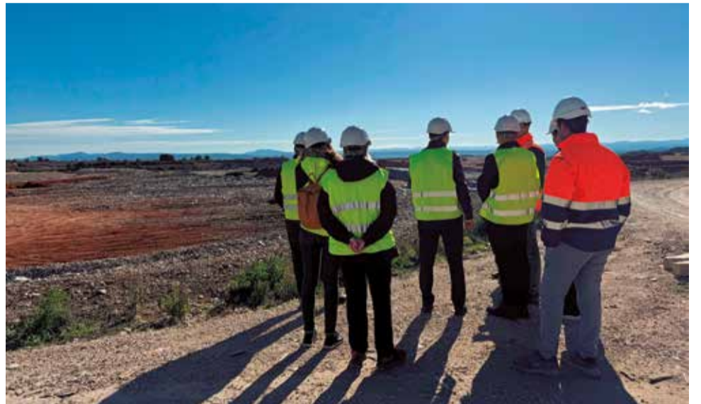
Diferentes momentos durante la visita a la planta de Caudete de las Fuentes.

también se separa la materia orgánica, que posteriormente se traslada a los túneles de compostaje, donde un proceso de fermentación acelerada garantiza la higienización del