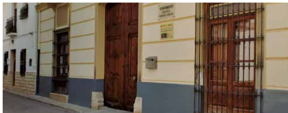
Fachada del Ayuntamiento de Macastre.

Gracias a este respaldo, el consistorio podrá avanzar en la elaboración de una propuesta europea orientada a poner en valor el papel de las mujeres en la cultura rural, impulsar la igualdad y abrir nue-