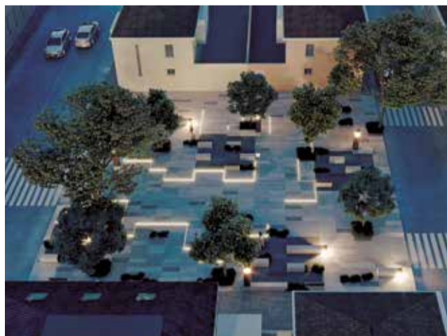
Proyecto de peatonalización de la plaza.

La actuación se desarrollará sobre el ámbito formado por las calles Rioja, Honrubia y Vendimia, un entorno actualmente abierto al tráfico rodado. Con este proyecto, el Consistorio pretende convertir la zona en un espacio plenamente peatonal, reforzando la seguridad y la convivencia, especialmente en un área muy frecuentada por familias debido a su proximidad al CEIP Higuierillas. La peatonalización busca priorizar los desplazamientos a