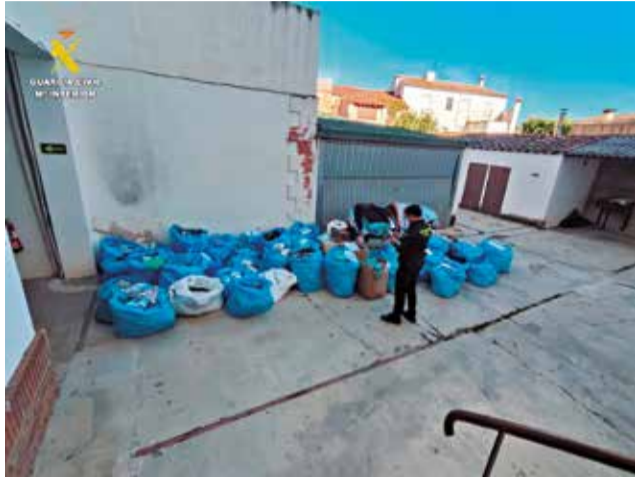
Las más de 1.000 prendas falsificadas.

Los agentes realizaban un punto de verificación de vehículos y personas en una estación de servicio de la A-3 a su paso por Venta del Moro y observaron a una persona que portaba en su vehículo una gran cantidad de prendas de ropa. Al realizar una serie de comprobaciones, verificaron que las prendas eran falsificadas y procedieron a inventariar todo el