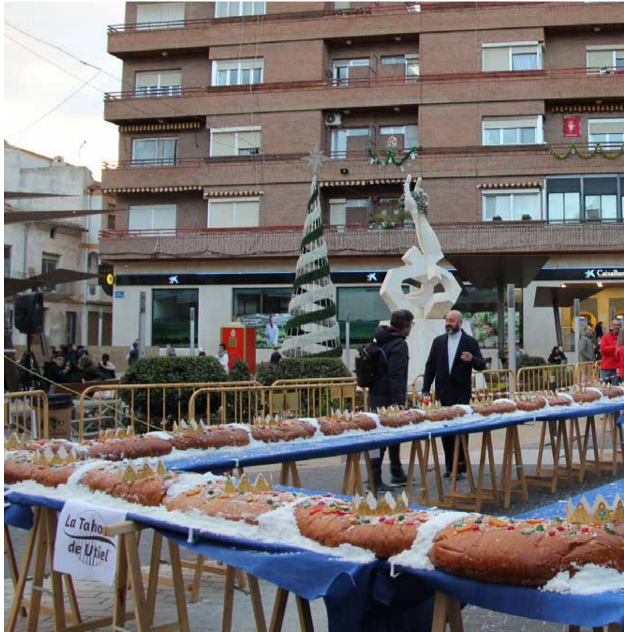
El Roscón de Reyes gigante de Utiel, en una foto de archivo de 2024.

La Navidad llegará oficialmente a Torrent, en l'Horta Sud, el viernes 28 de noviembre con la tradicional inauguración del encendido de la iluminación navideña en la Plaça Bisbe Benlloch, junto al emblemático ficus. El Ayuntamiento ha preparado un evento muy especial, diseñado para que niños, familias y vecinos disfruten del arranque de estas fiestas con música,