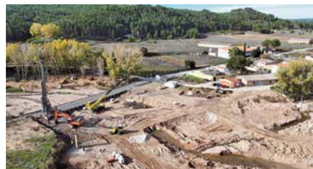
El nuevo puente de Hortunas de Requena.

marcha la redacción de la memoria técnica para acometer mejoras en la calle Rambla y en las vías perpendiculares. Esta intervención se enmarca en el plan de actuaciones financiado con los 35 millones de euros otorgados por el Gobierno de España