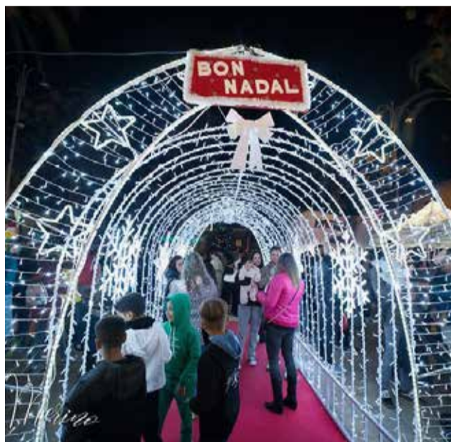
La magia de la Navidad en La Pobla de Farnals.