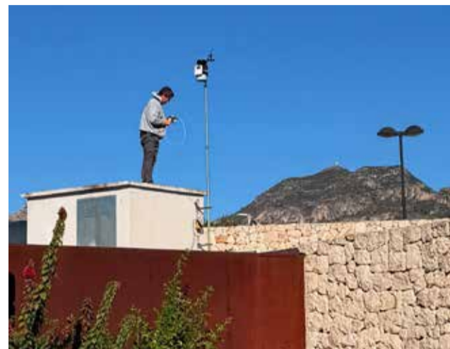
Estació meteorològica d'AVAMET.

Així, Gandia ja compta actualment amb set estacions meteorològiques d'AVAMET: a l'Ajuntament; Camí de la mar; Escola Pia; Grau sud;