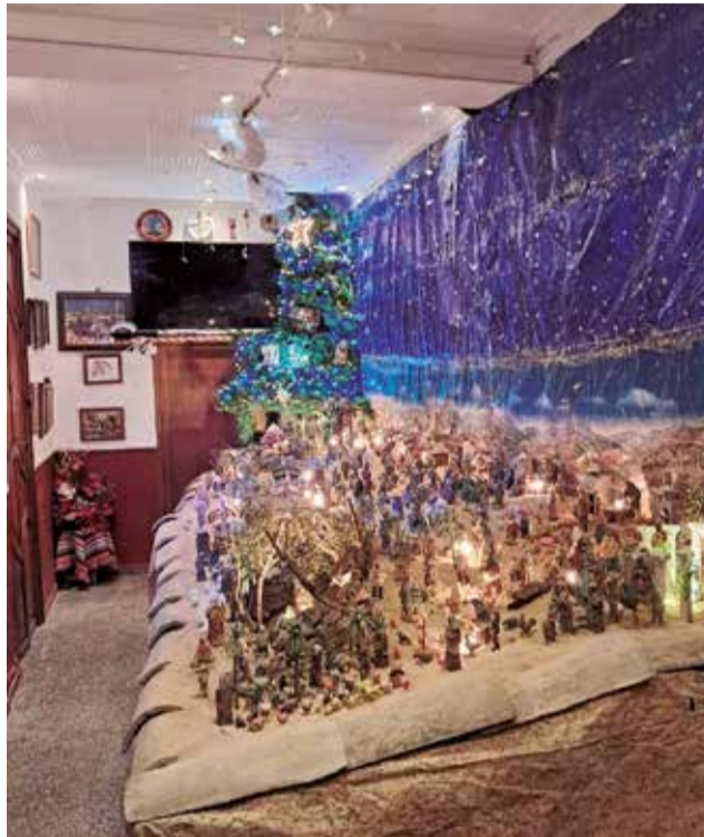
Instantáneas de archivo de la Navidad de 2024 en Godelleta.

El lunes 15 de diciembre se realizará un recorrido por el