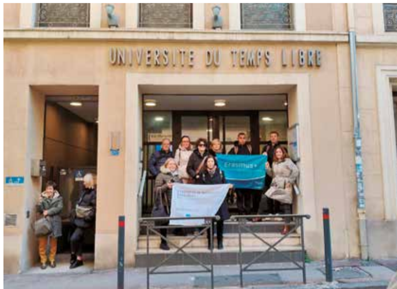
La EOI de Utiel impulsa su proyección europea con nuevas movi- lidades Erasmus+ para profesorado y alumnado.

Además, cuatro estudiantes de francés de la EOI de Utiel han disfrutado de una movilidad de una semana en la Université du Temps Libre de Marsella, junto a alumnado de la EOI de Llíria. La actividad incluyó asistencia a clases y conferencias, así como visitas guiadas por la ciudad