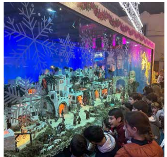
Visitas al belén en Riba-roja del Túria.