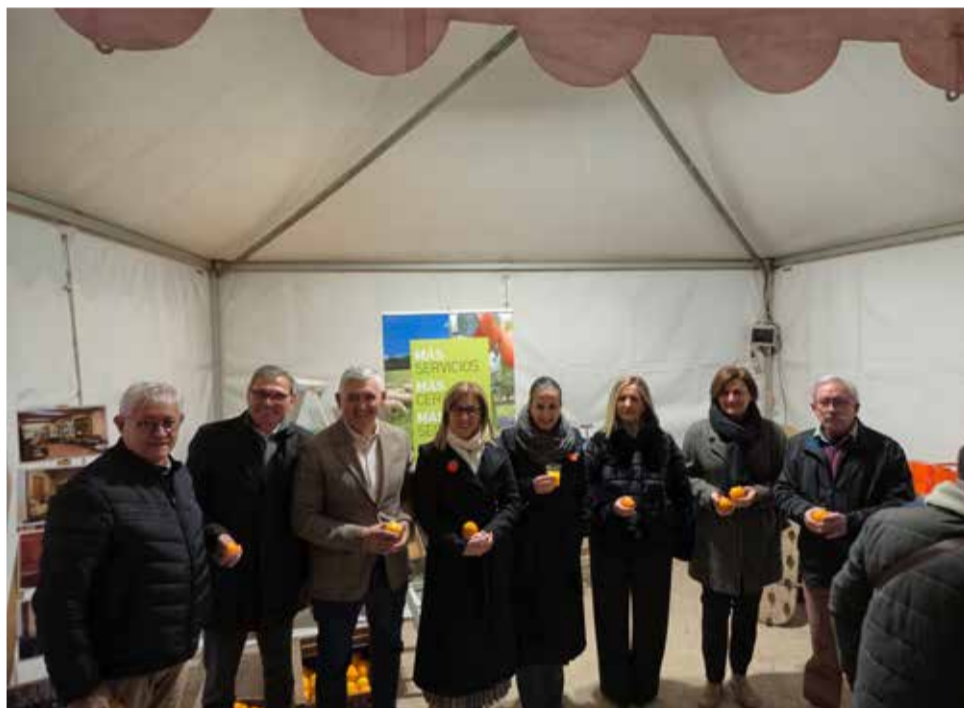
Diferents moments durant la III Mostra de la Taronja de Carcaixent.

de Ribera. També es van projectar documentals com Les que corren i De terra endins a la carpa audiovisual. A més, es va poder gaudir de l'exposició de fotografies que recopila tots els oficis del camp.