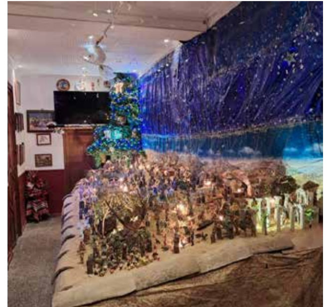
Godolleta expone su belén municipal.