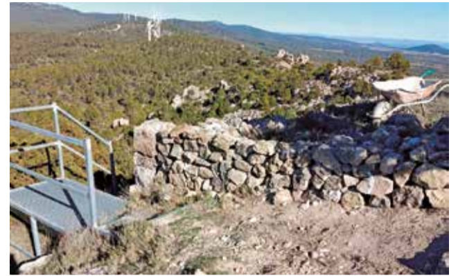
Vista aérea de El Molón.

El Molón es un referente nacional para el estudio de la cultura ibera. Su singularidad defensiva, el nivel de conservación de sus estructuras y la riqueza de los hallazgos lo sitúan entre los yacimientos más importantes para comprender la organización social, económica y militar de los iberos en la península. Cada intervención contribuye en consecuencia a ampliar el conocimiento y a reforzar su valor dentro del mapa arqueológico estatal.