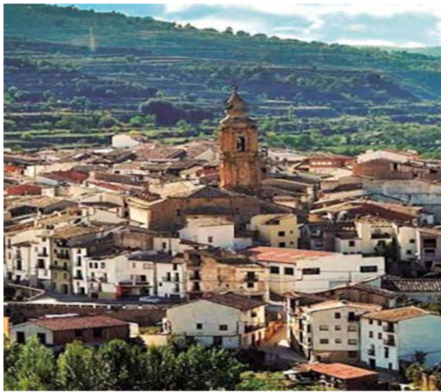
Vista aèria del municipi de Forcall.

Per a poder optar a esta prescripció, les persones sol·licitants hauran de presentar la documentació requerida, que inclou la sol·licitud oficial (Annex I), fotocòpia del DNI o NIE tant del sol·licitant com de la seua parella, el certificat de naixement del menor, així com els volants actualitzats d'empadronament