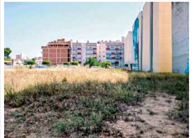
Habitatges públics a Benicarló.