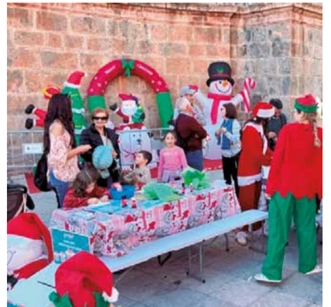
Actividades navideñas infantiles en la Vall d'Uixó.

con campañas específicas, ferias y actividades en la calle que invitan a vecinos y visitantes a participar del ambiente navideño y a realizar sus compras en los establecimientos de proximidad.