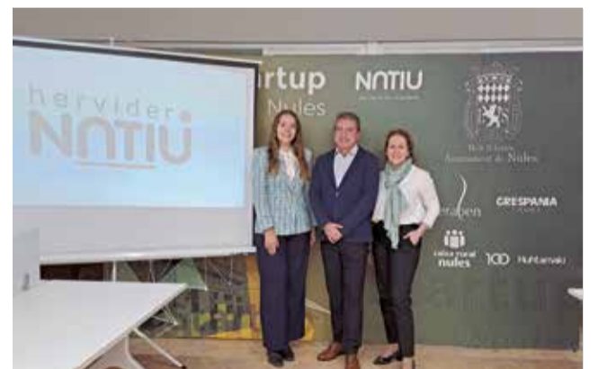
Presentació del pla estratègic per a empreses.

Entre les noves accions que es portaran a terme, emmarcades en este pla