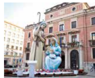
Imatge del pesebre.