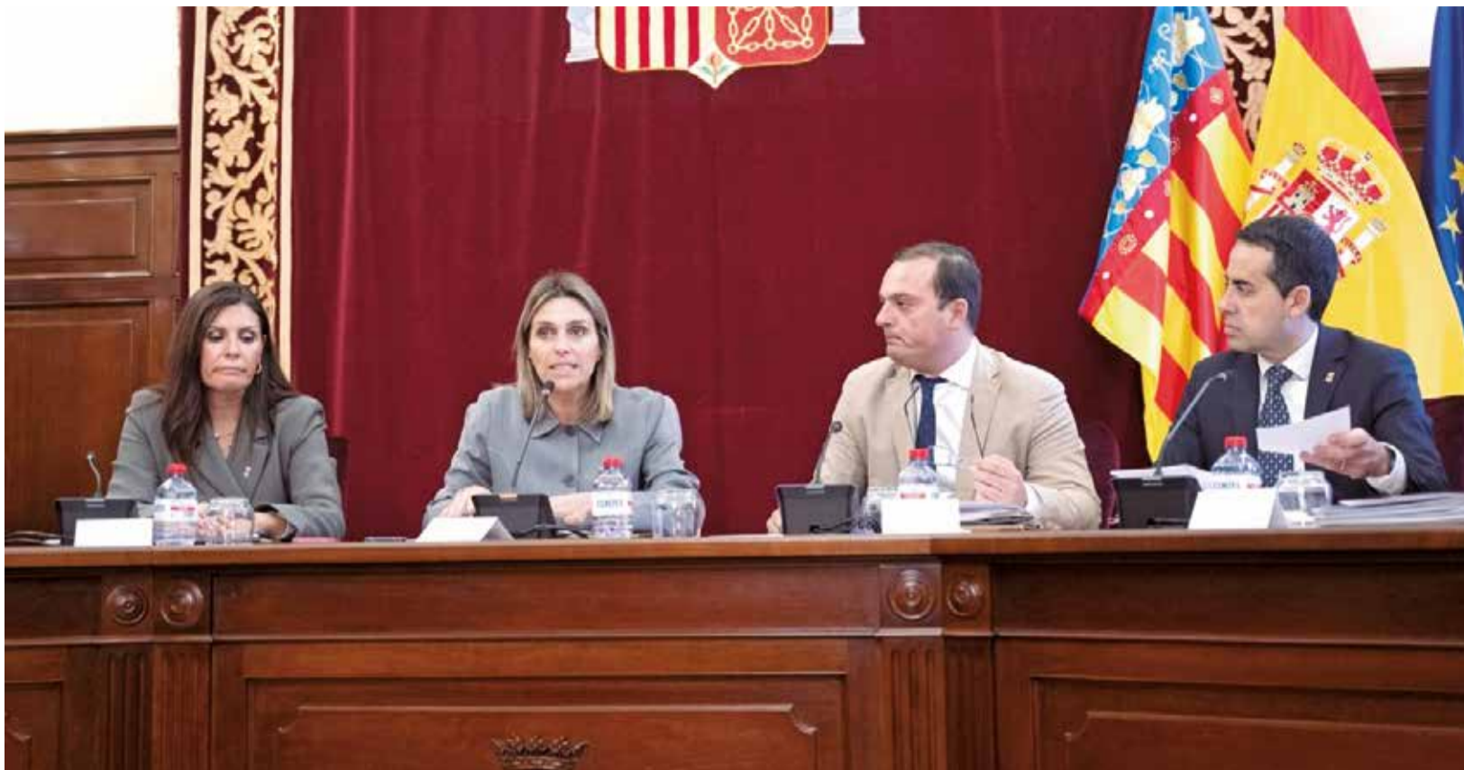
Marta Barrachina, presidenta de la Diputació de Castelló, amb els vicepresidents en un ple.

■ ELS COMPTES PER AL PRÒXIM EXERCICI SUPEREN ELS 216 MILIONS D'EUROS AMB UNA FORTA APOSTA PEL MUNICIPALISME