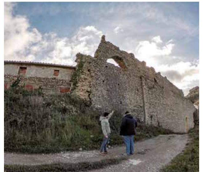
Imatge del aqüeducte de Morella.

Entre els mesos de setembre de 2024 i febrer de 2025 es va actuar en el tram més pròxim al poble. Va ser llavors la brigada d'obres del Centre Integrat de Serveis Econòmics (CISE) qui va dur a terme l'actuació amb un cost total de 38.915,64 euros finançats amb ajudes de presidència de la Generalitat Valenciana per a béns immobles i un reforç en temps per part del consistori.