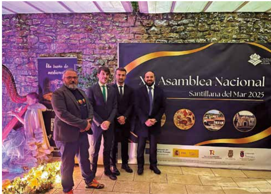
Los representantes de Vilafamés, Culla, Morella y el Castell de Guadalest.

Con esta iniciativa, Vilafamés y el resto de los municipios valencianos esperan reforzar su presencia dentro de la asociación, atraer más visitantes y consolidar su papel como referentes del turismo cultural y patrimonial en la Comunitat Valenciana, poniendo en valor su historia, cultura y riqueza arquitectónica.