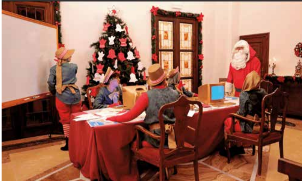
Imagen del vídeo de Papá Noel y sus elfos intentando llegar a Benicàssim.

La pieza audiovisual, difundida este jueves 19 de diciembre a través del canal oficial de YouTube y de las redes sociales del Ayuntamiento de Benicàssim, funciona como un creativo adelanto de lo que está por venir. En el vídeo, Papá Noel y sus elfos debaten distintas formas de llegar a la ciudad, un relato cuyo desenlace se desvelará es-