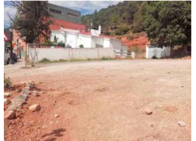
Solar del Centro de Día de Montanejos.

El Ayuntamiento de Montanejos también ha reivindicado que se reponga la ayuda para construir viviendas