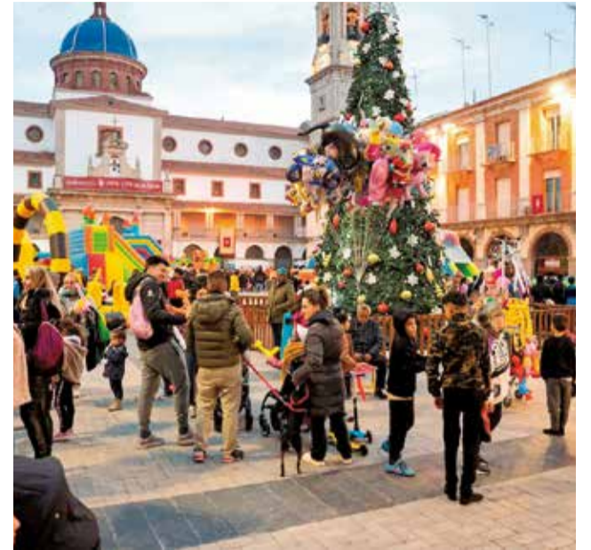
Feria navideña de Nules.