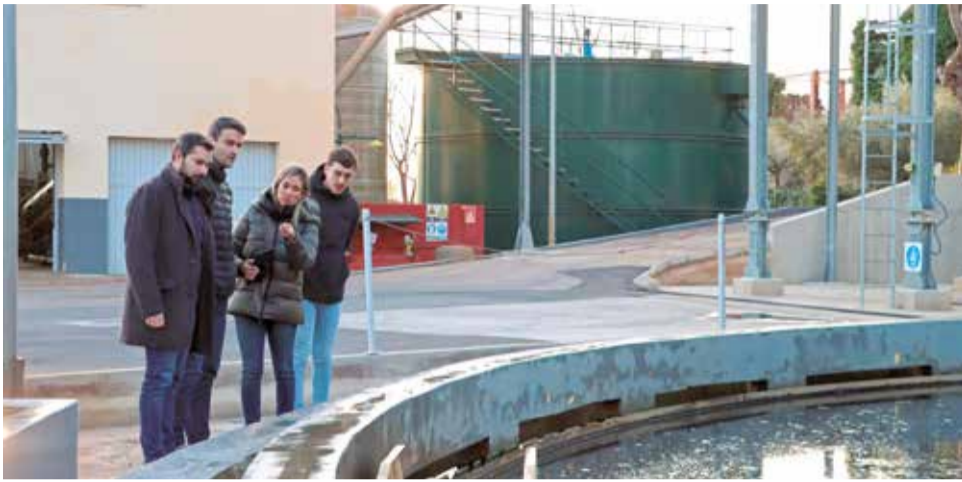
Imatge de la visita a la depuradora.