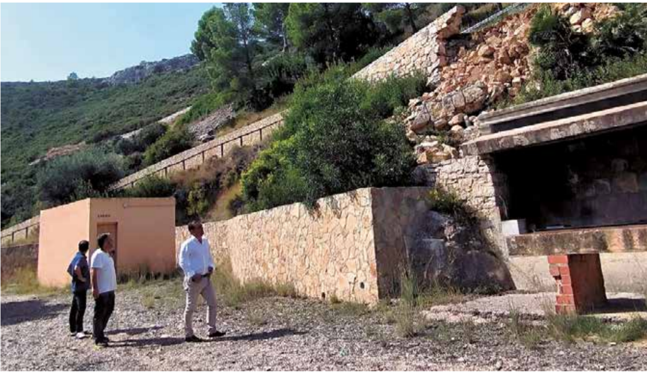
Visita a l'Ermite de Sant Antoni per a conèixer els trams afectats després de les pluges.