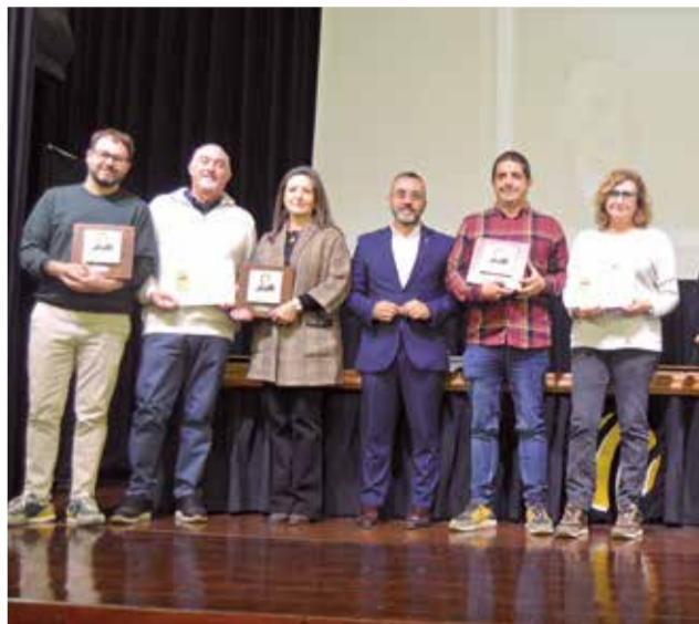
Premiats en el Segell d'Excel·lència.

rrompudament des de 2011. El reconeixement, creat amb la col·laboració de la Càtedra d'Innovació Ceràmica Ciutat de Vila-real, té com a objectiu fomentar les vocacions científiques, reconèixer l'esforç de l'alumnat i profes-