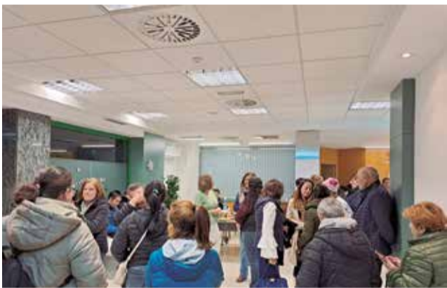
Instal·lacions del centre de la Unitat de Respir.

El consistori ha adquirit un local a la Plaça Major per a traslladar la seua Unitat de Respir Municipal, per a albergar tant a les de persones majors que participen en el Servei de Promoció de l'Autonomia Personal, com a les persones amb diversitat funcional usuàries del Programa Conviu.