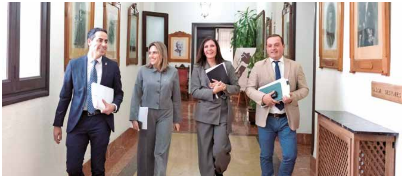
La presidenta de la Diputació, Marta Barrachina, amb els vicepresidents.