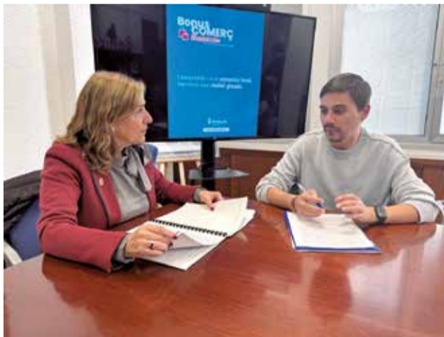
Presentación de los bonos de comercio local.

La campaña cuenta con una inversión municipal de 24.000 euros y permite a la ciudadanía adquirir bonos de 20, 50 y 100 euros, de los que el consistorio asume el 50 % del importe. Los bonos pueden comprarse a través de la web www.bonosbenicassim.es y cada persona empadronada en Benicàssim puede adquirir un máximo de 100 euros en bonos por DNI.