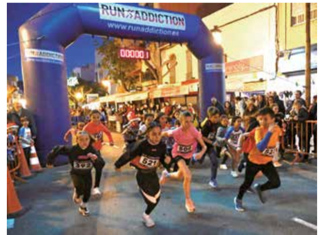
La San Silvestre en su última edición.

La carrera absoluta presenta un recorrido de cuatro kilómetros, con salida y meta situadas en la calle Santo Tomás, frente a la iglesia. La salida tiene lugar a las 19.30 horas y los participantes disponen de un tiempo máximo de una hora para completar el circuito, que finaliza a las 20.30 horas.