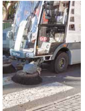
Nou servei de neteja.

Per altra banda, este nou servei de neteja disposa de control de rutes per a comprovar les zones que es nete-