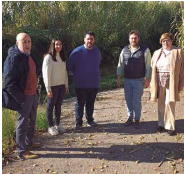
Visita al Barranc El Torrent en Nules.

Més de vint anys porta la població de Nules esperant les actuacions pendents per a evitar inundacions al seu terme municipal, principalment a la zona marítima, de manera que després de molts anys de reivindicacions davant la Confederació Hidrogràfica del Xúquer (CHX) per-