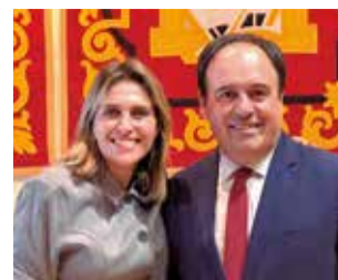
El president de GVA.