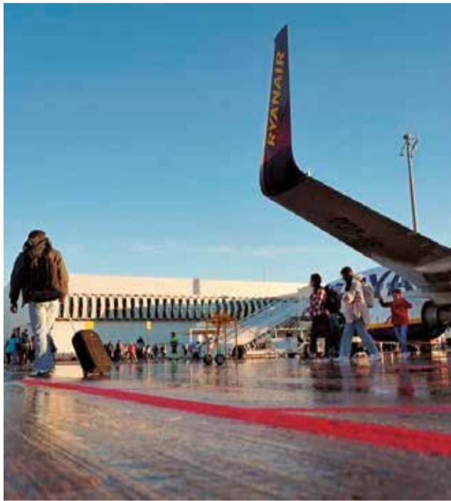
Aeropuerto de Castellón

Solo en el mes de noviembre, el aeropuerto ha registrado 13.369 pasajeros, lo que supone un incremento del 10 % respecto al mismo mes de 2024. En el conjunto del año, el aumento acumulado alcanza el 16 % en com-