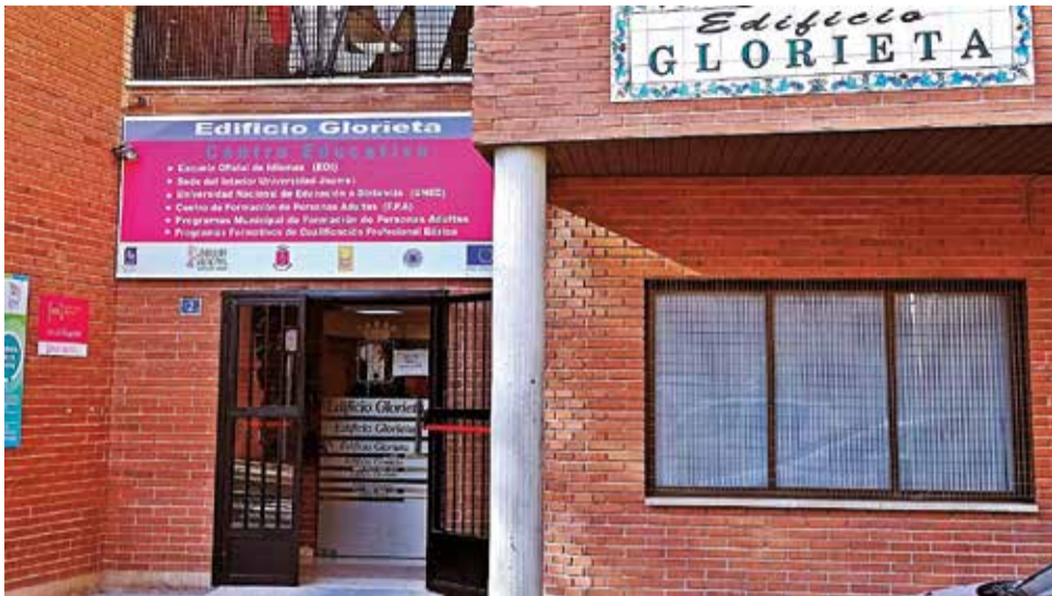
Edificio Glorieta de Segorbe donde se instalará un nuevo centro.