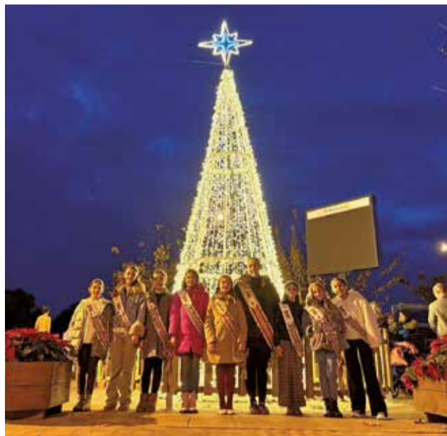
Árbol de Navidad de Benicàssim.