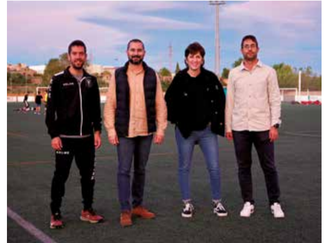
Camp de futbol de l'Alcora.

En 2024 es va donar un altre important avanç amb l'arrancada del pla integral