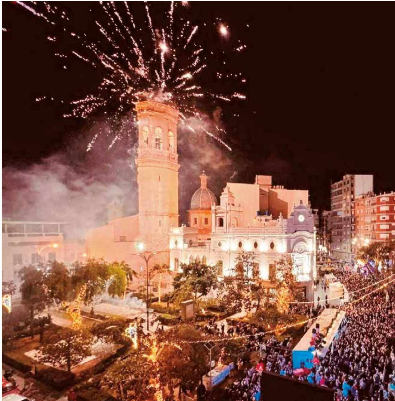
Los vecinos de Burriana disfrutaron del encendido de luces y adornos navideños en la capital de la Plana Baixa

En Oropesa del Mar, la Navidad se vive con una programación pensada para mantener la actividad social y cultural también fuera de la temporada alta turística. El municipio apuesta por una decoración luminosa repartida entre el casco urbano y la zona costera, con el encendido oficial de las luces como uno de los primeros actos del calendario festivo. A partir de ahí, la agenda navideña se completa con mercadillos puntuales, talleres infantiles, actividades culturales y propuestas familiares que buscan implicar