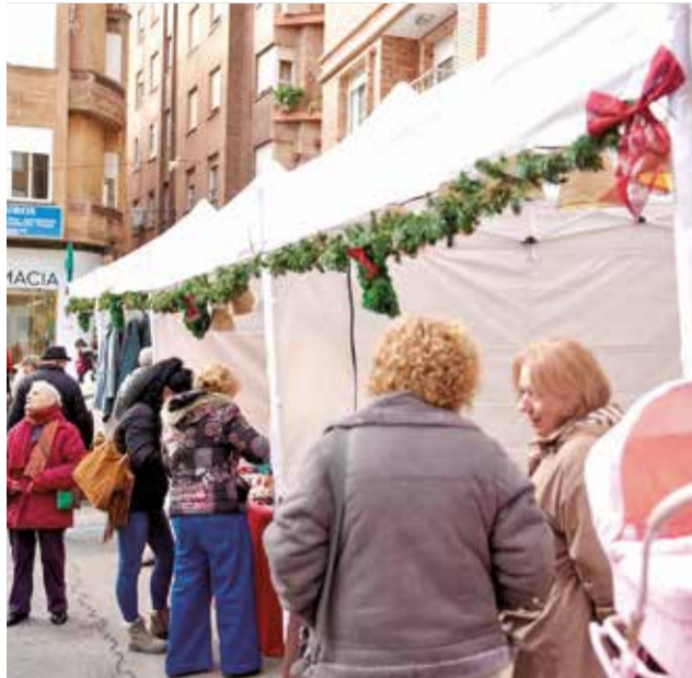
El mercado navideño de L'Alcora.