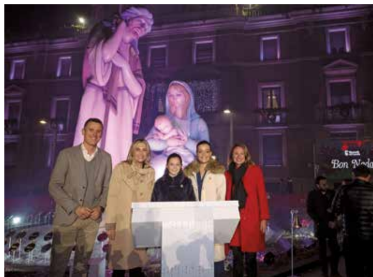
El belén gigante de la Diputación de Castellón.

tanto a los vecinos como a quienes visitan la localidad durante las fiestas.