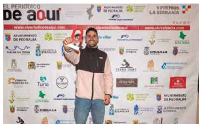
Varios instantes durante el photocall de los V Premios de El Periódico de Aquí La Serranía.