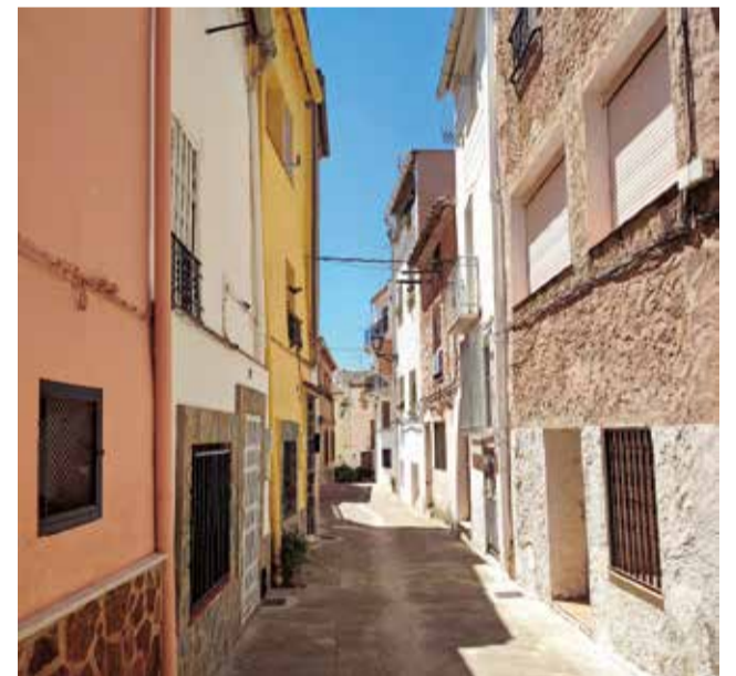
Una calle de Higueruelas.

En las próximas semanas se iniciarán las primeras acciones del proyecto, que incluirán trabajos de diagnóstico, planificación estratégica y acciones de difusión, con el objetivo de sentar las bases de un modelo de desarrollo económico sólido, sostenible y adaptado a la realidad del municipio.