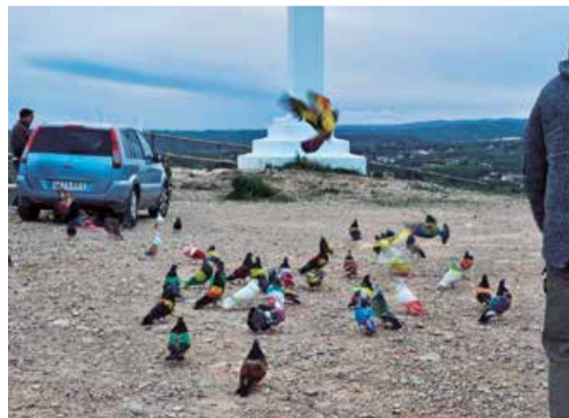
Palomos en 'La Torreta' de Pedralba.

Unas pruebas que se han preparado con mucho trabajo e ilusión, pero que no quedan ausentes de las inclemencias del tiempo por lluvias y vientos. Aún así el ambiente y la participación está siendo positiva.