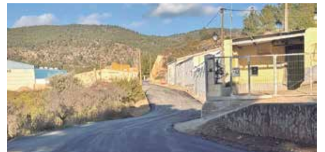
Reasfaltado en un camino de Tuéjar.