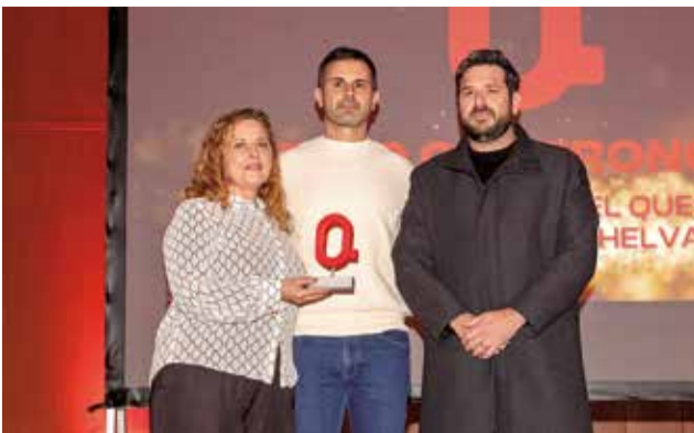
GASTRONOMÍA: Al Ayuntamiento de Chelva por la organización de Quesalia la Feria del Queso y Maridaje de Chelva.