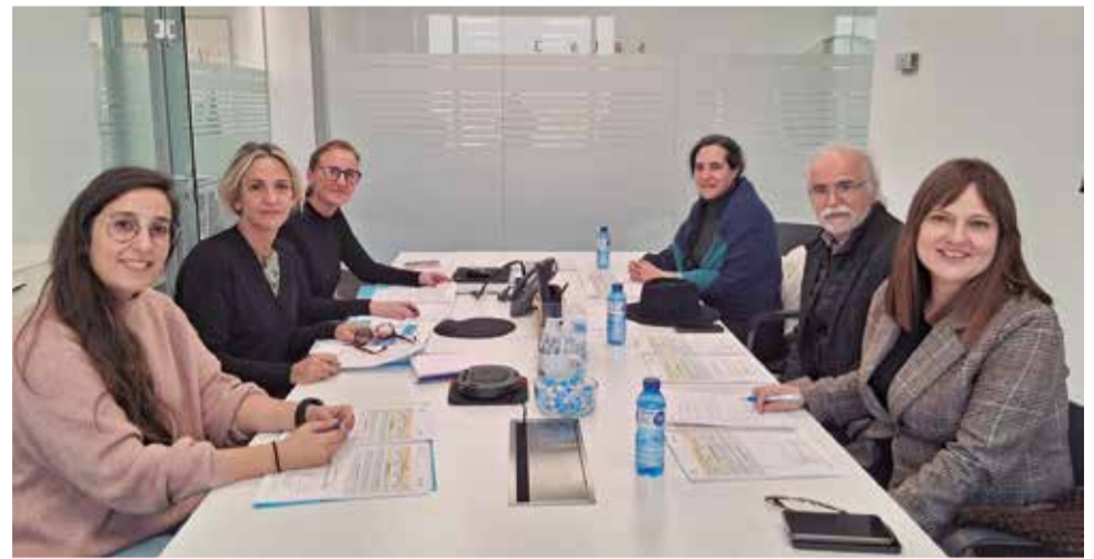
Reunión técnica entre la entidad Atenzia y la Mancomunidad Alto Turia.

El programa ha estado supervisado por un equipo multidisciplinar coordinado por una psicóloga, lo que ha permitido ofrecer una atención cercana y ajustada a cada caso. La experiencia ha demos-