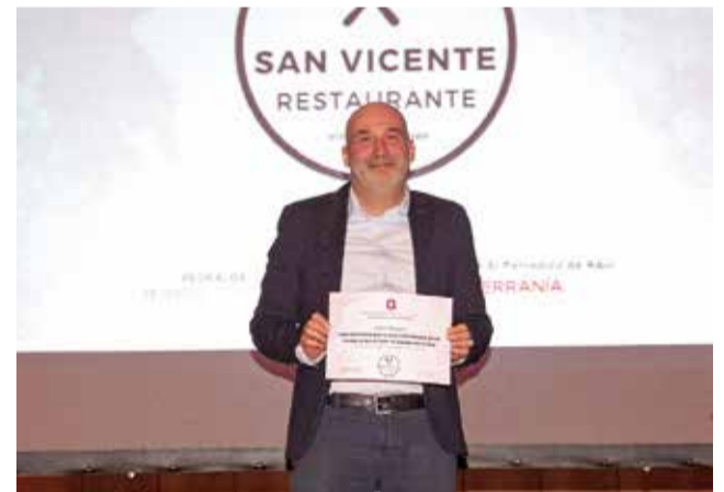
Ganadores del sorteo en los V Premios de El Periódico de Aquí La Serranía celebrados en Pedralba.