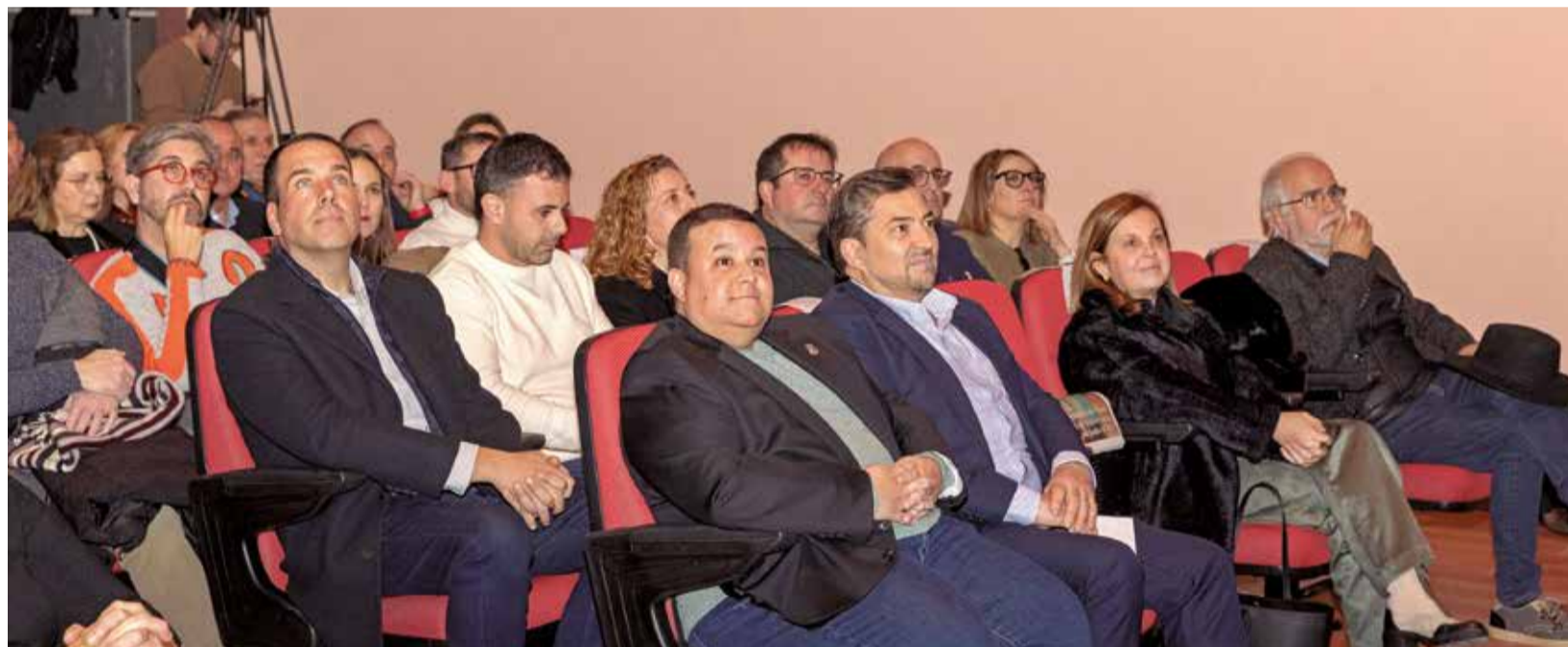
Autoridades en los V Premios de El Periódico de Aquí La Serranía celebrados en Pedralba.

Por su parte, el fundador y director del medio de comuni-