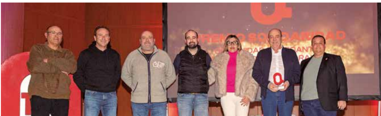
SOLIDARIDAD: A la Comunidad de Regantes El Palmeral de Pedralba, porque gracias a un enganche provisional a sus pozos las familias del municipio pudieron volver a tener agua potable tras la dana, una situación que todavía hoy se mantiene.