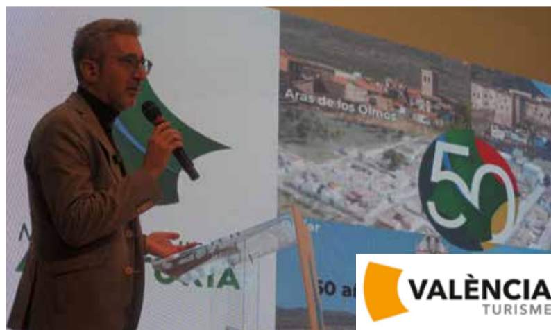
Varios instantes durante la celebración del 50 aniversario de la Mancomunidad Alto Turia en el auditorio de Tuéjar.

EL AUDITORIO ACOGE UN EMOTIVO ACTO CON RECONOCIMIENTOS A LOS ALCALDES Y CONCEJALES QUE HAN INTEGRADO LA ENTIDAD