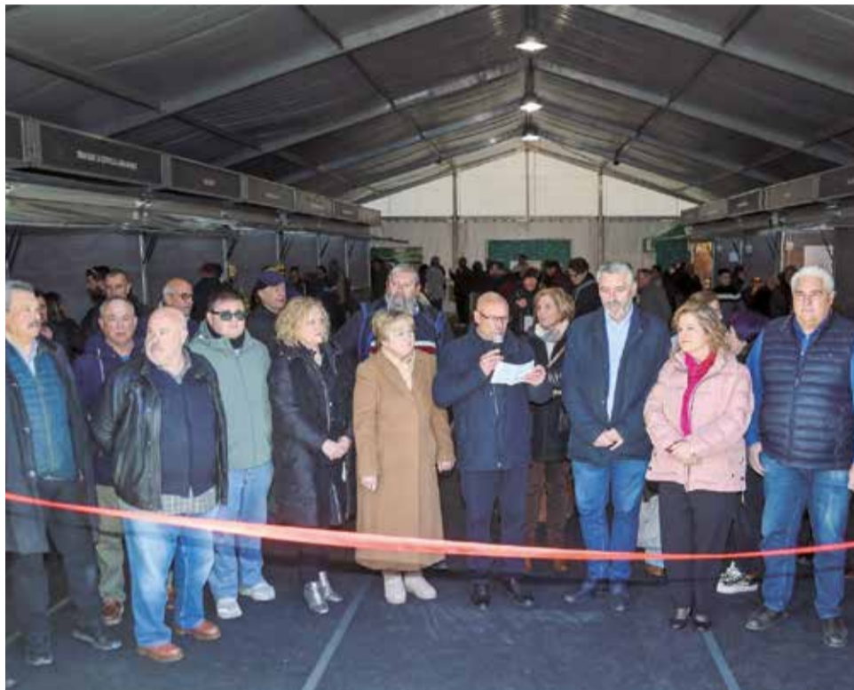
Inauguración de la VII Feria Valenciana de la Trufa de Andilla.

La elevada afluencia se reflejó en las largas colas de la barra gastronómica y en el ambiente festivo del "tardeo" con DJ, que prolongó la