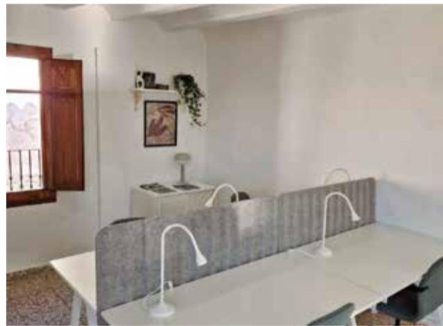
Coworking en Corcolilla.

Gracias a esta iniciativa, Alpuente recibirá un aula digital completa, compuesta por doce ordenadores portátiles HP Chromebook, auriculares