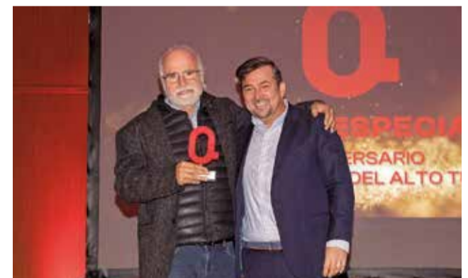
ESPECIAL: A la Mancomunidad Alto Turia por su 50 aniversario y su nombramiento como Reserva Starlight.

por la bicicleta en una trayectoria marcada por la constancia, el sacrificio y la ambición por superarse. Su palmarés incluye cuatro Campeonatos Autonómicos, oro en pruebas de máximo nivel como la Transnomad 2025 y Endurama 2025, plata en la Copa de España 2025, bronce en el Campeonato de España 2025 y un segundo puesto en la exigente Maxiavalanche de Andorra 2023. El premio reconoce no solo los resultados deportivos, sino también el orgullo de representar a La Serranía