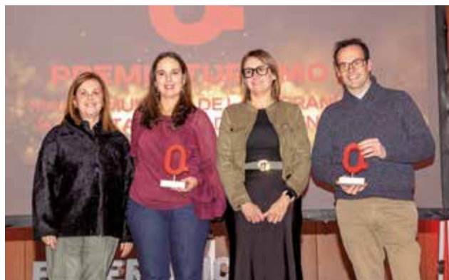
TURISMO: A Alpuente, por su inclusión en Los Pueblos Más Bonitos de España, y a la Mancomunidad La Serranía.