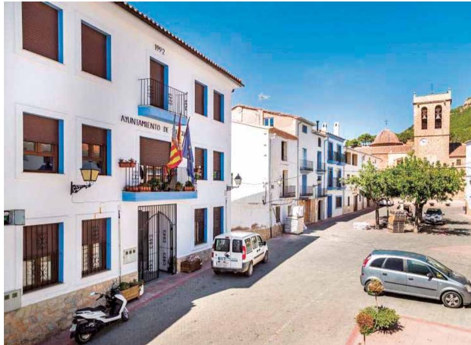
Fachada del edificio consistorial de Titaguas.

El objetivo principal de esta red es generar empleo, apoyar el microemprendimiento y contribuir a fijar población en el territorio, ofreciendo nuevas oportunidades de negocio a quienes apuestan por desarrollar su actividad en el ámbito local. Una iniciativa especialmente relevante