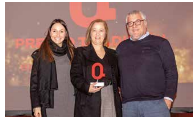
TRADICIÓN: A la Banda de Música de Tuéjar, por sus 120 años acompañando la vida social, cultural y festiva del municipio.