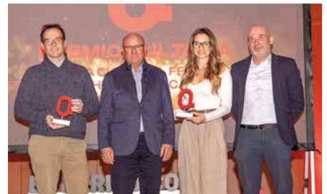
CULTURA: Al I Festival de Música Clásica 'Chullilla: El Cauce del Arte' y al 'Losa Cultural Fest', dos citas emergentes.