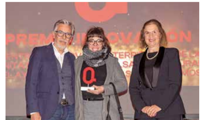
INNOVACIÓN: ARuraltec y el Ayuntamiento de Aras de los Olmos por impulsar el primer Centro de Innovación Territorial de la Comunitat.