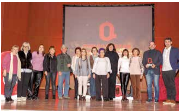
FIESTAS: A la Fiesta de las Hachas, Manos y Fogones y la Feria de las Tradiciones de Titaguas, un evento cultural y turístico.