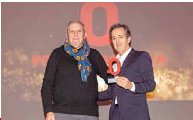
EMPRESA: A Molduras Alto Turia, compañía con raíces en Tuéjar y una proyección nacional e internacional.