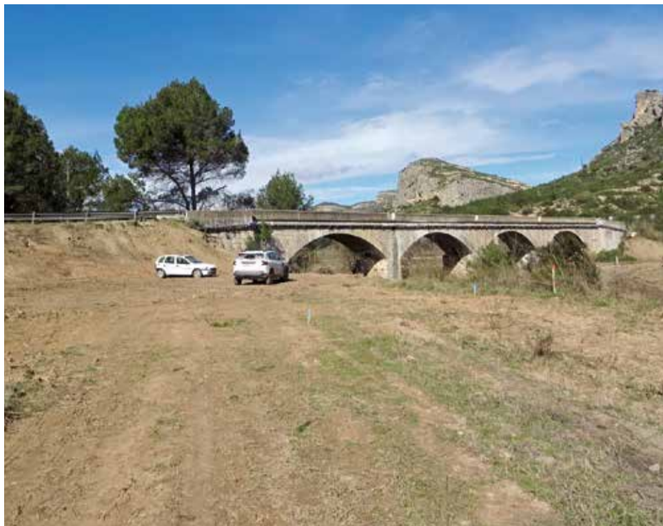
Trabajos de desbroce en el puente de 'La Rinconá'.

Además del nuevo puente principal sobre el Turia, ubicado en el PK 34+045 de la CV-395, el proyecto incluye un puente de menor entidad sobre el barranco de la Tabaira, en el PK 34+636, así como una tercera actuación de menor dimensión. En esta primera fase, los trabajos se centran