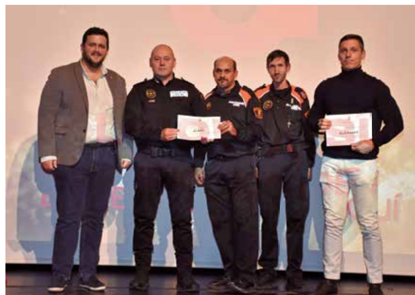
Ajuntaments, policies locals i voluntaris de Protecció Civil arregen la menció especial.