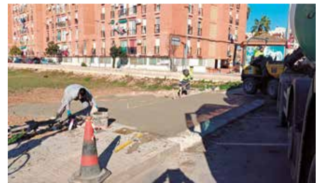
La adecuación de un solar.

Para el inicio de este plan, el consistorio ya ha consignado una partida inicial de 60.000 euros, que permitirá llevar a cabo las primeras actuaciones de adecuación en solares de titularidad municipal y otros espacios susceptibles de ser habilitados como aparcamientos públicos. Estas intervenciones se realizarán de forma progresiva a lo largo de 2026, con prioridad a aquellas zonas con ma-