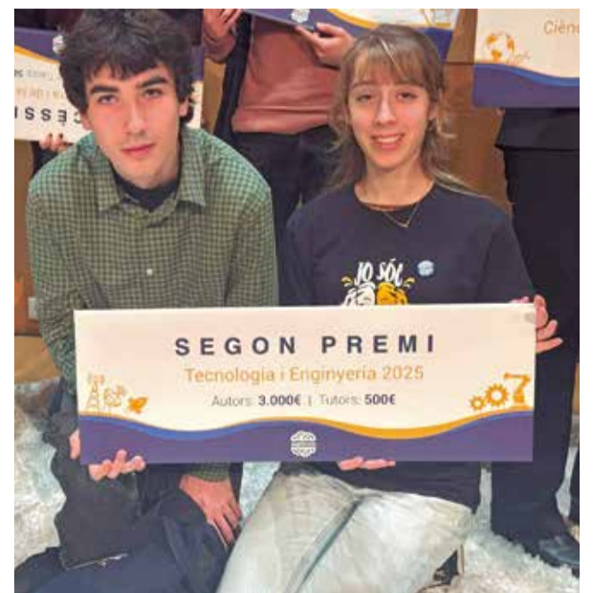
Els alumnes premiats.

A més d'este premi, este projecte ha aconseguit uns altres com a guanyador de la mateixa modalitat en la XX Fira Experimenta de la Universitat de València i el prestigiós premi Ampère-Blas Cabrera (França) consolidant el seu rigor científic i la rellevància de les seues aplicacions.