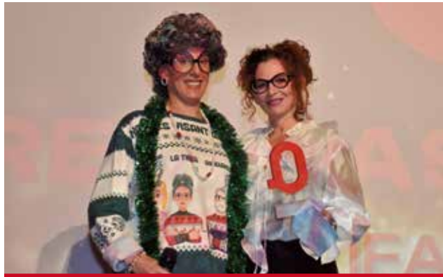
GASTRONOMIA: A l'Ajuntament de Xirivella per l'organització del Botifarra Fest que promou el producte local.