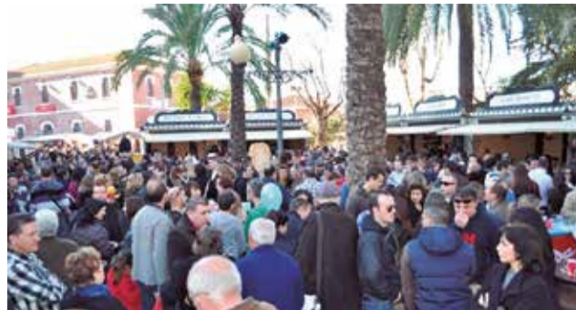
Los asistentes a la feria de años anteriores.

cogida de residuos, y el sábado 24 acogerá la IV Mostra Concurs d'Arròs en Perol amb Ànec, con degustación gratui-