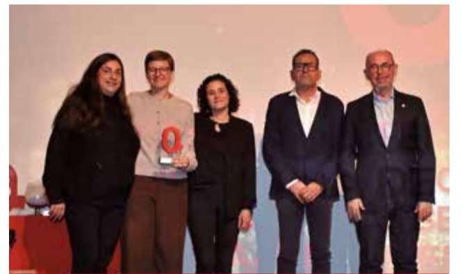
SALUT MENTAL: Per al departament d'Atenció Primària de Psicologia de Servicis Socials de l'Ajuntament de Sedaví.