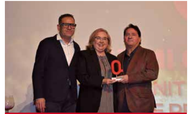
OCUPACIÓ: Al Pacte per l'Ocupació de la Mancomunitat de l'Horta Sud per la seua trajectòria de 25 anys.