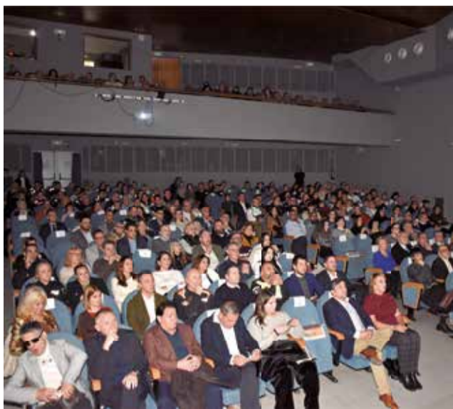
El públic ompli el Centre Cultural El Molí.