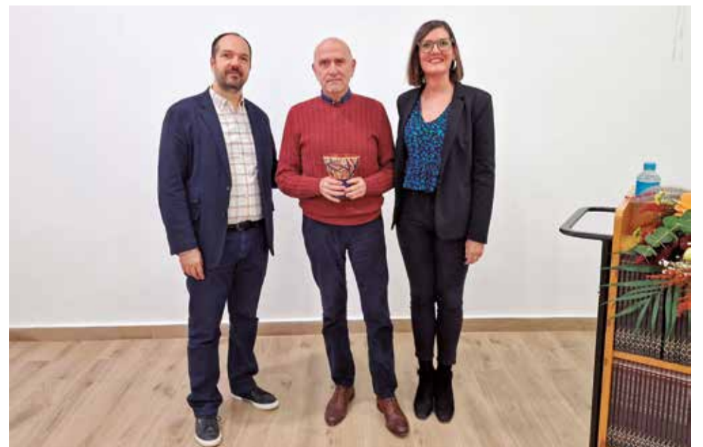
L'alcalde amb el guanyador del premi d'Estudis Locals.