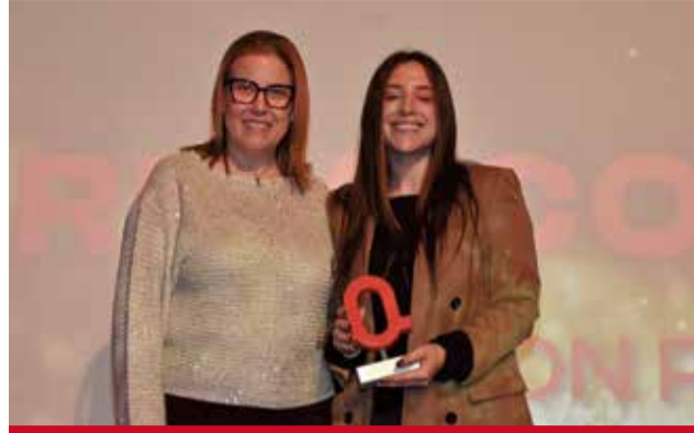
COMERÇ LOCAL: Don Pa Artesans, com a símbol de la resiliència i esforç per a recuperar-se després de la dana.