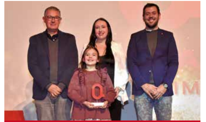
TRADICIÓ: Falla Creu i Mislata pels 100 anys des de la seua fundació i la seua trajectòria en la festa valenciana.