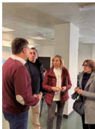
La reunión.

Esta es una de las medidas comunicadas en la reunión que han mantenido el Ayuntamiento con la Plataforma por el Soterramiento de Alfajar, Benetússer y Sedaví, en la que se ha analizado el impacto negativo que el paso a nivel ha tenido durante episodios de lluvias intensas, actuando como una barrera que dificulta la evacuación del agua y aumenta la inundabilidad de los barrios colindantes. Estos