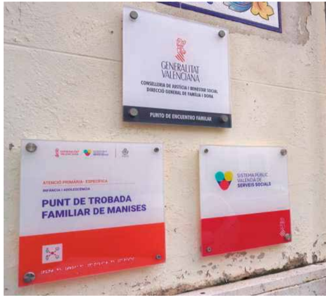
EL Punt de Trobada familiar.

El PP rebutja de pla que el PEF tinguerà un caràcter pro-