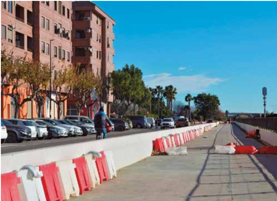
Les obres al últim tram urbà del barranc.