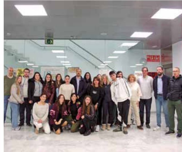
Les persones participants. / EPDA