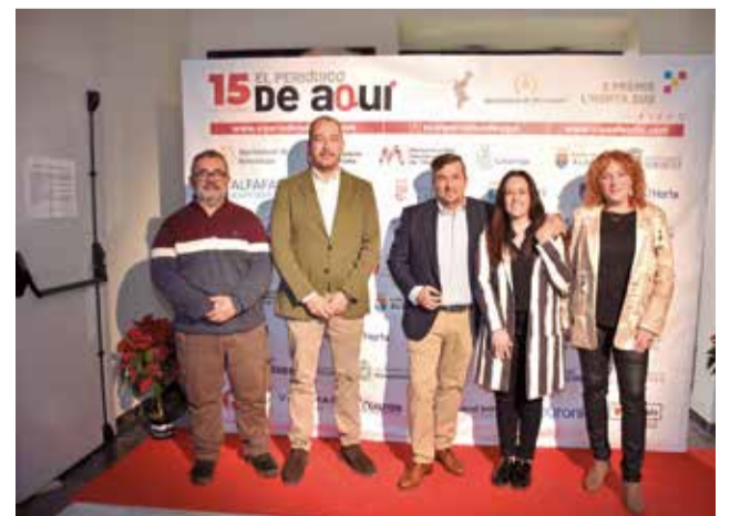
Alcaldes, regidors i representants del teixit associatiu comarcal acudixen a la cita dels premis. / PLÁCIDO GONZÁLEZ