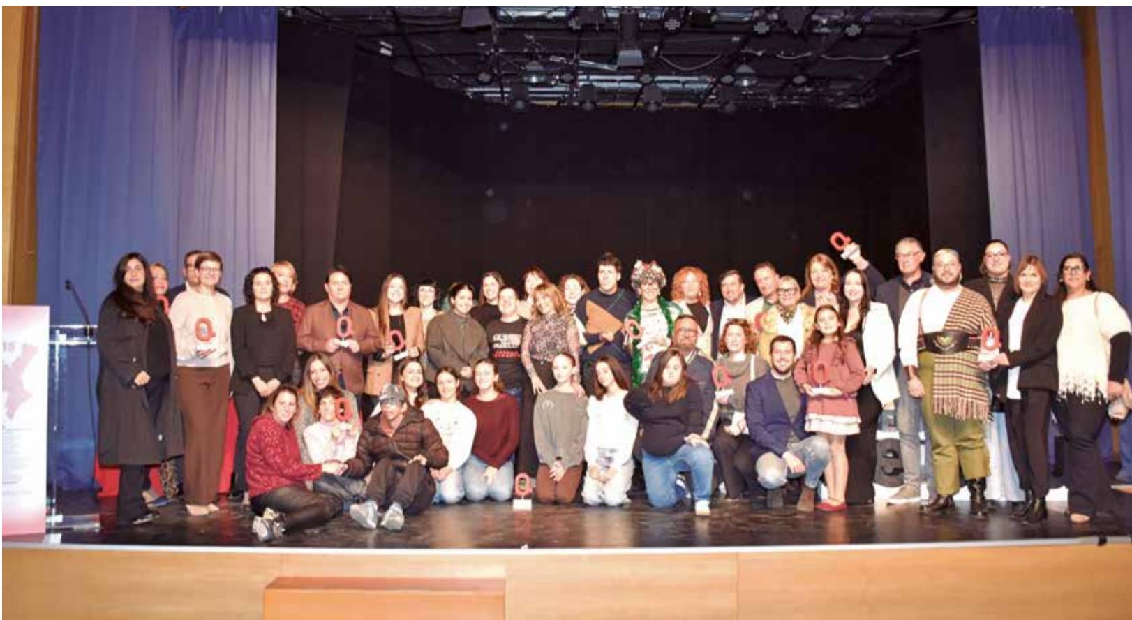
Els premiats en esta desena edició esgrimixen les seues 'Q' sobre l'escenari del Centre Cultural El Molí de Benetússer.

PROP DE 300 PERSONES ASSISTIXEN A LA GALA CELEBRADA EN EL CENTRE CULTURAL EL MOLÍ DE BENETÚSSER I QUE VA REUNIR PARTITS POLÍTICS, ASSOCIACIONS I ENTITATS, AMB UNA MENCIÓ ESPECIAL A AJUNTAMENTS I POLICIES LOCALS