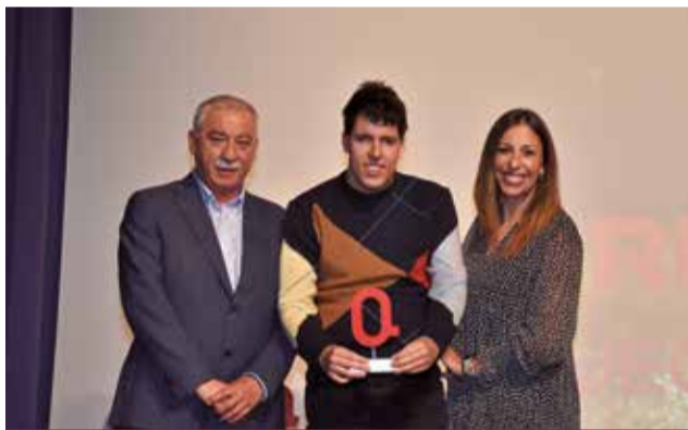
INCLUSIÓ: Projecte Empar de Manises per fomentar la autonomia i la inclusió de les persones amb diversitat funcional.

El Projecte Empar de Manises va ser el guardonat en