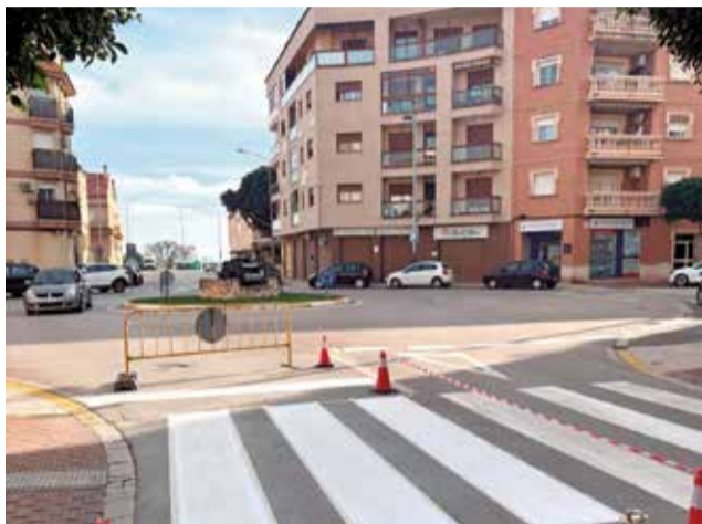
Los trabajos en la vía pública.

Estas actuaciones tienen como principal objetivo reforzar la seguridad de los peatones y facilitar una movilidad más ordenada y segura, contribuyendo al mismo tiempo a la mejora estética de las calles del municipio. Desde el consistorio destacan que este tipo de trabajos forman parte de una planifi-