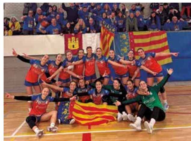
La celebración de los equipos.