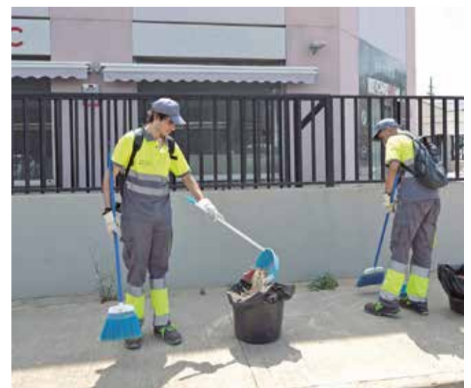
Trabajadores de los servicios municipales.

Las personas interesadas en participar en estos pro-