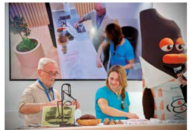
El showcooking en Fitur, con Bollet.

Con su presencia en Fitur, Torrent refuerza su estrategia de promoción turística y gastronómica, destacando el chocolate como un elemento identitario de la ciudad