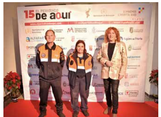
Premiats i convidats posen en el photocall d'El Periódico de Aquí abans de l'emotiva gala.