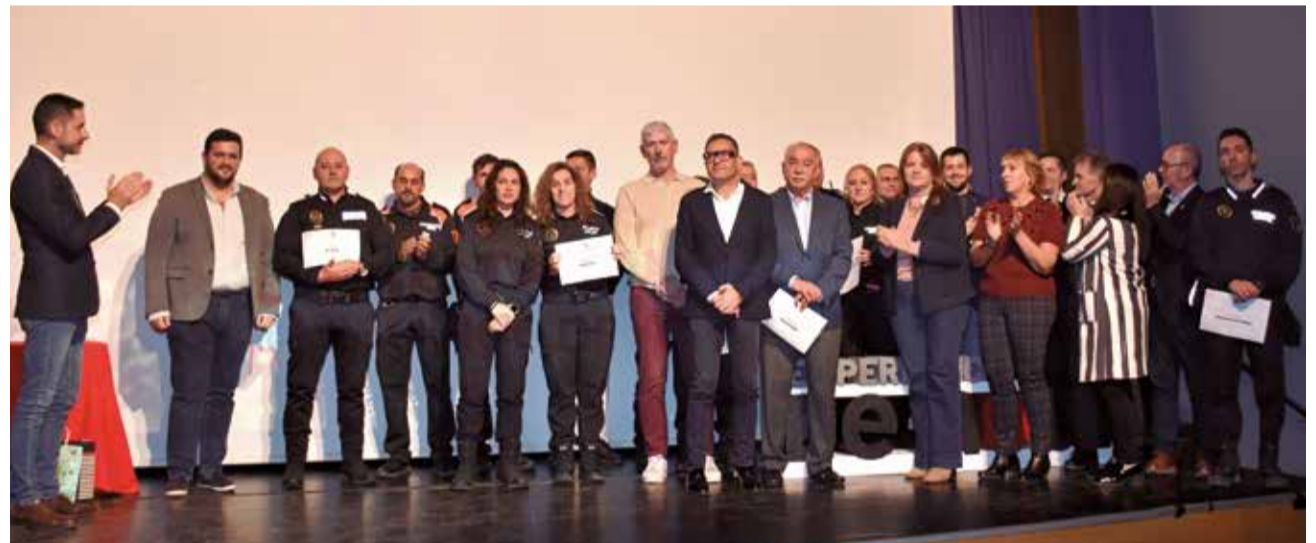
MENCIÓ ESPECIAL: Reconeixement als alcaldes i alcaldesses de la comarca de l'Horta Sud, juntament amb els seus ajuntaments, per la seua extraordinària capacitat de lideratge, compromís i resiliència demostrats després dels greus efectes de la dana i als cossos de la Policia Local i de Protecció Civil de tots els municipis, pel seu compromís a garantir la seguretat, l'atenció a les emergències i el suport a la població afectada, convertint-se en un exemple de servicis públics i solidaritat.