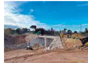
Les obres en el pont.

El pont de l'Omet de Picassent, situat en la carretera CV-4140 en el terme municipal, obrirà a mitjan mes de febrer per a connectar les urbanitzacions. Esta infraestructura va quedar destruïda per la dana del 29 d'octubre de 2024 i per a la seua reconstrucció ha comptat amb un pressupost de 2,9 milions d'euros, a càrrec de la vicepresidència Tercera i Conselleria de Medi Ambient, Infraestructures, Territori i de la Recuperació. Les millores implementades en el projecte