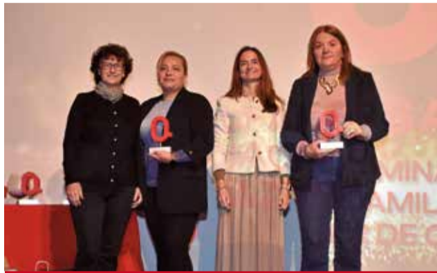
SALUT: 'Ex aequo' al projecte 'Alfajar Camina, camina vitamina' i l'Associació de Familiars i malalts d'Alzheimer de Catarroja.