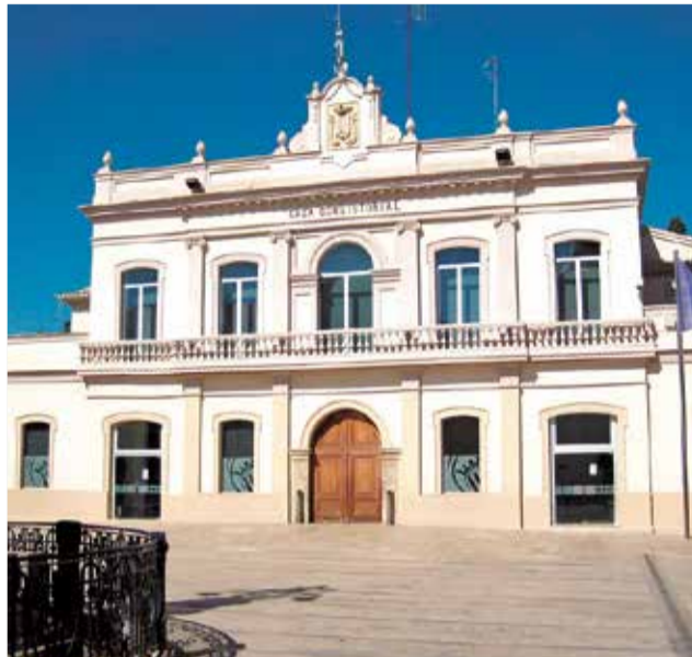
La fachada del ayuntamiento.

Las cuentas garantiza la prestación de los servicios públicos esenciales y refuerza aquellas áreas clave para el bienestar de los vecinos y vecinas, con especial