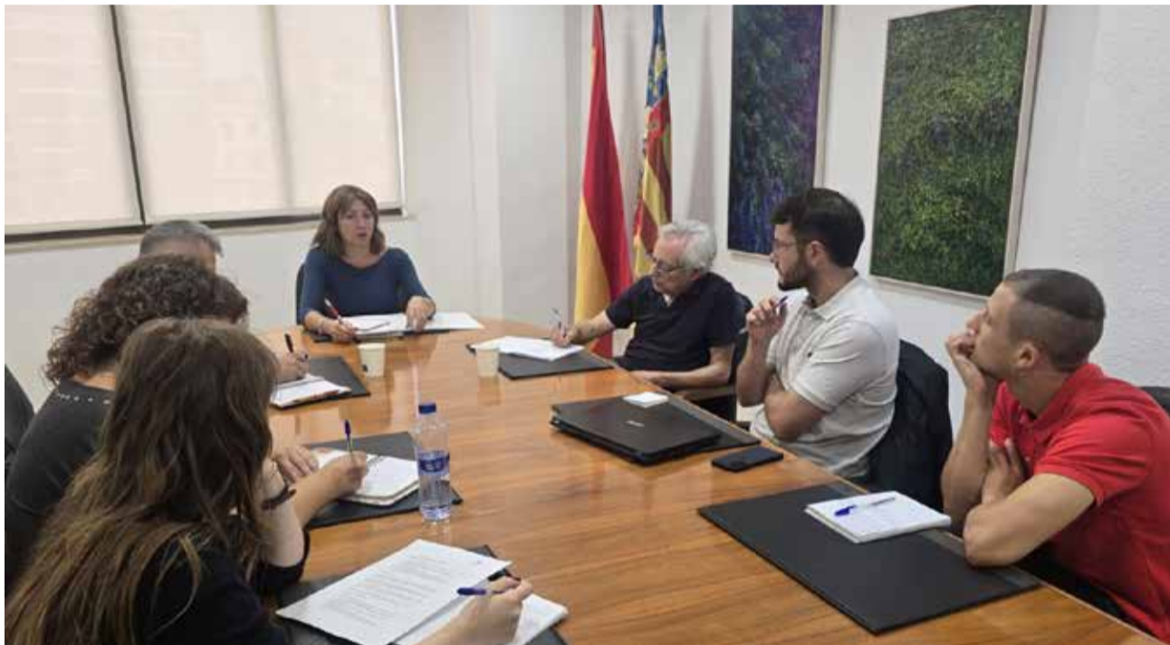
La Concejalía de Participación Ciudadana organiza las jornadas.

“La coordinación entre ambos procesos permite unificar esfuerzos, optimizar recursos y facilitar una participación ordenada, evitando la saturación de consultas y garantizando un espacio participativo amplio y representativo”, explica Vicent Ciscar, alcalde de Paiporta.