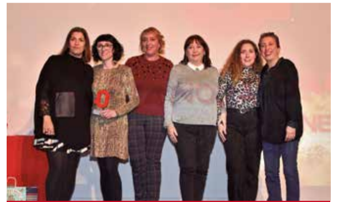
EDUCACIÓ: Per a l'Escoleta Nova de Benetússer, per acollir a xiquets d'altres guarderies molt afectades per la dana.