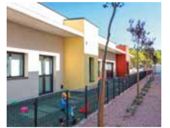
El col·legi El Rajolar.