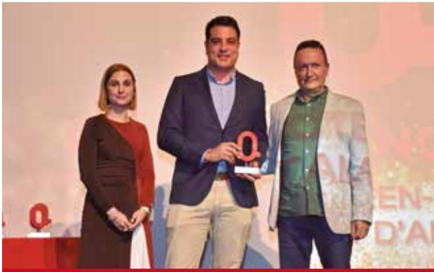
TECNOLOGIA: Ajuntament d'Alcàsser, pel projecte Green-TDigital, que està revolucionant l'atenció ciutadana.