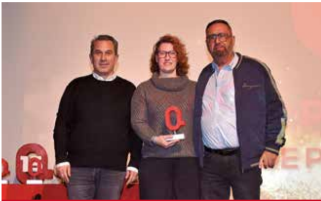
PATRIMONI: Per a l'Escola de Porrots de Silla, per mantindre viva esta dansa mil·lenària amb la implicació de noves generacions.