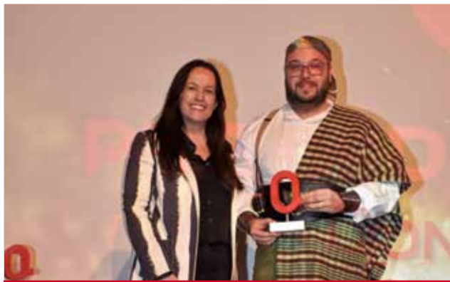
DIVERSITAT: Filà Contrabandistes Catarroja per l'organització de la primera Ambaixada Drag de la comarca.