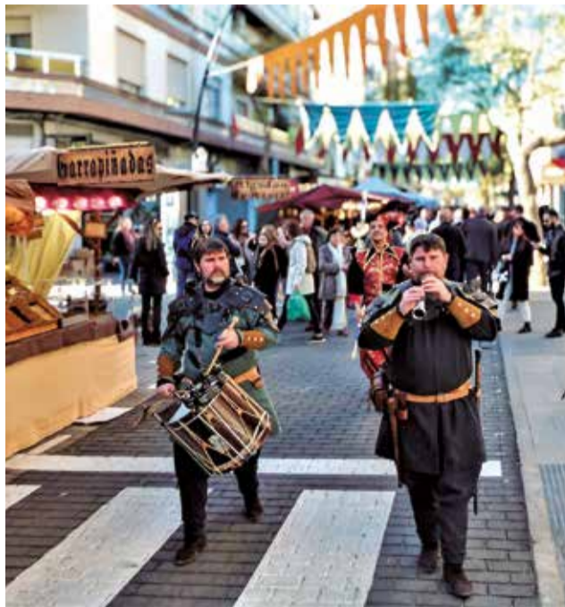
La feria medieval del año pasado.

Dentro de la feria, uno de los principales atractivos será la Feria Medieval, que llenará las calles de ambientación de época con puestos de artesa-