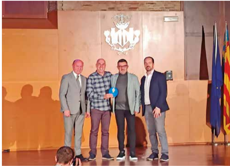
L'alcalde i representants del centre recullen el premi.

L'acte de lliurament dels premis va tindre lloc el passat 10 de desembre de 2025 al Centre Cultural La Petxina de València, en el marc d'una gala que va destacar per l'elevada participació i per posar en valor projectes educatius amb un fort impacte pedagògic i social. El reconeixement va ser entregat