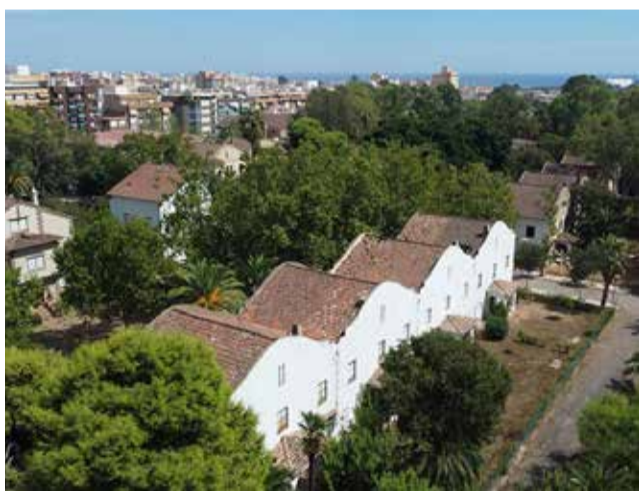
Vista aèria de la Gerència.

La Diputació assegura que l'administració provincial té voluntat de col·laborar en la rehabilitació, però deixen clar que la materialització dels fons depèn de la negociació pressupostària i de pactes polítics. L'Ajuntament, per la seua banda, denuncia que el projecte continua paralitzat i que, sense la intervenció econòmica de la Diputació, la segona fase dels Jardins de la Gerència segueix en suspens, deixant en l'aire la consolidació d'un dels espais patrimonials més emblemàtics de Sagunt.