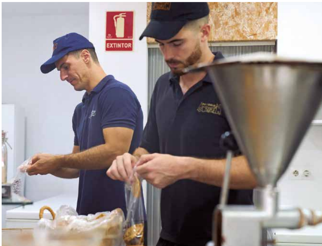
Dos treballadors en un conegut forn de Sagunt.

La precarietat afecta especialment joves, majors de 45 anys i persones amb discapacitat