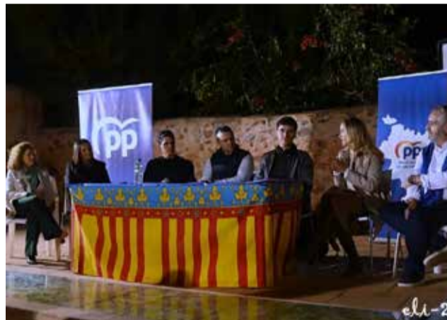
Reunión del PP en Benifairó hace unos meses.