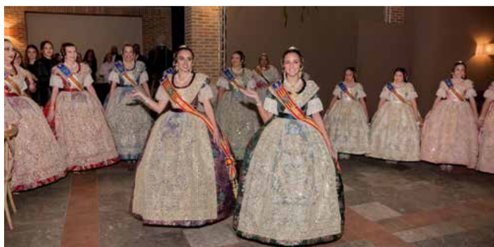
Diversos instants dels actes fallers del calendari 2026 que han tingut lloc fins ara.