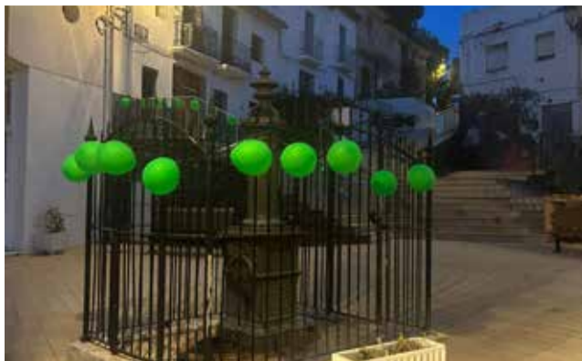
Globus a la plaça de Torres Torres.