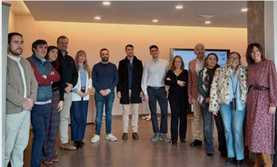
La iniciativa 'Ponemos la Primera Piedra' en la edición del año pasado.

Desde su creación, estos premios han consolidado una red de más de una veintena de proyectos regionales, acumulando una inversión directa en innovación de más de 110.000 euros. Los ganadores de la última edición ejemplifican el desarrollo de innovación con impacto, como es el caso de Evolving Therapeutics, enfocada en la biotecnología apli-