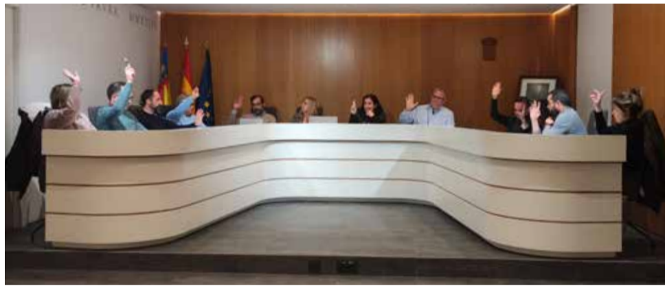
Un instant de l'últim ple de Faura.

Des del consistori s'ha valorat positivament l'acord, que ha comptat amb el suport de tots els grups polítics, com una mostra de consens en una qüestió clau per al sector primari local.