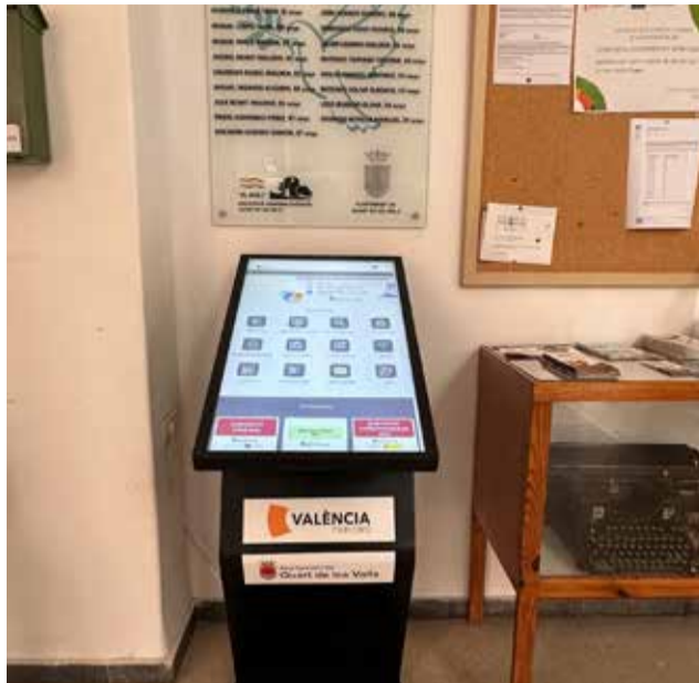
El nou tòtem informatiu a l'Ajuntament de Quart.