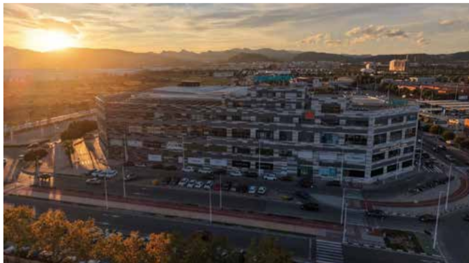
Instalaciones del Centro Comercial Lepicentre.

La experiencia se completa con una variada oferta gastronómica, con restaurantes de todo tipo y de gran calidad, que convierten al centro comercial en el lugar perfecto no solo para comprar los regalos de San Valentín, sino también para celebrar una ocasión tan especial en pareja o en familia.