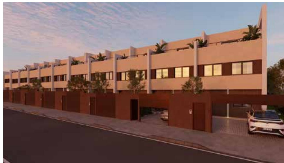
Una promoción de obra nueva en venta actualmente en Sagunt.

La evolución del mercado en Sagunt no se entiende sin considerar la situación general de la Comunitat Valenciana. Desde finales de 2020, en plena pandemia, se produjo una caída histórica