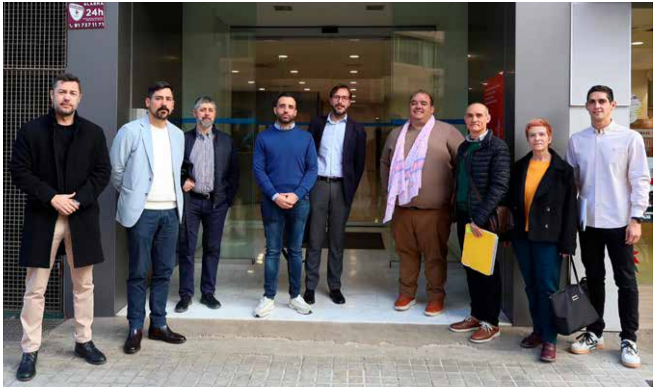
Representants de tots els partits polítics de Sagunt en la Conselleria d'Educació.