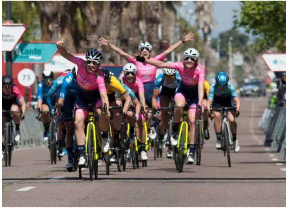
Corredores durant una Volta Femenina a la Comunitat.

La Setmana Ciclista recorre 481,5 km en quatre etapes distribuïdes per les tres províncies valencianes, amb jornades planes, esprints i dues etapes de muntanya amb ports exigents, com l'Alto de Tudons i l'Alto de Confrides. La primera etapa tindrà sortida i meta a Gandía (121