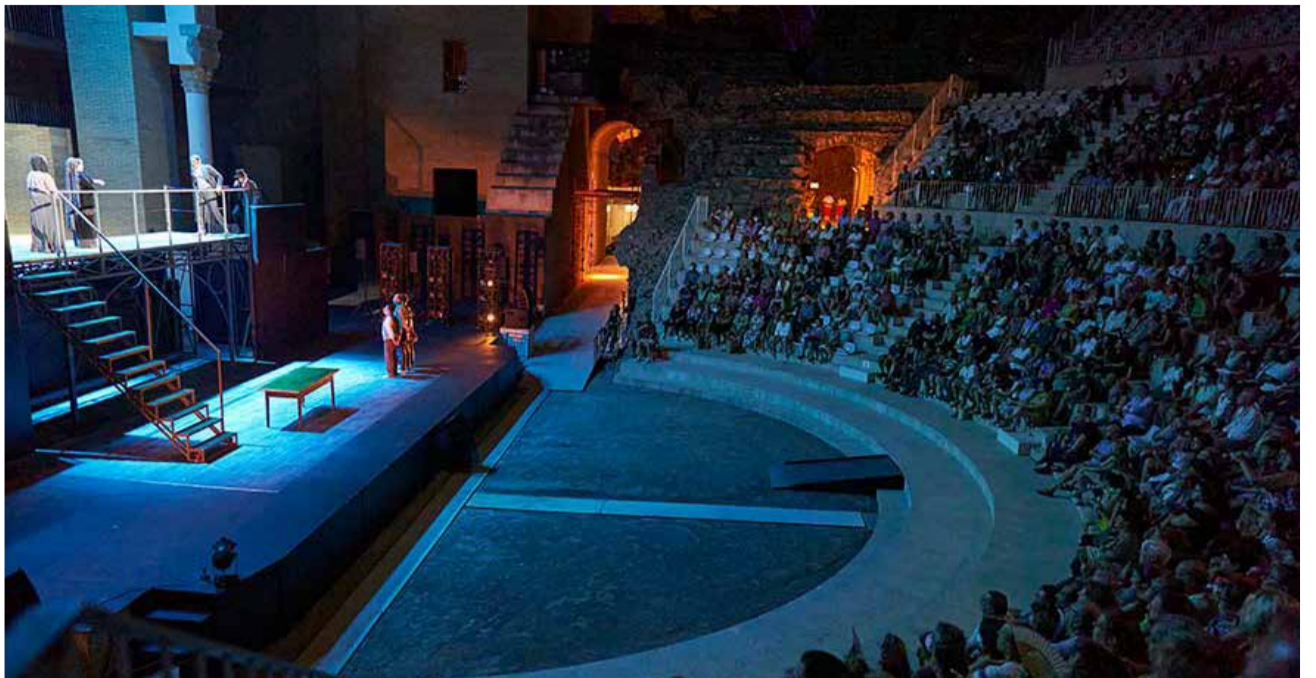
Una representació durant el festival Sagunt a Escena.