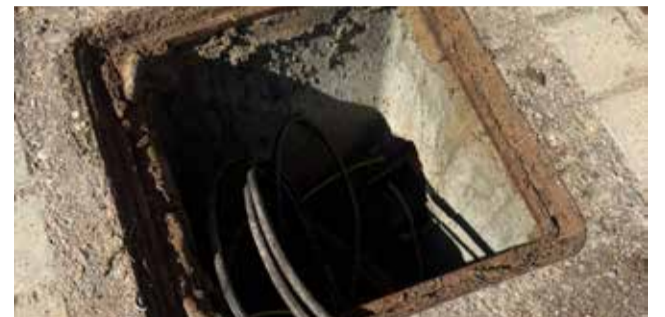
Robo de cable en Gilet.