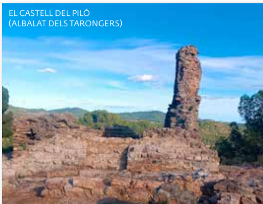
EL CASTELL DEL PILÓ (ALBALAT DELS TARONGERS)

Des de fa un temps, s'ha intentat recuperar-lo. Ja se n'han fet tres fases. S'ha vist que aquelles restes eren més que restes. Una anàlisi seriosa ha permès mostrar una part de la història que teníem oblidada. Entre les troballes, destaquen l'estança principal, un magatzem i una segona estança. També, cal esmentar l'aparició d'un paviment medieval i d'elements ceràmics de diferents cultures. Alguns d'ells tenen l'estrela de David. Les diferents actuacions donen suport al fet que la seua cronologia es trobe entre els segles xii i xiii, molt pareguda a les edificacions defensives de Beselga o Segart.