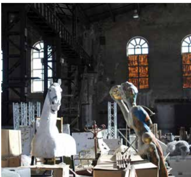
L'interior de la Nau de Tallers.

A esta quantitat se sumen més de 180.000 euros en contractes executats durant estos dos últims anys, entre els quals