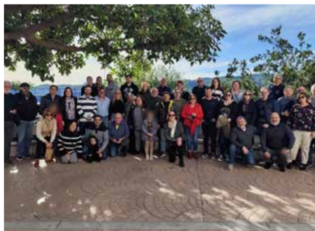
Un encuentro reciente de Compromís.