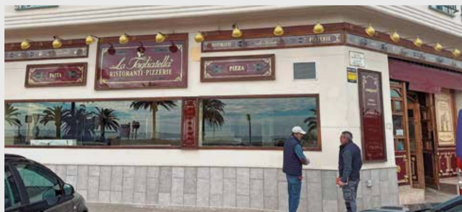
La Tagliatella del Puerto de Sagunto, en reformas.