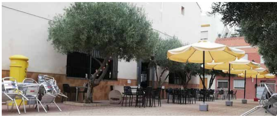
La terraza del Casino de Benavites.

En una economía local fuertemente basada en la agricultura, estas sociedades –muy comunes en las comarcas valencianas– permitieron a los pequeños productores mejorar las condiciones de venta de sus productos, gestionar