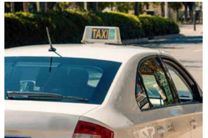
Un taxi en una imatge d'arxiu.

Con esta iniciativa, Estivella busca garantizar la movilidad de los vecinos en gestiones imprescindibles, evitando que la falta de transporte público limite el acceso a servicios básicos y administrativos, y reforzando la colaboración con entidades locales como Radiotaxi Sagunt para mejorar la calidad de vida de la población.