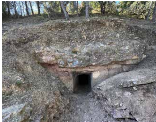
Una de les trinxeres de Gilet.

Les trinxeres de la Muntanyeta del Salero daten de la Guerra Civil espanyola i constitueixen un dels elements defensius més destacats conservats a l'entorn de Gilet. Amb el pas del temps, l'espai havia quedat ocult per la vegetació i l'erosió, fet que dificultava la seua identificació i conservació. La intervenció ha permés recuperar la visi-