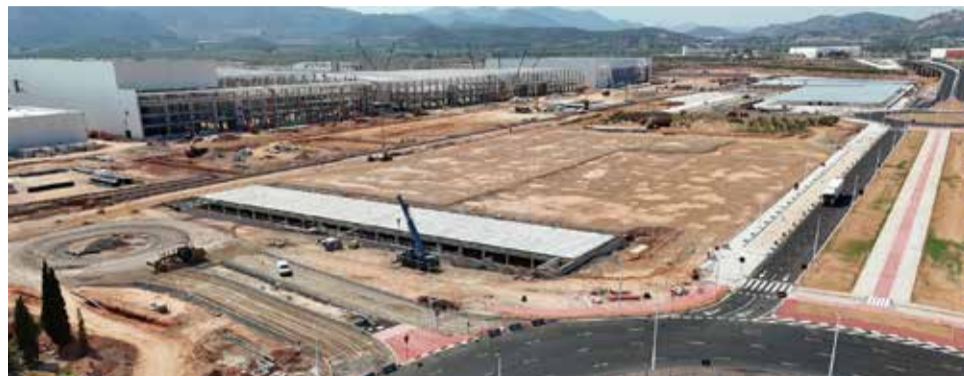
Parcela de Parc Sagunt II para Inditex.

EEE es una sociedad mercantil de titularidad pública, creada con el fin de dotar a la Comunitat Valenciana de suelo urbanizado, apto para usos industriales, productivos y manufactureros, facilitando el asentamiento de proyectos empresariales estratégicos.