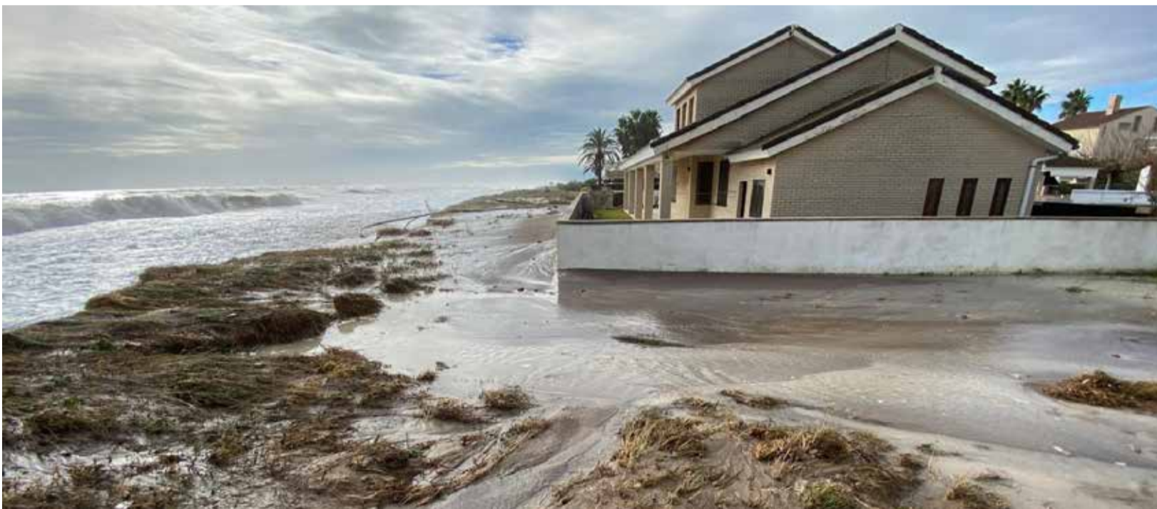
Els treballs que permetran injectar arena en el litoral comarcal varen començar fa poques setmanes.

EL PLE MUNICIPAL APROVA PER UNANIMITAT INSTAR AL MINISTERI A COMPLETAR LA REGENERACIÓ DEL LITORAL