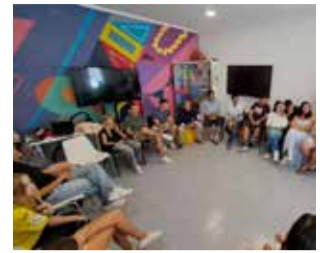
Fòrum jove. / EPDA