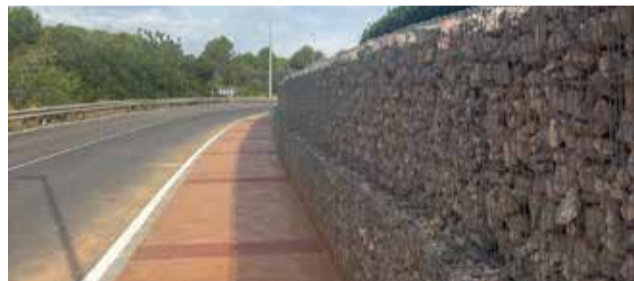
El nou passeig al Pont del Mirambueno d'Algar de Palància.

L'acte oficial va tindre lloc en el tram més pròxim al cementeri i, després de la inauguració, es va oferir un vi d'honor en el quiosquet de la piscina municipal."