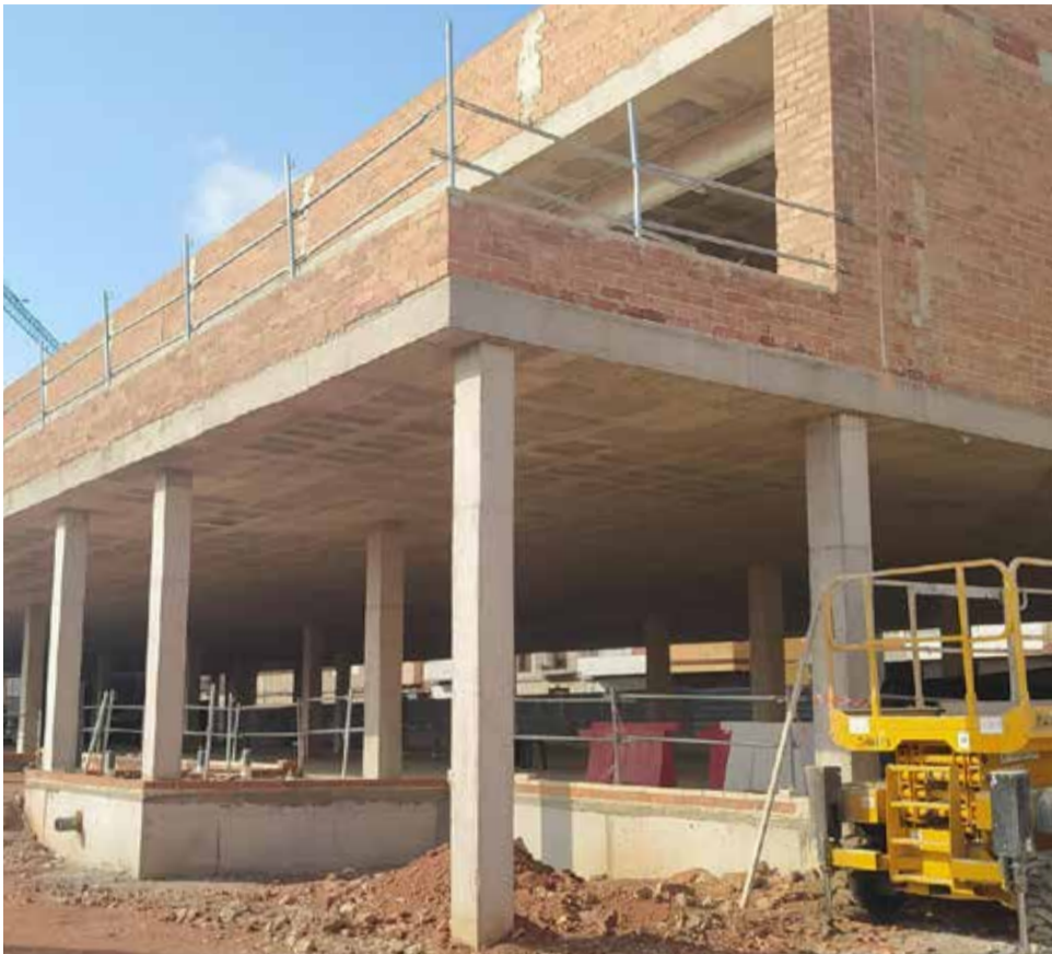
Las obras del nuevo entro educativo de Faura, paralizadas desde hace un año y medio.