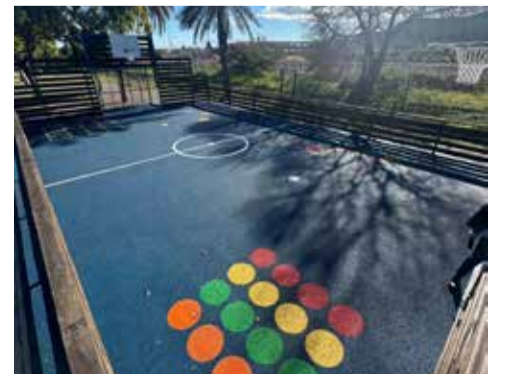
El parc del carrer Racó de Quartell, renovat. / EPDA