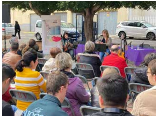
La fira en la seua edició de l'any passat.

Al llarg del dia, els carrers de Benifairó s'ompliran d'activitats familiars i lúdiques, amb tallers, paradetes,