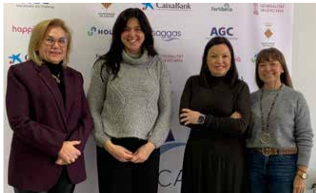
Responsables de ambas entidades.

El convenio establece un marco global de cooperación con una vigencia inicial