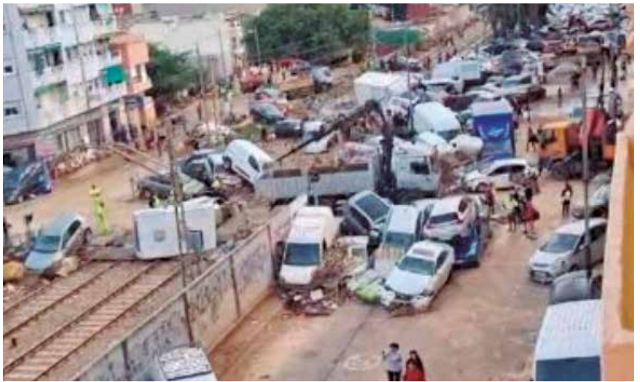
Los vehículos acumulados en el muro de las vías, tras la dana del 29-O.

La dana del 29 de octubre de 2024 no ha hecho más que acrecentar las reivindicaciones de los vecinos que vieron en directo como las vías hacían de muro artificial, provocando que el nivel del agua fuera mucho más alto en el barrio y, por ende, en toda la