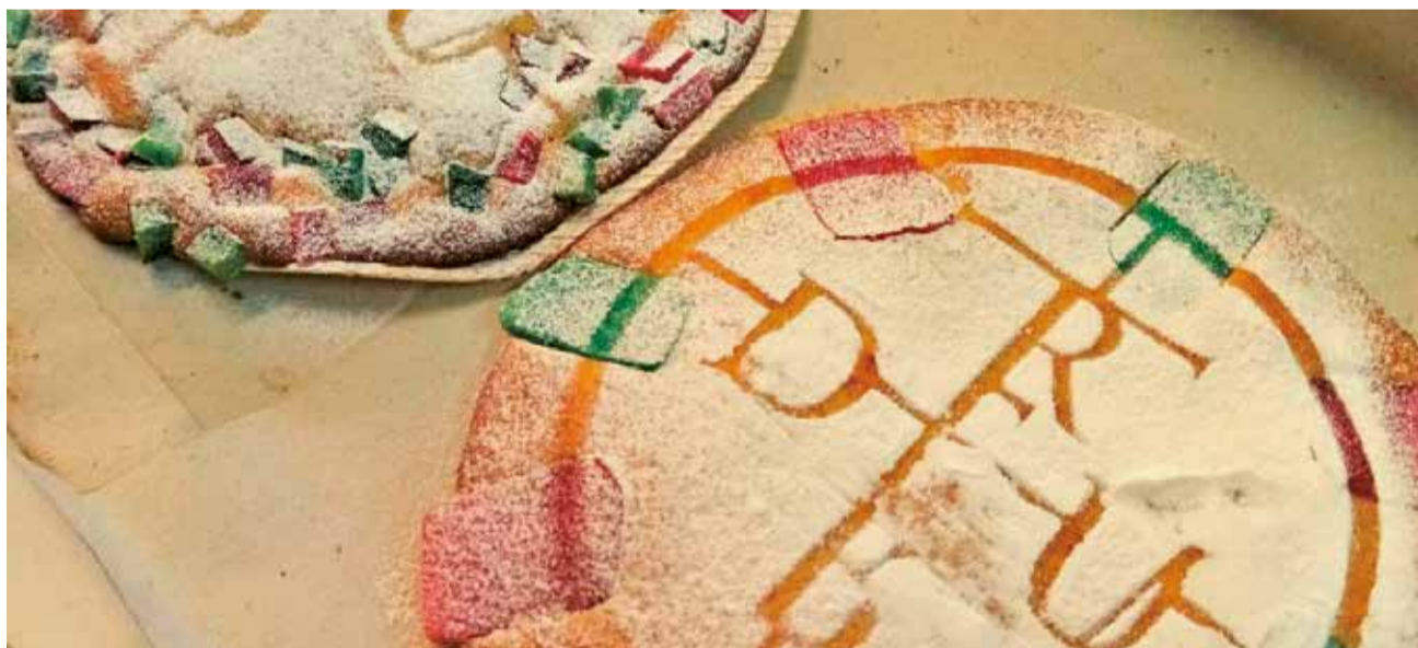
Dolç conegut com 'Bes Visigot' de Riba-roja de Túria.

El municipi d'Algar de Palància, a la comarca del Camp de Morvedre, torna a vestir-se de romanticisme amb la tercera edició de la seua 'Passeig de l'Amor', una iniciativa que transforma un atractiu recorregut natural en l'escenari perfecte per a celebrar Sant Valentí: un passeig d'uns 20 minuts que part del centre del poble i arriba fins a la pe-