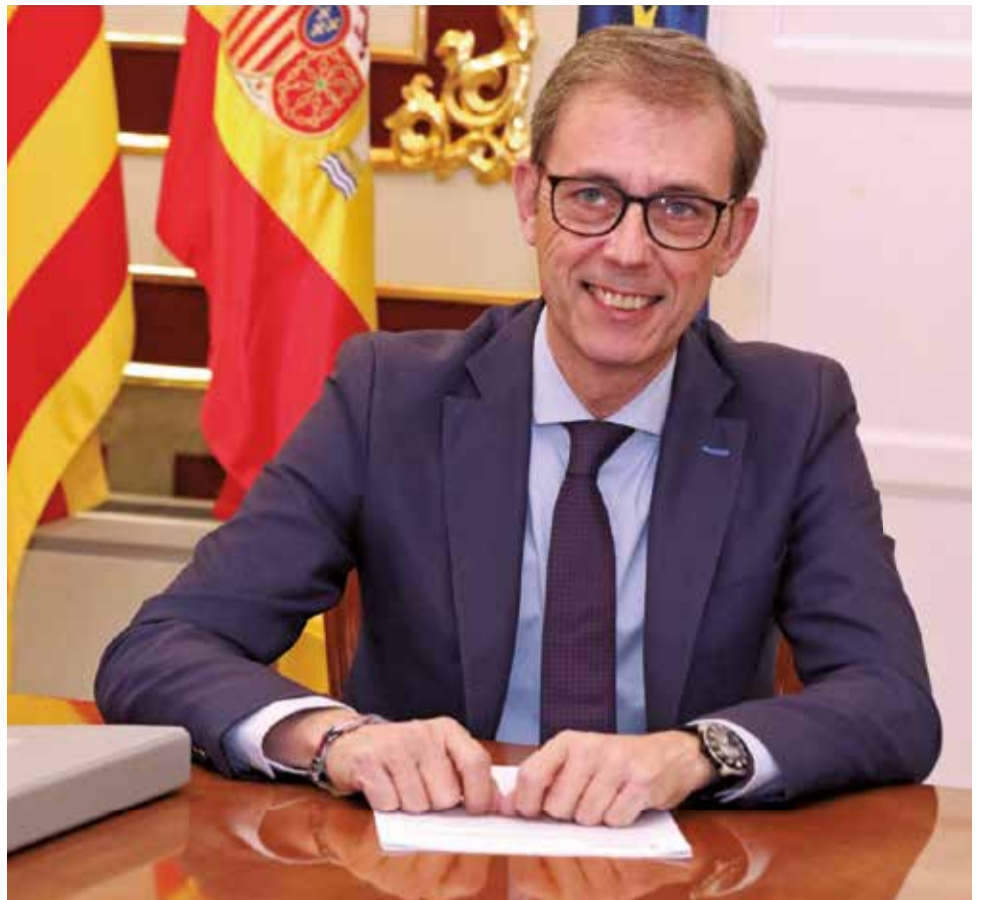
El responsable autonómico en su despacho.

► Estamos avanzando, pero el principal obstáculo sigue siendo la inseguridad jurídica