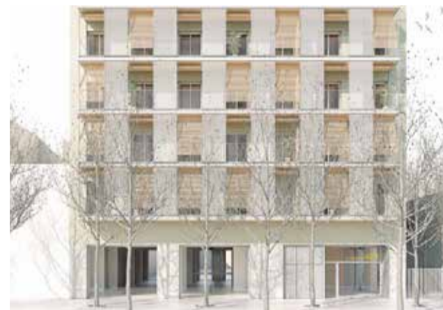
Un bloque de viviendas.

Respecto a los importes de adjudicación, en el caso de Torrent ha sido por 5.207.456 euros y en Albal, por un total de 5.350.935. Las viviendas industrializadas se alzarán en solares propiedad de la Entidad Valenciana de Vivienda y Suelo (EVVA). Concretamente, en