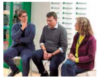
La inauguración.