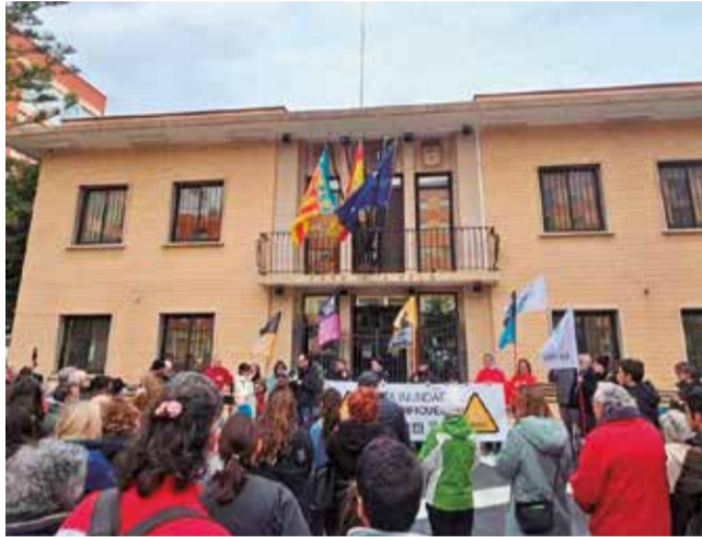
La protesta a las puertas del ayuntamiento.