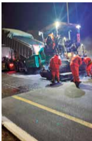
Los trabajos.

La obra se enmarca en la campaña de refuerzo de firmes y renovación de pavimentos que está llevando a cabo la Generalitat con el fin de mejorar la seguridad vial y la funcionalidad de la red viaria, y forma parte del Plan Endavant y de los trabajos de reconstrucción que se realizan no solo para reponer la movilidad de la zona cero de las riadas, sino para mejorarla.