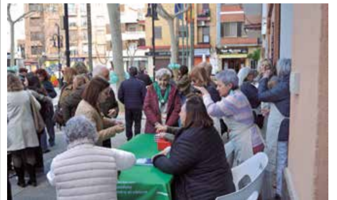
La venda de tiquets.