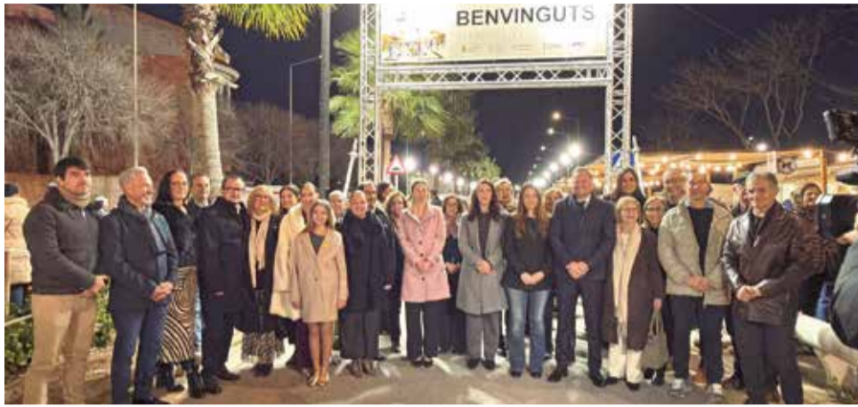
La inauguración del recinto ferial en la avenida Gandia.