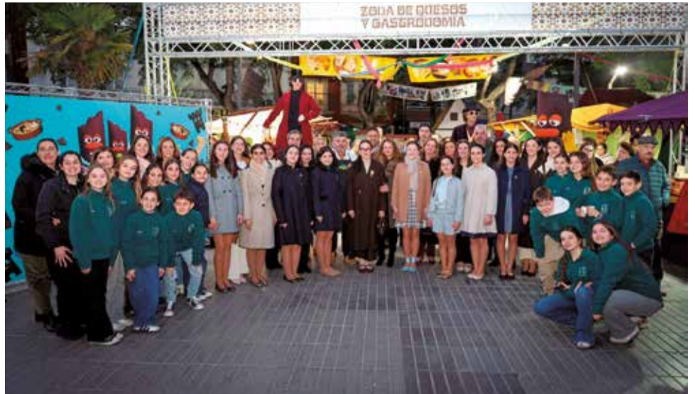
La inauguració de la Fira del Xocolate en Torrent.

formatges, embotits i productes gurmet, que han conviscut amb l'oferta tradicional del Porrat de Sant Blai. La programació d'activitats ha sigut un dels grans pilars de l'èxit, amb showcookings, tastos, tallers infantils diaris, animació itinerant i repartiments de xocolate calent.