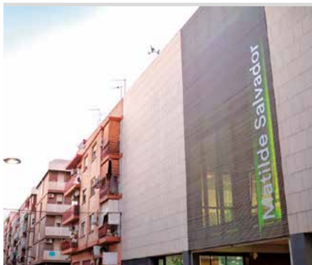
L'edifici Matilde Salvador.

Les persones interessades han de sol·licitar cita prèvia enviant un correu electrònic a psicojove@ajuntamentaldiaia.org. La psicòloga respondrà i consultarà algunes