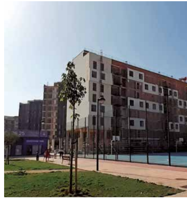
Un edificio en construcción en Quart de Poblet.

Por otra parte, en l'Horta Nord, se registra una de las mayores concentraciones inmobiliarias en el último año del área metropolitana, con