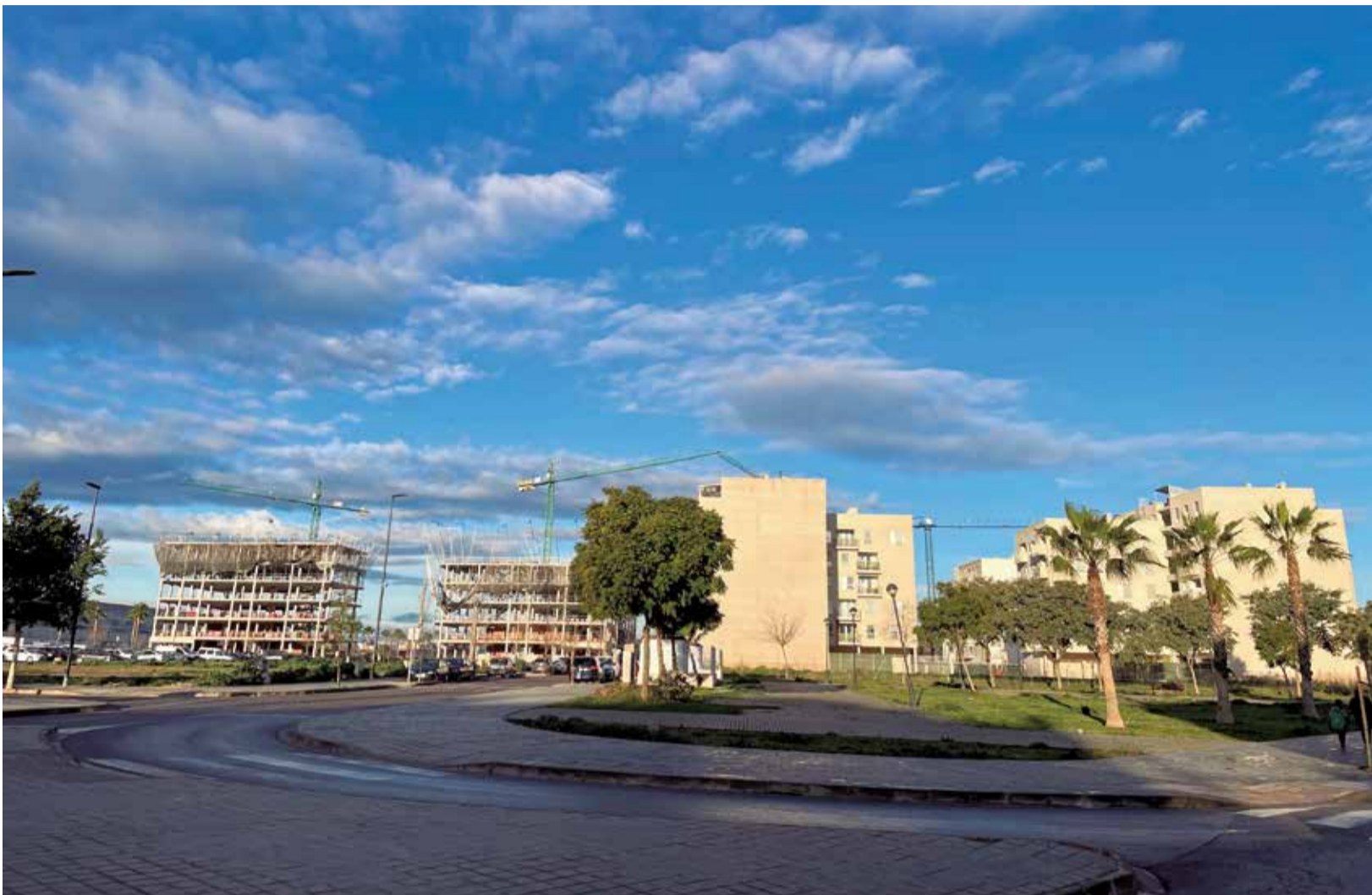
La construcción de varios bloques de viviendas en Albal, donde aumentan las promociones.