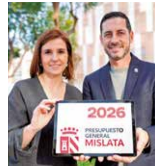
Los dirigentes.

Las áreas de gestión que más aumentan son el área de Bienestar Social con más de 9,3 millones y un 53,31% respecto al 2025, y representa un 19% del total del presu-