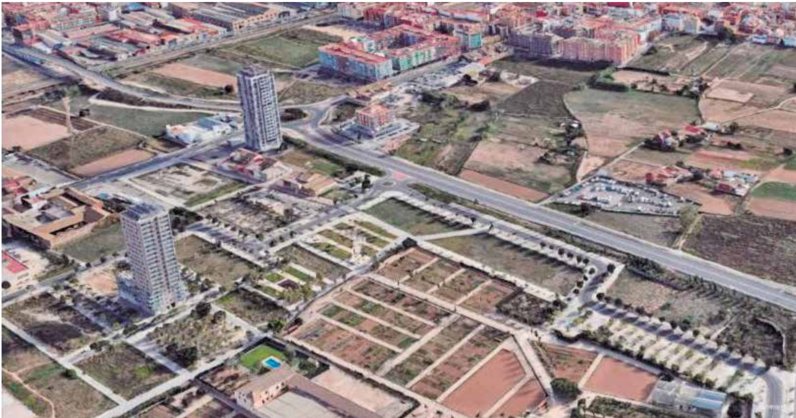
El plànol de l'àrea que es vorà afectada pel projecte de parc metropolità dissenyat per la Generalitat.