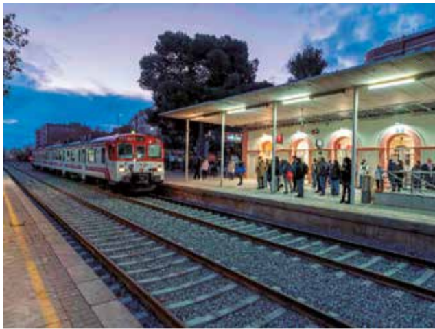
La estación de Aldaia.

El proyecto de duplicación, que está en fase final de redacción, se está presentando a los ayuntamientos de los municipios incluidos en el tramo. En concreto, contempla la instalación de una vía adicional en un tramo de unos 12 kilómetros de la línea C3 (València-Buñol-Utiel, la segunda con mayor densidad de tráfico del núcleo de