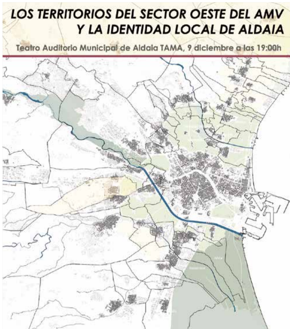
La portada del llibre sobre el terme municipal.

El llibre aposta per un enfocament supramunicipal com a clau de volta per a abordar problemes com els efectes de la dana, els riscos dels fenòmens atmosfèrics i les necessitats de benestar de les generacions futures, i recorre passat, present i possibles es-