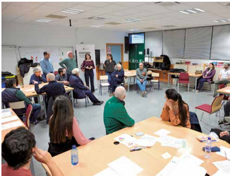
El primero de los encuentros con la ciudadanía.