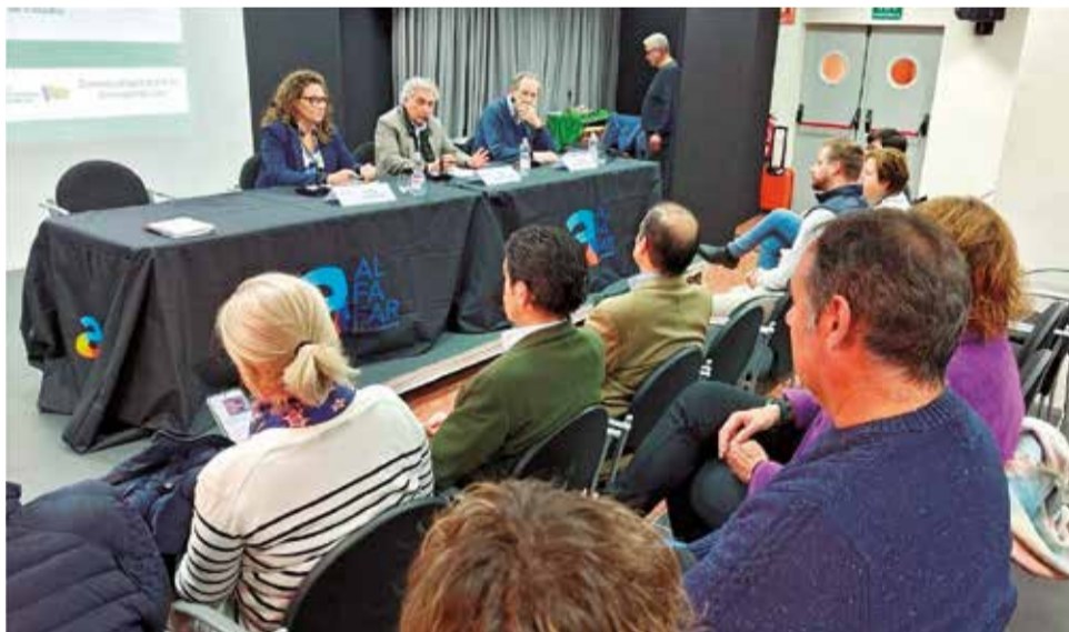
L'exposició del projecte als alcaldes dels municipis afectats.

Per a accelerar l'execució d'este macroprojecte de parcs inundables la Generalitat va dividir l'actuació