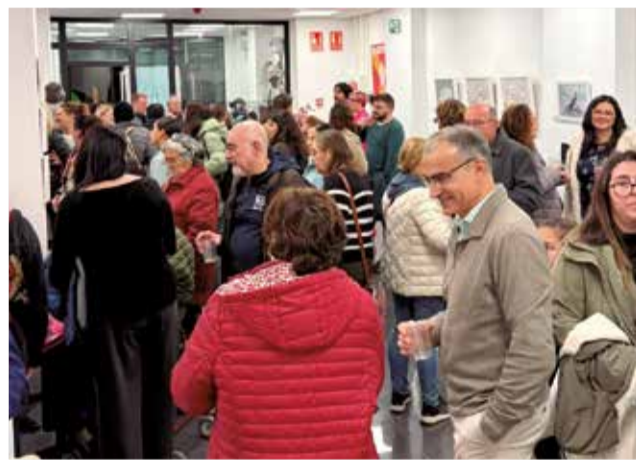
El público asistente a la inauguración.

Por la tarde, se convocó al público general don-