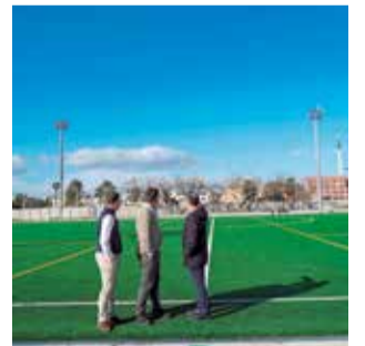
El recinto deportivo.

El proyecto entra ahora en una nueva etapa. En las próximas semanas comenzará la fase 2, que contempla la incorporación de nuevas infraestructuras, entre ellas un edificio polivalente, nuevas gradas y vestuarios, am-