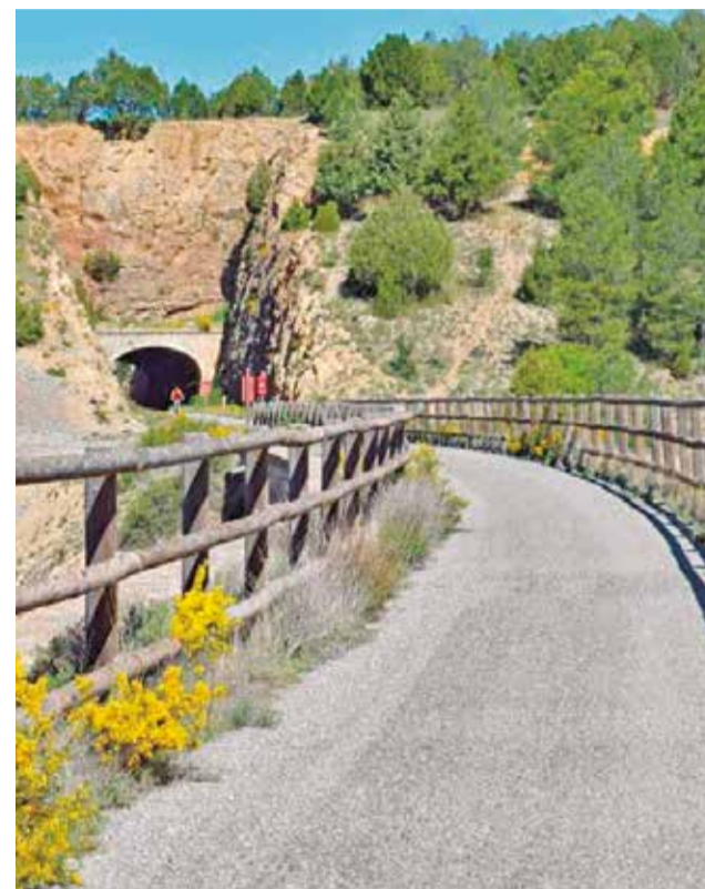
La Via Verda d'Ulls Negres es recorre en bici.

convertir cada regal en una mostra d'amor també cap al teixit comercial de proximitat. Sota el lema de fer costat als comerços de Gandia, la iniciativa cerca reforçar l'economia local i posar en valor la proximitat, la qualitat i el tracte personalitzat que proposen els negocis de la ciutat.