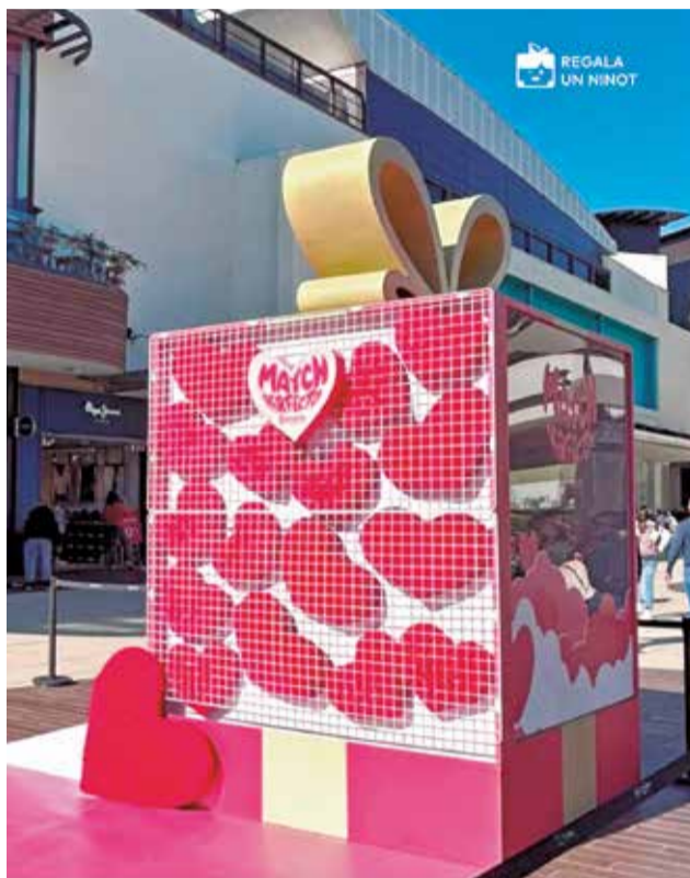
Decoració per Sant Valentí en C.C. Bonaire.