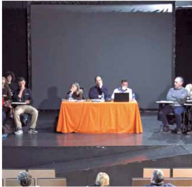
El ple celebrat a Aldaia.

No obstant, els comptes eixiren endavant, estretament vinculats a la realitat del municipi després de la dana del 29 d'octubre de 2024. Un pressupost que no és només un balanç econòmic, sinó un compromís amb un model de