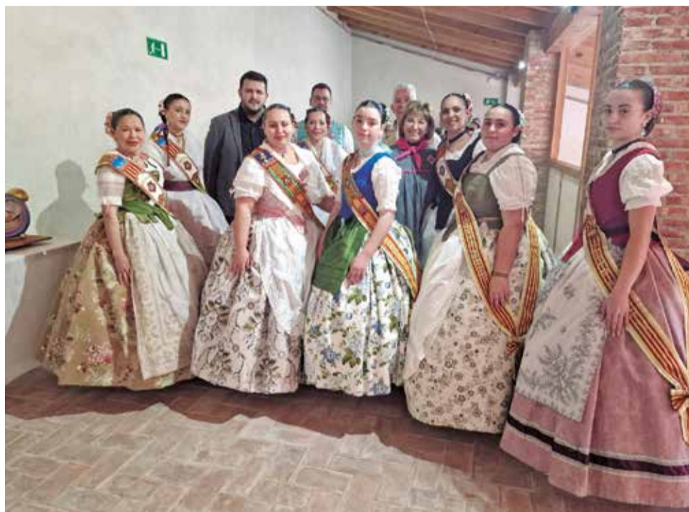
El alcalde y la vicealcaldesa con las representantes de las comisiones.

La exposición reúne un total de catorce ninots –siete infantiles y siete grandes– distribuidos entre la planta baja y la planta superior del edificio. Vecinos y vecinas de Albal, así como visitantes y amantes de las Fallas, podrán visitar la muestra y depositar su voto durante los fines de semana, hasta el próximo domingo 22 de febrero.