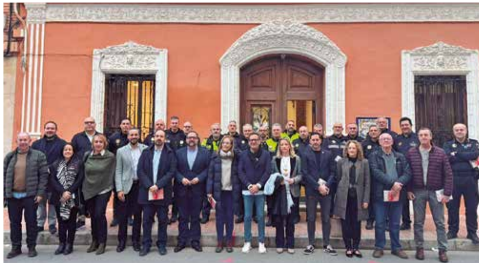
Els alcaldes del municipis i les prefectures de Policia Local.

La comissió d'emergències estarà formada pel president