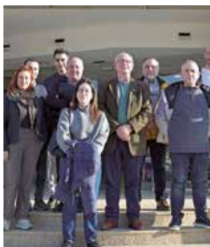
El primer encuentro.

Durante la reunión se han asentado las bases y los próximos pasos en la creación de la EGM, una figura recogida en la Ley 14/2018 de la Generalitat Valenciana de gestión, modernización y promoción de las áreas industriales. A su vez, se da continuidad al acuerdo adoptado por APIP