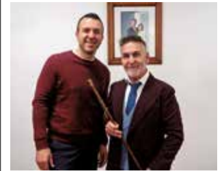
Mompó y el alcalde.