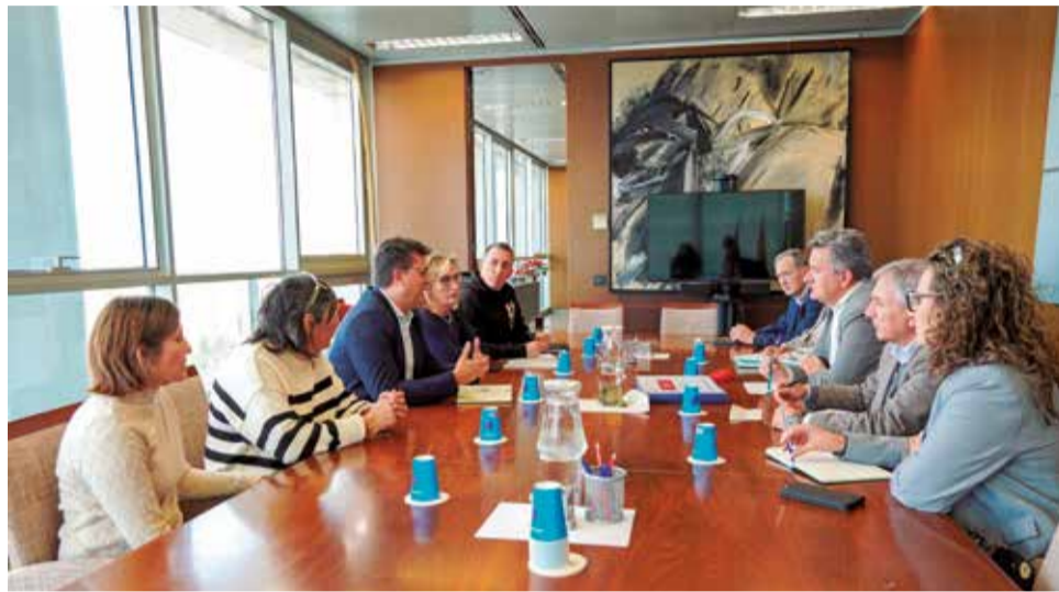
La reunión con la consellería, Ayuntamiento y Plataforma vecinal.

Desde el Ayuntamiento se subraya que el mantenimiento de las vías en superficie supone un riesgo estructural para Alfafar y los municipios colindantes, tal y como se evidenció durante las riadas del 29 de octubre de 2024. En este sentido, el alcalde explicó que es fundamental que esta infraestructura esté bajo tierra para evitar que actúe como una barrera que agrava el riesgo de inundación en episodios extremos.