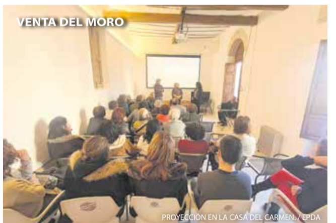
VENTA DEL MORO