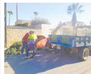
Treballs de recollida.