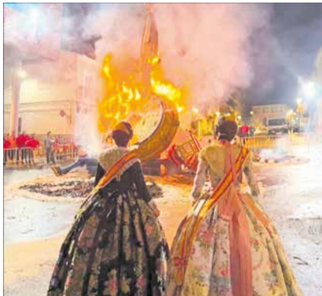
Diferentes actos de la Falla Godayla de Godelleta durante las fiestas de 2026.

Asimismo, la comisión recibió el premio de Fallas de la