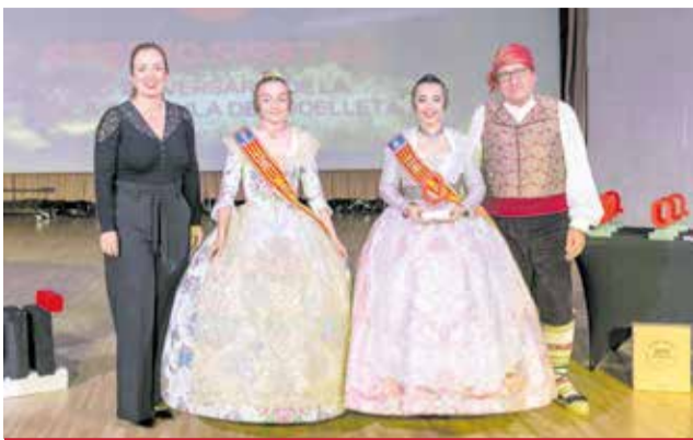
FIESTAS: A la falla Godayla de Godelleta por su 25 aniversario.