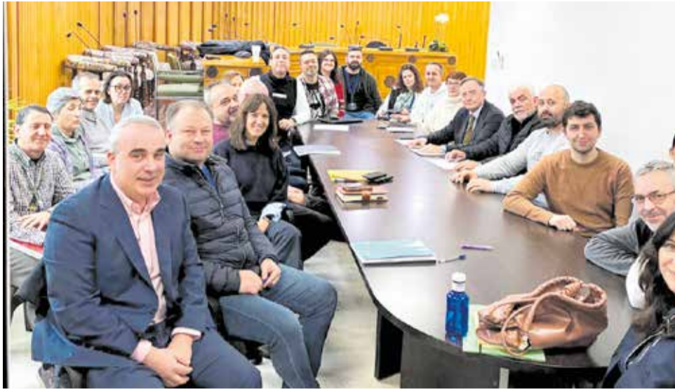
Un instante durante la reunión.