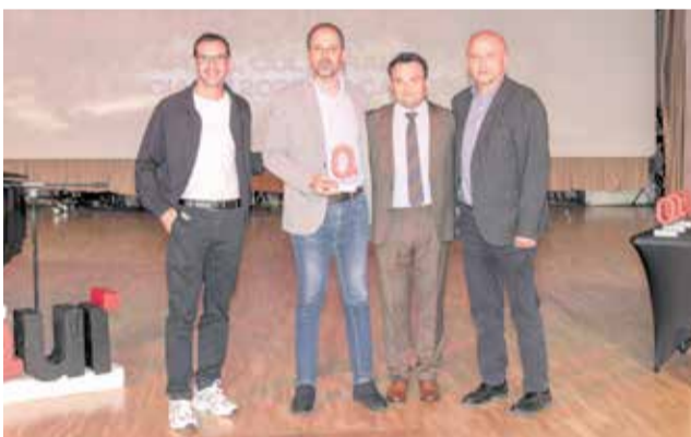
CULTURA: A Macastre, gracias a su elección como Capital Cultural Valenciana 2025.