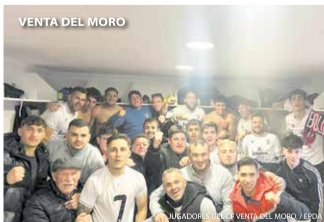
VENTA DEL MORO

El municipio de Venta del Moro celebró el Día del Árbol con la participación del alumnado del CEIP Maestro Victorio Montés y del Aulario de Las Salinas, en una jornada centrada en la educación ambiental. La actividad combinó plantación, aprendizaje y convivencia, fomentando entre los más jóvenes valores de respeto.