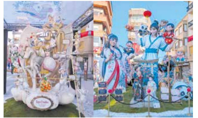
Monumentos ganadores.