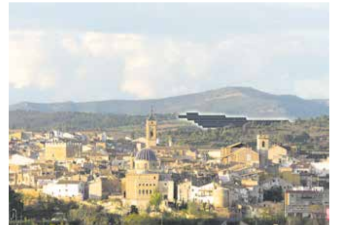
Fotomontaje del Limonero Solar.

Ante esta situación, la asociación ha acudido a los tribunales y prevé lanzar una campaña de crowdfunding para financiar el proceso.