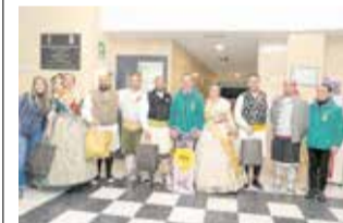
Presentació. / EPDA