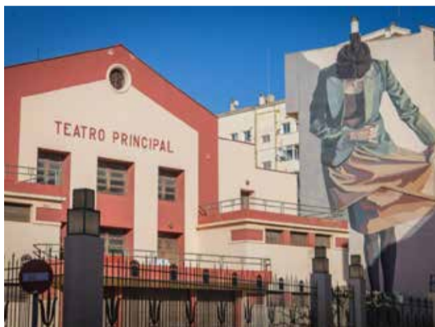
Teatro Principal de Requena.

Con esta renovación, se mejorará el confort térmico tanto para el público como para el