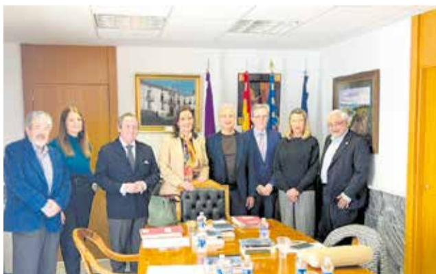
Sesión histórica en el Ayuntamiento de Utiel.

El primer Pleno fuera del Palau de Santa Bàrbara, sede de la institución, se ha celebrado