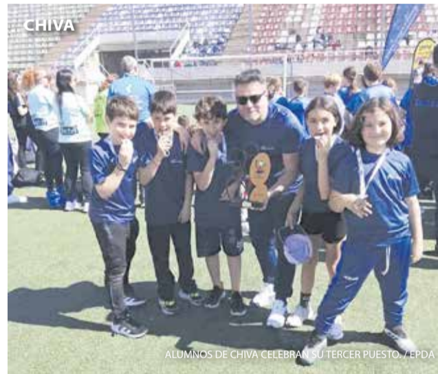
ALUMNOS DE CHIVA CELEBRAN SU TERCER PUESTO.

Un grupo de estudiantes de 6º de Primaria de Chiva ha conseguido el tercer puesto en el Campeonato Autonómico de Orientación de Centros Escolares, en el que participaron numerosos colegios de toda la Comunitat Valenciana. Durante la prueba, los jóvenes pusieron a prueba su capacidad de orientación, estrategia y trabajo en equipo, demostrando habilidad para moverse por el terreno y colaborar eficazmente.