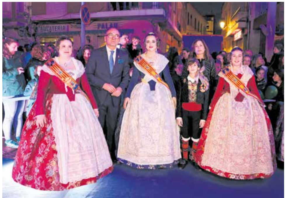
Diversos instants de la Crida de les Falles 2026 de Benaguasil.