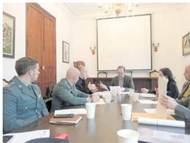
Fotografía durante la Comisión de Seguridad.

Por parte del consistorio asistieron el alcalde, el teniente de alcalde y la secretaria municipal.