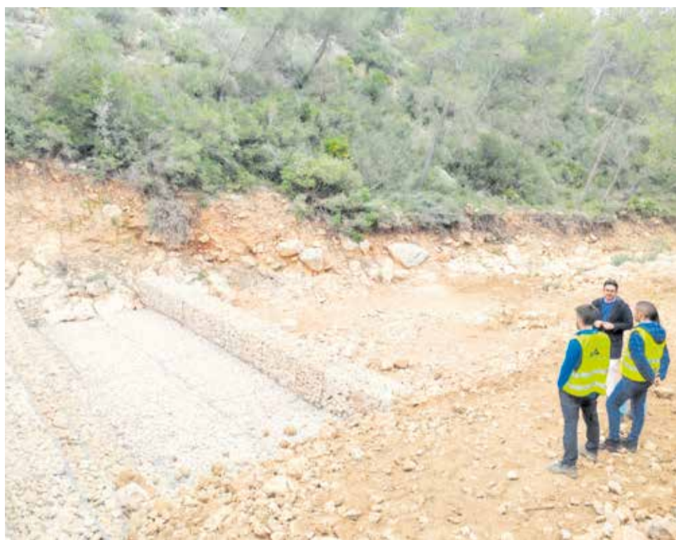
Estructura de protecció davant fenòmens meteorològics a La Llomaina.