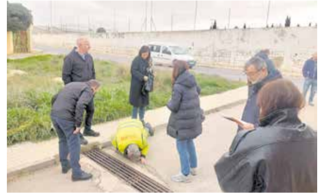
Visita conjunta a la zona de actuación.