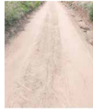
Camí a Casinos.

Casinos, amb esta actuació, té com a objectiu la reparació i millora del camí d'accés per als vianants al jaciment ibèric del Cabezo del Castellar. Un enclavament