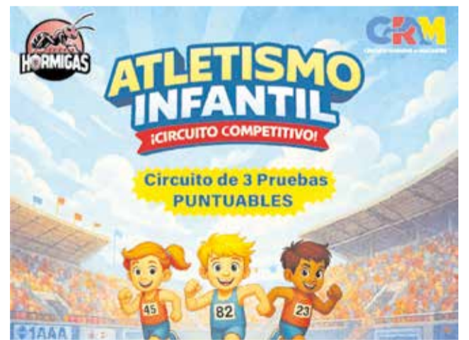
Cartel informativo del evento.

El evento contempla distintas categorías según el año de nacimiento. La categoría A1, de carácter no competitivo, está dirigida a nacidos entre 2020 y 2023. Por su parte, la categoría C1 (Benjamín) incluye a los nacidos en 2018 y 2019; la categoría D (Alevín), a los nacidos en