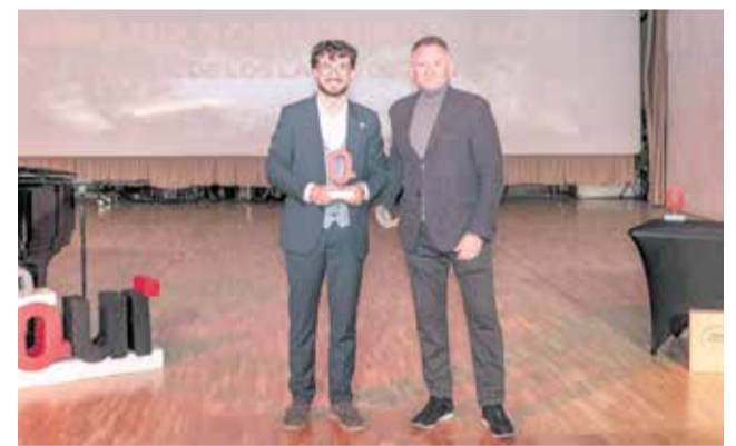
SOSTENIBILIDAD: Al Parque de los Lagos de Zarra, por su labor de recuperación histórica.

nicipio por promover su patrimonio y dinamizar la vida cultural local.