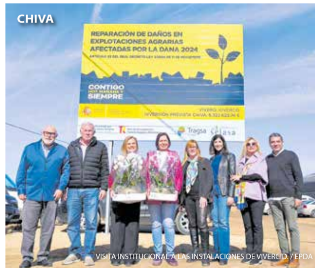
VISITA INSTITUCIONAL A LAS INSTALACIONES DE VIVERCID.

Un grupo de estudiantes de 6º de Primaria de Chiva ha conseguido el tercer puesto en el Campeonato Autonómico de Orientación de Centros Escolares, en el que participaron numerosos colegios de toda la Comunitat Valenciana. Durante la prueba, los jóvenes pusieron a prueba su capacidad de orientación, estrategia y trabajo en equipo, demostrando habilidad para moverse por el terreno y colaborar eficazmente.