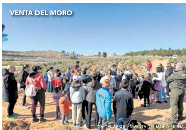
VENTA DEL MORO