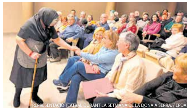
REPRESENTACIÓ TEATRAL DURANT LA SETMANA DE LA DONA A SERRA.

El Club de Lectura de Serra va celebrar el passat 9 de març el seu 10é aniversari amb una sessió de lectura molt especial, que va reunir a les persones que formen part d'esta gran família lectora per comentar l'obra 'La cabeza perdida de Damasceno Monteir'.