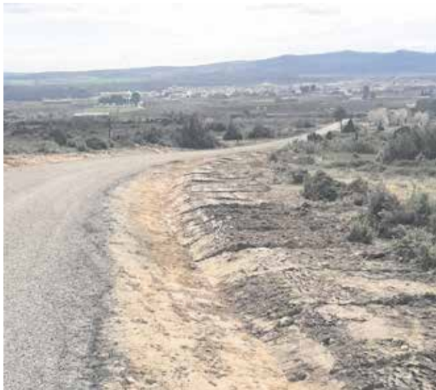
Inicio de los trabajos en el acceso a El Molón.

La actuación tiene como objetivo reforzar la seguridad vial y facilitar la llegada de visitantes, especialmente de grupos organizados y autobuses. Para ello, los trabajos contemplan el asfaltado completo del firme, la construcción y mejora de cunetas para optimizar el drenaje de aguas pluviales y la adecuación de la zona de aparcamiento, permitiendo así una mejor maniobra y es-