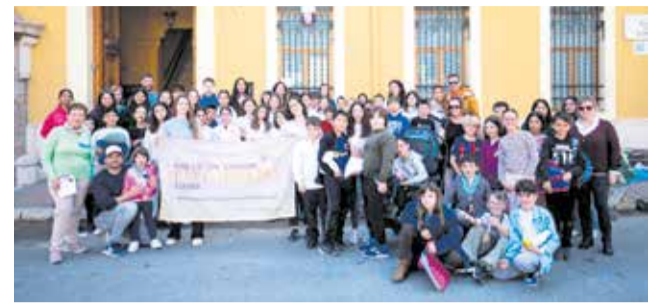
Participantes en el mercado solidario.