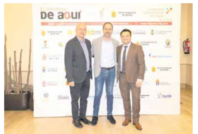
Autoridades e invitados posan en el photocall de los V Premios de El Periódico de Aquí Comarcas de Interior celebrados en Buñol.