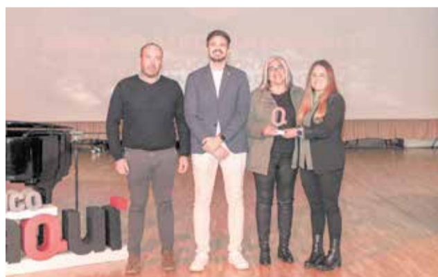
MEDIOAMBIENTE: A la M.I. Tierra del Vino, por su campaña de educación ambiental.