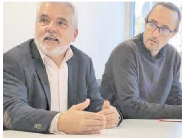
Verdeguer en su visita al Hospital de Manises.

El proyecto también contempla mejoras en las instalaciones, con una sala de espera más amplia y un apar-