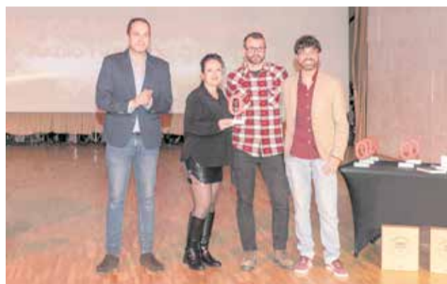
COMUNICACIÓN: A Radio TV Buñol, por su compromiso con el periodismo de proximidad.