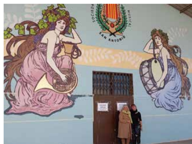
Nuevo mural en San Antonio.