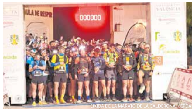
EIXIDA DE LA MARATÓ DE LA CALDERONA.

Serra va acollir el passat 1 de març la onzena edició de la Marató de la Calderona, una cita esportiva que va reunir més de 500 corredors i corredores amb eixida i meta a la plaça de la Font i va omplir el municipi de gran ambient esportiu.