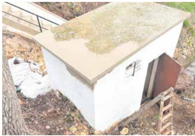
Trabajos de desbroce en Ayora.

La ayuda concedida incluye actuaciones en la Modalidad A.1.2 — Actuaciones silvícolas de apoyo y restauración del potencial forestal —, centradas en la mejora del estado de las masas forestales y la reducción del riesgo de incendios mediante desbroces, podas selectivas y otras labo-