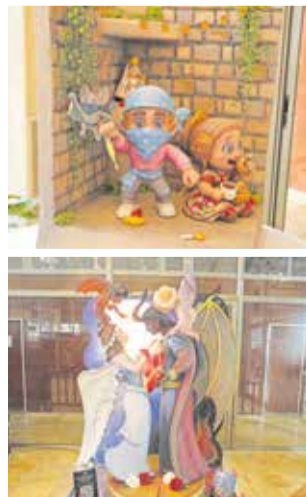
Ninots indultats.

Després del lliurament d'estos guardons es van donar a conèixer els premis al millor ninot indultat, que en les dos categories van ser també per a la comissió del Pilar, consolidant el seu protagonisme en esta edició.