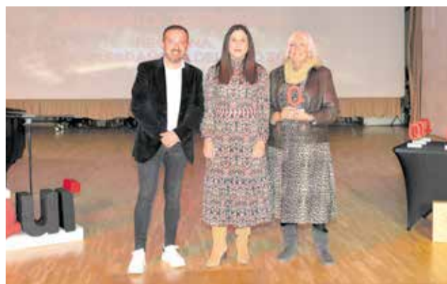
TURISMO: A Requena, por ostentar el título de Ciudad Española del Vino 2026.