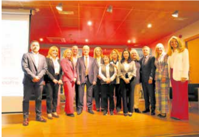
Autoridades en el foro organizado por Mapfre.

Uno de los principales diagnósticos compartidos en el foro fue la urgencia de frenar el éxodo de población joven y atraer nue-