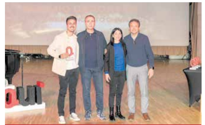
DEPORTES: Al Club Baloncesto Chiva, por el 15 aniversario de su sección Escuela.