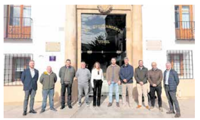
Representantes de empresas de Nuevo Tollo.

El proceso de constitución ha sido conducido por la empresa Gestión de Áreas Industriales by Ro-