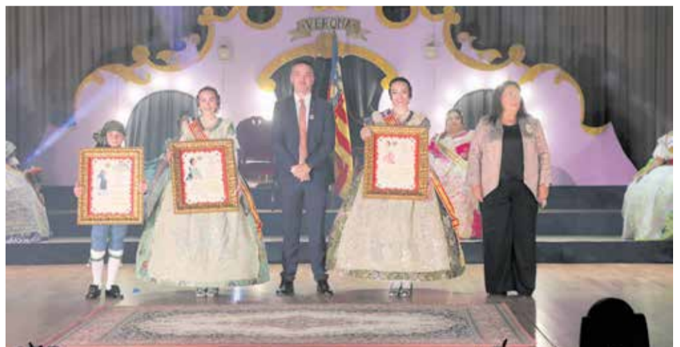
Exaltació de les Falleres Majors i el President Infantil de Lliria 2026.