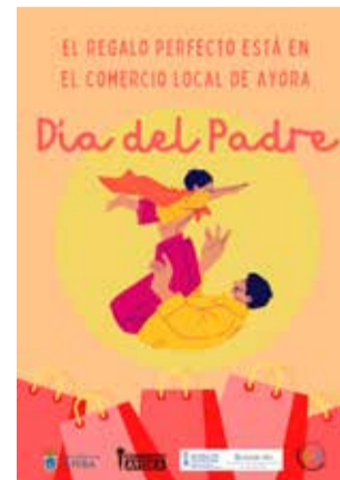
Campaña de Ayora.

Los comercios interesados en participar pueden recoger el material promocional en el Ayuntamiento, sumándose así a una iniciativa que busca dinamizar la actividad co-