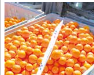
Cítrics incautats.