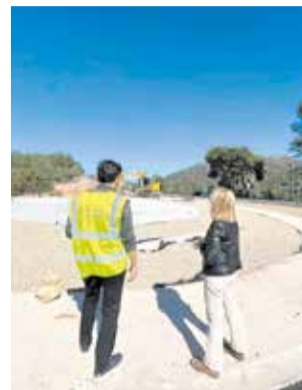
Visita als treballs.

Els treballs, que s'han vist endarrerits a conseqüència de les pluges dels últims mesos, es troben actualment molt avançats. Segons la direcció d'obra, la previsió és que la rodona puga estar oberta al trànsit abans de la festivitat de Sant Josep, encara que es podran produir alguns talls puntuals mentre es completen els últims detalls. La finalització completa de l'actuació està prevista per a finals del mes de març.