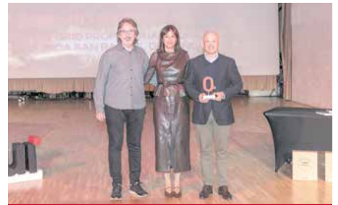
ESPECIAL: Al Conservatorio de Música de Buñol por su 50 aniversario.

Se sortearon tres lotes de vino de Coviñas, dos libros por cortesía de la librería Doña Leo, dos ejemplares del libro El oficio del lance de Emili Piera y un vuelo doble por cortesía de Air Nostrum. La velada terminó con la foto de familia de todos los galardonados y un vino de honor