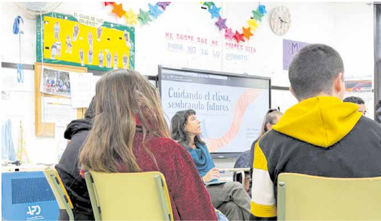
Una de las sesiones en el Centro de Educación Especial Virgen de la Esperanza de Cheste.