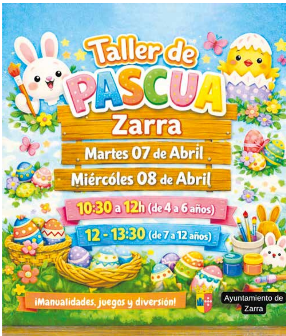
Cartel del Taller de Pascua organizado en el municipio de Zarra.