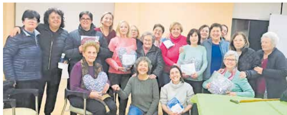
Participants en una de les activitats amb motiu del 8M a Benissanó.