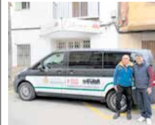
Vehicle municipal. / EPDA