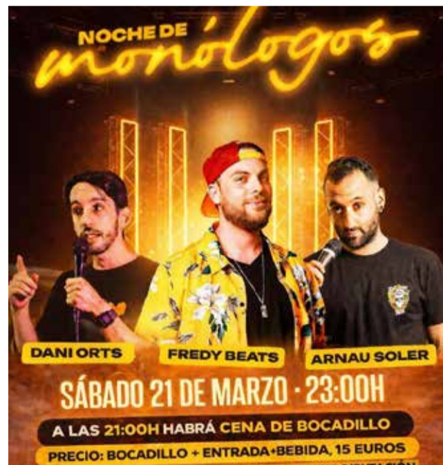
Cartel de la jornada compartido por la Comisión.

Tras la cena, la velada continuará con una sesión de bingo para amenizar la es- pera hasta el inicio del espectáculo.