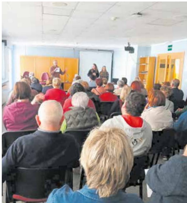
Presentación del anteproyecto del nuevo Punto de Atención Diurna de Titaguas celebrada en el centro social.

El proyecto nace con el objetivo de ofrecer un espacio de apoyo y acompañamiento para los vecinos de mayor edad, así como para sus familias. Según explicaron desde el consistorio, la iniciativa busca responder a una realidad cada vez más presente en los municipios rurales: la necesidad de contar con servicios que permitan a las personas mayores mantener su auto-