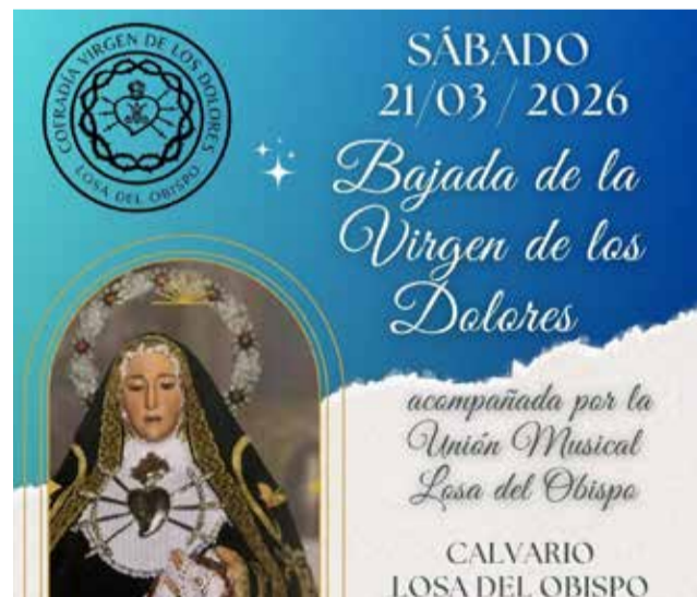
Cartel compartido por la cofradía.

Desde la organización invitan a vecinos y vecinas a reunirse en el Calvario a la hora indicada para participar en la romería y acompañar a la Virgen durante el tradicional trayecto hasta el templo.