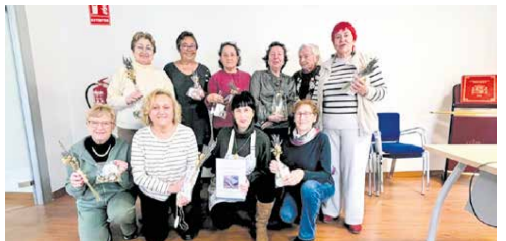
Mujeres de Andilla participan en el taller 'Corazones que florecen'.