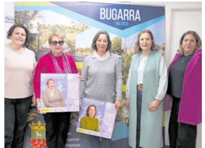
Presentación de 'Mujeres que hacen pueblo'.

El documental destacó el esfuerzo, la dedicación y la implicación de tantas mujeres que, desde distintos ámbitos, contribuyen cada día a mantener Bugarra como un pueblo vivo y lleno de identidad. La iniciativa sirvió para visibilizar el trabajo cotidiano de quienes hacen posible que la comunidad funcione y crezca, y para reflexionar