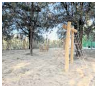
Zona de juego.

El parque de juegos infantiles ha sido sufragado por el Ministerio de Juventud con una inversión de 33.093,02 euros, mientras que las mesas de picnic adaptadas y las