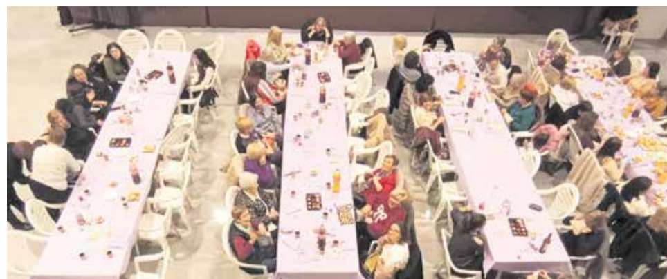
Cena de mujeres en el local multiusos de Benagéber.