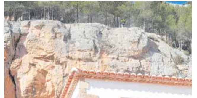
Operarios en la Loma de San Cristóbal.

Los trabajos han consistido en el saneo de bloques rocosos inestables y en la instalación de distintos sistemas de contención y protección adaptados a la compleja orografía del terreno.