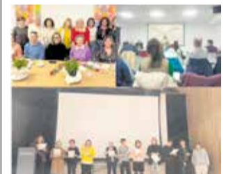
Actos del 8M en Villar.