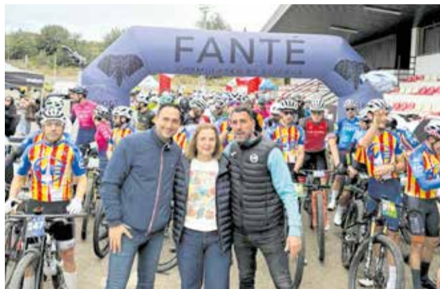
Prueba del Circuito MTB en Bugarra.

Este tipo de eventos deportivos contribuyen a consoli-