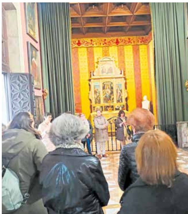
Varios instantes de la salida a Valencia y de la lectura del manifiesto en Chulilla.

Tras las visitas culturales, las asistentes presenciaron la tradicional mascletà de las Fallas de Valencia y posteriormente compartieron una comida de hermandad, poniendo así el bro-