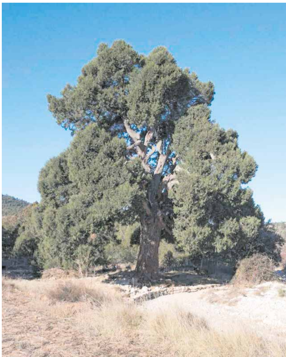
El Sabinar de Las Blancas de la Puebla de San Miguel.

El bosque no responde al arquetipo de masa cerrada y frondosa, sino que presenta un aspecto abierto y adeshado, con praderas frescas entre árboles retorcidos y monumentales. Esa fisonomía es fruto de siglos de