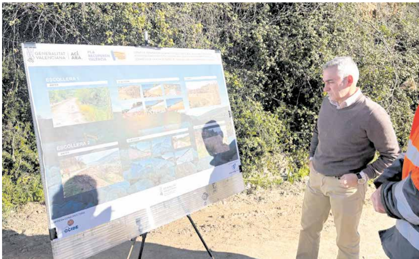
El conseller de Agricultura, Miguel Barrachina, visita el camino rural de la Acequia de Chelva en Tuéjar.

► EL CONSELLER DE AGRICULTURA, MIGUEL BARRACHINA, VISITA TUÉJAR, DONDE SE HA INVERTIDO CERCA DE 1 MILLÓN DE EUROS