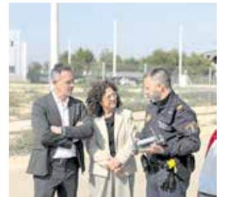
Nuevo dron.