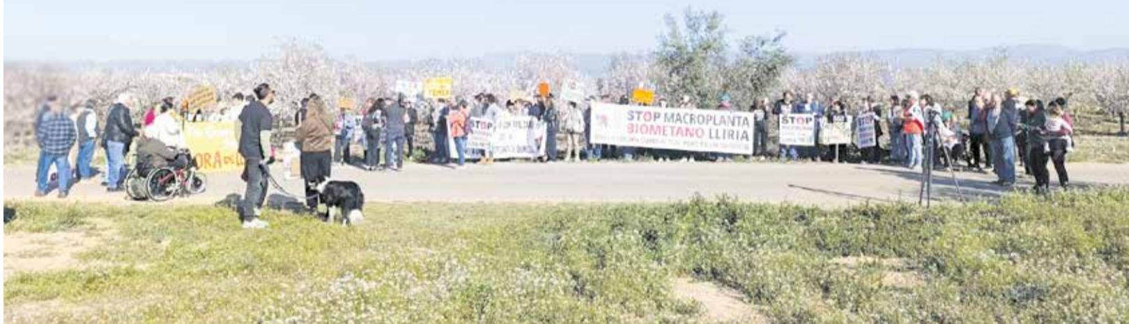
Movilización de la Asociación Ciudadana Camp de Túria-Serranía frente a los terrenos donde se ubicará la instalación.

► LA ENTIDAD PROMOTORA DEL PROYECTO INICIA LOS TRABAJOS PESE A LA MOVILIZACIÓN VECINAL