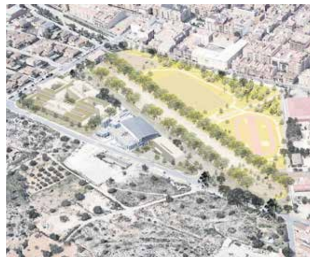
Ubicación del nuevo centro de salud de Pacadar.

cado y el edificio mantiene las mismas dependencias. Contrariamente, sí se han conseguido avances en la prestación asistencial. De 10 médicos se ha pasado a 14. La plantilla actual se completa con 14 enfermeras para adultos y tres en pediatría, cuatro pediatras en Riba-roja, un pediatra en Loriquilla, dos matronas y una trabajadora sociosanitaria.