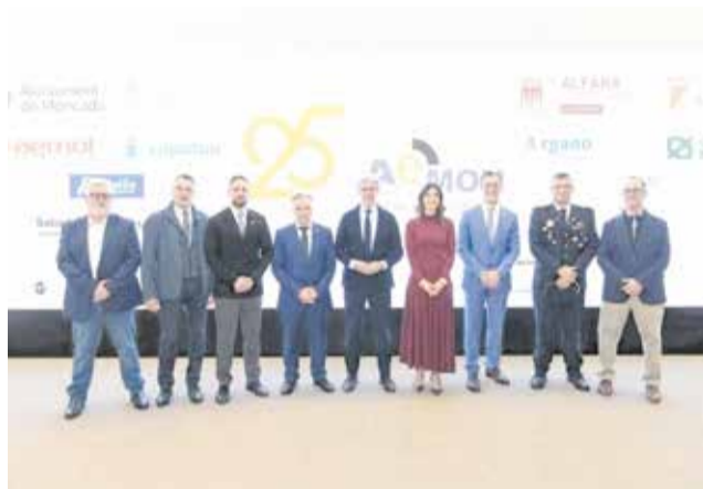
Autoridades y empresarios de Náquera.

La conmemoración reunió a representantes del ámbito empresarial, social e institucional, consolidando el papel de AEMON como entidad de referencia tras 25 años de trayectoria basada en la cooperación entre empresas, la profesionalización del sector y la mejora continua de las áreas industriales.