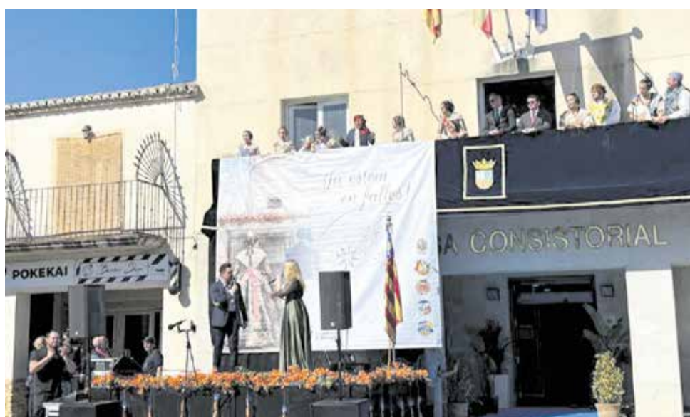
Crida de las Fallas de San Antonio de Benagéber.

De esta forma, Loriguilla vive unas Fallas de transición en las que tradición y renovación se dan la mano, con el objetivo de seguir manteniendo viva una de las fiestas más representativas de la cultura valenciana.