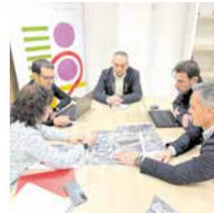
Reunión con la ATMV.

Además, San Antonio de Benagéber ya cuenta con un punto de venta y recarga de la tarjeta SUMA de transporte,