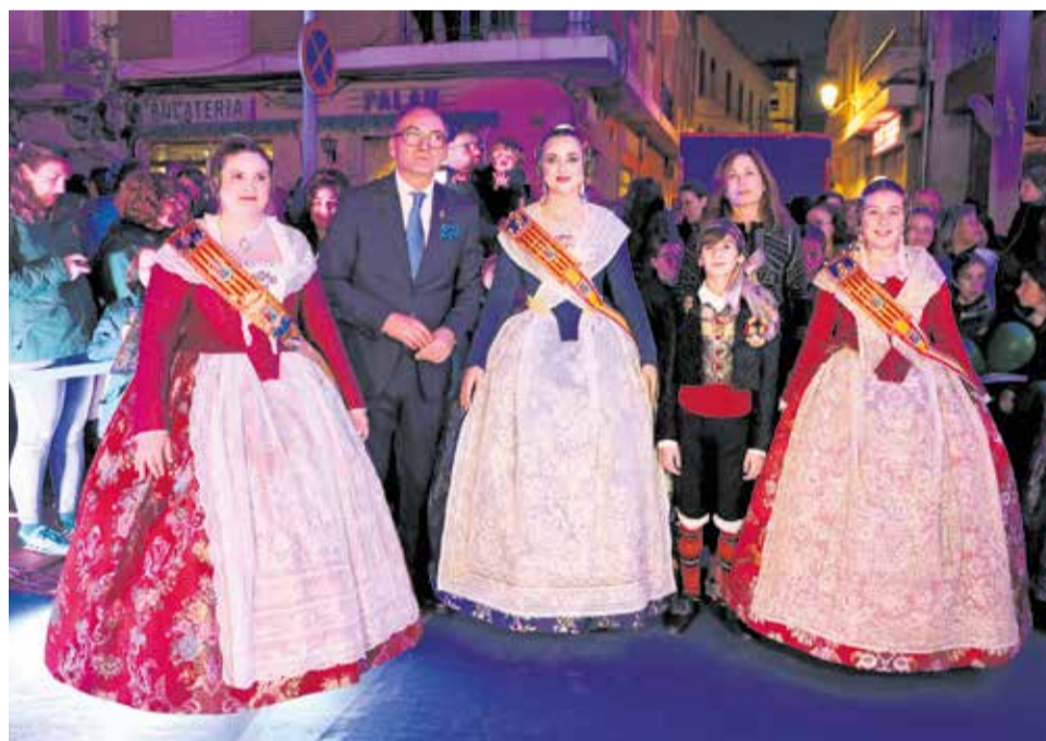
Diversos instants de la Crida de les Falles 2026 de Benaguasil.