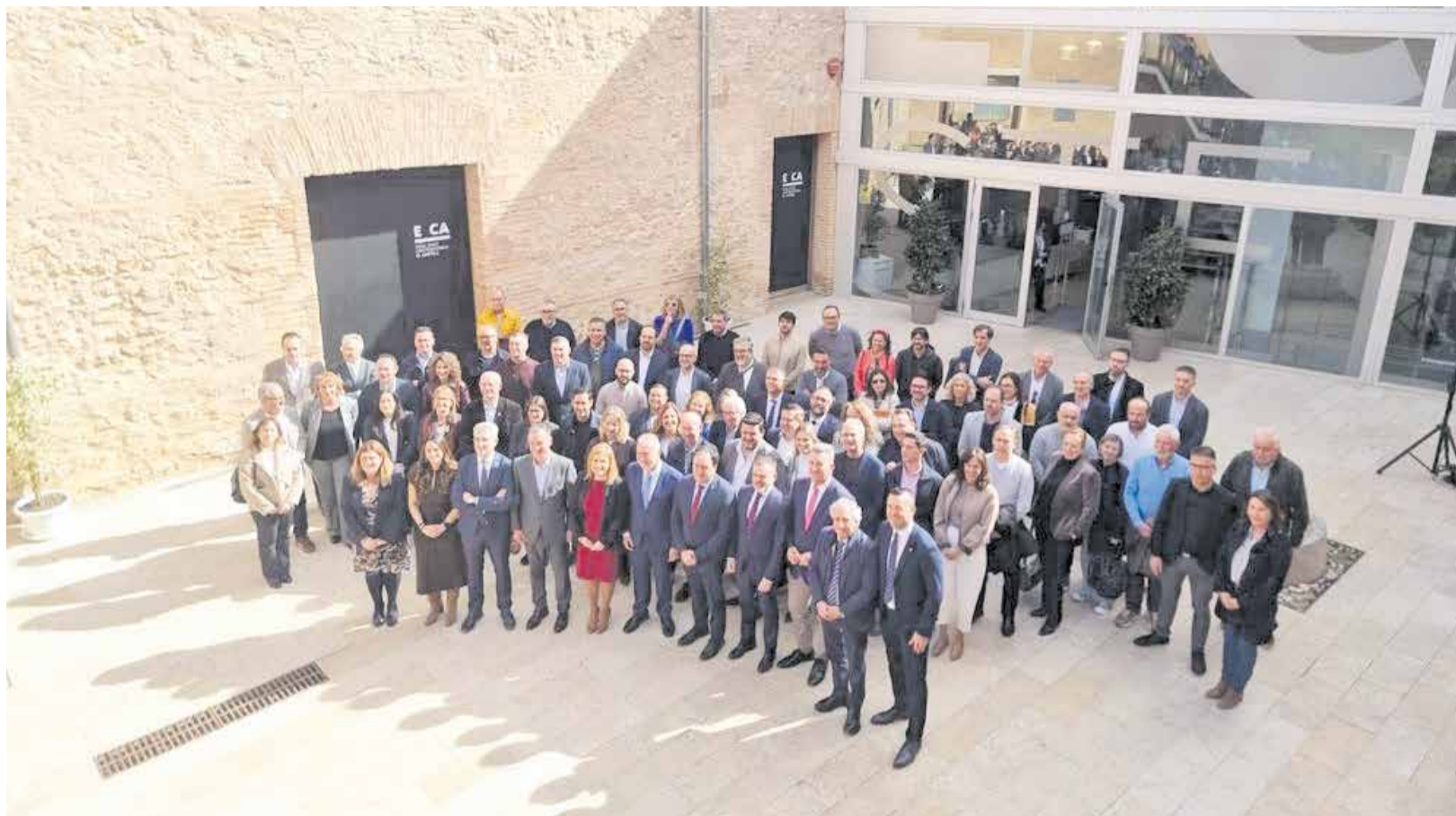
Autoritats a la primera Comissió Mixta de la dana celebrada al Castell de Riba-roja de Túria.

► L'OBJECTIU DE L'ORGANISME ÉS PLANIFICAR, IMPULSAR I COORDINAR LES ACTUACIONS DE LES ADMINISTRACIONS PÚBLIQUES