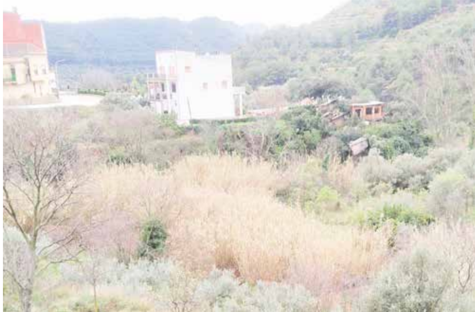
Barranco del Carraixet a su paso por el municipio de Gátova.