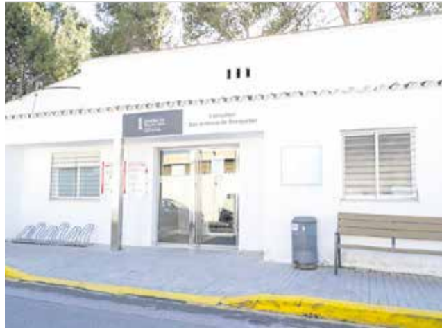
Actual consultorio de San Antonio de Benagéber.

El consultorio, adscrito al Departamento de Salud Arnau Vilanova-Llíria, se levantará en la calle Nieva 4, sobre una parcela de 1.390 metros cuadrados cedida por el Ayuntamiento, en una zona céntrica que facilitará el acceso a los vecinos. La infraestructura se adapta al crecimiento del muni-