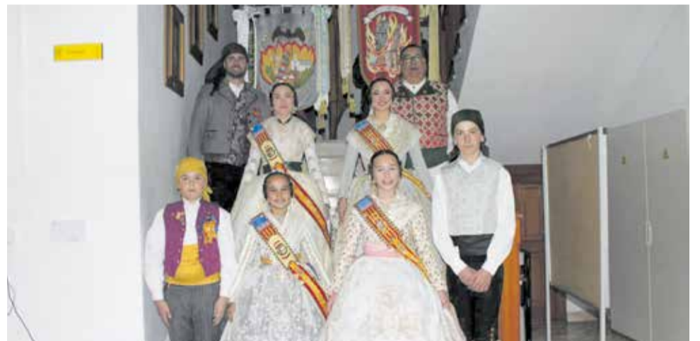
Representantes de las Fallas de Náquera en la Crida 2026.