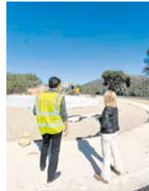
Visita als treballs.

Els treballs, que s'han vist endarrerits a conseqüència de les pluges dels últims mesos, es troben actualment molt avançats. Segons la direcció d'obra, la previsió és que la rodona puga estar oberta al trànsit abans de la festivitat de Sant Josep, encara que es podran produir alguns talls puntuals mentre es completen els últims detalls. La finalització completa de l'actuació està prevista per a finals del mes de març.