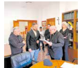
Visita institucional.

A lo largo de la jornada, el obispo recorrió distintas dependencias municipales, donde tuvo ocasión de saludar y conversar con el personal del Ayuntamiento, interesándose por el fun-