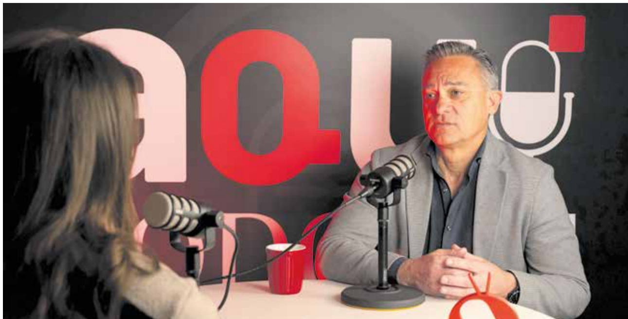
Un instante de la entrevista en el set de Aquí Podcast.

de San Antonio de Benagéber. Imagínate que un contenedor de basura lo pones para una finca y nosotros tenemos que ponerlo para tres chalets. Quiero decir, la gestión es mucho más cara y es más complicada. Aparte de que llegar al vecino cuesta mucho más