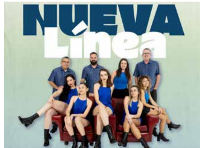
Integrantes de la Orquesta Nueva Línea.

La cita será a partir de las 23:00 horas en el Parc Municipal Benjamín March Civera, en el epicentro del municipio. Tras el concierto, la fiesta continuará con la sesión de DJ JAN, que pondrá el broche final a una noche