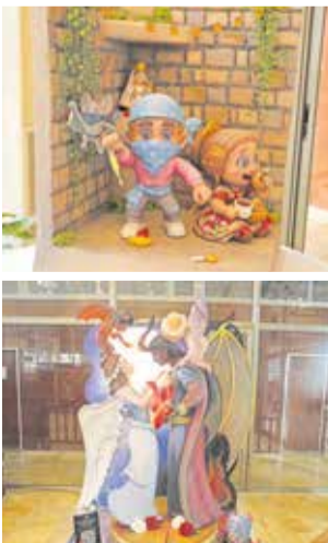
Ninots indultats.

Després del lliurament d'estos guardons es van donar a conèixer els premis al millor ninot indultat, que en les dos categories van ser també per a la comissió del Pilar, consolidant el seu protagonisme en esta edició.