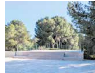
Escenari. / EPDA