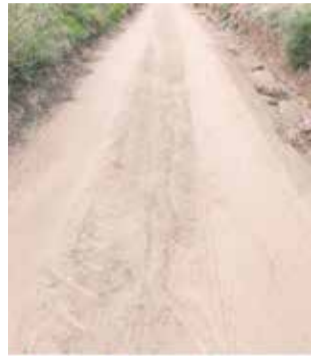
Camí a Casinos.

Casinos, amb esta actuació, té com a objectiu la reparació i millora del camí d'accés per als vianants al jaciment ibèric del Cabezo del Castellar. Un enclavament