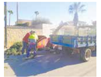
Treballs de recollida.