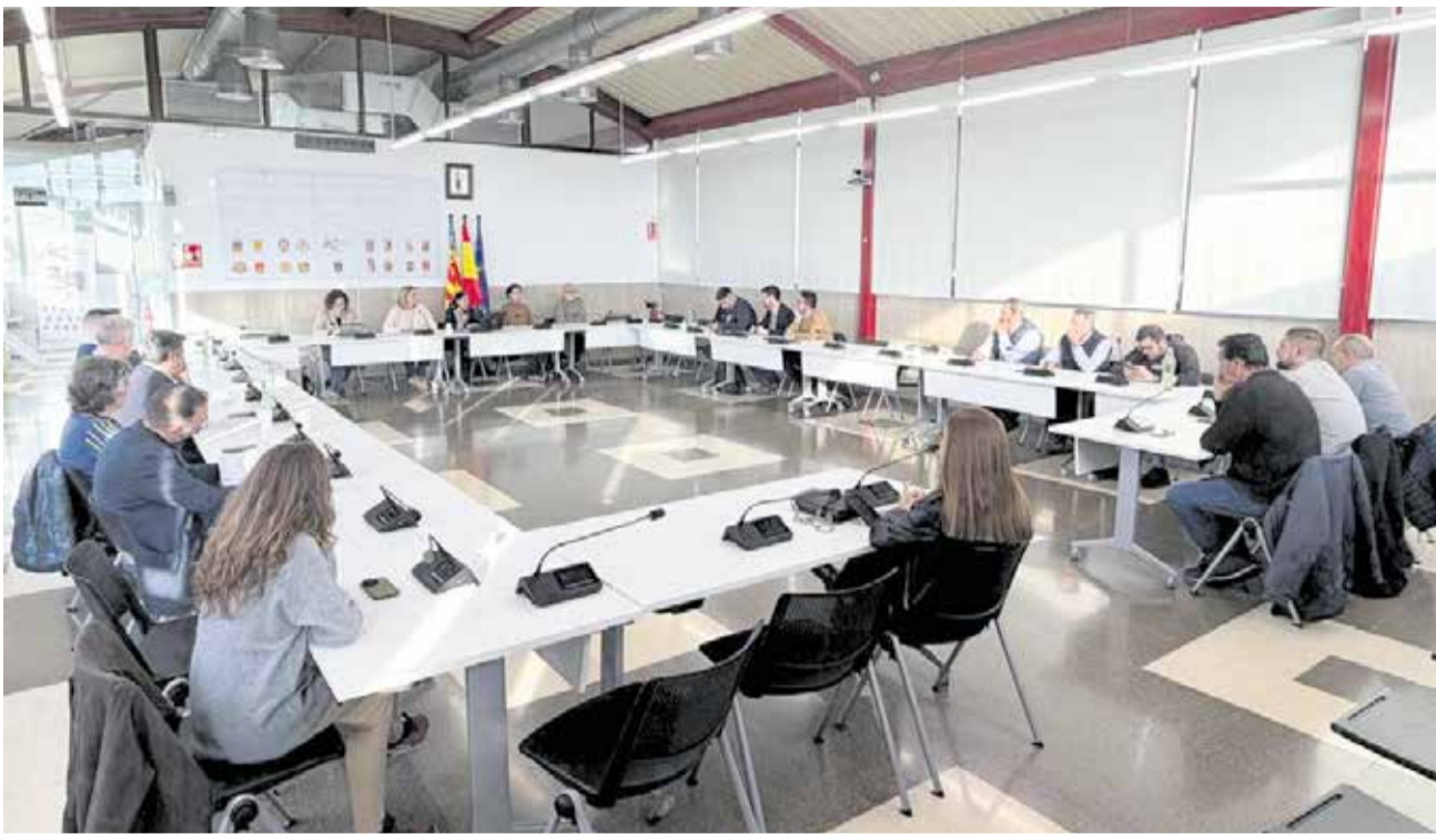
Plenari de març de la Mancomunitat Camp de Túria.