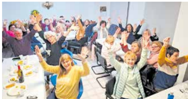
Actividad de la Semana de la Mujer en Náquera.

La programación, organizada en colaboración con la asociación Col·lectiu de Dones El Salt, ha contado con la implicación de su presidenta y de numerosas vecinas que han participado activamente en la preparación de las actividades. Durante toda la semana se han desarrollado propuestas pensadas por y para las mujeres, fomentando la convivencia, la partici-