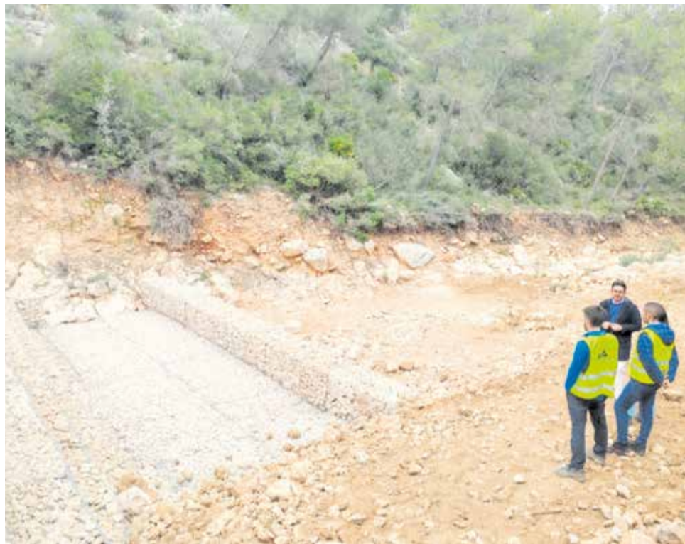
Estructura de protecció davant fenòmens meteorològics a La Llomaina.