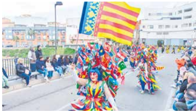
Tren faller de Vilamarxant.

El catàleg institucional d'actes de les 'Falles 2026' va començar el dissabte, 21 de febrer. Les tres comissions falleres desfilaren, acompanyades de la música i de la xerinoia, fins a les portes de l'ajuntament, on es van succeir els parlaments habituals d'este acte posteriorment a una interpretació artística molt emotiva per part