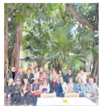
Actividad por el 8M.

Tanto las tertulianas como las asistentes a la charla del pasado 8 de marzo, donde el propio consistorio repartió una pu-