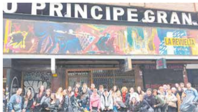
Viaje a Madrid para acudir La Revuelta.

El centro juvenil estará operativo para el uso y disfrute de