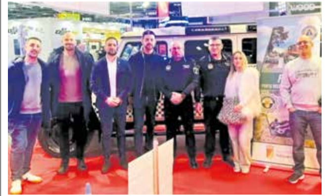
La Policía Local de Náquera en SICUR 2026.