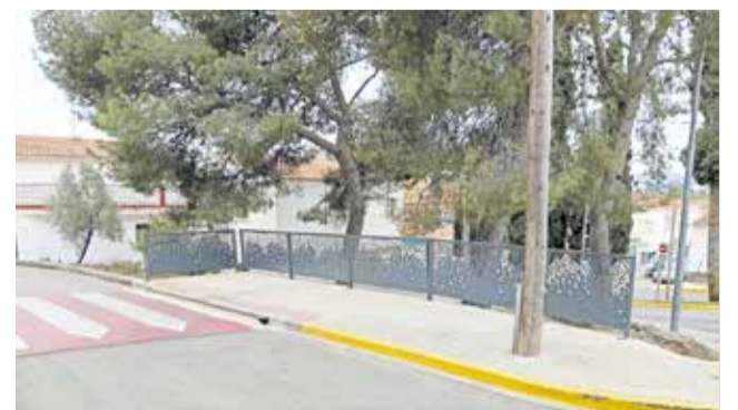
UNA DE LAS NUEVAS BARANDILLAS INSTALADAS EN LORIGUILLA.