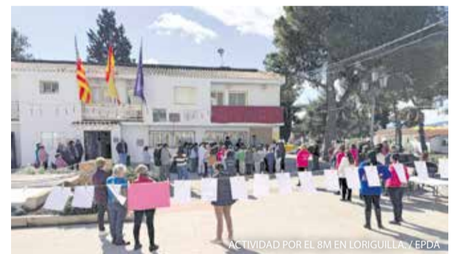
Loriguilla celebró recientemente la Semana de la Mujer con una programación de actividades y encuentros organizada para reconocer el papel de las vecinas del municipio en la sociedad.