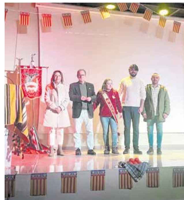
Cremà de la Falla Loriguilla a la izquierda y presentación de Tots a una veu a la derecha.

del municipio. Este año, sin embargo, las Fallas han dado un paso más con la creación de una segunda comisión, un hecho inédito en la historia del municipio y que refleja el crecimiento de esta población del Camp de Túria.