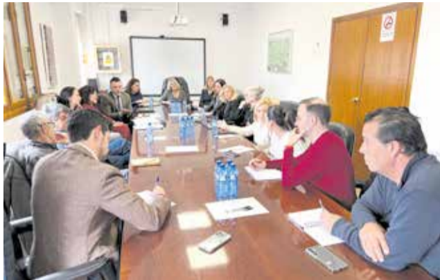
Reunió a l'Ajuntament de Bétera.

Segons es va informar en la reunió, el projecte de la depuradora serà publicat pròxi-