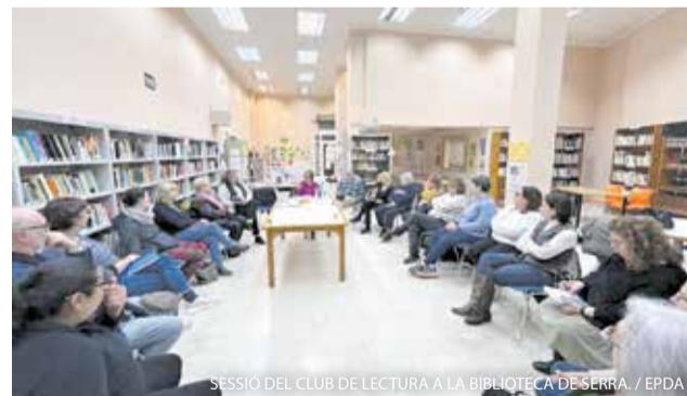
SESSIÓ DEL CLUB DE LECTURA A LA BIBLIOTECA DE SERRA.

Serra va acollir el passat 1 de març la onzena edició de la Marató de la Calderona, una cita esportiva que va reunir més de 500 corredors i corredores amb eixida i meta a la plaça de la Font i va omplir el municipi de gran ambient esportiu.