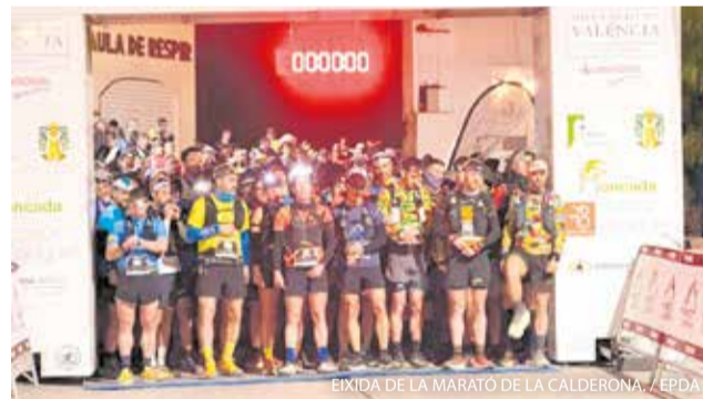
EIXIDA DE LA MARATÓ DE LA CALDERONA.

Serra va acollir el passat 1 de març la onzena edició de la Marató de la Calderona, una cita esportiva que va reunir més de 500 corredors i corredores amb eixida i meta a la plaça de la Font i va omplir el municipi de gran ambient esportiu.