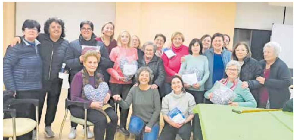
Participants en una de les activitats amb motiu del 8M a Benissanó.