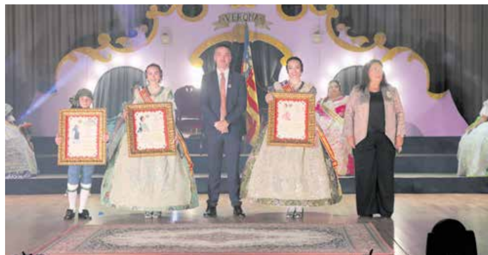
Exaltació de les Falleres Majors i el President Infantil de Llíria 2026.