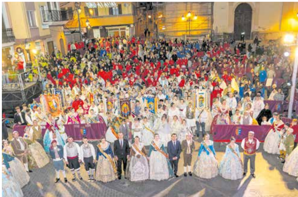
La Plaça de l'Ajuntament de Riba-roja de Túria abarrotada en la Crida 2026.

La programació fallera continuarà els pròxims dies amb la visita a la Basílica, el lliurament de premis als monuments fallers i la tradicional ofrena de flors a la Mare de Déu. Finalment, el 19 de març tindrà lloc la missa en honor a Sant Josep, que posarà el punt final a les celebracions.