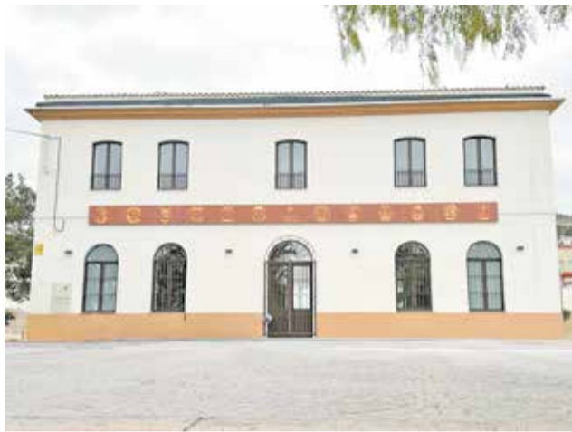
Nuevo museo fallero de Benaguasil.

En esta edición, Benaguasil ha sido distinguido en la categoría de 'Fiestas y Tradiciones' por su proyecto de recuperación de la antigua estación de Renfe. Este reconocimiento destaca la rehabilitación de un edificio histórico del municipio, manteniendo su identidad original y transformando las antiguas instalaciones