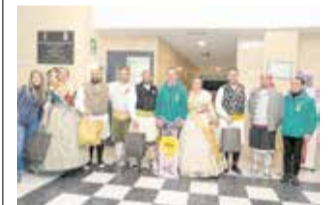
Presentació. / EPDA