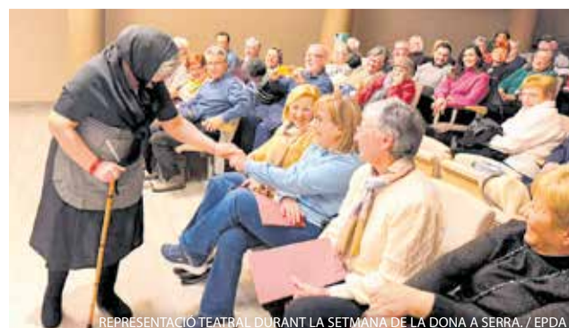
REPRESENTACIÓ TEATRAL DURANT LA SETMANA DE LA DONA A SERRA.

El Club de Lectura de Serra va celebrar el passat 9 de març el seu 10é aniversari amb una sessió de lectura molt especial, que va reunir a les persones que formen part d'esta gran família lectora per comentar l'obra 'La cabeza perdida de Damasceno Monteir'.