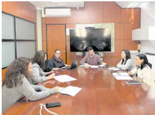
Reunión en el ayuntamiento de la Pobla.

Entre las medidas contempladas se encuentran las ayudas destinadas a comercios afectados por obras municipales, las subvenciones para