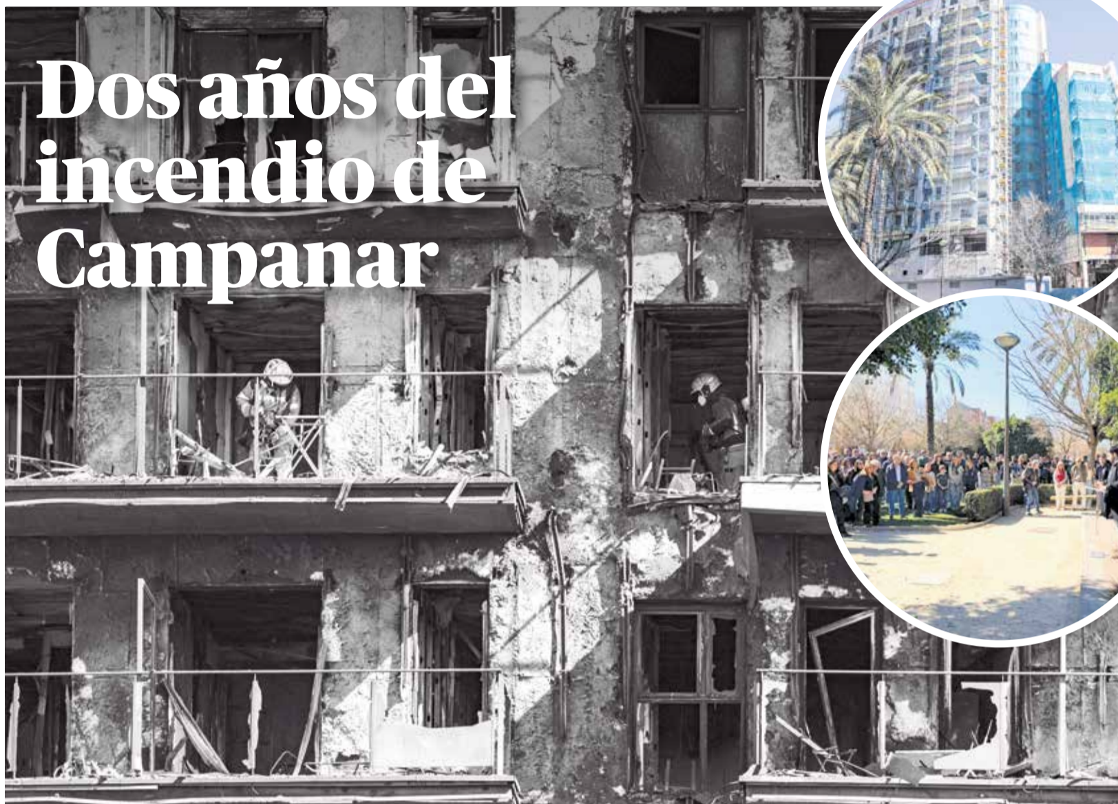
El edificio de Campanar tras el incendio, en su estado actual tras la rehabilitación y el homenaje del 22 de febrero de 2026.