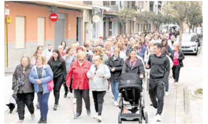
Veïnes i veïns marxen per la igualtat a Alberic.