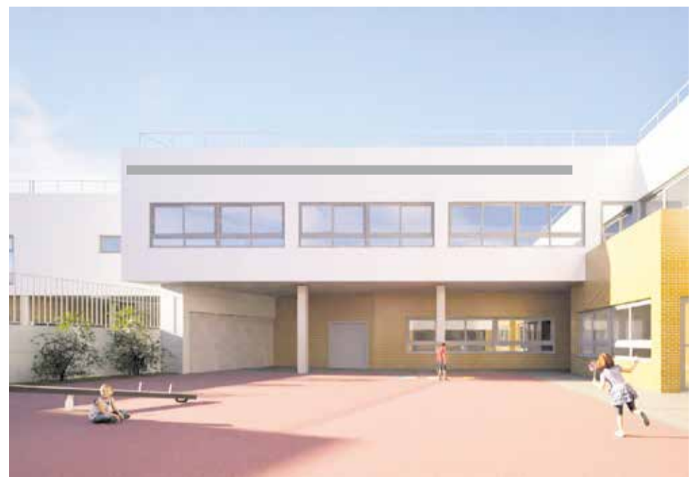
Así quedará el futuro colegio público Blasco Ibáñez de Massalavés.

Asimismo, ha querido destacar la importancia de la colaboración institucional que ha permitido avanzar en el proyecto. “Gracias al Plan Edificant de la Gene-