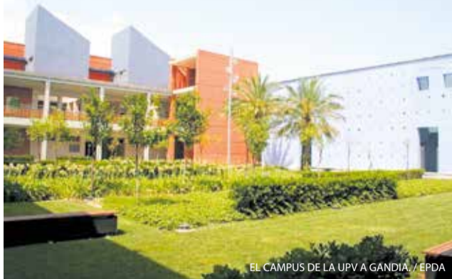
EL CAMPUS DE LA UPV A GANDIA.

El Campus de Gandia de la UPV estrenarà el curs 2026-2027 el Grau en Empresa i Tecnologia Digital, que combinarà gestió empresarial i habilitats tecnològiques per formar professionals en transformació digital. Els graduats podran treballar com a analistes de dades, consultors o emprenedors amb visió estratègica i capacitat tècnica.