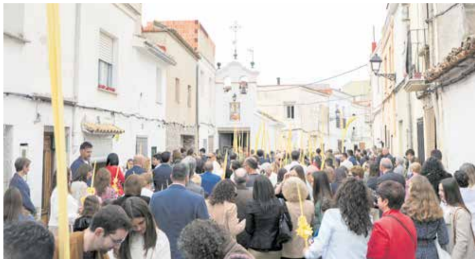
Diversos instants de la Setmana Santa a Alberic.

tes més peculiars de la festa alberiquenya, el Concurs de l'Encisam. Així, la pujada del calvari cap a l'ermita de Santa Bàrbara s'omplirà de visitants els minuts previs a l'entrega de trofeus.