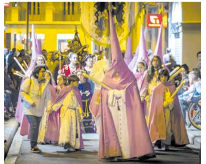
Una processó de la Setmana Santa Marinera.

El llibre oficial, amb 16 articles dedicats a aprofundir en la història i singularitats de la festa, posa especial atenció en aniversaris destacats com els 175 anys de la Germandat del Santíssim Crist del Salvador i diversos centenaris de confraries històriques.