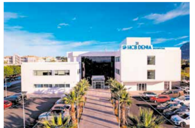
El Hospital HCB Dénia.

Con este modelo asistencial, HCB Dénia refuerza su compromiso con la sanidad privada de la comarca, ofreciendo respuestas cuando no se puede esperar y consolidando sus Urgencias como un servicio de referencia para la población local y extranjera de la Marina Alta.