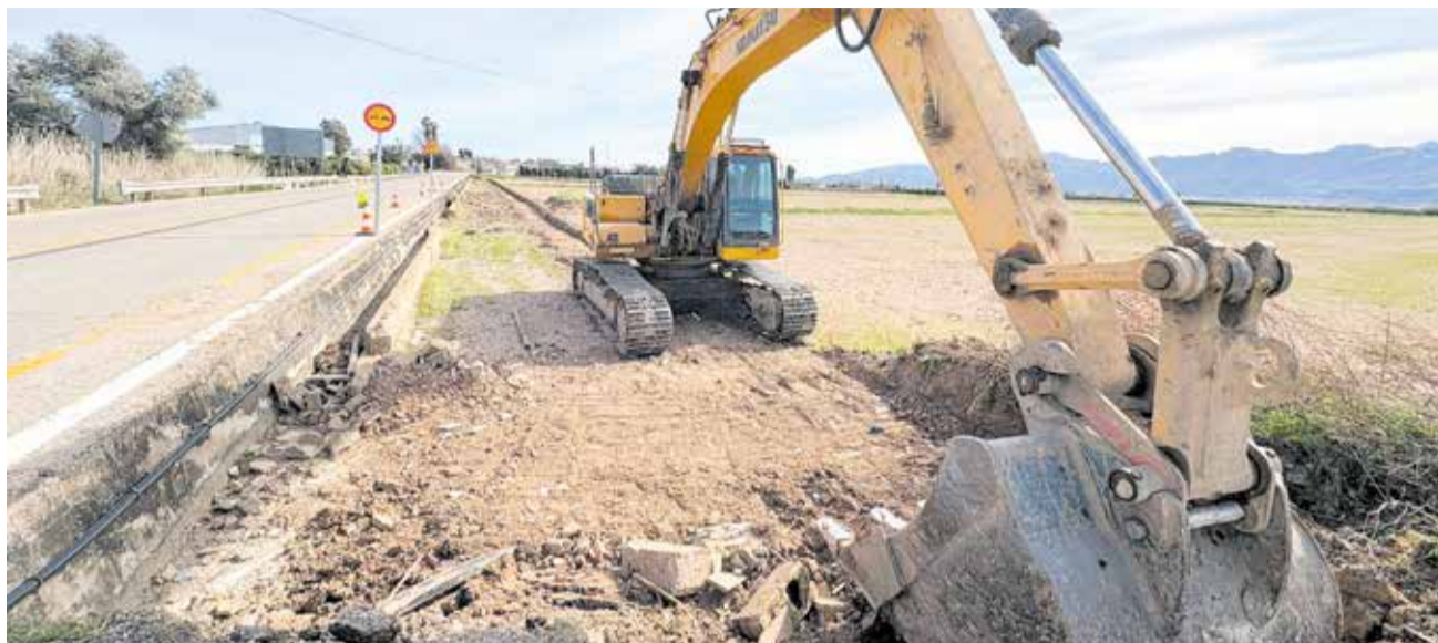
Tram per on passarà la nova via ciclopeatonal.

Les obres es duen a terme principalment a Fortaleny i al voltant del pont d'Alfons XIII, prolongant-se fins a l'àmbit urbà de Sueca. El projecte in-