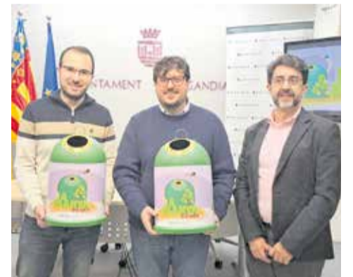
Representants en la presentació.

La iniciativa forma part d'una competició entre tretze municipis fallers de la Comunitat Valenciana que busquen augmentar la recollida de vidre durant la setmana fallera. Per facilitar la participació, els con-