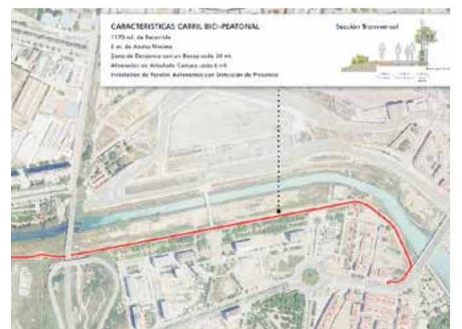
El itinerario de 1,3 km incluirá una pasarela.

La inversión supera los dos millones de euros, cofinanciados por el Ayuntamiento y la Generalitat, que aporta un millón. El proceso de adjudicación se prolongará unos cuatro meses y las obras tendrán un plazo de ejecución de ocho. Con esta actuación, València amplía su red de movilidad sostenible y avanza en la integración definitiva del río con el mar.