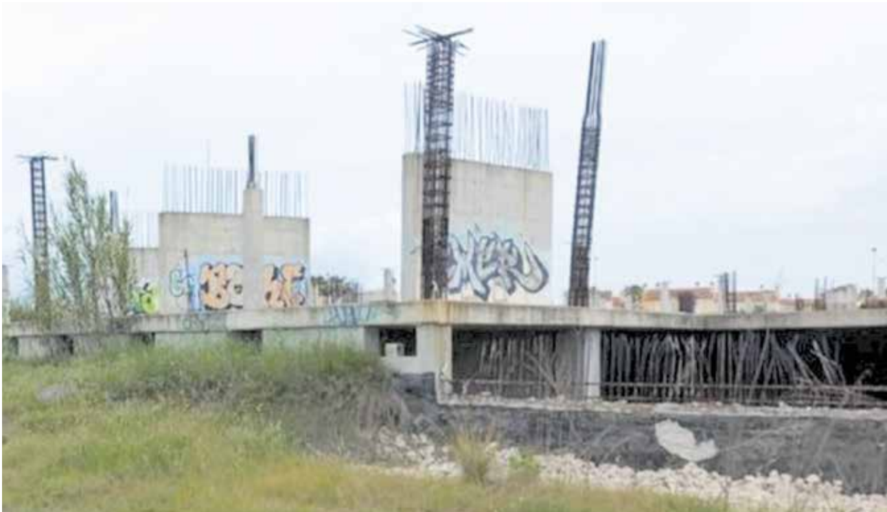
Les obres abandonades del Centre Ecumènic el Salvador, a Oliva.