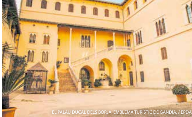
EL PALAU DUCAL DELS BORJA, EMBLEMA TURÍSTIC DE GANDIA.

Potenciar el turisme de Gandia més enllà de la platja i el Palau Ducal. És el que demana el PP després de constatar un descens del 5,1 % en el nombre de viatgers entre gener i juliol de 2025 i una caiguda del 16 % en la rendibilitat per habitació. La formació diu que el turisme "viu de les rendes" i patix estancament i estacionalitat. "No hi ha estratègia".