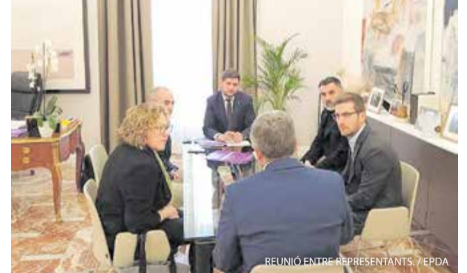
REUNIÓ ENTRE REPRESENTANTS.

L'Ajuntament ha signat un acord amb tres bancs per facilitar el finançament del 100% en la compra de la primera vivenda, especialment per a menors de 45 anys, gràcies a avals de l'ICO i l'Institut Valencià de Finances. La mesura se suma a bonificacions de l'ICIO, parcel·les per construir vivenda, compra de pisos a Sareb i ajudes a propietaris per posar habitatges en lloguer o reformar-los.