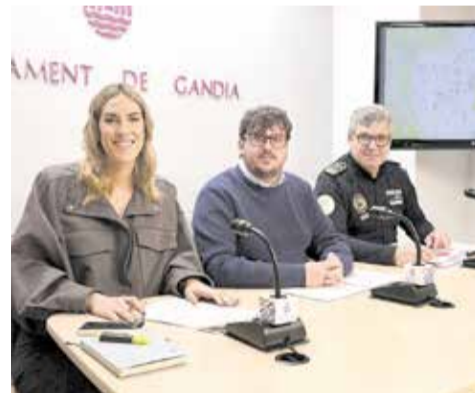
Presentació del bàndol.

A més, s'han creat dos zones de baixa intensitat sonora al Parc Baladre i al Parc de l'Alqueria de Martorell. Aquests espais estaran pensats especialment per a persones amb sensibilitat al soroll i també per a mascotes, i compten amb senyalització específica i presència informativa de la Policia Local.