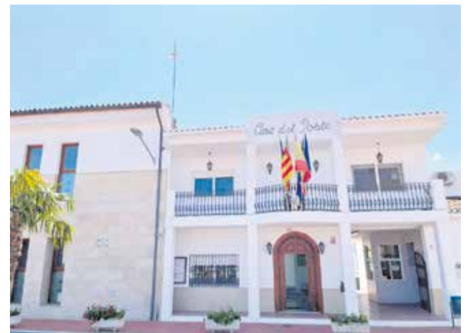
Façana de l'ajuntament de Beniflà.

L'alcalde, Borja Gironés, ha destacat que "l'objectiu d'estes ajudes, finançades amb càrrec a la partida d'Ajudes Socials del pressupost municipal, és facilitar la mobilitat i la independència de la ciutadania, per a poder desplaçar-se allà on calga sempre que ho necessiten".