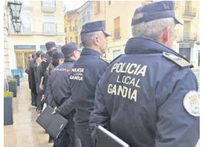
Diversos agents de la Policia Local de Gandia.