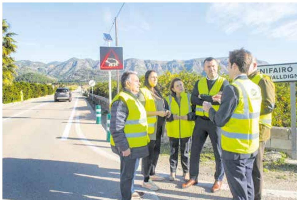
Visita d'autoritats i tècnics a un dels llocs on s'han instal·lat els sensors.