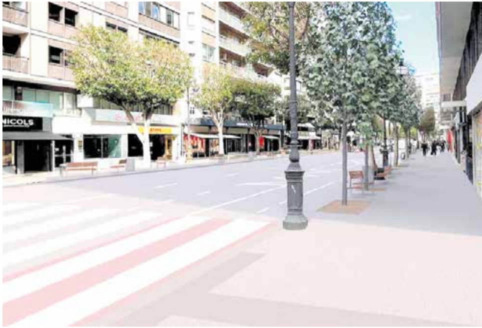
El projecte per al carrer Colón dissenyat per l'Ajuntament de València.

La reforma inclou també una reordenació de la mobilitat: l'estació de Valenbisi es traslladarà a l'espai actual