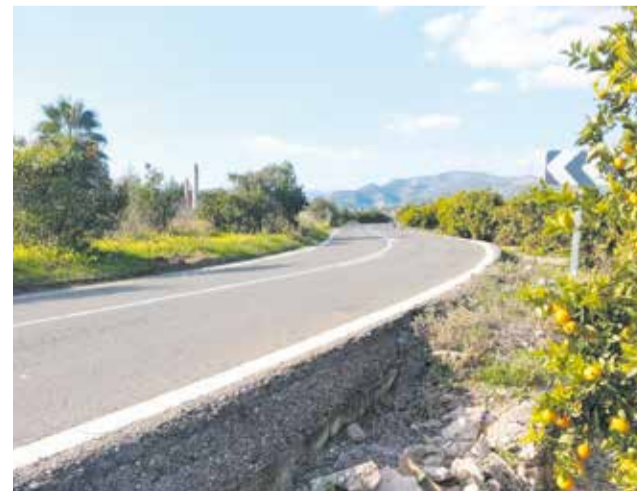
La comarcal entre Almoines i l'Alqueria.