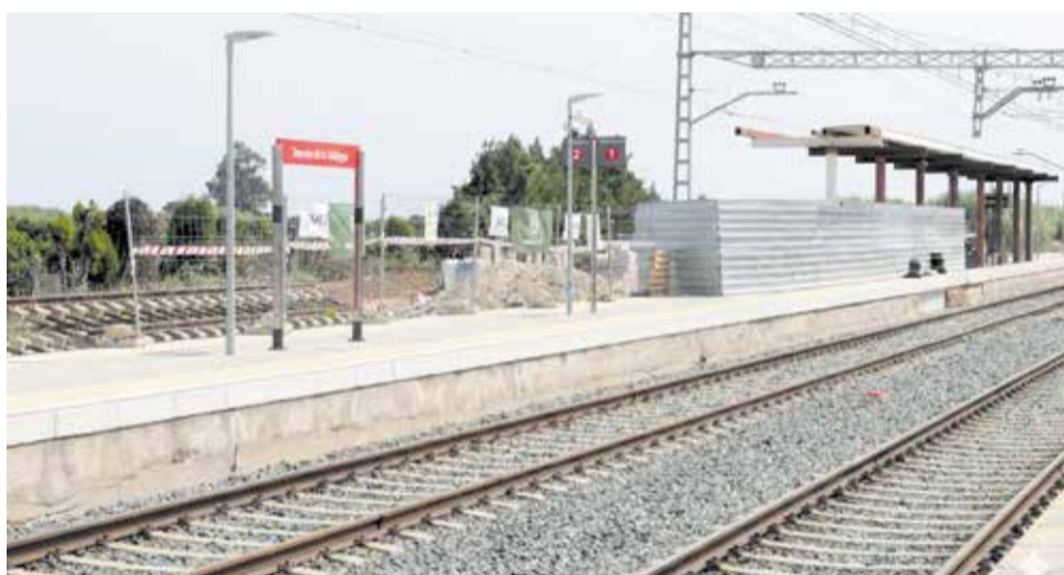
L'estació ferroviària de Tavernes de la Vall d'igna actualment.

Les obres havien començat al juliol de 2021, però es van paritzar al gener de 2023 per dificultats econòmiques de l'empresa adjudicatària. Durant aquest període, Renfe va dur a terme actuacions d'urgència per consolidar l'estructura, millorar els accessos i reforçar la il·luminació exterior,