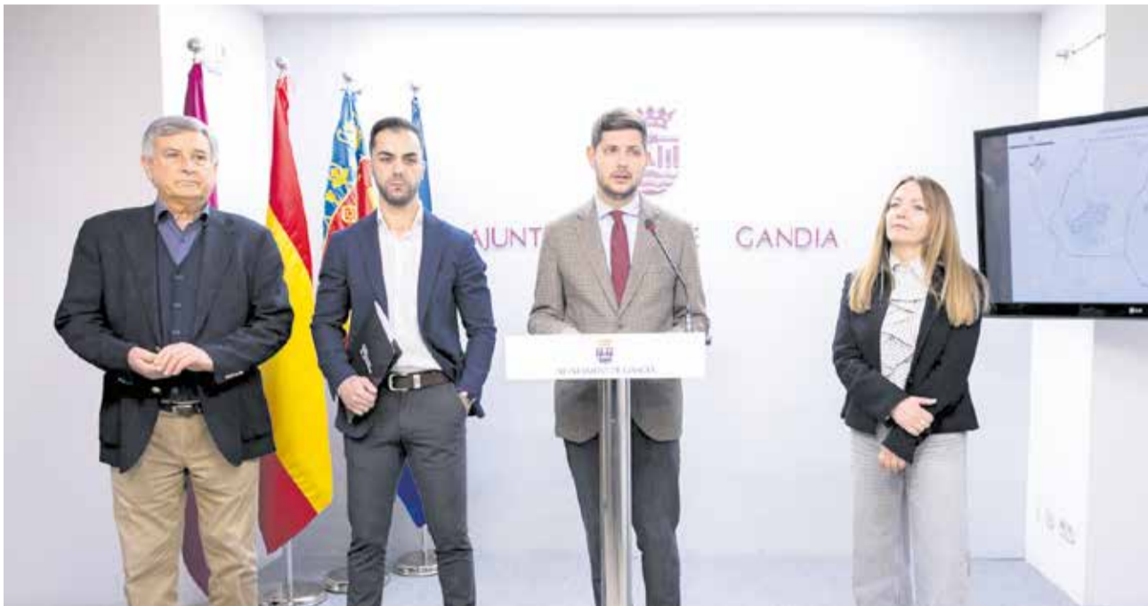
La presentació del projecte a l'ajuntament de Gandia este mes de març.