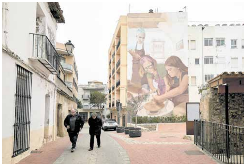
Un carrer de Potries.