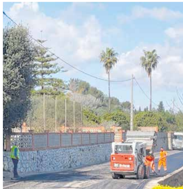
Algunes de les actuacions, que continuaran en les pròximes setmanes, i el regidor Enrique Montalvá.