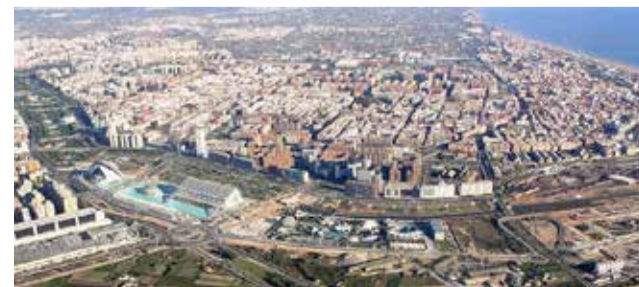
La ciudad desde el aire.