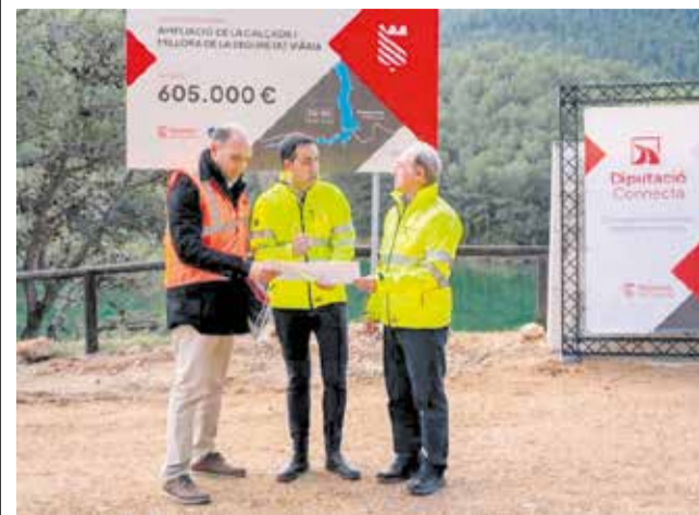
Visita a les obres en la CV-105.