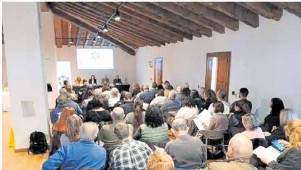
Presentación del proyecto 'Tejiendo Red' en la Villa de El Toro.