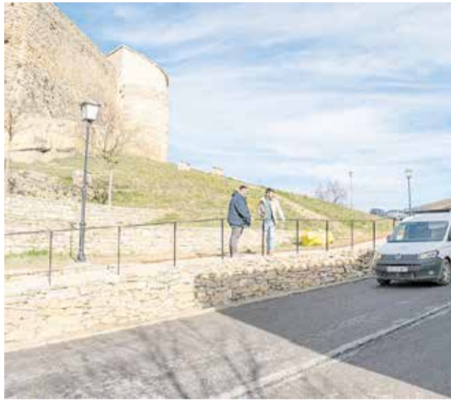
Imatge del nou camí per als viandants a Morella.

L'actuació ha consistit en la construcció de nous murs i rampes, la instal·lació d'una barana de seguretat i el canvi d'ubicació dels fanals per a il·luminar correctament la zona. Amb això, es pretén oferir un recorregut accessible per a totes les persones, incloent-hi aquelles amb mobilitat reduïda o famílies amb cotxes