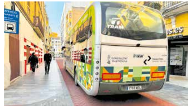
TRAM de Castellón en su trazado por el centro.