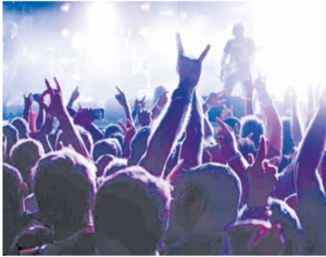
El públic gaudix en un festival.

El festival està impulsat per l'Ajuntament de Vilafamés de la mà