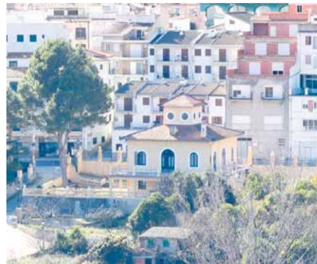
Villa Purificación de Montanejos.

Las intensas lluvias registradas durante este episodio afectaron seriamente a este emblemático edificio modernista, considerado uno de los símbolos patrimoniales del municipio. Los desperfectos en la cubierta han generado problemas de humedad y filtraciones que ya están afectando al interior del inmueble, donde se han detectado incidencias en varias salas. Por ello, además de actuar sobre el tejado, será necesario intervenir también en