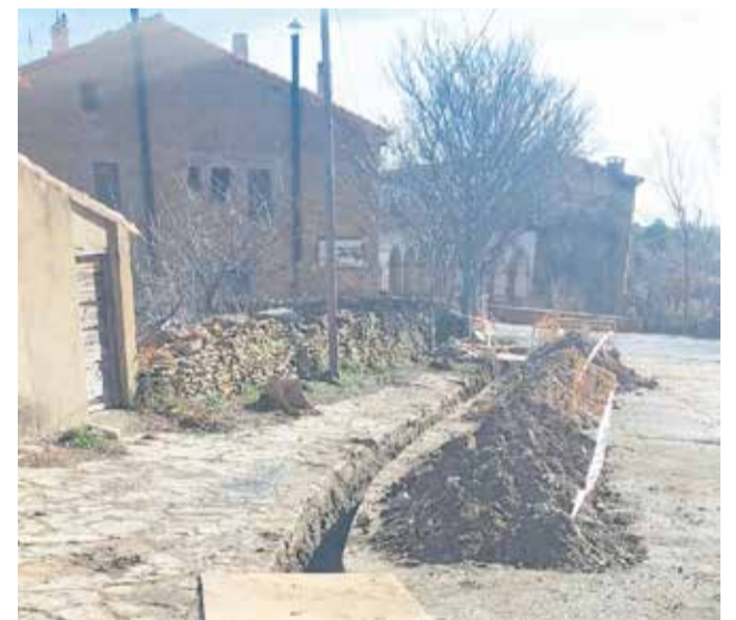
Obres en la xarxa d'aigua de Vilafranca.

Amb esta intervenció es garanteix el subministrament d'aigua potable amb la pressió correcta en tots els domicilis del Llosar, millorant així la qualitat del servei i les condicions per al conjunt del veïnat.