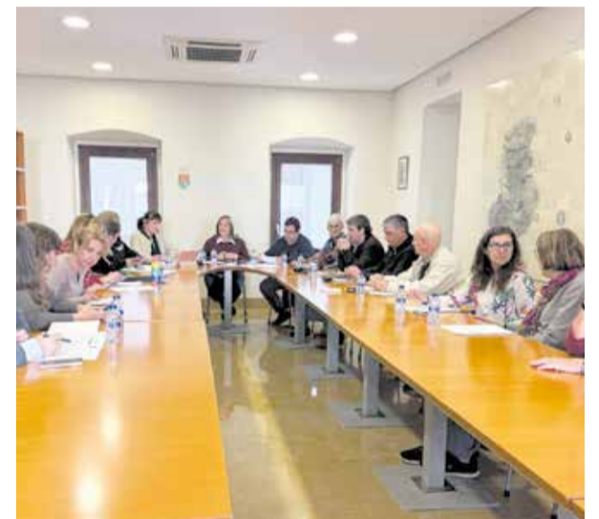
Reunión para el Mes de la Mujer de Benicàssim

El Mes de la Mujer continuará con actividades como la charla "Nutrición, entrenamiento y fisioterapia en la mujer Runner" el 21 de marzo en el Espai Cultural Villa Ana y el acto de formación y networking "Mujeres al poder" y la conferencia de Inés Torremocha el 25 de marzo.