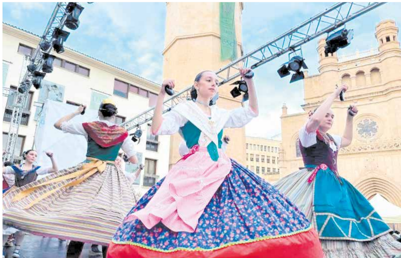
Muestra folklórica de las fiestas de la Magdalena de Castellón, en una imagen de archivo.

A partir de ahí y hasta el 15 de marzo, el programa incluirá citas destacadas como el XXX Concurso de Mascletas y la VIII Caravana festeria hacia la Mascletá, además de espectáculos de circo con MAGDALENA CIRCUS, desfiles infantiles, concursos gastronómicos y muestras