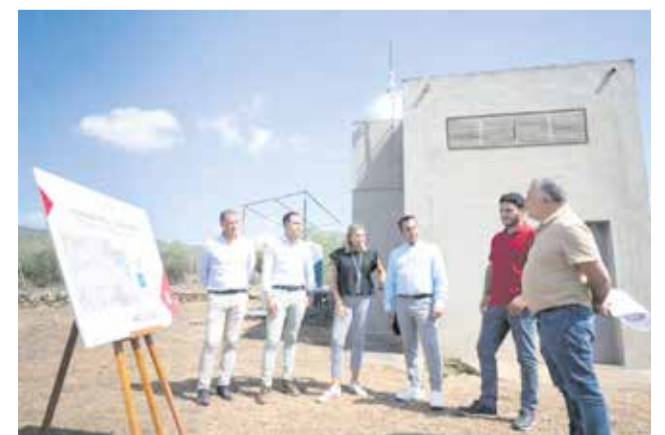
Projecte de proveïment d'aigua potable.

cial per l'aigua. La dirigent provincial ha explicat que esta inversió d'1.500.000 euros, que correspon a la convocatòria del AGA, permetrà als ajuntaments de la província de Castelló resoldre problemes reals que afecten el dia a dia de la gent.