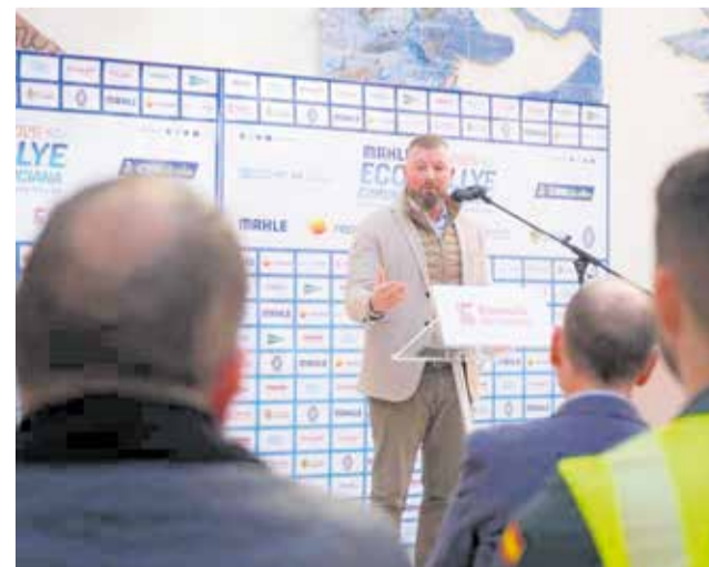
Presentació del MAHLE Eco Rally.

En definitiva, el MAHLE Eco Rally es consolida com un esdeveniment referent en mobilitat sostenible, que combina esport, tecnologia i patrimoni, i posiciona a Castelló com un destí de referència per a l'automobilisme ecològic i la promoció de la seua riquesa natural i cultural.