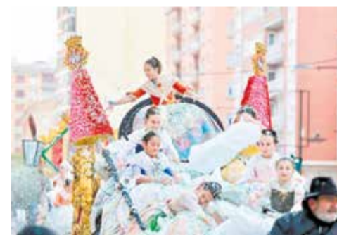
Diferentes actos de las fiestas de la Magdalena.

la oferta para públicos de todas las edades.