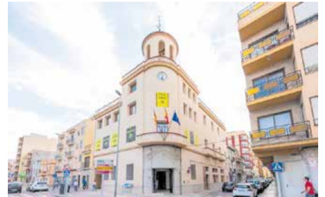
Antiga Cambra Agrària-Natiu de Nules.