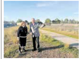
CV-149, Benicàssim / EPDA