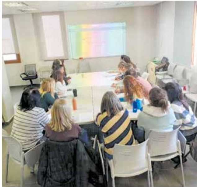
Presentació de la aplicació per als Serveis Socials. EPDA

Des de la Regidoria de Serveis Socials es destaca l'esforç que està realitzant el personal professional del departament "perquè esta