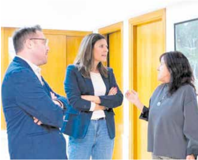
Visita de la diputada provincial.

Al respecte cal assenyalar que, fa uns mesos l'Ajuntament de Nules va