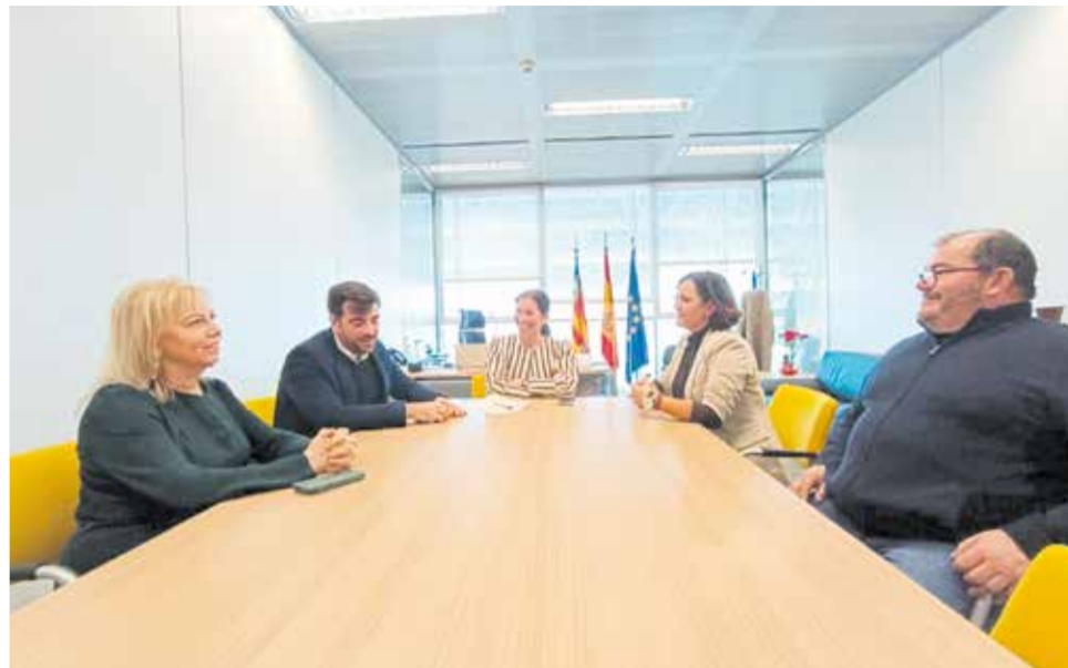
Reunió CEEM Albocàsser.

Albalat ha volgut agrair a la secretària autonòmica la recepció formal. "Hem hagut d'insistir un poc, perquè al principi no