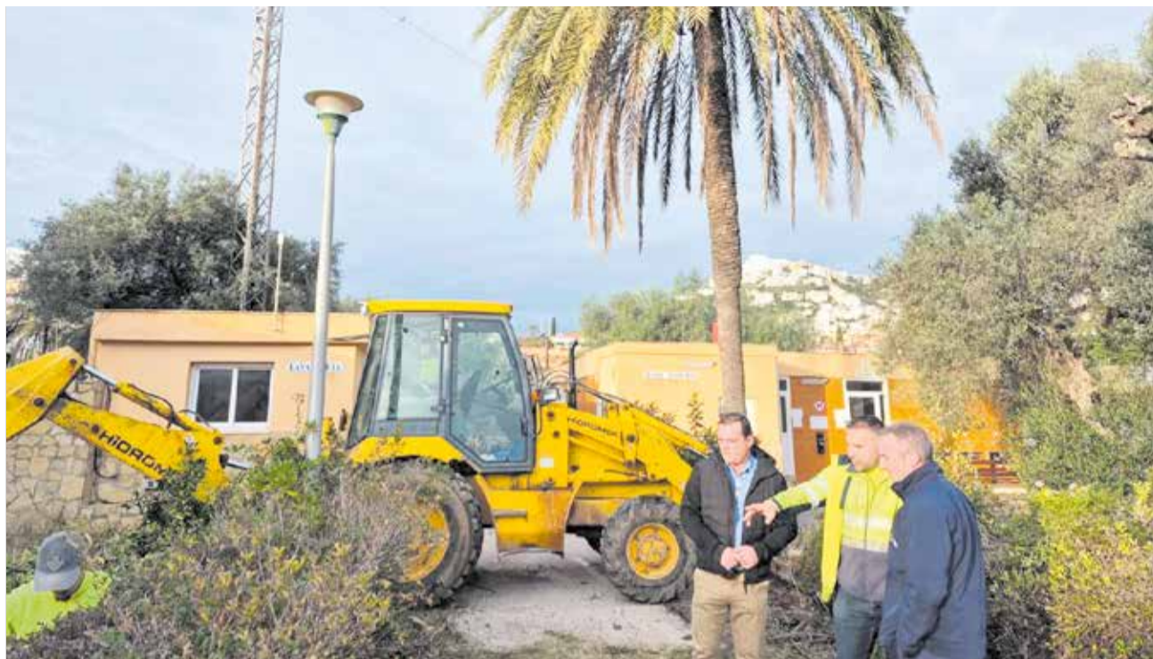
Treballs de neteja i desbrossament en el Càmping Bellavista de Peníscola.