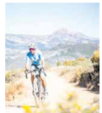
Castelló Gravel.

L'atractiu de les pistes castellanenques va generar un notable efecte anomenada a nivell global, reflectit en un escamot de 850 corredors inscrits, procedents de 32 països, que van prendre l'eixida a Llucena, marcant un rècord de participació internacional. La duresa tècnica del traçat i la bellesa de l'interior de Castelló van traspasar fronteres, consolidant a la província