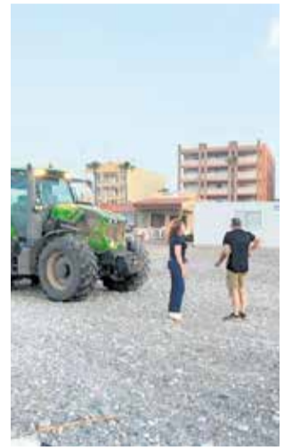
Platges de Nules.

Esteban explica que "la gestió de les platges requereix un treball constant, planificació i escoltar el veï-