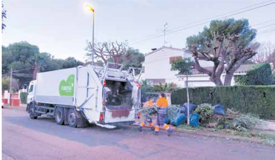
Equipos de recogida en enseres y poda del Ayuntamiento de Benicàssim

Durante el año 2024, el servicio permitió la recogida de un total de 1813 toneladas de residuos voluminosos y restos de poda, gestionados a través del sistema de recogida a demanda activo mediante el teléfono 964300897. La colaboración ciudadana y el incremento de recursos para cubrir este servicio permitirán con eficacia facilitar la correcta eliminación de este tipo de residuos y evitar su