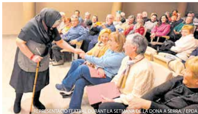
REPRESENTACIÓ TEATRAL DURANT LA SETMANA DE LA DONA A SERRA.

El Club de Lectura de Serra va celebrar el passat 9 de març el seu 10é aniversari amb una sessió de lectura molt especial, que va reunir a les persones que formen part d'esta gran família lectora per comentar l'obra 'La cabeza perdida de Damasceno Monteir'.