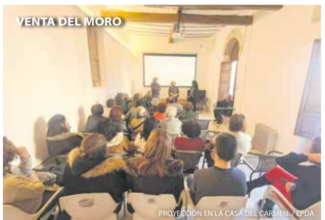
VENTA DEL MORO