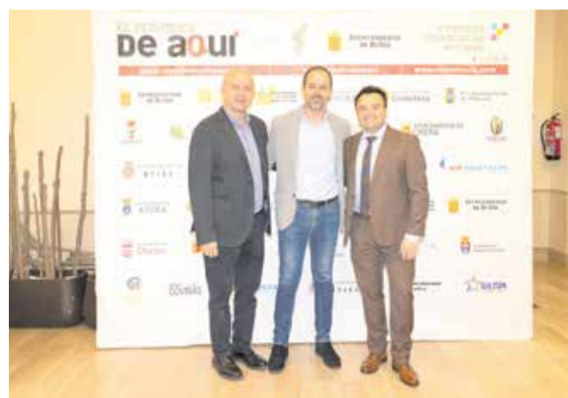
Autoridades e invitados posan en el photocall de los V Premios de El Periódico de Aquí Comarcas de Interior celebrados en Buñol.