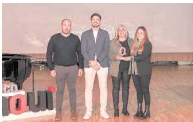
MEDIOAMBIENTE: A la M.I. Tierra del Vino, por su campaña de educación ambiental.