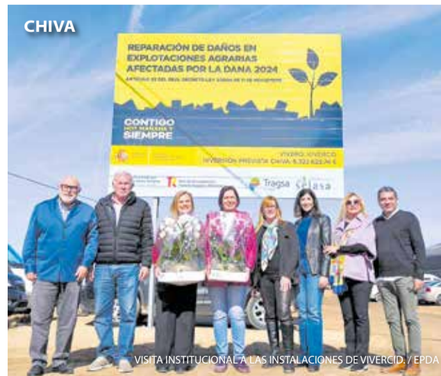
VISITA INSTITUCIONAL A LAS INSTALACIONES DE VIVERCID. / EPDA

Un grupo de estudiantes de 6º de Primaria de Chiva ha conseguido el tercer puesto en el Campeonato Autonómico de Orientación de Centros Escolares, en el que participaron numerosos colegios de toda la Comunitat Valenciana. Durante la prueba, los jóvenes pusieron a prueba su capacidad de orientación, estrategia y trabajo en equipo, demostrando habilidad para moverse por el terreno y colaborar eficazmente.