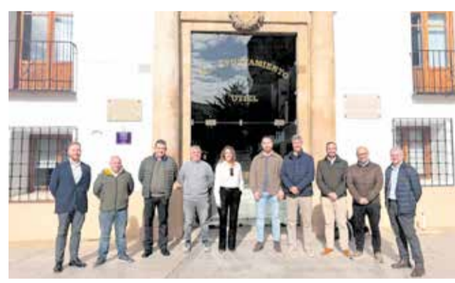
Representantes de empresas de Nuevo Tollo.

El proceso de constitución ha sido conducido por la empresa Gestión de Áreas Industriales by Ro-