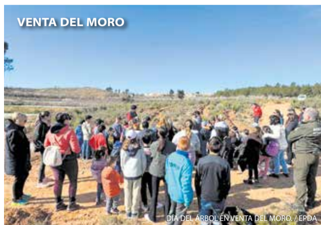
VENTA DEL MORO