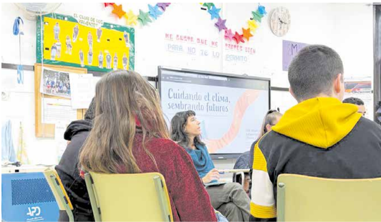
Una de las sesiones en el Centro de Educación Especial Virgen de la Esperanza de Cheste.