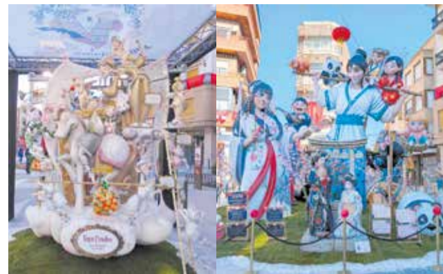
Monumentos ganadores.