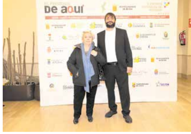
Autoridades e invitados posan en el photocall de los V Premios de El Periódico de Aquí Comarcas de Interior celebrados en Buñol.