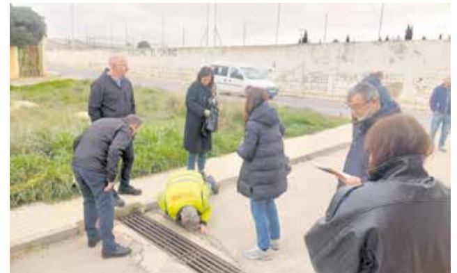
Visita conjunta a la zona de actuación.