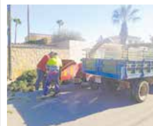
Treballs de recollida. / EPDA