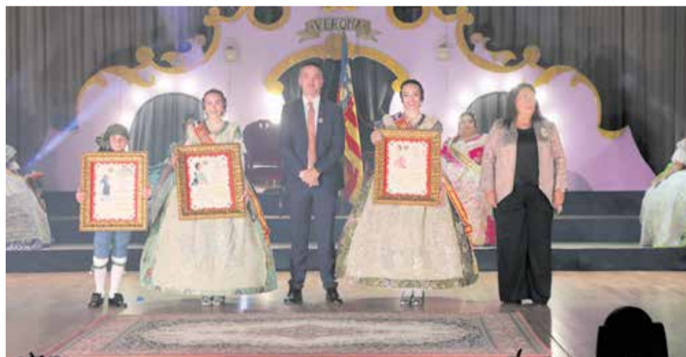
Exaltació de les Falleres Majors i el President Infantil de Lliria 2026.