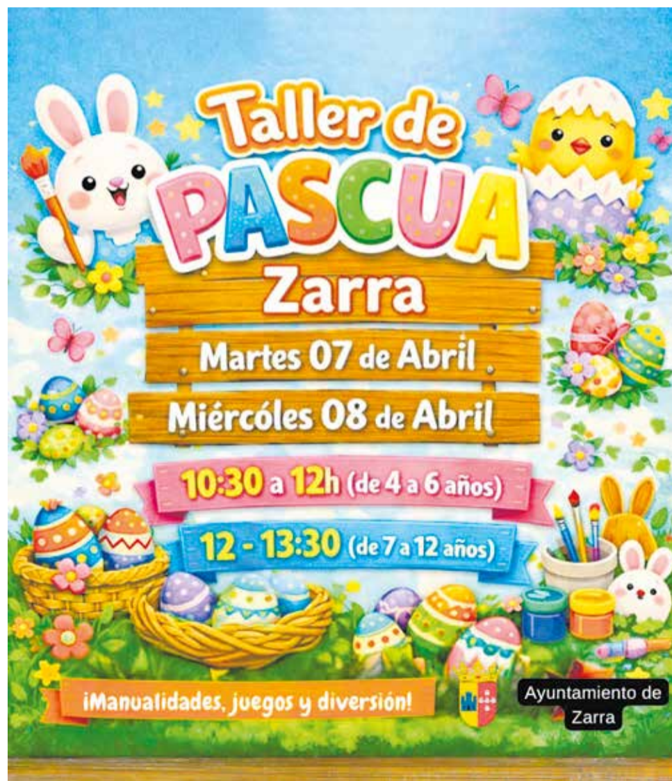
Cartel del Taller de Pascua organizado en el municipio de Zarra.