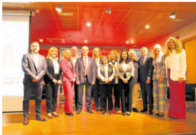
Autoridades en el foro organizado por Mapfre.

Uno de los principales diagnósticos compartidos en el foro fue la urgencia de frenar el éxodo de población joven y atraer nue-