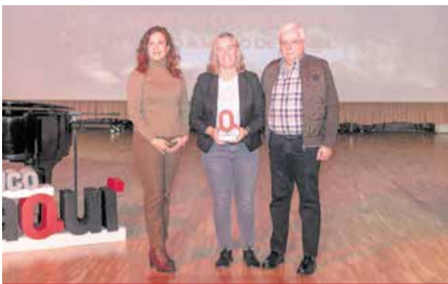
MÚSICA: A la iniciativa 'Mano a Mano' de la armónica y la artística de Buñol.