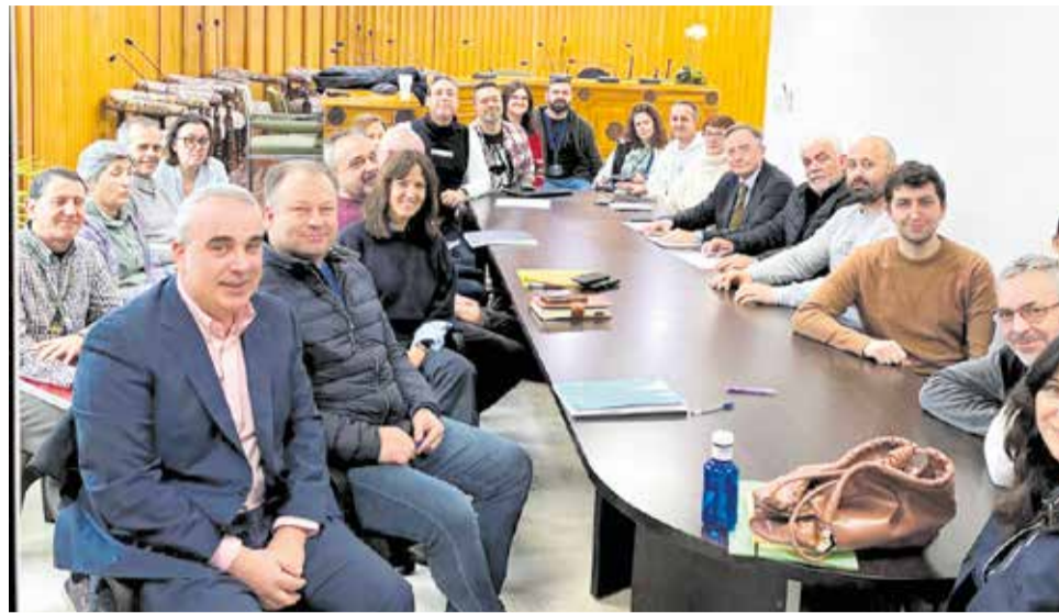
Un instante durante la reunión.

Tras varias reuniones de trabajo entre el Ayuntamiento, las empresas del polígono, la representación sindical y la Inspección de Trabajo, se ha acordado impulsar la creación de un vial específico que permitirá la entrada y salida de vehículos de emergencias,