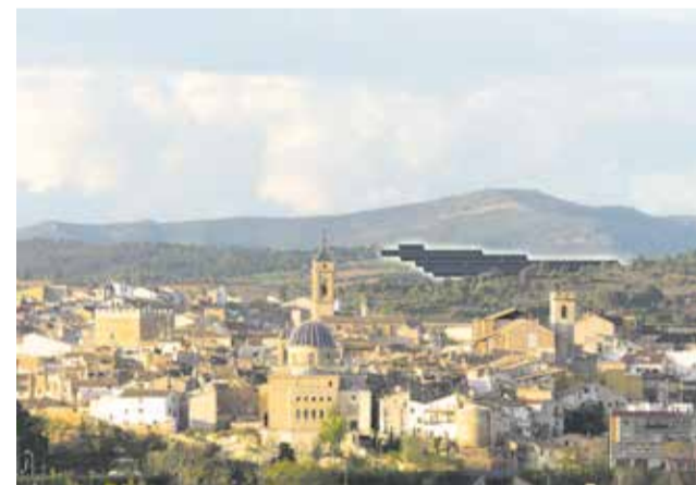
Fotomontaje del Limonero Solar.

Ante esta situación, la asociación ha acudido a los tribunales y prevé lanzar una campaña de crowdfunding para financiar el proceso.