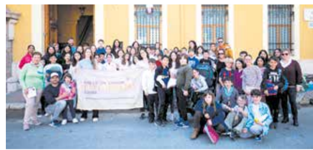
Participantes en el mercado solidario.