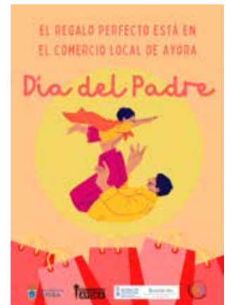
Campaña de Ayora.

Los comercios interesados en participar pueden recoger el material promocional en el Ayuntamiento, sumándose así a una iniciativa que busca dinamizar la actividad co-