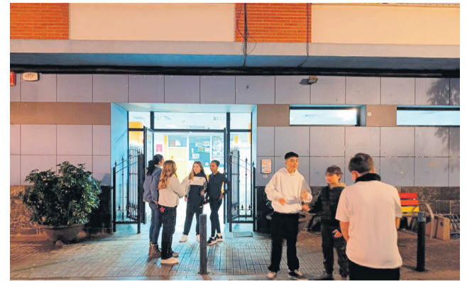
Casal Jove de Benicàssim.