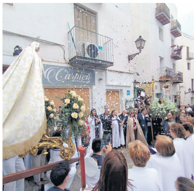
Procesión del encuentro de Peñíscola.

del Santo Entierro, mientras que el Domingo de Resurrección se celebra el tradicional Encuentro, que pone el cierre a la semana.