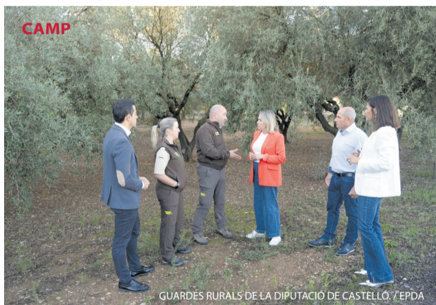
GUARDES RURALS DE LA DIPUTACIÓ DE CASTELLÓ.

La Diputació Provincial de Castelló reforça la seguretat del camp i el suport als municipis de menys de 5.000 habitants amb el servei de guarda rural. “Un servei necessari i molt útil per a les localitats més xicotetes de la nostra terra”. Així ho ha destacat la presidenta de la institució provincial, Marta Barrachina