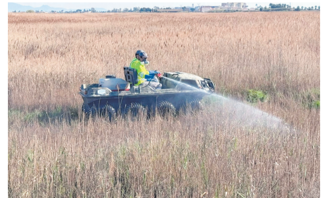
Servei de Control de Mosquits de la Diputació. / EPDA

La prevenició, coordinació i conscienciació són essencials per a frenar als mosquits, i la Diputació reafirma el seu compromís de reforçar campanyes de control i sensibilització.