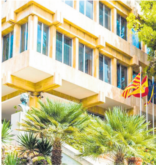
Fachada del ayuntamiento de Benicàssim.

Estas instalaciones se ubicarán en distintos puntos