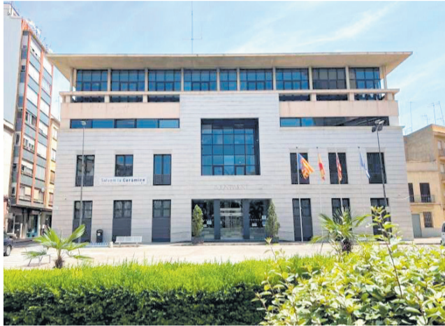
Ajuntament de Burriana. / EPDA

En matèria esportiva, contempla un suplement de crèdit de 40.000 euros destinat a les subvencions per a entitats esportives de la ciutat. Esta ampliació de la partida pressupostària respon al consens aconseguit amb els propis clubs i entitats, després de quedar un sobrant sense repartir en l'exercici anterior, assegurant així un major suport econòmic per a l'esport base i la capacitat d'ajustar el calendari natural a l'esportiu i de competició a Burriana enguany.