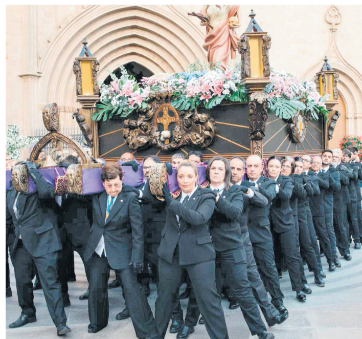
Un paso durante la procesión en Castellón.