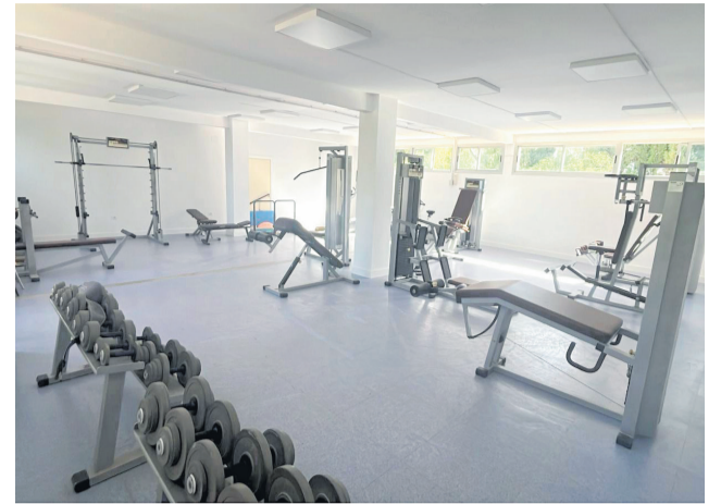
Gimnàs municipal d'Albocàsser.