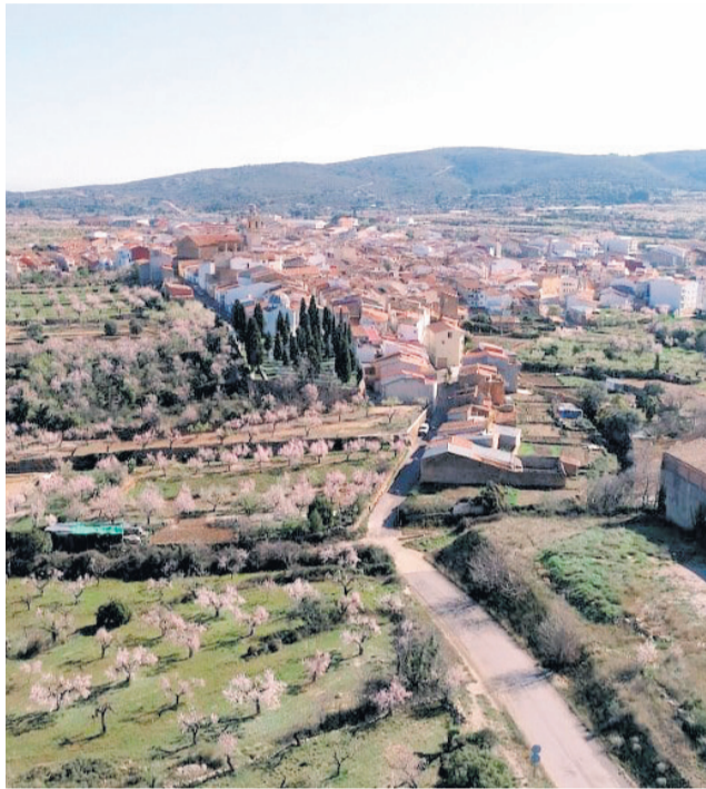
Vista aèria del municipi d'Albocàsser.

Entre les accions previstes, destaca l'anàlisi de l'accessibilitat en institucions culturals dels països socis, amb la finalitat d'identificar mancances