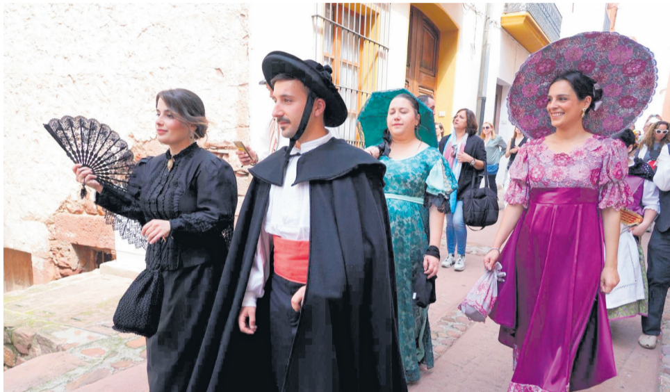
Recreació de la vida quotidiana de 1900 a Vilafamés, en una imatge de arxiu.

Durant els dies 1, 2 i 3 de maig, el nucli antic de Vilafamés -declarat Bé d'Interès Cultural (BIC)- es transformarà completament per recrear l'ambient, els oficis i la vida quotidiana de principis del segle XX. Carrers, places i espais públics es convertiran en escenaris vius on es podrà descobrir, de manera immersiva, com era el dia a dia dels nostres avantpassats.