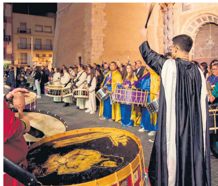
Tambores y bombos en Vinaròs.

en una experiencia teatral y solemne que atrae cada año a numerosos visitantes.