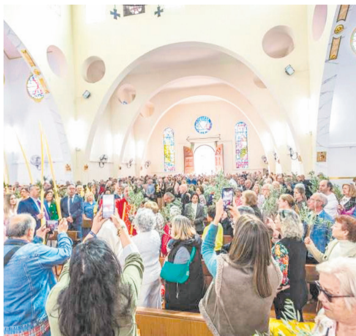
Domingo de Ramos en Oropesa del Mar.