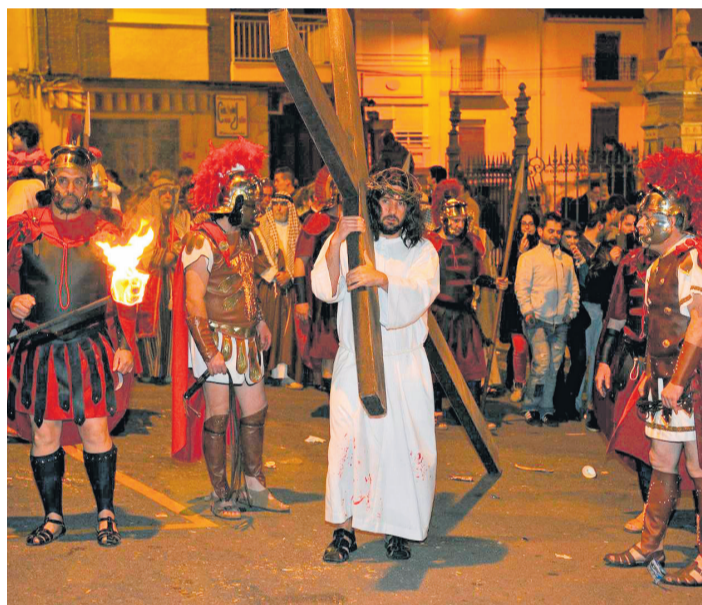
Pasión de Cristo de Borriol.