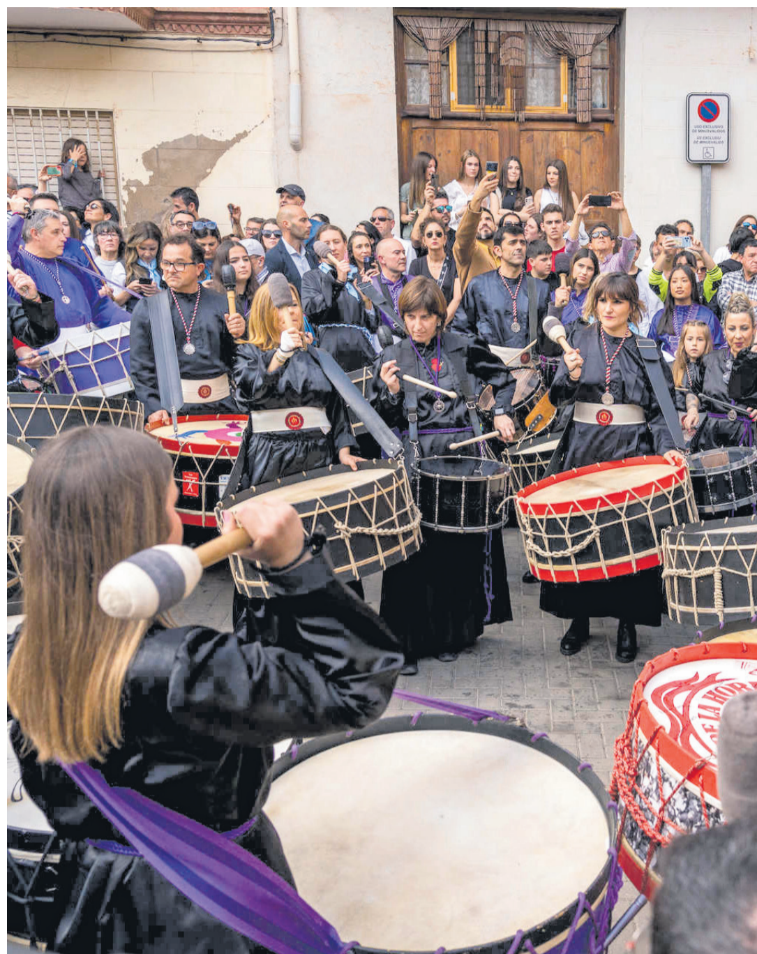
Multitud de personas participan en la conocida Rompida de la Hora del municipio de L'Alcora,

Uno de los momentos más destacados es la Trobada de Bombos i Tambors, que marca el inicio de la celebración con un ambiente multitudinario. Las procesiones se concentran especialmente en el Jueves y Viernes Santo, con actos como la Procesión