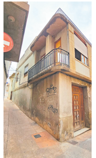
Casa adquirida.

Després de l'enderrocament de l'habitatge, adquirida per l'Ajuntament per un import de 30.000 euros, s'ampliarà l'ample del vial que unix els carrers Olivera i Sevilla. Aquesta actuació permetrà facilitar la circulació de tot tipus de vehicles i millorar la seguretat viària a la zona, resolent una situació que fins ara suposava dificultats tant per a conductors com per a vianants.