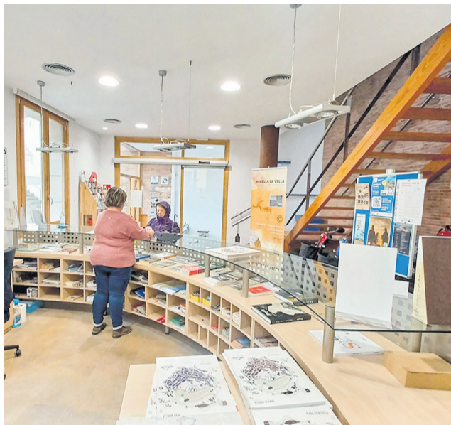
Oficina de turisme de Morella.

L'Ajuntament de Morella ha executat el contracte de remodelació de l'oficina de turisme per a la millora de l'eficiència energètica de l'edifici, amb un pressupost de 117.370 euros. Esta actuació està inclosa en el Pla de Sostenibilitat Turística en Destí de Morella, finançat per la Unió Europea - Next Generation EU. D'esta manera, una vegada acabades les obres, esta setmana el servei ha tornat a la ubicació habitual, en la plaça de Sant Miquel, i abandona el lloc provisional en el CISE. El projecte de reforma ha contemplat el canvi de portes i finestres, així com l'aïllament de parets i sostres de tots dos pisos de l'oficina. També la instal·lació d'un sistema d'aerotèrmia per a mantenir la temperatura