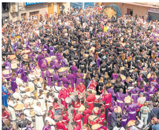
Rompida de la hora de L'Alcora.

Organizada por la Hermandad del Santísimo Cristo del Calvario, con el impulso de la asociación cultural L'Alcora