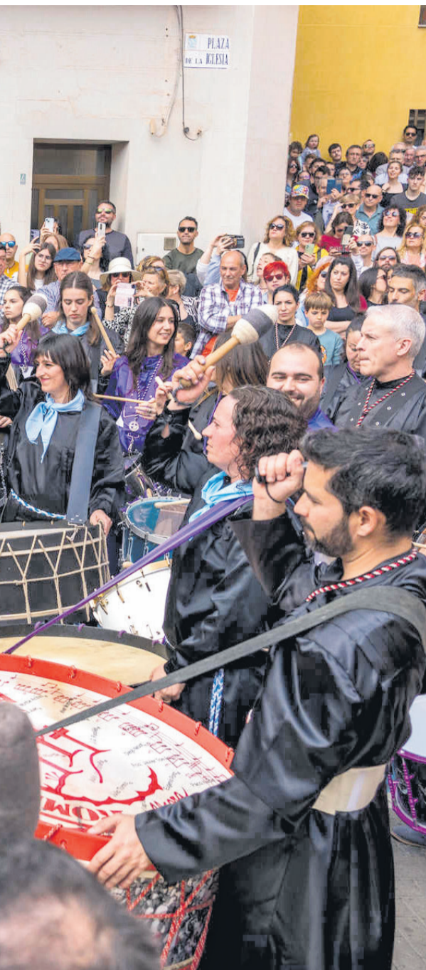
en una imagen de archivo.