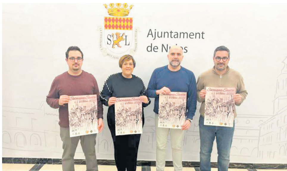
Presentació del cartell de Setmana Santa de l'Ajuntament de Nules.

Encara que, el V Pregó de Setmana Santa, que organitza la Germanor de Nazarenos de la Puríssima Sang