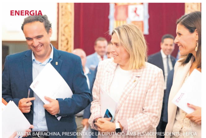
MARTA BARRACHINA, PRESIDENTA DE LA DIPUTACIÓ, AMB ELS VICEPRESIDENTS.

La Diputació Provincial de Castelló i el Centre Europeu d'Empreses i Innovació de Castelló (CEEI Castelló) impulsen el creixement empresarial de la província amb la novena edició del programa d'acceleració Òrbita. El programa està dirigit a startups de qualsevol vertical que compten amb un model de negoci innovador i escalable