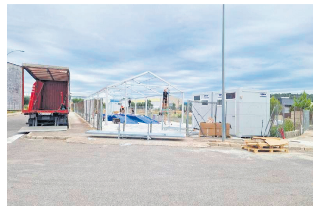
Construcción de la sede de ITV en Segorbe.

el paso adelante que supone la convocatoria pública y destacando el compromiso del Ayuntamiento con el bienestar y la comodidad de la ciudadanía. Según ha subrayado, esta iniciativa no solo mejorará el acceso al servicio de ITV, sino que también generará oportunidades laborales.