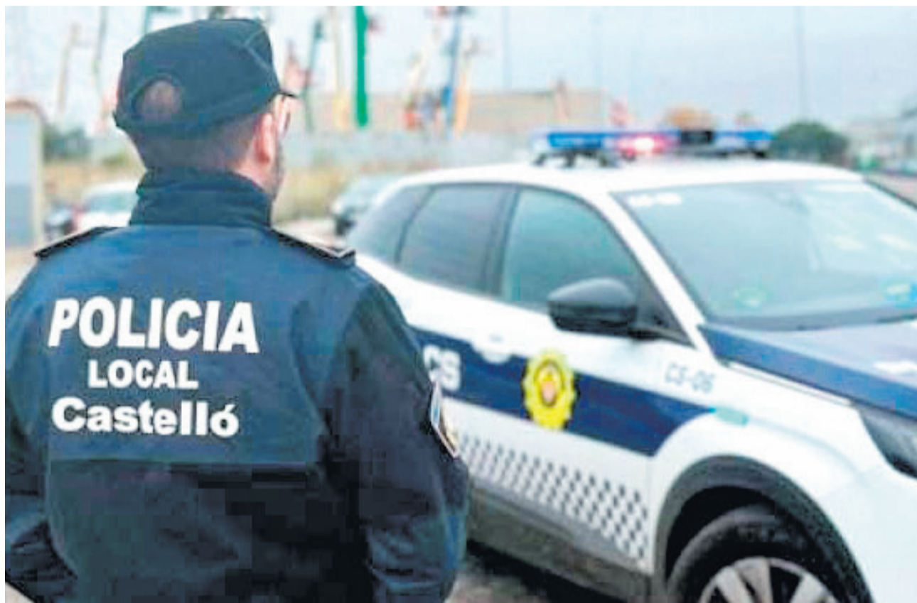
Un agente de la Policía Local de Castellón durante una intervención, frente a un vehículo oficial.

Frente a este escenario, la criminalidad convencional, la que no se comete a través de internet, presenta un