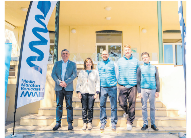
Presentación de la Media Maratón de Benicàssim.

Desde la organización han subrayado que la gran respuesta de los corredores es fruto del trabajo desarrollado durante meses junto a instituciones, patrocinadores y colaboradores que han apostado por impulsar un evento con vocación de consolidarse dentro del calendario deportivo.