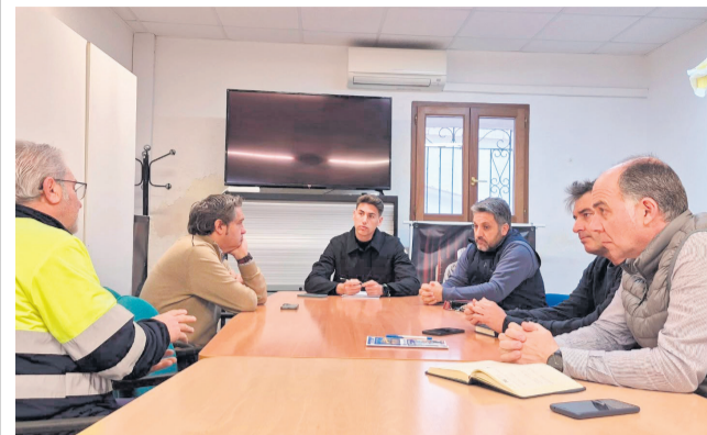
La regidoria de Turisme i Platges de Peníscola.