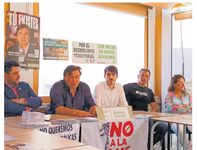
Reunió contra el clúster energètic.

jectes energètics poden tindre sobre el territori, tant des del punt de vista ambiental com socioeconòmic. Entre les principals preocupacions es troben l'impacte paisatgístic i patrimonial, així com l'afecció que les infraestructures associades podrien generar en comarques rurals amb un elevat valor natural i cultural.