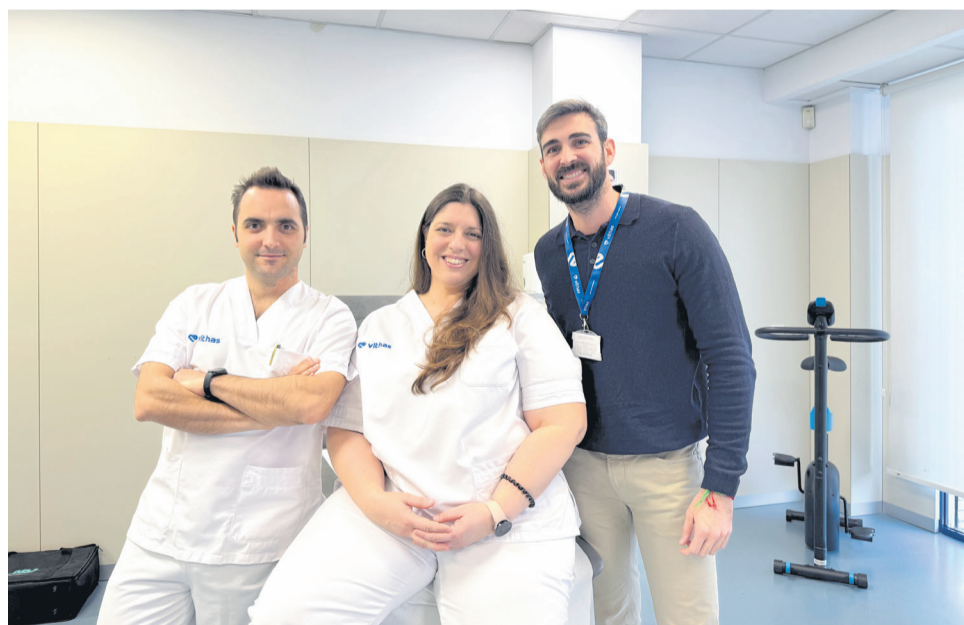
Equipo de fisioterapia del Hospital Vithas Castellón.

A partir de este estudio inicial, se diseña un plan de tratamiento individualizado que combina sesiones presenciales con programas de ejercicios domiciliarios adaptados. Esta combinación permite no solo obtener resultados en consulta, sino también consolidarlos en el tiempo, implicando al propio paciente en su proceso de recuperación.