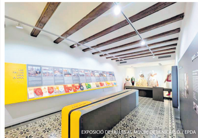
EXPOSICIÓ DE FALLES AL MUCBE DE BÈNICARLÓ.

Benicarló ha inaugurat al MucBe la nova exposició permanent 'EL nord DE LES FALLES', un espai dedicat a explicar i posar en valor la tradició fallera de la ciutat. L'exposició, cofinançada per la Conselleria d'Educació, Cultura i Universitats, naix amb la voluntat de mostrar que les Falles de Benicarló estan vives durant tot l'any