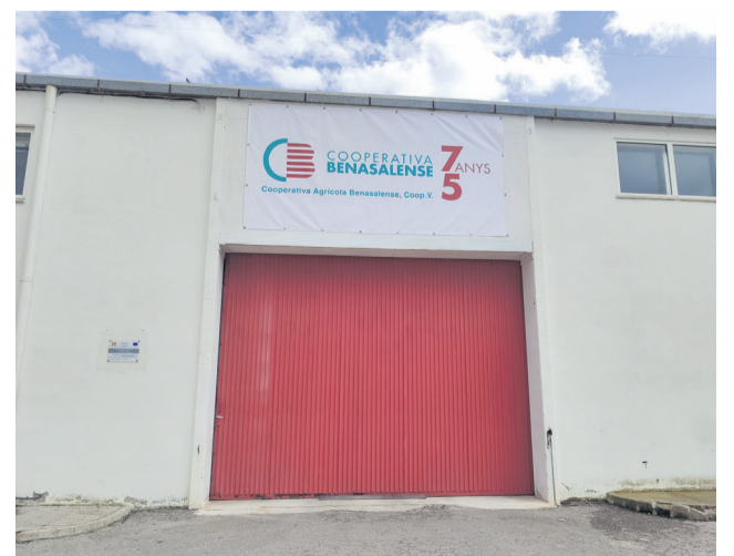
Edifici de la cooperativa de Benassal.

Més enllà de la dimensió comercial, AVELLASSAL persegueix també contribuir al manteniment de l'activitat agrària en entorns rurals, afavorint l'arrelament i la sostenibilitat del paisatge agrícola tradicional. En paral·lel, la implicació de Cooperatives Agro-alimentàries de la Comunitat Valenciana facilita la difusió i transferència dels resultats al conjunt del sector cooperatiu mitjançant jornades tècniques i publicacions.