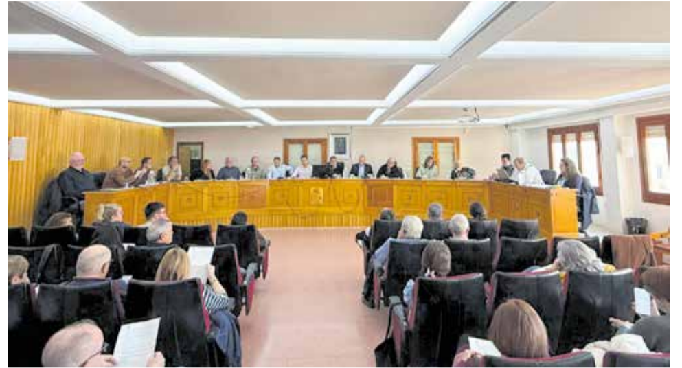
Un instante del pleno ordinario del 31 de marzo.