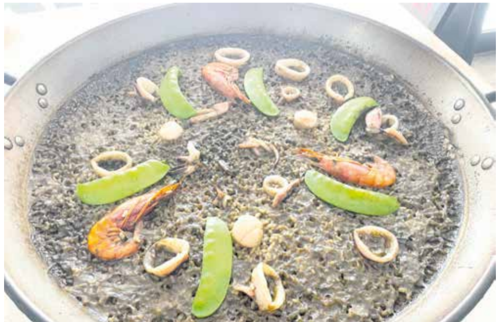
Nueva paella de calamar playa, gamba roja, vieiras, tirabeques y placton 'Enclave de mar'.

Cada evento es personalizado, damos forma a los sueños e ilusiones. Todo el personal presume de estar cualificado, siempre dispuesto a brindar un excelente servicio, atento, personalizado, cuidando cada detalle, garantizando que sea una experiencia perfecta e inolvidable. En su cocina mediterránea destacan sabores bien conjuntados, platos elaborados con ingredientes