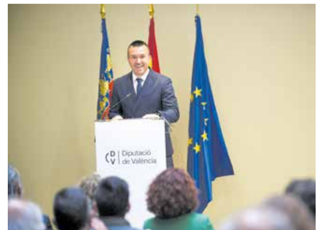
Presentación de Gestifoc 2026. / ABULAILA

Estas actuaciones permitirán reforzar la capacidad de respuesta de los municipios ante el riesgo de incendios, especialmente en zonas con una amplia superficie forestal, contribuyendo a una mejor protección del entorno natural y a la seguridad de la población.