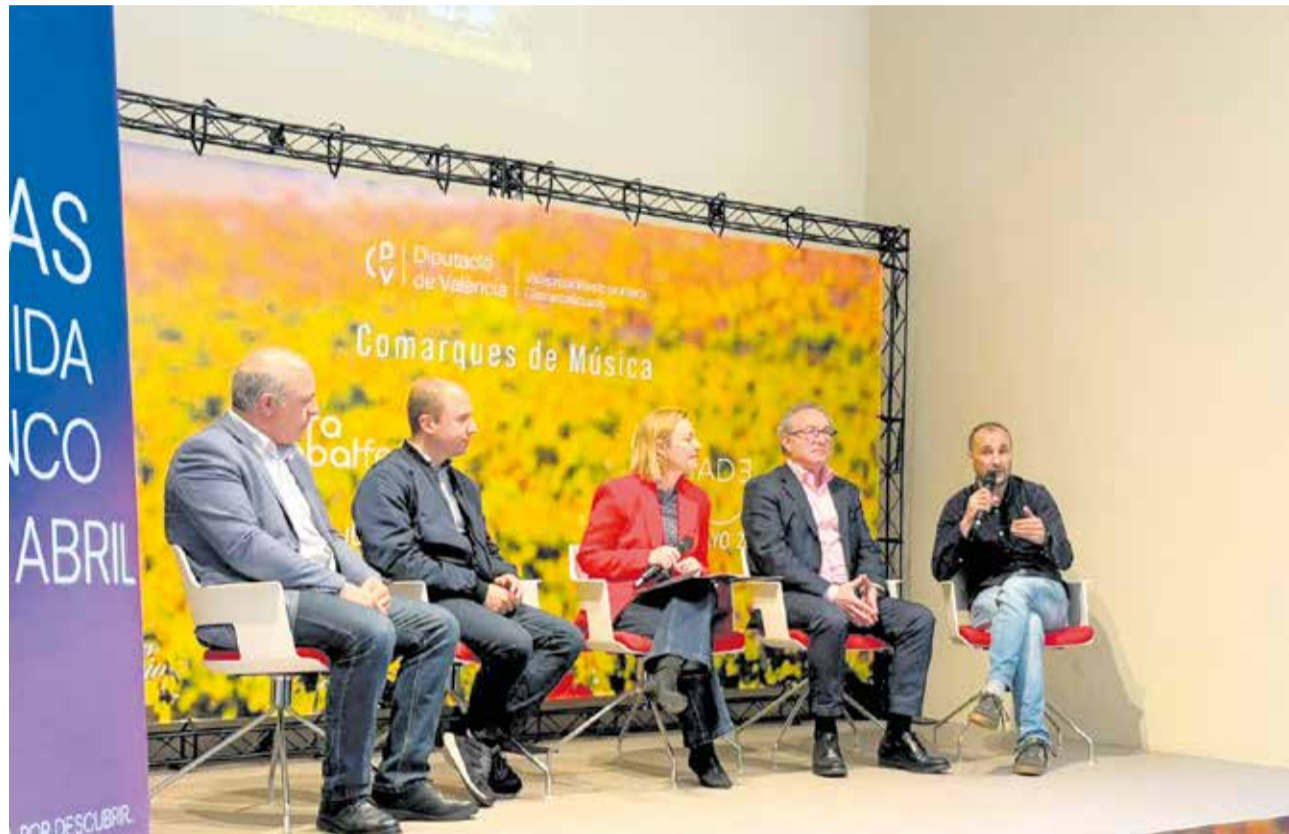
Un instante de la presentación de Tierra Bobal Fest y Nómade.