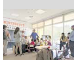
Escola de Pasqua.