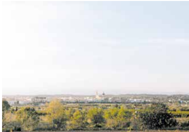
Panorámica de la zona de instalación.

La magnitud del proyecto y su localización han despertado ya el interés de empresas nacionales e internacionales, que ven en este enclave una oportunidad para implantarse en una zona bien comunicada y con proyección de crecimiento. Con la exposición pública del programa, el desarrollo