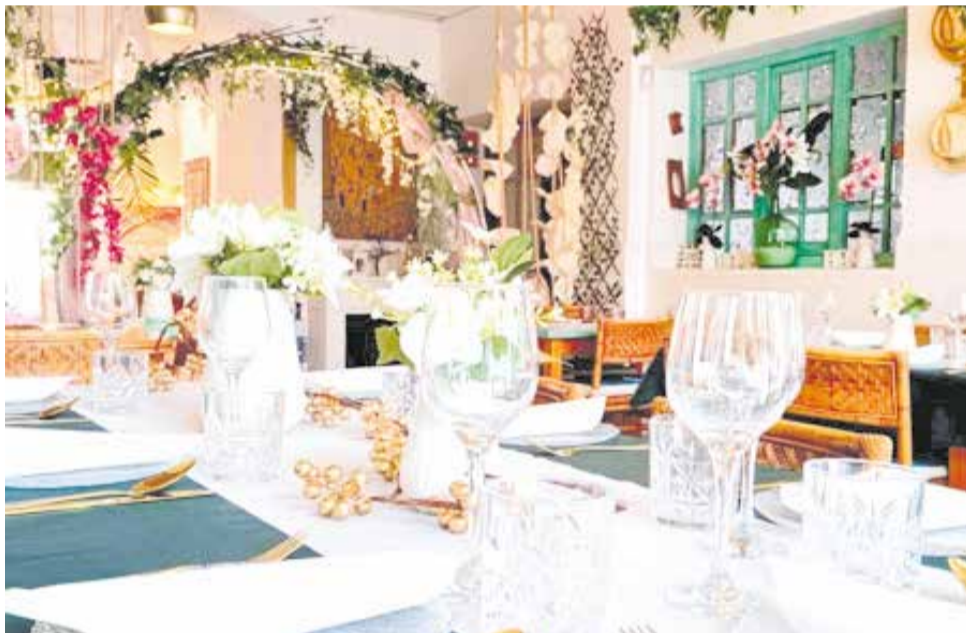
Comedor interior del restaurante 'Alquería Villa Carmen' de Catarroja.