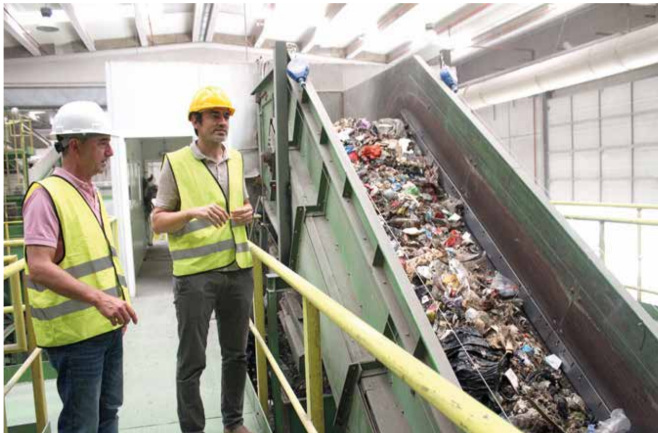
Evolución de la construcción de la planta de voluminosos de Lliria.

El proyecto está financiado a través de los fondos europeos Next Generation EU, en el marco del Plan de Recuperación, Transformación y Resiliencia, y supone una inversión estratégica para