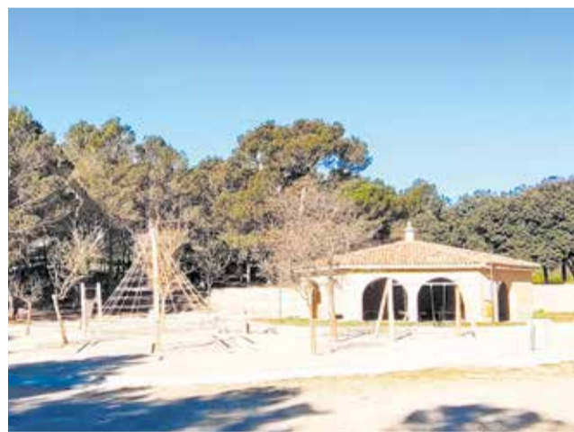
Fotografía del nuevo parque de El Remedio.

En El Remedio, el parque cuenta ahora con una amplia variedad de juegos para distintas edades, como tirolesa doble, red de escalada, columpios, tobogán,