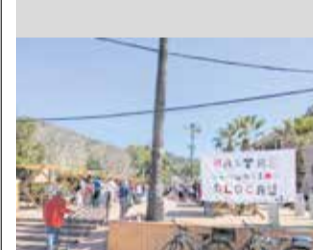
Rastre Comunitari. / EPDA