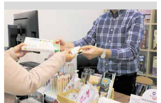
Un client compra amb el bo comerç de Lliria.

Finalment, l'alcalde Paco Gorrea ha assenyalat que amb esta iniciativa, "que compleix la seua quarta edició amb gran acolliment en les anteriors, l'Ajuntament de Lliria torna a contribuir a la dinamització del comerç local, i a afavorir la seua activitat econòmica".