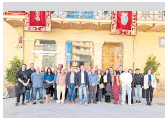
Recepció del personal qualificat.

El pla dona continuïtat al desenvolupat en 2025, que va permetre la contractació de més de 80 persones, i consolida l'estratègia municipal de recuperació amb una visió més tècnica i especialitzada, que a més a més ofereix oportunitats.