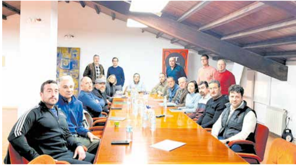
Fotografía de JCUMASRU durante una de las reuniones mantenidas.

Las alegaciones que se están preparando también pondrán el foco en la necesidad de establecer dotaciones de agua ajustadas a la realidad productiva y climática de la zona, así como en evitar que las políticas de gestión sostenible de las aguas subterráneas deriven en restricciones desproporcionadas para aquellos usuarios que ya han realizado importantes esfuerzos de racionalización y eficiencia en el uso del recurso. El planteamiento de la Junta Central pasa por compatibilizar un mayor control de las extracciones con el impulso a la diversifica-