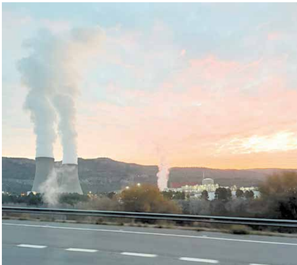
Vista de la central nuclear de Cofrentes.

El debate sobre Cofrentes ha centrado buena parte de la sesión plenaria, en la que también se ha evidenciado un clima de fuerte confrontación política. La mayoría parlamentaria conformada por PP y Vox ha permitido sacar adelante sus iniciativas, al tiempo que ha bloqueado todas las propuestas presentadas por