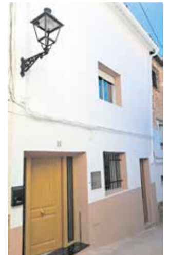
Fachada en Zarra.

Además, el plan establece criterios estéticos vinculados a la arquitectura tradicional, como el uso de determinados colores en fachadas y zócalos, con el fin de mantener una imagen homogénea y respetuosa con la identi-