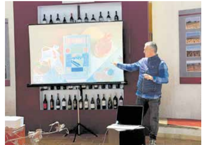
Presentación de la guía ‘Enomaníacos’.

Por 16,95 euros, “Enomaníacos” se presenta como una guía accesible para descubrir el vino valenciano desde una perspectiva más amplia.