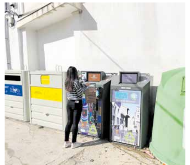
Nuevos contenedores orgánicos en Zarra.

La implantación del sistema ha supuesto una inversión cercana a los 95.000 euros, financiados por la Diputación de Valencia dentro