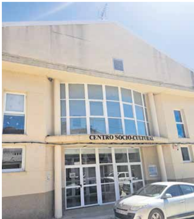
Imágenes del centro socio cultural de Chera.

Por otro lado, el municipio está ejecutando ya la reforma de los vestuarios de la piscina municipal, con