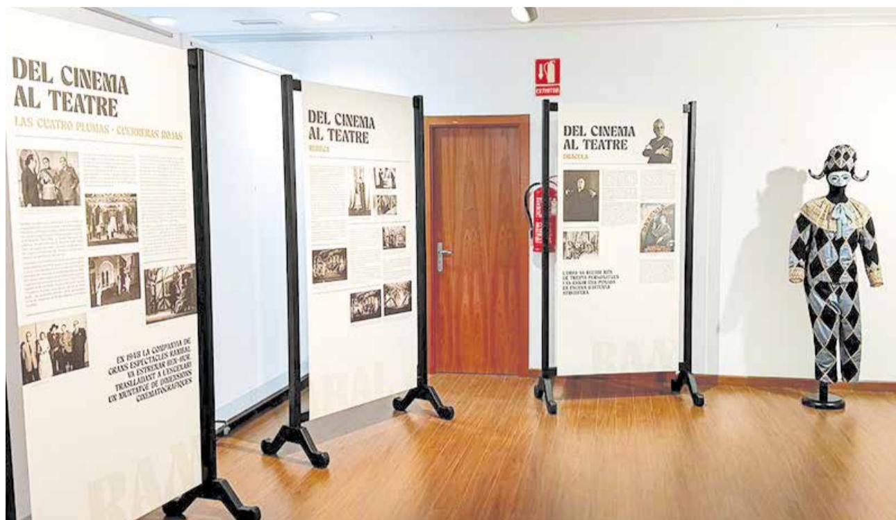
Exposición homenaje a Enrique Rambal en la Casa de Cultura de Utiel.

El alcalde de Utiel, Ricardo Gabaldón, destacó la trascendencia del actor y dramaturgo, subrayando que su figura ha sido fundamental como referente cultural y social tanto a nivel local como en el ámbito nacional e internacional, y remarcó la importancia