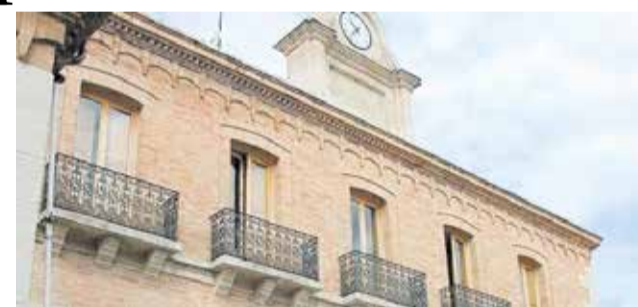
Ayuntamiento de Camporrobles. / EPDA

hasta ahora contaba con un único vehículo con limitaciones. La incorporación de esta nueva maquinaria permitirá actuar con mayor eficacia en tareas de mantenimiento, acceder a zonas de difícil tránsito y dar respuesta a situaciones climatológicas adversas, reforzando así la calidad de los servicios públicos en el municipio.