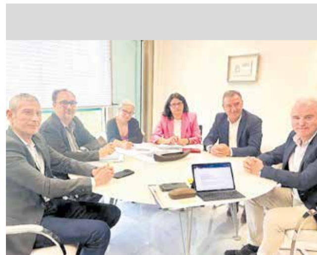
Un instant durant la reunió amb Conselleria.

La demanda del nou centre de salut està motivada per la necessitat de respondre a la demanda assistencial en Riba-roja, que ha experimentat un creixement poblacional al llarg dels anys i que, en èpoques estivals, registra també una gran afluència de població. Les noves infraestructu-