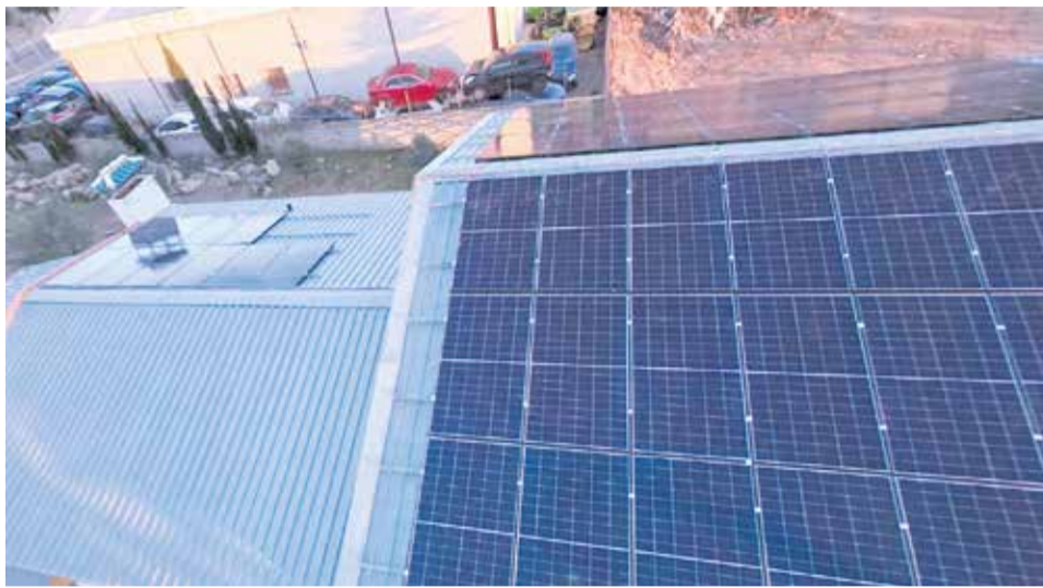
Instalación de paneles fotovoltaicos.

Uno de los ejes principales de la iniciativa es la creación de una red de instalaciones fotovoltaicas de autoconsumo