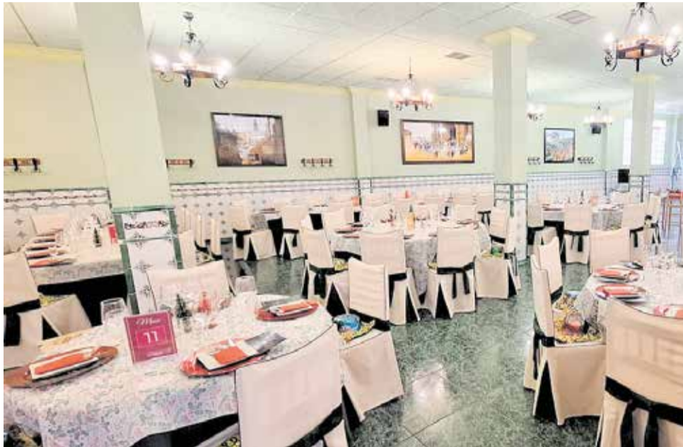
Comedor interior del Restaurante 'El Neutral', situado en el centro de Chelva.