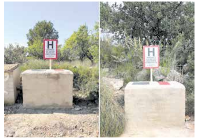
Dos hidrantes forestales instalados en la zona.