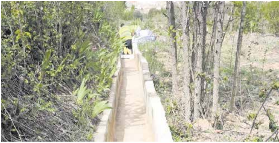
Operario trabajando en la impermeabilización de la acequia municipal.