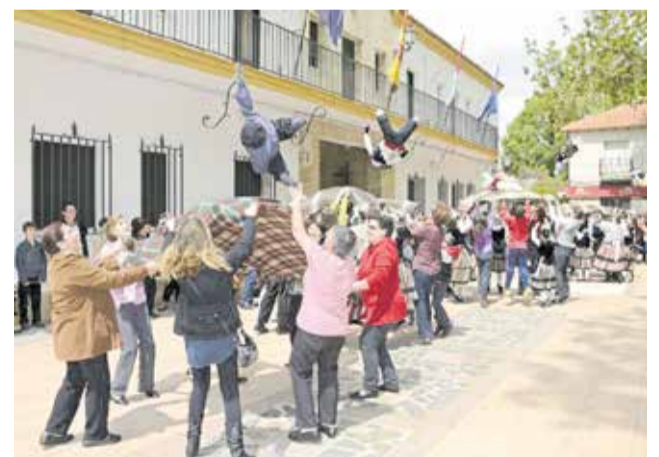
Fotografía del rito de los Judas.

Hoy, en un contexto donde muchas tradiciones corren el riesgo de desaparecer, el