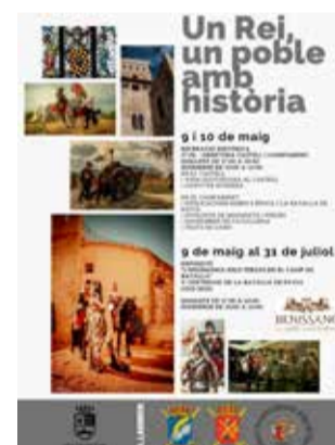
Cartell. / EPDA

La programació arrancarà dissabte a les 17.00 hores amb l'obertura del castell i del campament històric, espais centrals de l'activitat. Durant la vesprada, fins a les 20.00 hores, els visitants podran descobrir com era la vida quotidiana en el castell, així com assistir al tradicional canvi de guàrdia. L'endemà diumenge, les activitats continuaran de 10.00 a 14.00 hores.