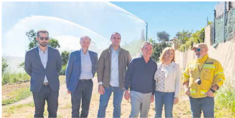
Visita institucional de la delegada del Govern, Pilar Bernabé.