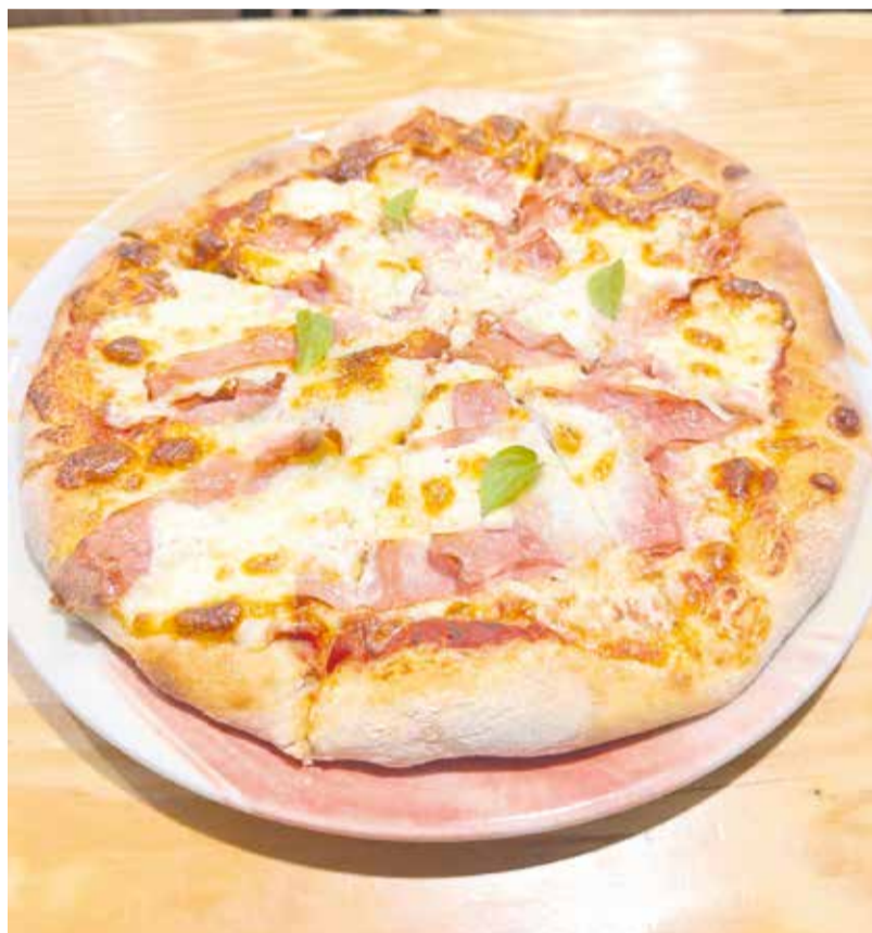
Pizza del restaurante 'La Vuelta' de Segorbe.

Ubicado en la Avenida España de Segorbe, el Restaurante 'La Vuelta' se ha consolidado como una de las propuestas gastronómicas más interesantes de la comarca del Alto Palancia. Este establecimiento destaca por una cocina que combina tradición y creatividad, integrando recetas de inspiración española con guiños a la gastronomía rumana, lo que le confiere una personalidad propia.