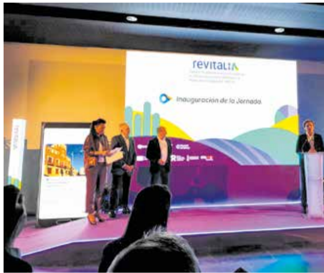
Un instante de la Jornada Revital-IA.

El proyecto, que cuenta con el apoyo de la Diputació de València y la Generalitat Valenciana, está liderado por la Fundación ValgrAI junto a la tecnológica WonderBits y se enmarca en el programa nacional de ayudas al desarrollo experimental en inteligencia artificial y espacios de datos. Con una inversión superior a los 500.000 euros, Revital-IA tiene como objetivo re-