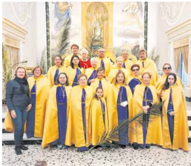
Fotografía al finalizar la Misa de Pascua.

La Semana Santa dio comienzo el Domingo de Ramos con la tradicional Procesión de Ramos y la posterior misa, que marcaron el inicio de una semana de recogimiento, devoción y reflexión en el municipio. A partir de ese momento, Godelleta vivió unos días intensos en los que se sucedieron distintas eucaristías y actos litúrgicos, con una notable participación vecinal. Entre ellos, destacó especialmente la jornada del Jueves Santo, con la celebración de la Misa de la Cena del