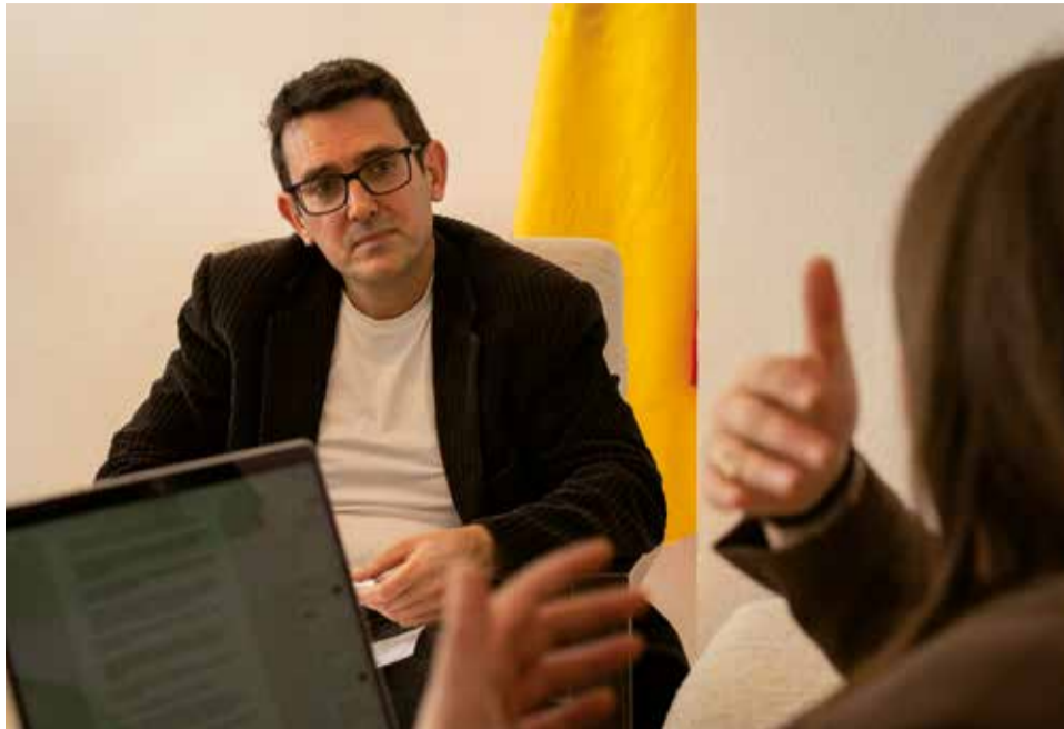
Un instant durant l'entrevista concedida a El Periódico de Aquí.

► Fent balanç de la legislatura, el centre de dia ha sigut un dels projectes més importants de la legislatura. Van anunciar que la seua obertura es produiria en 2026. En quin estat es troba actualment?