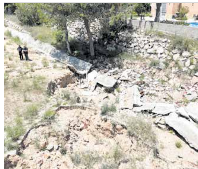
Treballs a La Llomaina de Vilamarxant.

un espai recreatiu, educatiu, i turístic que reforça el valor paisatgístic de La Llomaina i la seua seguretat enfront d'esdeveniments climàtics.