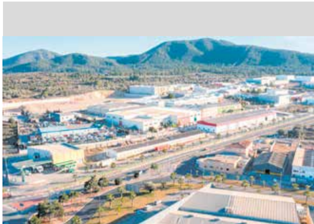
Vista del polígon industrial de Vilamarxant.

Des del consistori subratllen que esta ampliació respon a una aposta estratègica per reforçar el teixit productiu local i posicionar Vilamarxant com un enclavament