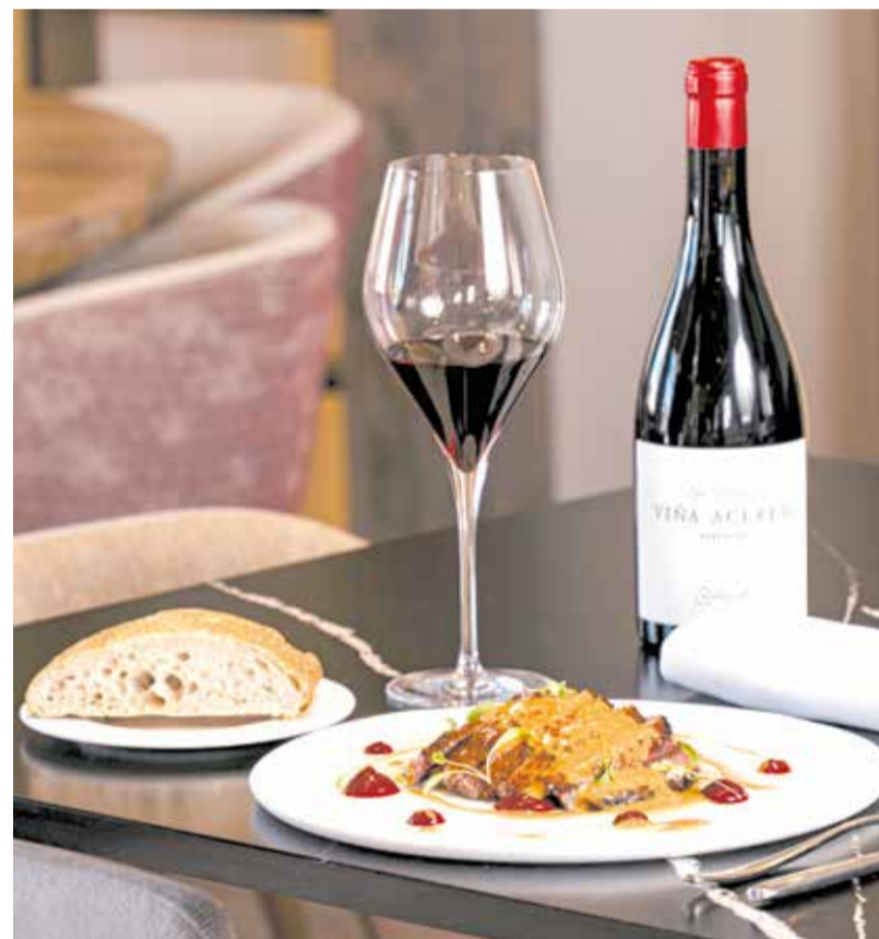
Magret de pato elaborado en 'Finca Calderón' de Requena.

El restaurante se ubica en una finca de 1901, restaurada con gusto y respeto por