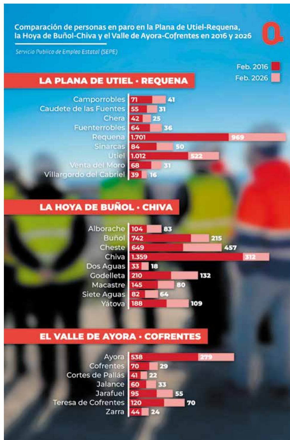
Infografía del desempleo en febrero 2016 y febrero de 2026. / JAIME SORIANO

Sin embargo, en otros municipios como Alborache, Macastre o Siete Aguas, la evolución ha sido más irregular, con bajadas menos acusadas e incluso ligeros repuntes en el último año. Esto demuestra que no todos los municipios cuentan con el mismo nivel de actividad económica y que algunos dependen más de factores puntuales o de sectores menos estables.