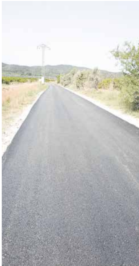
Millores als accessos de la urbanització El Pinar.

Finalment, recentment s'ha asfaltat el camí que