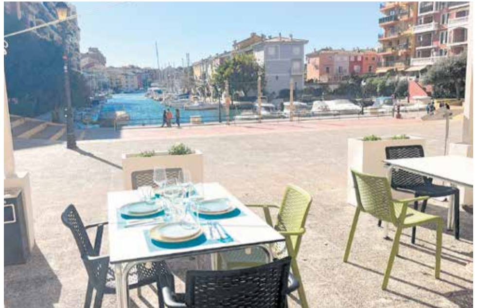
Terraza del restaurante 'Enclave de mar' ubicado en Portsaplaya.