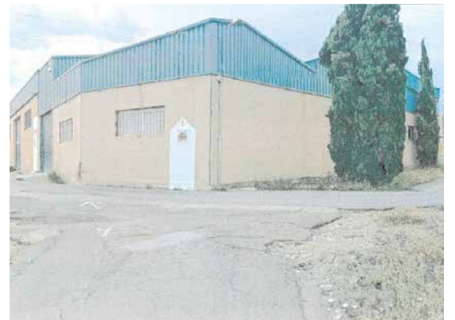
Acceso al cementerio de Macastre.

El consistorio ha subrayado también que esta actuación forma parte del compromiso municipal por continuar mejorando los servicios y espacios públicos, al tiempo que se aprovechan las líneas de ayuda disponibles para seguir avanzando en la recuperación y adecuación del municipio tras los efectos de la dana.