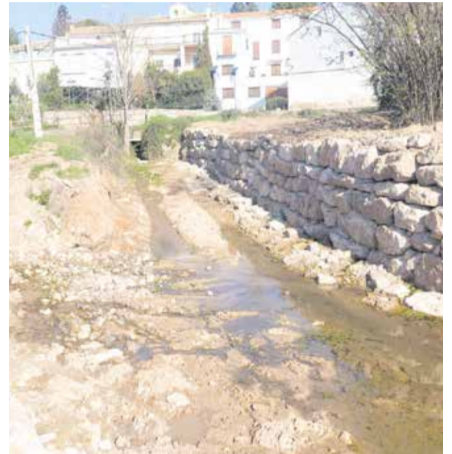
Restauración del río en Caudete de las Fuentes.

En los próximos días, la empresa adjudicataria continuará con la reparación del camino y avanzará en la instalación del vallado previsto, actuaciones necesarias para completar la interven-