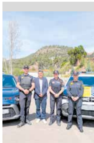
Recepció dels cotxes.

El primer —que ja disposa de tot l'equipament necessari per al desenvolupament de la labor dels agents, així com d'un desfibril·lador— ha tingut un cost de 32.799,39 euros, finançats a través d'una subvenció del Pla Obert d'Inversions 2024-2027 de la Diputació de València, i