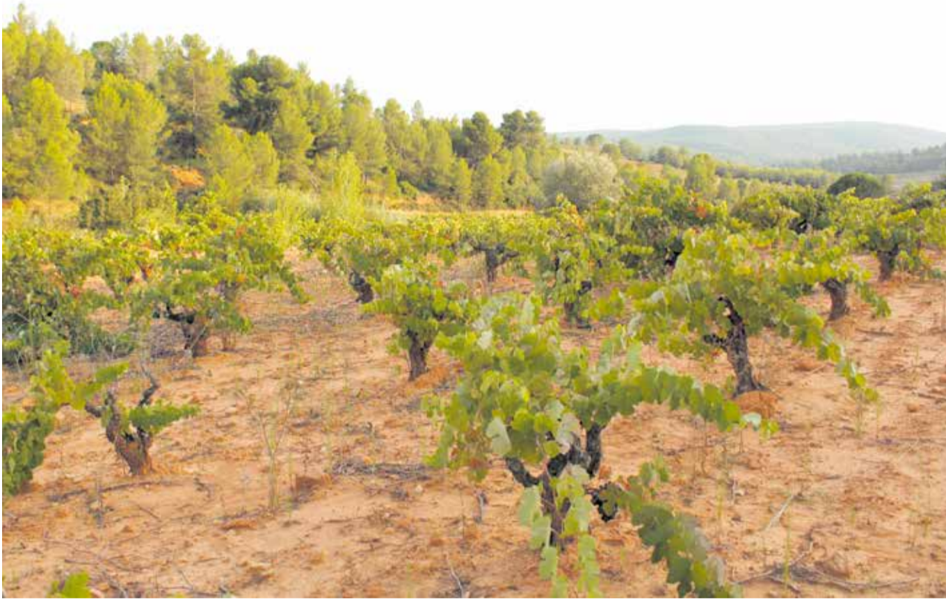
El viñedo, principal motor agrícola de las comarcas de interior. / SARA DE LA FUENTE