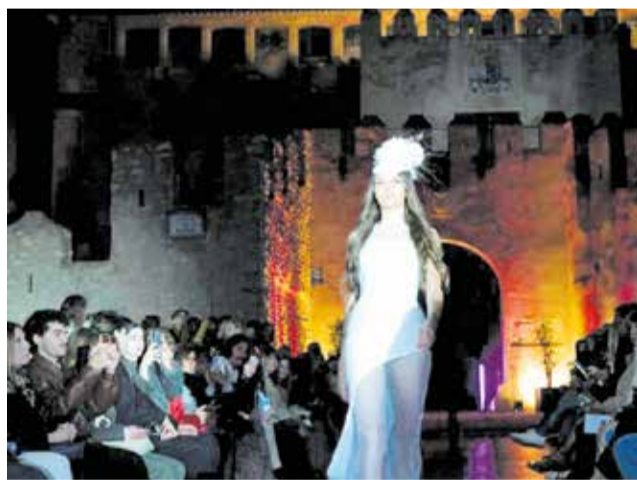
Desfilada al Castell de Benissanó.

El programa va incloure dos desfilades de la firma valenciana AO Concept Atelier, que va presentar una selec-