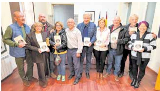
Presentación de 'Retratos del otro mundo'.

La colección 'Alcublas escribe' se ha consolidado co-