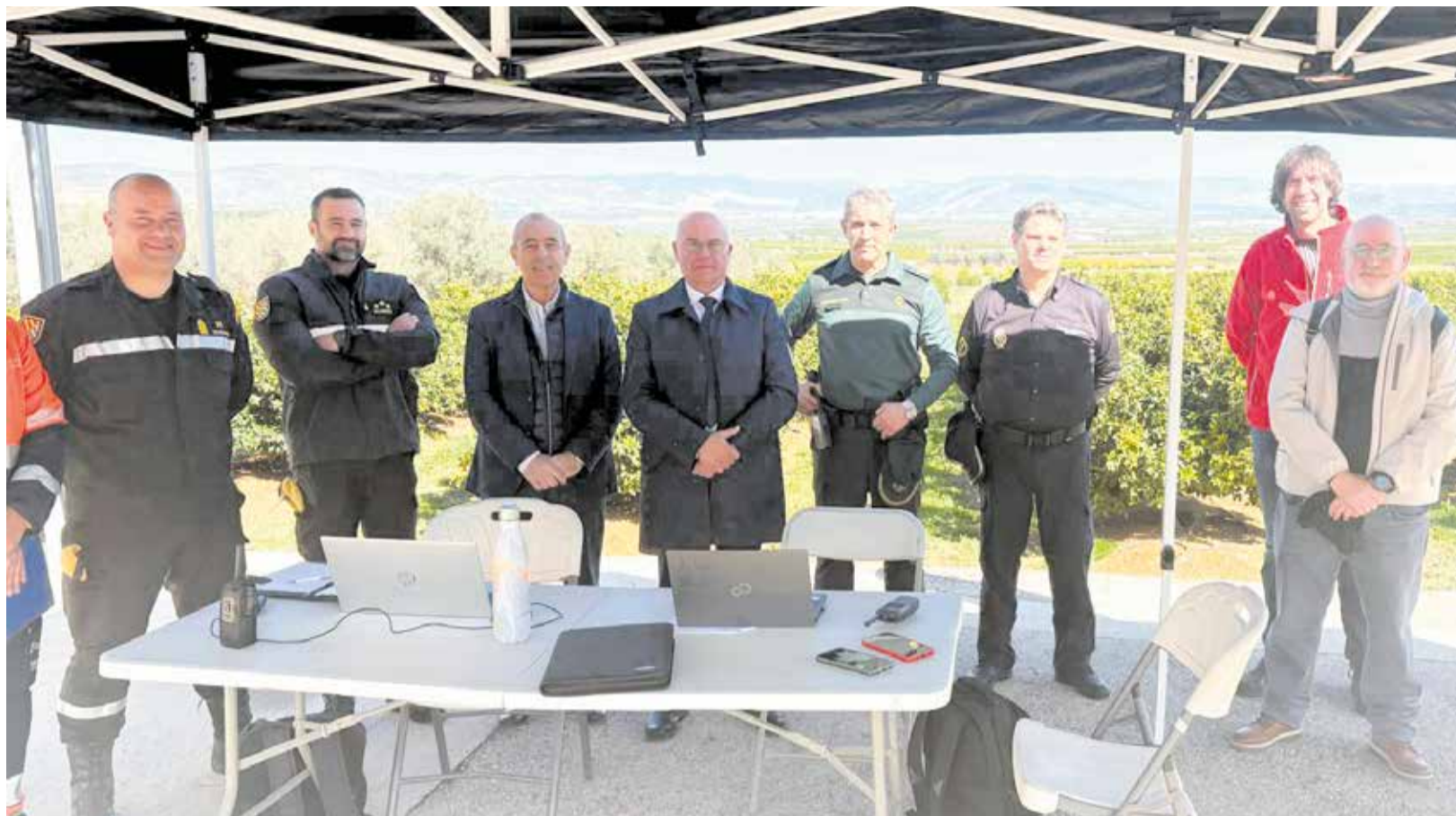
Puesto de Mando Avanzado del simulacro de evacuación de la población por rotura del embalse de Buseo.

► SOT DE CHERA, BUGARRA, PEDRALBA, GESTALGAR Y CHULLILLA, JUNTO CON CHERA, PARTICIPAN EN UN SIMULACRO A GRAN ESCALA