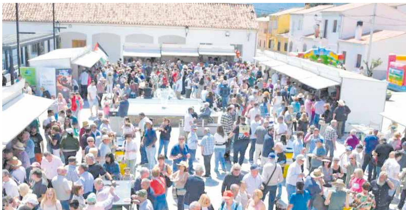
La plaza de Benagéber, abarrotada en una edición anterior de la Feria de los Pueblos Amigos.

La cita tendrá lugar el próximo sábado 9 de mayo y reunirá a numerosos municipios participantes, entre ellos San Antonio de Benagéber, San Isidro de Benagéber, Tuéjar, Sinarcas, Lliria, Requena o Buñol, además de entidades como la Reserva de la Biosfera del Alto Turia y la Comisión de Fiestas de Benagéber.