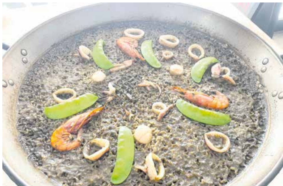
Nueva paella de calamar playa, gamba roja, vieiras, tirabeques y placton 'Enclave de mar'.

sueños e ilusiones. Todo el personal presume de estar cualificado, siempre dispuesto a brindar un excelente servicio, atento, personalizado, cuidando cada detalle, garantizando que sea una experiencia perfecta e inolvidable. En su cocina mediterránea destacan sabores bien conjuntados, platos elaborados con ingredientes frescos de primera calidad y