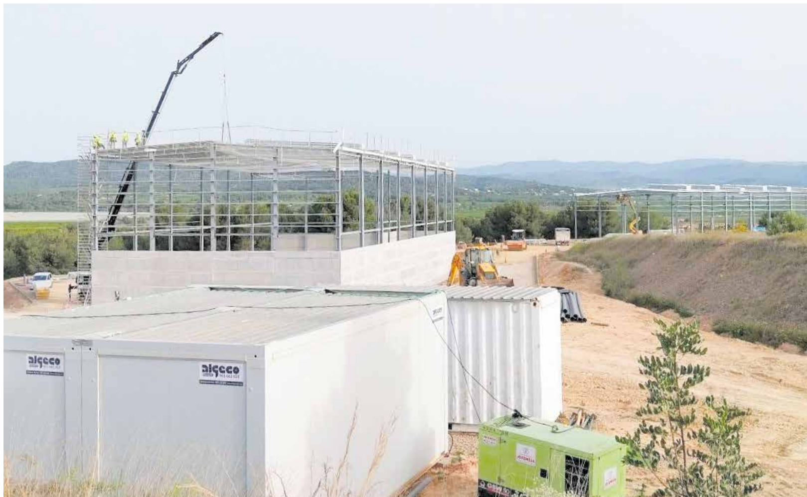
Obras de la nueva planta de voluminosos de Lliria.

► LA INFRAESTRUCTURA SERÁ CLAVE PARA REDUCIR LAS TONELADAS DE RESIDUOS QUE SE DEPOSITAN EN EL VERTEDERO