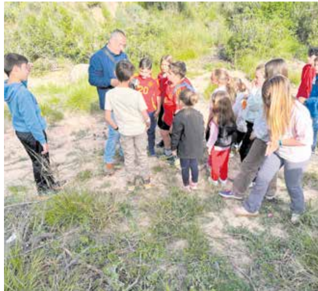
Actividades de educación ambiental celebradas en Bugarra.

Una de las actividades más destacadas ha sido "Descubriendo la fauna secreta de Bugarra", dentro del programa Pascua en los Parques, una experiencia que ha permitido a las personas participantes adentrarse en el conocimiento de la biodiversidad local a través