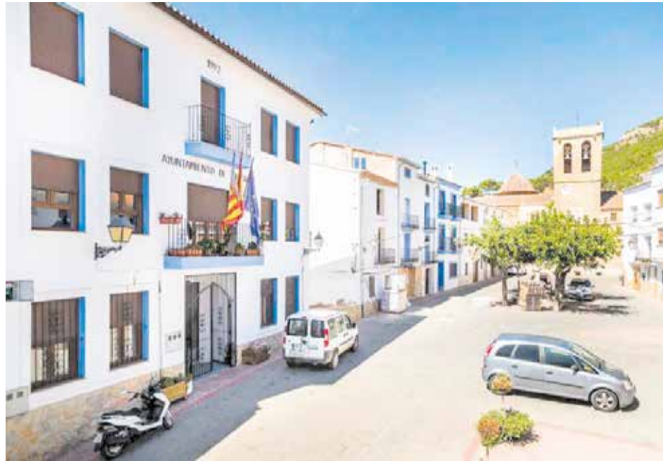
Fachada del ayuntamiento de Titaguas.

En total, se instalarán 803 contadores de agua potable equipados con módulos de telelectura mediante tecnología de radio LoRaWAN, lo que permitirá integrar todos los