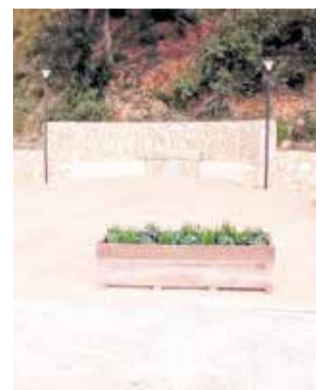
La Canaleta.

Cabe recordar que la fuente ya fue objeto de una primera rehabilitación en octubre de 2024, en el marco del Plan de Inversiones 2020-2021 de la Diputación de Valencia, con una inversión de 29.618,10 euros. Sin embargo, los efectos de la dana provocaron graves daños que obligaron a su reconstrucción.