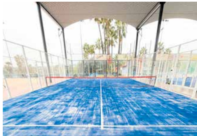
Pista de pádel en Pedralba.

El proyecto contempla una segunda fase en la que está prevista la construc-