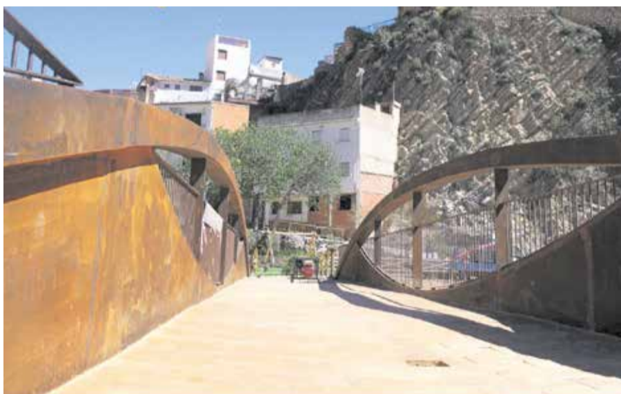
Nuevas pasarelas peatonales sobre el río en Sot de Chera.