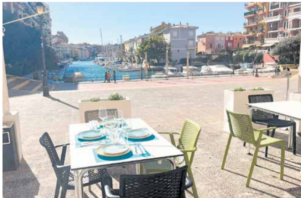
Terraza del restaurante 'Enclave de mar' ubicado en Portsaplaya.