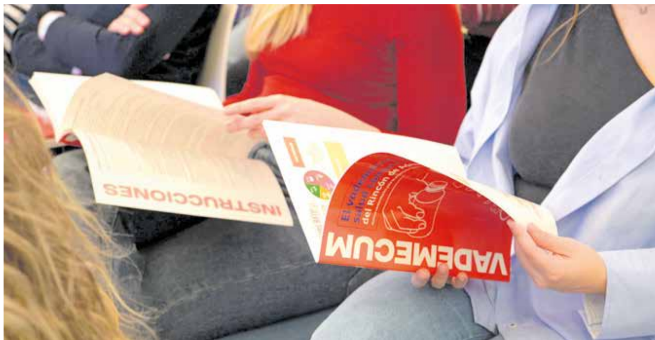
Vademecum de salud comunitaria del Rincón de Ademuz. / FARMAMUNDI

El vademécum recopila actividades, espacios y servicios que ya existen en el territorio: desde talleres de artesanía y actividades deportivas hasta entornos naturales o recursos públicos. La idea es sencilla: que cuidarse no dependa solo de tratamientos médicos, sino también de lo que la propia comarca puede ofrecer en el día a día.