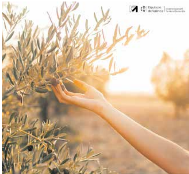
El proyecto ‘My Olive’ está en fase de desarrollo.

Nacido con el objetivo de dinamizar la economía local, atraer inversores y generar nuevas oportunidades de desarrollo empresarial, Higueruelas Impulsa ya está comenzando a transformar el posicionamiento del municipio más allá de sus fronteras.