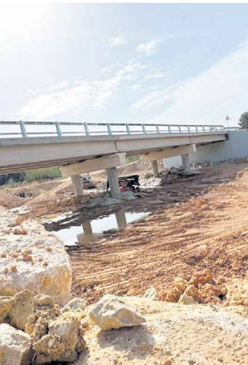
Después de su reconstrucción. / EPDA