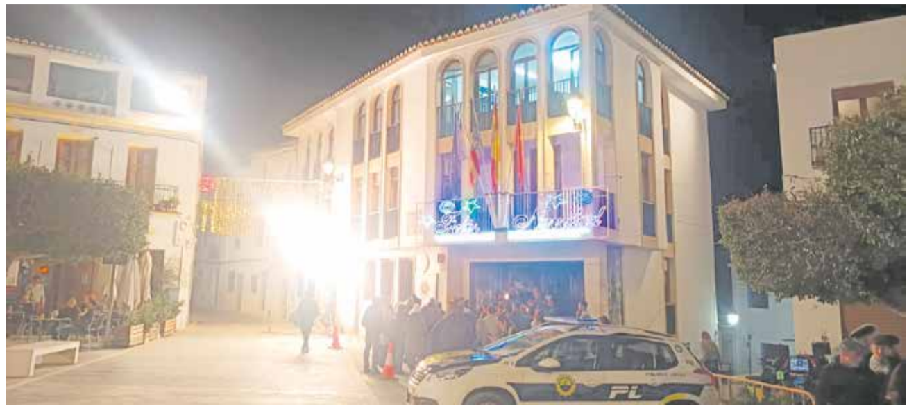
Rodaje de la película 'Buitres' en Chulilla.

Aunque el hermetismo es máximo en torno a las escenas rodadas, desde el consistorio tienen claro que Chulilla dejará su huella en la película.