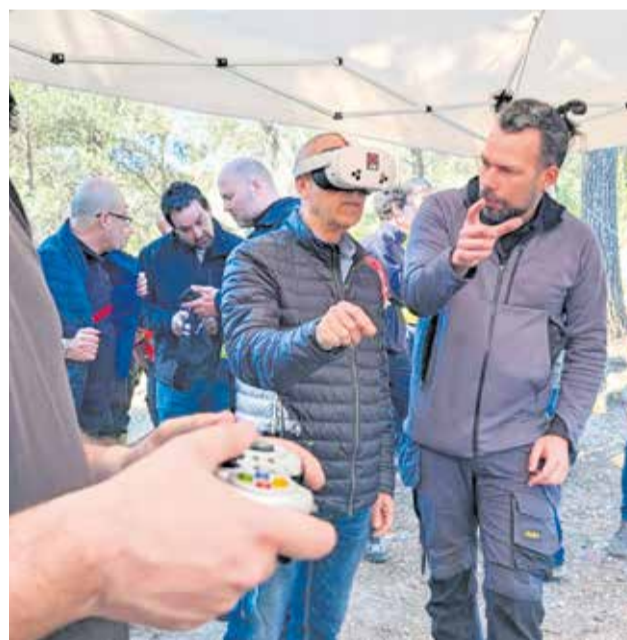
Diferentes instantes durante el simulacro en el embalse de Benagéber.

tornos de riesgo. También se probaron sistemas de envío de 'tracks' y datos en tiempo real, esenciales para la toma de decisiones en emergencias complejas.