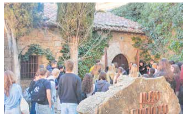
Visita al Museo Etnológico de Alpuente.

Uno de los elementos clave de la estancia ha sido la con-