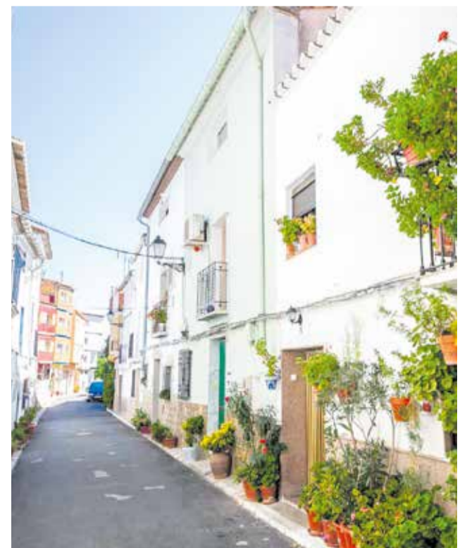
Una calle del municipio.

En Calles lo tienen claro: cada curso que empieza con alumnado es una señal de continuidad. Y ahora quieren que esa historia quede registrada antes de que se pierda en álbumes familiares o cintas olvidadas.