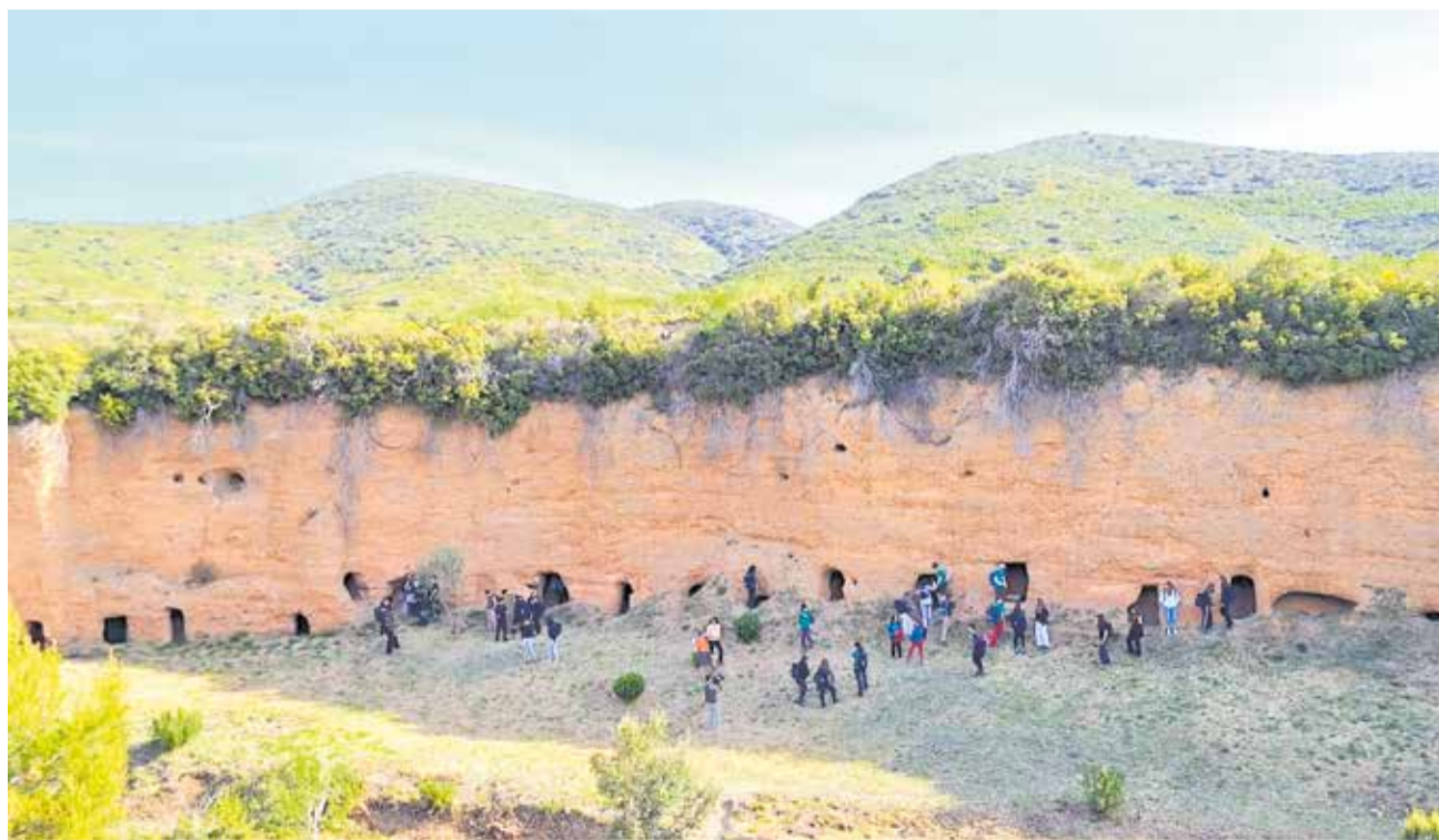
La expedición juvenil Cavanilles en una actividad organizada en Andilla.

La estancia en La Pobleta, donde se instaló el cam-