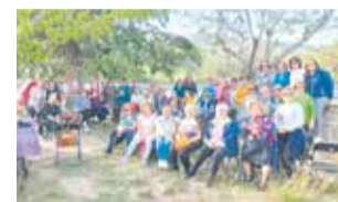
Actividades. / EPDA

merienda en Santa Bárbara, mientras que el segundo fin de semana incluyó aperitivo, tardeo y discomóvil.