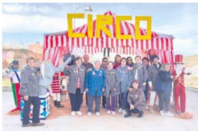
Las mujeres frente al monumento fallero.

Allí, la Asociación de Mujeres del municipio volvió a levantar, un año más, su propia falla. Esta vez bajo el lema ‘Bienvenidos al circo’, una propuesta tan colorida como simbólica que convirtió la plaza en un pequeño espectáculo al aire libre. Payasos, equilibristas y personajes imposibles tomaron forma en ninots hiperrea-