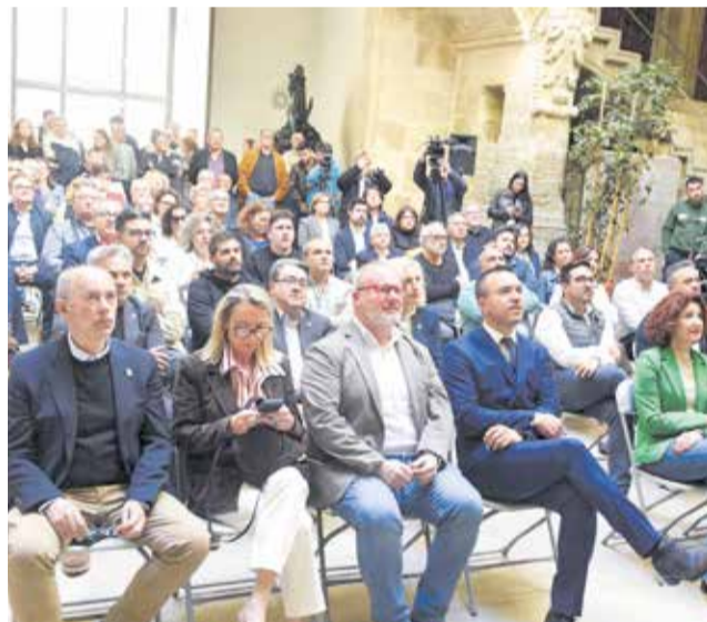
Presentación de Gestifoc en la Diputación.

Una de las principales novedades de la convocatoria de este año es la simplificación