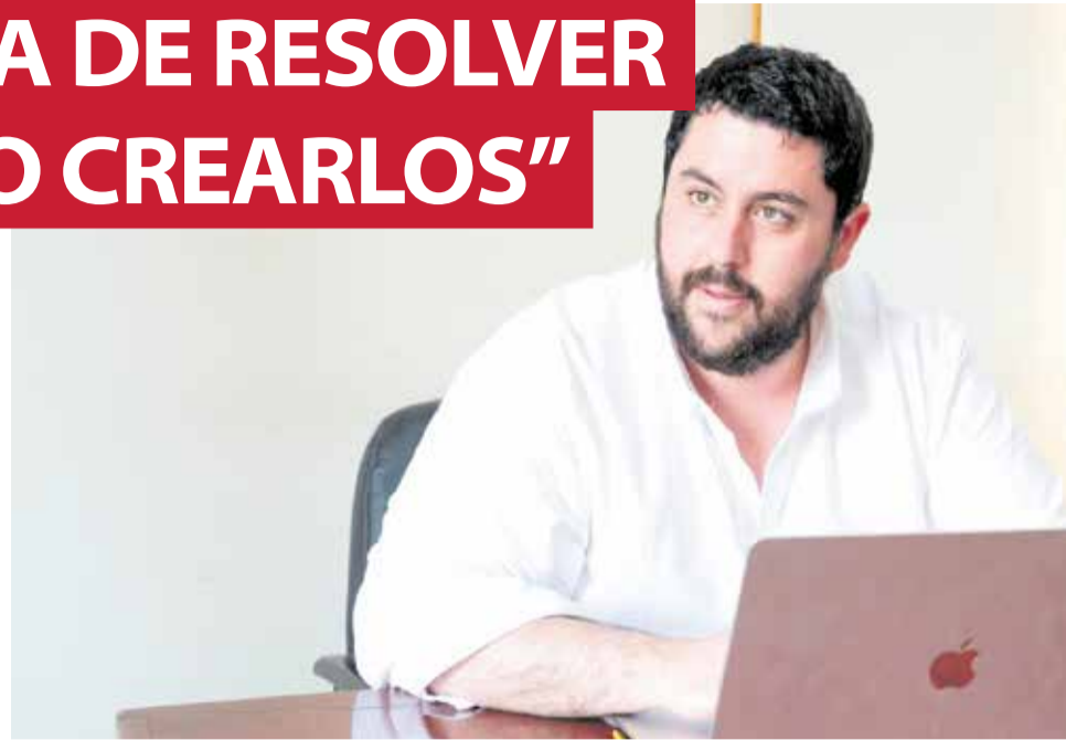
El presidente de Unión Municipalista, David García.

Estamos agrupando a los alcaldes y concejales de ca-