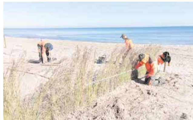
Treballs de protecció i revegetació dunar a les platges de Perelló (esq., 2026) i Motilla (dta., 2025).

va servir per traslladar les principals preocupacions dels tres municipis costaners. Sanjaime i Sáez coincideixen: "L'aportació d'arena no és una solució definitiva. Més enllà dels temporals i els corrents, caldria estudiar com està afectant l'ampliació del Port de València a les platges del sud. No estem en contra d'esta actuació, però la societat està patint-la".