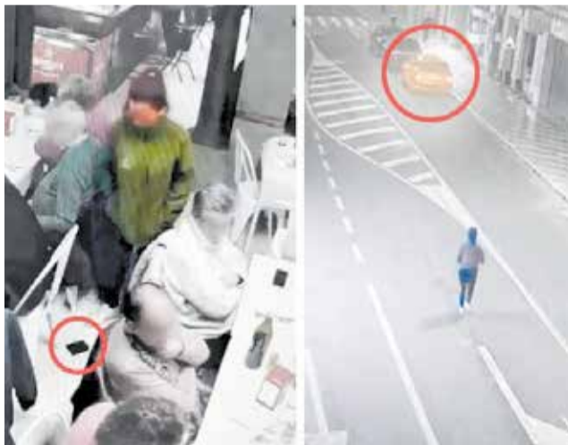
Càmeres de seguretat a Alberic.

Els fets es van produir a mitjans del mes de març, quan un home estava a l'interior d'un bar i la seua cartera va caure a terra. Seguidament, tal com es pot observar en les càmeres de vídeo de l'establiment, la dona va passar pel costat pe-