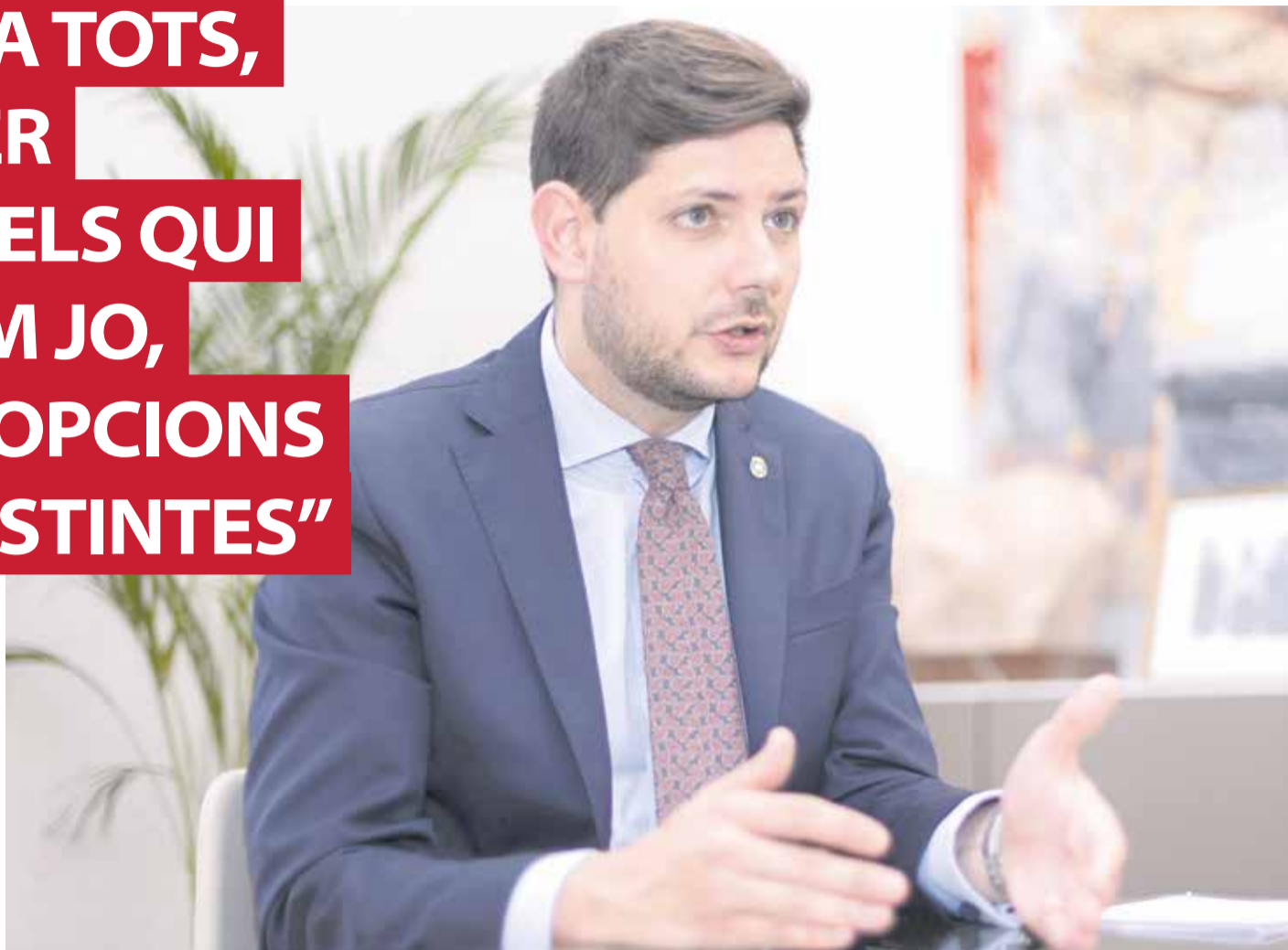
L'alcalde de Gandia, José Manuel Prieto, durant l'entrevista concedida a El Periódico de Aquí a l'ajuntament de Gandia.

► Com he dit, més de 130 milions d'euros en marxa en projectes. No sols inversions privades, que també, sinó estímul públic. En el nostre capítol d'inversions, el més alt probablement des de fa moltes dècades, venen més de 20 milions d'euros enguany. La transformació de Sanxo Llop jo crec que és una de les més importants. Generem un nou sector urbanístic que havia sigut un conflicte per a la ciutat i que, com molts altres problemes heretats, hem solucionat. Sanxo Llop és una inversió que està ja al 70 % d'execució i desenvoluparà en eixe sector no sols equipaments públics –com el Centre de Dia de Diversitat Funcional– sinó també hotels, residències privades, residències per a persones