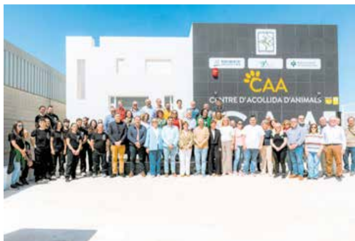
Inauguració del Centre d'Acollida d'Animals a l'Alcúdia.

Després d'una inversió d'uns 1,3 milions d'euros, les instal·lacions podran albergar 126 gossos, 76 gats i un cavall, amb mòduls adaptats