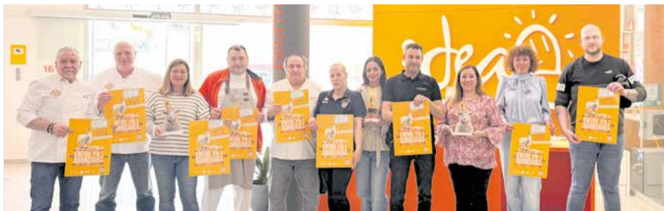
Presentació de la campanya 'Entre pa i borreguet' d'IDEA Alzira.

nales, un sector clave por su calidad y su papel vertebrador en el territorio. El servicio municipal coordinó íntegramente la campaña: desde la imagen gráfica y la web hasta la captación de participantes (hornos y bares) y la difusión en medios, así como acciones de street marketing y su lanzamiento. Además de reivindicar el 'esmorzar' valenciano, esta ruta fomenta sinergias duraderas entre hosteleros y panaderos que perduran más allá del evento.