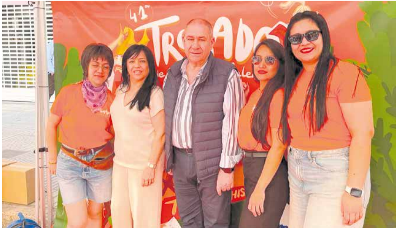
El regidor i la responsable del departament junt a les educadores ambientals.

Recentment, dos esdeveniments han posat novament a prova el servei: la Tamborada Local i la Trobada d'Escoles en València de la Ribera. Dos celebracions multitudinàries, amb una gran participació ciutadana, que han omplert els carrers de música, cultura i vida. I, una vegada més, darrere de cada jornada festiva, hi havia un equip treballant sense descans