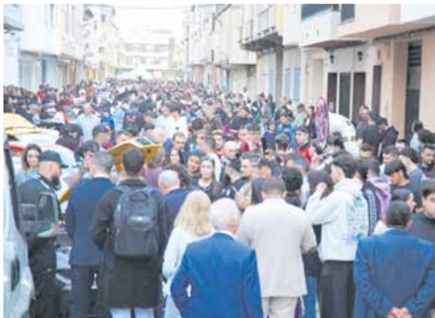
Afluència de visitants a la XVIII Agroguadassuar.

Des de l'organització, han destacat l'optimització de la distribució dels espais, la incorporació de nous serveis