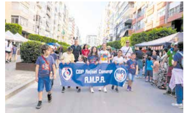
Les escoles d'Alberic en la Trobada d'Alzira