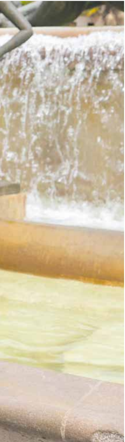
s visitantes recibe en Valencia.

vez los 16.000 millones de euros en turismo internacional, un 6 % más que el año anterior. Esto significa que estamos atrayendo a un perfil de turista con mayor capacidad de gasto, lo que genera más riqueza y mejores empleos. Por tanto, hay una hoja de ruta clara: reindustrialización, orden administrativo y turismo de valor.