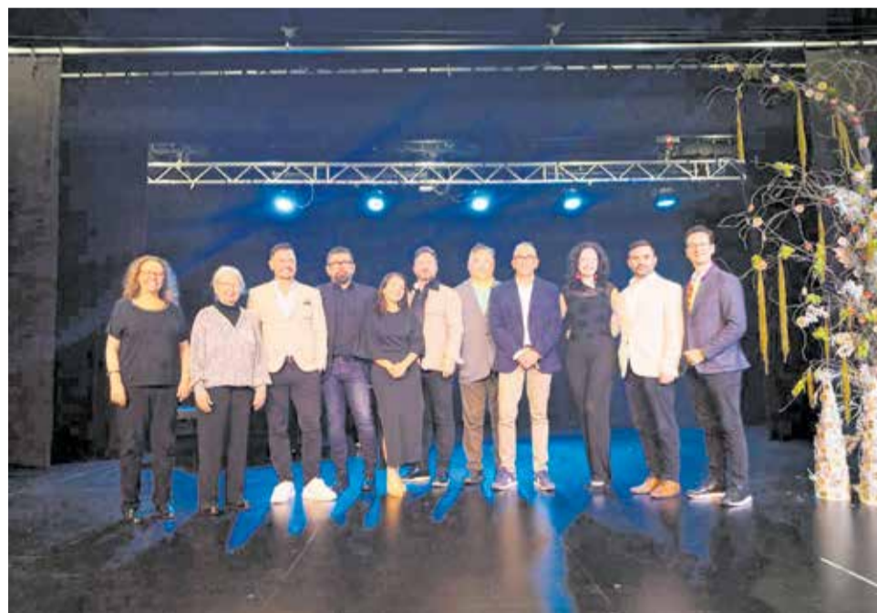
Concursants i jurat de la IX edició del Concurs Internacional de Cant de Polinyà.