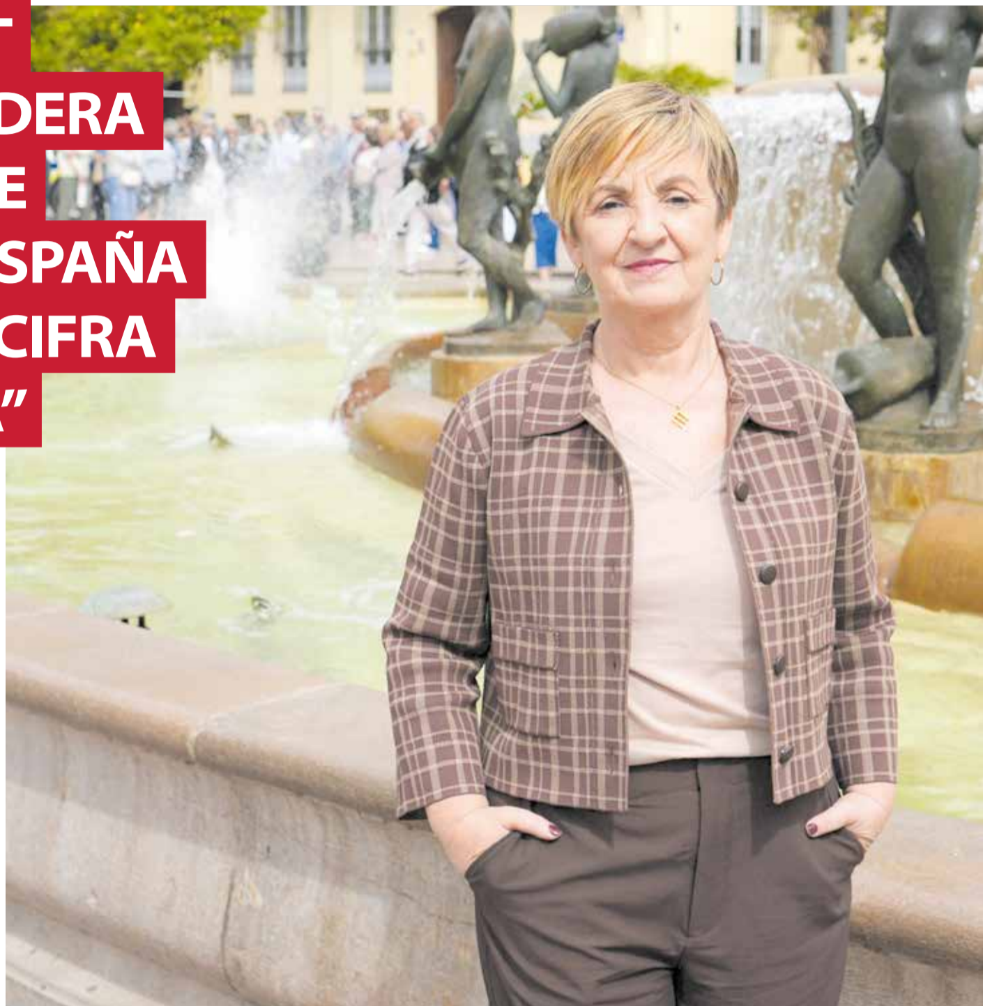
La consellera de Industria, Turismo, Innovación y Comercio, Marian Cano, en la Plaza de la Virgen, uno de los lugares que más

Esa base logística se complementa con nuestra ambición exterior. El Plan de Promoción Exterior 2026 es nuestra gran apuesta por la internacionalización. Hablamos de 88 acciones de impacto en 38 mercados estratégicos. No se trata simplemente de vender productos fuera; el objetivo es posicionar a la Comunitat como un territorio competitivo, innovador y,