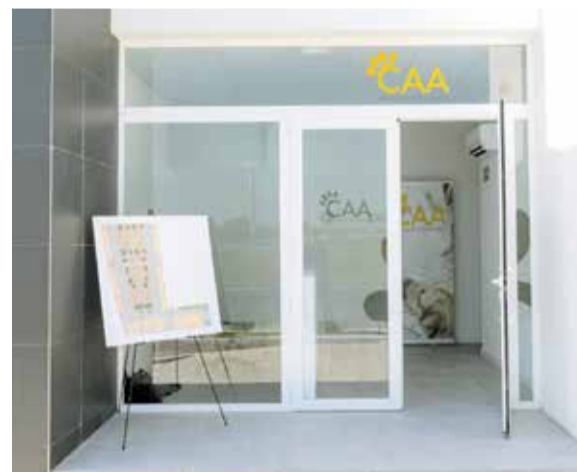
Entrada al centre i plànol de les instal·lacions.

a les necessitats de cada animal i patis comuns repartits en una superfície total de 4.053,22 m 2 . També hi ha una sala de consulta veterinària i espais dedicats a la formació, les reunions i les visites, a més d'un quiròfan.