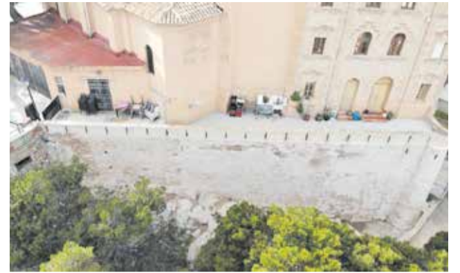
Vista aèria de la muralla del Castell de Cullera.