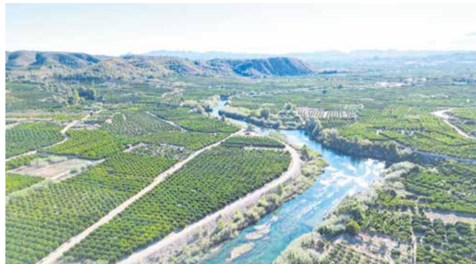
La seu de la Mancomunitat de la Ribera Alta a l'esquerra i la vista aèria del riu Xúquer, que vertebrava la comarca.