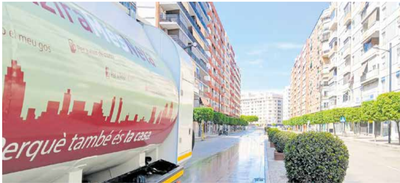
Camió de FOVASA.