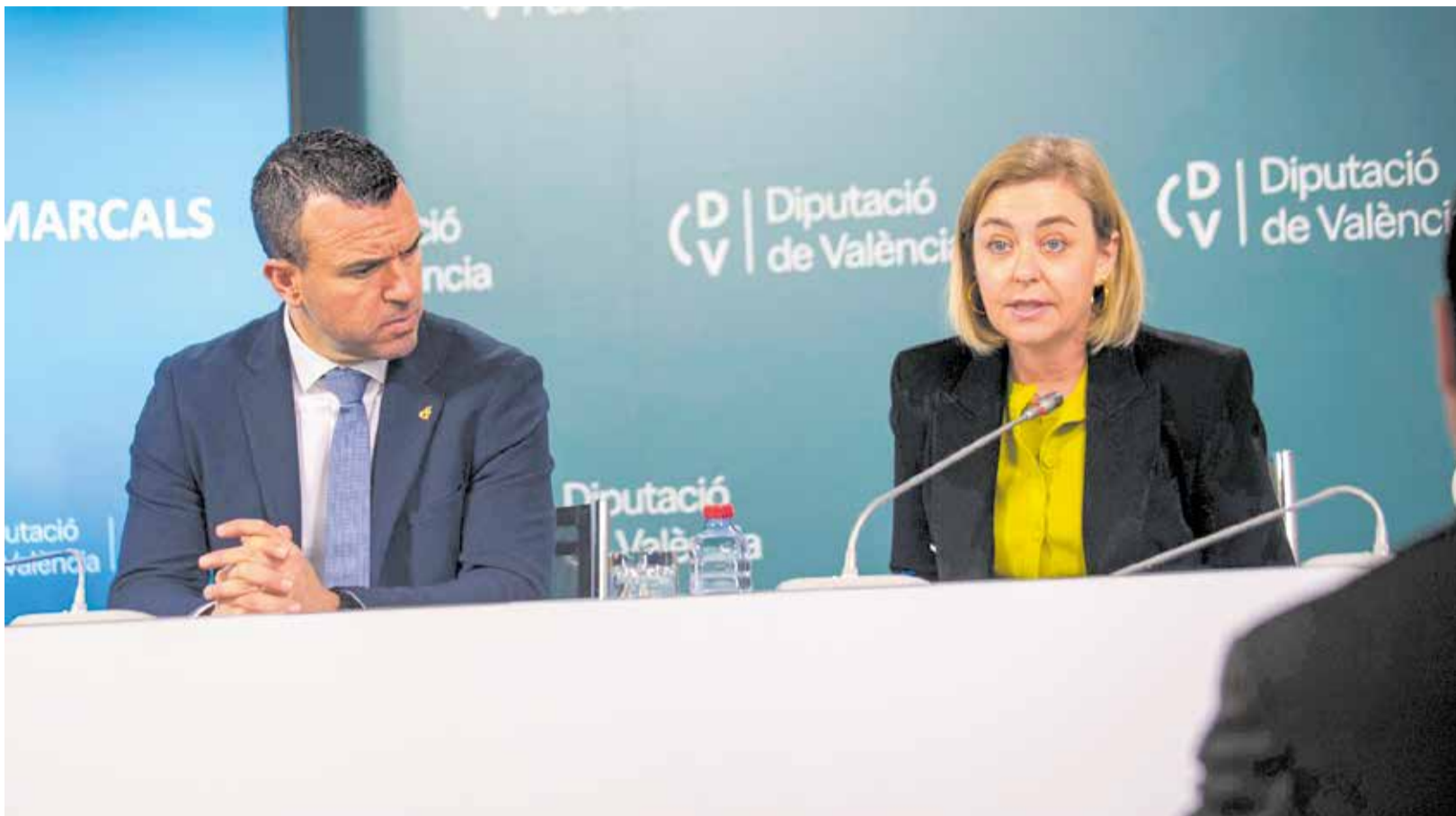
El president de la Diputació de València, Vicent Mompó, i la vicepresidenta, Natàlia Enguix.

► BARX ÉS EL MUNICIPI QUE COMPTA AMB MÉS INICIATIVES APROVADES EN L'ÚLTIM DECRET PROVINCIAL AMB UN TOTAL DE QUATRE