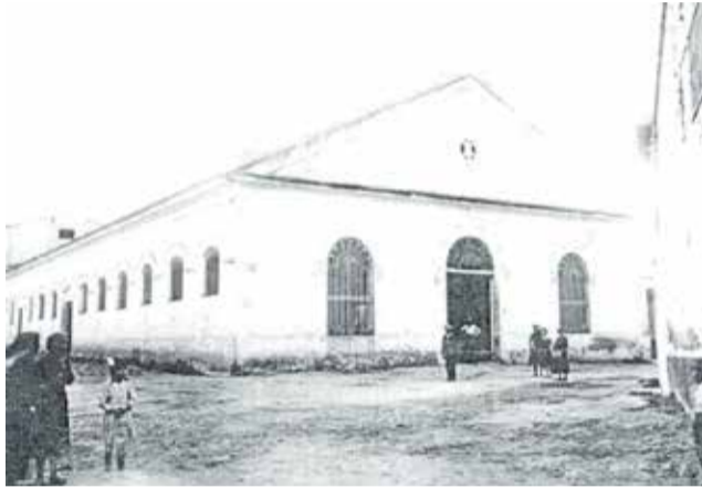
Antic molí d'arròs d'Alberic.

El projecte, amb un pressupost de 1.259.063,47 euros i una previsió de nou