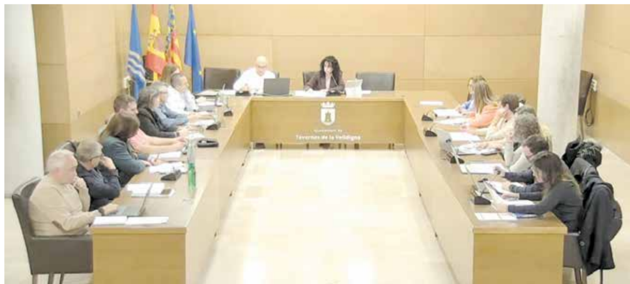
Últim plenari d'abril de l'Ajuntament de Tavernes de la Vall d'Alldigna.

A més, va advertir que durant esdeveniments multitudinaris com els focs artificials s'han produït situacions en què “moltes