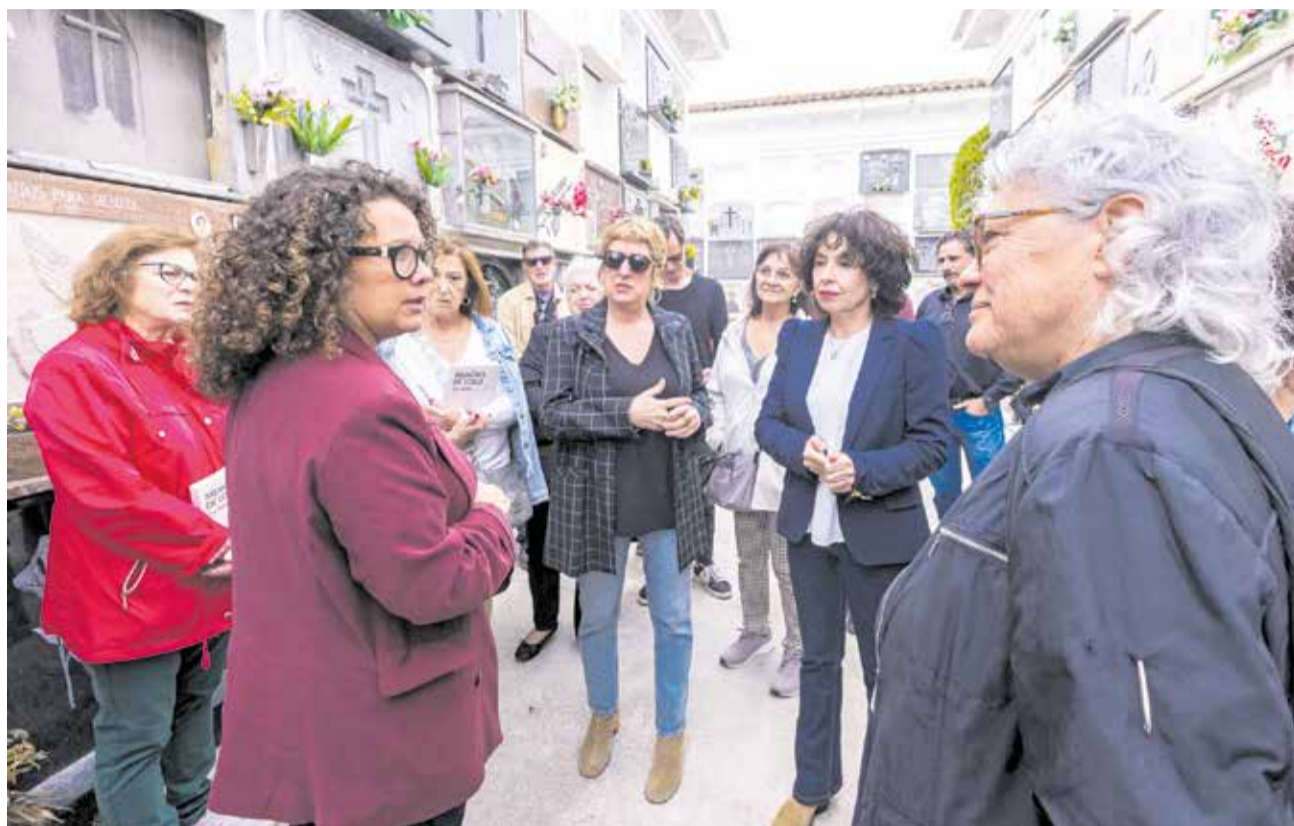
Acte d'anunci públic del nom dels quatre primer identificats a les fosses de Gandia.

Izquierdo també va reclamar més implicació institu-