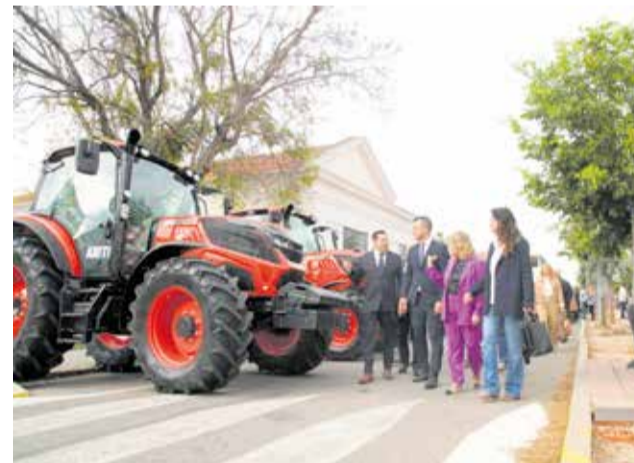
Visita institucional en la inauguració de la fira.

i una programació diversa i equilibrada.