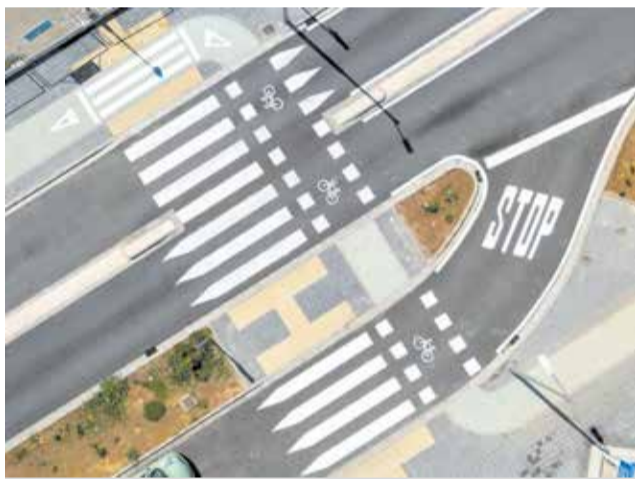
Obres a la N-332 al seu pas per Sueca.