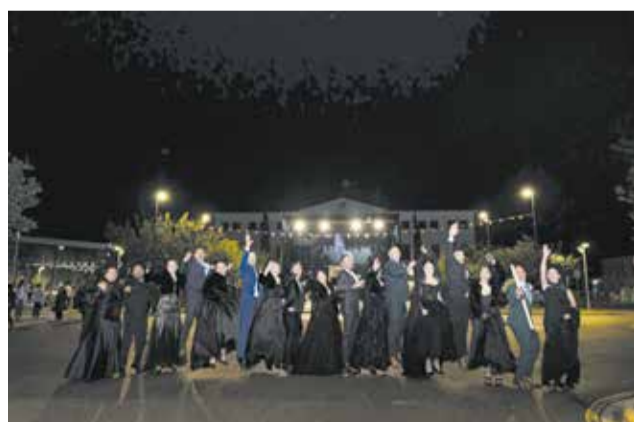
Diferents moments de les festes de Sant Vicent Ferrer i la Immaculada Cncepció a Gavarda.

Un dels elements diferencials d'esta edició ha sigut el paper del grup de festeres i festers, que per primera vegada va protagonitzar una presentació oficial, sent este l'acte que donava inici a la resta de