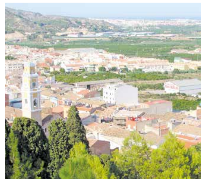
Vista del municipi d'Ador.

L'informe desfavorable sobre riscos en el territori i la falta de documentació motiven l'arxivament