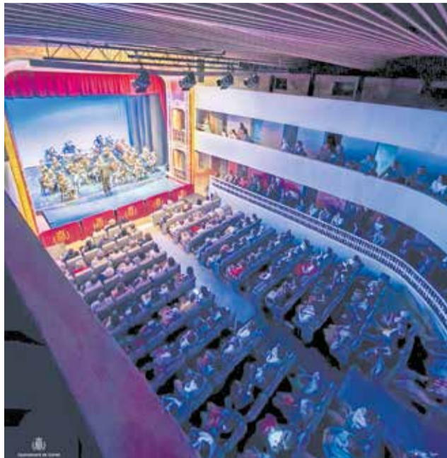
Reapertura del Teatro El Siglo de Carlet después de su rehabilitación.

Entre las principales actuaciones realizadas destacan la mejora integral del