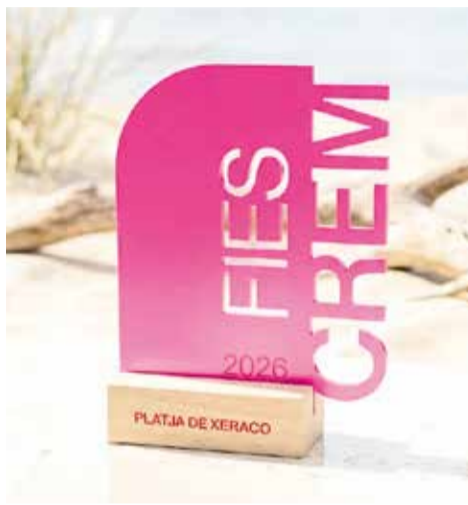
Un dels trofeus de Fiescrem 2026 (dreta) i una edició anterior (esquerra).

En la categoria tradicional, el jurat realitzarà un tast a cegues centrat exclusivament