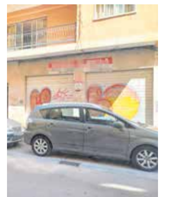
Façana del nou local.

El Punt de Trobada Familiar és un servei específic que presta temporalment atenció