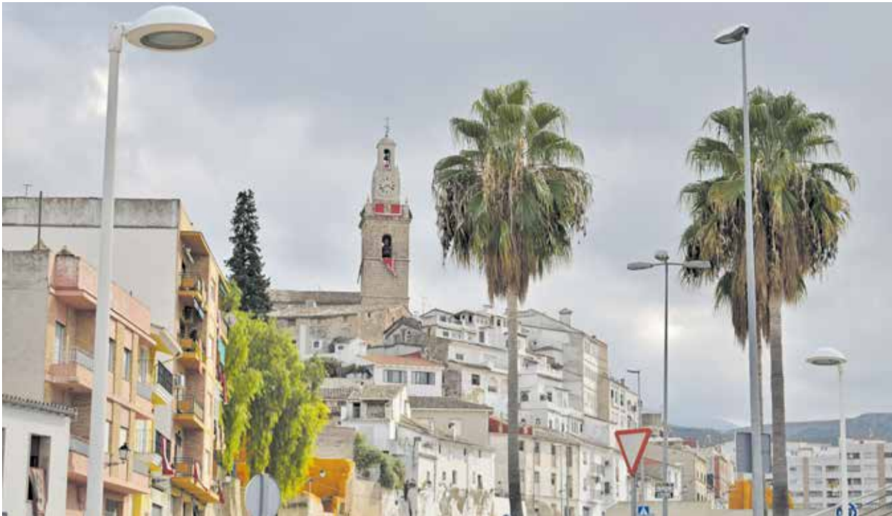
Vista del municipi d'Albaida.