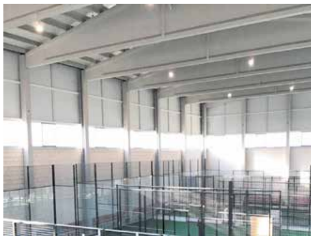
Interior del poliesportiu del municipi.