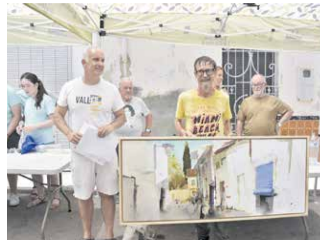
Un dels guanyadors d'una edició anterior.

La inscripció es realitzarà el mateix dia del concurs, entre les 7.30 i les 9.00 hores, a l'Ajuntament, on es procedirà al segellament dels suports de les obres. A partir d'eixe moment, els participants disposaran del matí per fer els seus treballs in situ, amb tècnica i format lliures, prenent com a