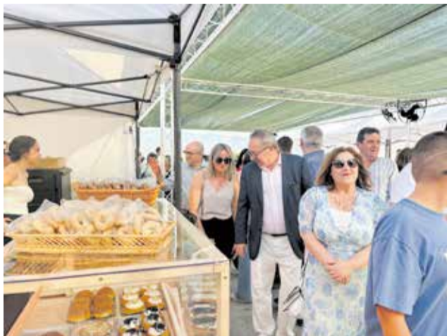
Edició anterior de la fira d'Alfarrasí.

L'edició d'enguany aposta per la diversitat d'activitats per a totes les edats, destacant especial-