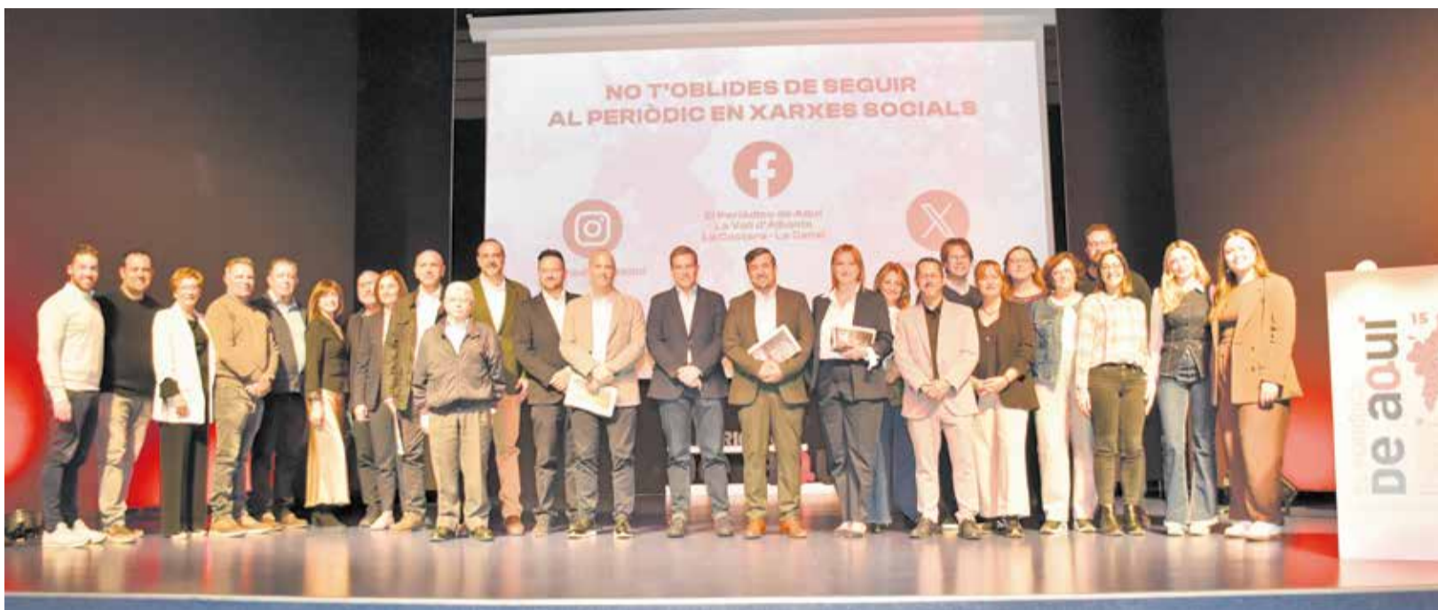
Foto de les autoritats que assistiren a l'acte de presentació del projecte en societat.

► 200 PERSONES DE LES TRES COMARQUES VAREN OMLIR EL CENTRE CULTURAL DE XÀTIVA EN LA PRESENTACIÓ DEL PROJECTE