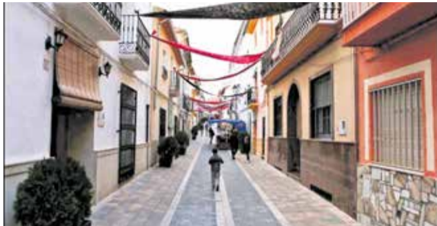
Un carrer de Ràfol de Salem.

L'Ajuntament impulsa este projecte estratègic per a la dinamització del municipi a través del comerç local, amb una actuació innovadora que combina eines digitals, ac-