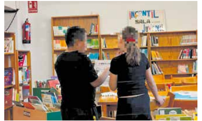
Biblioteca Tutorizada de Enguera.