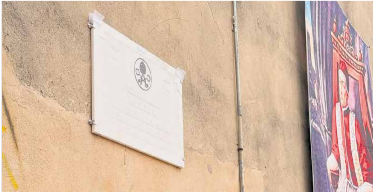
Fira Turística 'Calixte III' a la Torreta de Canals amb gran participació i activitats culturals i històriques.

També es va destacar la continuïtat de les visites guiades gratuïtes per l'arqueòloga local Marta Pardo, tant al To-