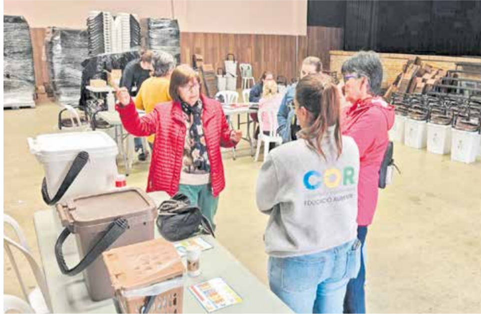
El COR en una jornada de la Mancomunitat de la Canal de Navarra.

En la Canal de Navarra, los vecinos deben depositar cada fracción el día correspondiente: