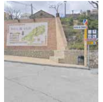
Accés al municipi.

En este procés, la Direcció General de Règim Jurídic i Autòmic i Local va validar