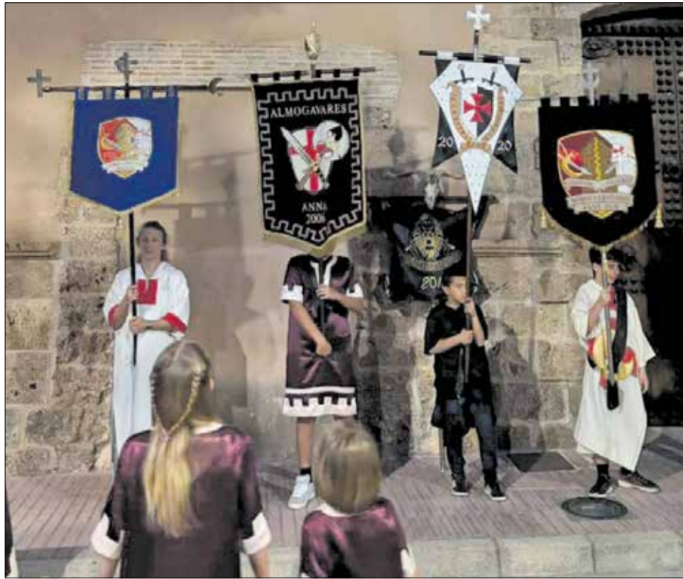
Acto del cambio de cargos de los Moros y Cristianos de Anna. / TEMPLARIOS ANNA

Actualmente, la fiesta está formada por 10 comparsas. En el bando cristiano se encuentran Almogávares, Contrabandistas y Arqueros, además de Salvajes y Templarios. En el bando moro participan La Kabila, Ben-Bons y Al-Azraq, junto a Al-Parrús y Mandingas.