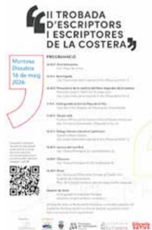
Cartell oficial/ EPDA

La jornada, de 10 a 14 h, inclourà actes de benvinguda i cloenda, la presentació de "Llegendes de la Costera", una visita guiada per la