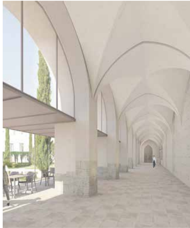
Presentació del projecte (dalt) i recreació del nou Centre Raimon d'Activitats Culturals (baix).