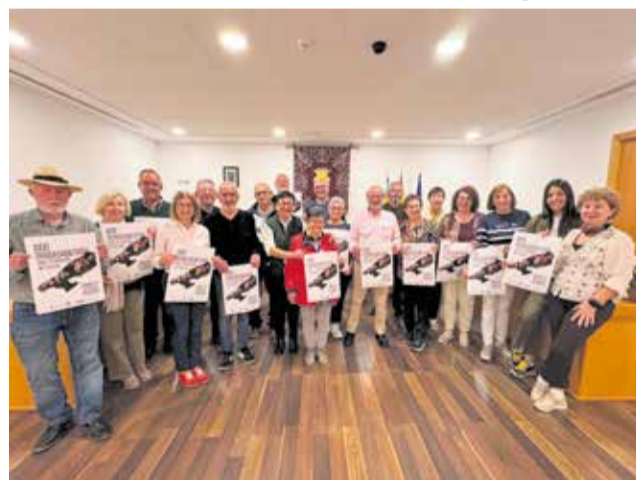
Presentació de la 31a Trobada de Cors.

La jornada del 30 de maig es desenvoluparà en dos moments destacats. A les 17.00 hores tindrà lloc un passacarrer pels carrers de la localitat, que permetrà apropar la música coral a la ciutadania i generar