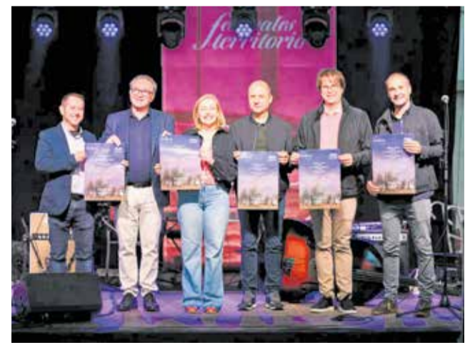
Inauguració del Festival Nómade a Moixent.