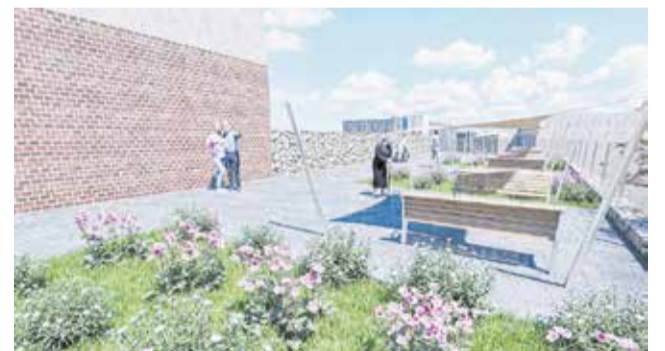
Recreació del projecte.

El calendari previst contempla que la licitació es resolga en les pròximes setmanes i que les obres puguen executar-se al llarg de 2026. L'Ajuntament destaca que aquesta actuació no sols millorarà l'entorn urbà, sinó que també reforçarà els serveis socials i l'atenció a les persones majors.