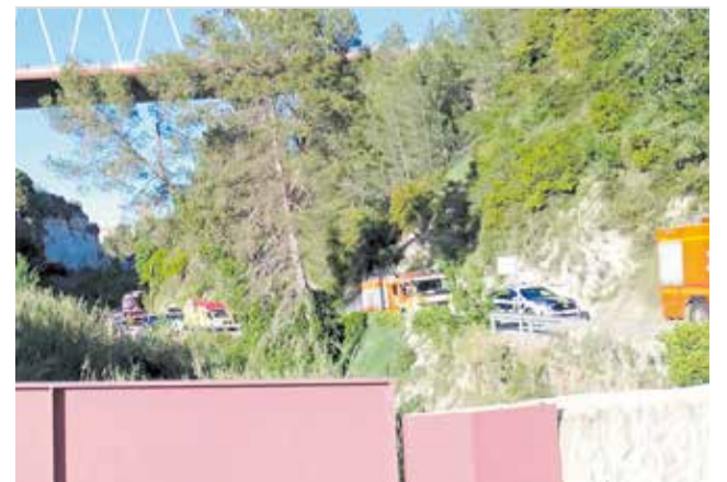
Vehicles d'emergències a l'entorn del succés.

El succés ha deixat una profunda petjada en la ciutat, especialment entre el teixit social i hostaler.