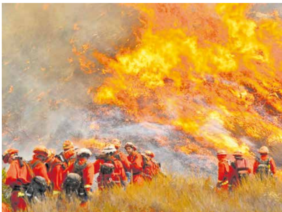
El fatídic incendi forestal de Montixelvo.

cent Mompó, i el diputat de Medi Ambient, Avelino Mascarell, arriba enguany amb una novetat destacada: la reducció a la meitat de la burocràcia. Segons han explicat, l'objectiu és agilitzar els tràmits perquè els ajuntaments puguin executar abans les actuacions preventives i millorar la resposta davant el risc d'incendis.