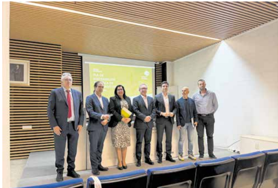
Presentació dels resultats del Pla de Sostenibilitat Turística en Destinació.

La conclusió compartida pels participants va ser clara: la Vall d'Albaida ha demostrat que és possible avançar cap a un model turístic competitiu si existixen visió compartida, metodologia i cooperació entre administracions, empreses i personal tècnic. El PSTD no representa el final d'una etapa, sinó l'inici d'un camí que reforça la identitat comarcal i aposta per un desenvolupament turístic equilibrat i sostenible.