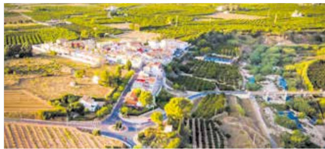
Vista del municipi de Vallés.

L'Aplec no només serà una exhibició artística, sinó també un espai de convivència entre pobles, on participants