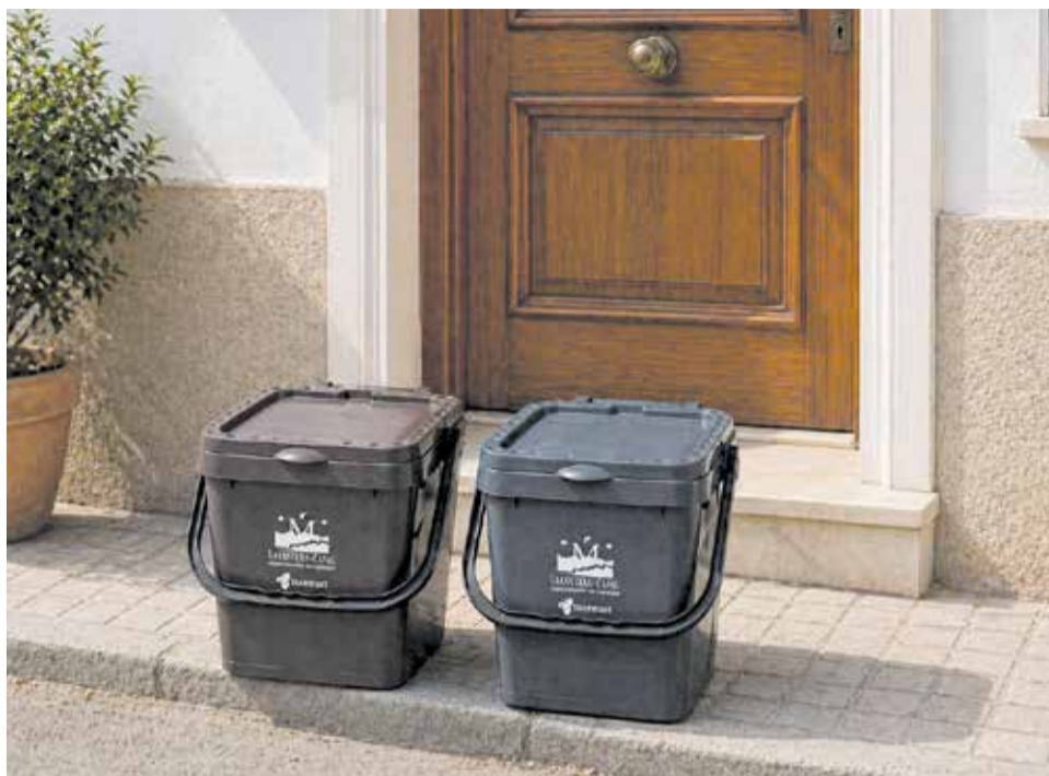
Nous poals per al sistema 'Porta a Porta' de la Mancomunitat.

El canvi principal afecta la fracció resta i l'orgànica, que passen al sistema porta a porta.