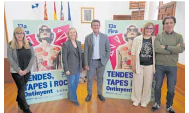
Presentació de la XIII Fira de Tendes, Tapes i Rock.