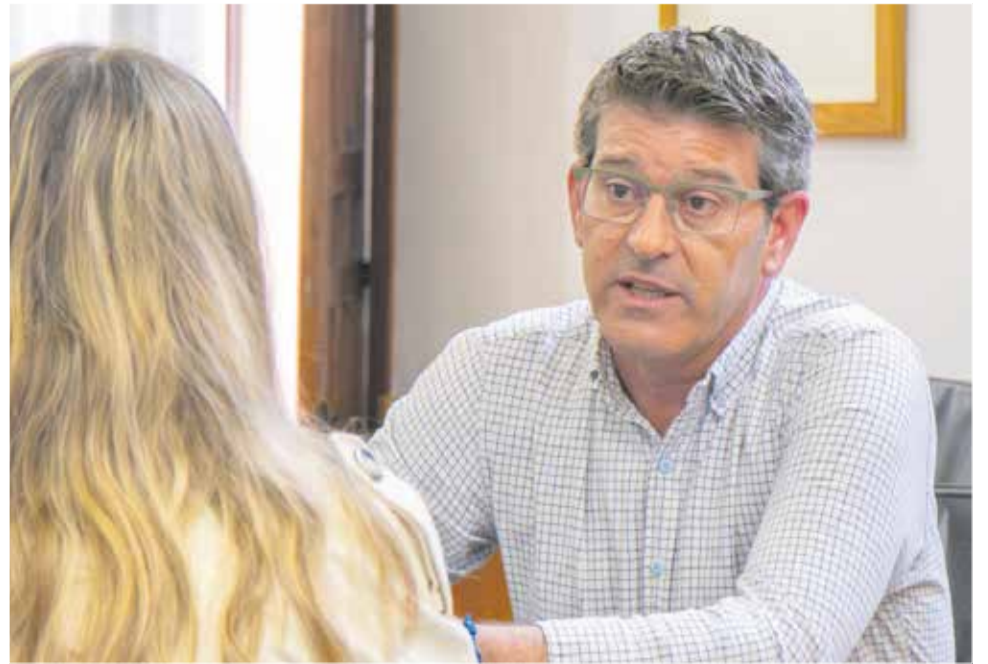
Un instant durant l'entrevista concedida a El Periódico de Aquí.

En el nostre cas, com que no teníem un sistema de contenidors implantat, s'ha optat pel porta a porta, que