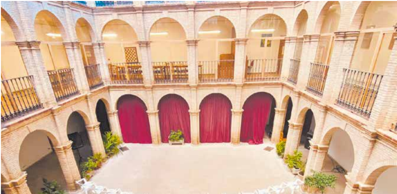
El claustro de la Casa de la Cultura un de los principales espacios del festival.