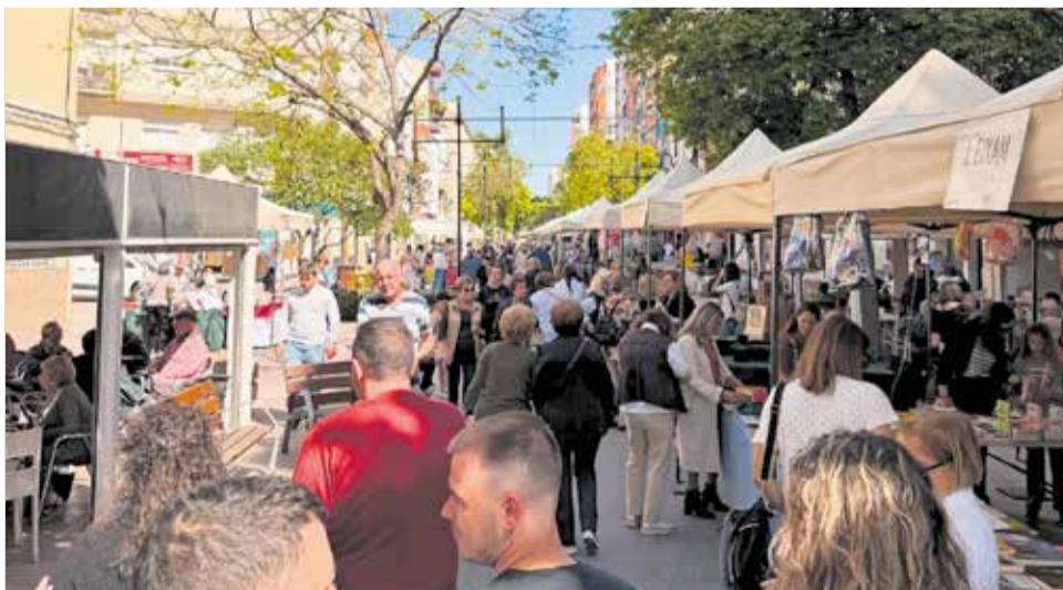
Gent passejant pels estands de la fira comercial de Canals.

Durant la jornada del dissabte es van desenvolupar activitats culturals, musicals i tallers infantils que van dinamitzar l'espai