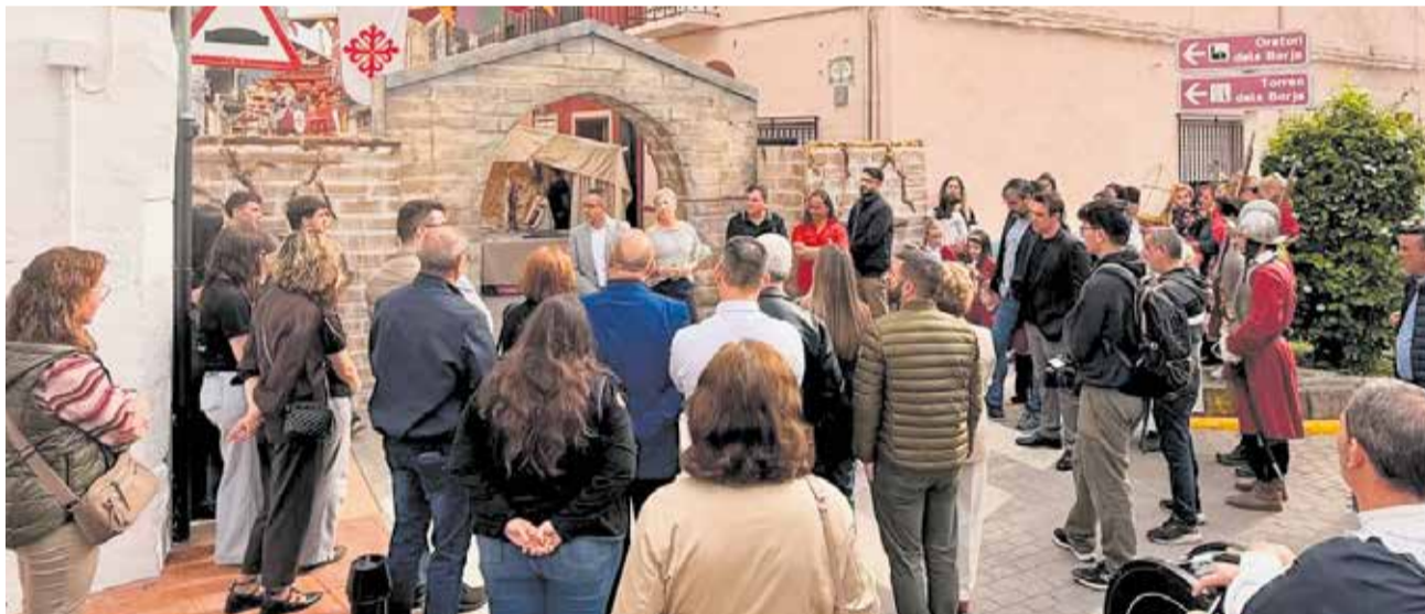
Ambient de la Fira Turística 'Calixte III' amb activitats culturals i recreacions històriques.