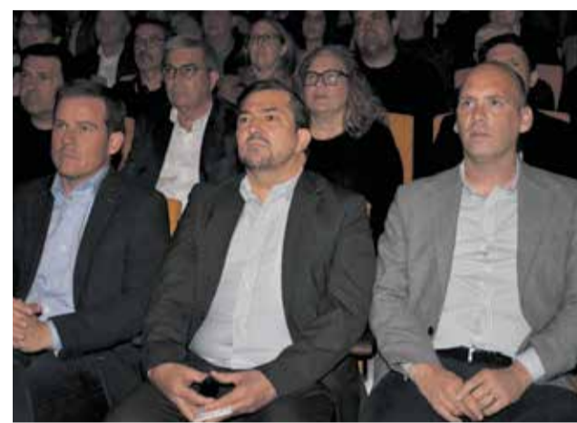
Alguns assistents a la presentació al Centre Cultural de Xàtiva.

la ciutat que m'ha vist créixer i que forma part de qui soc.