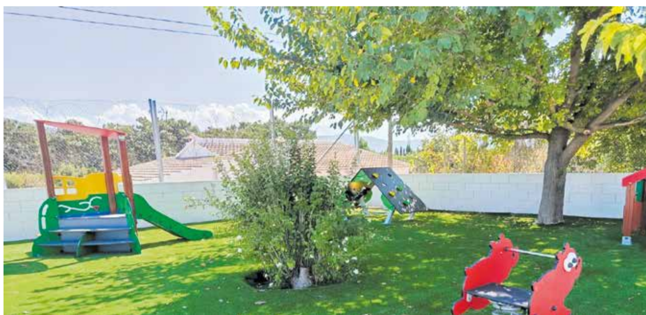
Parti de l'escola pública que es troba prop de les noves vivendes.