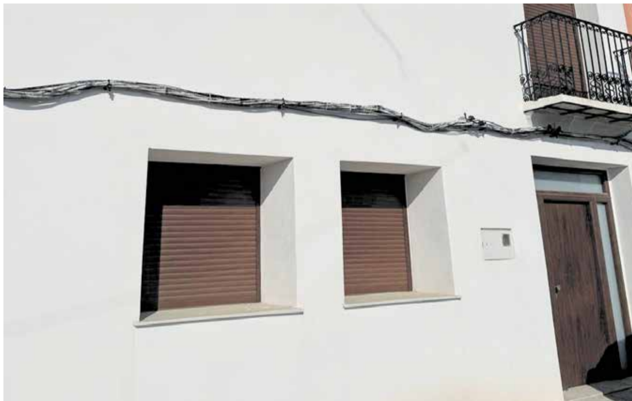
Imatge d'un dels habitatges de Lloguer pensada per a famílies joves en el municipi de Cerdà.

El centre compta amb activitats extraescolars i diversos espais adaptats al projecte educatiu, com ara aules a la natura, pati infantil renovat, zones per a bicicletes i