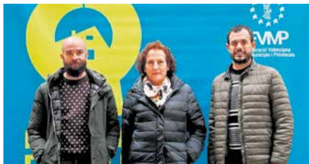
Presentación del programa ‘Sé Saludable’.

Se trata de un programa municipal gratuito con un