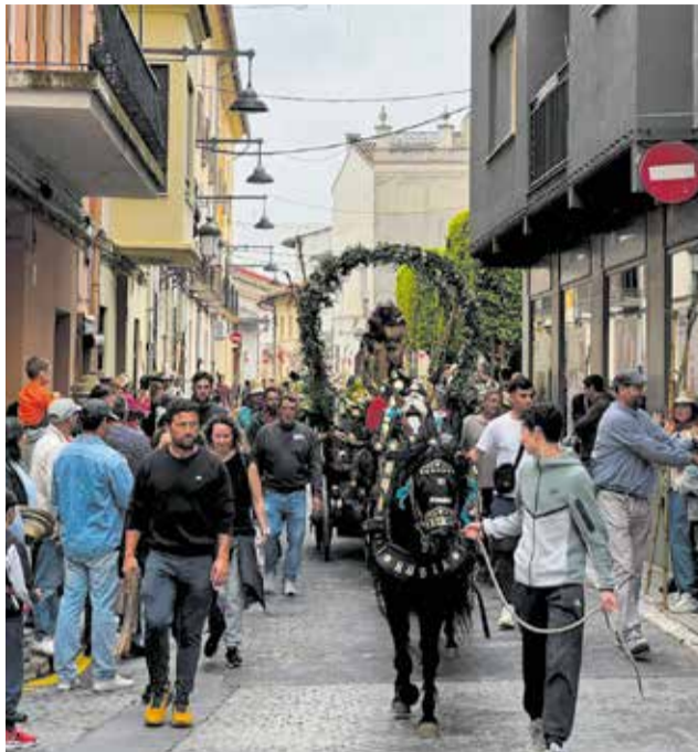
Diversos instants de la romeria de Santa Anna de La Llosa de Ranes.

Tot i això, la festa no es va suspendre completament i va saber reinventar-se dins del poble. La imatge de Santa Anna va poder entrar a la localitat amb el carro, arribant fins a l'església parroquial, on va ser rebuda per veïns i veïnes que no van voler perdre's el moment. L'entrada va estar acompanyada per diversos carruatges i cavalleries, que van mantindre viu l'esperit