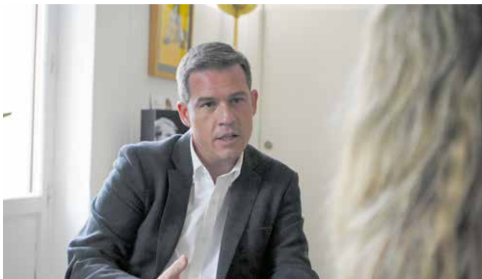
Un instant durant l'entrevista concedida a El Periódico de Aquí.

s'ubique en els terrenys de Santa Clara, perquè això canviaria completament també la imatge d'un punt neuràlgic de la ciutat com és l'avinguda de Selgas. En definitiva, crec que estratègicament la ciutat té molts reptes al davant i que assegut les bases per a poder desenvolupar-nos en els pròxims anys.