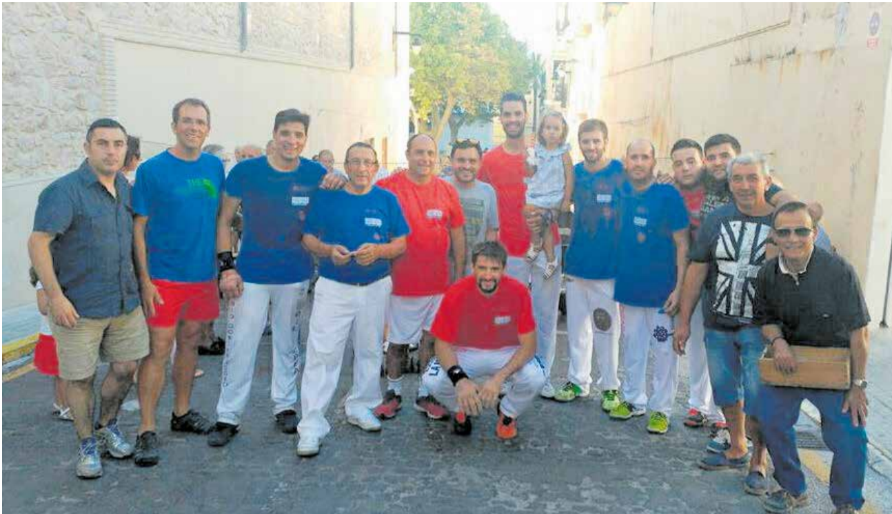
El carrer de l'Altet de Sant Joan és conegut popularment com "Carrer de la Pilota".