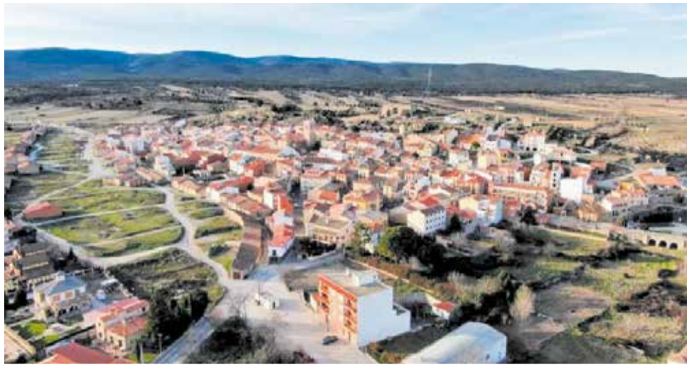
Panorámica del municipio de la Villa de El Toro.