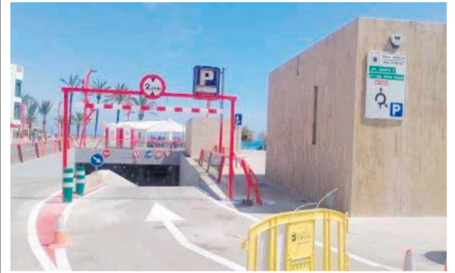
Pas inferior del passeig marítim de Vinaròs.