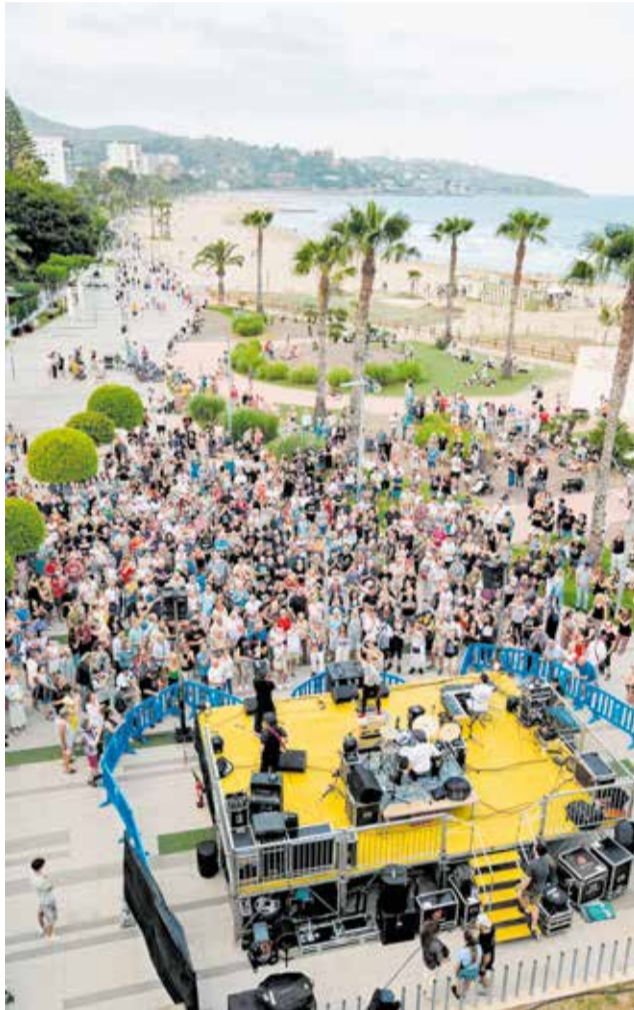
Benicàssim Blues Festival, en una edición anterior.

El cartel de esta edición reúne a destacados artis-