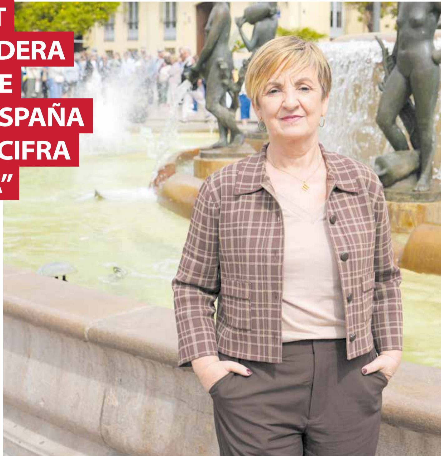
La consellera de Industria, Turismo, Innovación y Comercio, Marian Cano, en la Plaza de la Virgen, uno de los lugares que más

Esa base logística se complementa con nuestra ambición exterior. El Plan de Promoción Exterior 2026 es nuestra gran apuesta por la internacionalización. Hablamos de 88 acciones de impacto en 38 mercados estratégicos. No se trata simplemente de vender productos fuera; el objetivo es posicionar a la Comunitat como un territorio competitivo, innovador y, sobre todo, fiable para la inversión extranjera directa.