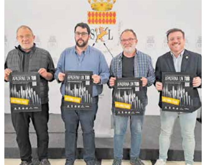
Presentación de la campaña de recuperación. / EPDA