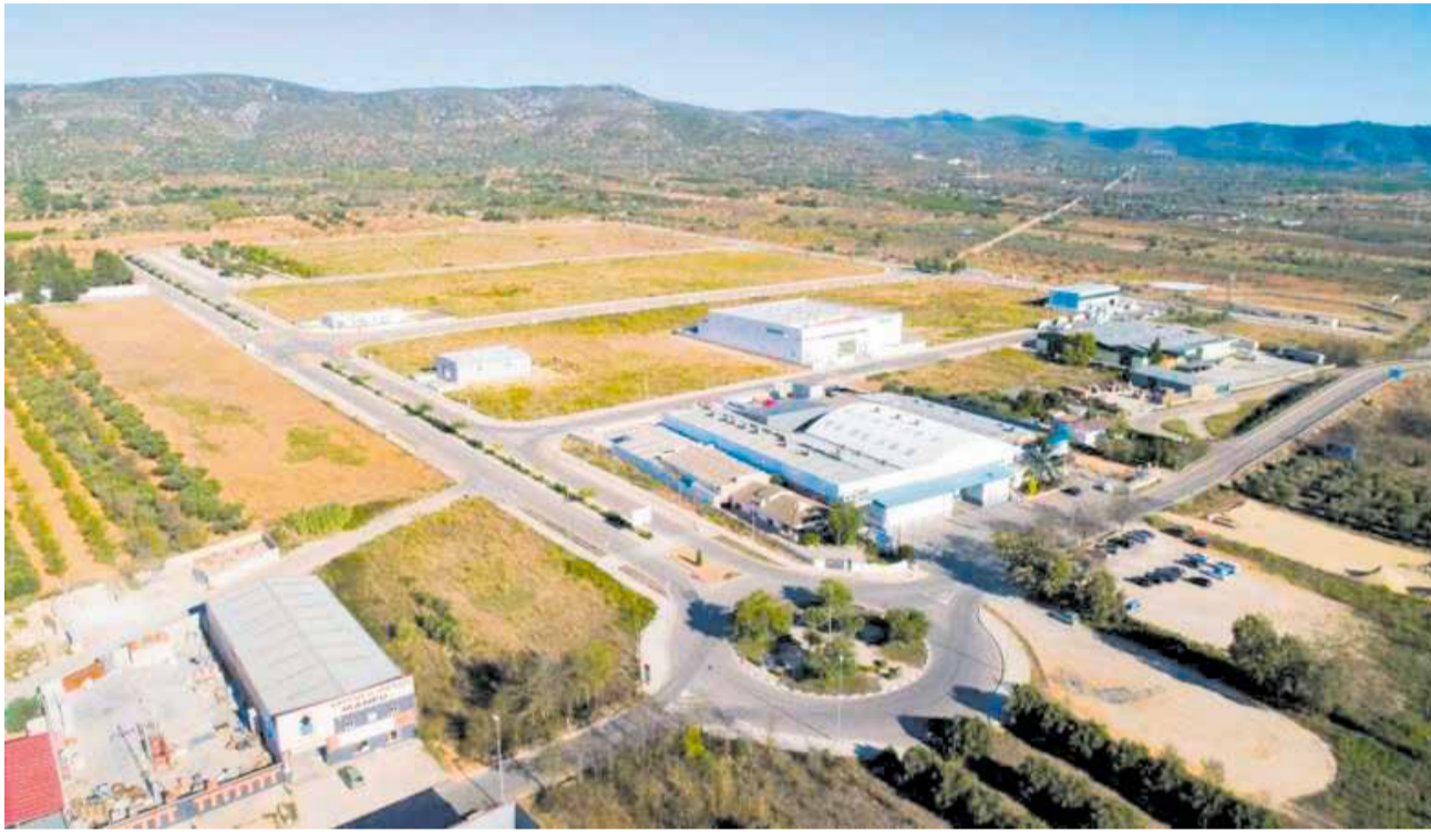
El sòl industrial al parc empresarial El Campaner, en el municipi d'Alcalà de Xivert.