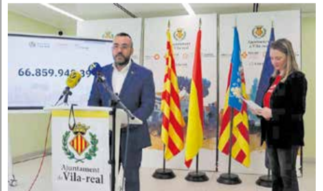
Presentación de los presupuestos.