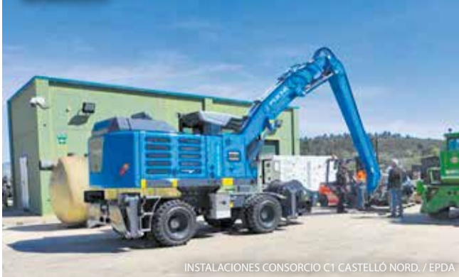
INSTALACIONES CONSORCIO C1 CASTELLÓ NORD.

La Generalitat ha aprobado el Decreto 45/2026, que permite una nueva redistribución de las ayudas NextGenerationEU para proyectos de gestión de residuos, gracias a la cual el Consorcio C1 Castelló Nord recibirá hasta el 100 % de la financiación del centro de tratamiento de residuos voluminosos de Cervera del Maestre.