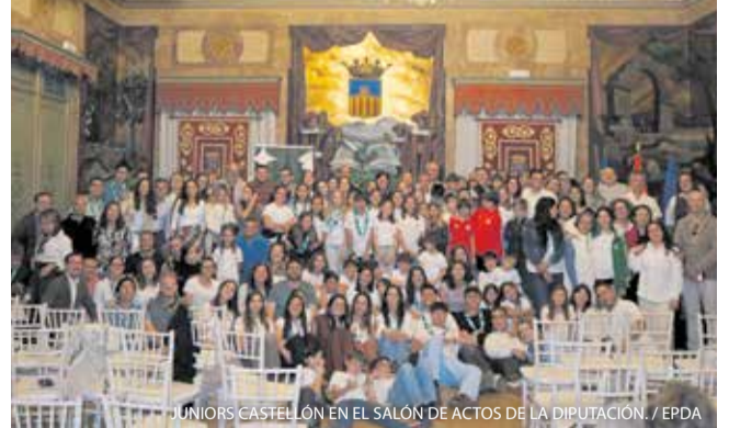
JUNIORS CASTELLÓN EN EL SALÓN DE ACTOS DE LA DIPUTACIÓN.

Juniors Castellón conmemoró su 15 aniversario con un acto que logró reunir a cerca de 230 asistentes, consolidando su papel como referente del asociacionismo juvenil. Una asociación que centra su actividad en la educación en valores de niños y jóvenes a través del tiempo libre, la convivencia y el compromiso social.