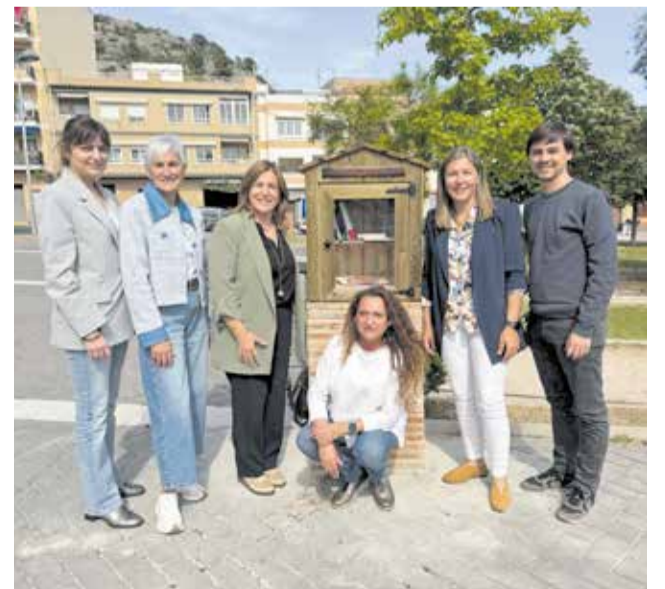
Presentación de las primeras “Bibliotecas Viajeras”.

Las casetas han sido fabricadas por el personal de la brigada municipal empleando materiales reciclados, una actuación que refuerza el compromiso del consistorio con la sostenibilidad.