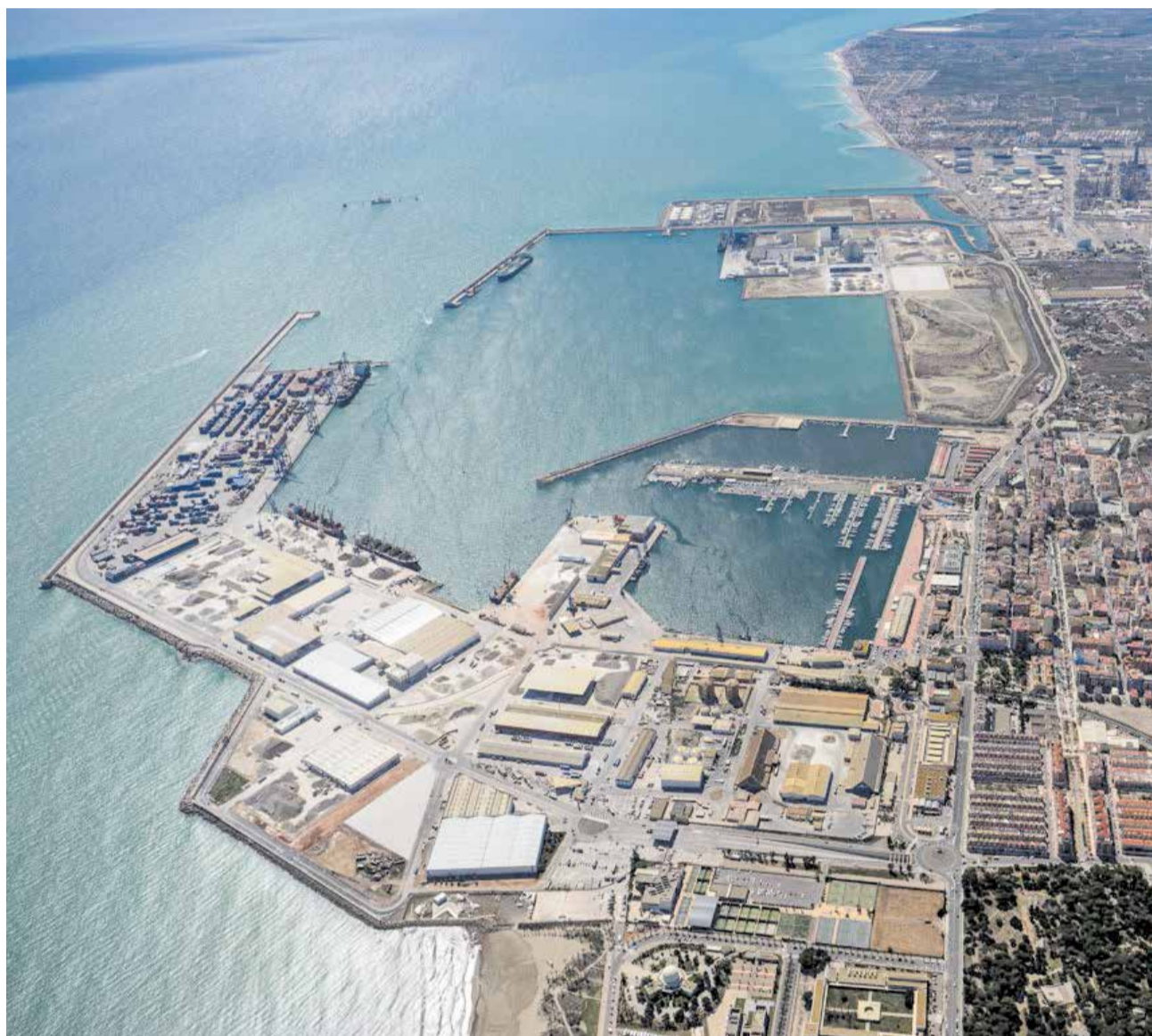
Vista aérea de las instalaciones del Puerto de Castellón.

Ibáñez ha subrayado que la llegada del National Geographic Orion consolida la apuesta por un modelo de cruceros sostenibles, orientado a atraer navieras con escalas selectivas y pasajeros interesados en la oferta cultural, gastronómica y natural del territorio.