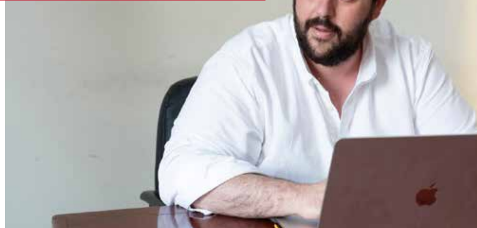
El presidente de Unión Municipalista, David García.

Estamos agrupando a los alcaldes y concejales de ca-