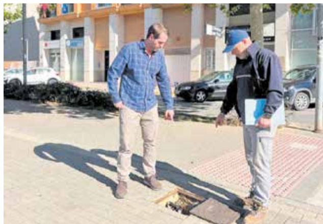
Labores de automatización del riego.

El nuevo sistema de riego inteligente sustituye las