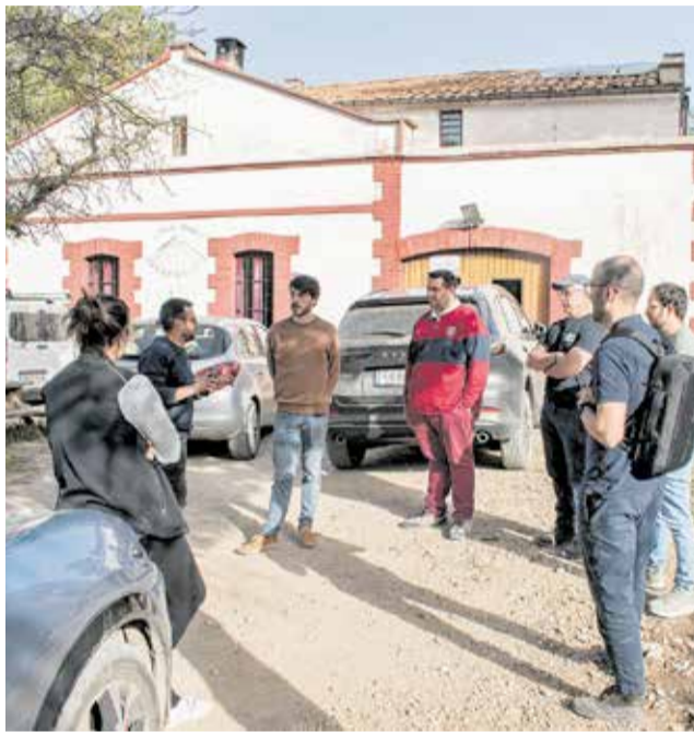
Casa forestal de Pereroles de Morella.

La casa forestal de Pereroles ofereix servei de turisme rural durant tot l'any per a grups nombrosos. Amb esta intervenció es pretén millorar