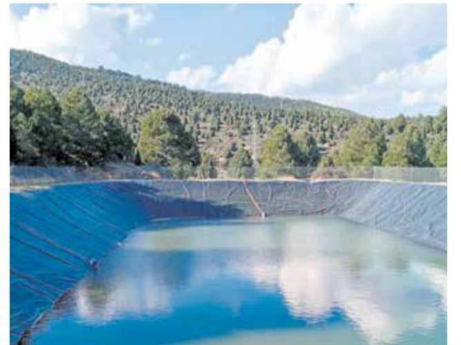
Bassa del Pou Nou de Benassal.

Amb una capacitat de huit milions de litres d'aigua, la bassa del Pou Nou tindrà un paper fonamental en la prevenció i lluita contra els incendis forestals. La seua ubicació, pròxima al riu Montlleó i en una zona de fàcil accés per als mitjans d'extinció, la converteix en un punt clau per al subministrament d'aigua en cas d'incendi. Amb esta actuació, el consistori continua apostant per la millora de les infraestructures municipals.