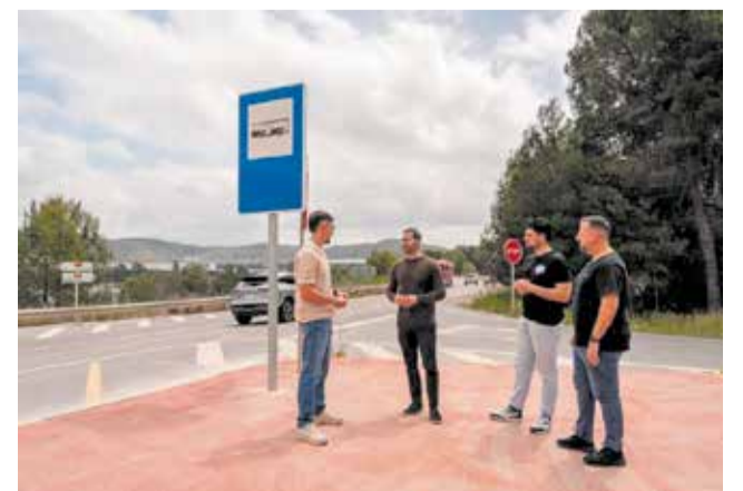
Visita al accés a l'urbanització El Pantà.

Davant esta situació, el consistori planteja adoptar una posició ferma en defensa de la seguretat ciutadana. La moció inclou exigir l'execució immediata de la glorieta, reclamar un calendari públic i concret de les obres i sol·licitar mesures provisionals urgents mentre no s'execute l'actuació definitiva.