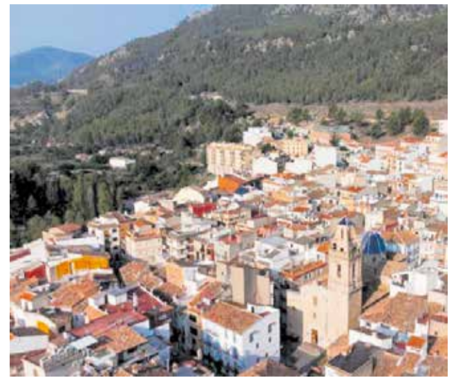
Vista aérea de Montanejos.

El alcalde explicó que el municipio arrastraba problemas de aparcamiento