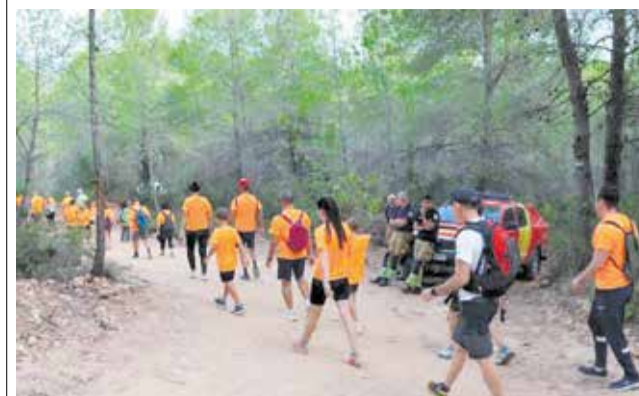
Un grup de persones caminen per les senderes.