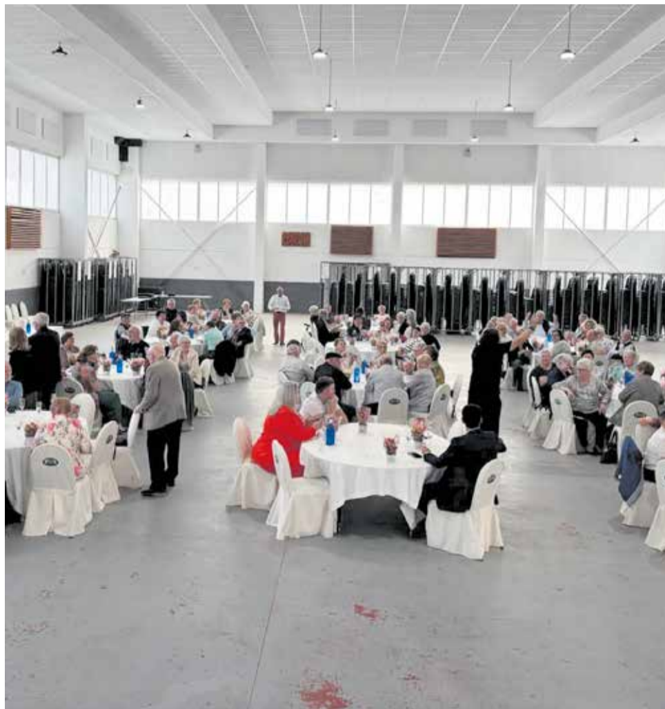
Festa de l'Associació de Jubilats El Salvador de la Llosa.

La celebració va continuar amb l'actuació de l'humorista Larry, qui amb el seu espectacle va aconseguir arrancar nombroses rialles entre el públic assistent. La música, l'humor i la participació activa dels presents van contribuir a crear un ambient festiu que es va allargar durant tota la vesprada.