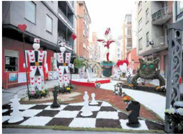
Cruces de Mayo de Burriana.

La celebración, que tradicionalmente tenía lugar a principios de mayo coincidiendo con el Día de la Madre, se mantiene por tercer año consecutivo en el tercer fin de semana del mes, una decisión adoptada por las comisiones falleras para evitar el encarecimiento de las flores y disponer de más tiempo de preparación.