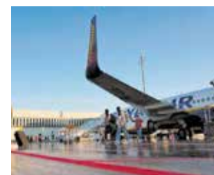
Aeropuerto de Castellón.