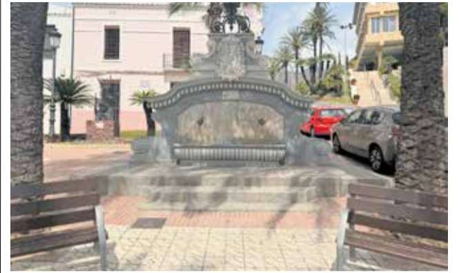
Fuente del Señor de Benicàssim.