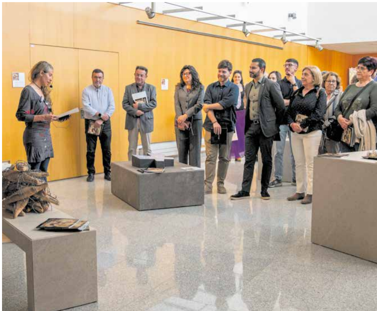
Presentació de la nova edició del Maig Ceràmic de l'Alcora.

Precisament, l'ESCAL celebra este curs el seu 20é aniversari, que s'està commemorant amb iniciatives especials com "La peça del mes", un projecte que apropa a la comunitat educativa obres d'artistes reconeguts i genera espais de trobada i reflexió entorn de la ceràmica contemporània. Esta iniciativa culminarà al maig i juny amb l'exposició