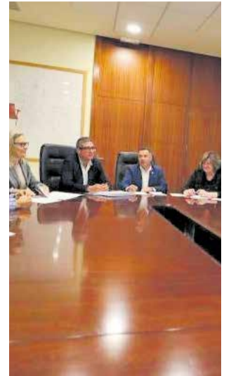
Junta de Gobierno.

La adjudicación supone, según el equipo técnico municipal, "poner el contador a cero" en un proyecto que abarca 2,5 millones de metros cuadrados en primera línea de costa y que busca consolidarse como un nuevo polo de desarrollo turístico y residencial para la capital de la Plana Baixa.