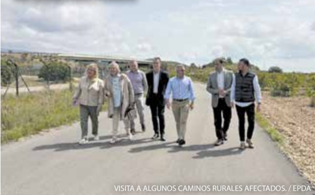
VISITA A ALGUNOS CAMINOS RURALES AFECTADOS.

Finaliza la recuperación de 242 caminos rurales afectados por la dana en la provincia de Castellón, con una inversión de 9,4 millones de euros, dentro de un plan global que ha permitido actuar en 598 caminos en toda la Comunitat Valenciana con una inversión total de 30,8 millones de euros en mejorar el acceso.