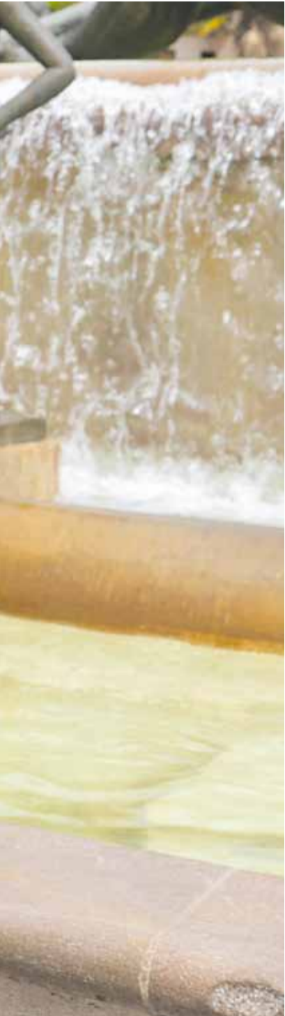
Los visitantes recibe en Valencia.

ejecutando con precisión. Hemos puesto en marcha una Estrategia de Reindustrialización con un objetivo que no admite dudas: elevar el peso de la industria en la economía valenciana. Y lo hacemos facilitando suelo, agilizando la burocracia y aportando la seguridad ju-