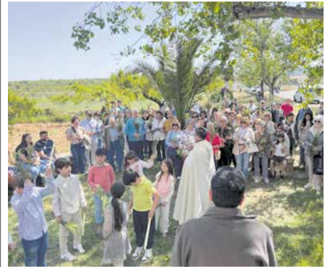
Gimnàs municipal d'Albocàsser.