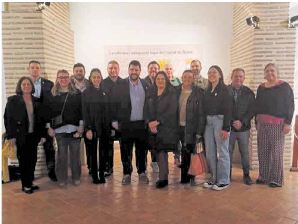
Presentación del nuevo escudo oficial del Ayuntamiento de Nules.