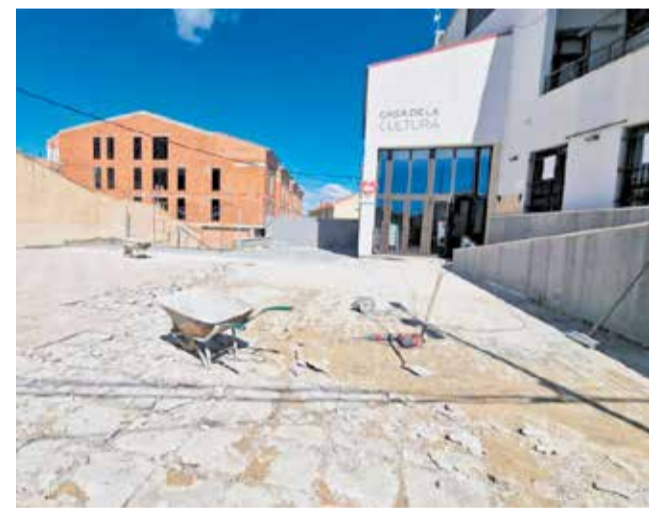
Obres de rehabilitació de la plaça.

Mentre duren els treballs, l'Ajuntament ha informat que l'accés a la biblioteca municipal serà provisionalment per la part inferior de l'edifici.