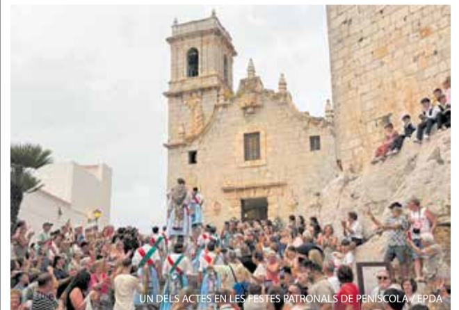
UN DELS ACTES EN LES FESTES PATRONALS DE PENÍSCOLA. / EPDA

Les Festes Patronals en honor a la Verge de la Ermitana de Peníscola han sigut declarades Bé d'Interès Cultural (BIC), segons la resolució de la Direcció General de Patrimoni Cultural de la Generalitat Valenciana, la qual cosa suposa el màxim nivell de protecció patrimonial autonòmic per a esta manifestació cultural immaterial.