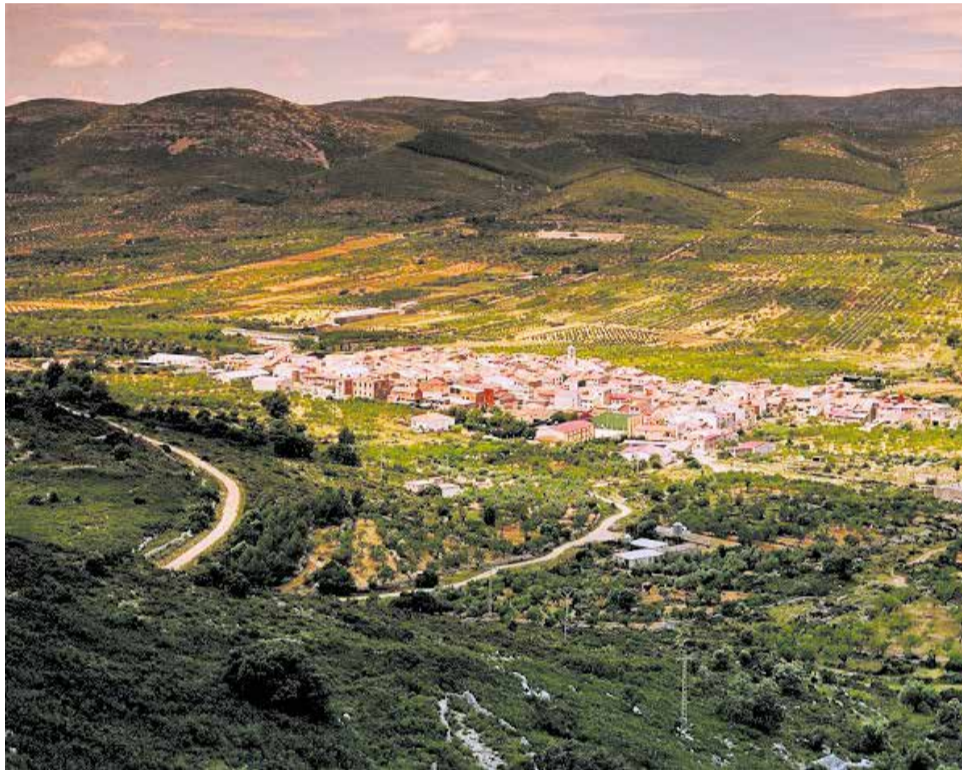
Vista aèria del municipi de Tírig.

Les empreses interessades podran presentar les seues ofertes fins al pròxim 11 de maig de 2026 a través de la Plataforma de Contractació