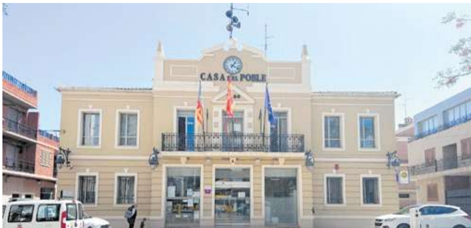
Edifici consistorial de la Pobla de Farnals. / EPDA