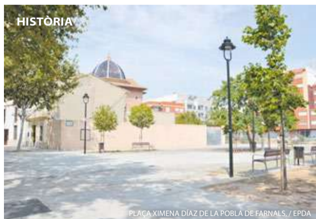
PLAÇA XIMENA DÍAZ DE LA POBLA DE FARNALS.