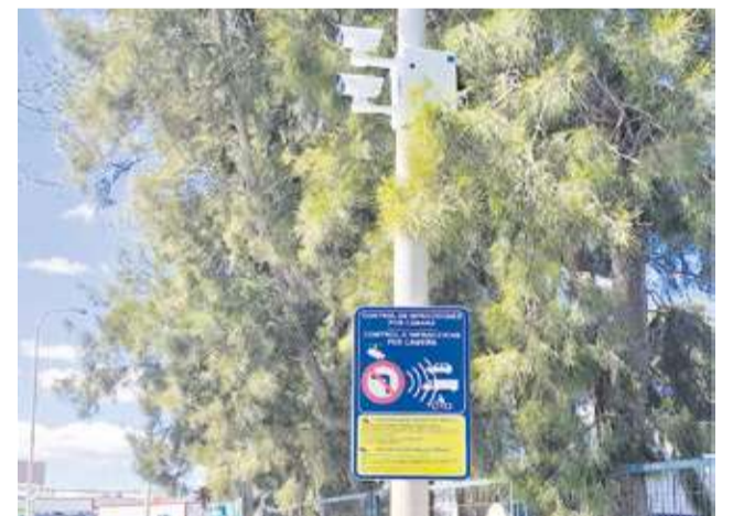
Càmeres presents al polígon de Massalfassar.

Per tal de complir amb la legalitat i respectar els drets de la ciutadania, el Consistori ha acompanyat la instal·lació amb la col·locació de cartellera informativa en les zones afectades. Estos senyals advertixen de la presència de les càmeres i detallen la seua funció, assegurant el dret a la informació de tots els usuaris de la via.