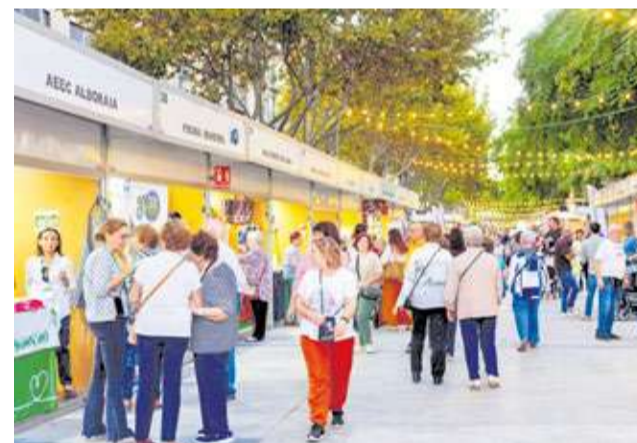
Persones passejant per les casetes de Firalboraià 2025.

Esta aposta pel comerç de carrer tindrà continuïtat al llarg de l'any amb altres ini-