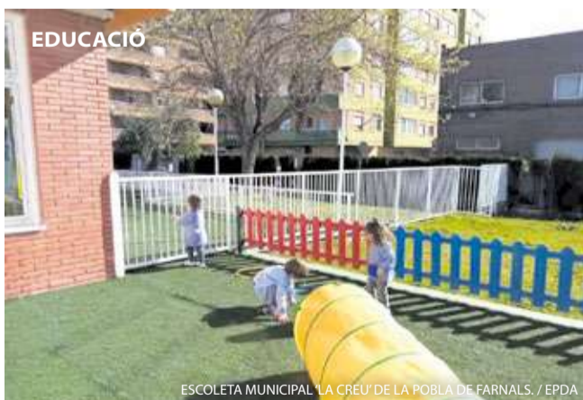
ESCOLETA MUNICIPAL 'LA CREU' DE LA POBLA DE FARNALS.