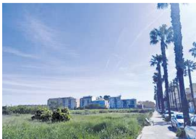
Solar per a urbanitzar del Puig de Santa Maria.

El projecte residencial se centra en la urbanització d'una parcel·la de 100.399 m 2 situada entre el carrer de l'Estació i l'avinguda València. El pla contempla que el 30% de les vivendes siguen de protecció pública, xifra que s'incrementarà amb el 10% de l'aprofitament de sòl municipal, que el consistori vol destinar íntegrament a habitatge assequible. Segons defensen