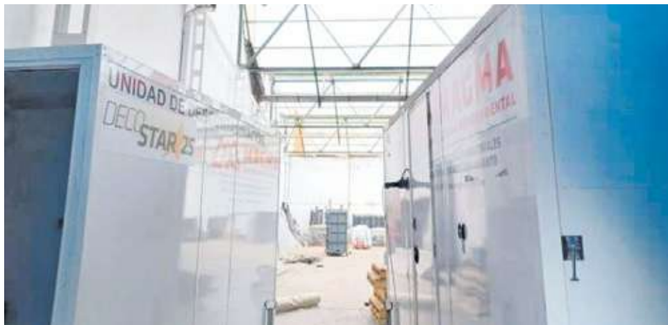
Les plaques fotovoltaiques podrien ubicar-se a l'antiga cooperativa de Sant Josep.