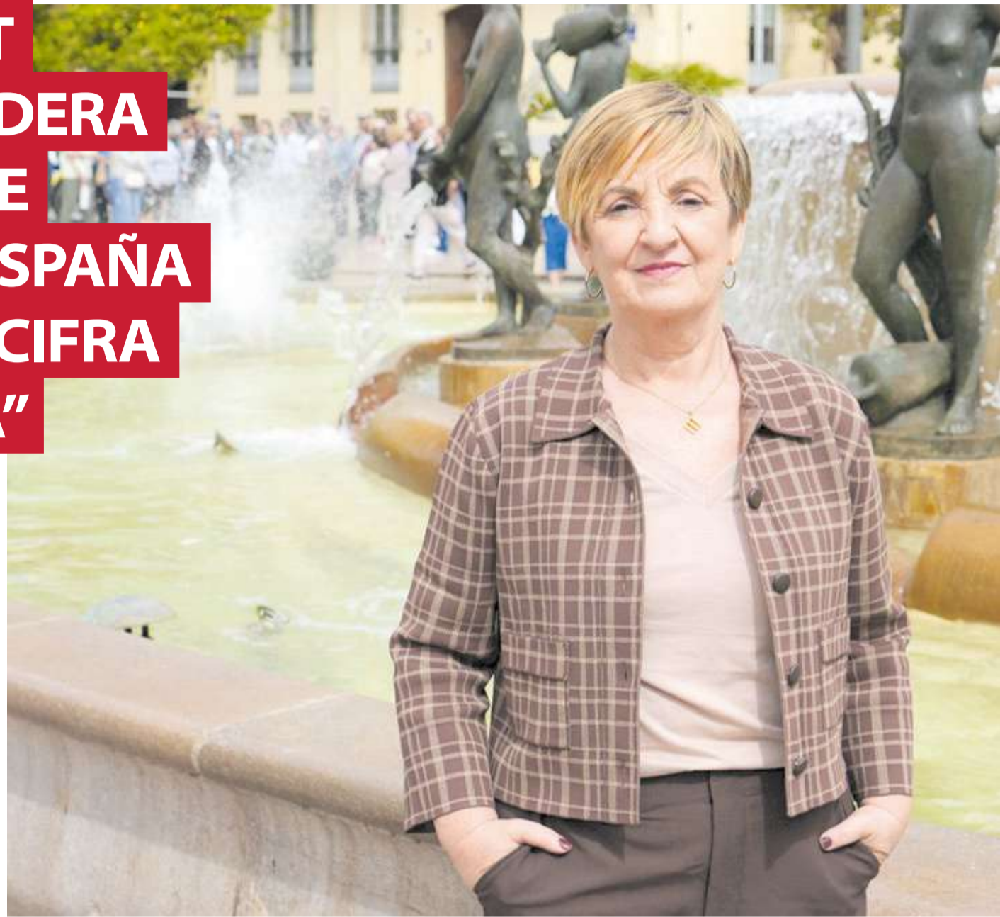
La consellera de Industria, Turismo, Innovación y Comercio, Marian Cano, en la Plaza de la Virgen, uno de los lugares que más

Esa base logística se complementa con nuestra ambición exterior. El Plan de Promoción Exterior 2026 es nuestra gran apuesta por la internacionalización. Hablamos de 88 acciones de impacto en 38 mercados estratégicos. No se trata simplemente de vender productos fuera; el objetivo es posicionar a la Comunitat como un territorio competitivo, innovador