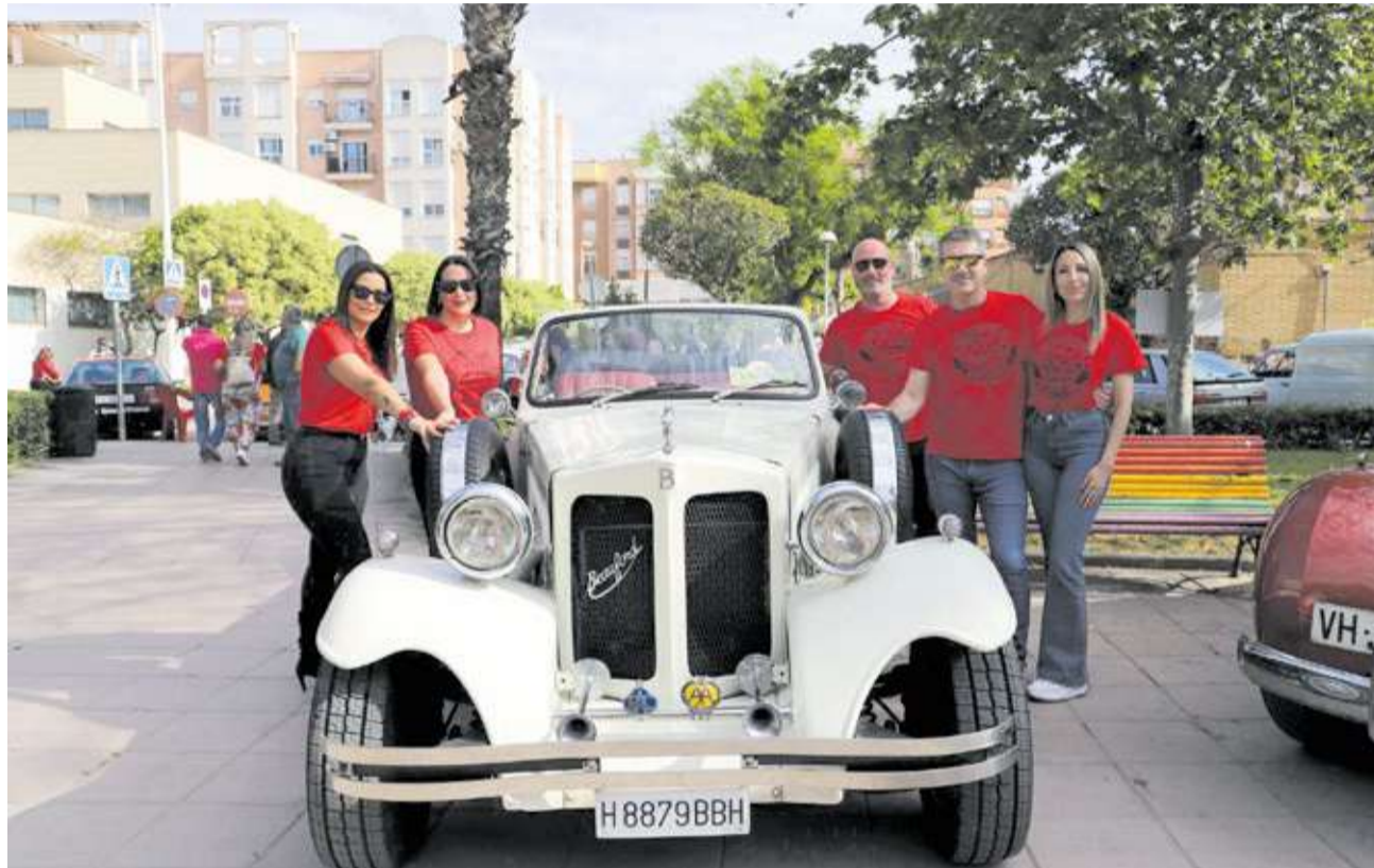
Equipo de gobierno de Moncada junto a uno de los coches antiguos presentes en la exposición.

La calidad de las piezas expuestas fue el denominador común de una jornada marcada por la diversidad. Desde los icónicos utilitarios que motorizaron a la España de mediados del siglo XX hasta elegantes berlinas europeas y robustos modelos americanos, la muestra ofreció un recorrido exhaustivo por la historia del diseño industrial. El evento ha trascendido las fronteras locales, atrayendo