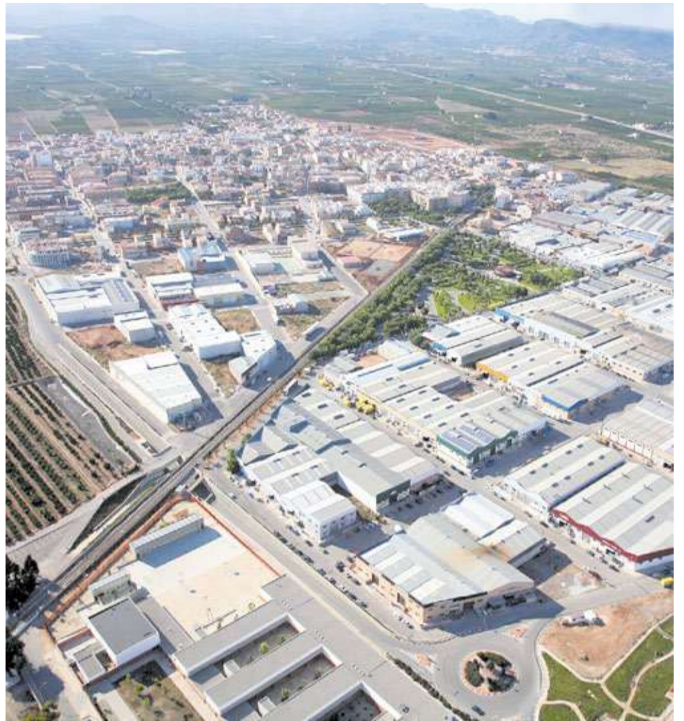
Imagen a vista de pájaro de Rafelbunyol y su gran polígono industrial.

El desafío de los próximos años será asegurar que este dinamismo que hoy lideran las localidades de Paterna, Burjassot, Alboraya y Moncada se extienda de forma equilibrada debido a que la tendencia positiva demográfica es inevitable. Además, se deben garantizar unos servicios públicos de calidad para una población que, independientemente de su origen, ya comparte un mismo destino a orillas de la huerta, del río Túria o del mar Mediterráneo.