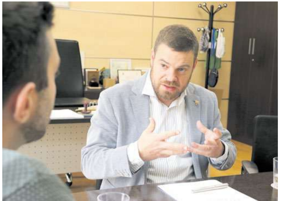
Un instant durant l'entrevista concedida a El Periódico de Aquí.

► Acabarem l'escoleta de la platja, per a descongestionar el centre que es va inaugurar l'any 82. Farem el cobriment d'una canxa de bàsquet. Hem fet un salt qualitatiu en la gestió esportiva i també se necessita