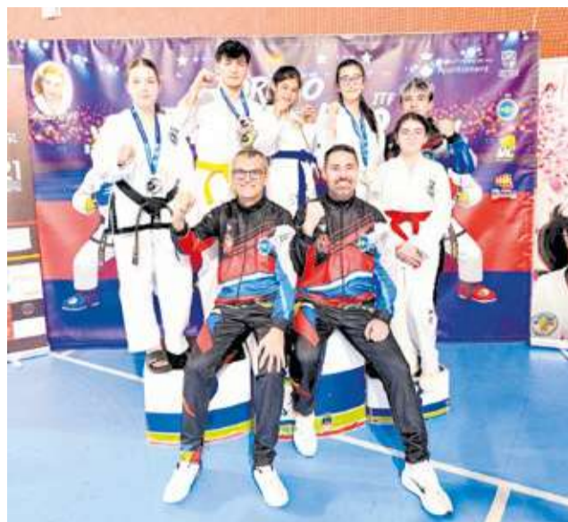
Integrants del CD Choi-Doi al torneig d'Orpesa.

equip tècnic i familiars, van ser els protagonistes d'un acte institucional que va posar en valor l'esforç i la disciplina d'esta escola. L'alcalde de l'Albuixech, Marta Ruiz, no va ocultar la seua admiració durant l'homenatge: "És un vertader orgull tindre un club d'esta envergadura perquè sempre que participen en alguna competició deixen el nom del poble en el més alt. Tenen una escola digna de lloar. Això, per a un municipi xicotet com el nostre, es tot un orgull. Per això, des de l'Ajuntament hem de trac-