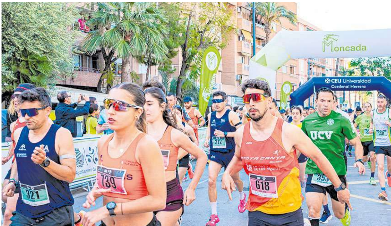
Algunos de los participantes de la 34 edición de la Media Maratón de Moncada justo a la salida de la carrera.