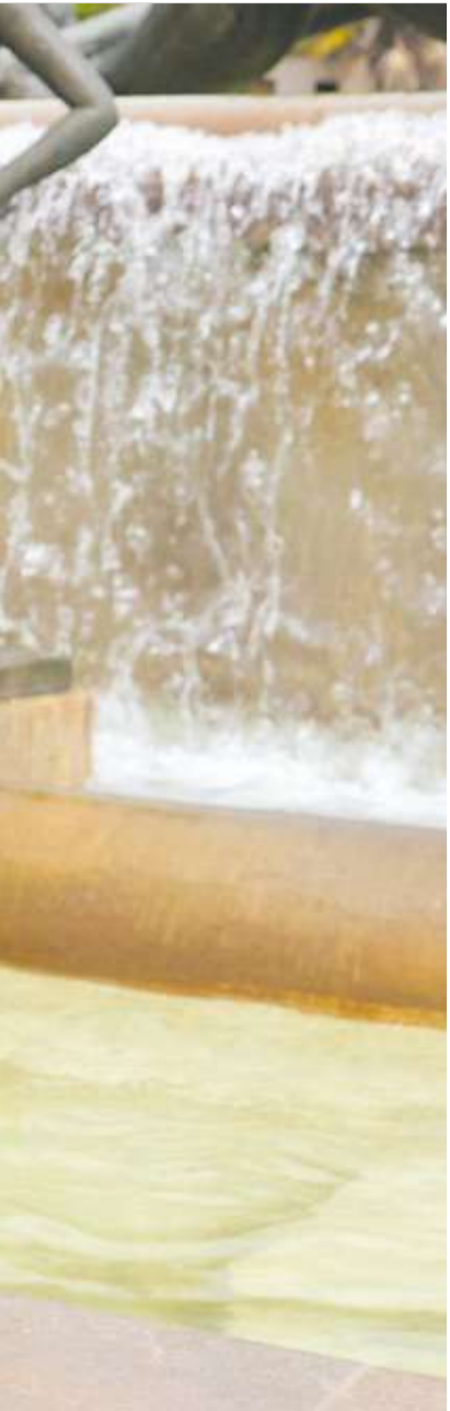
s visitantes recibe en Valencia.

nas por el mero hecho de batir cifras, sino que buscamos rentabilidad y sostenibilidad. Los resultados de 2025 son la prueba: cerramos con un récord histórico de gasto turís-