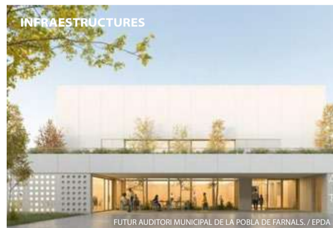
FUTUR AUDITORI MUNICIPAL DE LA POBLA DE FARNALS.

El Ple de l'Ajuntament ha aprovat la creació d'una nova escoleta municipal en la zona de la platja que ampliarà l'oferta educativa per a xiquets i xiquetes de 0 a 3 anys i reforçarà els serveis dirigits a famílies al municipi. El futur centre se situarà en una part de l'edifici Veles e Vents i comptarà amb tres aules destinades a alumnat de 0 a 3 anys.