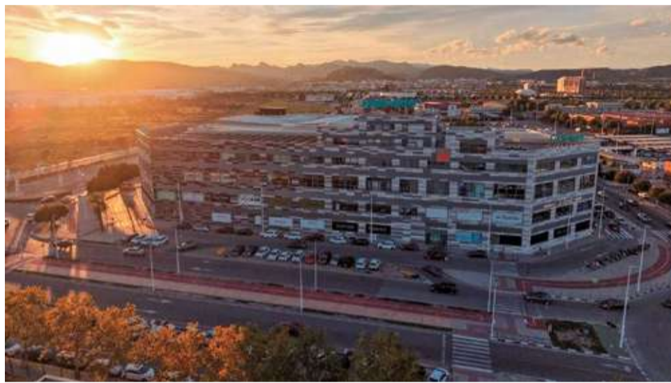
Instal·lacions del Centre Comercial Lepicentre.

Des de la direcció del centre destaquen que "els resultats obtinguts en la campanya