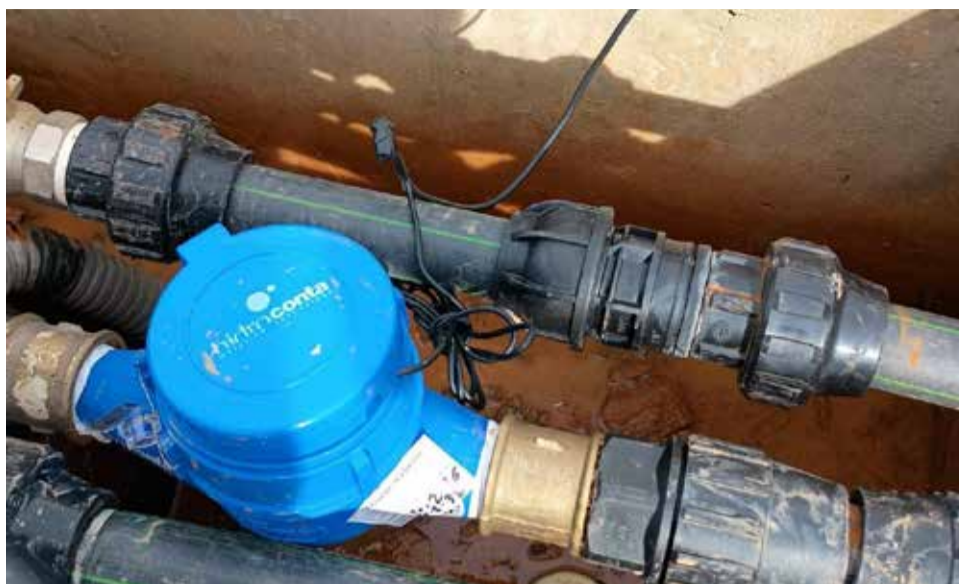
Contador digital instalado en los pozos de Requena-Utiel.

Desde la Junta Central recuerdan que estos nuevos contadores digitales permiten