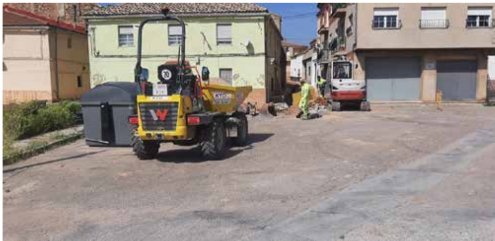
Operarios trabajando en la renovación de la red de agua potable.