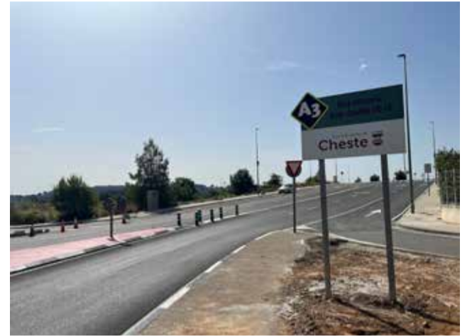
Nueva señalización y asfaltado.

La actuación ha sido financiada en un 80% a través de las ayudas concedidas por el IVACE dentro de su línea de apoyo para la mejora, modernización y dotación de infraestructuras