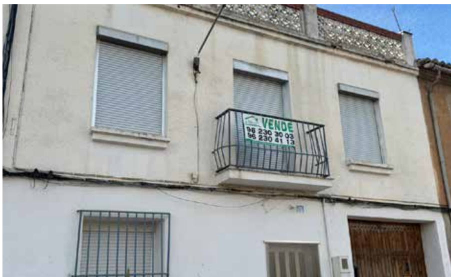
Casa en venta en la pedanía de Roma. / SARA DE LA FUENTE