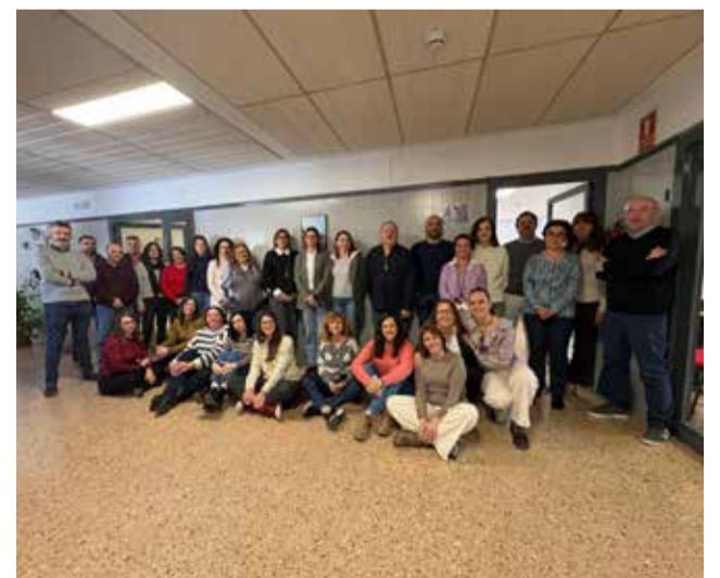
Visita al Centro de Salud Pública de Utiel.

Utiel-Requena concentra una de las mayores áreas de producción vitivinícola de la Comunitat Valenciana, con un sector que no solo tiene un importante peso económico, sino también una fuerte vinculación con la identidad y tradición de la comarca.