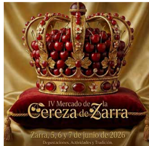
Cartel del IV Mercado de la Cereza de Zarra.

La cita contará además con degustaciones y actividades pensadas para todos los públicos, en una edición que volverá a apostar por unir tradición, gastronomía y turismo rural en torno a uno de los productos más identificativos del municipio.