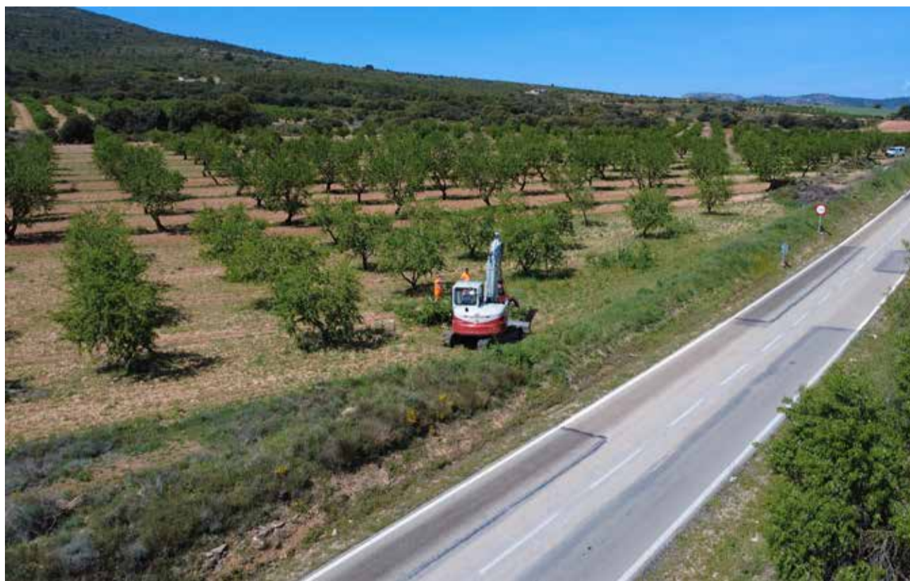
Obras de mejora de la carretera CV-470 que une Utiel y Camporrobles.

Desde el ámbito municipal, el alcalde de Camporrobles, Faustino Pozuelo,