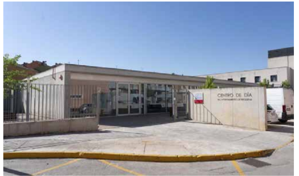
Centro de día de Requena.

El nuevo contrato permitirá además consolidar un mo-