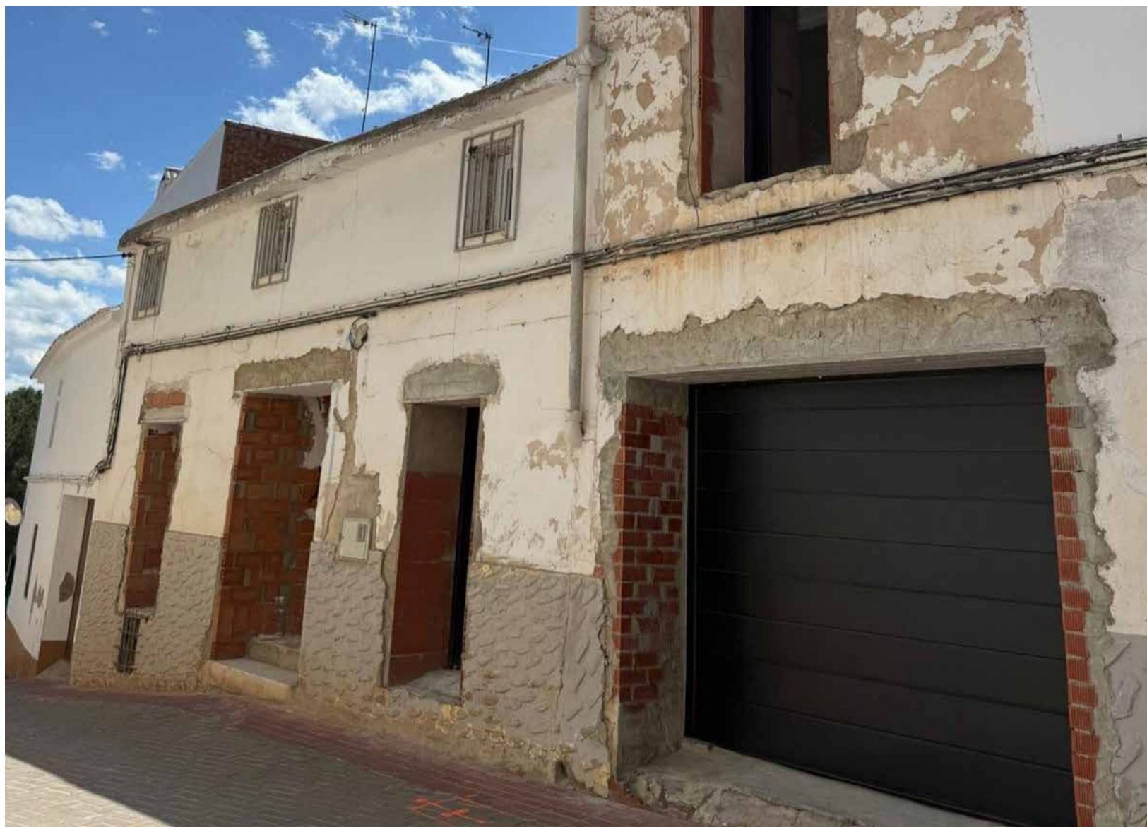
Vivienda en obras en el municipio de Zarra en el Valle de Ayora-Cofrentes.