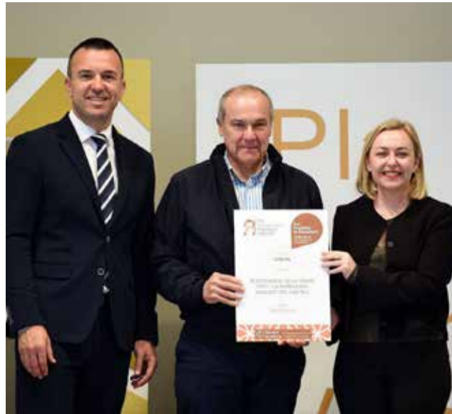
Entrega de la ayuda concedida por Diputación.

La nueva inversión se enmarca dentro del Plan de Recuperación del Patrimonio Valenciano de la Diputación de València, destinado a financiar actuaciones de