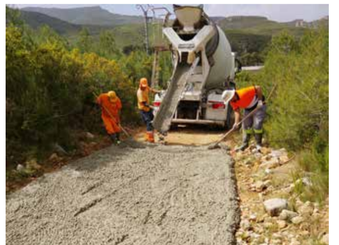
Labores de hormigonado en la zona de Socaña.

Con la finalización de estas obras, el Ayuntamiento continúa avanzando en su planificación de mejora de infraestructuras industriales y servicios vinculados a la actividad económica, una línea de trabajo que el consistorio considera prioritaria para seguir impulsando el desarrollo económico local.