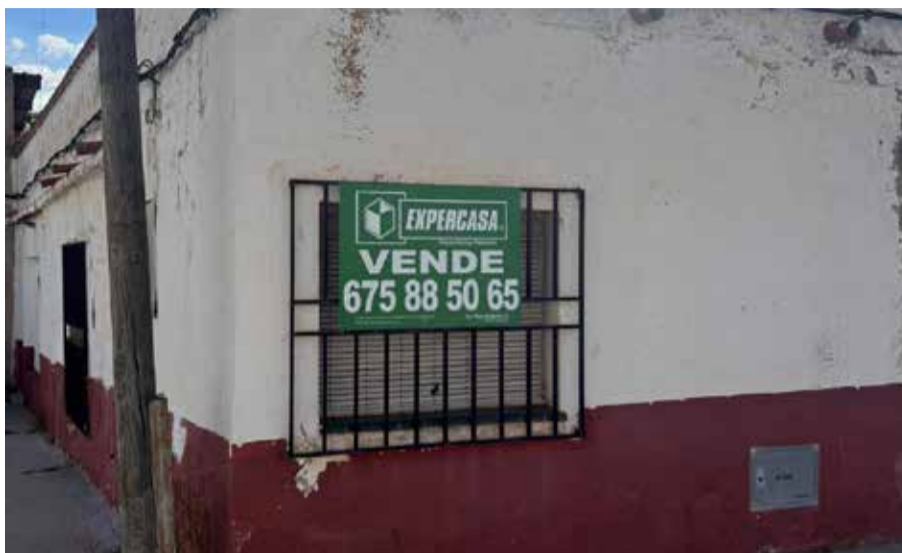
Casa en venta en San Antonio de Requena.