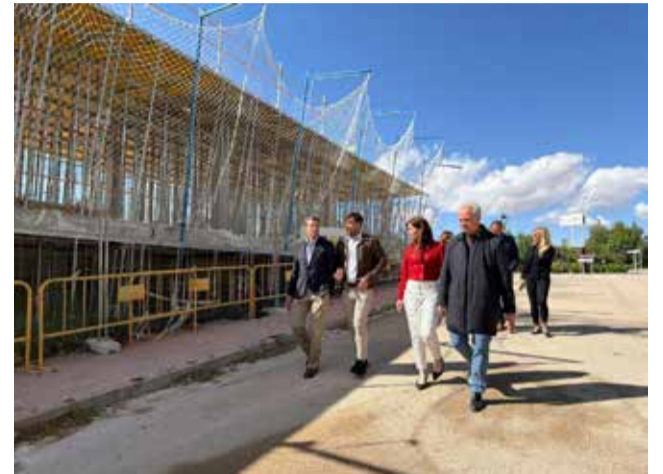
Visita al centro de día de Utiel.

Desde el Ayuntamiento subrayaron además que este nuevo espacio permitirá mejorar la atención de proximidad y ofrecer un