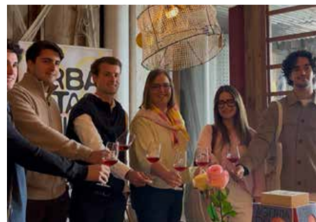
Presentación de URbanitas en el Cabanyal.

Durante la presentación también se puso el foco en cuestiones como la despoblación, el relevo generacio-