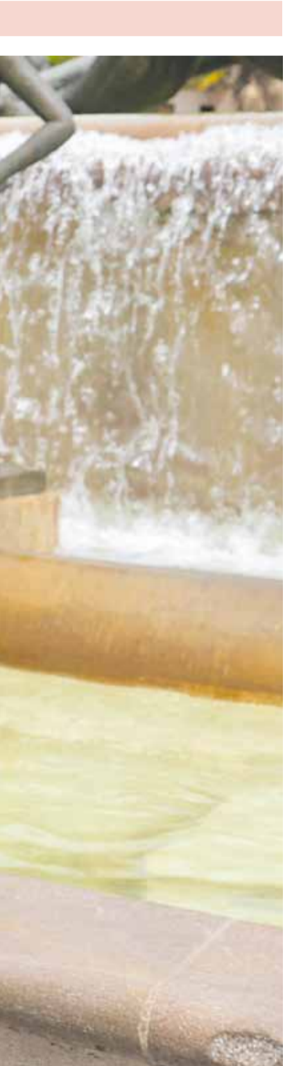
s visitantes recibe en Valencia.

co, superando por primera vez los 16.000 millones de euros en turismo internacional, un 6 % más que el año anterior. Esto significa que estamos atrayendo a un perfil de turista con mayor capacidad de gasto, lo que genera más riqueza y mejores empleos. Por tanto, hay una hoja de ruta clara: reindustrialización, orden administrativo y turismo de valor.