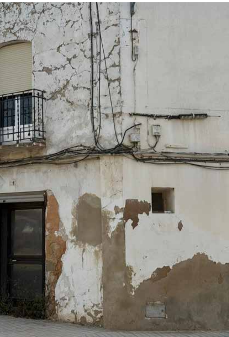
El Pontón. / SARA DE LA FUENTE