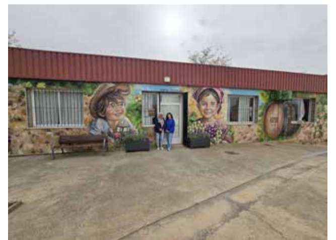
Medianera en el Centro Cultural de Roma.

La actuación forma parte además de la apuesta municipal por la mejora de los espacios públicos y la promoción de iniciativas culturales ligadas al entorno rural y al