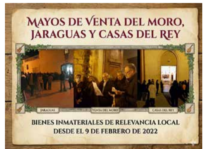
Cartel sobre el tradicional canto de los Mayos.

La implicación vecinal y la participación de distintas generaciones vuelven a ser uno de los elementos más destacados de esta celebración, que combina tradición, convivencia y patrimonio cultural.