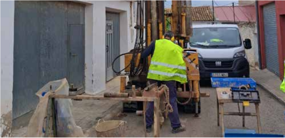
Labores de sondeos geotécnicos en la calle Poniente.