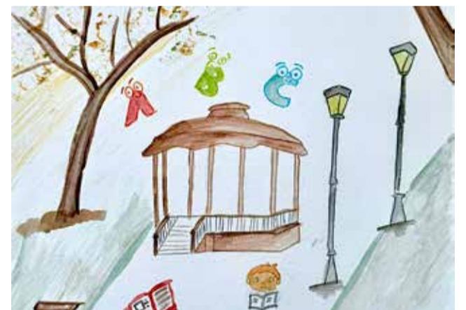
Cartel anunciador de la Feria del Libro 2026.

La celebración de este evento convierte nuevamente al Paseo de la Alameda en uno de los principales puntos de actividad cultural