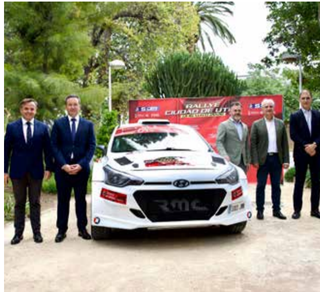
Presentación oficial del Rallye Ciudad de Utiel en Valencia.

Uno de los aspectos más destacados de esta edición será la instalación del parque de asistencia y centro de operaciones en el Circuit Ricardo Tormo, convirtiéndose en la única prueba del campeonato nacional que contará con