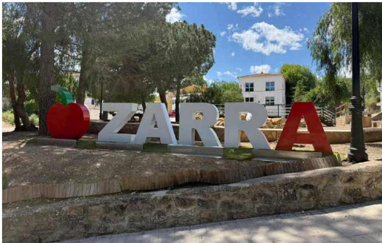
Mural decorativo a la entrada del municipio de Zarra.