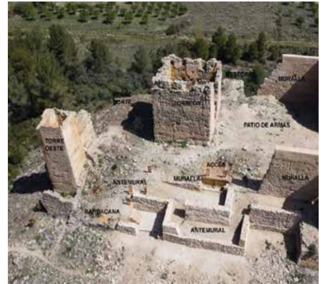
Parte del castillo que será recuperado.

Asimismo, este tipo de actuaciones permiten dinamizar el entorno rural y generar nuevas oportunidades vinculadas al turismo cultural y patrimonial, espe-