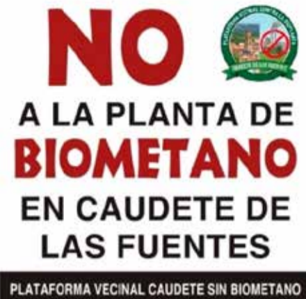
Cartel contra la planta de biometano.

Desde el Ayuntamiento reiteran además su compromiso con la transparencia y aseguran que continuarán informando puntualmente a los vecinos y vecinas sobre cualquier cuestión de interés general relacionada con este asunto y con futuros proyectos que puedan afectar al municipio.