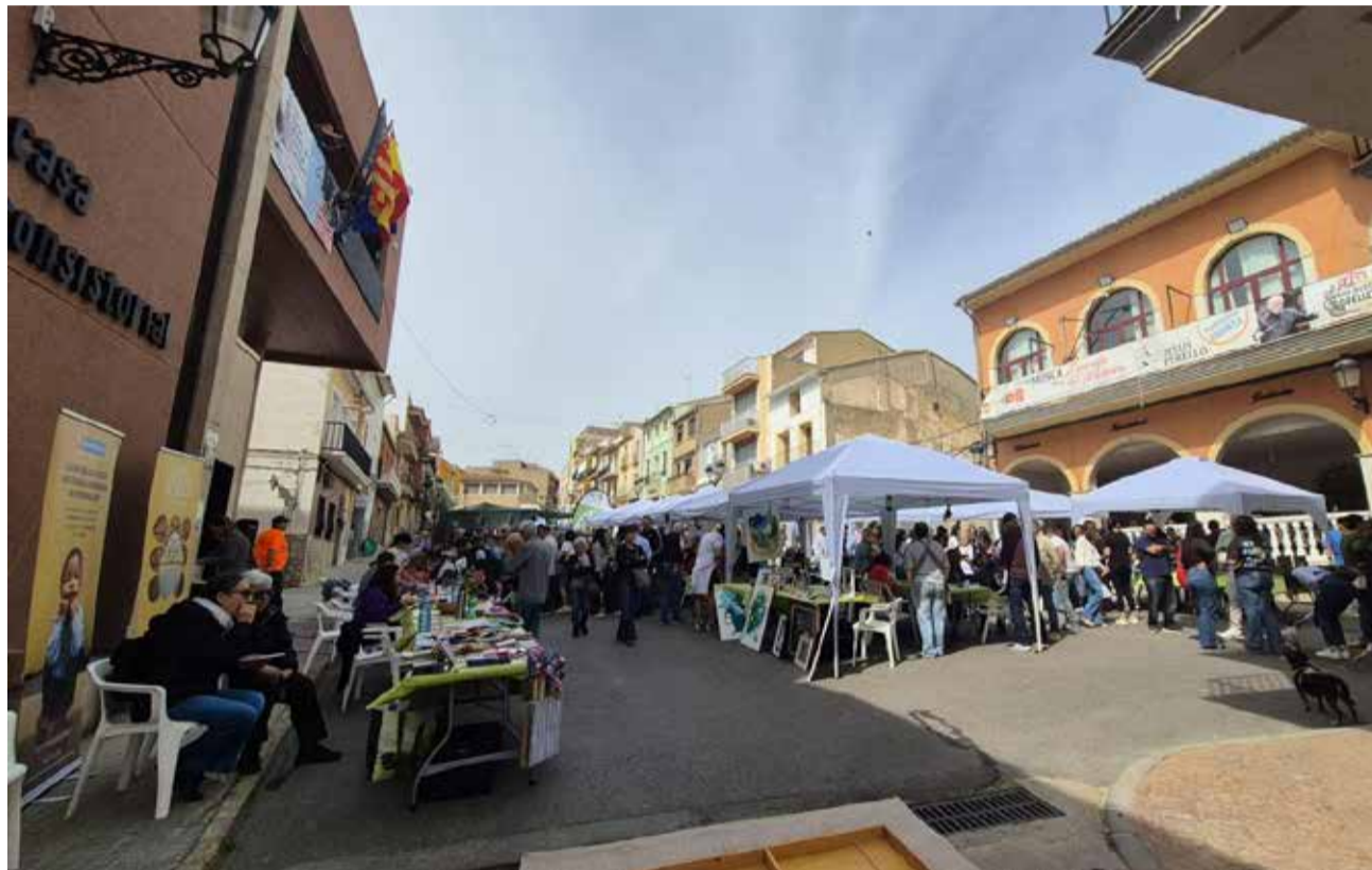
Éxito en la primera edición de la Feria del Libro en la plaza España.

Entre las actividades organizadas destacaron los talleres de elaboración de marionetas, bolsas y marcapáginas pintados a mano, además de un espacio para crear exlibris personalizados desde cero. La programación incluyó también juegos de mesa, photocall,