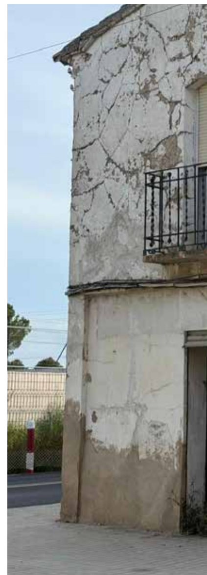
Casa abandonada en la pedanía de