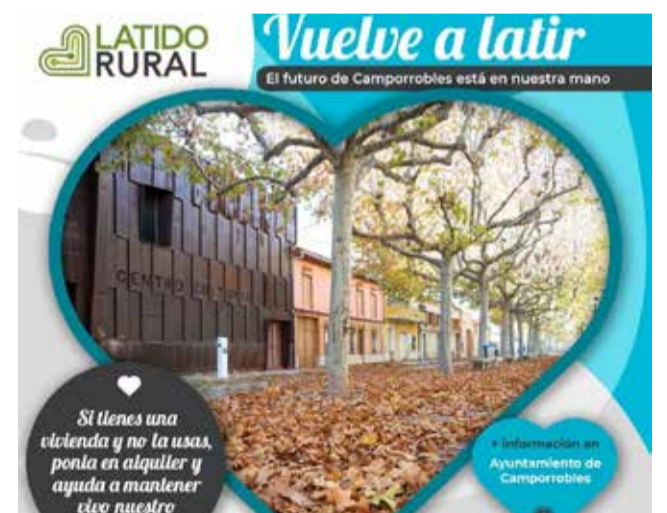
Cartel promocional de Latido Rural.

Según los datos aportados por el proyecto, siete