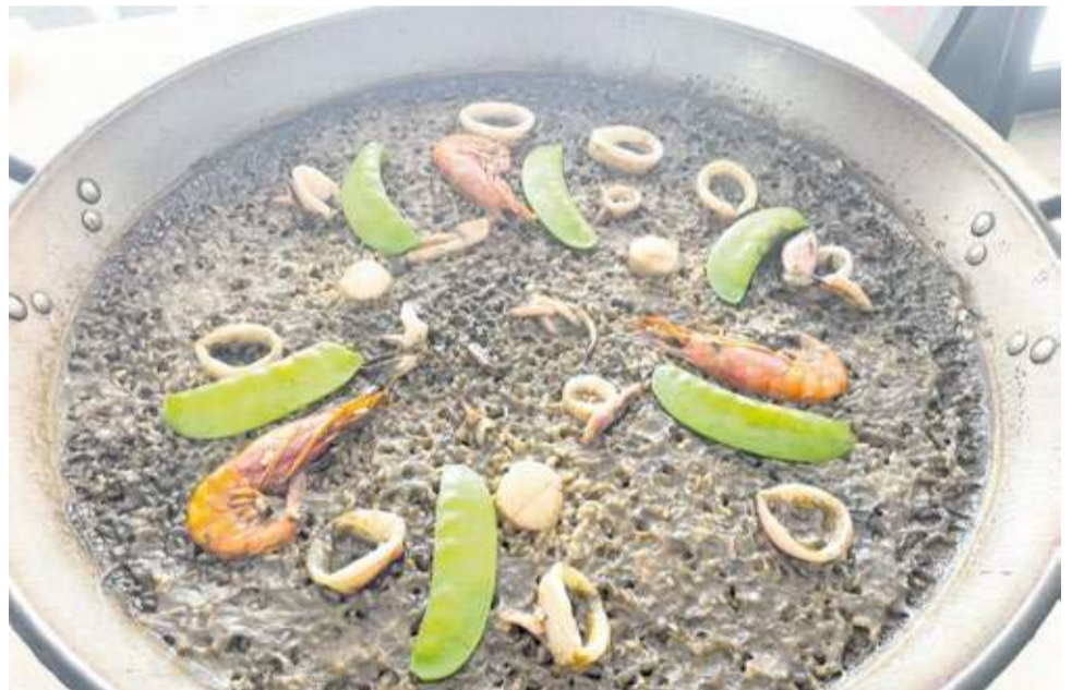
Un dels arrossos que es preparen al restaurant 'Enclave de mar'.

rantint que siga una experiència perfecta i inoblidable. En la seua cuina mediterrània destaquen sabors ben conjunyits, plats elaborats amb ingredients frescos de primera qualitat i proximitat. Compta amb un menú compost per més de quaranta plats, en els quals destaquen els suggeriments de temporada, els arrossos, carns i peixos. Entrants suggeridors com el calamar en