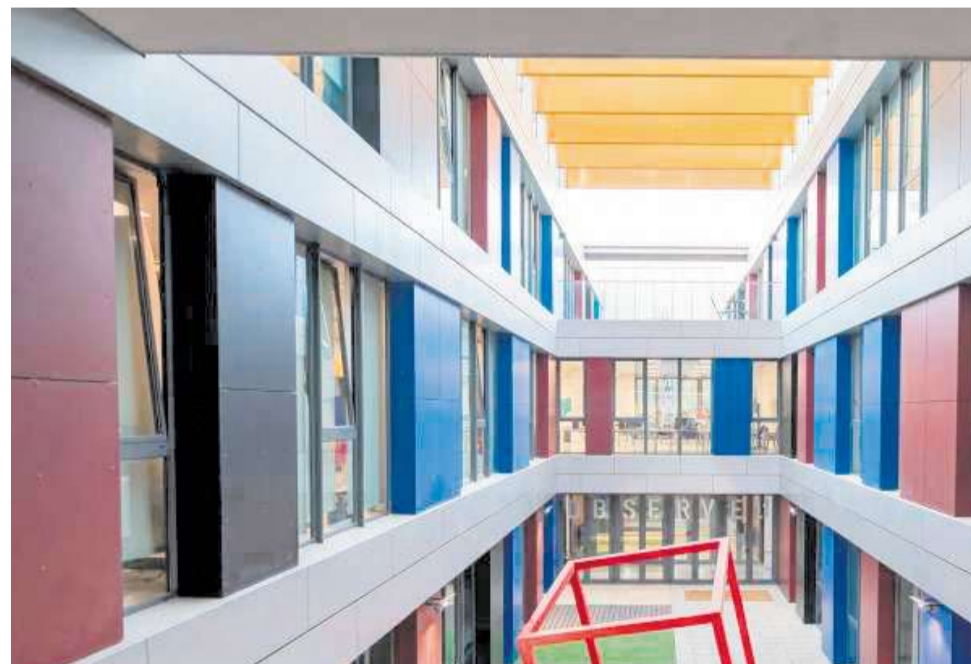
Espais socials d'Aldaia Gent Jove i Centre Matilde Salvador.

Amb esta fita, Aldaia se situa oficialment dins de