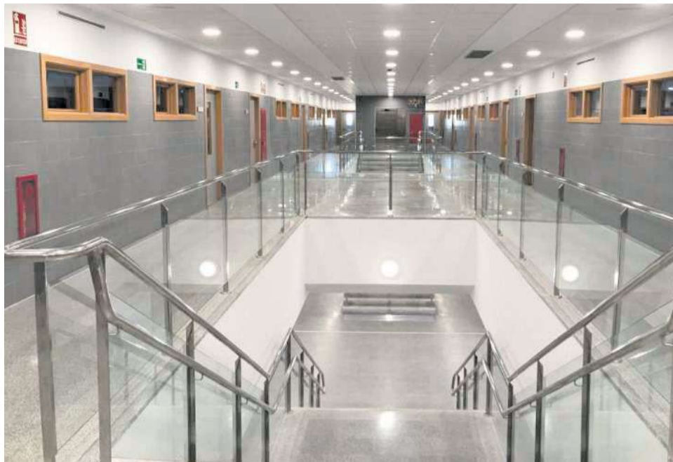
Interior d'El Rajolar d'Aldaia, un dels centres educatius públics del municipi.

A diferència de plans anteriors, esta nova etapa no es planteja com una simple declaració de bones intencions. Es tracta d'un marc tècnic rigorós que integrarà pressupostos detallats, calendaris d'execució concrets i, sobretot, indicadors i eines d'avaluació per a mesurar de manera científica si les polítiques aplicades estan do-