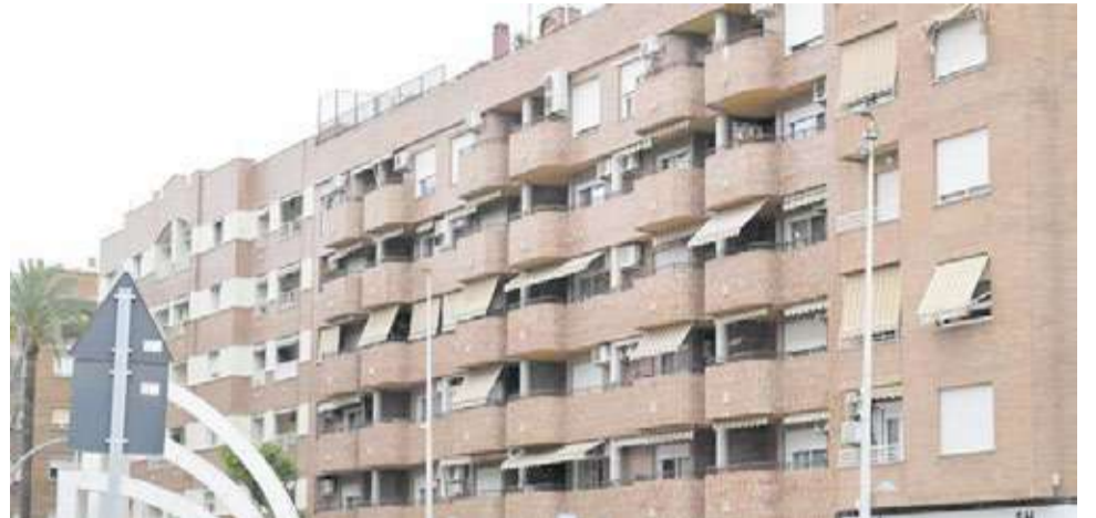
Bloc de vivendes ubicat al municipi de Paiporta.