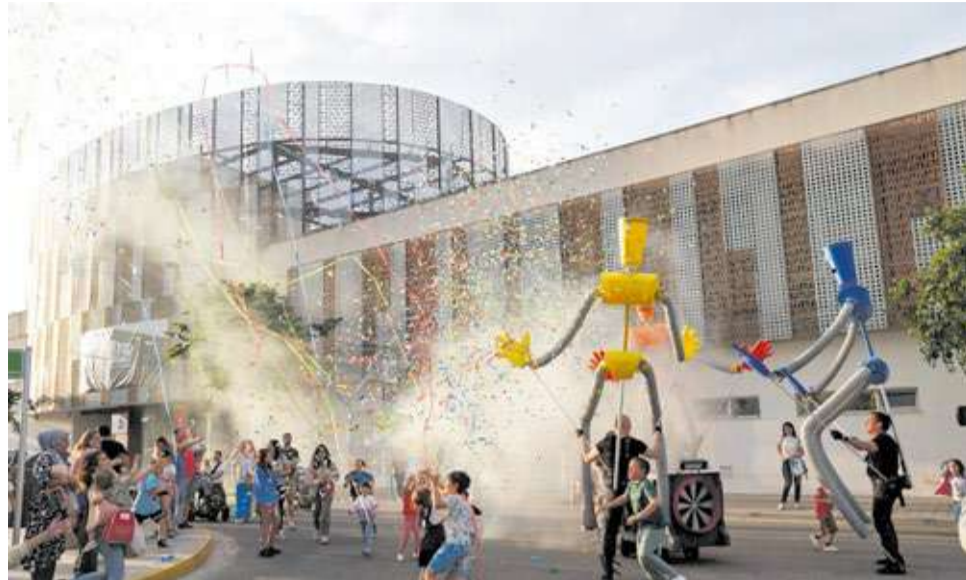
Robobops, una de les activitats del MAC de Mislata l'any passat.

La nota més musical d'esta edició la posarà el grup de punk-pop valencià Lisasinson, que farà un concert al Parc de La Canaleta presentant el seu nou treball Des de quan tot.