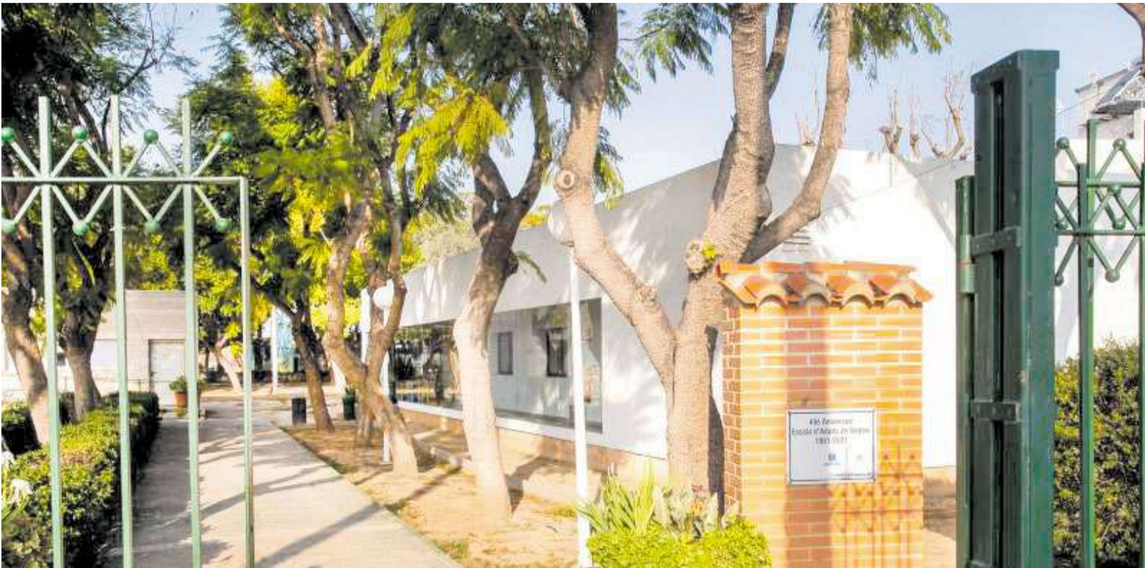
L'actual edifici on es desenvolupa l'Escola de Persones Adultes de Sedaví. / EPDA

▶ LA NOVA ESCOLA DE PERSONES ADULTES SUBSTITUÏX LES INSTAL·LACIONS ARRASADES PER LA DANA I SERÀ CASA DE MÉS DE 450 USUARIS