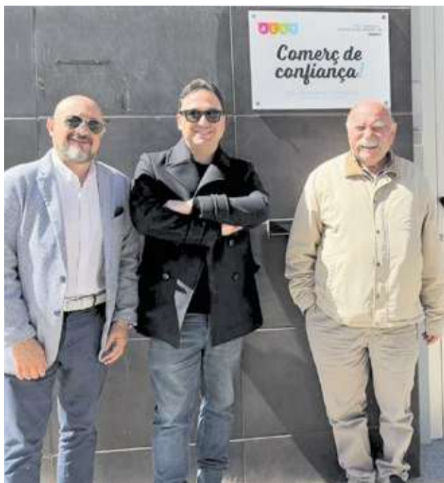
Inauguración de la nueva sede de la Asociación de Comerciantes y Servicios de Torrent (ACST).

La nueva sede se presenta como un punto de encuentro para comerciantes y empresas de servicios de la localidad, consolidándose como "la casa" del tejido empresarial torrentino adherido a la asociación. Desde este espacio, la ACST continuará desarrollando iniciativas orientadas a dinamizar, visibilizar y poten-