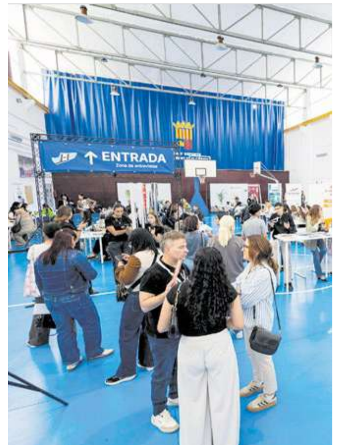
La Carrera del Empleo de Alcàsser se consolida como un espacio de intermediación laboral en el municipio.

viabilidad de los puestos de venta a largo plazo. La mejora de estos espacios públicos responde a una planificación técnica que prioriza la eficiencia energética y la comodidad térmica del recinto.