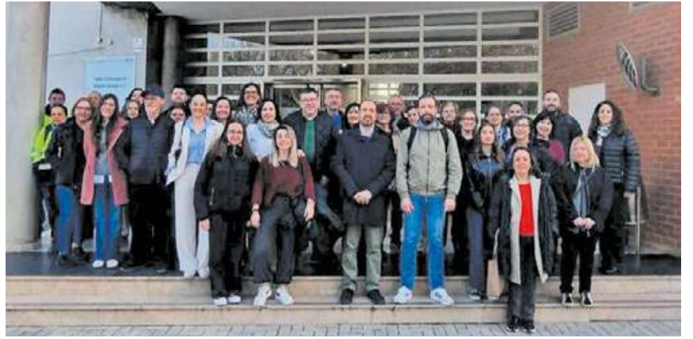
Els 40 nous treballadors amb l'alcalde d'Aldaia, Guillermo Luján.