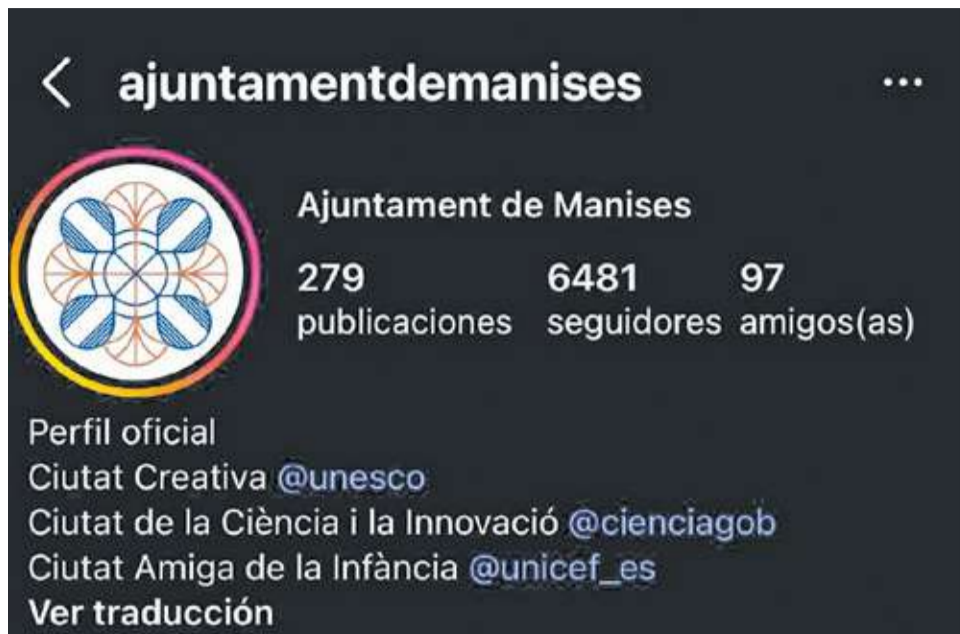
Cuenta oficial de la red social Instagram del Ayuntamiento de Manises.

La formación popular señala directamente la decisión del gabinete de Alcaldía de limitar la interacción de la ciudadanía en los per-