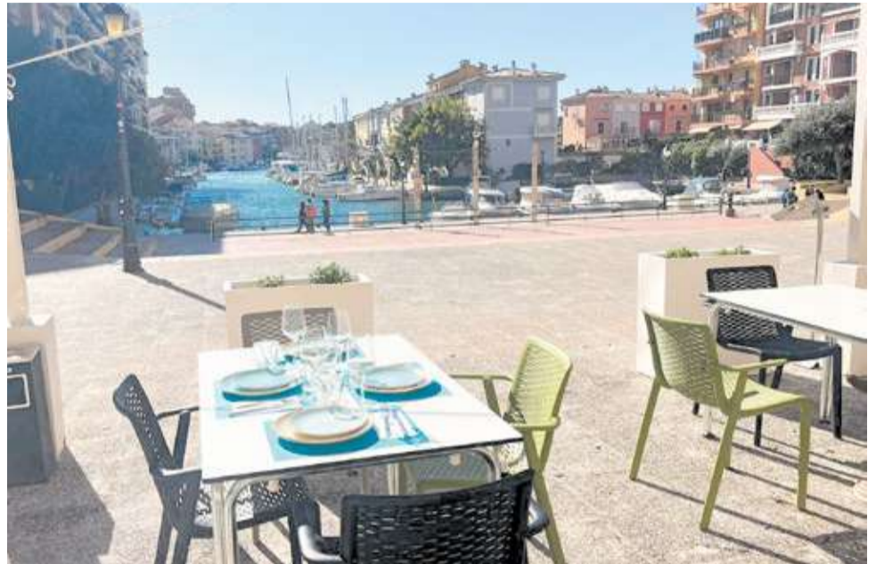
Terrassa del restaurant 'Enclave de mar' ubicat a Portsaplaya.