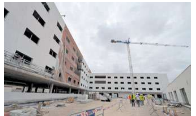
Obres de la residència i el centre de dia d'Alfafar.