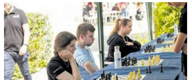
Jocs i activitats dutes a terme en la VI edició de les jornades 'Rol and Roll' del Casal Jove d'Albal.

dicada a la il·lustració en viu. Diversos artistes locals van mostrar els seus processos de treball, des dels esbossos inicials fins a les criatures fantàstiques acabades, creant un vincle directe entre l'art visual i la narrativa dels jocs.