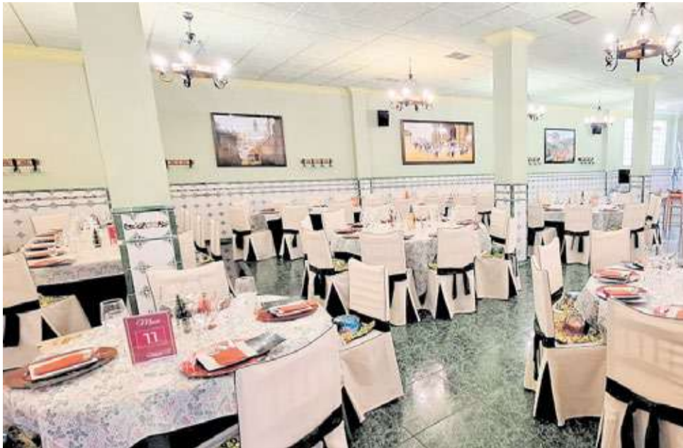
Menjador interior del Restaurant 'El Neutral', situat en el centre de Xelva.