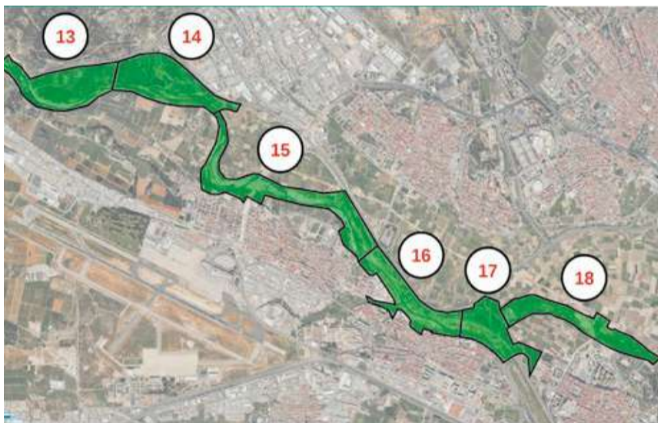
Sectors en què la Generalitat ha dividit el projecte dels parcs inundables metropolitans. / EPDA