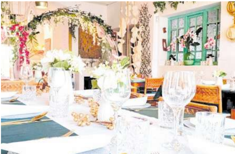
Menjador interior del restaurant 'Alquería Villa Carmen' de Catarroja.