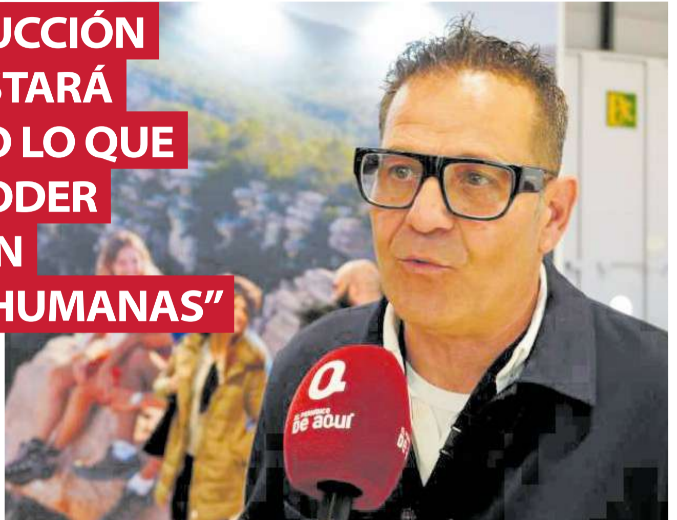
El alcalde de Sedaví y presidente de la Mancomunitat de l'Horta Sud atendiendo a El Periódico de Aquí.

tenté la alcaldía unos 14 o 15 meses inicialmente, luego pasó a Compromís, y la sintonía fue muy buena. Aunque Podemos abandonó el gobierno más tarde, logramos terminar la legislatura con éxito. En la siguiente, los ciudadanos nos volvieron a dar la confianza, subimos en número de concejales y gobernamos en solitario, aunque con el apoyo externo de Compromís. Actualmente, estamos gobernando de nuevo con ellos. Pero si algo define nuestra trayectoria desde 2011, incluso antes de gobernar, es la obsesión por el "deuda cero". Cuando entramos, el Ayuntamiento debía más de cinco millones de euros y pendía sobre nosotros una sentencia por el cierre de la piscina bajo el mandato del PP. Al final esa sentencia se quedó en algo menos de tres millones. Nosotros abrimos la pisci-