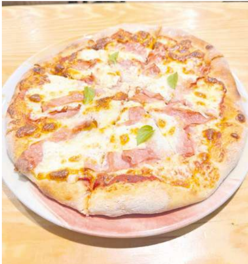
Pizza elaborada pel restaurant 'La Vuelta' de Segorbe.

Un dels seus principals atractius és la qualitat del