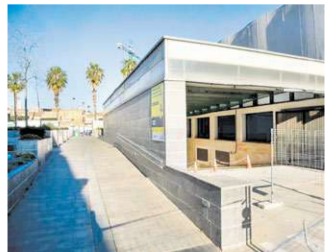
Obres en el pàrquing municipal de Sedaví.

D'altra banda, l'Ajuntament ha informat les persones usuàries amb plaça en el garatge municipal del carrer València (amb accés pel carrer Salvador Giner) que han de comunicar qualsevol canvi de vehicle. A partir del 9 d'abril, hauran de presentar una instància indicant la nova matrícula i el permís de circulació, amb l'objectiu d'agilitzar els preparatius per a la pròxima reobertura de la instal·lació.