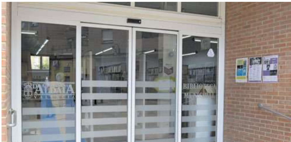
Una de les sales de la Biblioteca Municipal d'Aldaia.