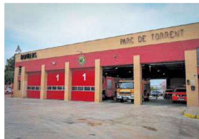
Parque de Bomberos de la ciudad de Torrent.

La importancia de esta reforma trasciende el ámbito local, puesto que el parque de Torrent es considerado un nodo logístico fundamental para la comarca. Su relevancia se hizo patente durante episodios críticos como la pasada dana, donde la capacidad de respuesta desde este punto fue vital para la gestión del desastre. La modernización busca dignificar las condiciones laborales de la plantilla y reducir los tiempos de respuesta y