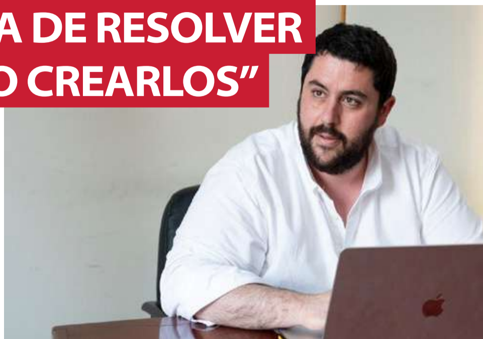
El presidente de Unión Municipalista, David García.

Estamos agrupando a los alcaldes y concejales de ca-