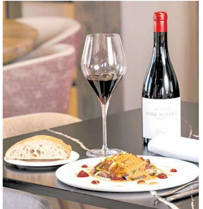
Magret d'ànec elaborat a 'Finca Calderón' de Requena.