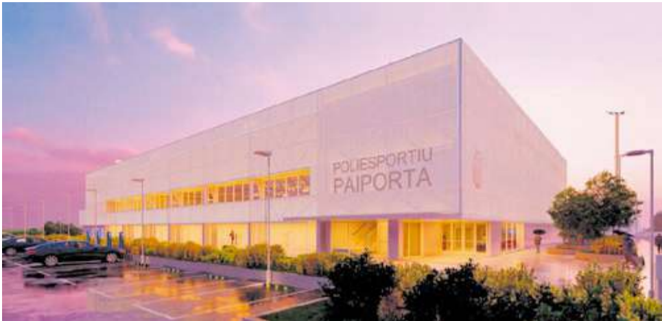
Maqueta del futur pavelló poliesportiu de Paiporta.