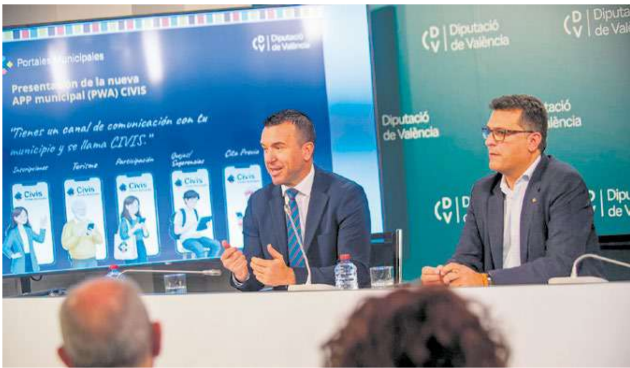
El president de la Diputació de València i l'alcalde d'Alfafar durant la presentació de l'app municipal CIVIS.