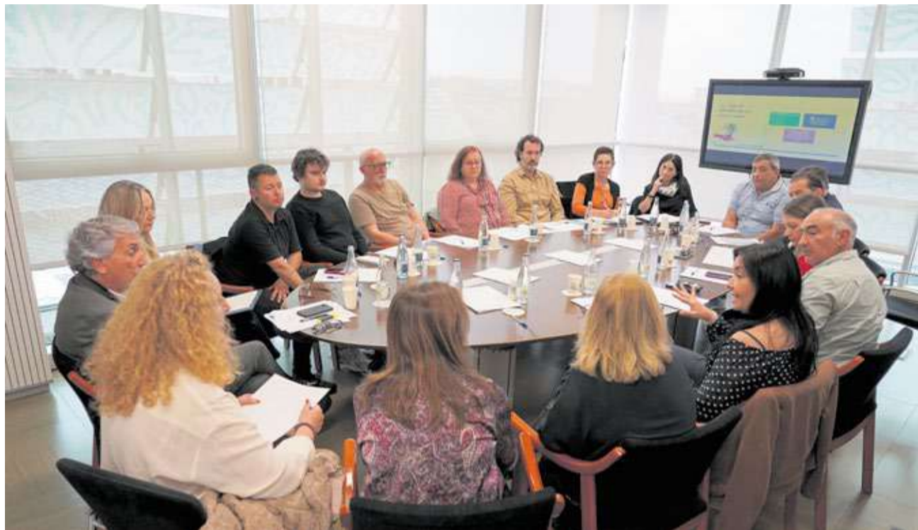
Primera Taula Permanent de Treball que la Generalitat ha mantingut amb les associacions de víctimes.