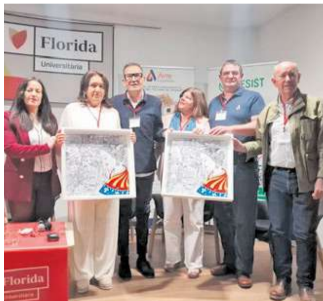
Diferents moments de les jornades del projecte Resist a Florida Centre Educatiu.

Finalment, l'alcaldessa de Catarroja va manifestar que