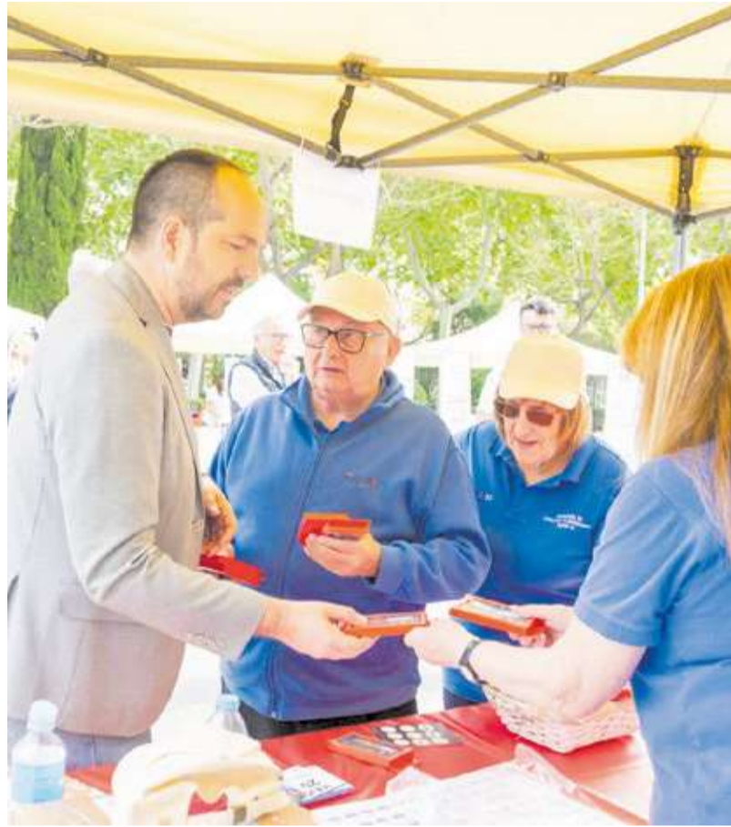
Dos dels llocs de les diferents associacions a la fira DELAMÀ celebrada en la plaça de les Corts Valencianes d'Aldaia.

► L'ESDEVENIMENT BUSCA APROPAR A LA CIUTADANIA LA DIVERSITAT D'INICIATIVES QUE CONVIUEN DIÀRIAMENT AL MUNICIPI