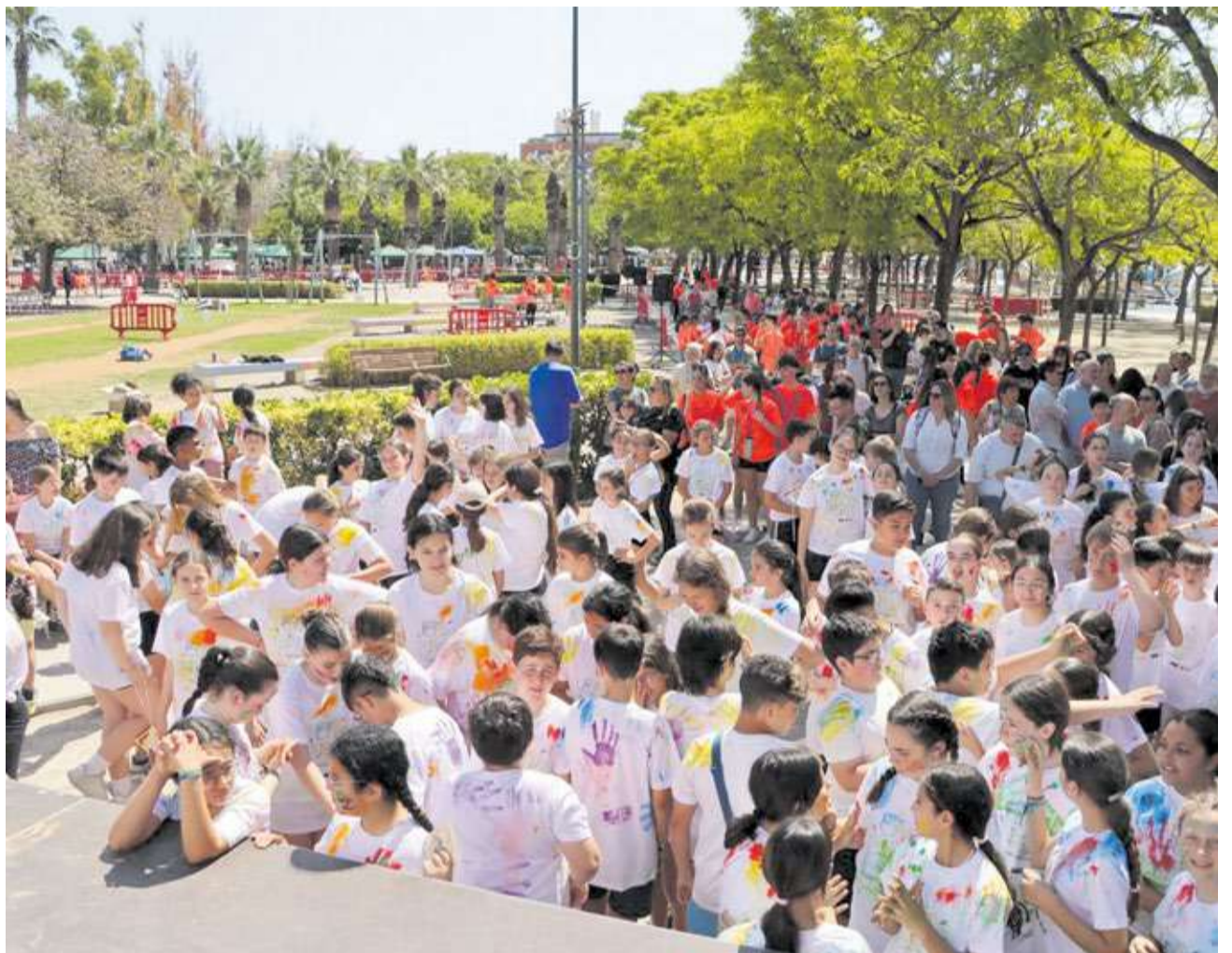
Xiquets i xiquetes a la celebració de la Festa de la Primavera d'Alaquàs en anys anteriors.

Com no podia ser d'una altra manera, la gastronomia posarà el punt final al matí. A les 14 hores se serviran les paelles solidàries. Per una aportació simbòlica de tres euros, els assistents podran gaudir d'una ració de paella i beguda, sabent que cada