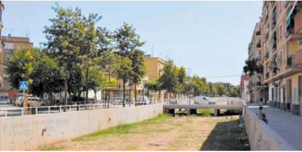
Imatge d'arxiu del barranc de la Saleta al seu pas pel municipi d'Aldaia.