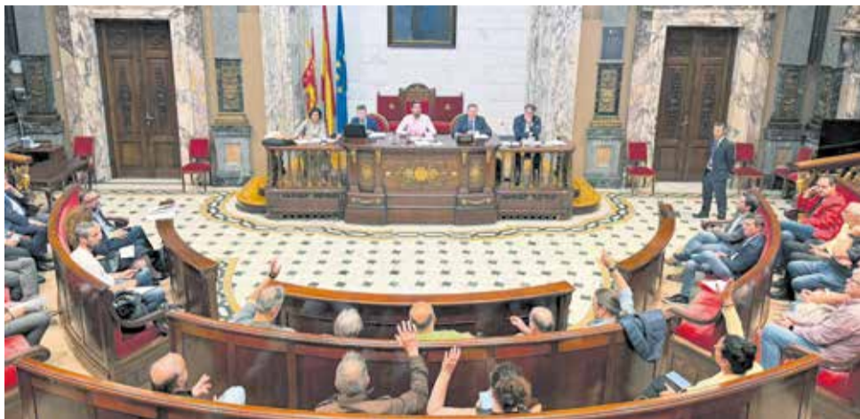
Un pleno celebrado por la EMTRE en el Ayuntamiento de Valencia.