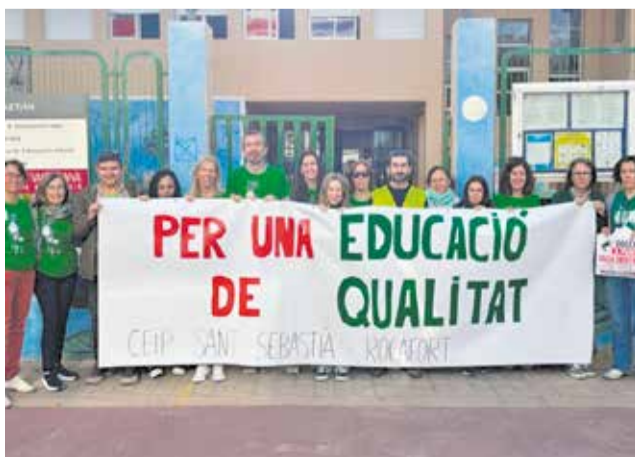
Professorat del CEIP Sant Sebastià de Rocafort.