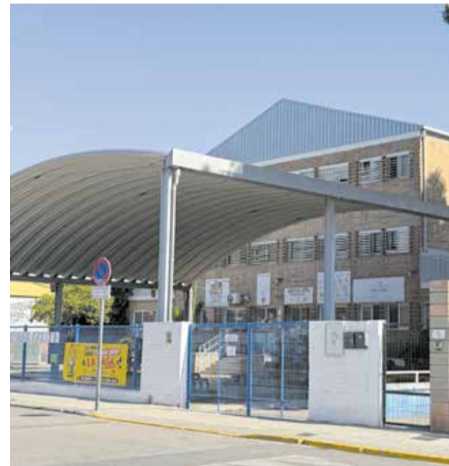
El CEIP Doctora Anna Lluç d'Alfara del Patriarca. / EPDA

L'objectiu final d'esta obra és habilitar l'històric immoble com a nou consistori. D'esta manera, es combinarà la recuperació d'un edifici d'alt valor arquitectònic i cultural amb