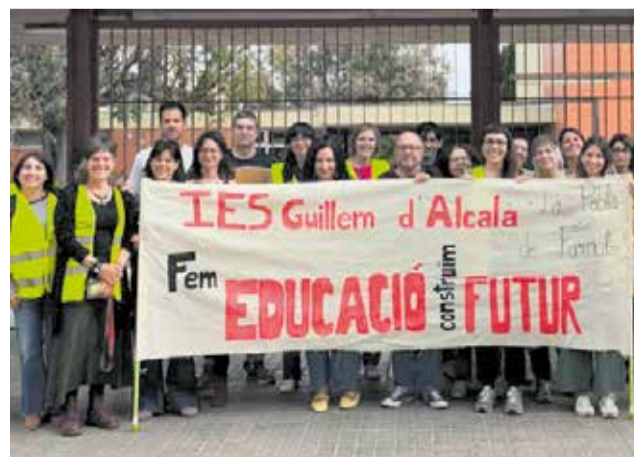
Docents d'un institut de la Poble de Farnals. / MOVEM L.H.N.

Dins d'este mapa de mobilització, destaquen especialment comunitats educatives com les de Museros, que ha liderat l'activitat en la zona, al costat d'altres municipis com Foios, Massamagrell i Alboraya. Així mateix, el seguiment ha sigut molt visible en els centres d'educació primària de Burjassot i Paterna, on el professorat s'ha bolcat amb la vaga.