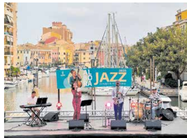
Un concert d'Alborajazz 2025 a Port Saplaya.

El tancament d'esta edició d'Alborajazz arribarà el diumenge 14 de juny a la Plaça de la Constitució. A partir de les 20.00 h, el prestigiós músic Andrés Belmonte serà l'encarregat de posar el fermall d'or a un festival que torna a demostrar que Alboraia és un escenari obert a la creativitat i al talent en directe.