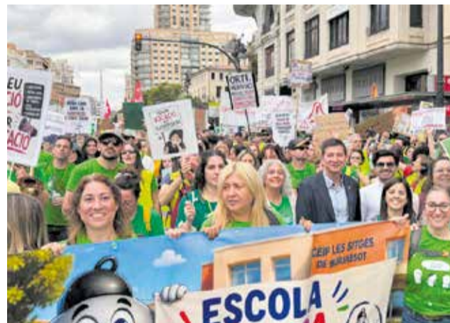
Professorat de Burjassot manifestant-se. / MOVEM L.H.N.