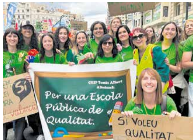
Professorat d'un col·legi públic d'Albuixech. / MOVEM L.H.N.