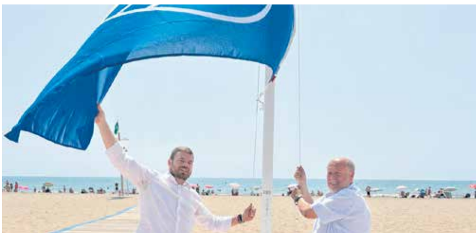
Hissada de la Bandera Blava en la Platja Nord de la Pobla de Farnals.