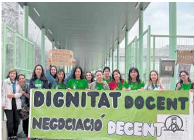
Professorat d'un col·legi públic de Foios. / MOVEM L.H.N.