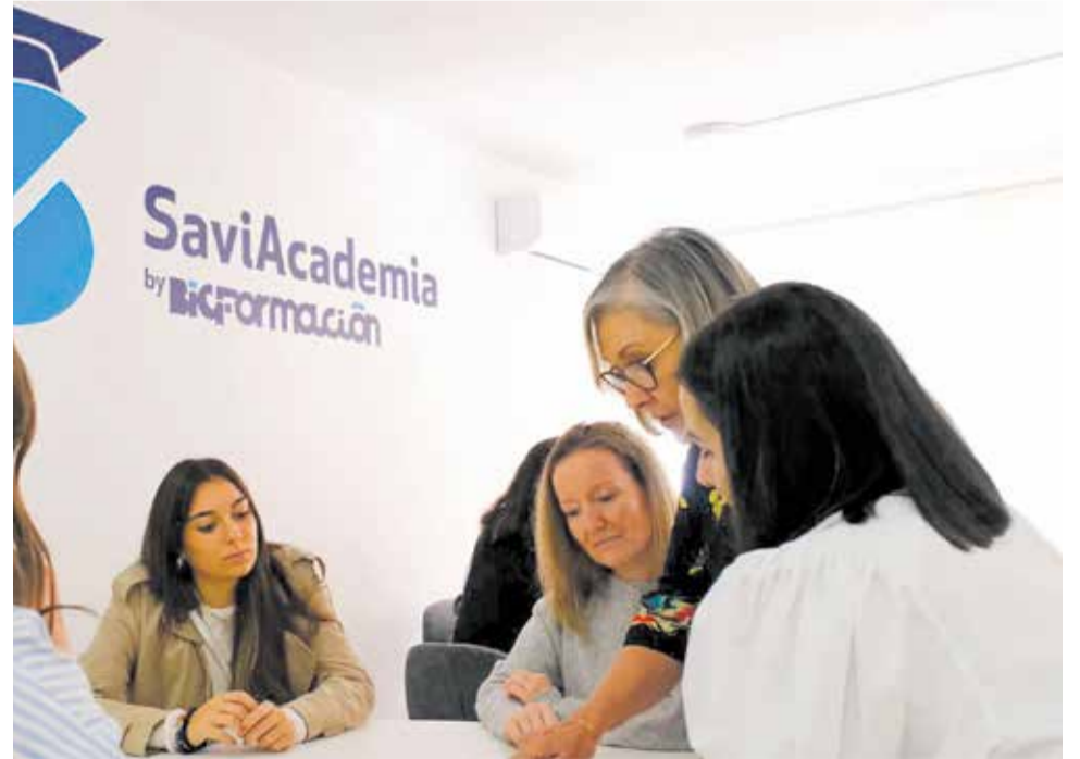
Alumnado del programa SaviAcademia.

Big Formación, entidad especializada en formación profesional, garantizando una preparación adaptada a las necesidades actuales del sector. El programa está dirigido a personas de entre 18 y 30 años con titulación mínima de ESO, en situación de desempleo e inscritas como demandantes de empleo. Además, se requiere no haber tenido un contrato indefinido en los tres meses anteriores ni haber desempleado el mismo puesto en