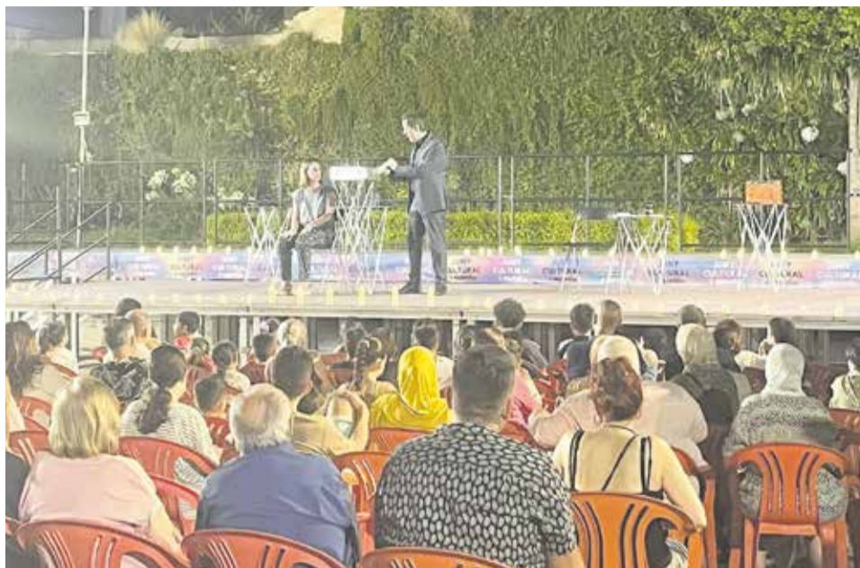
Una de les activitats realitzades del 'Juny Cultural i Esportiu' de l'any passat.

ESPORT I JOVENTUT L'apartat esportiu arrancarà amb força a finals de maig amb la Gala Fi d'Escoles Esportives i trobades de pàdel i frontenis. A més, els