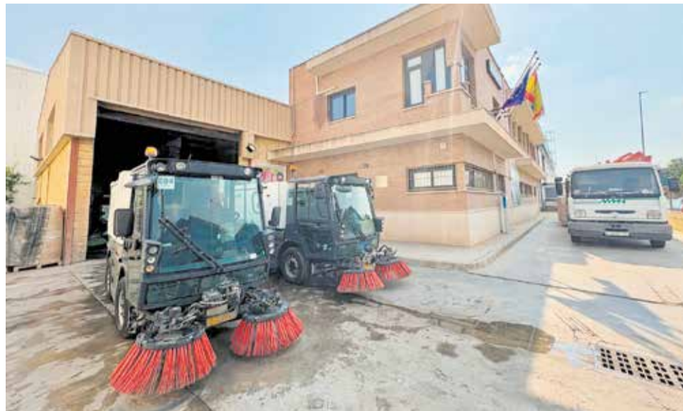
Maquinària pertinent per a dur a terme la neteja dels diferents municipis.