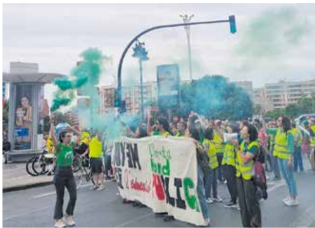
Columna de l'Horta Nord en una manifestació.