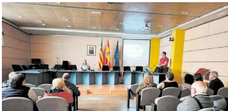
Reunió informativa al saló de plens de l'Ajuntament de la Pobla de Farnals.