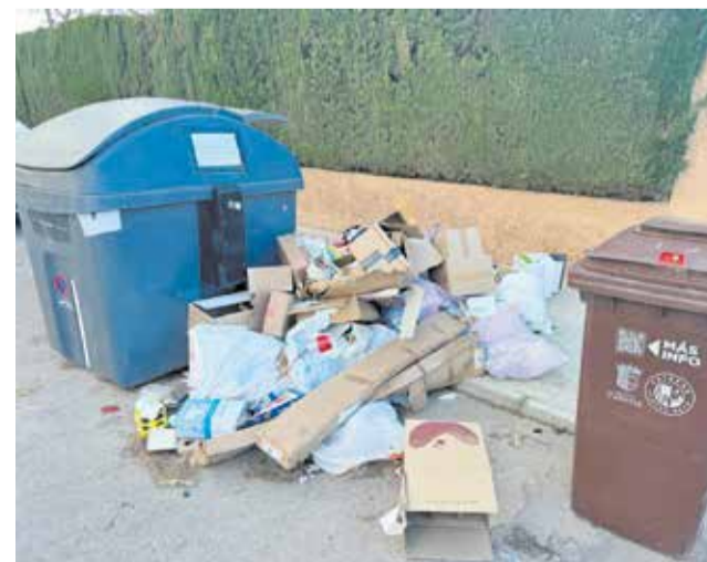
Suciedad en los contenedores de Paterna.

Por último, la portavoz de la oposición ha enmarcado esta situación dentro de la trayectoria del primer edil, señalando que Juan Antonio Sagredo debe decidir si centrarse en la gestión de los contratos de Paterna o en su carrera política externa y su puesto de senador. Según concluye el comunicado del Partido Popular, los ciudadanos requieren un alcalde enfocado exclusivamente en las problemáticas y dificultades que atañen al municipio.