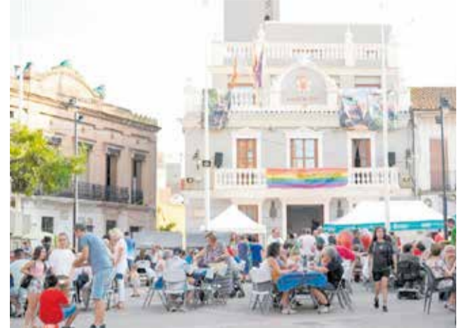
IV Fira de la Tomata de Meliana, en 2025.

Des de l'Ajuntament de Meliana s'anima a tota la ciutadania i visitants de la comarca a participar en esta jornada festiva dedicada a la nostra agricultura, gastronomia i tradicions, convertint Meliana en el gran aparador de l'autèntica tomata valenciana.