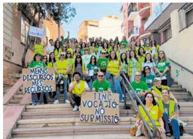
Docents de diferents centres públics de Paterna. / MOVEM L.H.N.