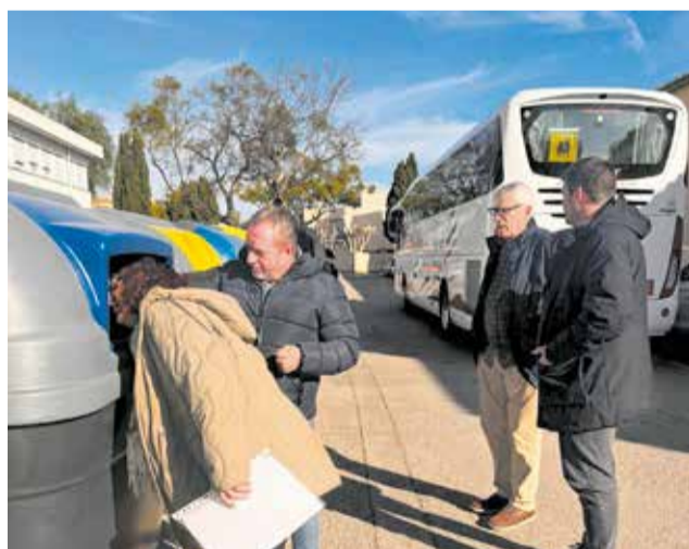
Nous contenidors impulsats per la Mancomunitat.

L'àrea de Medi Ambient de la Mancomunitat del Carraixet, ha iniciat una campanya informativa per a mostrar les millores realitzades en els serveis de recollida de residus, unes accions destinades a transformar els hàbits ciutadans cap a un futur més verd.