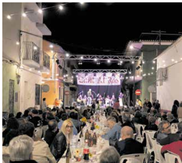
Públic assistent a l'esdeveniment musical.