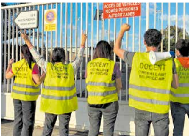
Professorat d'un institut públic de Massamagrell. / MOVEM L.H.N.