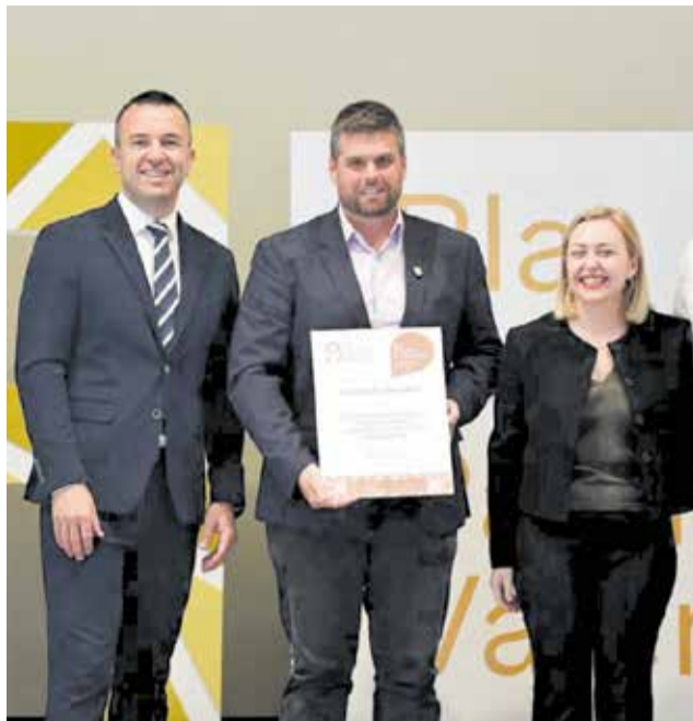
L'alcalde firma amb la Diputació la rehabilitació del Palau.

Esta inversió es destinarà íntegrament a l'adequació de l'edifici d'Infantil, la rehabilitació integral del bloc