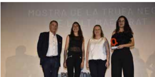
GASTRONOMIA: La Mostra de la Trufa Negra de l'Alt Maestrat.