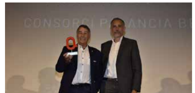
MEDI AMBIENT: Consorci Palància Belcaire.