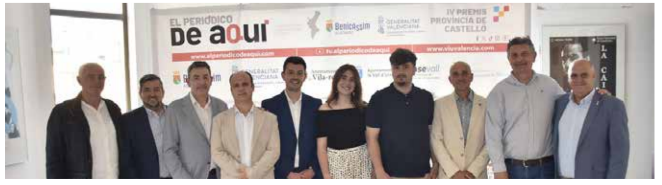
Autoritats i convidats al photocall dels Premis El Periódico de Aquí.