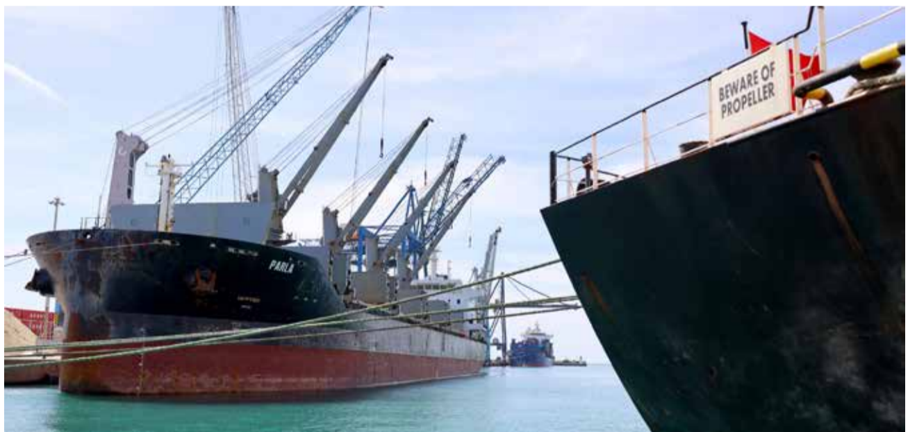
Vaixells de càrrega atracats al Port de Castelló.

La dada més cridanera del mes correspon al tràfic de contenidors, que va créixer un 80%, una xifra que reflecteix el dinamisme comercial que viu la infraestructura castellanenca. La mercaderia general transportada en contenidor va avançar un 56,8%, mentre