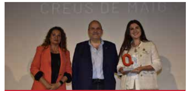
FESTES: Les Creus de Maig de Borriana.