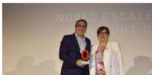
ESPECIAL: A les Noves Escales de Creuers del Port de Castelló.