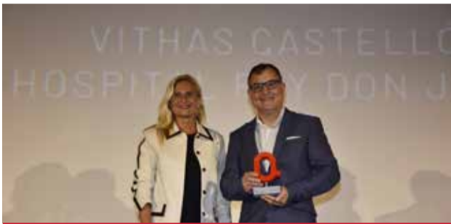
SALUT: Hospital Vithas de Castelló.