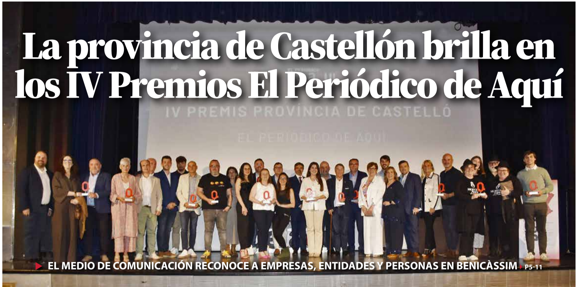
► EL MEDIO DE COMUNICACIÓN RECONOCE A EMPRESAS, ENTIDADES Y PERSONAS EN BENICÀSSIM ► P5-11