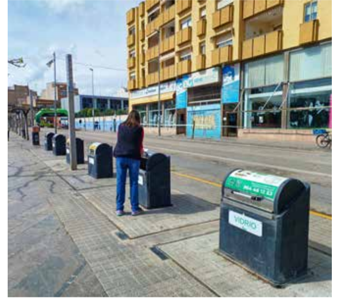
Ciutadana reciclant.

Els establiments comercials poden obtenir reduccions encara més importants: fins a un 20% per adherir-se a la recollida porta a porta de paper i cartó, i fins a un 30% per participar en la recollida de biorresidus. Com que ambdues són acumulables, els negocis que s'acullen a les dues modalitats poden arribar al 50% de descompte.