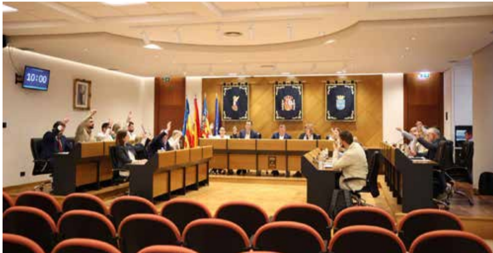
Ple extraordinari a l'Ajuntament de Borriana. / EPDA

El projecte es desenvoluparà mitjançant un model de finançament sanitari pioner: la Generalitat assumirà la inversió total, mentre que el consistori gestionarà la licitació i l'execució administrativa de les obres, amb l'objectiu d'agilitzar els terminis i començar els treballs abans de 2027 a la zona del Port de Borriana.