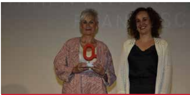
CULTURA: Al Certamen Internacional de Guitarra Francesc Tàrraga.