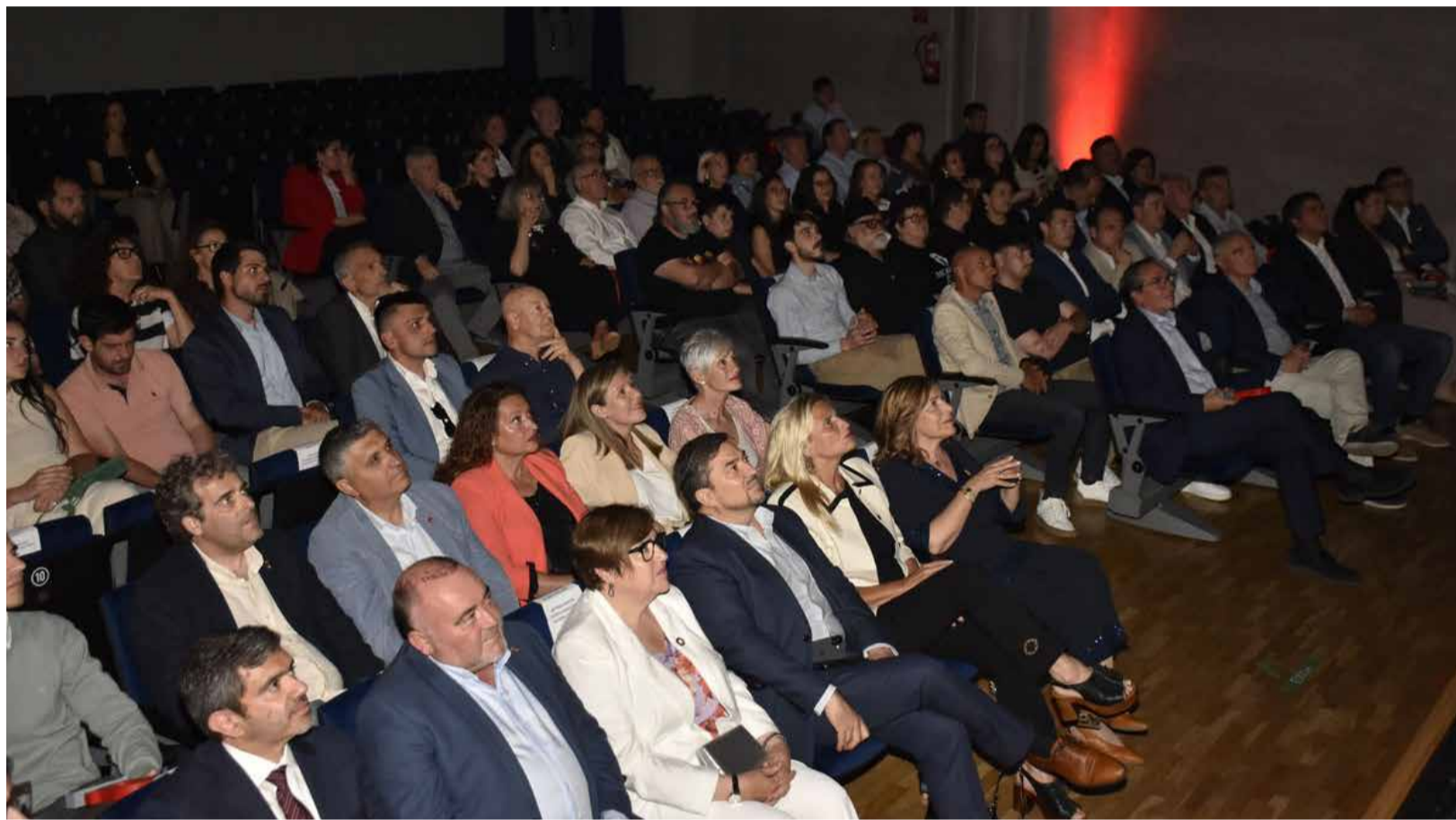
Assistents a la gala en el Teatre Municipal Francesc Tàrraga.

► VORA 200 PERSONES OMPLIN EL TEATRE MUNICIPAL DE BENICÀSSIM PER A RECONÉIXER PERSONES, ENTITATS I INSTITUCIONS