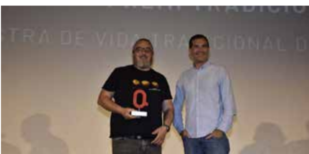
TRADICIÓ: La Mostra de Vida Tradicional de Vilafamés.