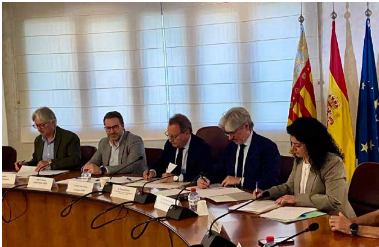
Representants de la Generalitat i del sector taulellar.

El secretari autonòmic va insistir en la necessitat de mantindre la pressió a Brussel·les per evitar que la regulació europea sobre emissions perjudique greument el teixit industrial ceràmic. En este sentit, va reclamar una posició conjunta de totes les forces polítiques valencianes per reforçar la defensa del sector davant la Unió Europea. Pressió davant Brussel·les