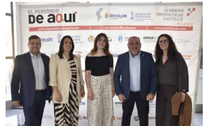
Autoritats i convidats al photocall dels Premis El Periódico de Aquí.