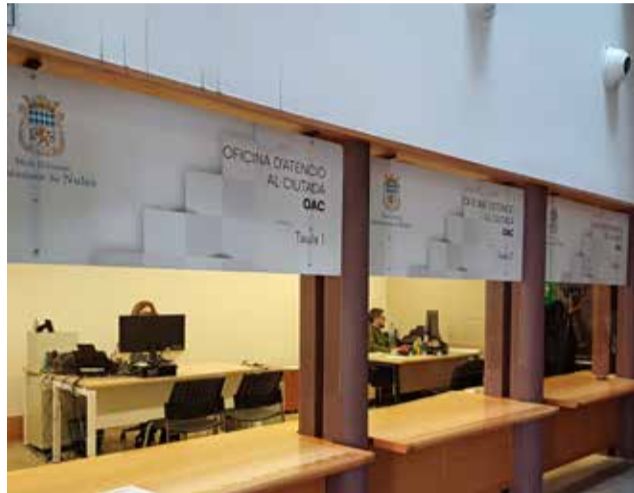
Les taules de l'Oficina d'Atenció al Ciutadà.

La transformació digital afecta aquells procediments administratius més recurrents en el dia a dia del poble, és a dir, aquells tràmits que els veïns i veïnes necessiten realitzar amb més freqüència i que fins ara requerien desplaçaments i esperes innecessàries. Amb aquesta mesura, el consistori elimina barres burocràtiques i facilita de manera significativa la relació entre la ciutadania i l'administració local, posant les noves tecnologies