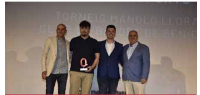
ESPORT: Torneig Manolo Llorach, organitzat pel Cub de Bàsquet Benicarló.