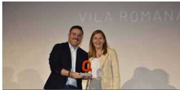
PATRIMONI: Vila Romana de Benicató, Nules.