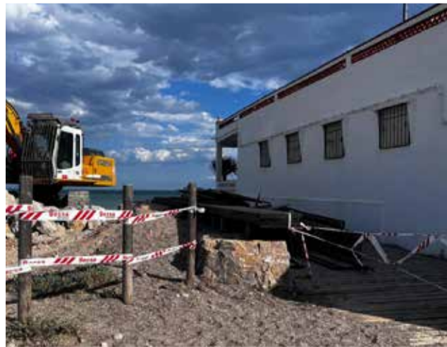
Els treballs de millora del litoral.

Les actuacions busquen garantir que totes les zones del litoral nulero estiguen en les millors condicions possibles per a rebre la temporada de bany, assegurant tant la seguretat com el confort dels usuaris. La regidora ha subratllat la importància d'aquests treballs per a mantenir l'atractiu turístic del municipi i oferir un servei de qualitat a tots aquells que trien les platges de Nules per a gaudir del seu temps lliure durant l'estiu.