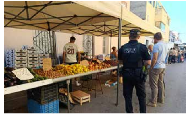
La Policia Local de Nules fent un control.