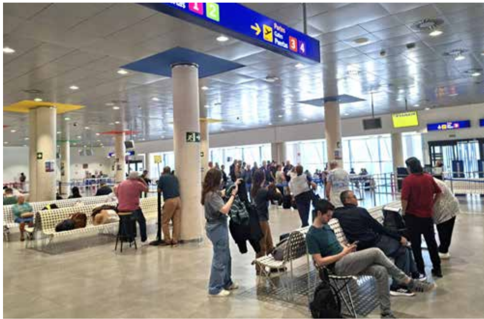
Diversos viatgers en l'aeroport de Castelló.

L'aeroport també ha anunciat una operativa xàrter per a final de juny que permetrà l'arribada de fins a 2.700 turistes procedents d'Eslovàquia, consolidant així Castelló com a destinació d'interès per al mercat centreeuropeu.