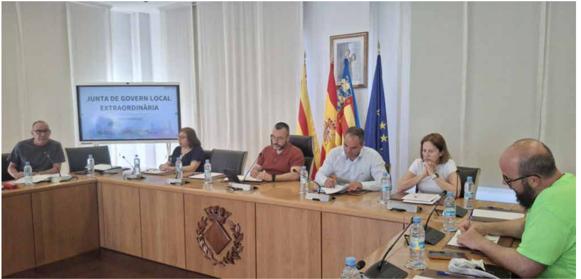
Un instant durant la Junta de Govern Local Extraordinària de l'Ajuntament de Vila-real.

► MÉS DIES DE BANY, MILLORES AL RECINTE I PREUS ACTUALITZATS I ADAPTATS A TOTS ELS VEÏNS, VEÏNES I CLUBS ESPORTIUS