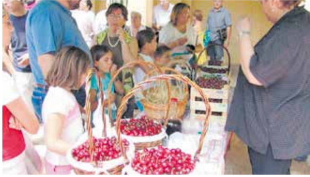
Uno de los puestos de la Feria de la Cereza de Caudiel.

El sábado 6 de junio se desarrollará la jornada central del certamen con la apertura del Mercado Artesanal y Popular, actividades infantiles, visitas guiadas a la Iglesia