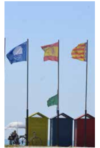
Bandera Blava.

L'acte de lliurament de les Banderes Blaves de la Comunitat Valenciana se celebra a Xilxes. Aquests guardons els atorga l'Associació d'Educació Ambiental i del Consumidor (ADEAC) i distingeixen l'excel·lència en aspectes com la qualitat de l'aigua, la seguretat, els