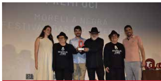
OCI: Festival Morella Negra com la Trufa.