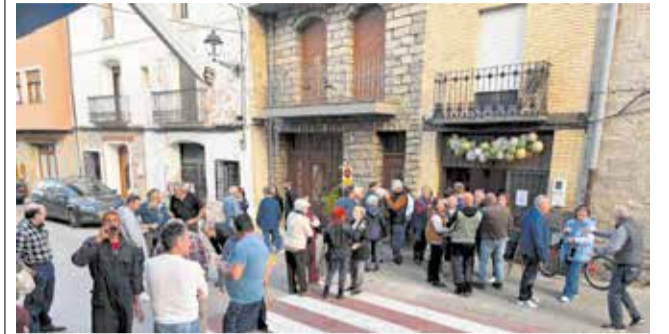
Inauguración de la nueva panadería de El Toro