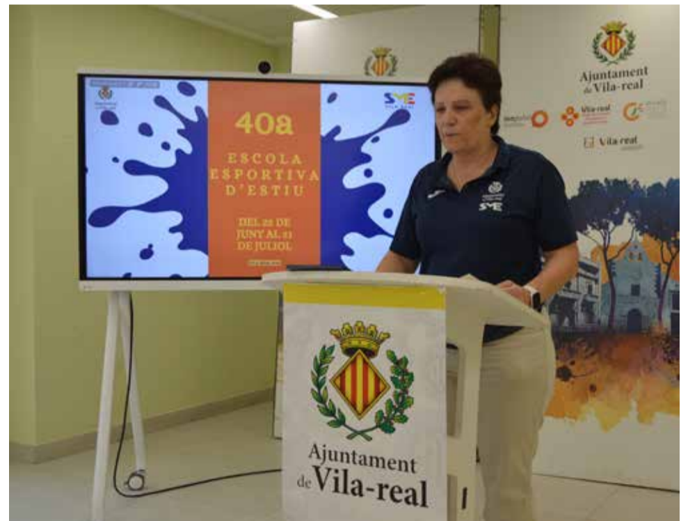
Presentació de la 40a edició de l'Escola Esportiva d'Estiu / EPDA

Pel que fa a l'Estiu Actiu, amb 955 places, les activitats es duran a terme entre el 22 de juny i el 31 de juliol a la piscina coberta Yurema Requena i al pavelló Bancaixa. El programa inclou nou disciplines: cursos de natació per a xiquets de 3 a 14 anys i per a adults, activitats aquàtiques per a bebès d'entre 6 i 36 mesos, aigua-salut per a majors de 65 anys, pilates, ioga, bific i entrenament funcional, aquesta última incorporada per primera vegada a la campanya estival després de l'èxit registrat durant l'hivern.