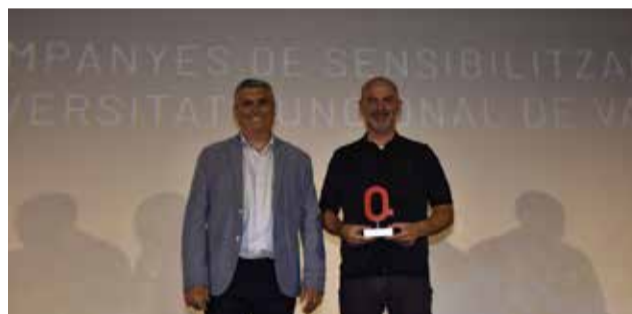
DIVERSITAT: Les Campanyes de Sensibilització sobre la Diversitat Funcional.