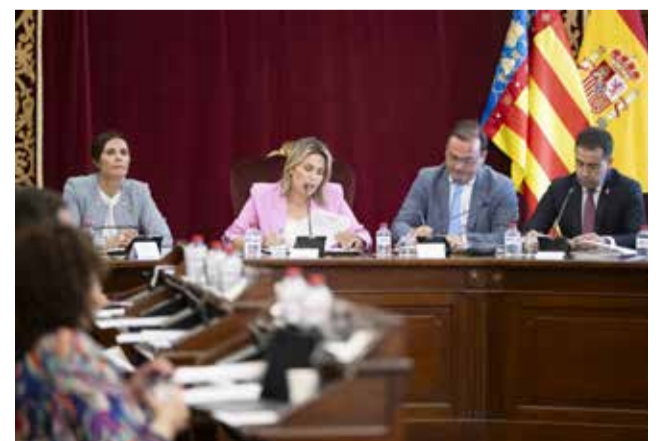
Ple ordinari de la Diputació.

Després de l'aprovació inicial i el seu corresponent període d'al·legacions, es procedirà a l'aprovació definitiva. El vicepresident provincial ha subratllat que la inversió destinada a gasto corrent, 1.965.000 euros, "una vegada s'aprove de manera definitiva es realitzarà un acompte del 100%".