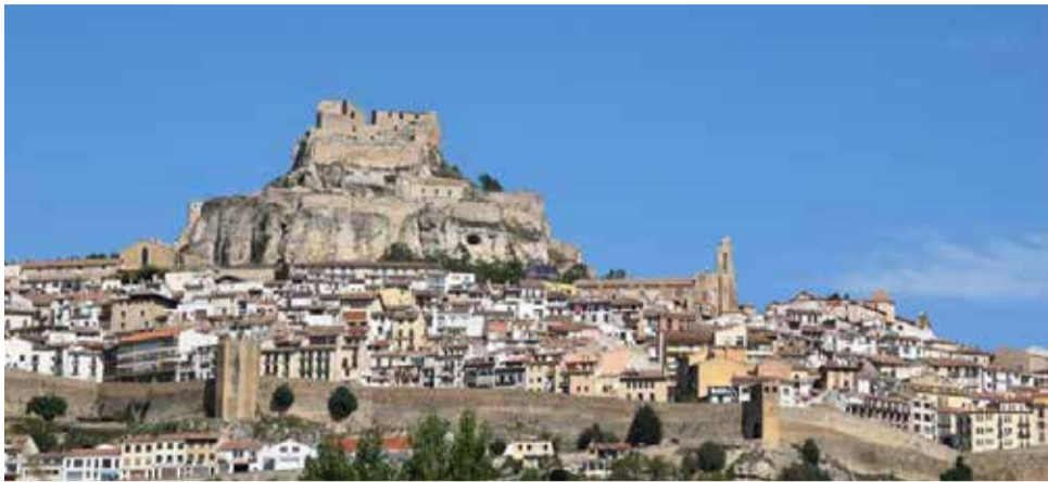
Vista panoràmica de Morella