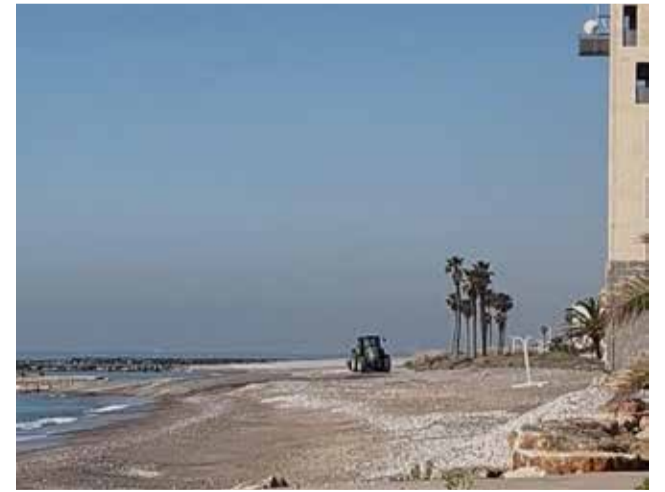
Maquinària treballant a les platges.

Des del consistori s'insisteix en la necessitat d'una major implicació de