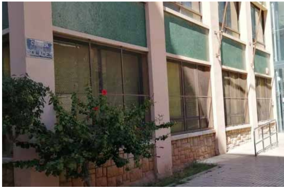
Centre de Salut Torrehermosa.