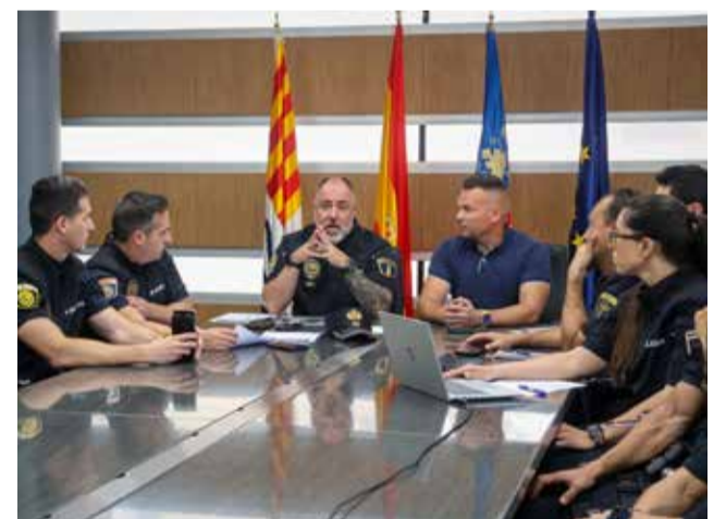
La Policia Local d'Onda i el regidor de Seguretat.

taquen la consulta ràpida de legislació i ordenances municipals, l'accés àgil a procediments interns i recursos tècnics de suport, i la generació assistida d'esborranys durant les actuacions. El sistema incorpora també mecanismes de protecció de dades i confidencialitat, complint de la normativa vigent.