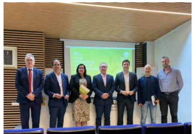
Durant la presentació del projecte a l'abril.

Entre les iniciatives destacades del PSTD es troba precisament la creació i consoli-