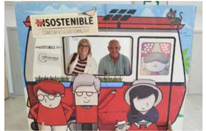
L'alcalde d'Aielo de Malferit i la regidora municipal.

Al Centre Cultural Grup Nou es va poder visitar l'exposició "Un camí cap a la sostenibilitat", una mostra que apropava els 17 ODS de