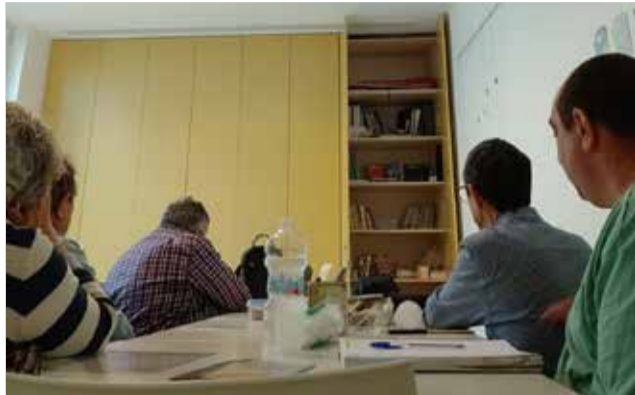
Algunes persones rehabilitades.

El moviment d'Alcohòlics Anònims es va originar en 1935 a Akron (Estats Units), arran de la trobada entre Bill W. i el Dr. Bob, dues persones