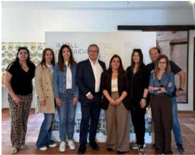
El president de la Mancomunitat amb visitants.

La jornada va començar amb un esmorzar de benvinguda i va continuar amb l'obertura del museu fins a les dues del migdia. Durant el recorregut, els visitants van poder redescobrir peces relacionades amb els oficis tradicionals, la vida agrícola, la indústria local, les festes populars i objec-