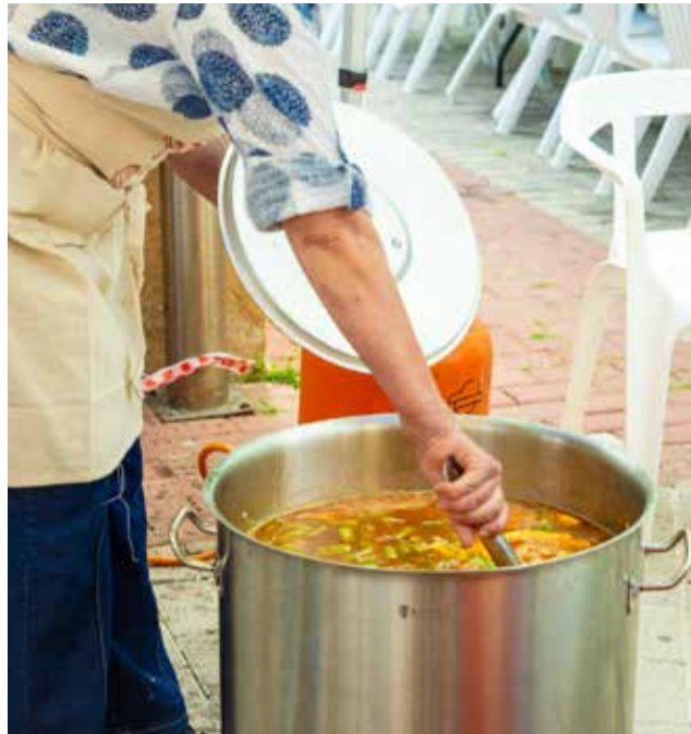
Concurs d'arròs i pastissets de moniato

Equips formats per famílies, colles d'amics i associacions locals van treballar en un ambient distès, compartint fogons i experiències gastronòmiques. L'Ajuntament va facilitar tant els ingredients com el material necessari per al desenvolupament del concurs.