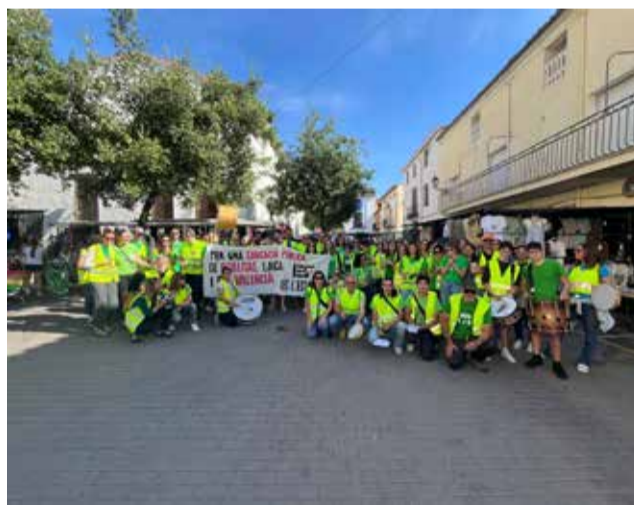
Durant una de les manifestacions.

Els docents insistixen que el conflicte va molt més enllà de la qüestió salarial i afecta directament la qualitat educativa. Entre les principals reivindicacions van destacar la reducció de ràtios, la millora de l'atenció a la diversitat, la falta de recursos en les aules específiques i la manca