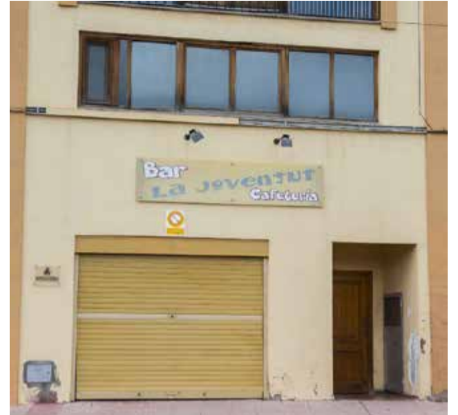
La seu de l'Espai Jove de Bocairent.

El nou Espai Jove comptarà amb dues àrees diferenciades. D'una banda, hi haurà una zona infantil orientada principalment