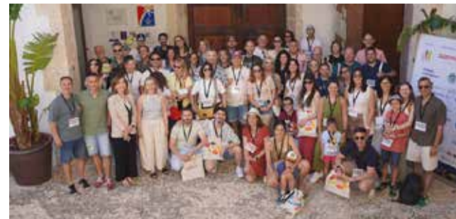
Travel bloggers.