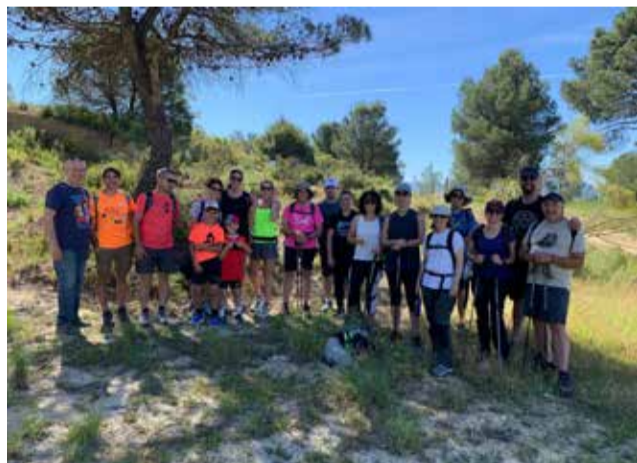
Una de les activitats del programa.

La programació continuarà el 13 de juny a Guadasséquies, el 14 de juny a Bocairent, el 20 de juny a Quatretonda i finalitzarà el 21 de juny a Agullent, tancant així una nova edi-