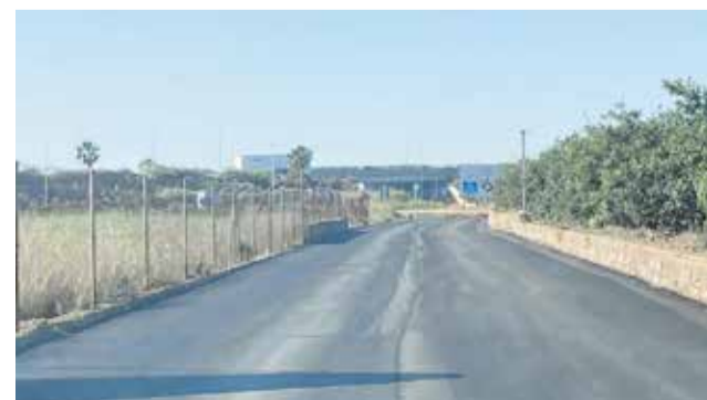
El camí comença a estar asfaltat.

ritzontal com vertical, aconseguint com a objectiu principal incrementar la seguretat viària i reduir la sinistralitat en tot el traçat. Com a conseqüència directa de l'execució d'estes obres, les autoritats han informat que es tallarà de manera total el tram afectat durant les hores de treball de les màquines.