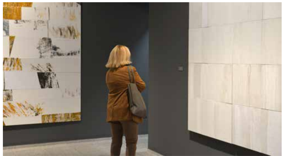
Una mujer observa una obra de la exposición Carrara, en la sala de la Glorieta.