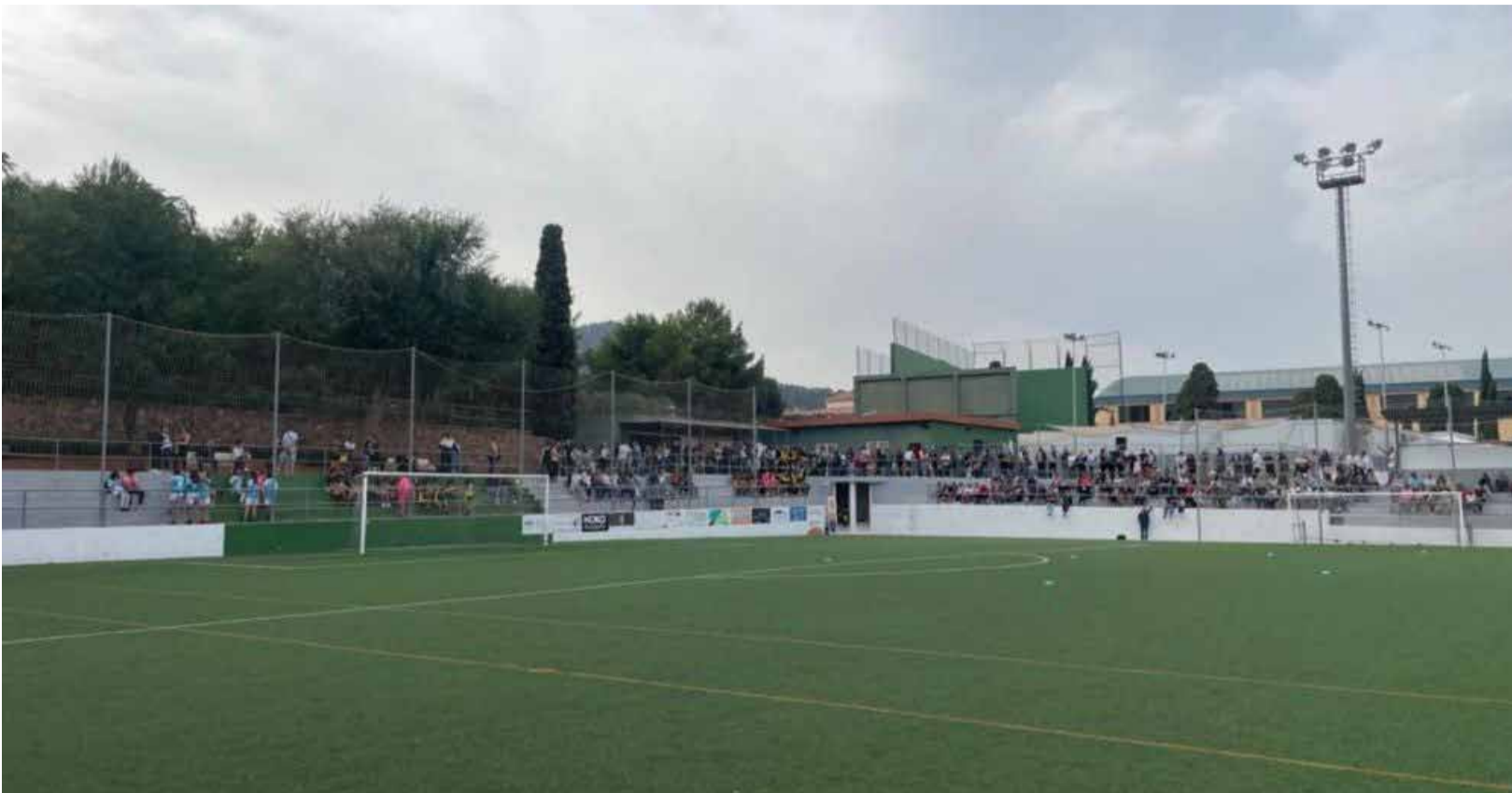
Menors del Club de Futbol de Faura durant un entrenament recent.

► LA DENÚNCIA ASSENYALA EL FISIOTERAPEUTA DE L'EQUIP FEMENÍ, UN JOVE DE 25 ANYS, PELS FETS OCORREGUTS EL 13 DE MAIG