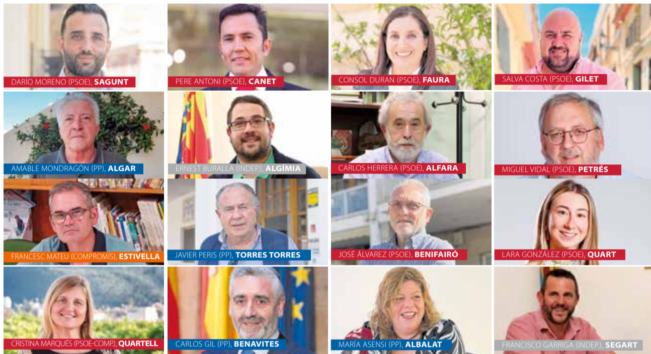
Los actuales alcaldes y alcaldesas, por municipios y partidos.

Alfara de la Baronía es una de las golosinas para el PP, donde la formación busca devolver la alcaldía a quien fuere alcal-