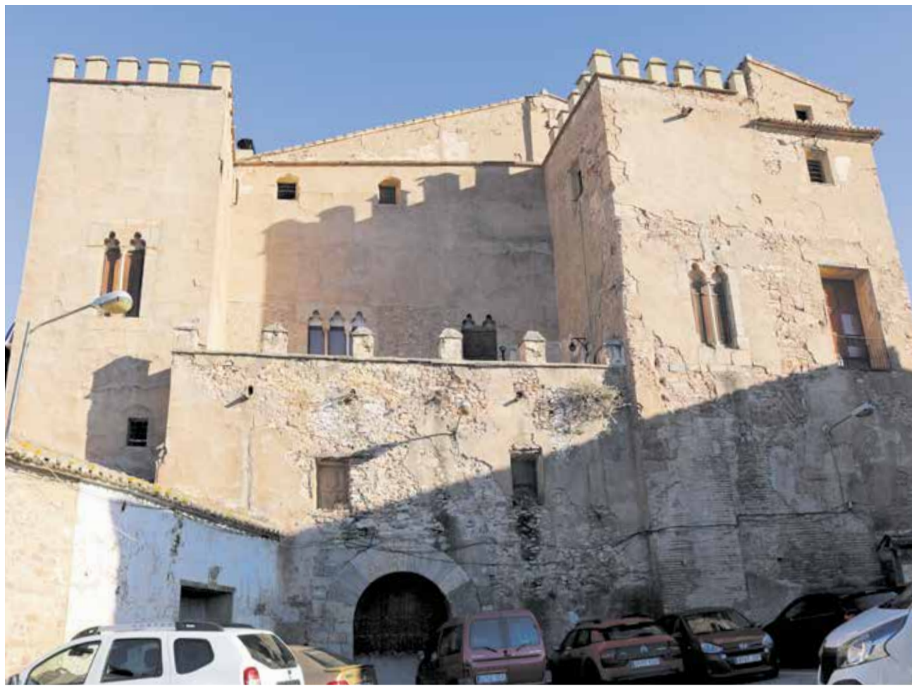
L'entrada al Castell-Palau d'Albalat dels Tarongers, amb un alt valor per al patrimoni valencià.