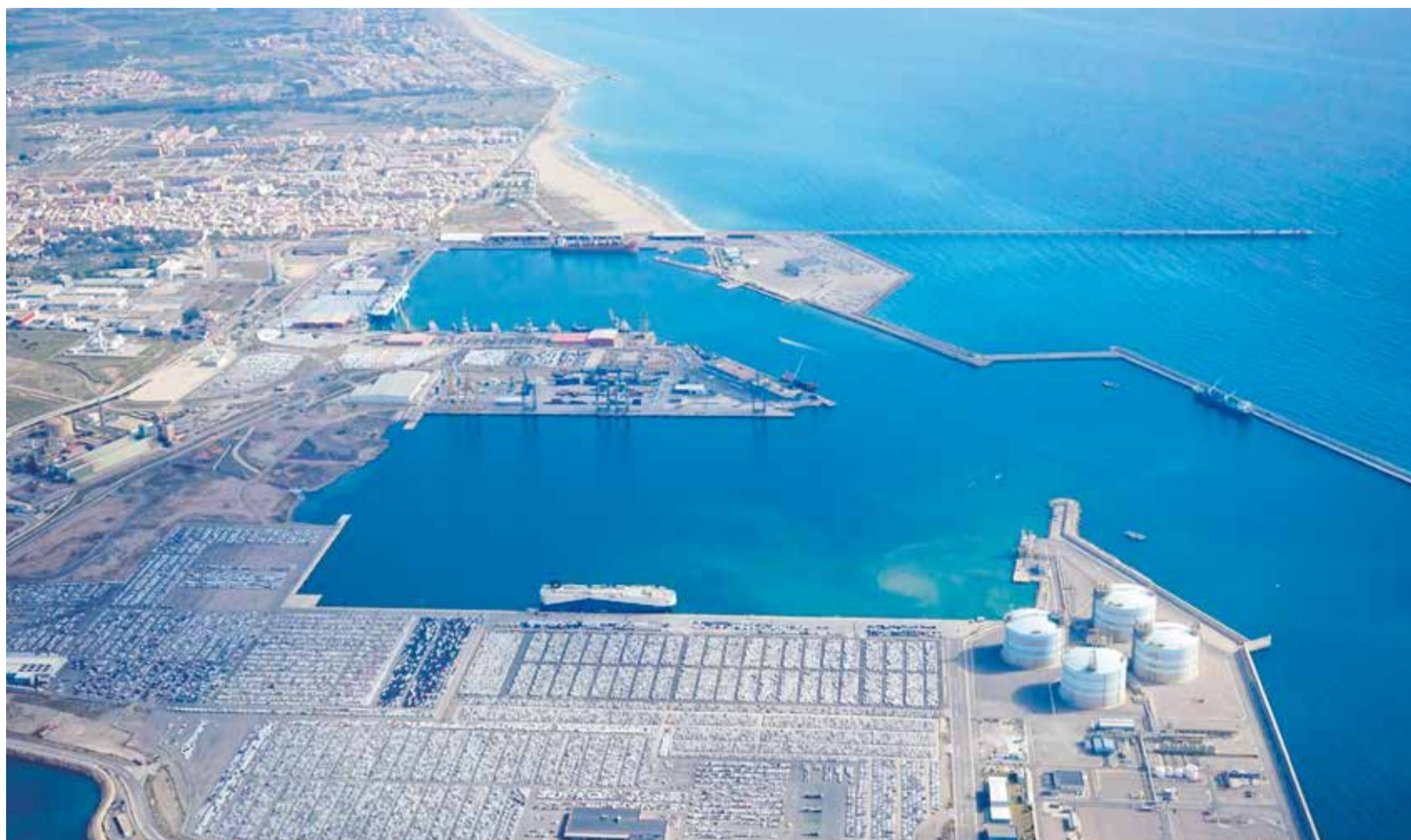
Vista aèria del recinte portuari de Sagunt.

► LA INSTAL·LACIÓ S'UBICARPA EN EL MOLL SUD DEL RECINTE DE SAGUNT I TRANSFORMARÀ RESIDUS EN ENERGIA RENOVABLE