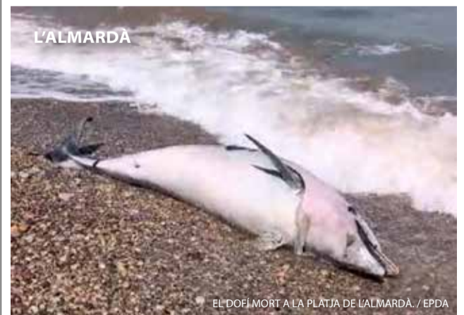
EL DOFI MORT A LA PLATJA DE L'ALMARDÀ.

Trista notícia a la platja de l'Almardà. Un veí va vore fa uns dies flotar alguna cosa a escasos metres del litoral. Va resultar ser un dofí mort. L'avançat de descomposició va impedir fer-li la necropsia que n'haguera esclarit la causa.