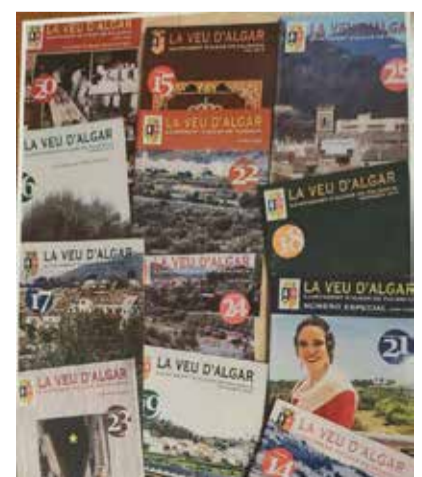
Alguns números de LVdA. / J.C.

Amb tot, voldríem que això no fóra un adéu definitiu i que altres persones, amb noves inquietuds i amb altres alternatives més d'acord amb els temps actuals, decidiren recobrar i fer renàixer esta xicoteta publicació local com ha sigut La Veu d'Algar. Estem convençuts que això valdria la pena.