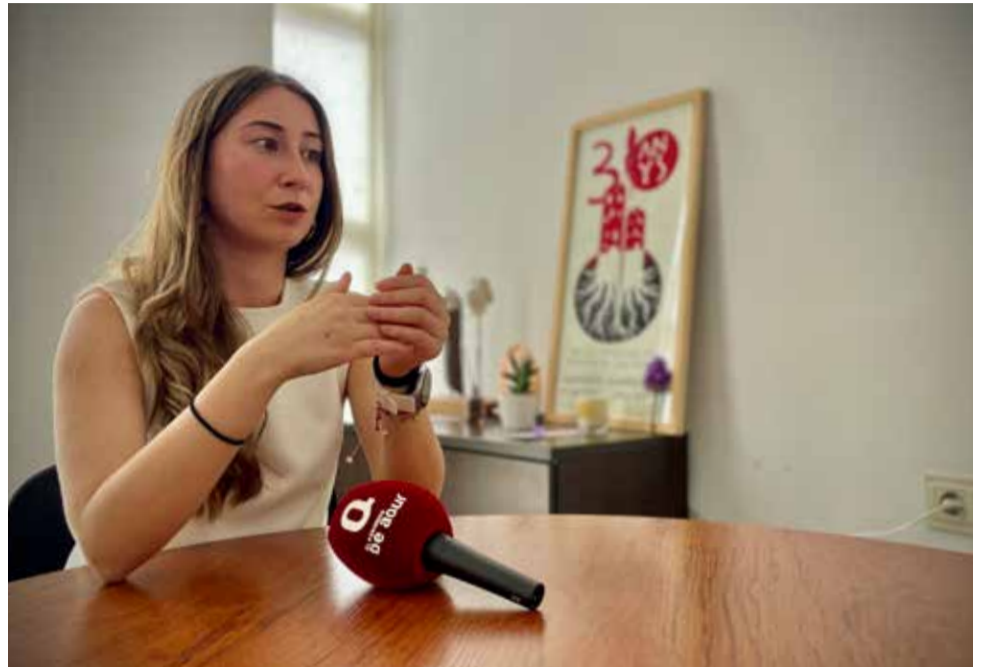
La responsable municipal durant l'entrevista concedida a El Periódico de Aquí.

► La Font de Quart és un altre dels espais emblemàtics