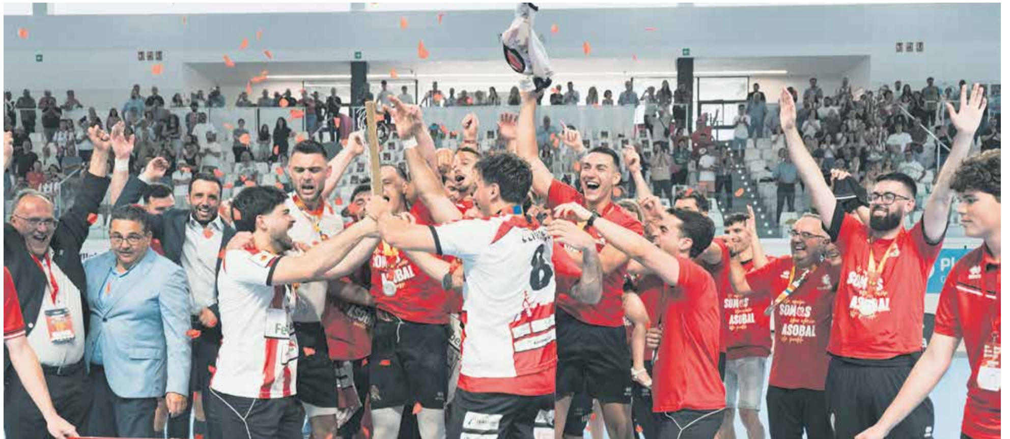
El Feriberia Puerto Sagunto celebra el ascenso a Asobal tras vencer a Agustinos.

▶ EL FERTIBERIA PUERTO SAGUNTO REGRESA A LA MÁXIMA CATEGORÍA DEL BALONMANO ESPAÑOL JUSTO CUANDO CELEBRA TRES CUARTOS DE SIGLO DE HISTORIA