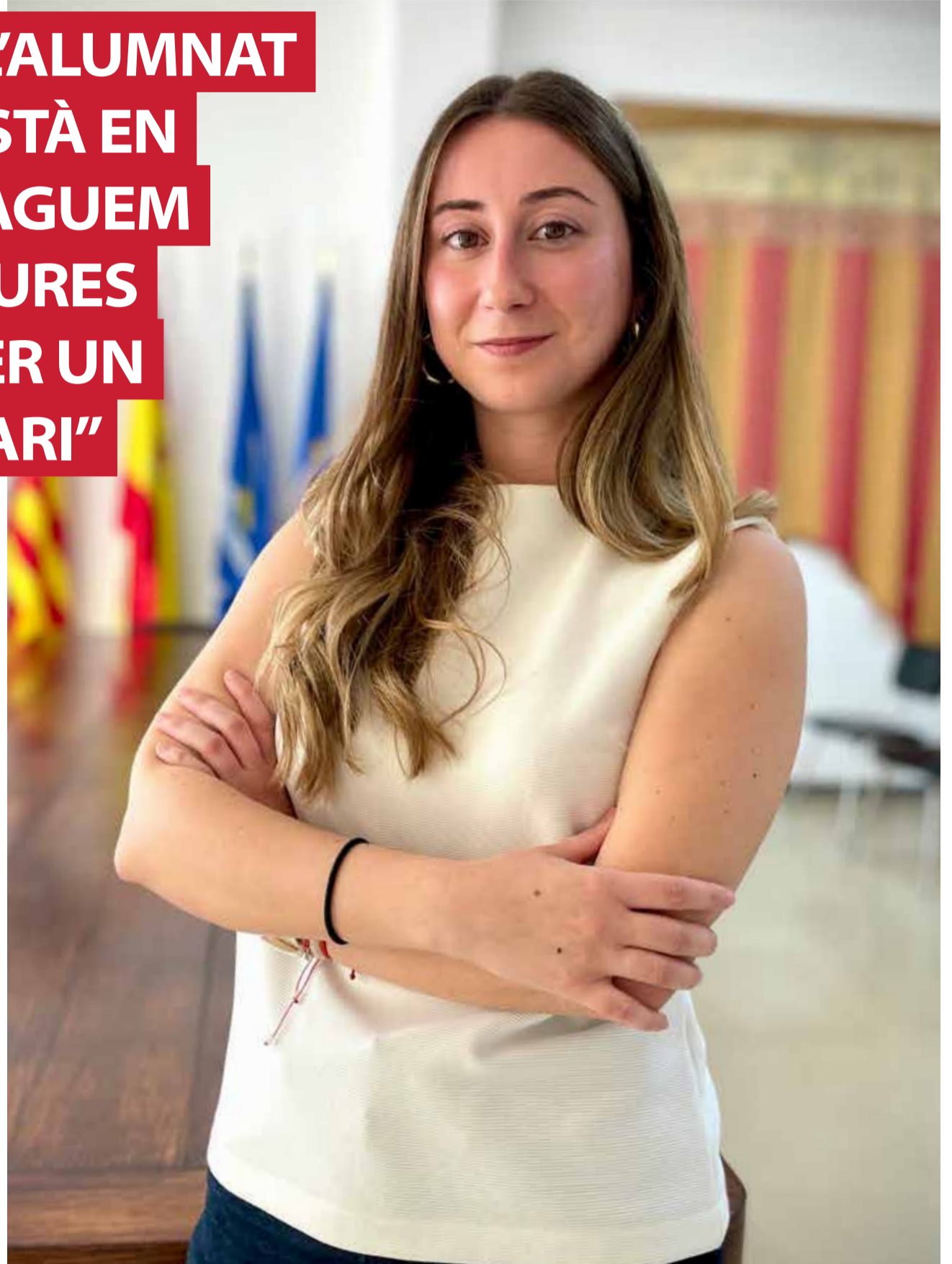
L'alcaldeza de Quart de les Valls, Lara González, en el saló de plens de l'ajuntament.

► Pel que fa a les infraestructures, estem fent millores en molts edificis. Dins del pla d'inversions tenim la reforma de l'auditori municipal, la construcció dels paellers de la Font de Quart, la reno-