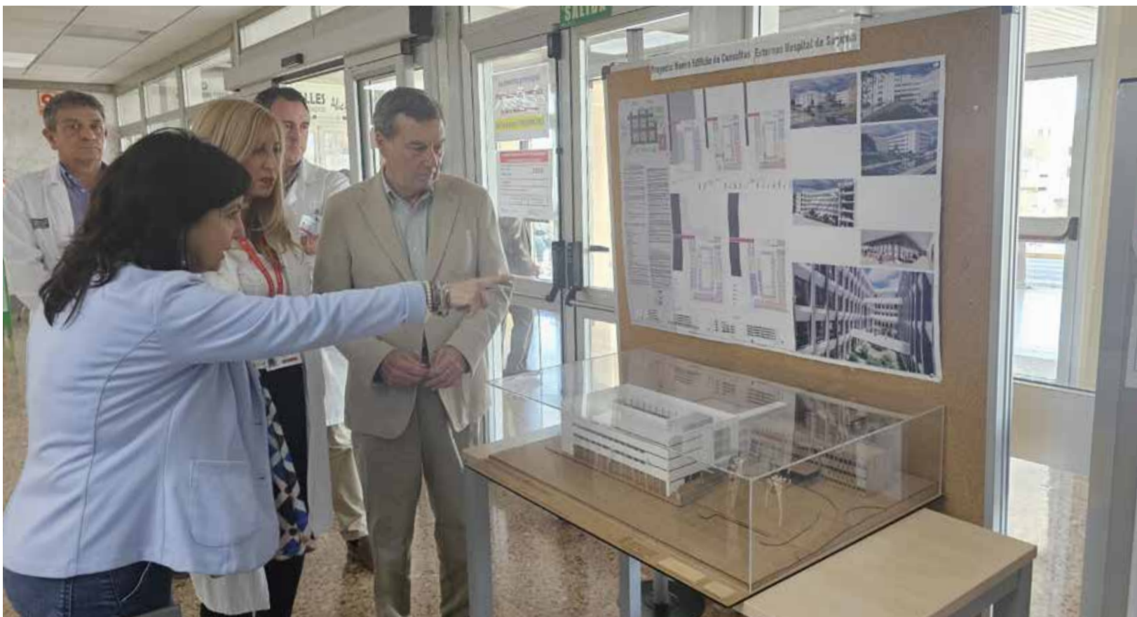
El conseller de Sanitat, Marciano Gómez, observava fa unes setmanes la maqueta d'ampliació de la Mini Fe.

► LES OBRES CONTEMPLEN LA CONSTRUCCIÓ DE LA NOVA UNITAT DE CIRURGIA MAJOR AMBULATORIA PER 6,1 MILIONS D'EUROS