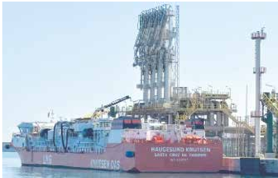
Un vaixell de gas arriba al recent portuari de Sagunt.

Al llarg d'estes dues dècades, la planta ha rebut un total de 1.046 bucs metaners i ha descarregat més de 50,2 milions de tones de gas natural liquat (GNL), una xifra que equival a prop de 766.000 gigawatts hora d'energia. D'esta quantitat, més de 648.000 GWh han sigut injectats a la xarxa de transport, contribuint de manera decisiva a reforçar l'estabilitat del sistema gasista i a garantir el subministrament en moments de major demanda.