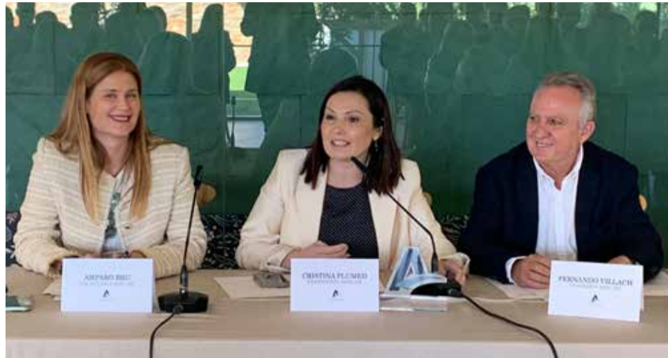
Direcció d'Asecam durant el balanç anual.

La dirigent empresarial va reivindicar a més el paper d'Asecam com a nexa entre les empreses i les administracions en un moment de profunda transformació econòmica. "El que fem des d'Asecam és teixir xarxes i enfortir-les, treballar sempre amb els millors i ser una associació que lidera, acompanya, influïx i connecta", va assenyalar.