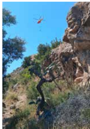
L'helicòpter al castell.

Segons varen traslladar les fonts presents a este mitjà, el cos presentava indicis evidents de deteriorament: "Estava unflat. L'han vist alguns". Este fet va reforçar la hipòtesi que la mort podria haver-se produït uns quants dies abans, cosa que hauria dificultat la seua loca-