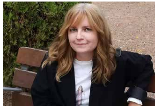
La investigadora, cronista oficial i col·laboradora d'EPDA.

El jurat del Premi Arrels ha destacat la trajectòria de la investigadora de Quart de les Valls per la seua dedicació a la recerca i la divulgació cultural, així com per la seua aportació al coneixement del patrimoni i la memòria col·lectiva del Camp de Morvedre.