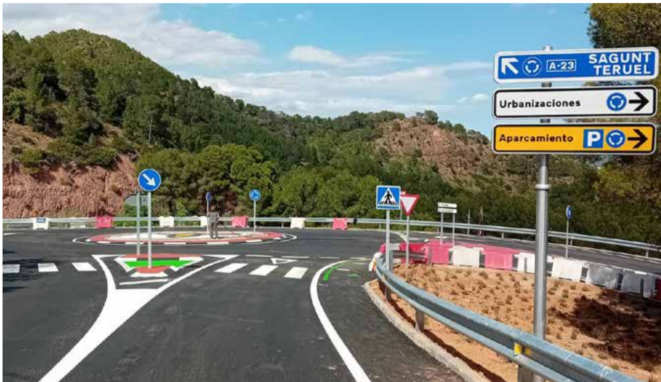
La nova rotonda que permetra la reordenació del trànsit a Segart.