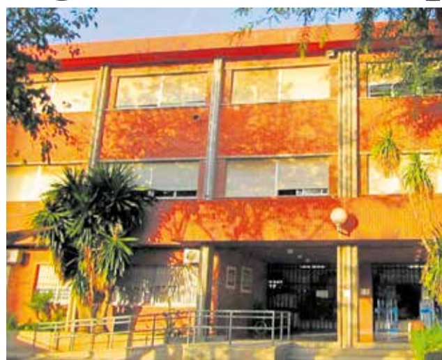
El CEIP Joan Fuster de Manises.

no local conformado por PSPV-PSOE y Compromís, recordando que tardó tres años en remitir a la Generalitat el proyecto del nuevo CEIP Vicente Nicolau. "Tras ese retraso era evidente que el presupuesto inicial necesitaba ser actualizado. Sin embargo, mientras el Ayuntamiento tardó años en actuar, la Conselleria resolvió en apenas dos días la modificación de crédito necesaria, incrementando la inversión en 1.365.201,40 euros", ha señalado la portavoz. A esta cantidad se suman otras dos modificaciones aprobadas durante el pasado mes de