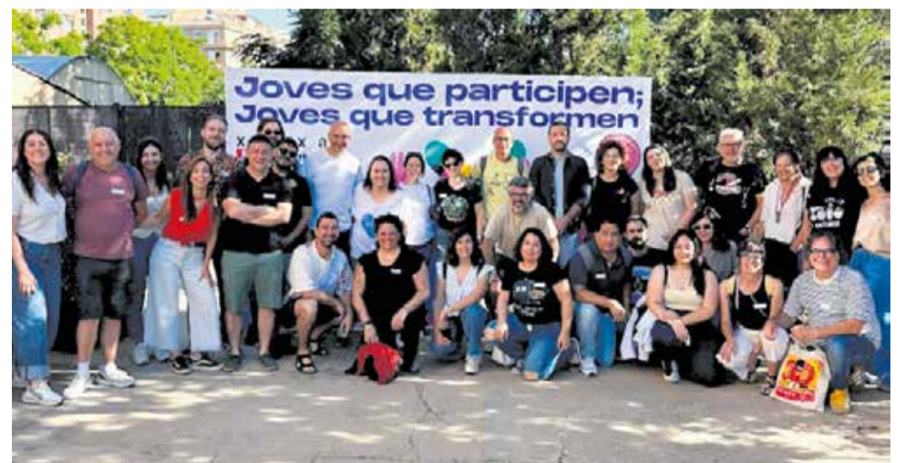
Participants de la 'Jornada Formativa de Professionals de Joventut'.

Així mateix, el president va avançar la voluntat ferm del Consorci de donar continuïtat a aquesta iniciativa mitjançant la convocatòria d'una jornada anual dedica-