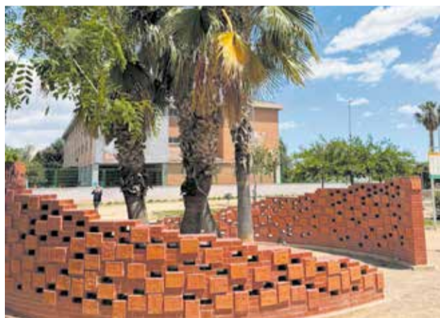
Monument a Benetússer.