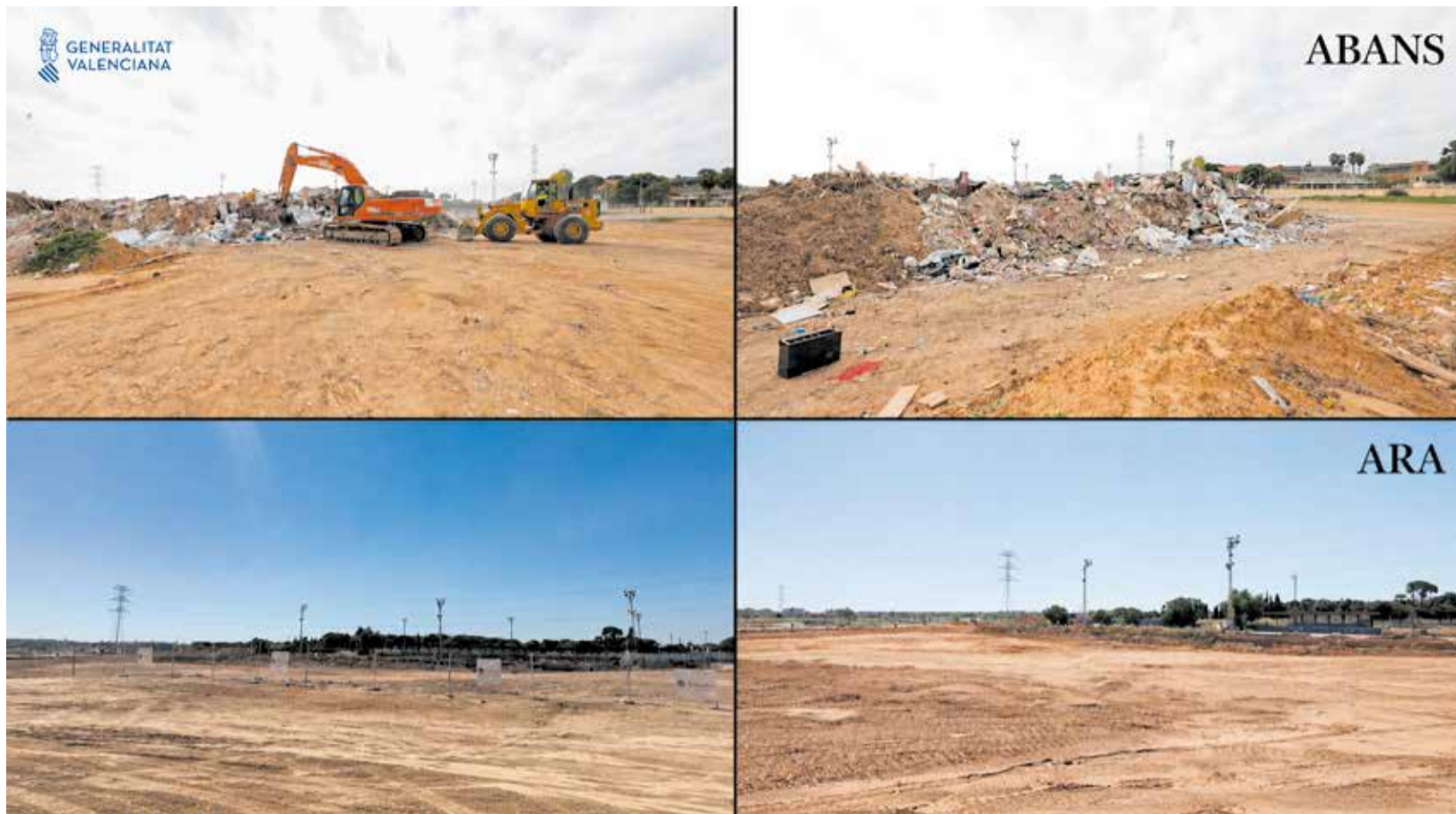
Comparació del punt d'apilament de Paiporta tenint en compte "l'abans i el després" dels treballs de recollida dels enderrocs de la dana.

► ELS ÚLTIMS ESPAIS EN DEIXAR D'ESTAR OPERATIUS HAN SIGUT ELS DE PAIPORTA, ALDAIA, CATARROJA I QUART DE POBLET