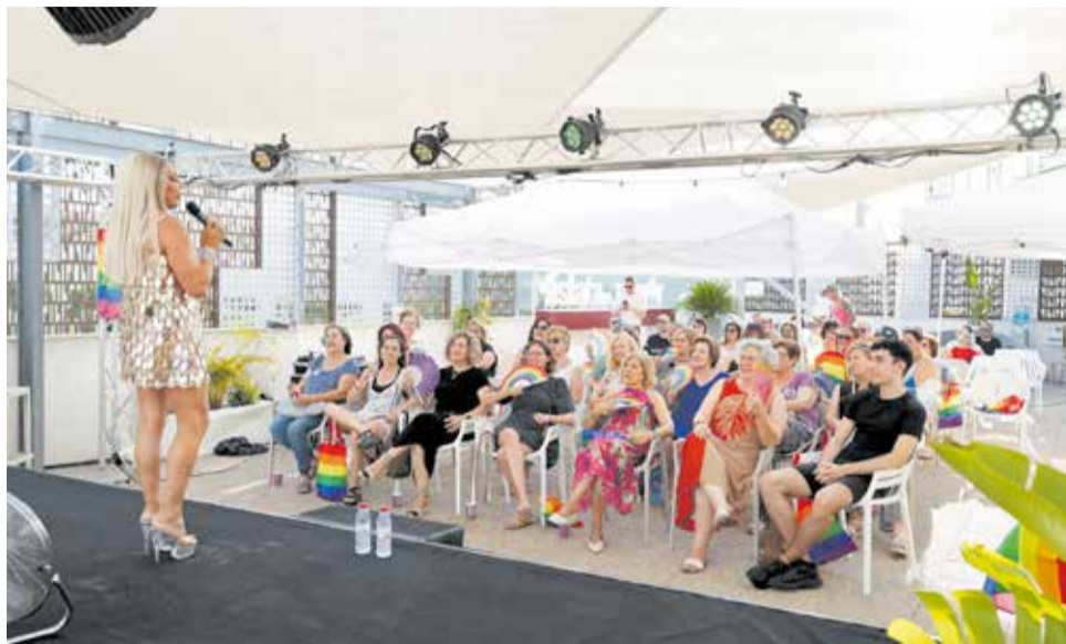
Uno de las actividades celebradas en el Mes del Orgullo de Mislata en 2025.

LECTURA Y MEMORIA La literatura y la memoria histórica tienen un peso fundamental en esta campaña. Del 1 al 30 de junio, la Biblioteca Central de Mislata acoge la iniciativa "Llig amb orgull", habilitando durante todo el mes una sección especial con libros LGTBI+ a disposición de las personas usuarias para su consulta o préstamo.