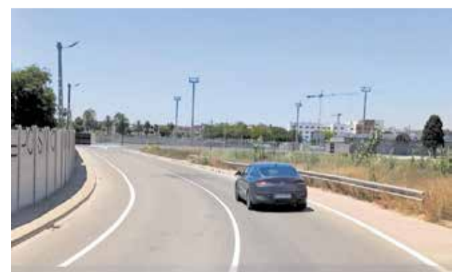
Resultat final de les obres del Camí del Cementeri.

en condicions clares de circulació, s'han dut a terme les tasques de pintura pública i la instal·lació de la nova senyalització viària, tant horitzontal com vertical. Amb la recepció i certificació final de l'obra, el vial ja es troba plenament operatiu per al veïnat de la localitat.