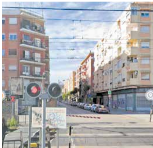
Paso a nivel de Alfafar-Sedaví. / EPDA

¿Por qué la Plataforma por el Soterramiento parece encontrar siempre más obstáculos que interlocutores? ¿Por qué una reivindicación respaldada durante años por ayuntamientos, asociaciones vecinales y miles de ciudadanos continúa teniendo tantas dificultades para acceder a los espacios donde se toman las decisiones?"