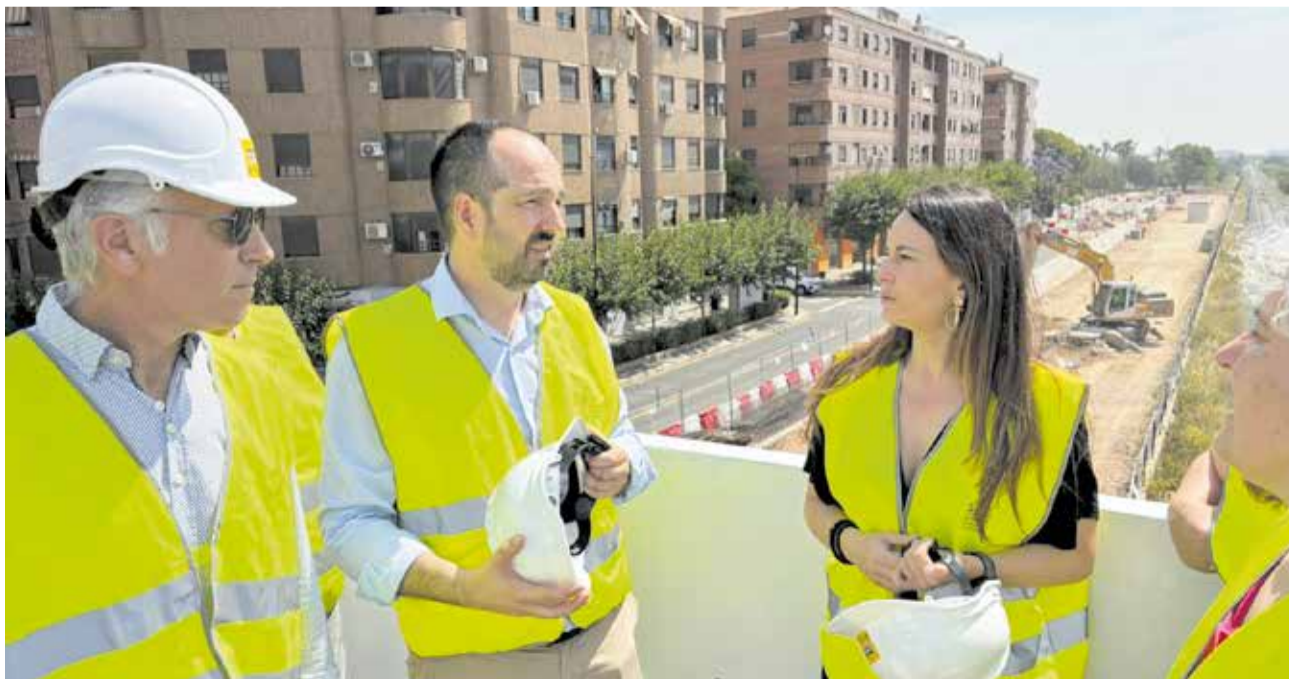
La comissionada per a la Reconstrucció visita les obres del barranc de la Saleta amb l'alcalde d'Aldaia.