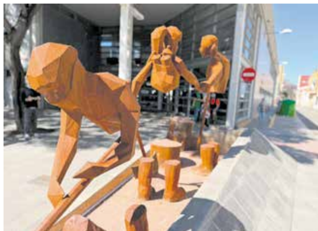
Escultura a Alaquàs.

El pla inclou la creació de noves excursions com la "Ruta d'Homenatge a les Víctimes de la dana i al voluntariat", que recorrerà nombrosos punts en els quals s'han realitzat murals, escultures i altres monuments, impulsats pels ajuntaments, les associacions i el col·lectiu d'artistes. "Unió" de Benetússer, "Gràcies" d'Alaquàs, "Bosc d'Acer" de Torrent o "Revivim" de Paiporta són alguns dels elements creats, mentre que en murals trobem "Orgull de