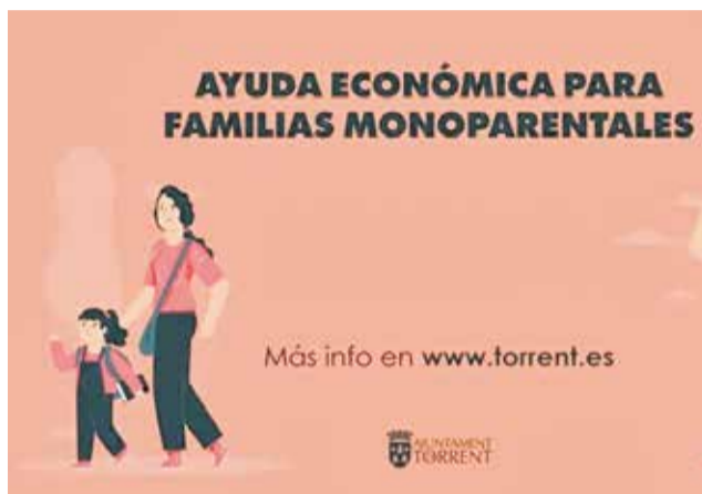
Cartell anunciador de les ajudes en qüestió.

La finalitat del programa es centra de manera exclusiva en el finançament de conceptes domèstics de primera necessitat. Entre les despeses que l'administració municipi-