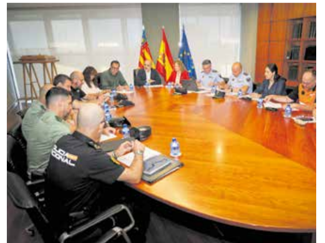
Celebració de la Junta Local de Seguretat de Torrent.

A més, es requerirà la col·locació de limitadors acústics que hauran de ser verificats per un Organisme de Control Autoritzat (OCA) abans de l'obertura de portes. Dins de les possibilitats tècniques, l'Ajuntament ha sol·licitat que els escenaris s'orienten cap a les zones menys poblades per a reduir l'impacte sonor sobre els habitatges.