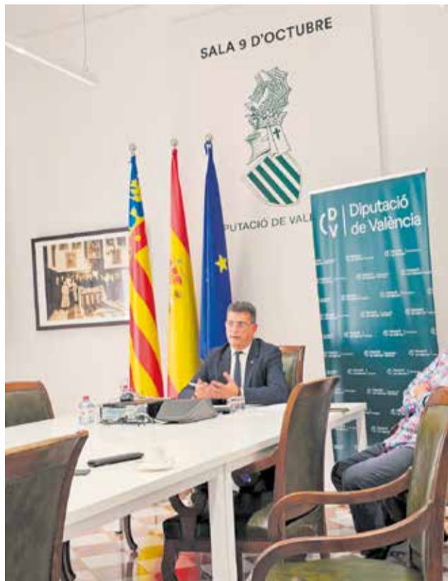
Intervenció de l'alcalde d'Alfatar en el Fòrum Europeu per a la reestructuració territorial celebrat a Moldàvia.

Així mateix, la seua òptima labor de coordinació supramunicipal va ser elogiada pel seu pragmatisme