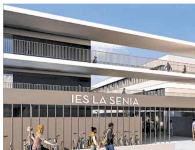
Així quedarà el futur IES La Sénia.

El nou centre tindrà una capacitat estimada per a 1.100 estudiants en unes instal·lacions que sumaran més de nou mil metres quadrats construïts i