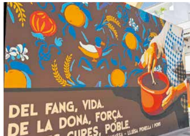
Mural a Massanassa.