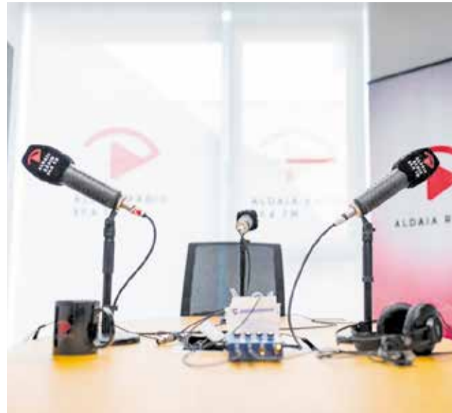
Estudi de l'emissora municipal Aldaia Ràdio.

Després de cinc temporades consecutives en antena, la ràdio local es troba actualment en un dels seus millors moments de forma. Hui en dia, més d'un centenar de veus diferents passen setmanalment pels seus estudis de gravació, una xifra a la qual cal sumar indispensablement la gran quantitat de convidats que aporten riquesa, dinamisme i varietat a cada programa de la graella. La major part d'estos espais