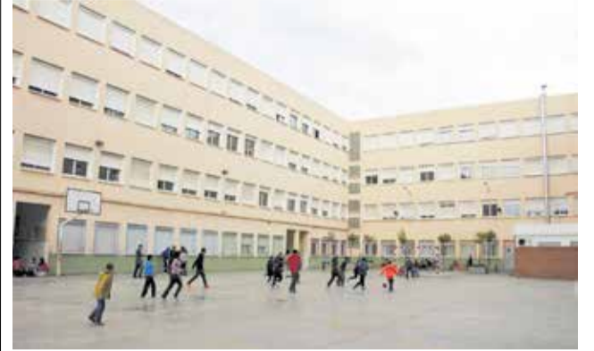
Pati del CEIP Verge del Rosari de Torrent.