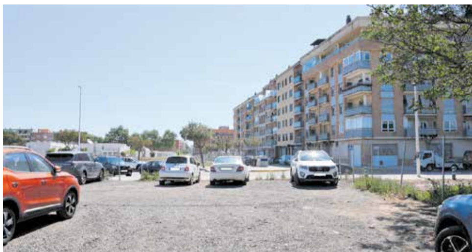
Un del punts d'estacionament alternatiu oferits a Catarroja pel Pla Aparca.