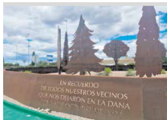
Monument a Torrent.

Poble" de Catarroja, "Fang en mans de dona", de Massanassa o "Gràcies" d'Alfàfar, entre altres creacions.