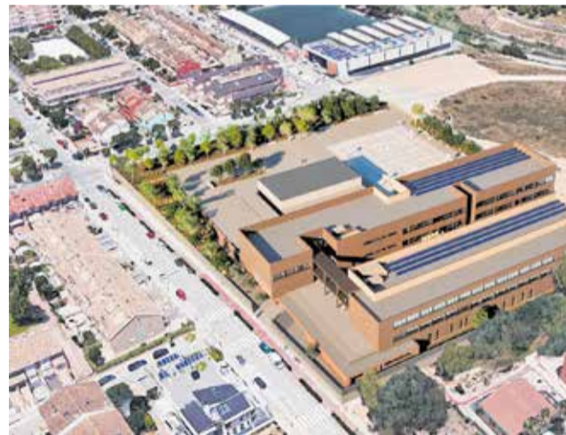
Vista aèria de la maqueta del futur IES La Sénia.

quasi set mil metres quadrats destinats a patis i pistes esportives. Esta gran envergadura permetrà al centre albergar vint unitats d'ESO, sis unitats de Batxillerat i set cicles formatius repartits en catorze unitats, a més de servicis complementaris com una cafeteria per a la comunitat educativa.