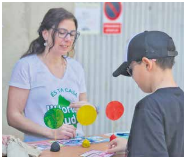
Una educadora ambiental informa un xiquet.

Esta iniciativa es desenvolupa en el marc de les ajudes de la Diputació de València per a la contractació de professionals de l'Educació ambiental. En 2026, l'Horta Sud rep un màxim de 140.000 euros, que han permès incorporar a les dues primeres