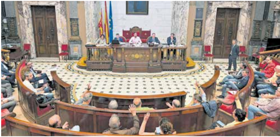
Un pleno celebrado por la EMTRE en el Ayuntamiento de Valencia.