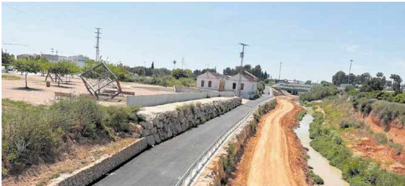
Otro de los puntos por los cuales pasa el barranco de Picassent en el término municipal de Alcàsser.

El objetivo de esta infraestructura es doble: por un lado, funcionará como un dique de contención capaz de retener grandes avenidas de agua en el futuro; por otro, integrará el entorno del barranco en la trama urbana como un espacio sostenible, aumentando drásticamente la protección del núcleo residencial ante lluvias torrenciales.