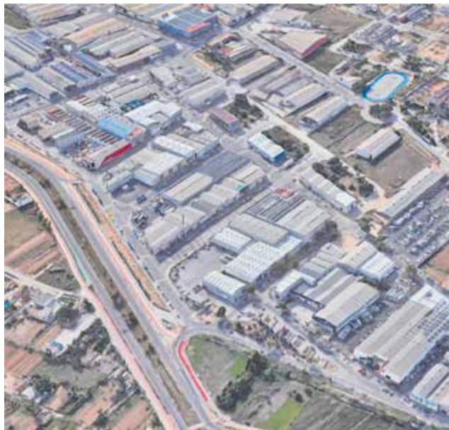
Polígon La Pasqualeta de Paiporta.