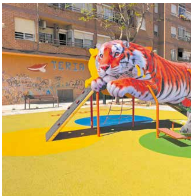
Noves zones de joc infantil implantades al Parc de la Florida després de la seua reconstrucció.

La infraestructura verda de la localitat de l'Horta Sud havia patit greus danys estructurals a conseqüència de la forta barrancada provocada per l'episodi meteorològic del 29 d'octubre de 2024. L'aigua i el fang van colpejar de manera significativa tant a les zones jardineres com a les àrees d'ús infantil i als accessos del recinte, obligant al tancament total de l'espai per motius de seguretat de