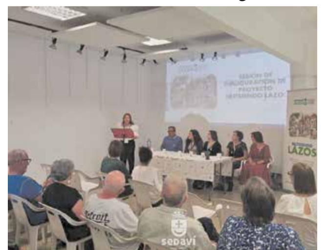
Presentació del programa 'Nutriendo Lazos'.

la gran acollida que ha tingut la iniciativa entre els veïns i veïnes. A partir d'ara, el projecte inclourà sessions relacionades amb els hàbits saludables, la nutrició, l'activació física i cognitiva, així com diversos espais de participació i relació social. Per la seua banda, des de l'Ajuntament de Sedaví s'ha volgut agrair el treball d'Acció contra el Hambre i de totes les entitats i professionals implicats per impulsar un projecte que contribueix de manera clara al benestar i a l'acompanyament dels majors de la localitat.