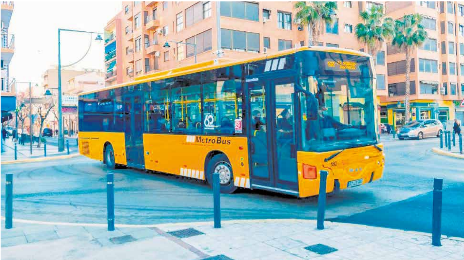
Un dels autobusos coneguts com "gros" que l'ATMV proporciona per a donar servei als pobles de l'àrea metropolitana de València.

► EL CONSISTORI RECLAMA SOLUCIONS BASADES EN LA IGUALTAT TERRITORIAL I L'EQUITAT RESPECTE A ALTRES MUNICIPIS DE LA ZONA