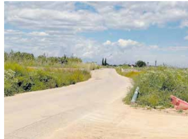
Punto en el que se ubicará el nuevo puente.

Además del factor de seguridad hidráulica, el nuevo puente supondrá una mejora relevante en la conectividad de la comarca. El primer edil ha incidido en el impacto positivo que tendrá en el día a día del municipio: "Nuestro objetivo es claro: resolver problemas y mejorar la calidad de vida de las personas. Este proyecto permitirá que no quedemos incomunicados frente a lluvias intensas", ha concluido Primo Llácer.