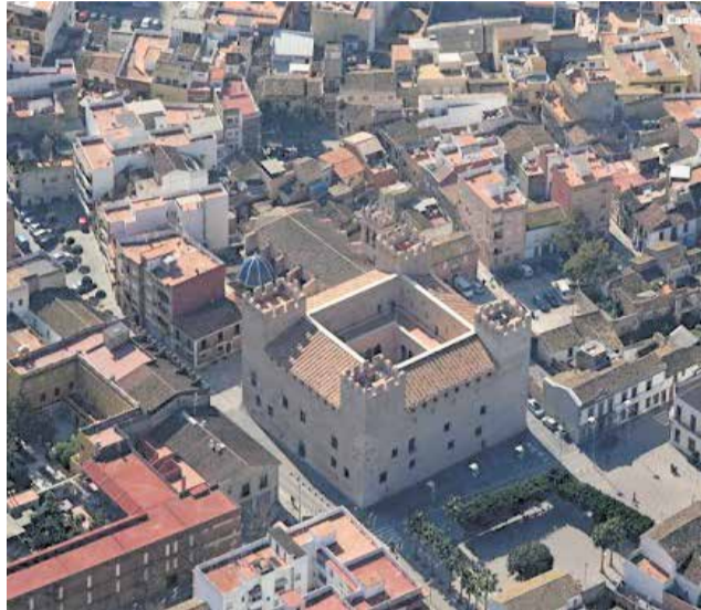
Alaquàs encapçala el rànquing a València.

Més a baix en la classificació se situen Alfafar, amb un 44,57% (82 indicadors); Picassent, amb un 38,04% (70 indicadors); Quart de Poblet, que es queda en un 31,52% (58 indicadors); i Manises, amb un 28,26% (52 indicadors). Tanquen la representació de la comarca al rànquing Xirivella, amb un 21,2% de compliment (39 indicadors); Aldaia, amb un 18,48% (34 indicadors); i Silla, que se situa en el tram final amb un 7,61% de trans-