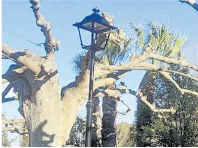
Renovación de alumbrado en la Alameda y N-3.

Por su parte, en la travesía de la N-III se renovarán las luminarias y se elevarán los