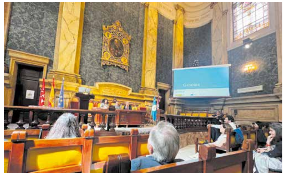
Encuentro de JCUMASRU en Madrid.

Como consecuencia de esta clasificación, el organismo de cuenca ha fijado una dota-