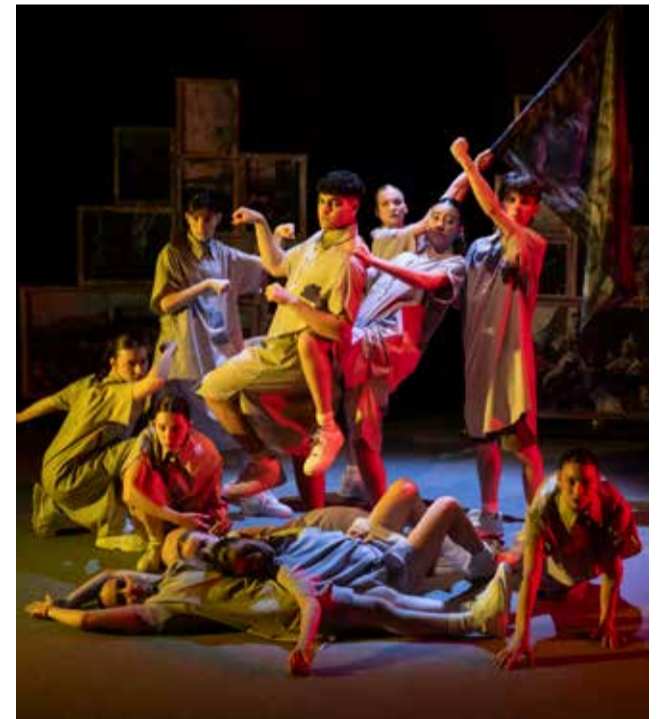
Primera actuación de Escena Erasmus en Utiel.

La buena acogida del público confirmó el interés por este tipo de propuestas culturales y convirtió la visita de Escena Erasmus en una de las citas destacadas de la programación desarrollada en el Teatro Rambal durante esta temporada.