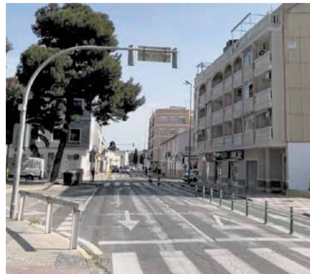
La ronda d'Algemesí on s'actuarà.

El projecte contempla rebaixar el caràcter de carretera d'estes rondes per a donar més protagonisme als vianants mitjançant zones d'estada, ombres amb arbrat i un carril bici segregat connectat a l'estació de tren. A més, es mantindrà el doble sentit i l'aparcament,