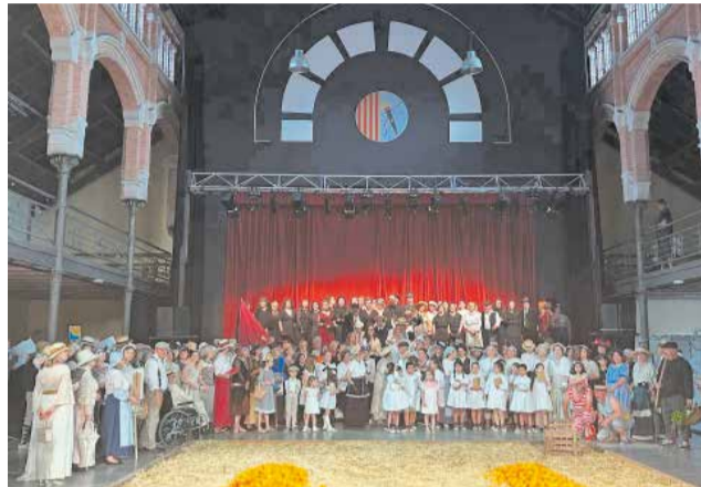
Inauguració de la Fira Modernista al 2025.

A banda del gran ambient festiu i musical que es viurà als carrers, la Fira Modernista oferirà una programació molt rica i variada per a tots els públics. Entre els grans atractius d'aquesta edició destaquen les visites guiades per les cases mo-