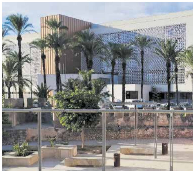
El nou Palau de la Justícia d'Alzira.

L'obertura d'este imponent edifici de més d'11.000 metres quadrats, situat a l'avinguda Luis Suñer, suposarà la fi d'una llarga situació de precarietat i dispersió logística. Actualment, els òrgans judicials de la capital de la Ri-