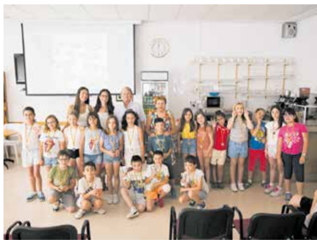
Estudiantes premiados en la undécima edición. / EPDA

Además de la competición, el programa integra el