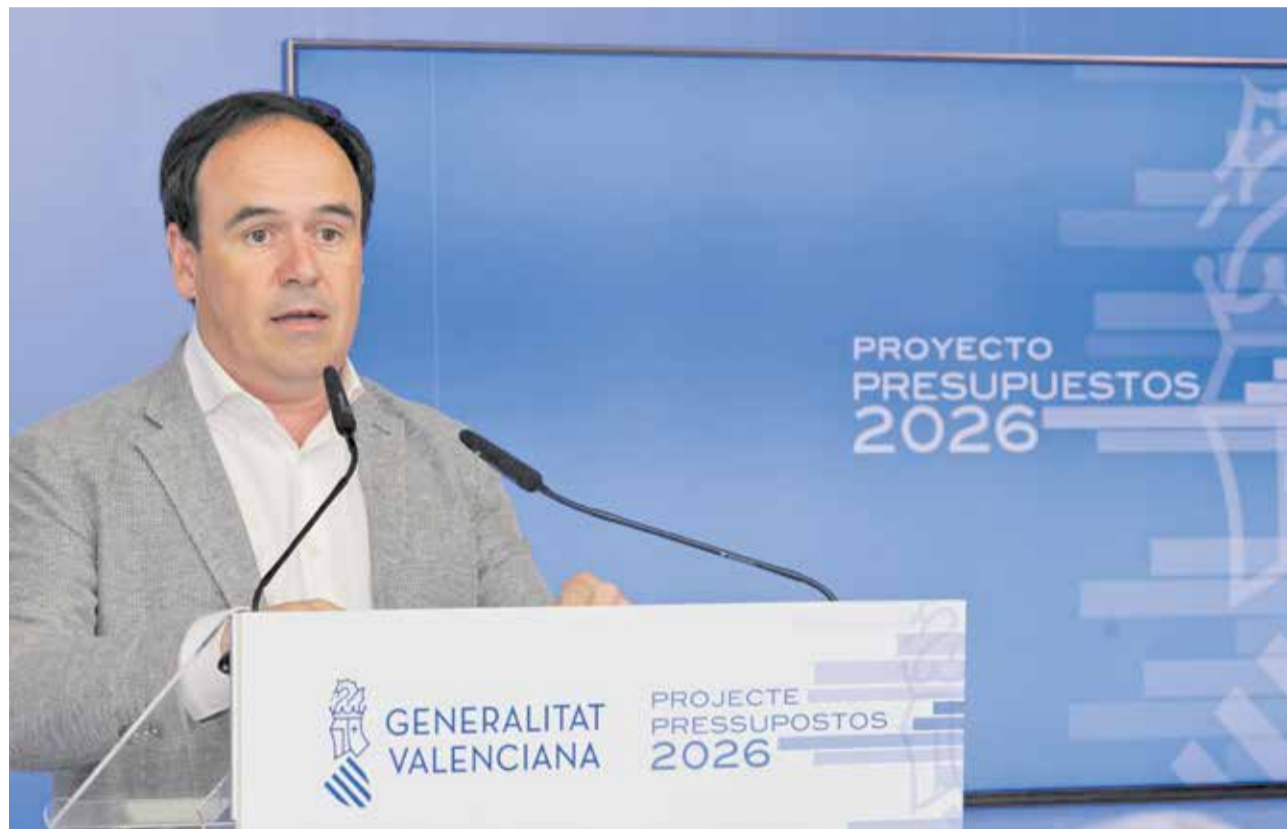
El presidente de la Generalitat Valenciana, Juanfran Pérez Llorca, en la presentación del proyecto.

El grueso de la inversión se concentra en los pilares del estado del bienestar. La Conselleria de Sanidad encabeza el reparto con 9.453 millones de euros (+2,9 %), destinados a reforzar las plantillas, impulsar el nuevo hospital de Ontinyent y acometer ampliaciones clave, como las del Hospital Clínico de Valencia y el de Orihuela, además de la puesta en marcha de centros