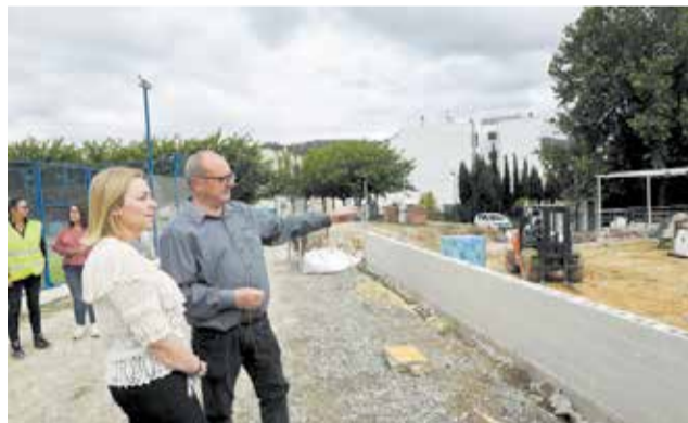
Visita a les obres del nou trinquet.

El nou trinquet compta amb un pressupost pròxim