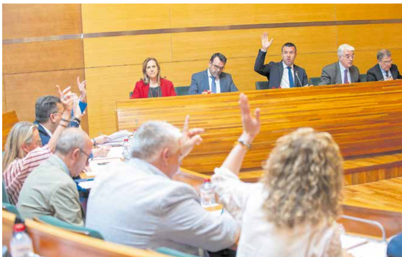
Momento de la votación durante el pleno de mayo de la Diputación de Valencia.

Las ayudas podrán destinarse a la elaboración o actualización de los planes municipales de emergencia, una herramienta especialmente relevante en muni-