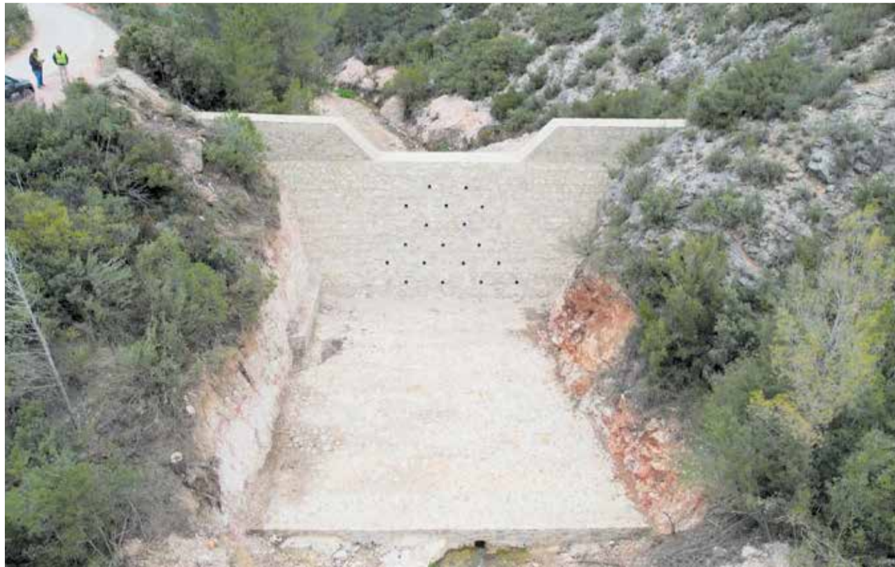
Dique terminado en el Barranco del Agua.

A diferencia de otras intervenciones centradas en la propia presa de Buseo, estas obras se ejecutan aguas arriba del embalse y tienen un carácter eminentemente preventivo. Su objetivo es frenar parte del agua y los sedimentos que descienden por los barrancos durante los episodios de lluvias torrenciales, reduciendo la velocidad de escorrentía y suavizando las avenidas que llegan a los cauces principales.