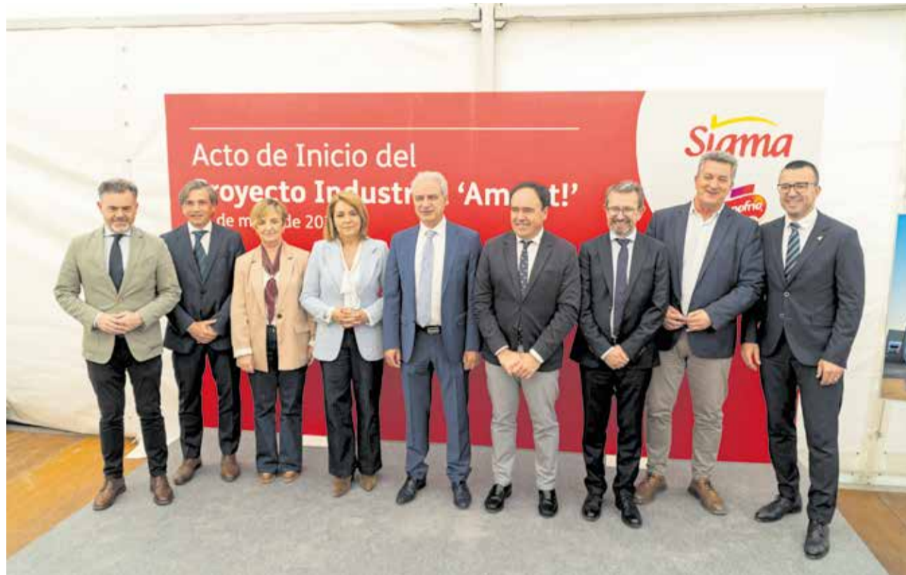
Autoridades y responsables de Campofrío durante el acto que marcó el inicio de las obras.

La elección de Utiel para albergar estas nuevas instalaciones supone un importante respaldo al potencial industrial de la localidad y de toda la comarca. El Parque Empresarial Nuevo Tollo, uno de los principales espacios empresariales del interior valenciano, gana así un nuevo impulso con la llegada de una firma de referencia en