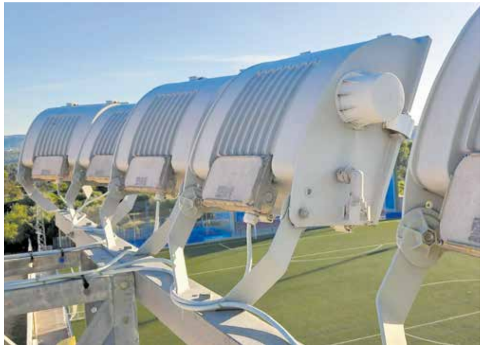
Nueva iluminación en el campo de fútbol municipal de Macastre.

Con esta actuación, el consistorio continúa apostando por la modernización de las instalaciones deportivas municipales y por ofrecer espacios más eficientes y adecuados para la práctica del deporte.