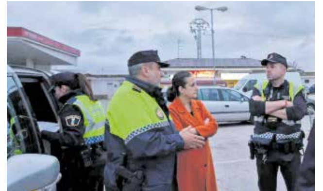
L'alcalde de Carcaixent amb la Policia Local.