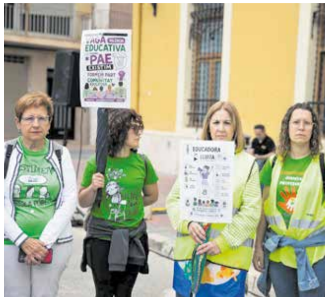
Los municipios de las Comarcas de Interior se movilizan en esta huelga educativa.

En las comarcas del interior, las reivindicaciones también han tenido reflejo. Uno de los apoyos más visibles se ha producido en Cheste, donde el Consejo Escolar Municipal aprobó