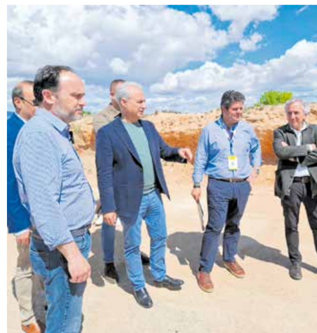
Cierre del punto de residuos en Utiel tras la dana.

Con el cierre del punto de acopio, Utiel da por concluida una de las etapas más visibles del proceso de recuperación tras la dana, aunque las actuaciones para reconstruir infraestructuras y reforzar la resiliencia del municipio continúan en marcha.