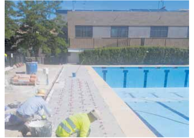
Obras de mejora en la piscina municipal.

El proyecto permitirá restaurar un enclave situado junto al Centro de Interpretación y el Jardín Botánico de El Molón, concebido originalmente para favorecer la regulación hídrica y la mejora ambiental del entorno. Los efectos de la dana provocaron la erosión