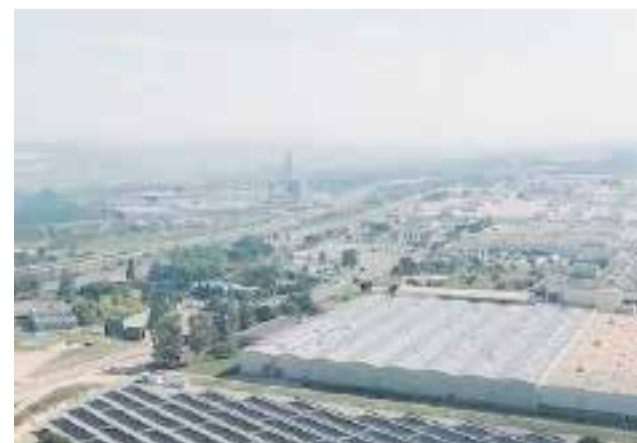
Vista aèria de la planta de Ford Almussafes.

El Clúster d'Automoció i Mobilitat de la Comunitat Valenciana (AVIA) destaca, a més, que l'aposta pels vehicles multienergia genera noves oportunitats de creixement per a la xarxa de proveïdors vinculada a Ford Almussafes.