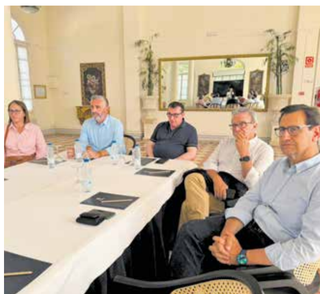
Reunión institucional para afrontar los retos del futuro del Valle de Ayora-Cofrentes.