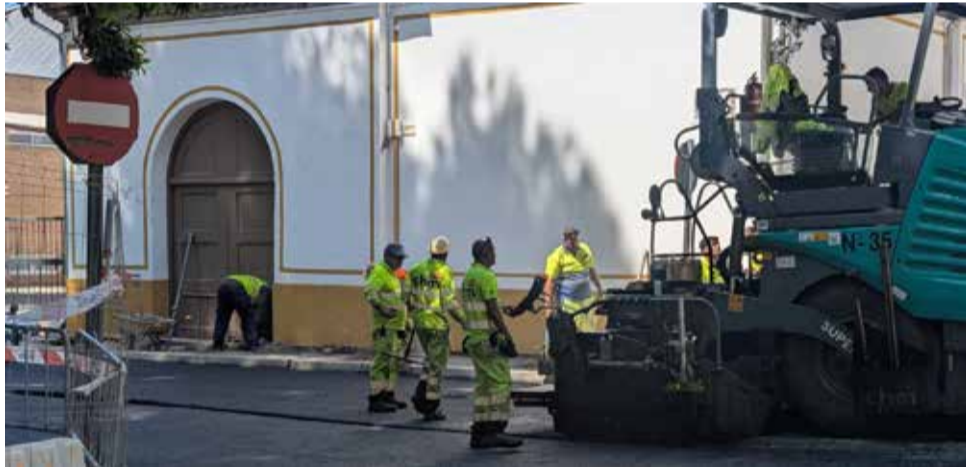
Obras de emergencia para la reparación de la calzada en la Avenida Arrabal.