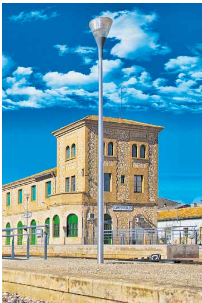
Histórica estación de tren en Camporrobles.

La reapertura completa de la línea pondrá fin a una de las consecuencias más visibles de la dana sobre la movilidad del interior valenciano. El reto será comprobar si las inversiones permiten convertir la C-3 en una línea más moderna, fiable y preparada para el futuro.