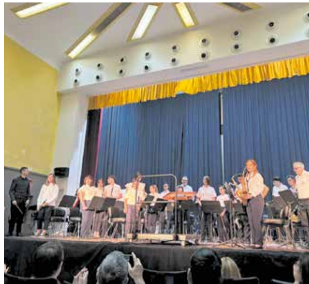
Los jóvenes músicos de Godelleta y Yátova comparten escenario en el intercambio musical.

Desde el Ayuntamiento de Godelleta han destacado que