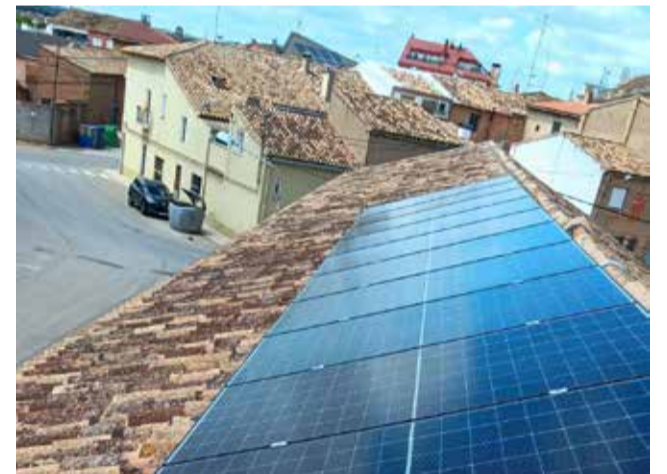
Instalación de placas solares en San Antonio.

Los trabajos han comenzado con las primeras actuaciones técnicas previas necesarias