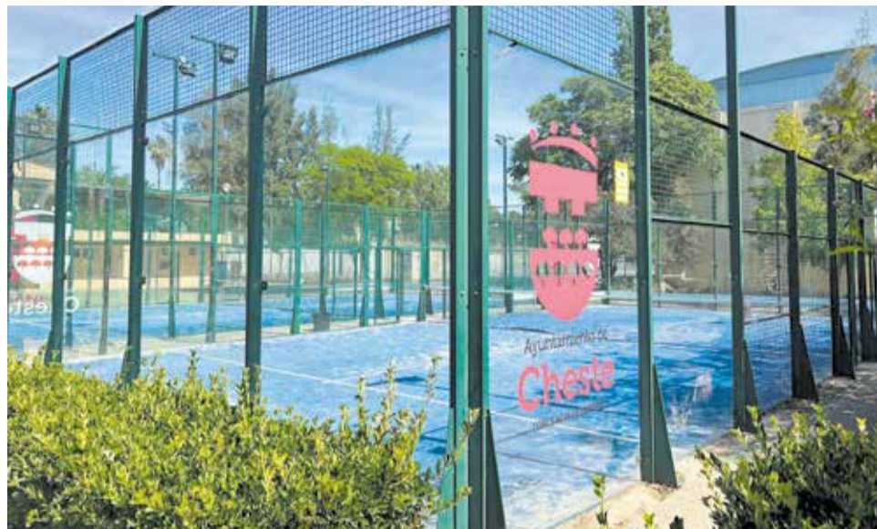
Primera fase de las obras de reparación del polideportivo municipal.

La intervención ha abordado de forma integral los daños provocados por las intensas lluvias en uno de los principales complejos deportivos del municipio. Entre las actuaciones más destacadas figuran la reparación de los vestuarios, la mejora de las pistas de pádel y la impermeabilización de las cubiertas del frontón y del pabellón deportivo,