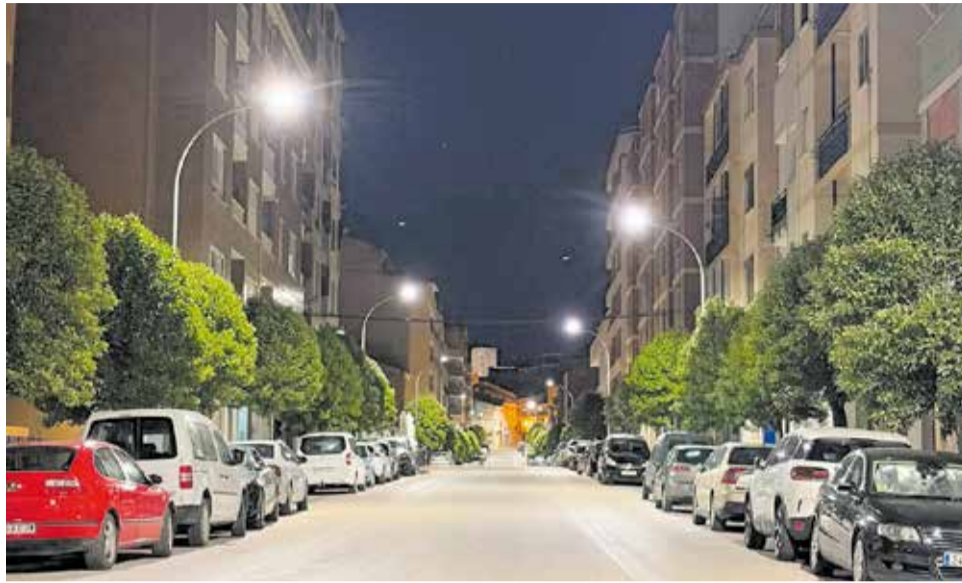
Nueva iluminación en la Avenida Valencia.

En los últimos meses ya se ha llevado a cabo la renovación de la iluminación en puntos como la Avenida Lamo de Espinosa, Avenida de la Estación, la Calle Albacete y la Avenida Arrabal, que cuentan ya con un nuevo sistema más eficiente y adaptado a las necesidades actuales. A estas actuaciones