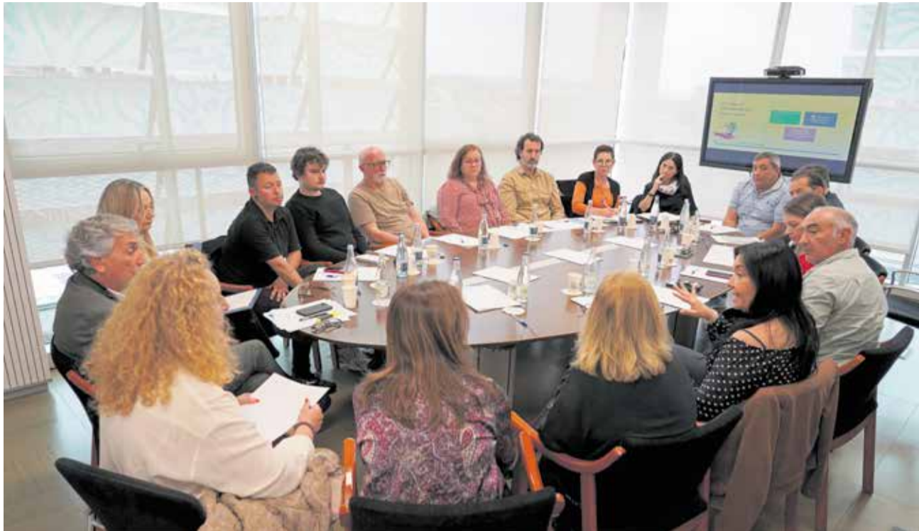
Primera Taula Permanent de Treball que la Generalitat ha mantingut amb les associacions de víctimes.