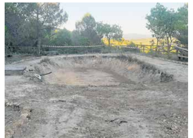
Obras de recuperación del estanque.

La piscina municipal constituye cada año uno de los principales puntos de encuentro y ocio de la localidad durante la época estival, especialmente para familias y jóvenes. Por ello, desde el consistorio se ha apostado por realizar estas mejoras antes de la apertura de la temporada para que los usuarios puedan disfrutar de unas instalaciones en las mejores condiciones posibles.