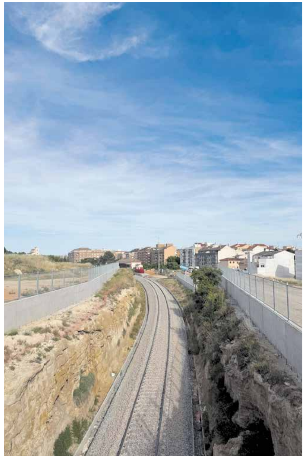
Llegada a la estación de Requena por Utiel, actualmente arreglada.

Las obras afectan a un tramo de aproximadamente 45,6 kilómetros y forman parte de un proyecto mucho más amplio que no solo busca reparar los daños provocados por la dana, sino modernizar integralmente una línea históricamente li-