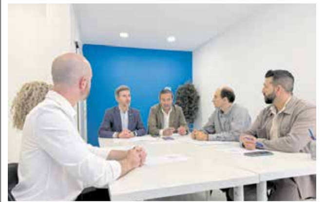
Visita del síndic popular a Gandia.