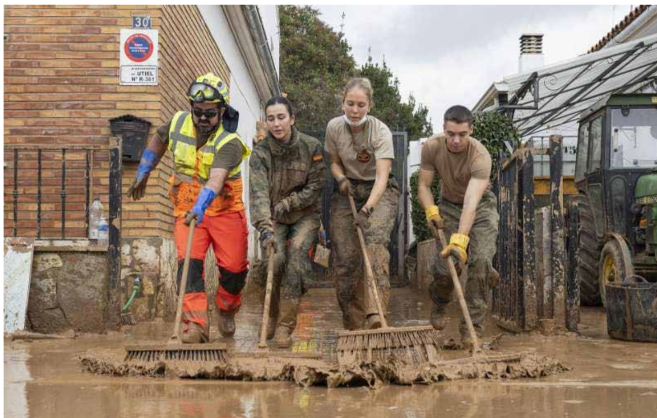
Miembros del Ejército limpian las calles tras el paso de la dana en Utiel.

La resolución judicial pretende aclarar qué comunicaciones llegaron a los ayuntamientos y en qué momento fueron recibidas. Para ello, los consistorios deberán certificar oficialmente los avisos procedentes del Centro de Coordinación de Emergencias relacionados