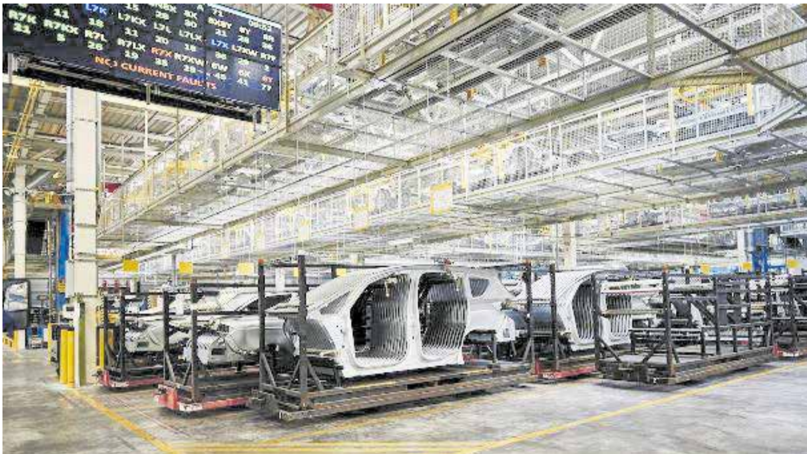
Interior de la planta de Ford Almussafes.

► LA FACTORIA VALENCIANA FABRICARÀ DES DE 2028 UN SUV MULTIENERGIA EN PLENA NEGOCIACIÓ SOBRE LA NOVA ETAPA