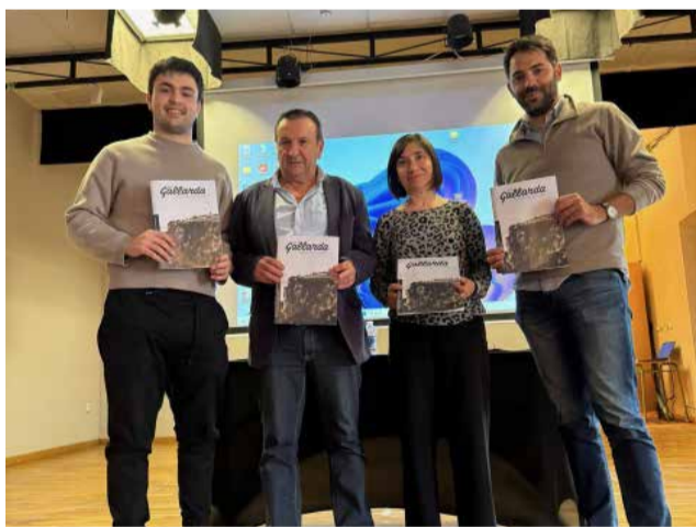
Presentación de “Desde la Gallarda”.

La iniciativa surge gracias al trabajo desinteresado de un grupo de vecinos y vecinas que han querido impulsar un proyecto destinado a dar visibilidad al patrimonio cultural, las tradiciones, la historia y las inquietudes de la localidad. Sus promotores defienden la cultura como un patrimonio compartido que debe conservarse y adaptarse a los nuevos tiempos sin perder sus raíces.