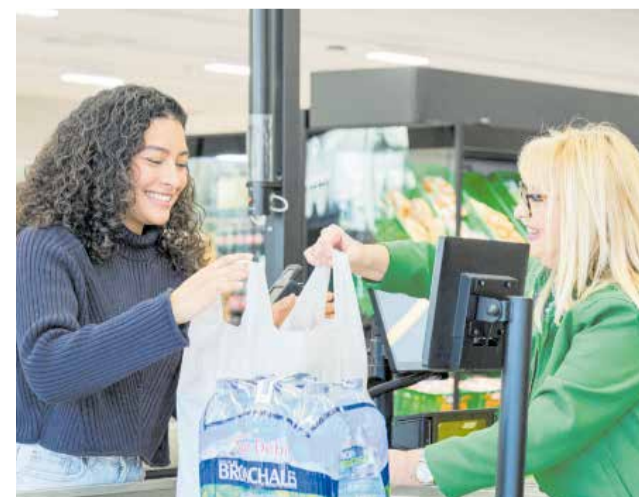
Una cliente y una trabajadora en Mercadona.

gas CO 2 y tecnología Aerofoil, que mantienen la temperatura óptima sin necesidad de puertas y reducen significativamente el impacto ambiental. Además, el uso de herramientas digitales colaborativas facilita la autogestión y la toma de decisiones por parte de los equipos de trabajo, consolidando un modelo de tienda más productivo, sostenible y eficiente.