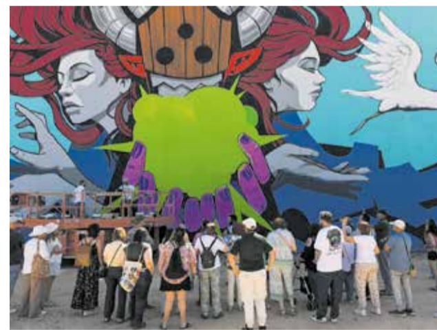
Uno de los murales en el municipio de Cheste.

El acto de clausura contó con la actuación de Dómisol