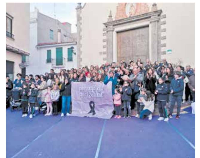
Concentración por una Semana Santa inclusiva en marzo.