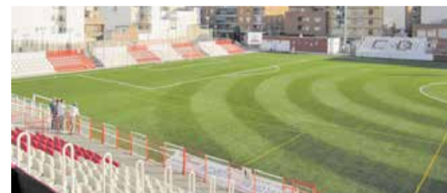
El campo de fútbol del Fornás.

Con todo, el Pleno mantiene su apoyo político al futuro estadio, pero con la condición de que se ejecute por fases y sin mermar en ningún caso las partidas económicas destinadas al resto de infraestructuras deportivas de los núcleos urbanos. Según IP, la adaptación de los estadios actuales es prioritaria frente a un gasto que consideraban desproporcionado.