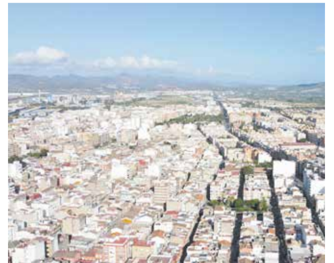
Vista aèria del Port de Sagunt.

Així mateix, CCOO ha anunciat l'inici d'una campanya de mobilitzacions, concentracions i accions reivindicatives que s'intensificaran si no es garantixen condicions de treball segures. “No pararem fins que les treballadores puguem desenvolupar la seua faena en condicions segures”, han subratllat els responsables sindicals, els quals reclamen una resposta immediata de la direcció del centre i de les administracions competents.