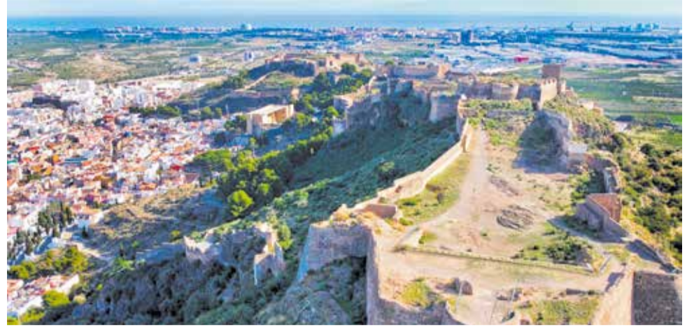
Vista del Castell de Sagunt.