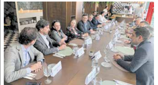
Reunió empresarial en la comarca.

També reclamaren una millora de les infraestructures de transport i mobilitat que facilite les connexions tant internes com amb l'àrea metropolitana de València, així com una aposta decidida per la formació professional especialitzada. En este sentit, es va insistir en la importància d'adaptar l'oferta educativa a les necessitats reals de la nova indústria per a disposar de personal qualificat.