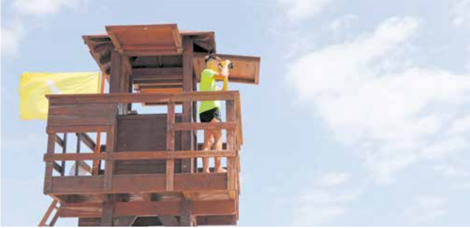
Una torre de vigilància amb un socorrista a Sagunt.