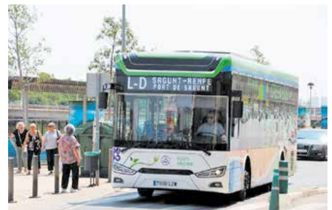
Un autobús a Sagunt.

A) i 53,00 euros (zona AB), un import que es reduïx a 29,75 i 45,05 euros per als usuaris amb Carnet Jove. A més, els bitllets turístics SUMA T1, T2 i T3 (de 24, 48 i 72 hores) variaran entre els 4,00 i els 9,70 euros. Finalment, es manté la gratuïtat per als menors de 8 anys i el títol SUMA Violeta per a col·lectius vulnerables d'Igualtat.