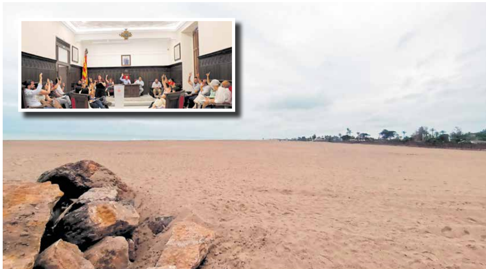
L'estat actual de la platja de la Malva-rosa després de les actuacions de regeneració i votació de la iniciativa en el ple municipal.

► LA PROPOSTA DEL PP PLANTEJA INSTAL·LAR UN SISTEMA DE SENSORS MARINS PER OBTINDRE DADES EN TEMPS REAL SOBRE L'EVOLUCIÓ DE LA COSTA