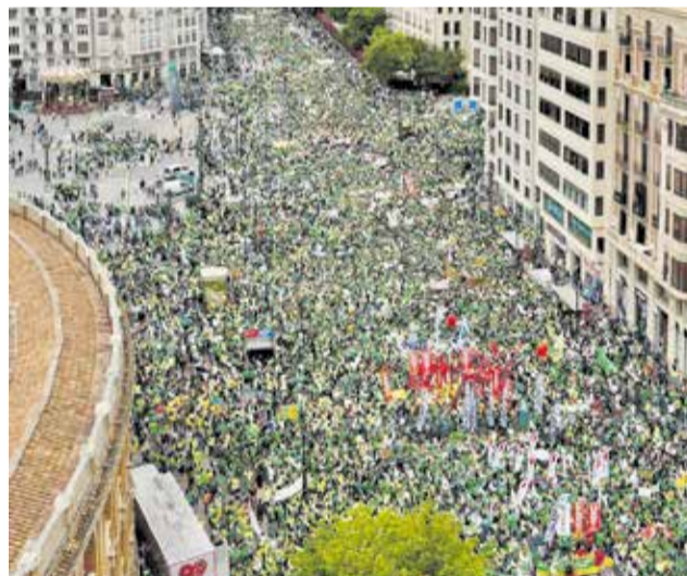
Una multitudinaria manifestación en Valencia.

la mesa y anunciaron un encierro dentro del edificio. Fuera, centenares de docentes permanecían concentrados exigiendo un acuerdo. La escena fue escalando. Se produjo uno de los episodios más polémicos de toda la huelga.