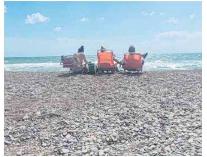
Piedras en la playa del Racó de Mar de Canet.