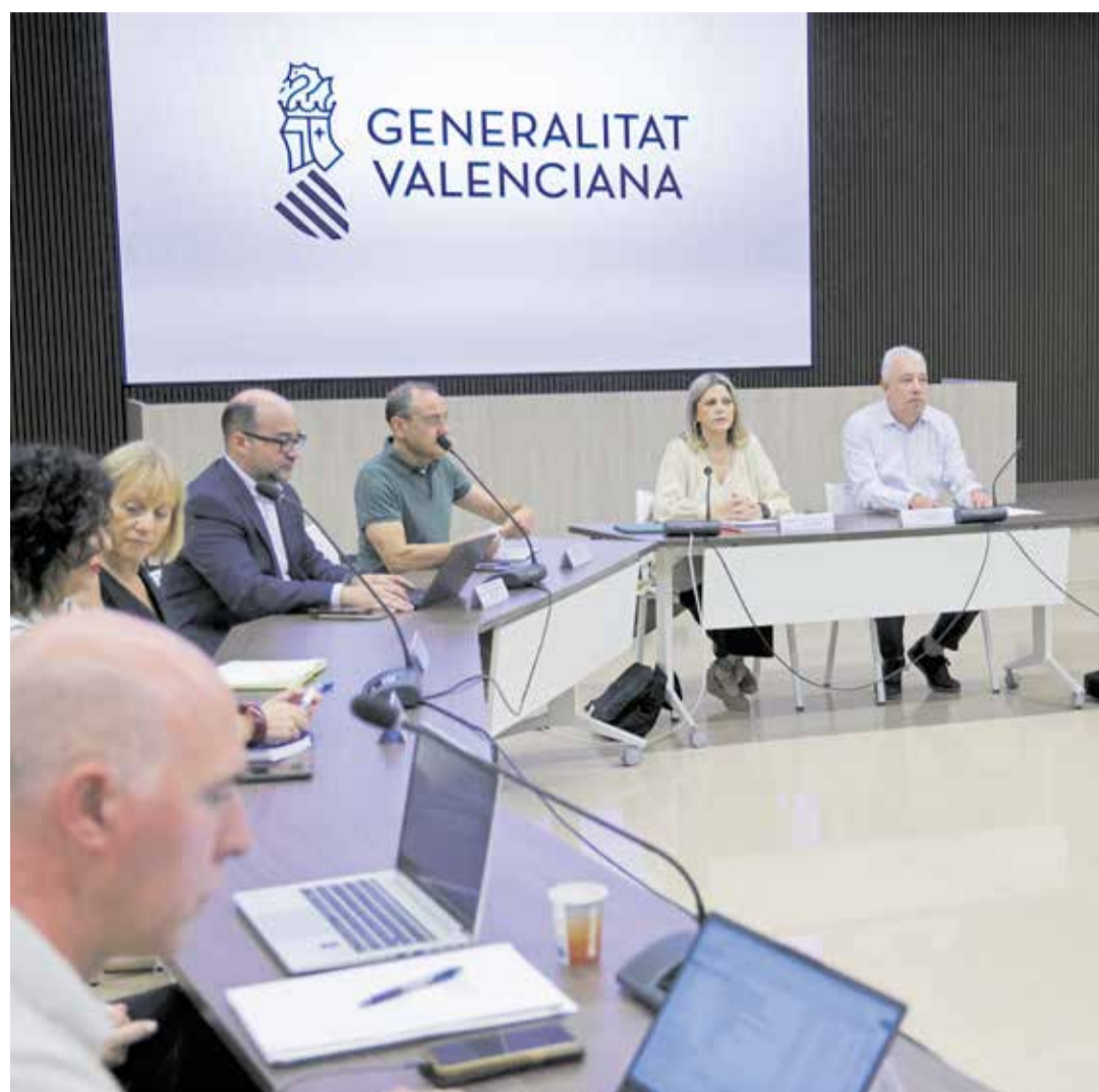
Una reunión entre la Conselleria de Educación y los sindicatos.

Aunque el conflicto ya venía acumulando tensión desde hacía semanas, muchos participantes sitúan el domingo 31 de mayo como el verdadero punto de inflexión. Aquella tarde, sindicatos y Conselleria volvieron a sentarse para intentar desbloquear una negociación que parecía encallada. De nuevo, propuestas sobre la mesa; y de nuevo, posiciones muy alejadas. Finalmente, la Conselleria decidió dar por concluida la reunión. Sin embargo, los representantes de STEPV, UGT y CCOO se negaron a abandonar