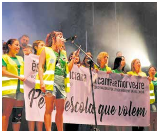
Discurso por la educación pública en el Fescamp.

Las calles del Port de Sagunt han sido escenario de varias