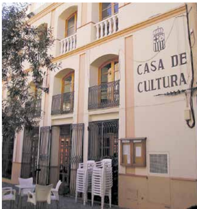
La Casa de la Cultura i el bar de la plaça de Quartell.

Tot va començar amb una denúncia del Partit Popular de la localitat, que alertava que les bases de la subvenció obliguen a col·locar un cartell informatiu durant tota l'execució de l'obra i, en actuacions de més de 200.000 euros, a informar la ciutadania mitjançant un fullet al començament dels treballs.