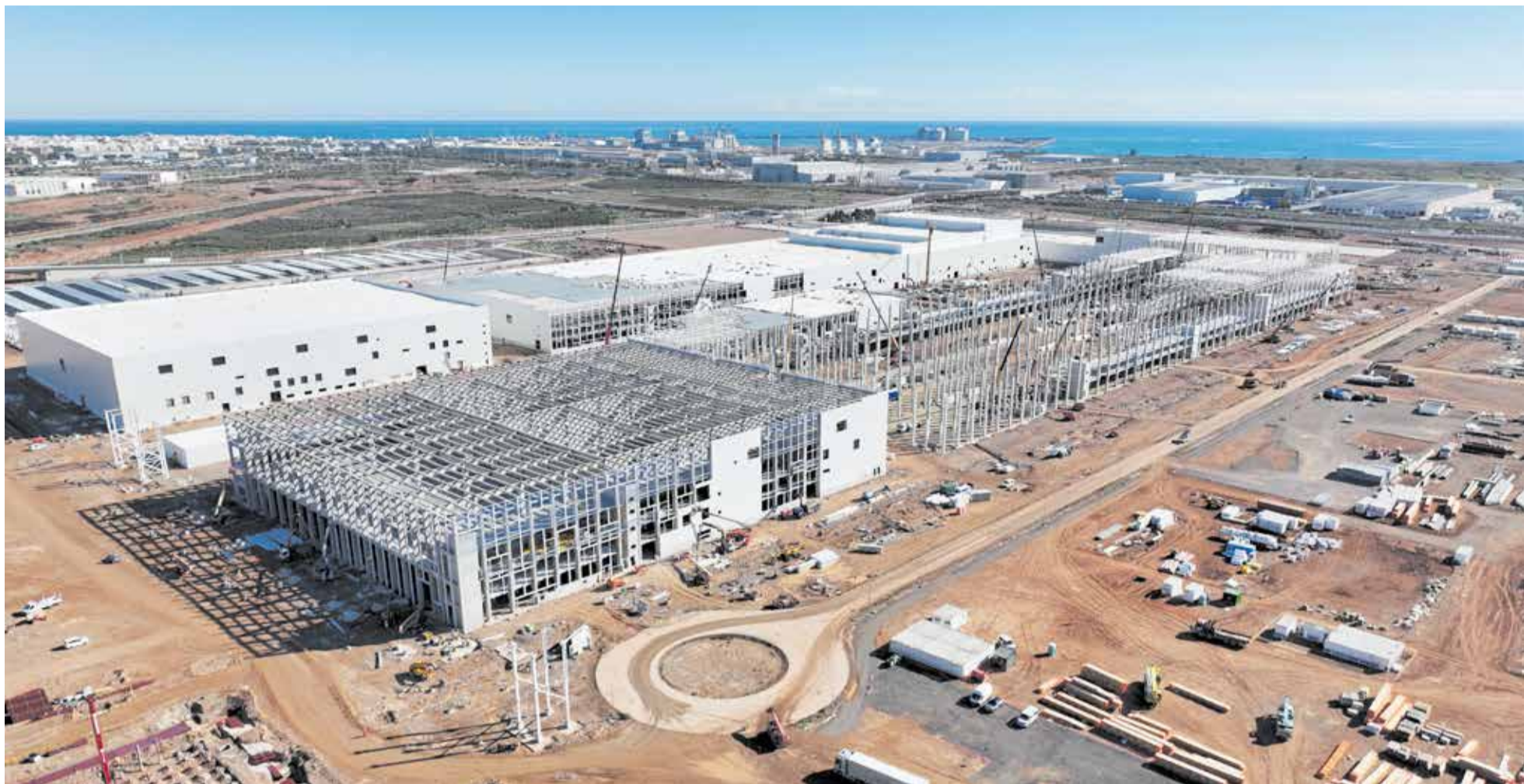
Vista aérea de las obras de la gigafactoría que PowerCo construye en Sagunt y cuya inversión atrae una batería de proyectos para la capital del Camp de Morvedre.