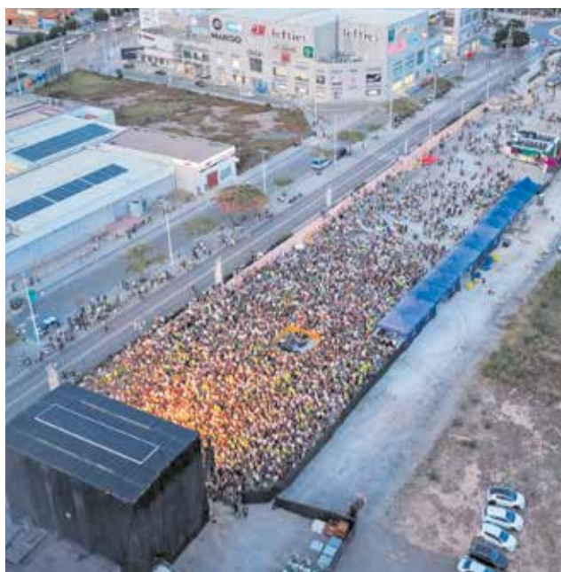
Diversos instantes de la celebración del FesCamp 2026 junto al Centro Comercial Lepicentre.

Sin embargo, lo que más ha picado ha sido el coste del evento. La publicación de los contratos en la sede electrónica del Ayuntamiento de Sagunt ha situado el gasto total del festival en 99.645 euros, una cantidad que alcanza los 120.570,45 euros una vez aplicado el IVA.