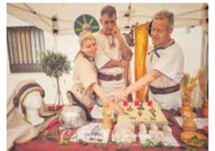
Diversos instants de la I Trobada de Cultures Antiques a Quart de les Valls.