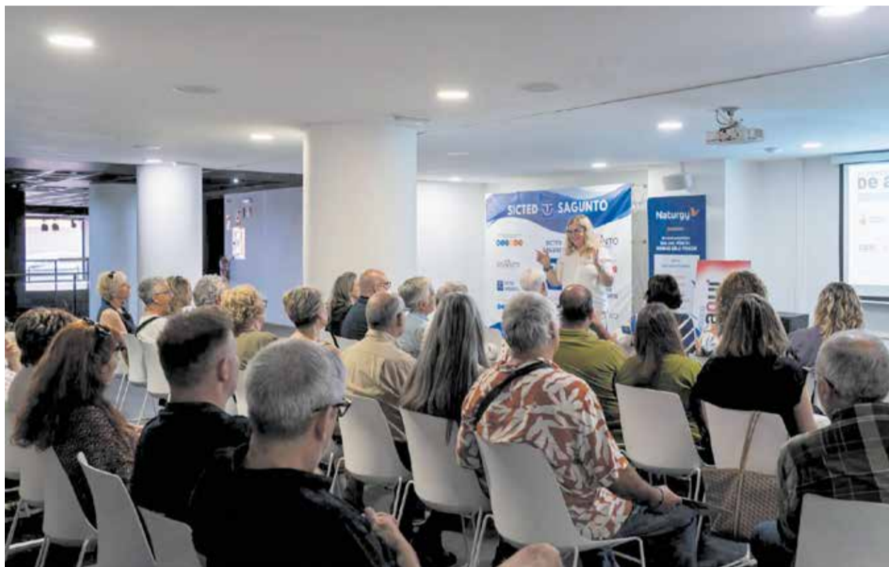
Una de les intervencions en la sala de conferències de l'espai arqueològic Via del Pòrtic, a Sagunt.

La presentació també va posar en valor l'altíssim potencial nat de què gaudix esta comarca, subratllant que és un privilegi comptar amb un patrimoni i uns recursos d'este nivell, que han de saber-se aprofitar i coordinar de manera con-