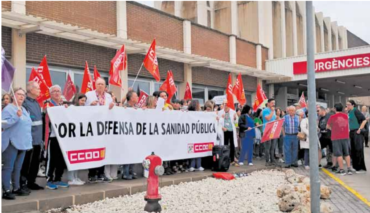
Una protesta fa uns dies a les portes d'Urgències de l'Hospital de Sagunt.