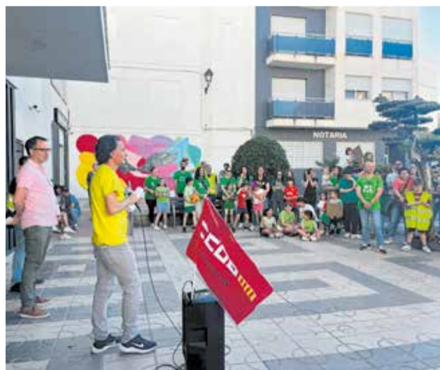
Concentración educativa en Faura este mes de mayo.

manifestaciones multitudinarias con participación de profesorado, alumnado y familias. Las movilizaciones han alterado el funcionamiento habitual de los centros, donde desde hace semanas no se desarrollan clases con normalidad debido al seguimiento de la huelga.