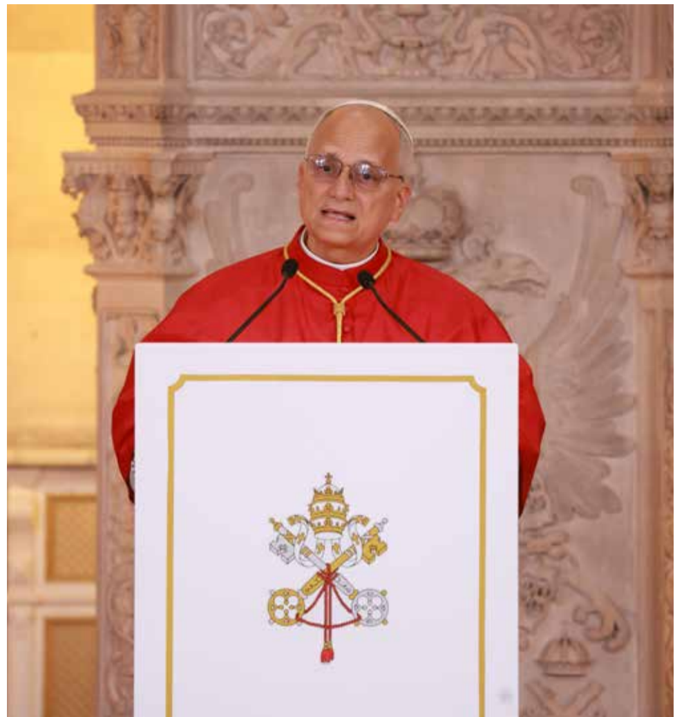
El Santo Padre durante su visita el pasado fin de semana a Madrid.

El caso coincide además con la apertura de diligencias de investigación por parte de la Fiscalía tras una denuncia del Ministerio de Igualdad, que ha señalado la posible naturaleza discriminatoria de esta situación.