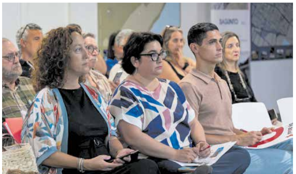
Part del públic assistent a l'esdeveniment, que va participar en el debat.