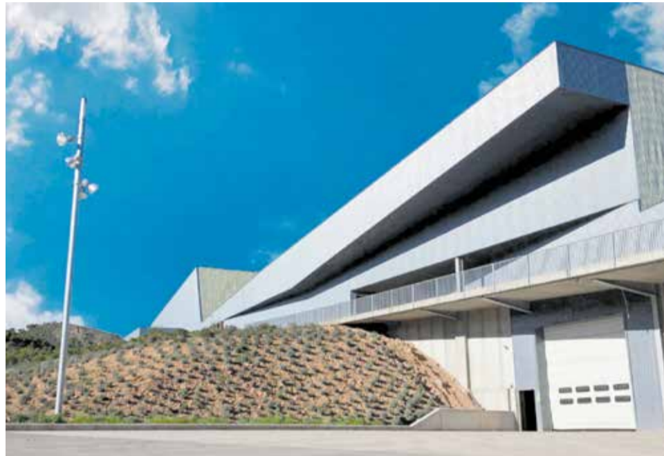
La planta del Consorcio Palancia Belcaire (C3V1) en Algímia d'Alfara.

Al mismo tiempo, el porcentaje de residuos destinados a vertedero se situó en el 31,19%, una cifra notablemente inferior al límite máximo permitido por la legislación vigente. A ello se suma el incremento de la actividad en la red de ecoparques del consorcio, que registró un aumento del 12,10 % en la recogida de residuos respecto al año anterior.