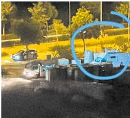
Furgoneta robada en la zona e instantes de un robo en un edificio en construcción.