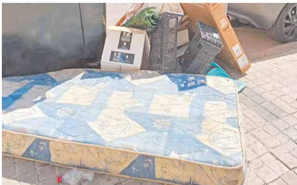
Restos de poda y enseres depositados en la calle y no en el lugar adecuado.