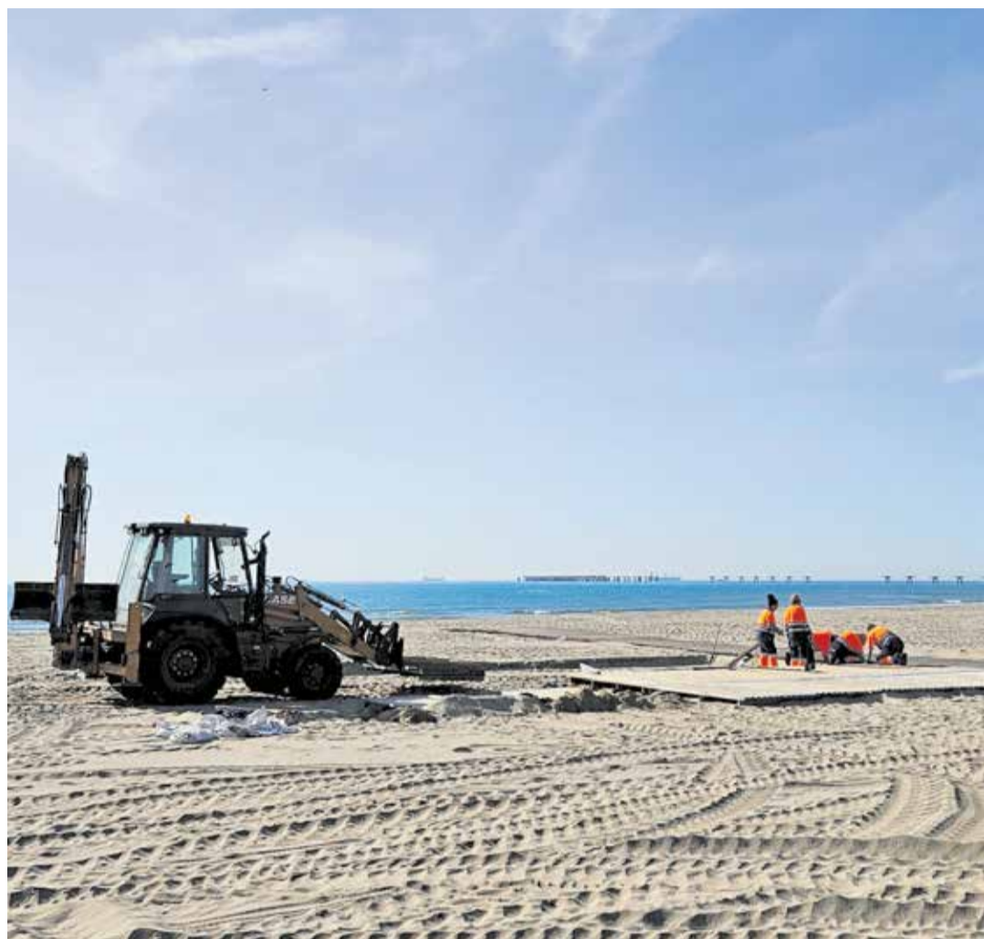
Operarios de la SAG adecuantan la playa urbana del Port de Sagunt.

A pocos kilómetros, Canet d'en Berenguer también afronta la temporada con el orgullo de volver a contar con todos los distintivos que certifican la calidad de Racó de Mar. La playa ondeará un año más la Bander