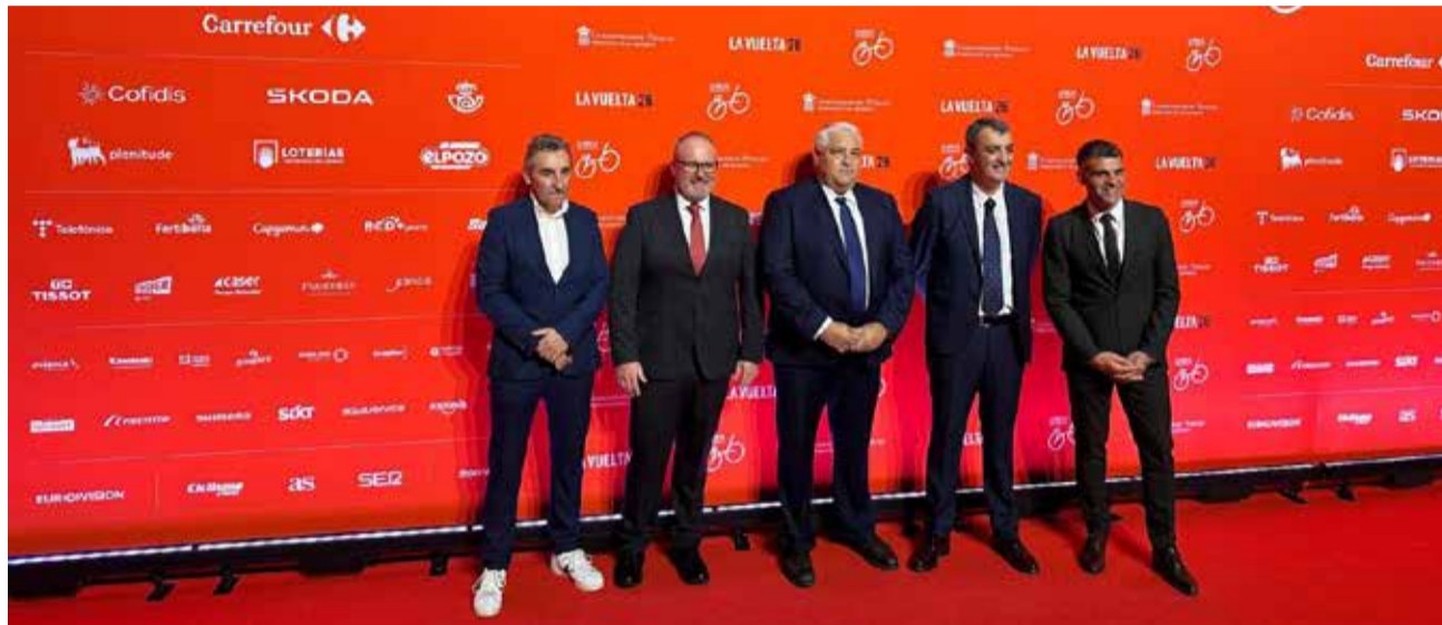
L'alcalde de Xeraco, el regidor d'Esports i el diputat d'Esports durant la presentació de La Vuelta a Mònaco.

El traçat de la huitena etapa –l'única que transcorre íntegrament per la província de València, finançada per la Diputació– és pla i travessarà Meliana, Montcada, Nàquera, Ribarroja de Túria, Xest, Montserrat, Carlet, Algemesí i el Port de Barx abans d'encarar el tram final fins a Xeraco. La meta s'instal·larà a l'avinguda dels Borrons, a la zona sud de la platja, molt pròxima a la desembocadura del riu Vaca.