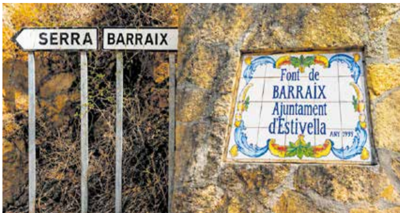
Senyal que indica la ubicació de la Font de Barraix.

Instintivament, he tornat a rellegir la definició que el diccionari Alcover-Moll dona del topò-