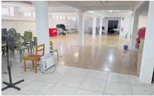
El sòtan de la 'Unión Musical Porteña'.