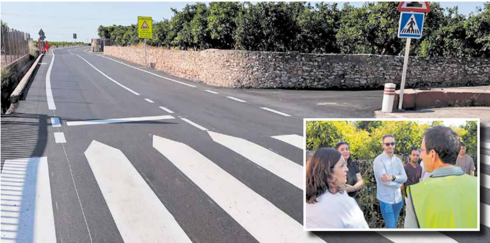
El Camí de les Valls després de les obres executades per la Diputació de València i autoritats municipals el dia de la recepció de les actuacions.

► EL CAMÍ DE LES VALLS JA TÉ NOU ASFALTAT, MILLOR DRENATGE I MÉS SEGURETAT TANT PER A CICLISTES COM PER A CONDUCTORS