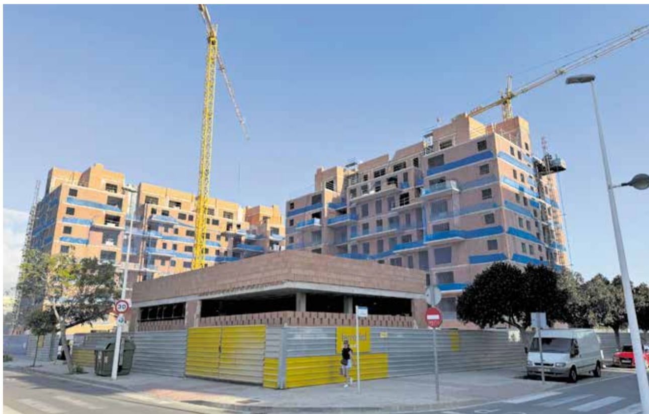
Un edificio en obras en Sagunt.

La subida de precios no es una excepción local, sino