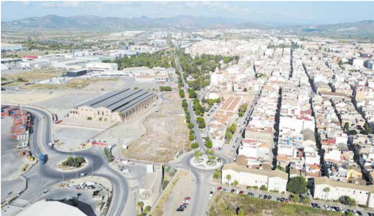
Vista aèria de l'entorn que aglutina la gran part del patrimoni industrial Port de Sagunt.