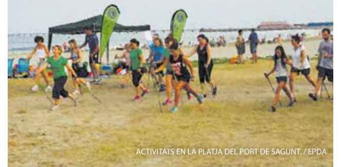
ACTIVITATS EN LA PLATJA DEL PORT DE SAGUNT.

Sagunt llança una nova edició d'Estiu a la Mar, amb activitats esportives de juny a agost a les platges del Port de Sagunt i Almardà. El programa inclou travessies, curses, tornejos i classes de ioga, zumba i gimnàstica per a tots els públics.