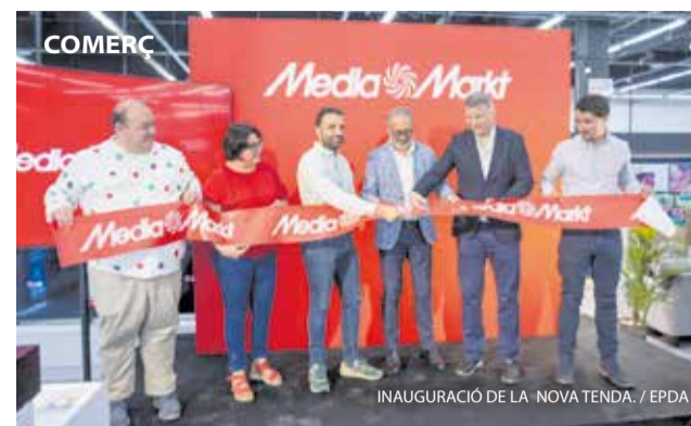
INAUGURACIÓ DE LA NOVA TENDA. / EPDA

MediaMarkt ha arribat al Camp de Morvedre amb la inauguració d'una nova tenda al centre comercial VidaNova Parc de Sagunt, que substitueix la de Massalfassar i reforça l'oferta tecnològica amb més de 40 treballadors i 6.000 productes disponibles des de ja.