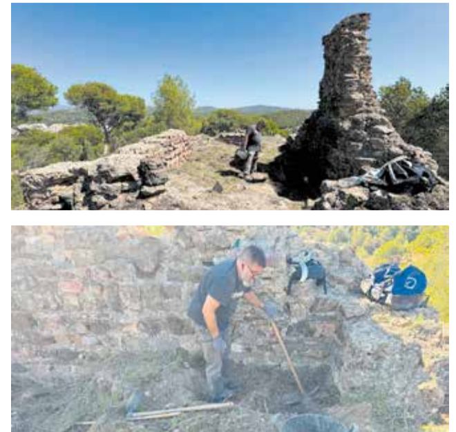
Treballs recents de neteja i recuperació en el Castell del Piló d'Albalat dels Tarongers.

deteriorament. "L'objectiu és evitar nous danys i crear les condicions necessàries per a reprendre les excavacions amb garanties, una intervenció considerada prioritària després dels resultats obtinguts en les últimes campanyes arqueològiques", expressa Asensi.