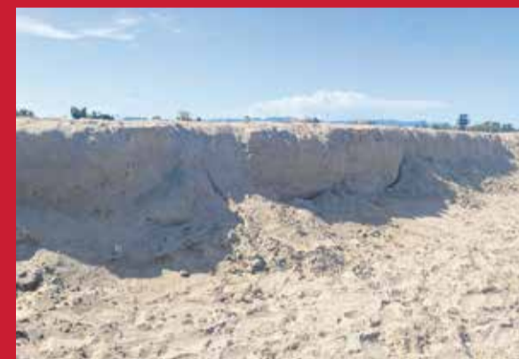
El escalón en l'Almardà el 14 de junio.

La actuación desarrollada en el conjunto del litoral del Camp de Morvedre ha supuesto uno de los mayores proyectos de regeneración de la costa en España, con una inversión superior a los 42 millones de euros y la aportación de alrededor de 1,2 millones de metros cúbicos de arena. El material ha sido extraído de un banco submarino situado frente a Cullera y Sueca mediante un proceso de dragado marino, y posteriormente impulsado hasta la costa a través de un sistema combinado de tuberías flotantes en el mar y conducciones terrestres en los tramos de playa. Una vez llegado al litoral, la arena se ha distribuido de forma progresiva a lo largo de los distintos tramos afectados, con trabajos de perfilado y redistribución para adaptar la nueva morfología de la playa y recuperar anchura en las zonas más erosionadas.