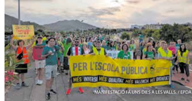
MANIFESTACIÓ FA UNS DIES A LES VALLS.

En el marc de la vaga educativa que va marcar la Comunitat Valenciana durant un mes, la Vall de Segó es va unir en una protesta realment multitudinària en defensa de l'educació pública i de qualitat. La marxa va recórrer els cinc pobles d'esta subcomarca del Camp de Morvedre.