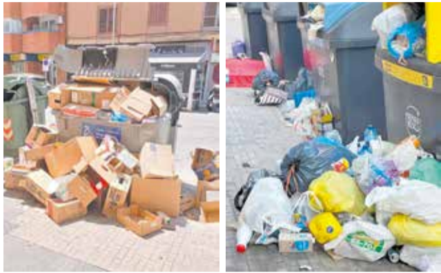
Contenedors de fem a Sagunt.