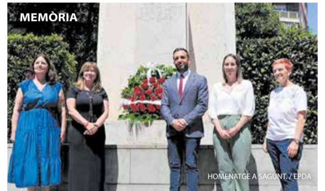
HOMENATGE A SAGUNT.