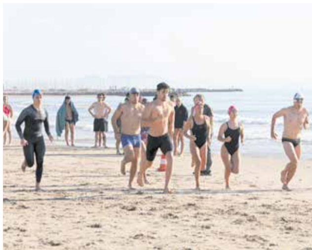
Policía de Playas, vigilante en l'Almardà, turistas y socorristas en las pruebas de acceso.

ción de los puertos de Castellón, Burriana y Sagunt, la regulación de los ríos —que redujo el aporte natural de arena— y la intensa urbanización de la costa modificaron profundamente el equilibrio natural del litoral. También ha tenido un papel importante el puerto de Siles, cuya presencia ha provocado una acumulación de sedimentos en unos puntos y una mayor erosión en otros. Lo mismo con los espigones construidos al norte de la costa comarcal, como los de Almenara.