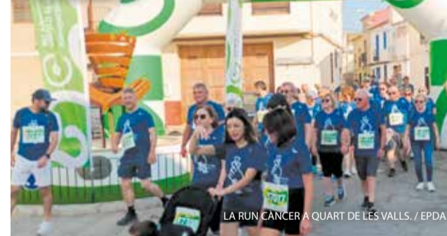
LA RUN CANCER A QUART DE LES VALLS. / EPDA

El veïnat de Quart de les Valls es va unir el passat 23 de maig pel càncer. En una marxa solidària, es va aconseguir recaptar un total de 620 euros, que es destinaran íntegrament a la investigació contra esta malaltia. Unió, solidaritat i compromís varen marcar la jornada.