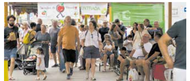
La XIII Fira de la Tomaca del Perelló bat rècords d'assistència amb més de 80.000 visitants.

en un punt de trobada per a productors, visitants i amants de la cuina de qualitat.