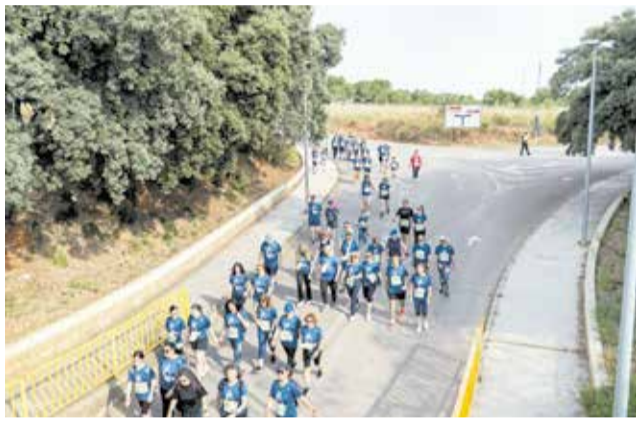
Participants en la Run Càncer d'Alberic.