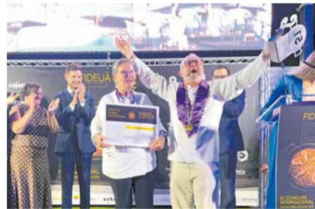
Casa Repinaldo d'Astúries, millor fideuà del món.