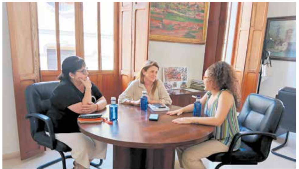
Moment durant l'entrevista.

► Per al que queda de legislatura igual no, perquè queda un any i no serà possible. Però sí que és de veres que s'estan fent reunions per a poder fer