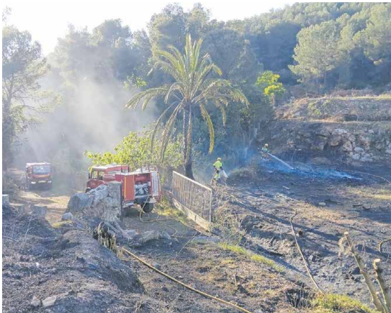
Treballs d'extinció d'un incendi a la partida de Valletes de Gallo d'Alzira el passat mes d'abril.

Una iniciativa que se suma a les actuacions en matèria de prevenció que ha dut a terme fins ara el servei d'Emergència Climàtica i Resiliència, projectes estratègics i europeus de l'Ajuntament d'Alzira.