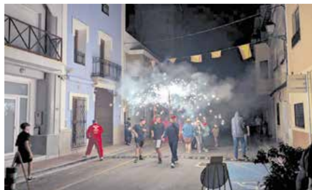
Festes patronals a l'Alqueria de la Comtessa.