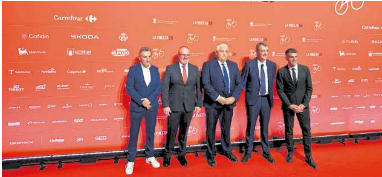
L'alcalde de Xeraco, el regidor d'Esports i el diputat d'Esports durant la presentació de La Vuelta a Mònaco.

El traçat de la huitena etapa –l'única que transcorre íntegrament per la província de València, finançada per la Diputació– és pla i travessarà Meliana, Montcada, Nàquera, Riba-roja de Túria, Xest, Montserrat, Carlet, Algemesí i el Port de Barx abans d'encarar el tram final fins a Xeraco. La meta s'instal·larà a l'avinguda dels Borrans, a la zona sud de la platja, molt pròxima a la desembocadura del riu Vaca.