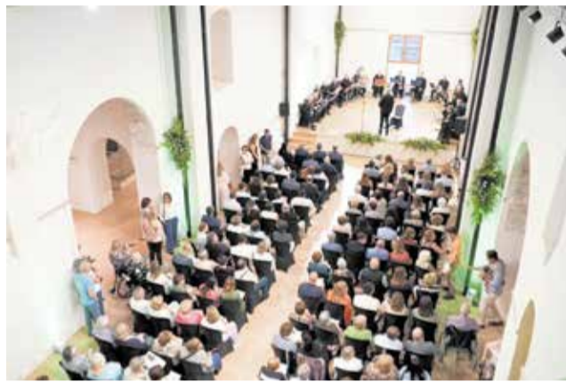
Inauguració del Convent dels Àngels d'Alberic.

no sabíem si podríem amb este repte, però hui podem dir que hem salvat un espai que estava pràcticament perdut".