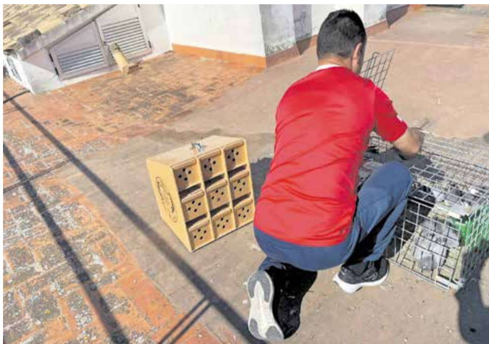
Alzira aconseguix reduir en un 50% la població de coloms assilvestrats.