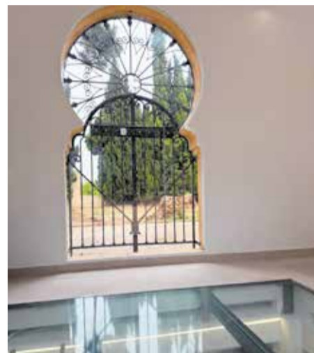
Treballs d'adequació d'un dels antics depòsits d'aigua potable dels Pinets a Carlet.

banys accessibles, la incorporació d'un sistema de climatització i la creació d'un nou accés des de la peça central del conjunt que connecta els dos depòsits.