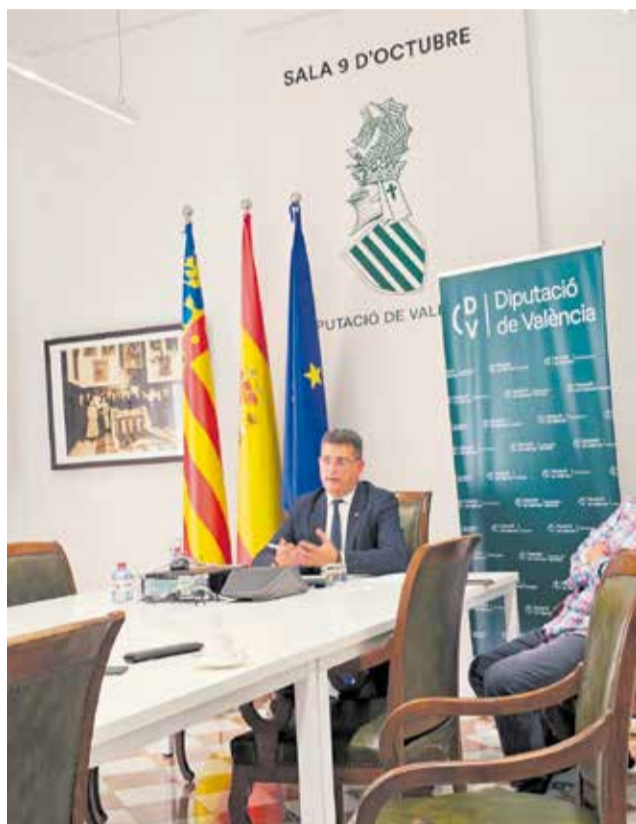
Intervenció de l'alcalde d'Alfatar en el Fòrum Europeu per a la reestructuració territorial celebrat a Moldàvia.

Així mateix, la seua òptima labor de coordinació supramunicipal va ser elogiada pel seu pragmatisme