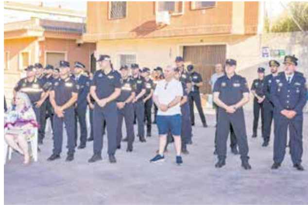
Diferentes momentos durante la celebración del 30 aniversario de la Policía Local de Montroy.

por dotar al municipio de un cuerpo propio de seguridad. Asimismo, se homenajeó al concejal de Seguridad Ciudadana por sus 35 años de servicio en la corporación municipal,