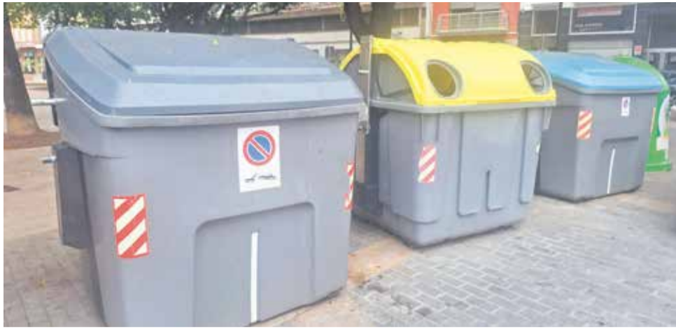
El PP de Gandia denuncia la ausencia del contenedor marrón en la ciudad.