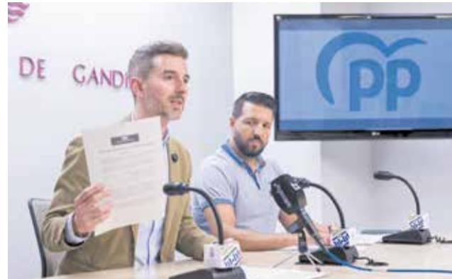
Rueda de prensa del PP sobre la criminalidad.