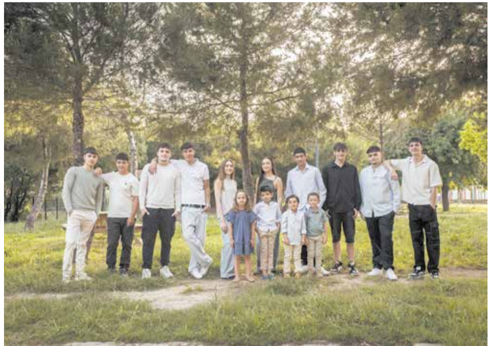
Festers i Festeres 2026, junt als festerets i festeretes.