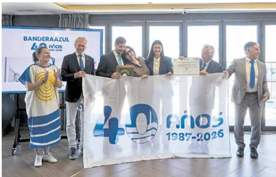
La platja Nord de Gandia revalida el distintiu Bandera Blava.