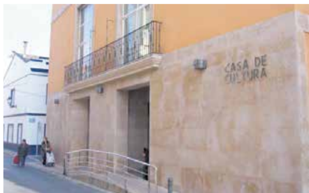
Casa de la Cultura de Xeraco.

Lacte tindrà lloc a les 19.30 hores a la Casa de la Cultura de Xeraco, en una gala que reunirà representants de tots els àmbits de la vida comar-