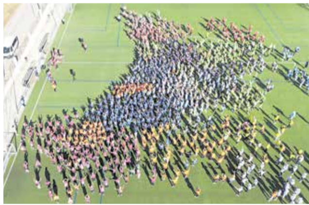
Participants en la Trobada 'La Ribera Camina'.

Esta iniciativa, impulsada des de Departament de Salut de La Ribera amb la col·laboració de l'Ajuntament d'Alberic, va reunir els distints grups de persones que participen en les caminades saludables dels diferents municipis. Pel que fa al nostre poble, l'Alberic Camina té lloc