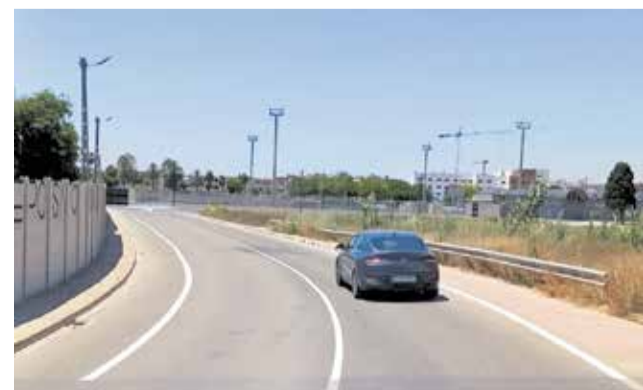
Resultat final de les obres del Camí del Cementeri.

en condicions clares de circulació, s'han dut a terme les tasques de pintura pública i la instal·lació de la nova senyalització viària, tant horitzontal com vertical. Amb la recepció i certificació final de l'obra, el vial ja es troba plenament operatiu per al veïnat de la localitat.