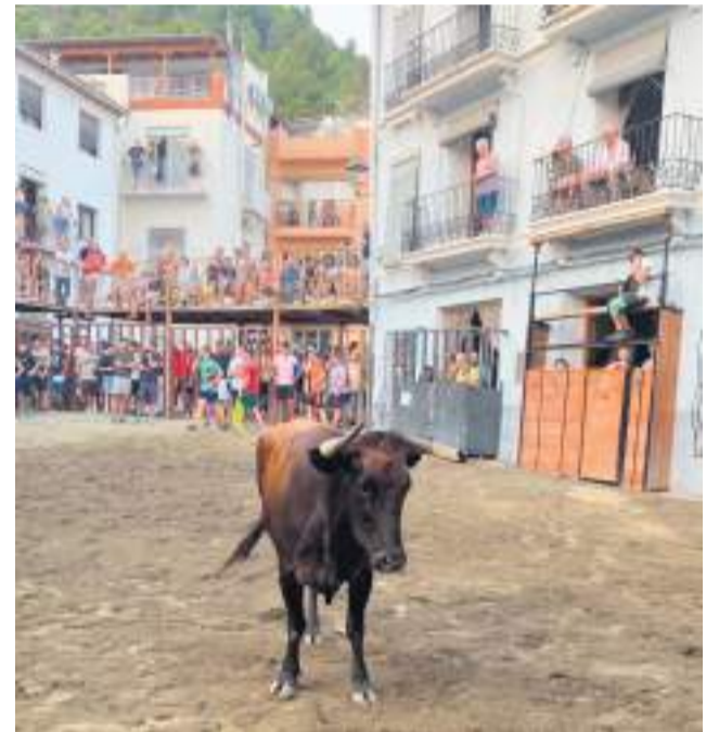
Imagen de archivo de las fiestas de Vall de Almonacid.

Entre los actos más destacados figura la Noche de Paellas , una cita en la que vecinos de todas las edades comparten mesa y conversación. También destaca la subida nocturna al castillo , organizada por la Asocia-