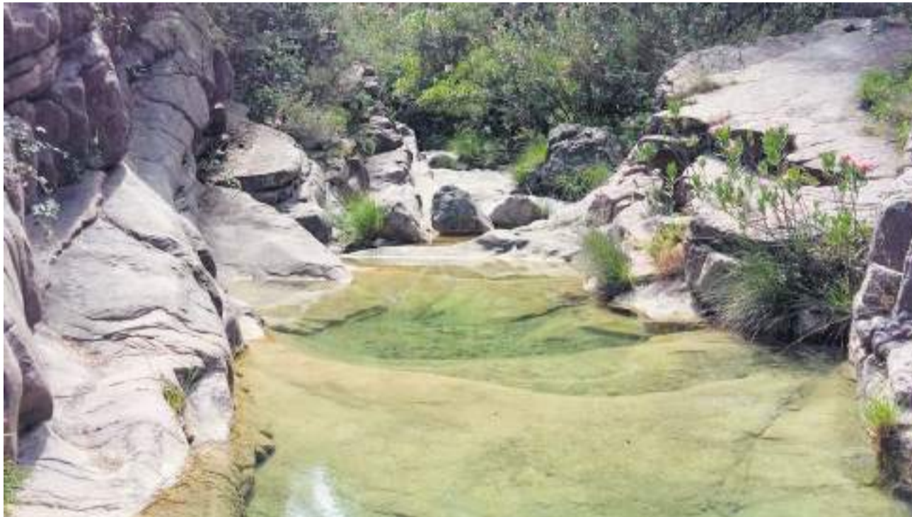
Una de las pozas de aguas cristalinas de Cirat.

Desde el Ayuntamiento se ha informado de que serán sancionados los vehículos que estacionen en lugares no habilitados para ello. Por este motivo, se ha hecho un lla-