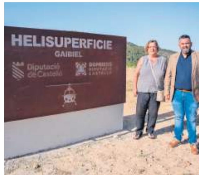
La nueva helisuperficie de Gaibiel.