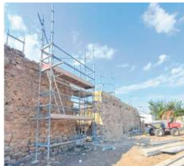
Estado actual de las obras.

Las obras que se están ejecutando permitirán recuperar un espacio de gran valor histórico, cultural y sentimental.