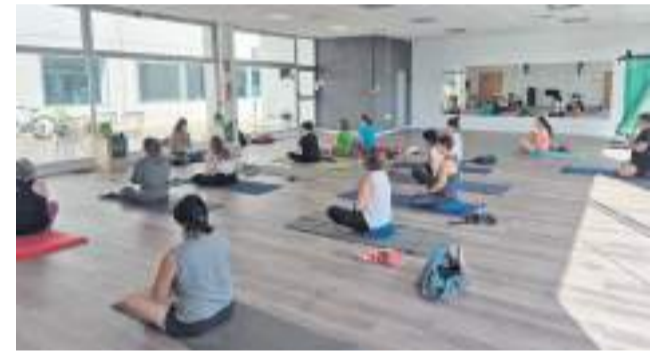
Sesión de meditación grupal.

El proyecto prioriza el bienestar emocional, la integración social y la prevención de la soledad no deseada, con talleres, encuentros intergeneracionales y rutas saludables dentro de la iniciativa “Respira tu municipio, Viver”.