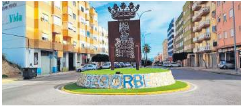
Entrada a Segorbe.