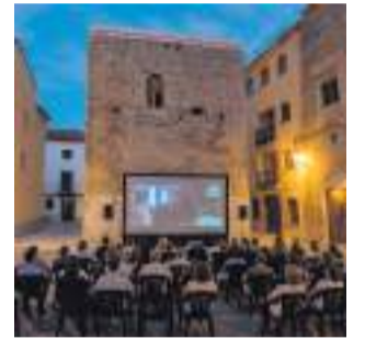
Cine de verano.