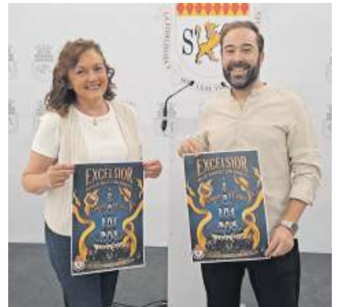
Presentació del cartell de "Excelsior"

El pla preveu, a més, un seguiment mensual de cada cas registrat per part dels agents, amb l'objectiu de mantindre un control continuat de l'evolució de cada expedient i garantir que les mesures adoptades resulten efectives amb el pas del temps.