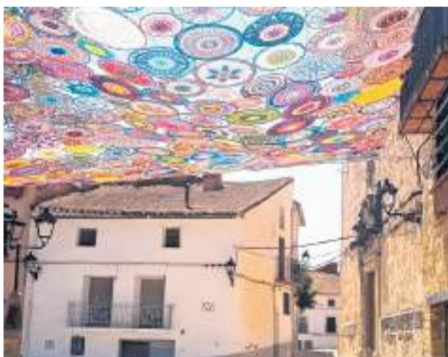
El dosel de ganchillo.

"Detrás de este trabajo hay un año entero de esfuerzo, ilusión y muchas horas de dedicación", ha explicado la Asociación, que hoy muestra con orgullo el resultado