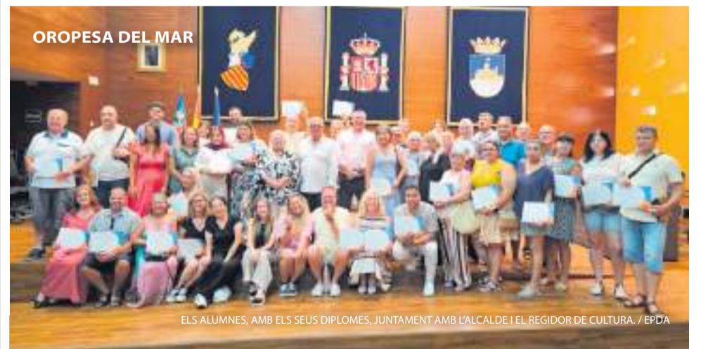
ELS ALUMNES, AMB ELS SEUS DIPLOMES, JUNTAMENT AMB L'ALCALDE I EL REGIDOR DE CULTURA.

La regidoria de Cultura ha entregat els diplomes als alumnes que han superat el curs 2025-2026 d'idiomes, entre els quals Castellà, Valencià, Anglès i Alemany. Els cursos es reprendran al setembre.