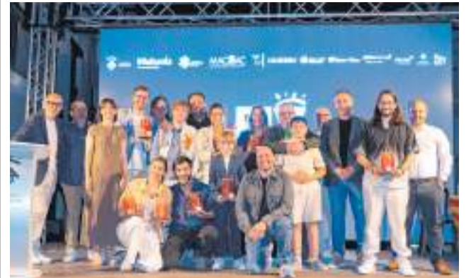
Els guardonats de la gala.