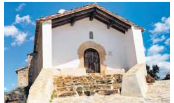
Ermita de Santa Bárbara.

Catalán ha defendido la inversión en patrimonio como motor de desarrollo: "El patrimonio es pasado pero también es futuro, e invertir en él es garantizar desarrollo y turismo para nuestra localidad".