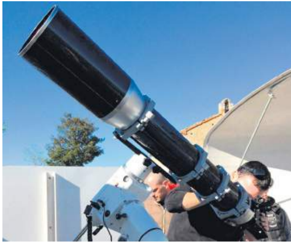
Telescopio solar.

El programa cuenta con subvención de la Diputación de Castellón, dentro de la convocatoria de fortalecimiento de la oferta turística provincial. Su objetivo es doble: acercar la astronomía a la ciudadanía y po-