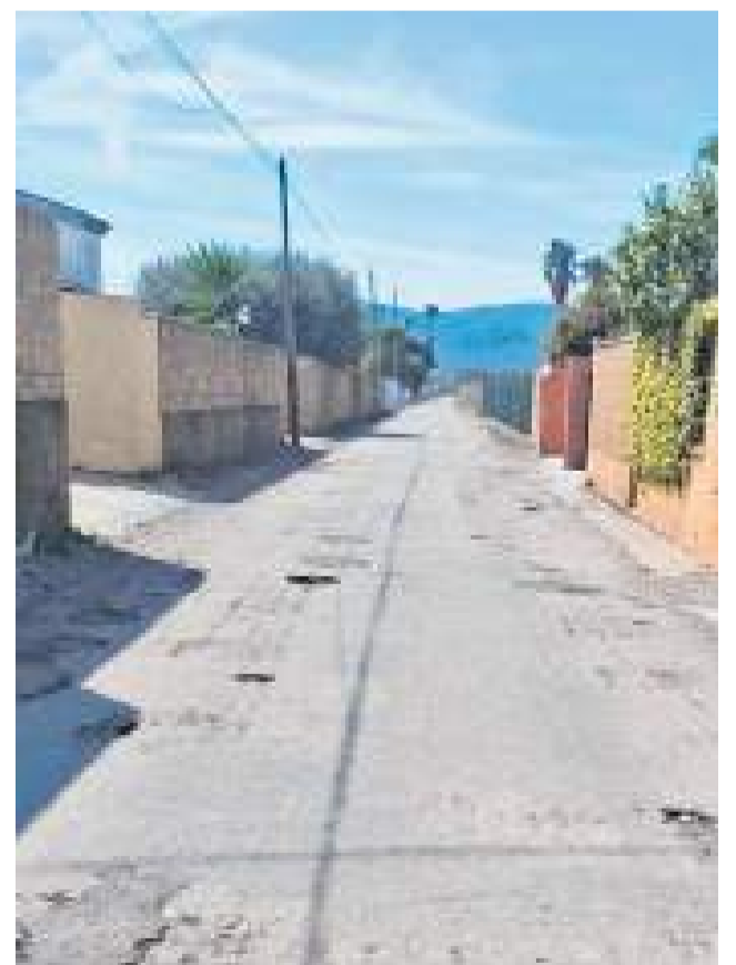
Estat actual del paviment.

Amb aquesta inversió de prop de mig milió d'euros, l'Ajuntament de Benicarló busca garantir, d'una banda, la seguretat dels usuaris que circulen diàriament per aquestes vies i, d'altra banda, la funcionalitat a llarg termini d'unes infraestructures que es consideren essencials per a la mobilitat quotidiana de bona part del terme municipal.