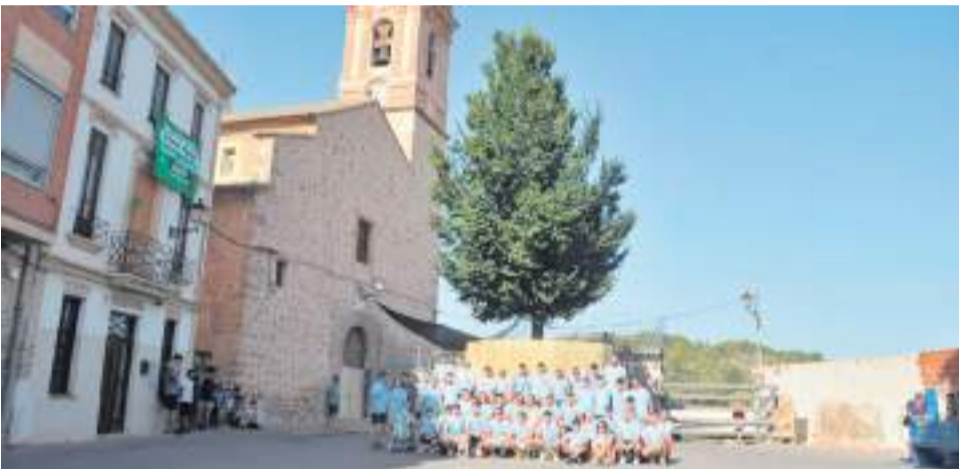
Peña Taurina El Olmo.