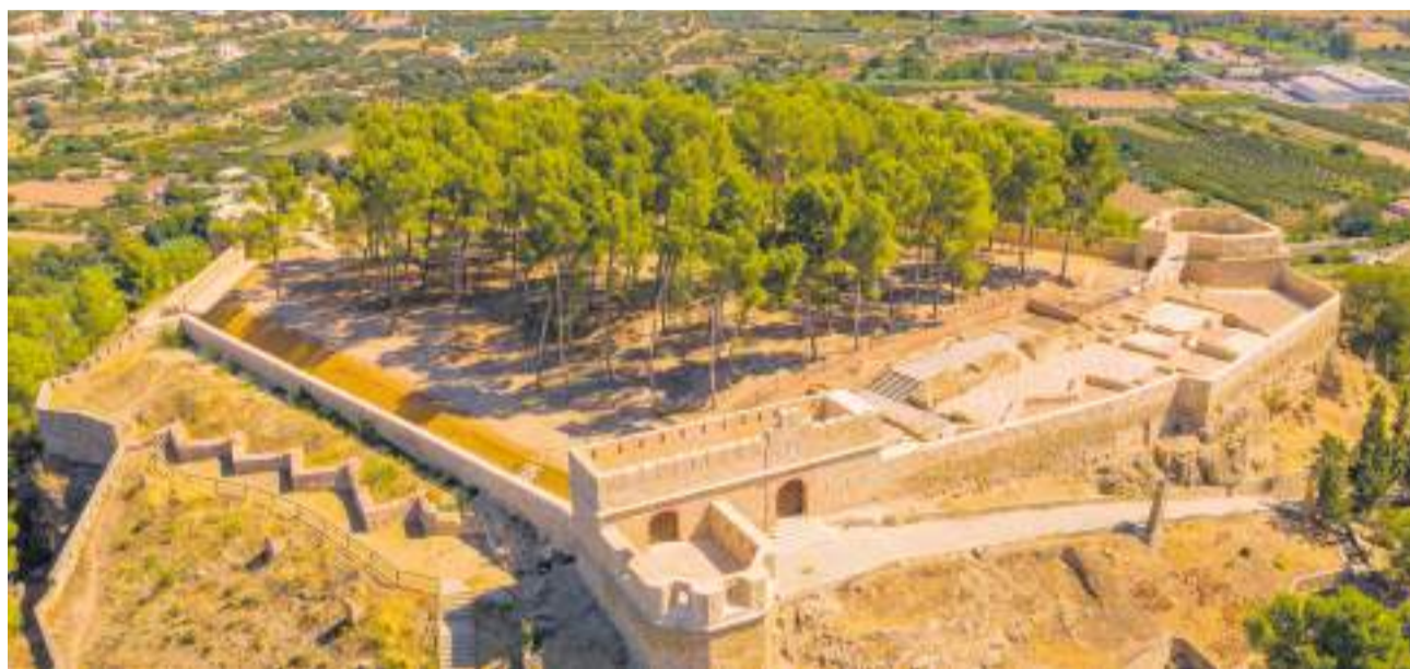
Cerro de Sopeña y Castillo de la Estrella, Segorbe.

La intervención está financiada al 100% con la subvención concedida por la Vicepresidencia i Conselleria de Presidència de la Generalitat, que aporta 127.289,91 euros para la excavación y consolidación de las cisternas. Estas ayudas, destinadas a promover la protección, el fomento y el desarrollo del patrimonio y la dinamización culturales, así como la adecuación y renovación de bienes y espacios municipales de la Comunitat Valenciana, se emplearán para recuperar nuevos espacios y profundizar en el conocimiento de la estructuración de la