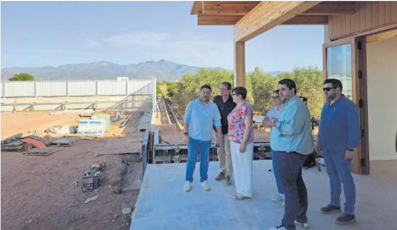
Visita a les obres de la Vila Romana del Benicató.