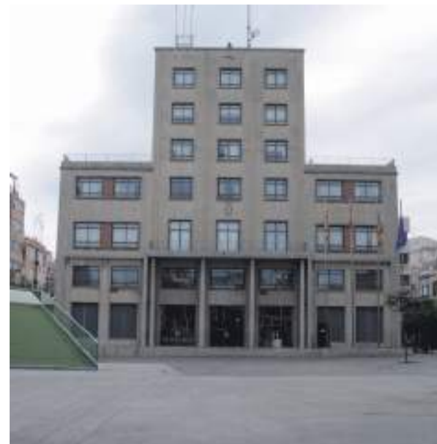
Ajuntament de Vila-real. / EPDA

"Estem centrats en esta prioritat. Ens dol profundament que esta situació haja generat tanta distorsió i dificultats a empreses i proveïdors de l'Ajuntament", ha afirmat l'alcalde, qui ha insistit en que l'objectiu és recuperar la normalitat administra-