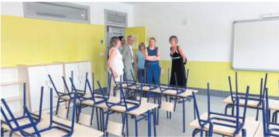
Vecinos del municipio durante la visita a las nuevas instalaciones.