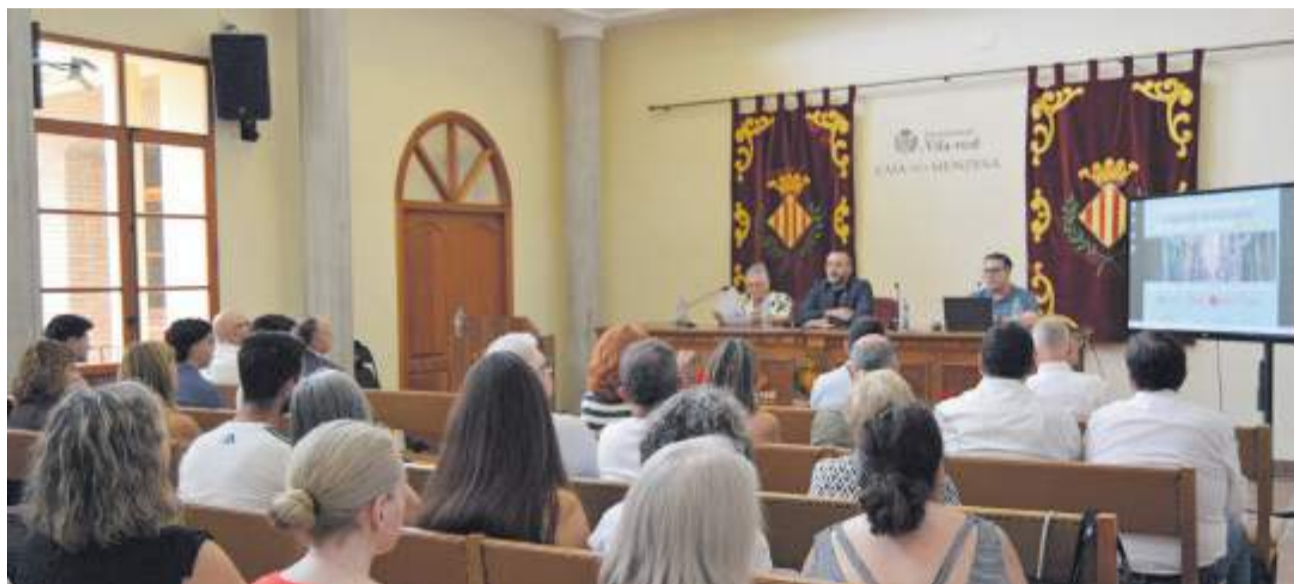
Presentació diagnòstic Pla Director Comerç.