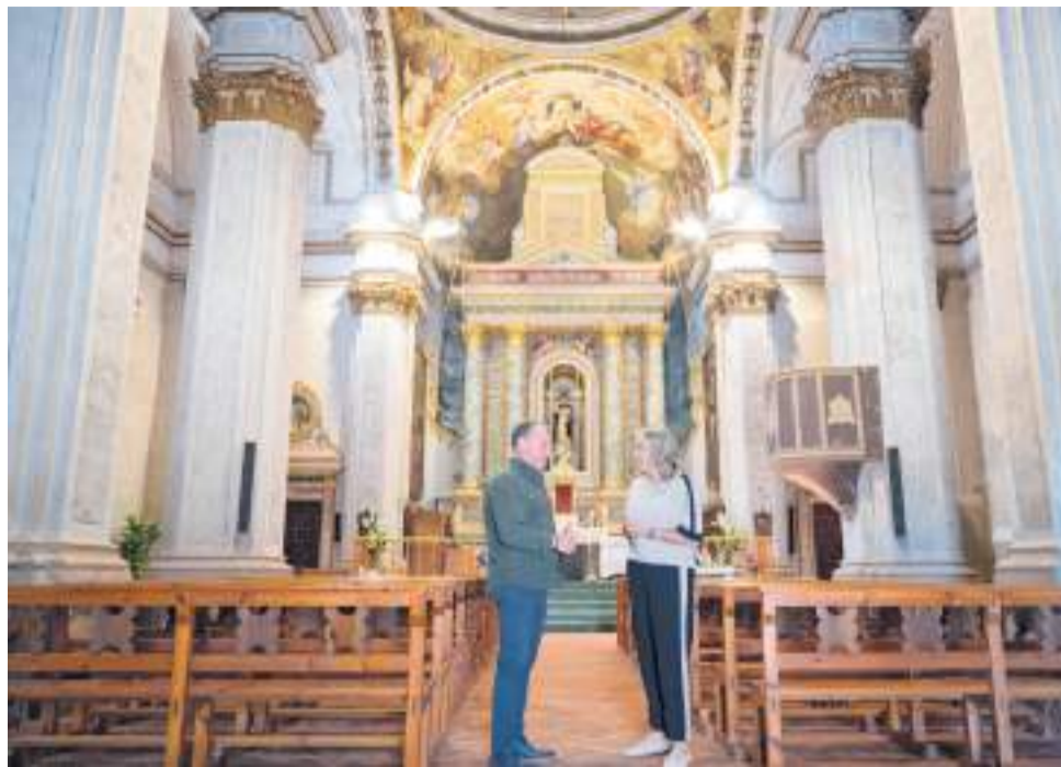
Interior de la parroquia de San Vicente de Ferrer.