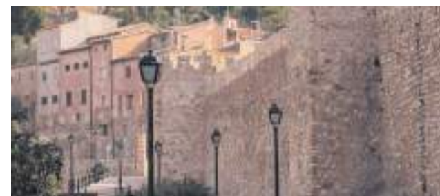
Murallas medievales.

Climent explicó que la obra contempla la creación de una zona de aparcamiento con un total de 62 plazas, además del acondicionamiento del acceso a la zona histórica. Según remarcó, la actuación mejorará también las condiciones de vida de los vecinos y contribuirá a frenar la des-