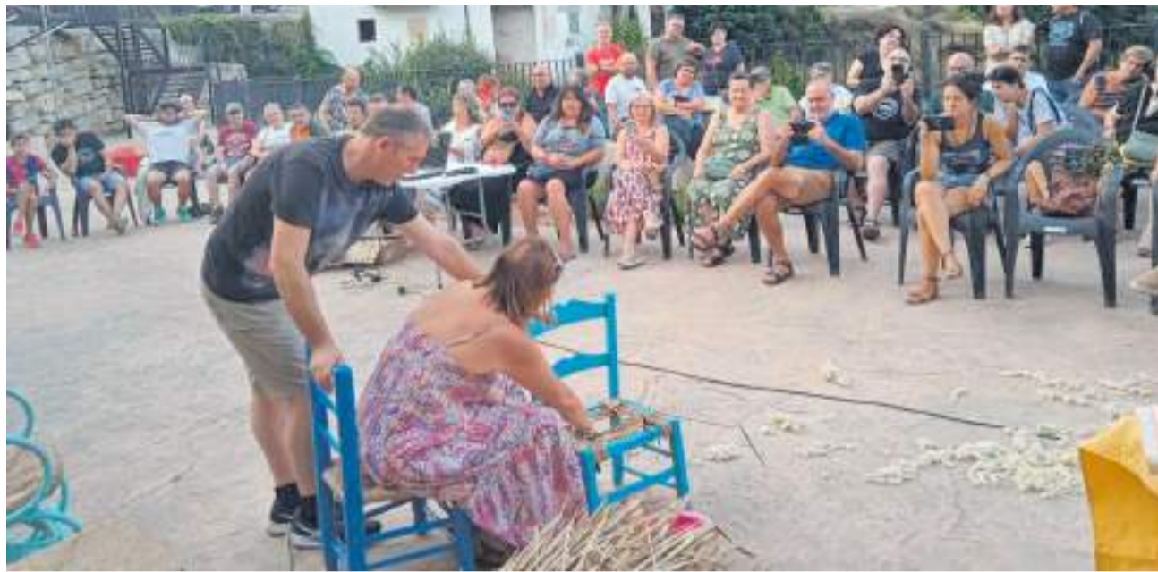
Una actividad de la primera edición de 'Citas con el Conde'.

La programación incluye la presentación de publicaciones dedicadas a la historia de Montán, exposiciones fotográficas, visitas teatralizadas, rutas culturales, recitales de poesía, conferencias y actividades participativas