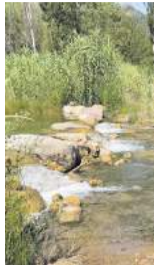
Tramo del río Mijares.