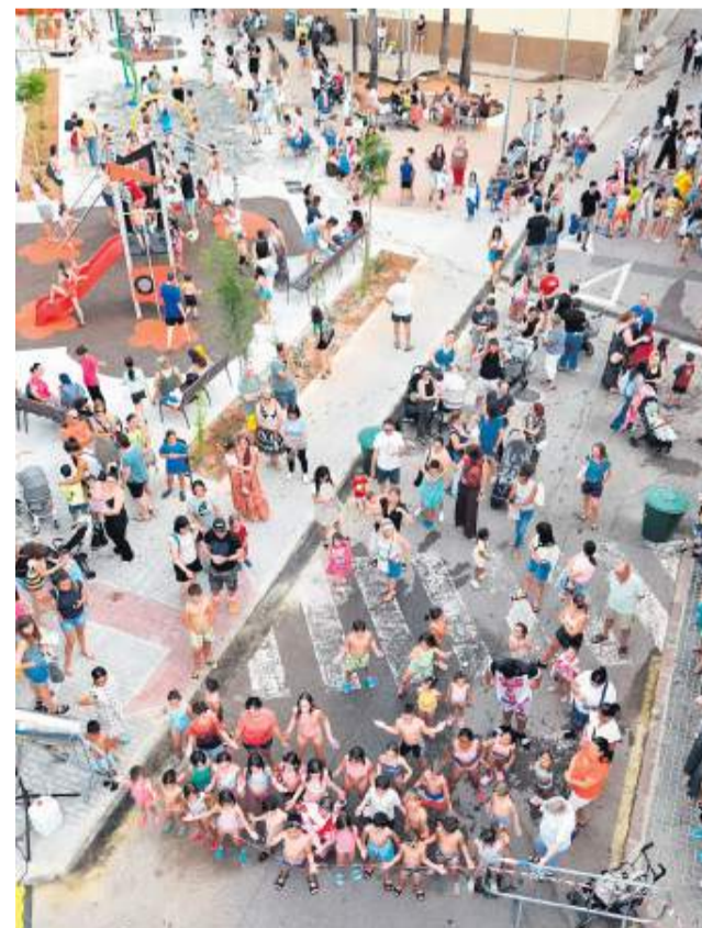
Inauguració de la nova plaça del carrer Balmes.

L'objectiu és que este procés de transformació estiga completat al voltant dels anys 2030 i 2031. L'alcaldesa ha conclòs que s'inverteixen recursos públics per a millorar els espais de convivència i joc de la ciutat, però que també és important que tota la ciutadania els cuide, perquè formen part del patrimoni col·lectiu i de la qualitat de vida de la Vall.