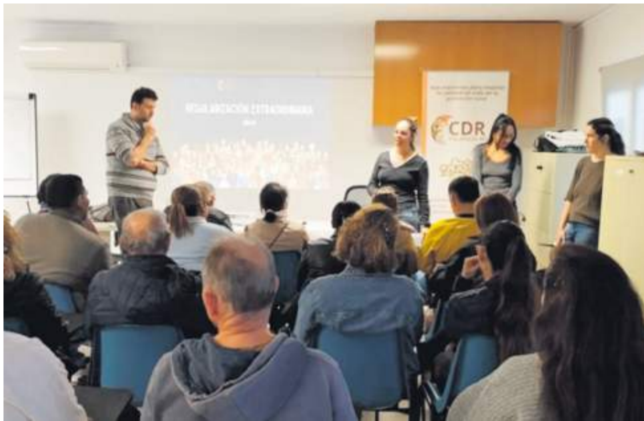
Reunión informativa del CDR Palancia-Mijares.

A estas 70 atenciones directamente vinculadas a la tramitación se suman cerca de 40 personas que participaron en las sesiones informativas organizadas por la entidad en Segorbe y Montanejos, pensadas para resolver dudas generales sobre los requisitos del proceso. A