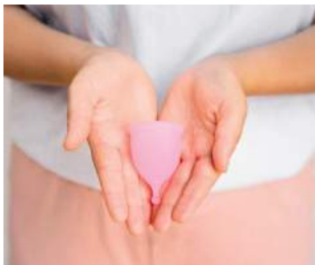
Las copas menstruales repartidas.

La Concejalía de Igualdad ha puesto en marcha una campaña de reparto de copas menstruales dirigida a las alumnas de 5.º y 6.º de Primaria del CEIP Virgen de Gracia. La iniciativa busca dar a conocer alternativas menstruales más sostenibles, cómodas e higiénicas frente a los productos convencionales, y se enmarca dentro de las actuaciones que el consistorio desarrolla en materia de igualdad y salud pública dirigidas a la población más joven.