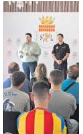
Roda de premsa. / EPDA

L'ajuntament contractarà un gabinet jurídic per a ajudar les persones afectades. Aquest servei estudiarà cada expedient de manera individualitzada per a acompanyar al col·lectiu afectat durant tot el procés.