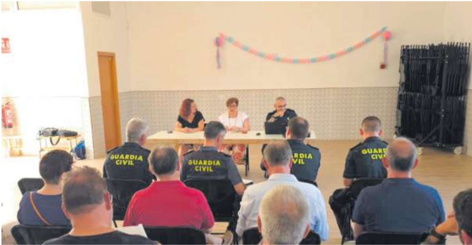
Un momento de la reunión comarcal de seguridad del Alto Mijares, celebrada en Vallat.

▶ ALCALDES DE TODA LA COMARCA SE CITAN CON LA SUBDELEGADA DEL GOBIERNO PARA REFORZAR SU COORDINACIÓN