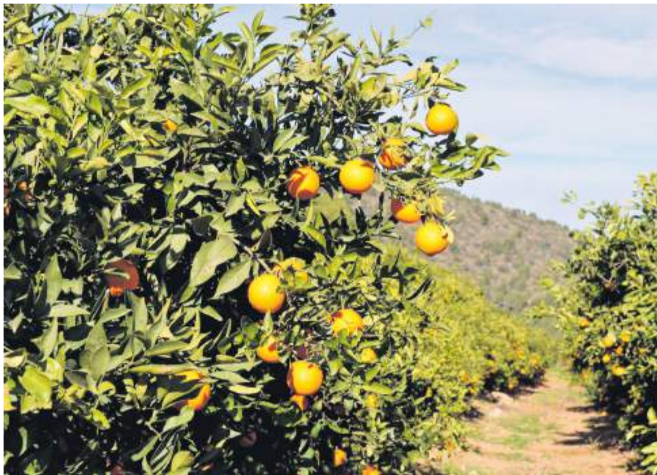
Campos de naranjos de la Plana Baixa.

Estas cuatro zonas concentran así 39 de los 66 proyectos aprobados en el conjunto de la Comunitat, lo que subraya el peso del territorio castellanense dentro de esta primera fase de la convocatoria.