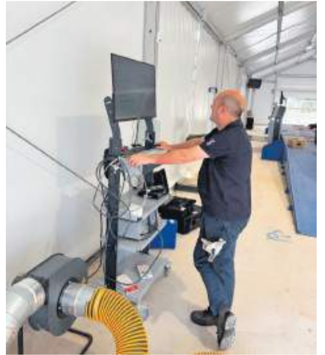
Primeras pruebas de la ITV permanente.

Según ha podido confirmarse, cada día está más próxima la entrada en servicio de esta instalación, que se ha convertido en una demanda largamente esperada por los vecinos de la comarca. Fuentes conocedoras del proceso sitúan la aper-