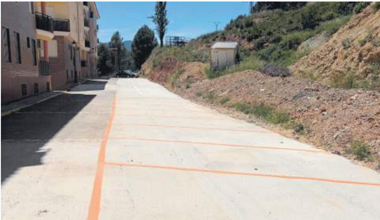
Vista de las nuevas plazas de aparcamiento reservadas para el vecindario.