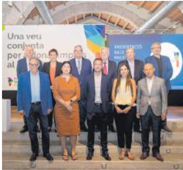
Representants de Baix Maestrat Impulsa.

Des de Baix Maestrat Impulsa destaquen que la unió d'esforços permetrà transformar estes propostes en projectes reals i d'impacte, aprofitant al màxim el potencial de la comarca i fomen-