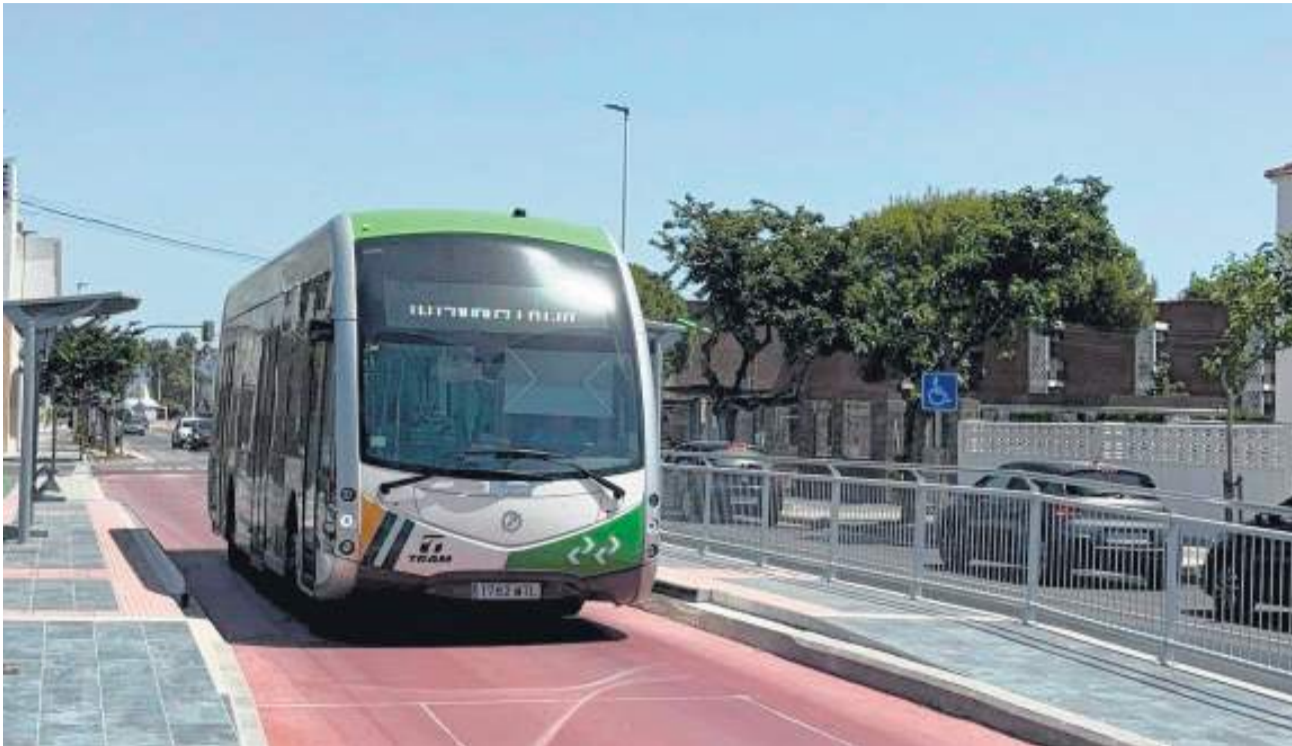
Vehicle elèctric circulant per la línia directa Castelló - Benicàssim.