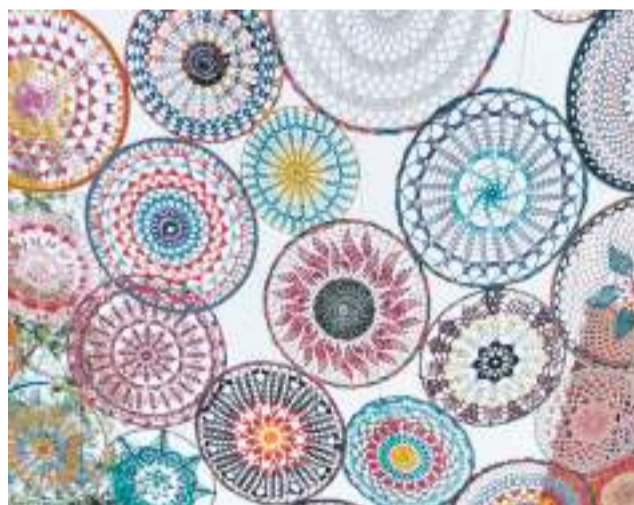
Piezas de ganchillo tejidas.

de esa labor colectiva. Cada pieza ha sido tejida a mano de forma individual antes de unirse para dar forma al gran dosel de color que ahora preside la calle, creando un juego de luces y tonalidades muy celebrado por vecinos y visitantes.