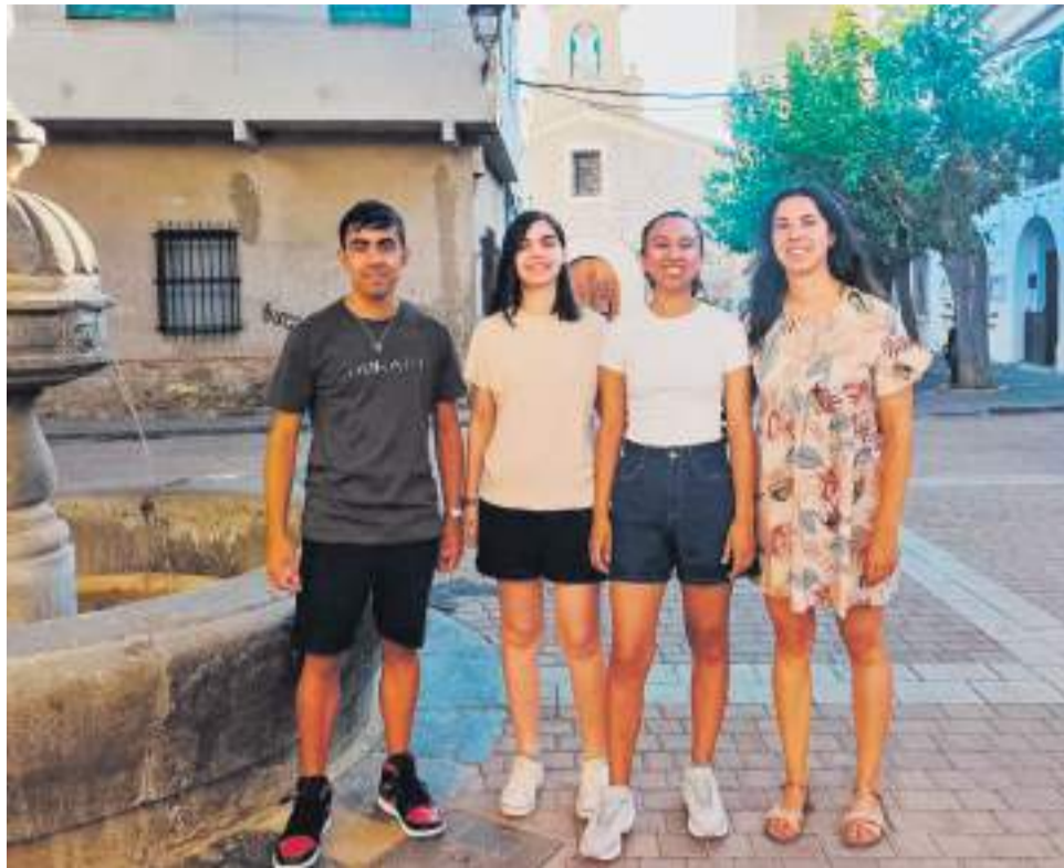
La alcaldesa de Benafer, junto a los tres estudiantes.

En esta ocasión serán tres las estudiantes que desarrollarán sus prácticas en las dependencias municipales durante las próximas semanas. Cursan los grados de Administración y Dirección de Empresas (ADE), Criminología y Publicidad, y cada una de ellas se incorporará a distintas áreas relacionadas con su formación. Su paso por el Ayuntamiento supondrá una aportación de conocimientos, ideas y propuestas que, según se espera, enriquecerán la actividad municipal en sus respectivos ámbitos de trabajo.