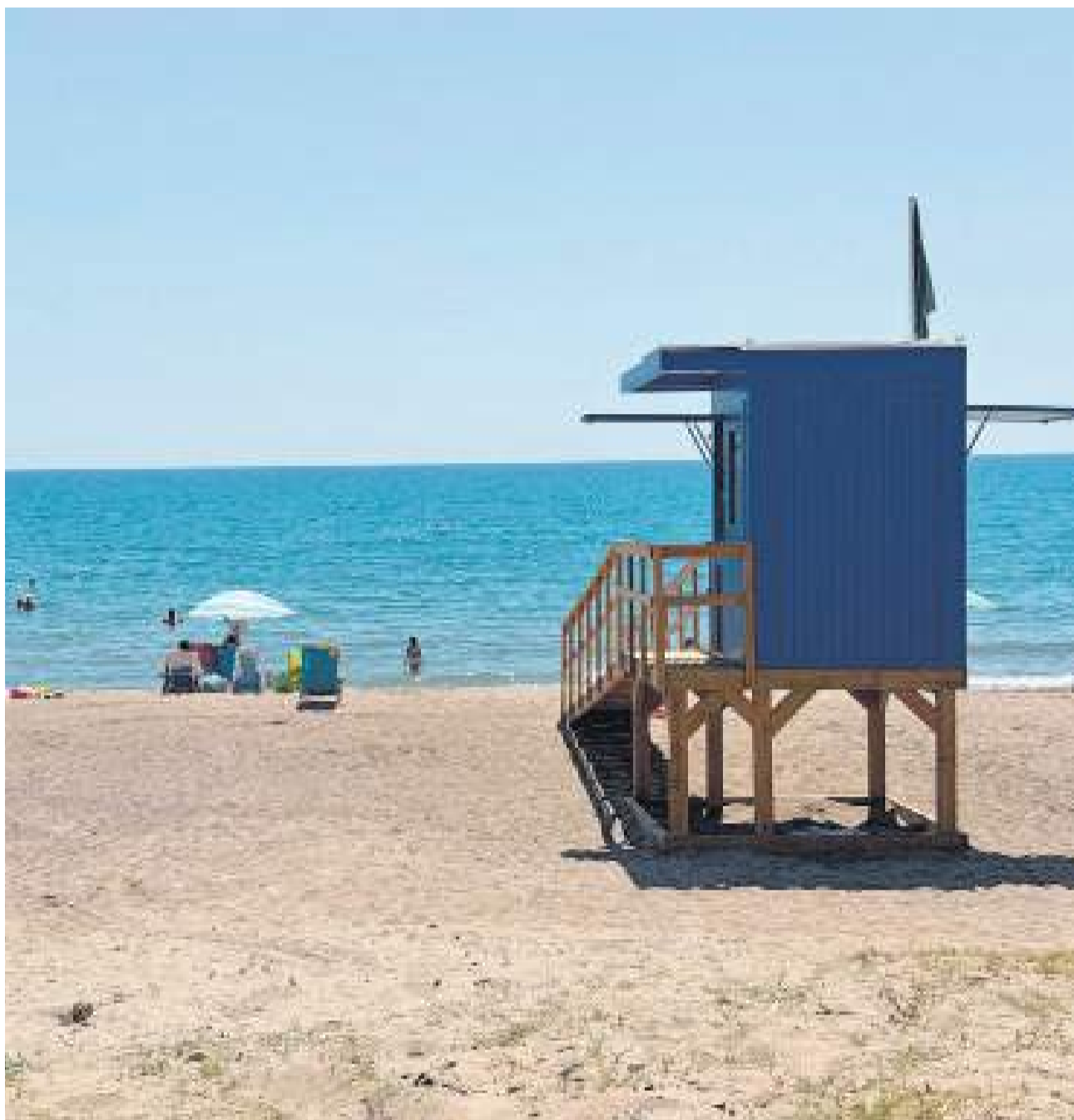
Caseta de socorrisme a la platja de Benicàssim.

Per a acompanyar estes setmanes de vacances, l'Ajuntament ha dissenyat una àmplia programació per a tots els públics durant juliol i agost. El calendari combina grans cites musicals com el Festival Internacional de Benicàssim (FIB), del 16 al 18 de juliol, i el Rototom Sunsplash, del 16 al 23 d'agost, amb propostes culturals consolidades com el Festival de Música Sacra en