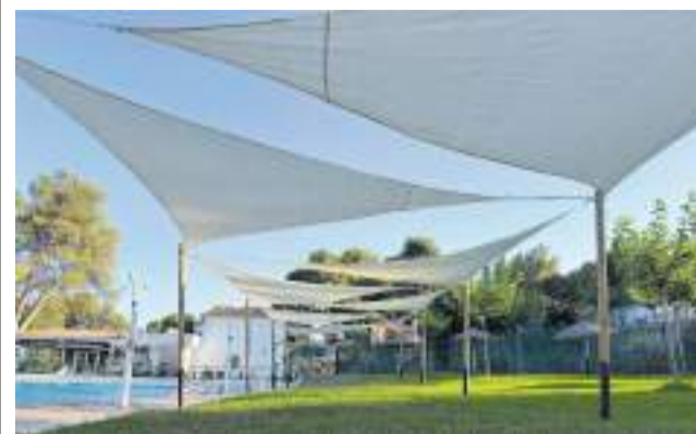
Zona de sombra en la piscina.