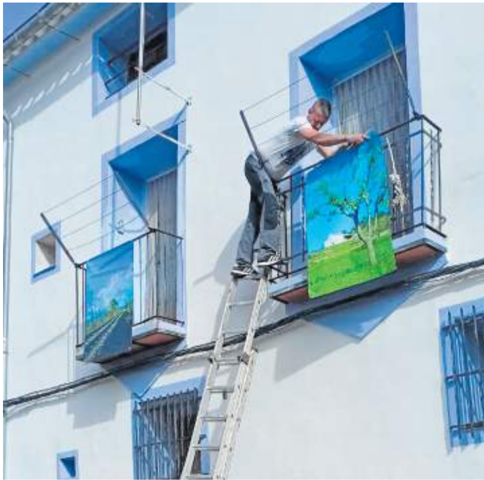
Montaje de la exposición fotográfica en Higueras.

La muestra está compuesta por lonas de gran formato que se instalarán en espacios urbanos, balcones y fachadas de las localidades participantes, configurando un recorrido visual al aire libre por diferentes rincones y perspectivas de la comarca. Se trata de una fórmula pensada tanto para vecinos como para visitantes, que podrán descubrir el territorio a través de la mirada de quienes han participado