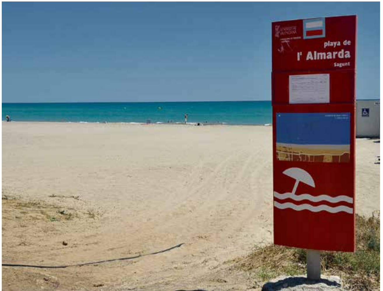
Playa de l'Almardà de Sagunt.

Recientemente se ha adjudicado la redacción del 'Proyecto de regeneración de las playas de Canet, Almardà, Corinto y Malvarrosa, T.T.M.M. de Canet d'en Berenguer y Sagunt'. Sin embargo, este podría no estar finalizado hasta