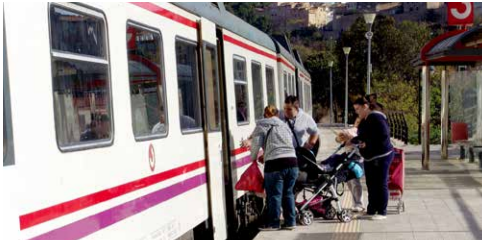
Pasajeros subiendo a un tren.

A la pregunta de la diputada de Unidas Podemos Roser Maestro en el Congreso sobre el proyecto de construcción de la línea de cercanías entre Sagunt y el Port, el Gobierno contestó que el plan presen-