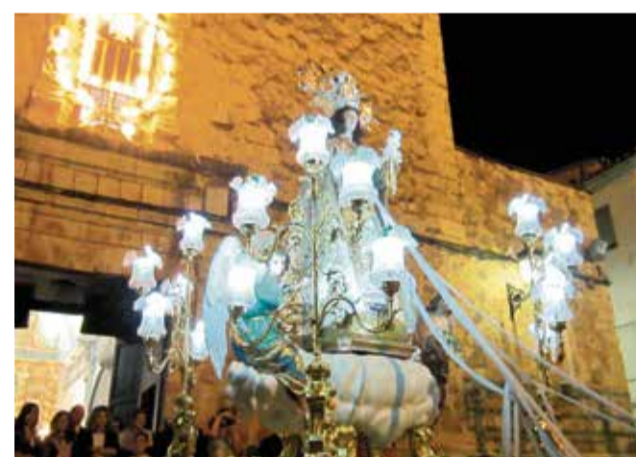
Actes de les festes populars de 2019 i processó durant una edició anterior de les festes patronals d'Algar.