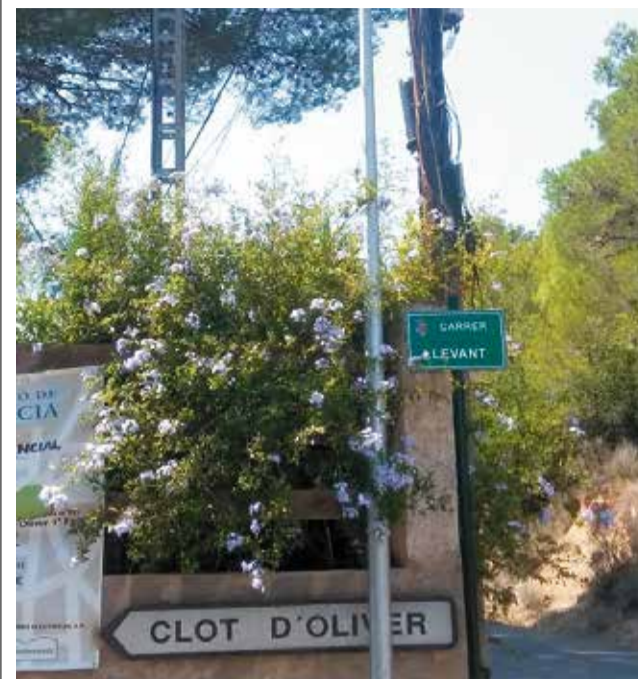
Urbanització on s'han fet millores d'enllumenat.

te l'obra. S'espera, per altra banda, que aquesta estiga finalitzada, com a màxim, per al curs 2022-2023.