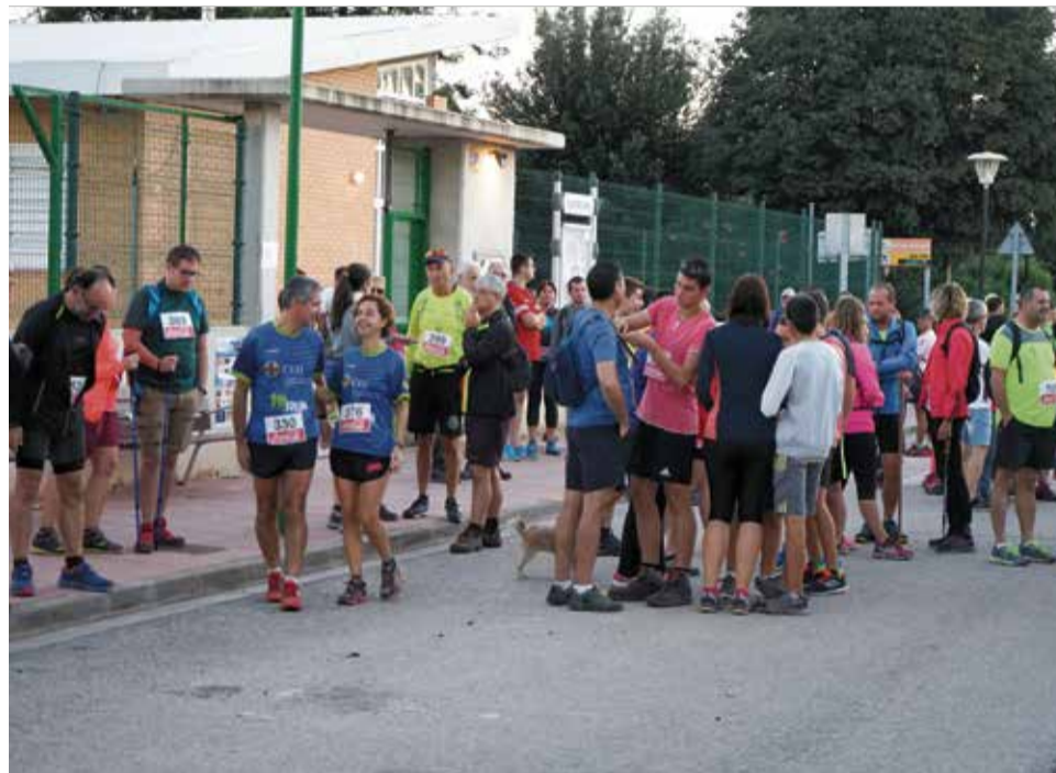
Eixida de la Marxa Solidària de Muntanya al Garbí a l'edició de 2018. / EPDA

Els participants recorreran 15 kilòmetres a peu a través d'una senda senyalitzada en tot moment mitjançant cin-