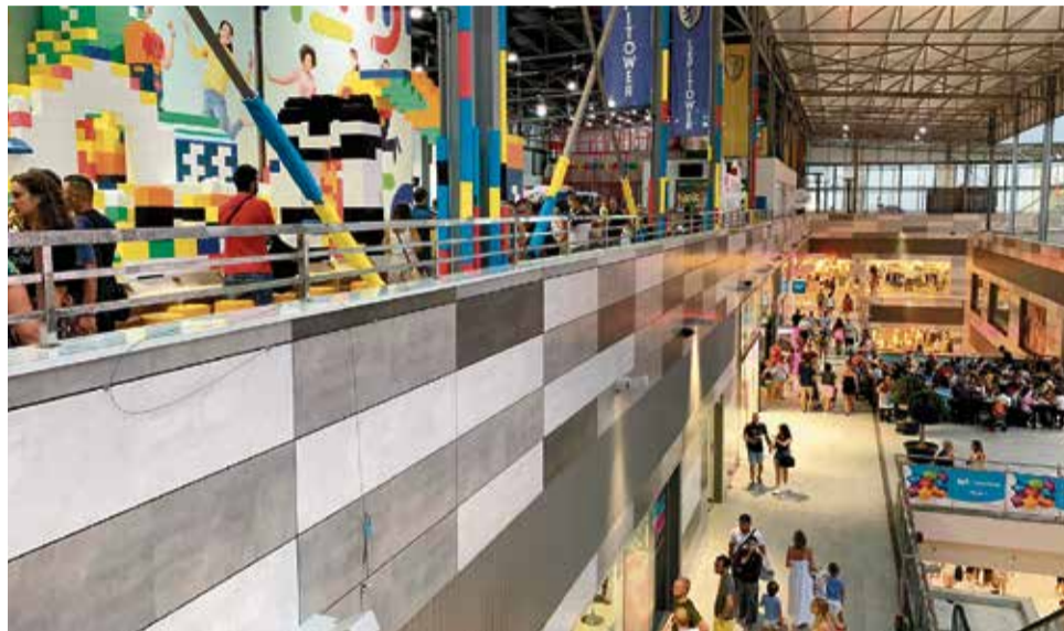
Centro Comercial L'epicentre. / EPDA

También la apertura de Lepilandia, con más de 5.000 metros cuadrados de ocio en la planta segunda del centro comercial, ha sido un punto