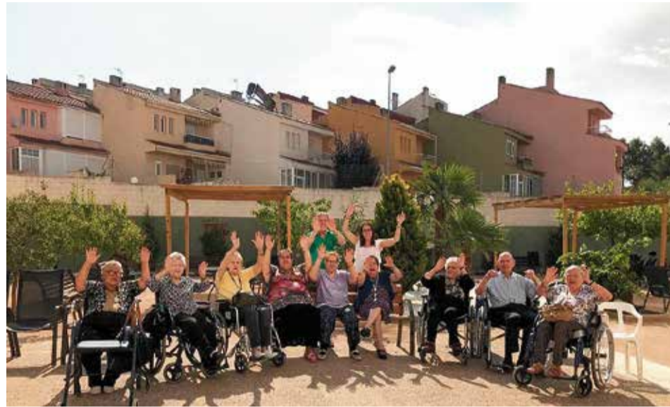
Usuarios del centro SAVIA Residencias 3ª Edad.

Deben sentirse activos para mejorar su estado de ánimo y cognitivo. La parte social es impor-