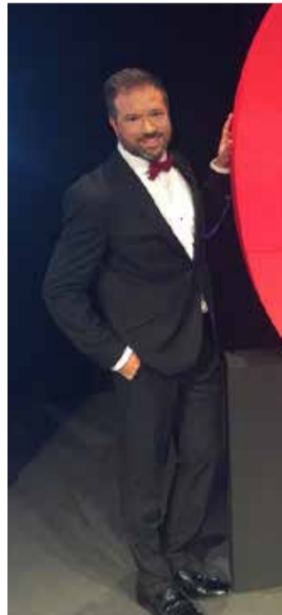
Los presentadores de la gala.