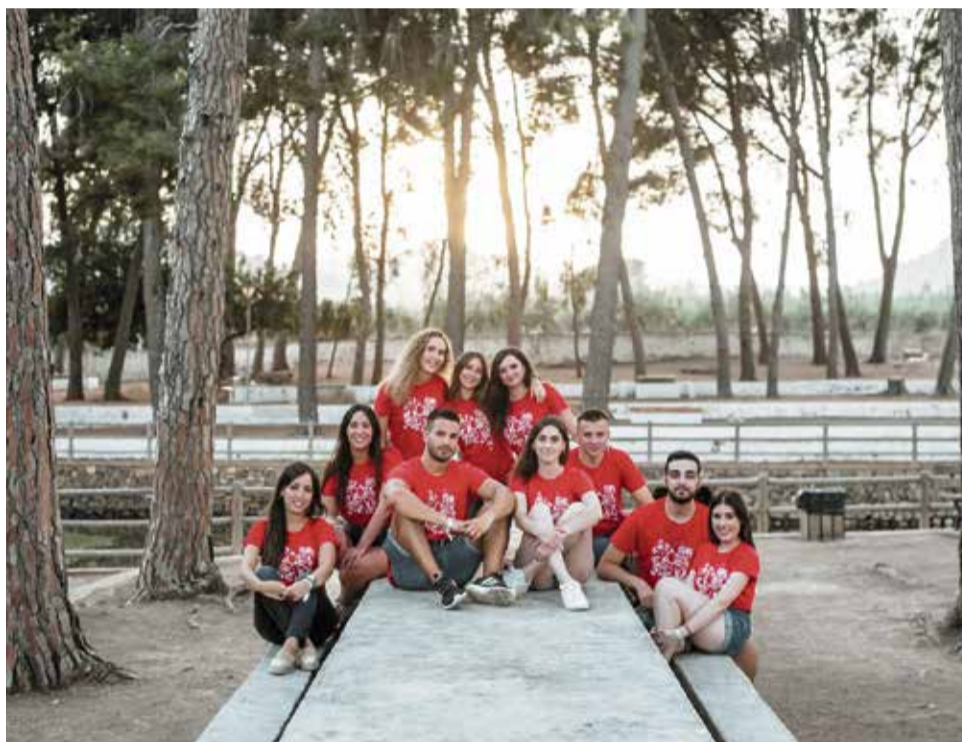
Festeros de Quart de les Valls.

El miércoles los cadafales empezarán a inundar las calles. Mientras, a las 20.00 horas los Festeros de hace 25