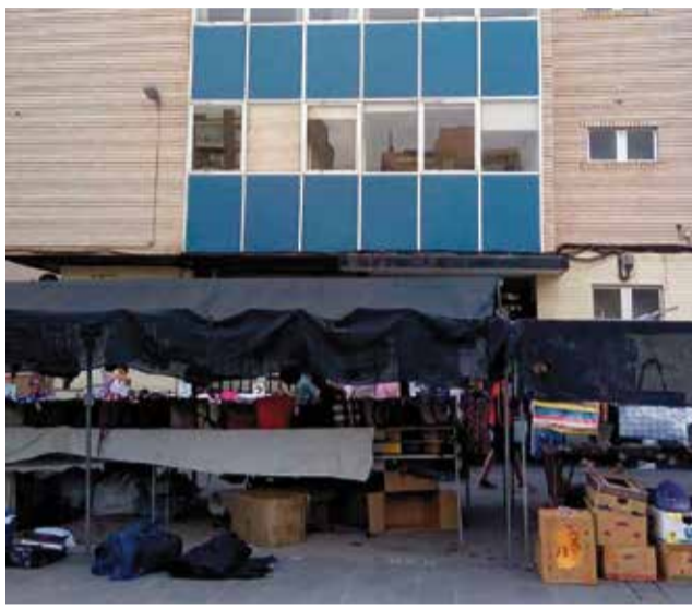
Centro de la Seguridad Social (CAISS) en Sagunt.

El CSIF explica que en esta actuación al retraso ya acumulado de ocho meses se suma la falta de información sobre la remodelación, ya que no han terminado de aclarar si consistirá en la ampliación hasta el primer piso. Tampoco han explicado si el CAISS