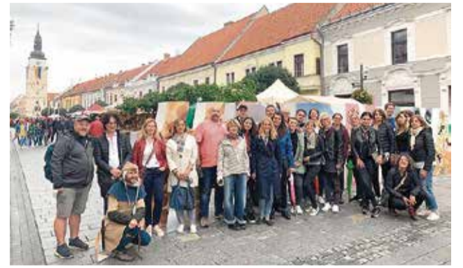
Visita de la Fundació a Eslovàquia.