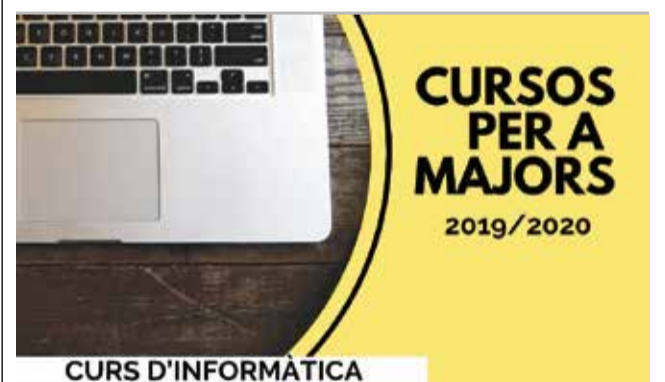
Cartel de los cursos para mayores en Benifairó.