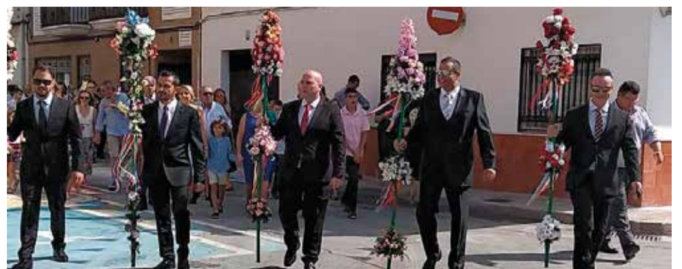
Clavarios en las fiestas de Canet 2019.

La lluvia ha causado la suspensión de algunos actos taurinos y festivos que se reanudarán en función de la disponibilidad de fechas. Por ejemplo, los encierros y toros embolados, así como la actuación de la orquesta Montecarlo que se ha pospuesto para el próximo día 28 de septiembre.