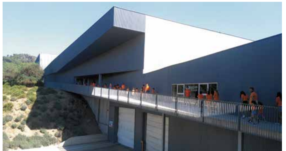
Visitas a la Planta de Tratamiento de Residuos d'Algímia d'Alfara.

Cualquier persona usuaria que quiera disponer de la Tarjeta Verde, podrá solicitarla personalmente en todos los ecoparques móviles de la red y en los ecoparques fijos de La Vall d'Uixó, Sagunto y Nules.