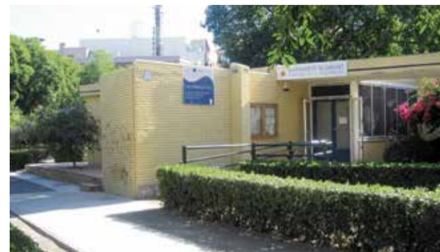
Edificio de formación y empleo en Sagunt.