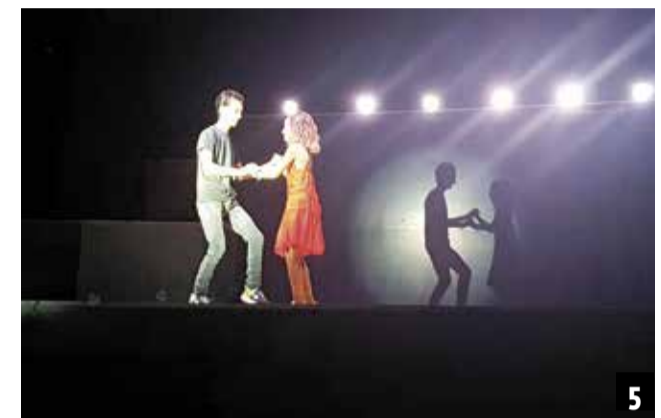
► FESTES BENIFAIRO DE LES VALLS. Una de las peñas del municipio durante el concurso de disfraces (foto 1). 'Baixà' de la Mare de Déu del Bon Succés (foto 2). Vecinas de la localidad durante el concurso de paellas (foto 3). Miembros de la comisión de fiestas repartiendo la caldera entre los vecinos del municipio (foto 4). Dos bailarines participando en el concurso de Play-baks (foto 5).