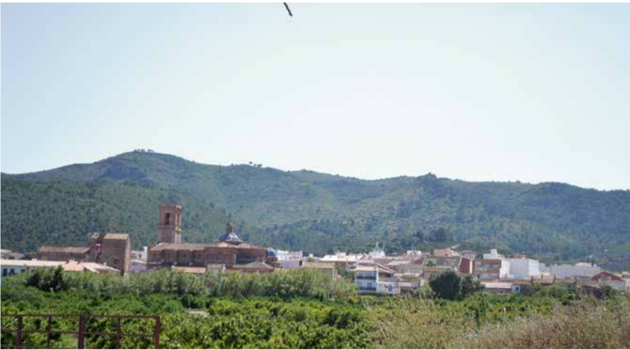
Vista de Les Valls.