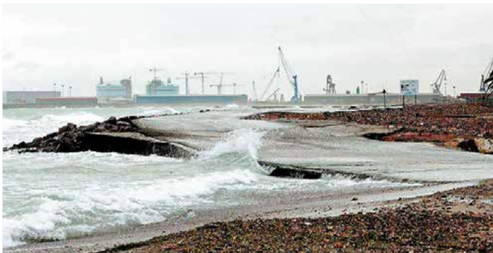
Imagen de la carretera que une Canet y el Port durante el temporal.

El municipio de Sagunt ha tenido que cortar varias vías al tráfico a causa del temporal, como la avenida Mediterráneo, la calle Periodista Azzati, el paso del río, el vial entre núcleos y la calle del casco urbano del Sants de la Pedra. Por su parte, los bomberos no han tenido que asistir muchas incidencias, a excepción del saneamiento de una fachada y ayudar a achicar agua en algunas zonas de la ciudad. En concreto, han realizado durante la mañana una treintena de servicios relacionados con el temporal, y han actuado con vehículos en