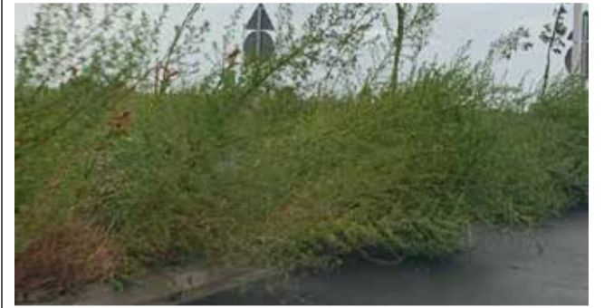
Dos imágenes que muestran el abandono.