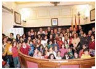
Pleno infantil.