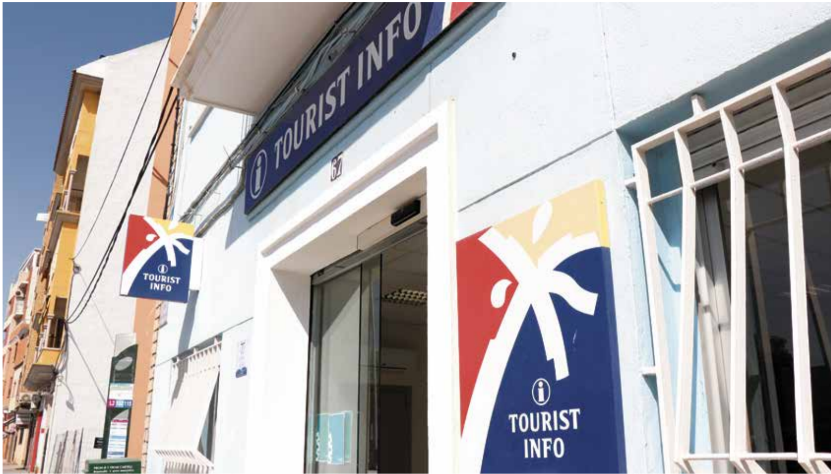
Oficina de Turismo del Port de Sagunt. / EPDA