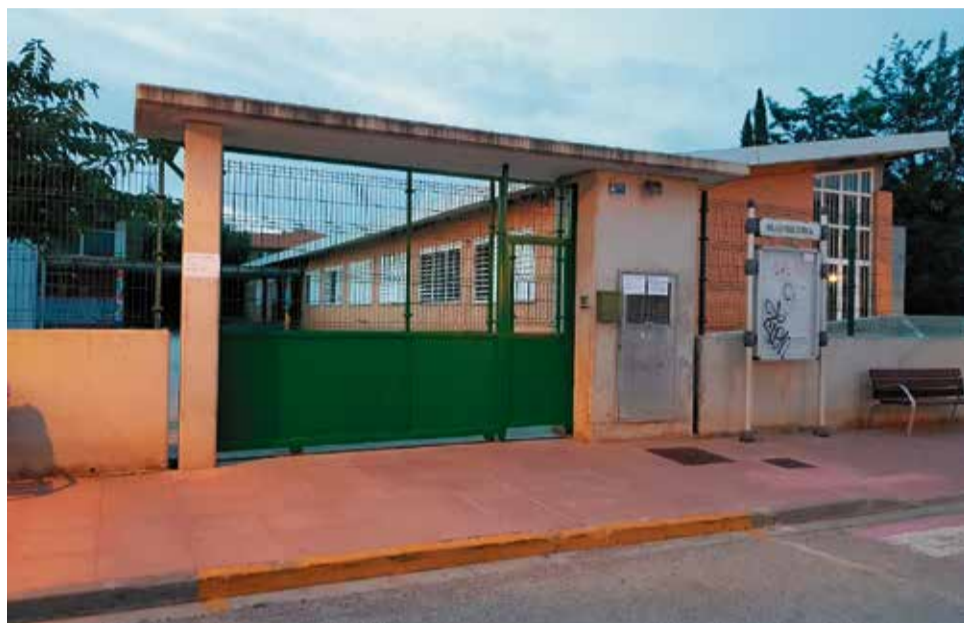
Escola d'Estivella.

Així ho ha valorat l'alcalde del poble, Rafa Mateu, qui assegura que un dels avantatges de la construcció és que permetrà que els alum-