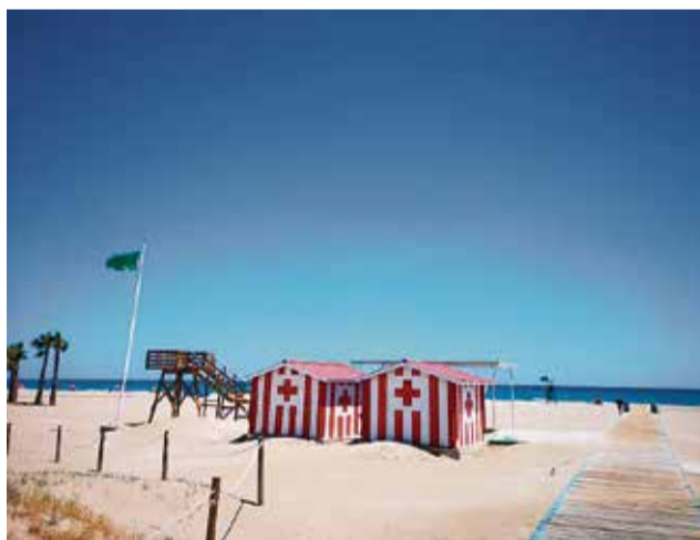
Playa de Canet.