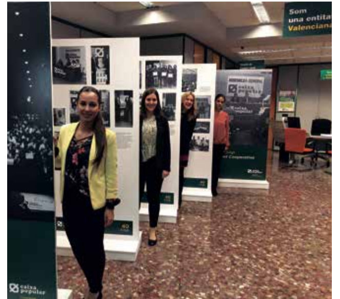
Trabajadoras de Caixa Popular de Port de Sagunt.

Pueden obtener más información en la oficina de Caixa Popular de la Calle San Vicente, número 48 de Port de Sagunt.