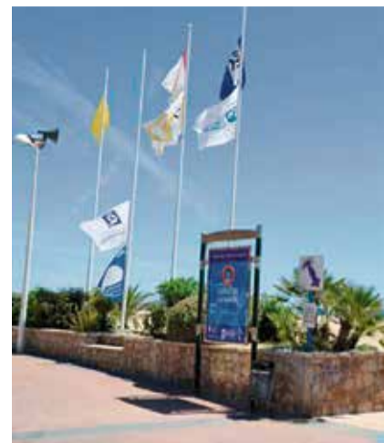
Playa del Port.