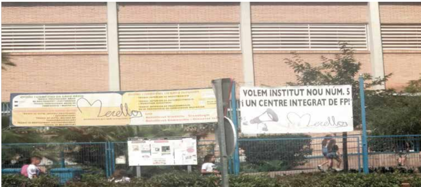
Pancartas en el IES Eduardo Merello.