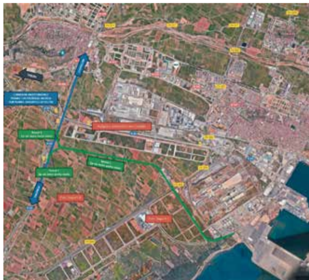
Plano de acceso al Port de Sagunt.

El ramal 1 tiene una longitud de 4,6 km. Cuenta con dos alineaciones rectas de 1,9 y 1,6 km, que discurren paralelas al polígono Camí La Mar y al viario Parc Sagunt I, res-