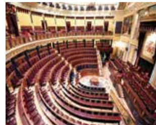
El hemiciclo del Congreso.