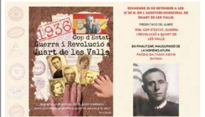
Cartel del evento.