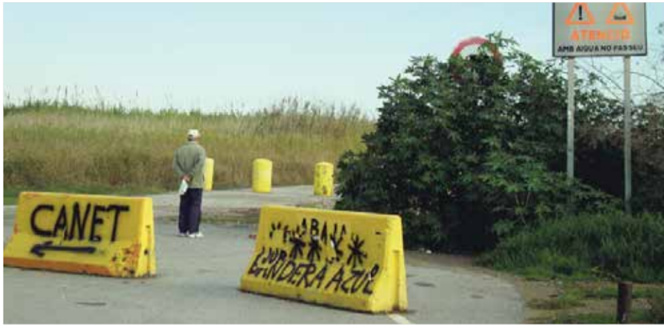
Carretera entre Canet y el Port de Sagunt por la playa.

“Hay dos proyectos en los que trabajamos Sagunt y Canet, uno de más de 4 millones y el otro de 2. Este último es el que se haría sobre el actual vado irregular, al ser la zona